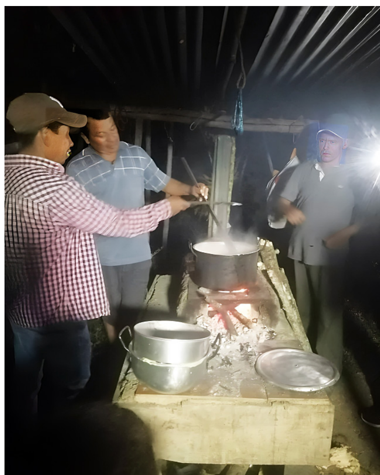
La Asociación se ha dedicado a procesar artesanalmente la arracacha.

Monseagro espera que entes gubernamentales del nivel local, departamental y nacional les apoyen con una planta de procesamiento que les permitirá aprovechar al máximo este producto, generando autosostenibilidad en la región.