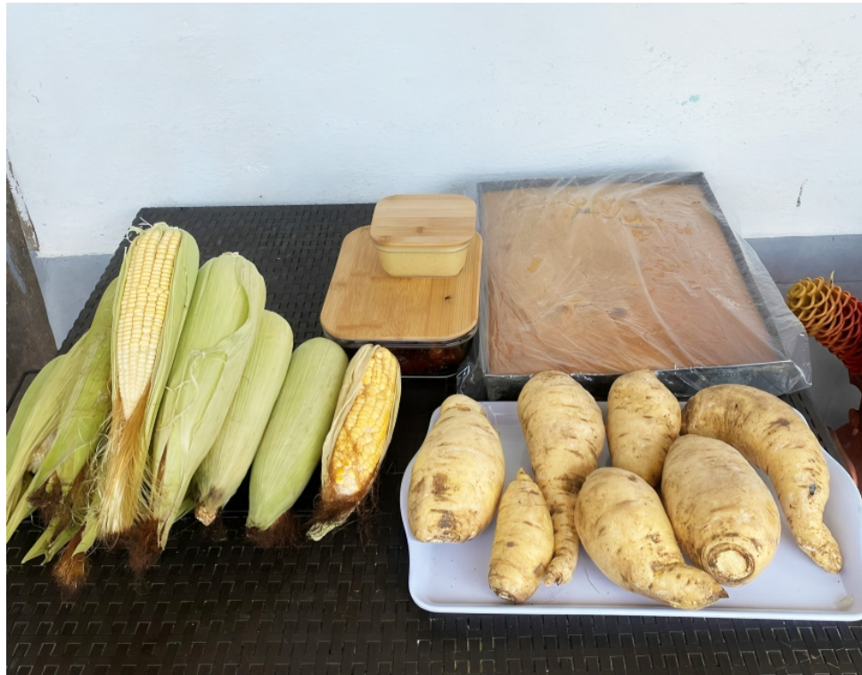
Según los líderes de Moseagro, la falta de apoyo al pequeño productor, es una de las dificultades con las que se encuentran a diario.

La transformación de la arracacha en almidón, por ejemplo, podría abrir nuevas oportunidades de mercado. Según Cuéllar, “el almidón lo estamos entregando para sopas, es un aprovecha-