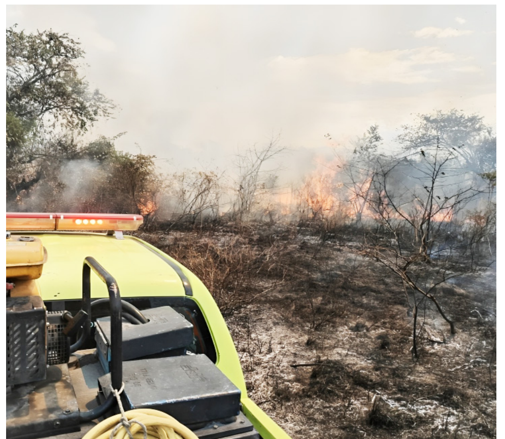
En la ignición registrada en Buziraco, 25.2 hectáreas fueron ‘devoradas’.

Ya en cuanto a las posibles causas que originan estas conflagraciones, se presentan debido a las altas temperaturas y a actividades propias del ser humano, principalmente las ‘quemadas’.