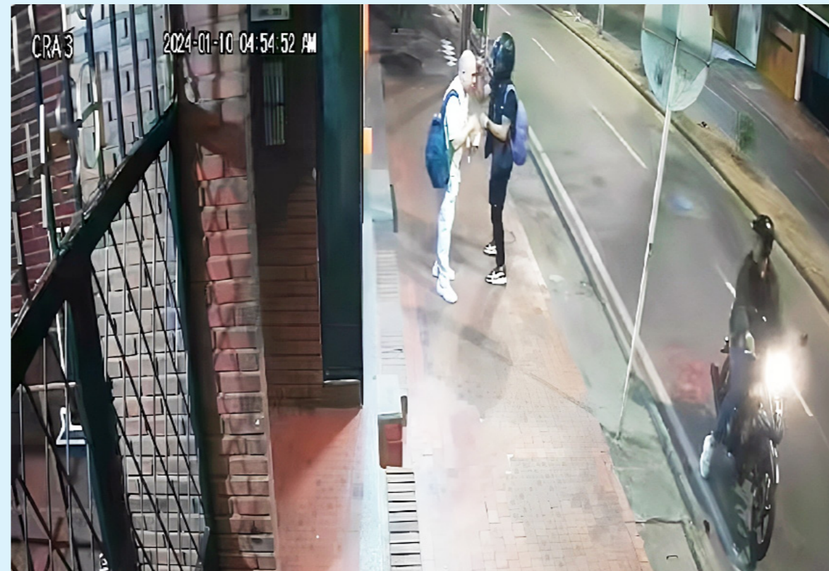
En redes sociales abundan los videos de hurtos a mano armada.