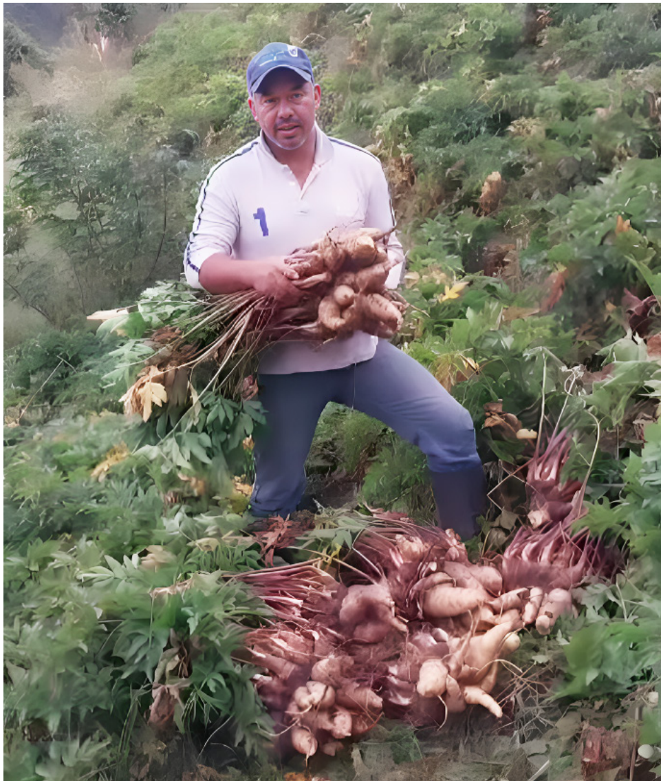
La fertilidad de la tierra en la zona es perfecta para la producción de arracacha.

da como Arracacia xanthorrhiza , es un tubérculo andino que ha sido cultivado durante siglos en la región. Aunque su popularidad había disminuido frente a otros cultivos, en los últimos años ha re-