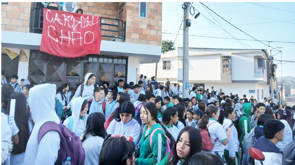
Los estudiantes protestaron por los presuntos malos manejos.

"Muchos de los alumnos de manera anónima, nos han comentado, que les da miedo salir a protestar porque tienen cohibido ese derecho, con amenazas de que van a perder el año. Y este es el momento para que la Secretaría de Educación del Huila, se dé cuenta de ¿cómo están nuestras instituciones? que necesitamos el apoyo de las entidades, y a quienes tengan dudas, les podemos mostrar las pruebas que tenemos