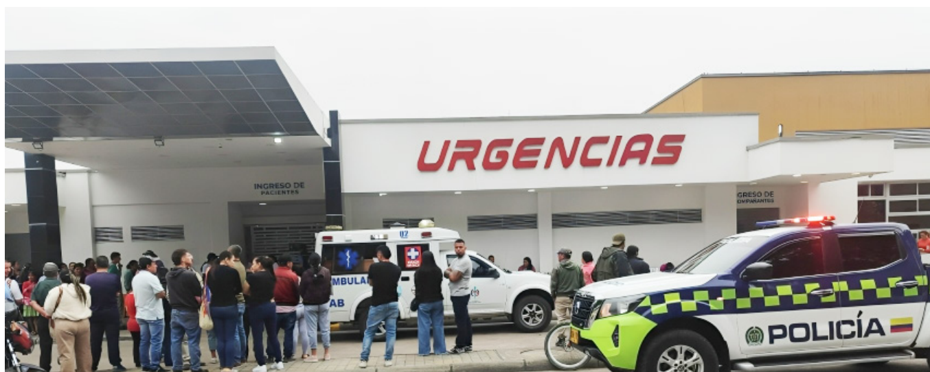
Los heridos fueron trasladado hasta el Hospital San Antonio de Pitalito.

Las unidades de rescate, entre ellas el Cuerpo de Bomberos Voluntarios de Pitalito, la Defensa Civil y la Cruz Roja, llegaron rápidamente al lugar del accidente. Con gran esfuerzo, lograron rescatar a los sobrevivientes y trasladarlos al Hospital Departamental San Antonio de Pitalito, donde los equipos médicos ya estaban preparados para recibir a las víc-