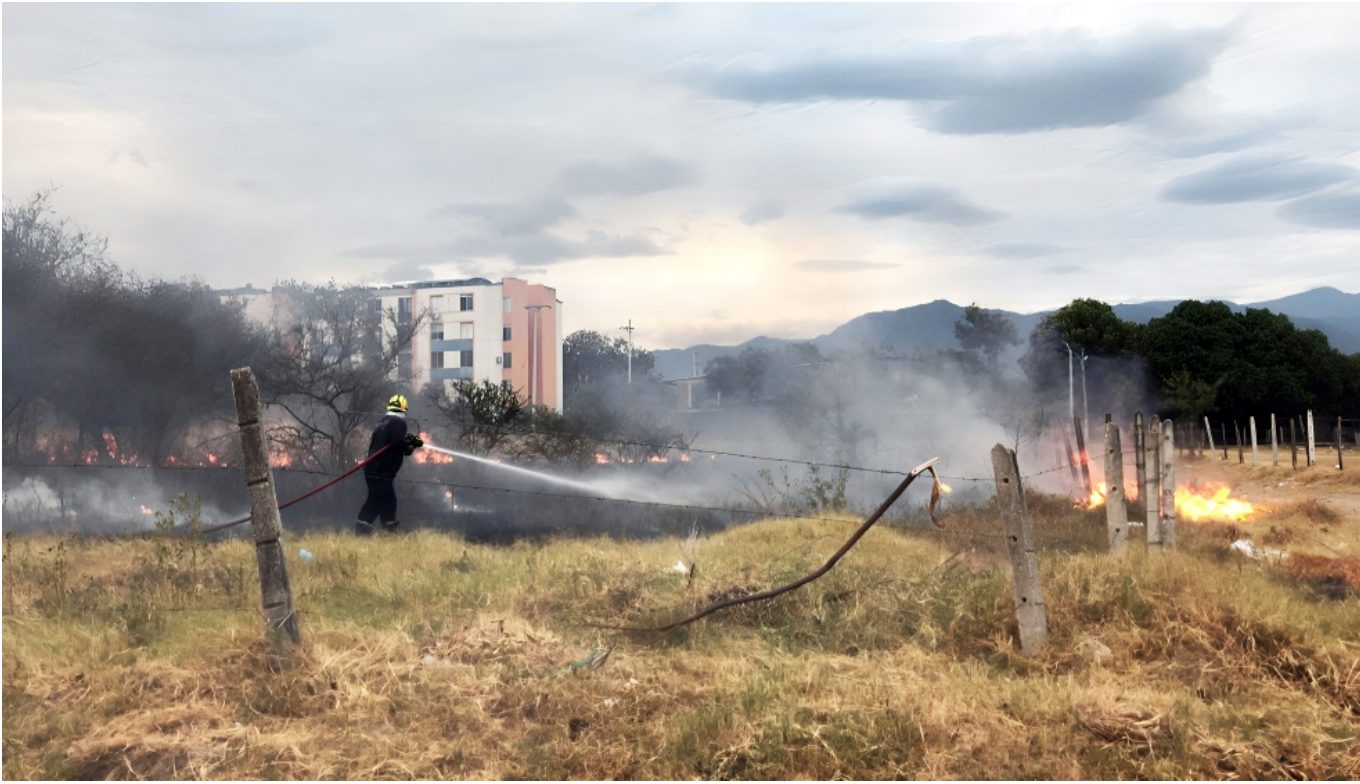
El sector de Moscovia, es uno de los más perjudicados por que las llamas han llegado cerca de los domicilios.