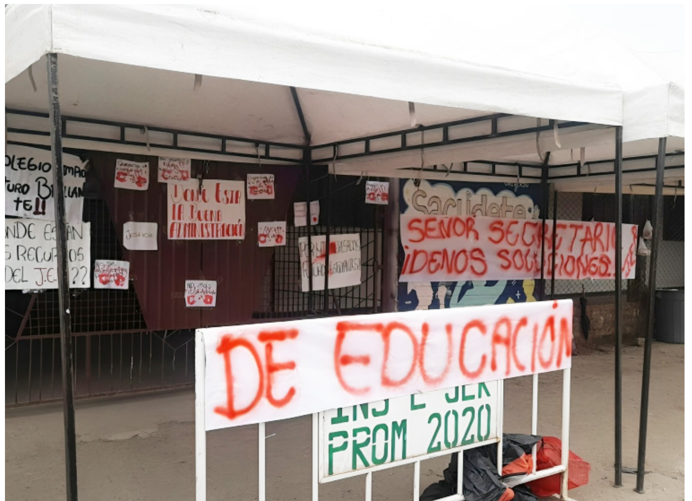
En una reunión los estudiantes, tomaron la decisión de no recibir clases hasta la llegada del nuevo secretario de Educación del Huila.