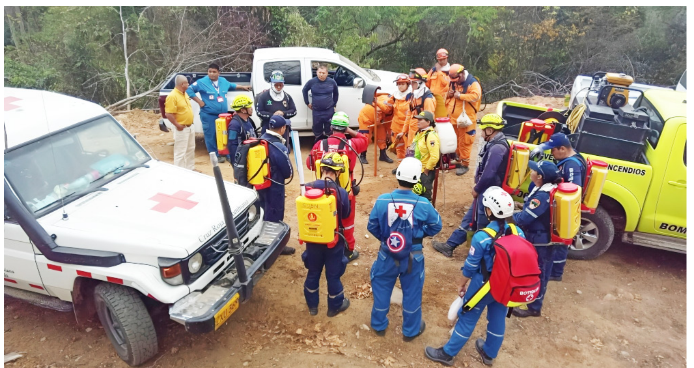
La ignición en la vereda La Mojarra, ha sido compleja de extinguir.

Y entre las zonas críticas de Neiva se encuentran: la comuna nueve que comprende al barrio Alberto Galindo, Fortalecillas, vía al Venado; en la siete, la cuenca del río Las Ceibas, Reservoirio, Ipanema; y la comuna seis, encontramos El Caguán, 'Trapichito', y el patinodromo o los lotes ubicados detrás de Surabastos.