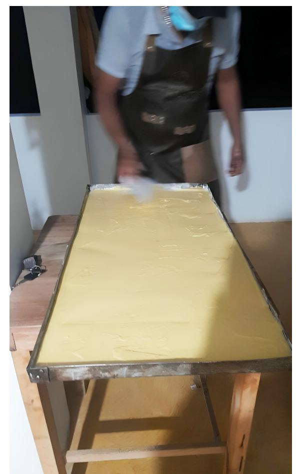
Entre los productos derivados están las tortas, almidón, bizcochos, entre otros.

Además, es necesario que se implementen políticas públicas que faciliten el acceso de los pequeños productores a los mercados, garantizando precios justos y evitando que se pierdan cosechas por falta de infraestructura para el transporte y almacenamiento. Hurtado y Cuéllar coinciden en que la clave para el éxito de la arracacha en La Plata está en la cooperación entre el sector público y privado, y en el reconocimiento del potencial que tiene este tubérculo para convertirse en un motor de desarrollo para la región.