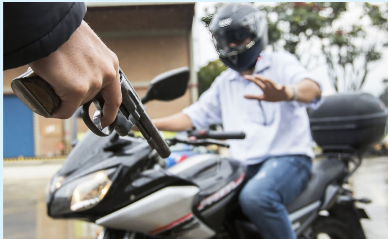
Pese a los esfuerzos por atacar al delito, la percepción de inseguridad sigue en aumento.