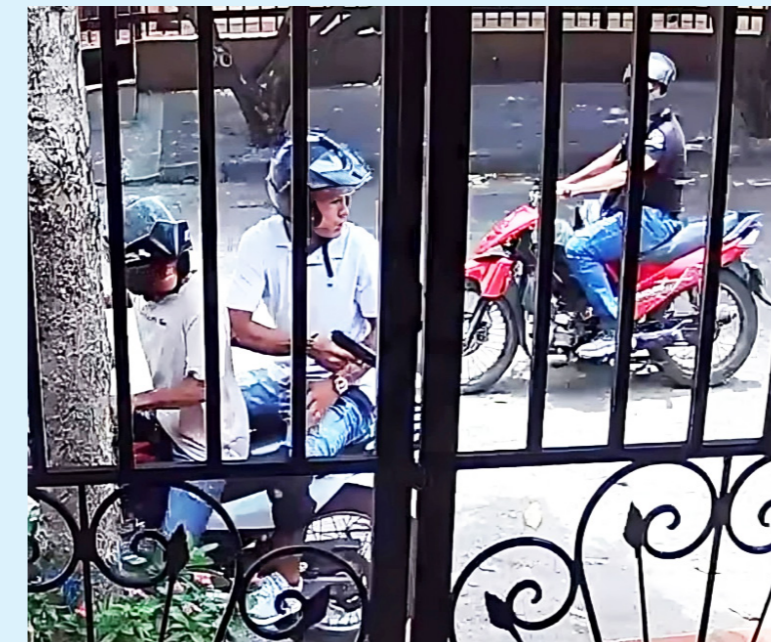
Los delincuentes amedrentan a sus víctimas con armas de fuego.

justicia que el Gobierno Nacional y las autoridades locales han implementado. Por su parte, la violencia intrafamiliar también ha dejado su huella en las cifras de homicidios, con un caso registrado en lo que va del año. Además, las autoridades están investigando un homicidio que podría estar relacionado con grupos armados organizados, lo que añade una dimensión aún