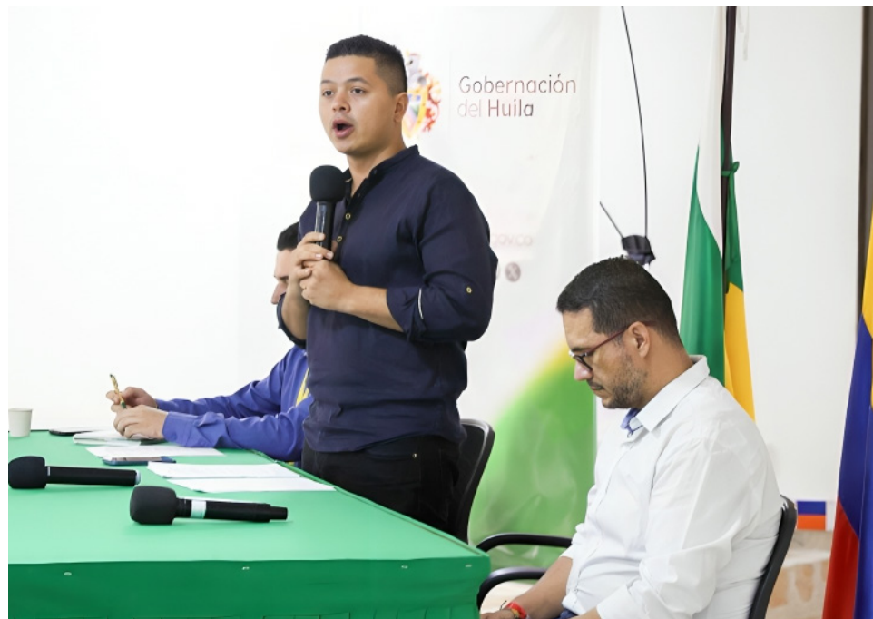
En el evento se instaló la Mesa Departamental de Reincorporación.

personas, entre ellos están las y los firmantes de paz, quienes hoy son agentes constructores de paz”.