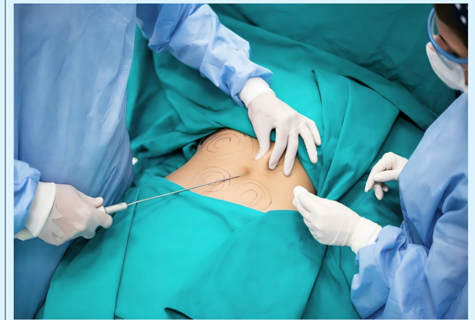
La mayoría de estas mujeres, presentaron afectaciones en el posoperatorio.

El camino hacia una práctica médica ética y segura en el ámbito de la cirugía estética es largo, pero con un esfuerzo conjunto entre las autoridades, los profesionales de la salud y la sociedad, es posible evitar que más mujeres pierdan la vida o sufran daños irreparables en su búsqueda de belleza.