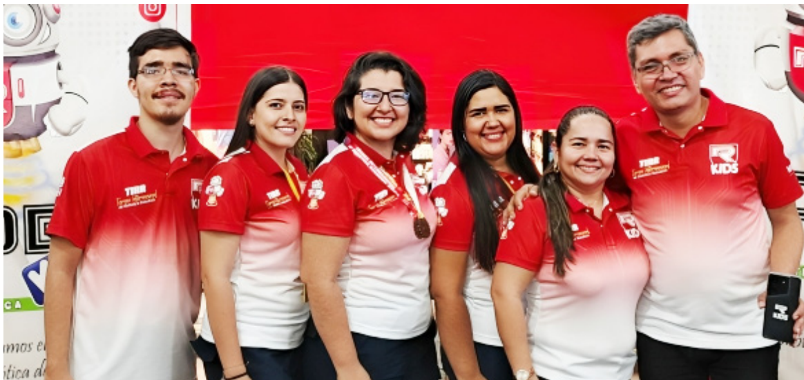
El equipo de Robo Kids, organizador del evento.