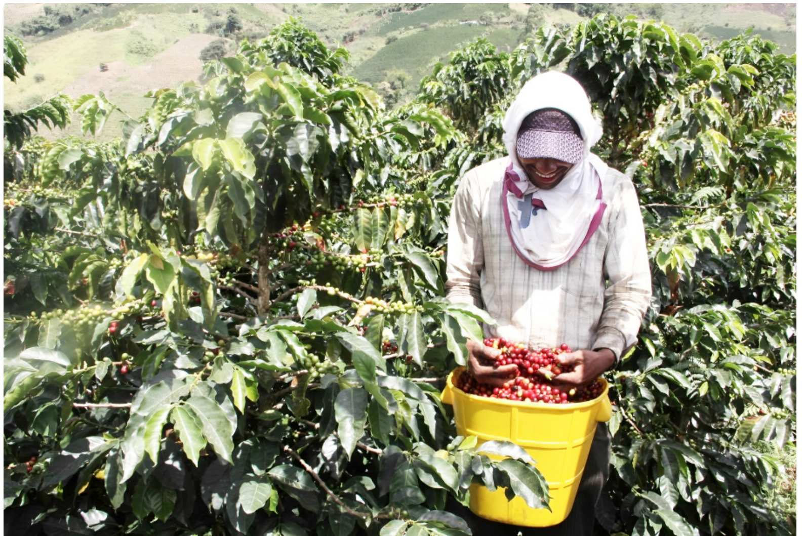
Café recién recolectado en una finca del Huila, listo para iniciar su proceso de secado y beneficio.

A pesar de una leve corrección, con la libra ubicándose en US$2,54 según los últimos datos de Bloomberg, el mercado sigue siendo favorable. En agosto, el precio ha aumentado un 10%, principalmente debido a las heladas en Brasil, el mayor productor mundial de café. Este clima