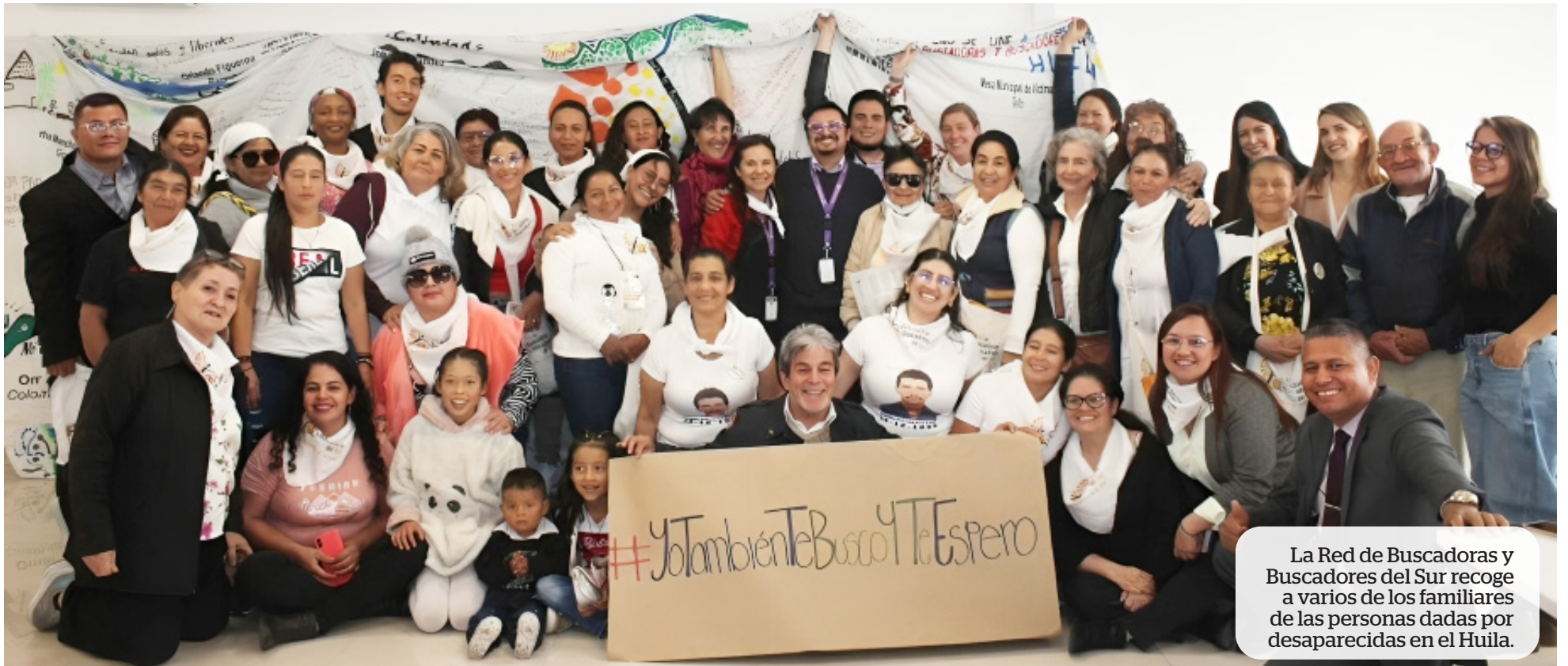
La Red de Buscadoras y Buscadores del Sur recoge a varios de los familiares de las personas dadas por desaparecidas en el Huila.