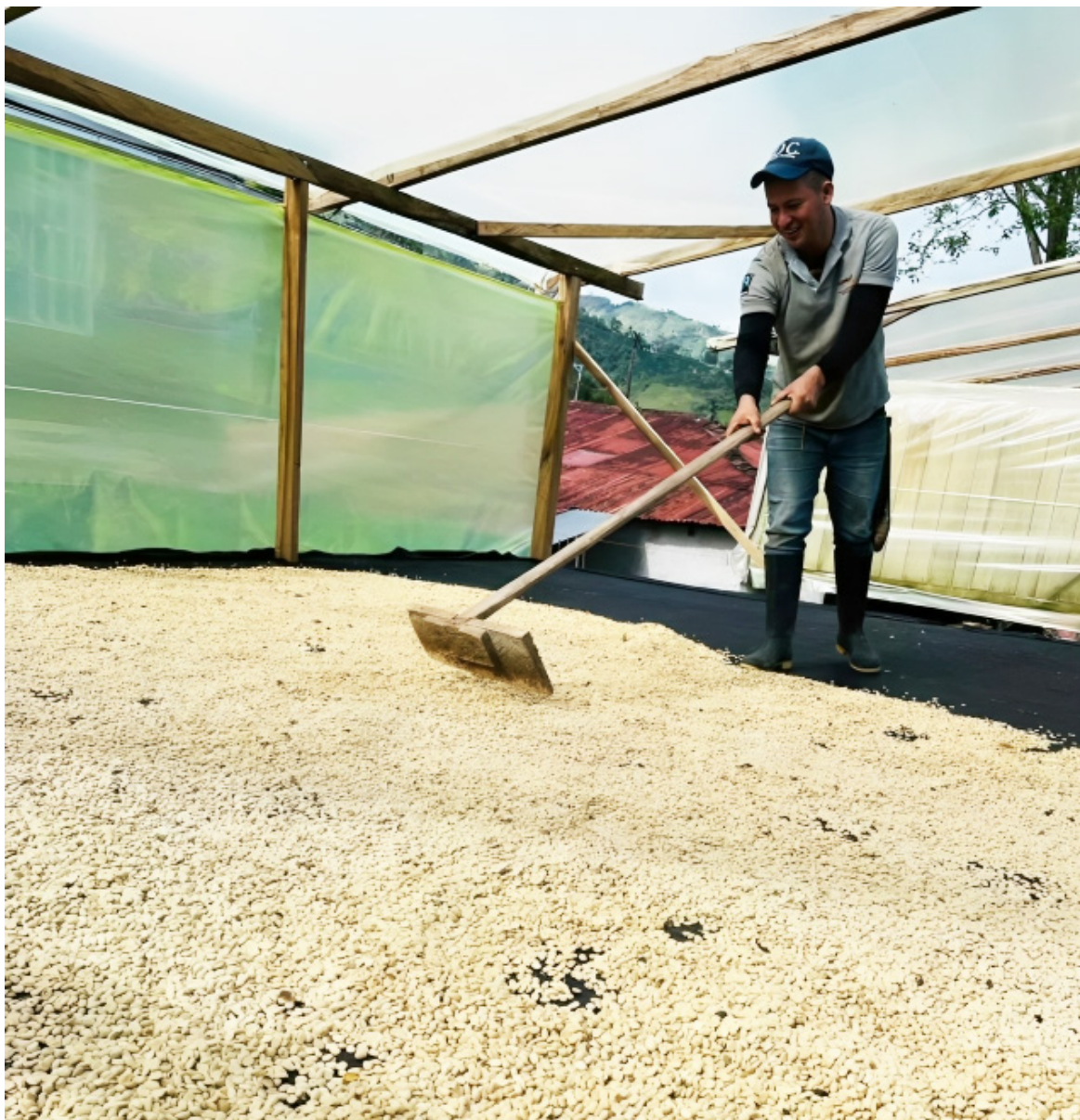
El Huila se destaca no solo por la cantidad de hectáreas sembradas, sino también por la calidad de su café, apreciado a nivel mundial.

La variedad de pisos térmicos y microclimas en el Huila garantiza la producción de café premium, consolidando al departamento como el epicentro de la caficultura en Colombia.