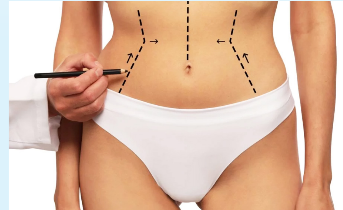
Cinco mujeres han perdido la vida en procedimientos estéticos en Neiva.

Uno de los factores que contribuyen a esta alarmante situación