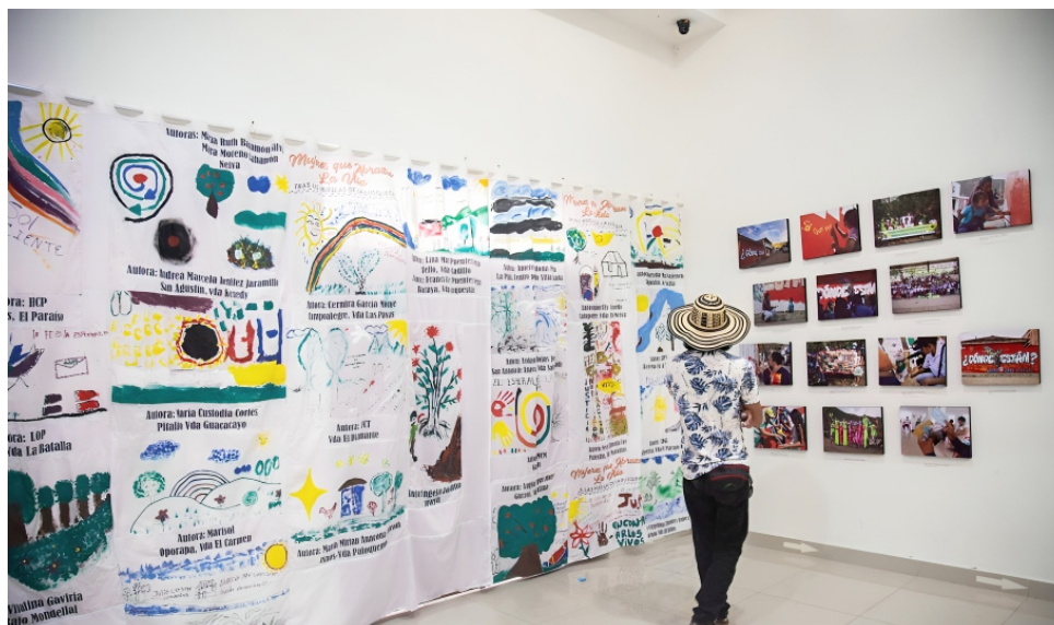
El telar es una forma de expresión que les permite narrar sus propias realidades.

Con estos hallazgos y desafíos en mente, Plataforma Sur se dio cuenta de que era necesario hacer más. En el año 2022, la organización, con el apoyo del Fondo de Países