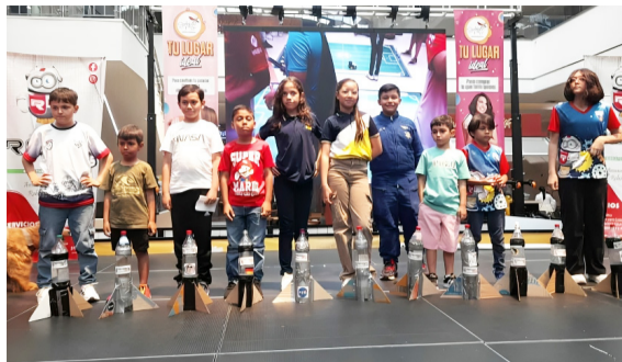
Bee Bot Challenge: Robótica para los más jóvenes