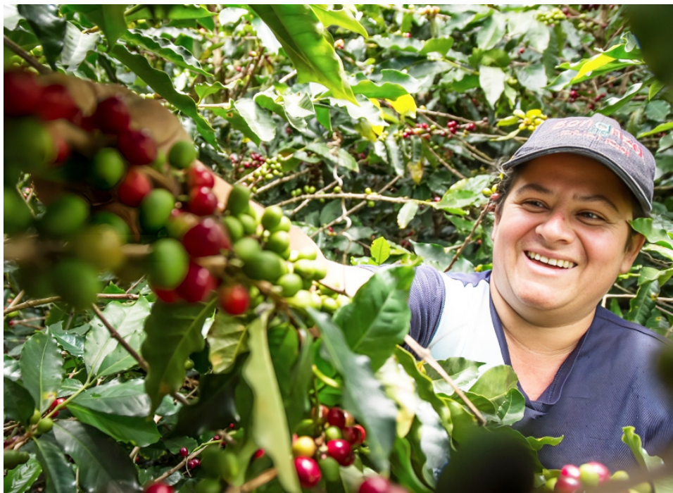
Cosechadores de café en acción en las montañas del Huila, donde el cultivo del café es la principal actividad económica.

Con una producción que supera los 12 millones de sacos anuales, la tendencia es claramente ascendente. Solo en julio, la carga de cosecha incrementó un 22%, lo que refleja no solo la resiliencia