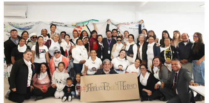
La lucha incansable de la red de Buscadoras y Buscadores del Sur