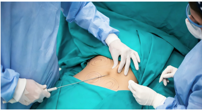
El alto costo de la belleza en Neiva