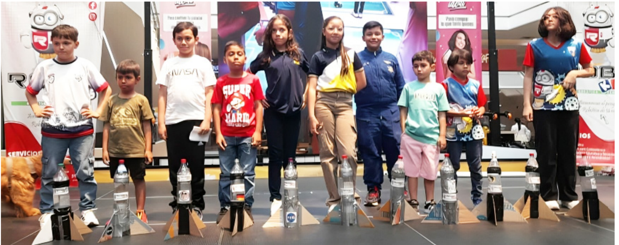
El Centro Comercial Santa Lucía fue el escenario de encuentro en el Bee Bot Challenge.

delegaciones hicieron tours al Desierto de la Tatacoa y a otras zonas turísticas del Huila, lo que ayudó a dinamizar aún más la economía de la región.