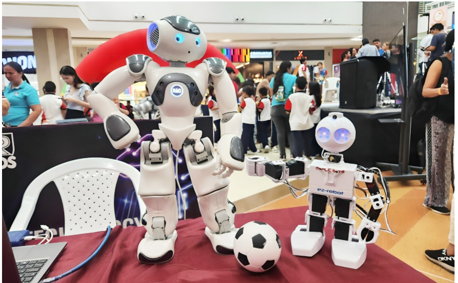
El Bee Bot Challenge se desarrolló como un evento que impulsa la innovación y la tecnología en niños y adolescentes.

El Bee Bot Challenge es una competencia diseñada para niños y adolescentes entre los 4 y los 13 años, enfocada en el desarrollo de habilidades en progra-