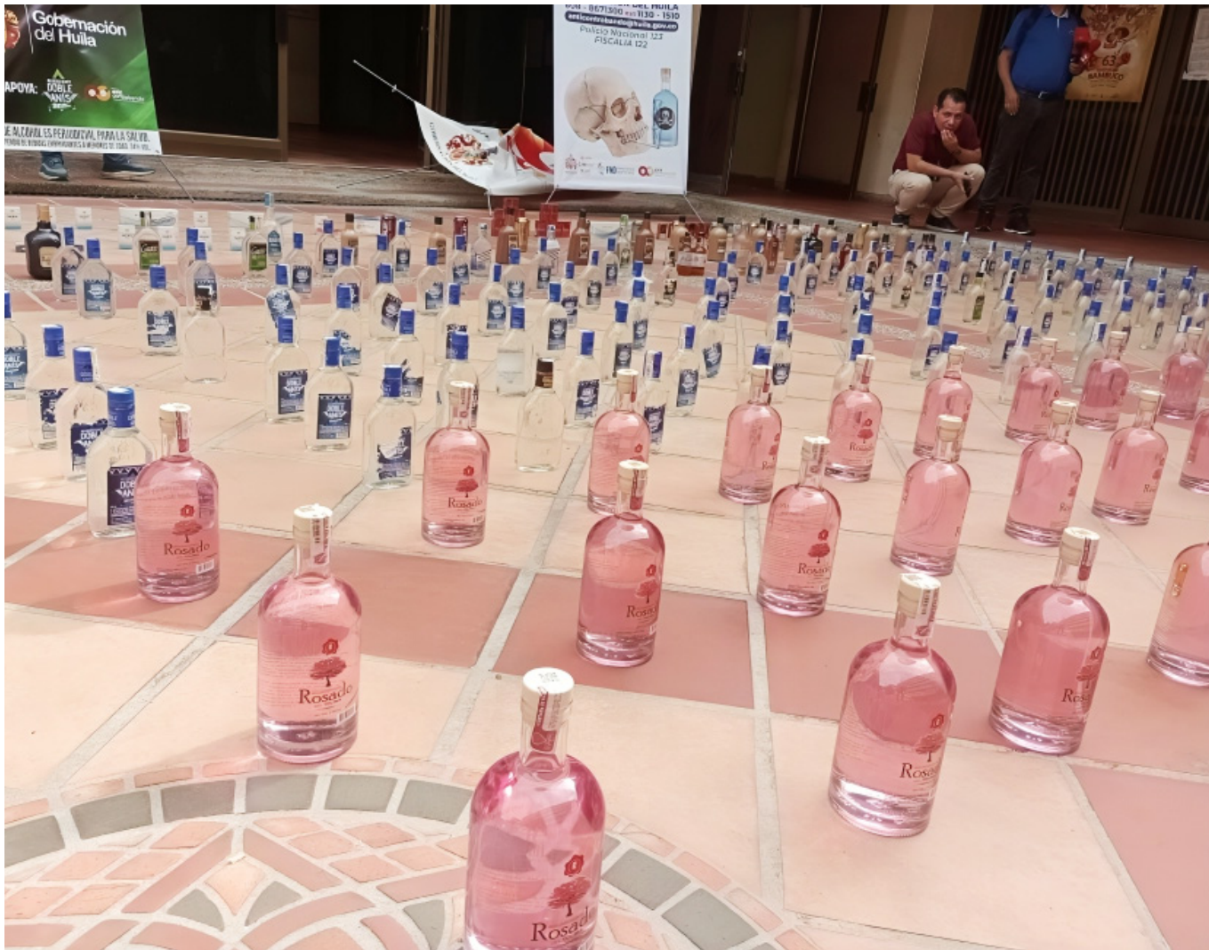
La región estaría ‘inundada de mercancía de contrabando’.

Las utilidades del departamento del Huila, habrían sido ‘golpeadas’ por mercancía de contrabando que ingresa a la región. Una de las hipótesis de este hecho, es que hubo demora en la liquidación de un contrato que impedía la llegada de nuevos funcionarios para que integran el equipo anti-contrabando.