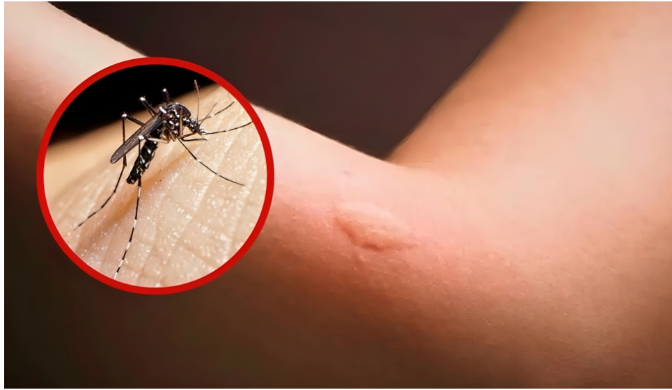
El zancudo es el principal transmisor de una enfermedad muy peligrosa como el dengue.

En este contexto, el departamento del Huila se encuentra entre las regiones más afectadas. Con 19.180 casos reportados, el Huila ocupa el quinto lugar en el país,