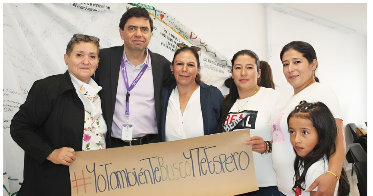
“Yo también te busco y te espero”, es una campaña que pretende vincular a los huilenses en la búsqueda de personas desaparecidas.