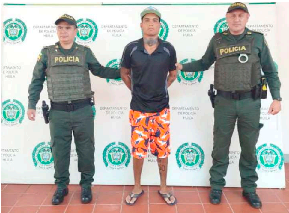
Reconocido actor criminal fue capturado mientras agredía a su compañera sentimental.

El municipio más afectado en este flagelo es Pitalito con 4 casos y uno que se presentó en el municipio de Yaguará.