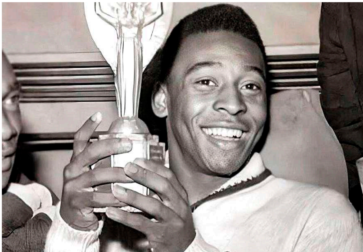
El único jugador de la historia que levantó tres copas del mundo.

Según reportaron varios medios brasileños, O Rey ya no respondía a las sesiones de quimioterapia que se le hacía para combatir el cáncer de colon detectado el año pasado. La enfermedad no pudo ser contenida y pasó a su intestino, hígado y pulmón. Este jueves, su cuerpo no aguantó más y partió a la eternidad.