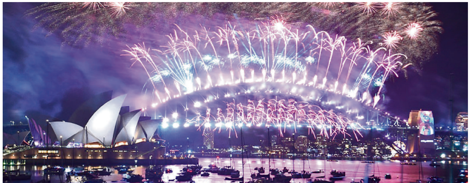
Juego pirotécnico que indica la llegada del nuevo año en Australia.

por distintos expertos, la noche vieja se tarda un poco más en cerrar. El día normalmente tiene 24 horas, pero línea internacional de fecha, es decir, el punto oficial de inicio y fin de cada día sigue aproximadamente el meridiano 180 de norte a sur por el centro del Océano Pacífico y, es lo que tradicionalmente se usa para marcar el punto