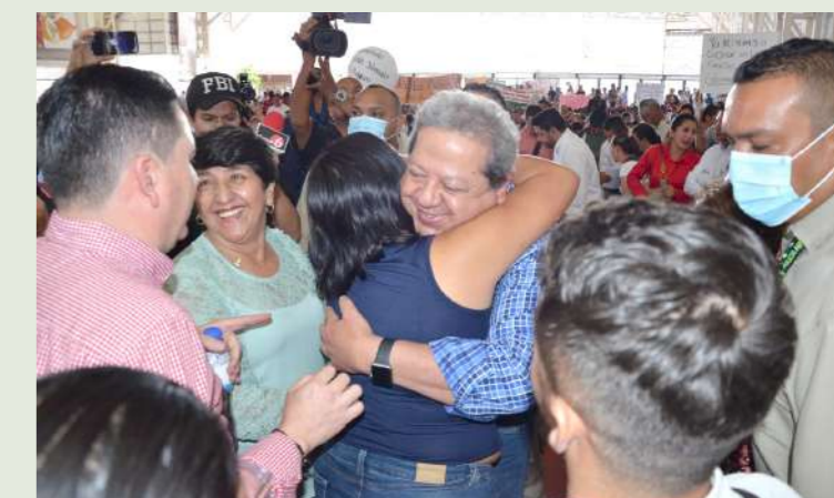
Comunidades de La Plata, Gigante y Garzón asistieron a la firma de este convenio en el salón de Gobernadores.