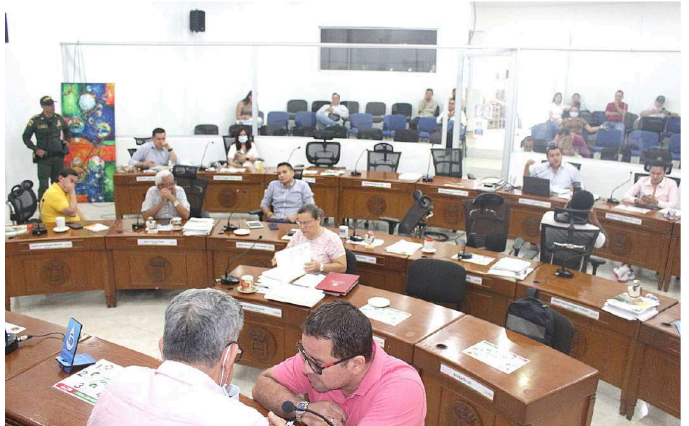
Solucionado pago a maestros en Neiva.