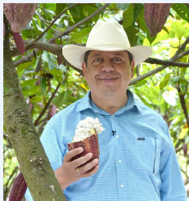
En cacao hay una inversión cercana a los $8.000 millones para alternativas de generación de valor agregado en frutos de cacao con características especiales en el departamento de Huila.

El sector agropecuario tiene una enorme importancia para el departamento del Huila, tanto por la generación de riqueza, las oportunidades de empleo, y el desarrollo que representa para la región.