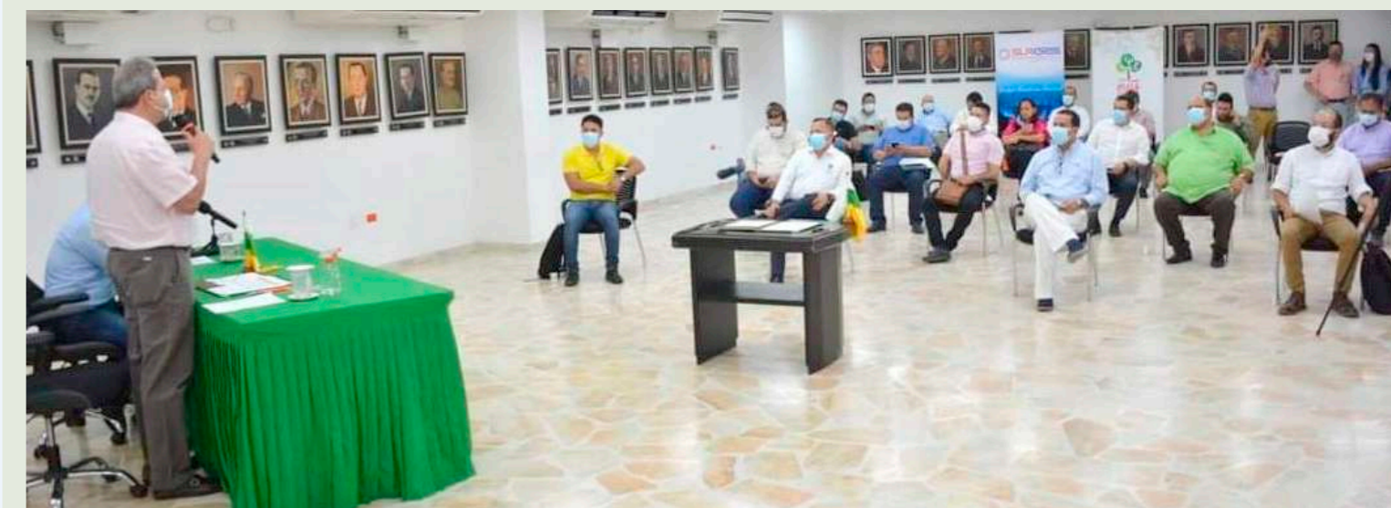
La firma se realizó con delegados de la empresa Surgas y alcaldes de 13 municipios del Huila.

Tres grandes convenios que superan los $53.000 millones en implementación de gas domiciliario por parte del gobierno “Huila Crece”, han permitido que 62.216 personas en 168 veredas de 19 municipios del departamento, puedan tener una mejor calidad de vida. El Gobierno Departamental prepara más alianzas interadministrativas que permitan llegar a más veredas en la región.