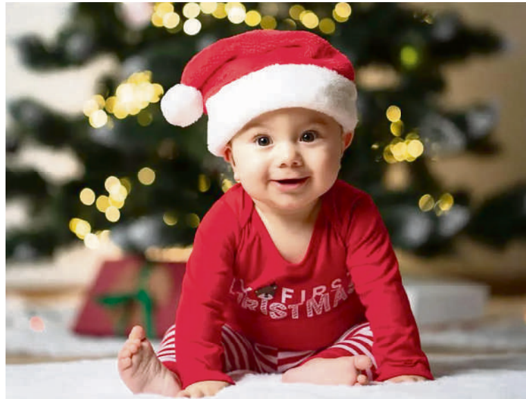
En Colombia desde el año 2015 a la fecha se han registrado 16 444 personas nacidas el 24 de diciembre, 13 933 el 25 de diciembre, para el 31 de diciembre se registran 17 304 personas y para el 1 de enero un total de 14 574.

La entidad también dio a conocer que hay un peruano llamado Jesús, que nació el 25 de diciembre en el distrito de Belén, en la provincia de Sucre, región Ayacucho, hecho similar a la historia del nacimiento del hijo de Dios en Belén de Judea.