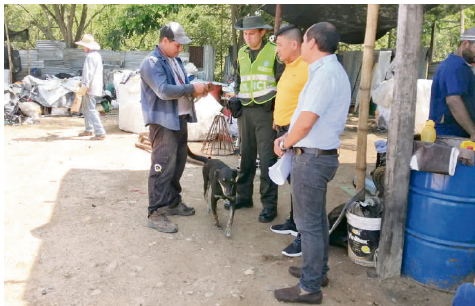
Las comunas más afectadas son: la 4, 5, 6, 8 y 9

Actualmente están realizando un proceso de sensibilización y el propósito de este año es realizar un trabajo más riguroso. Esto debido a que, según lo