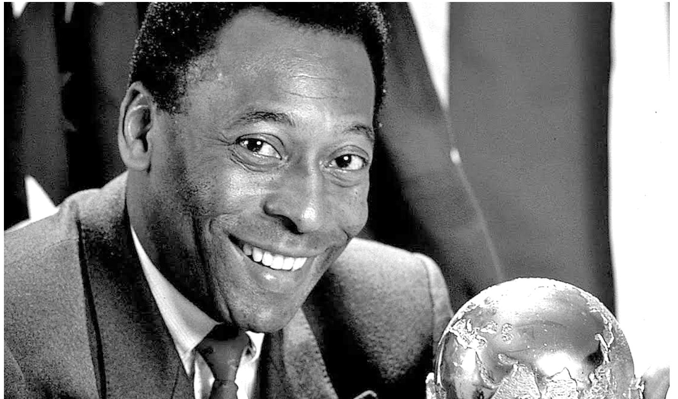
Edson Arantes do Nascimento, mejor conocido como Pelé.

A lo largo de su carrera, Pelé anotó 1.283 goles, 767 de ellos en partidos oficiales según la RSSSF, que reúne estadísticas de fútbol. Tuvo un promedio de 0,9 gol por juego, algo extraordinario hasta hoy.