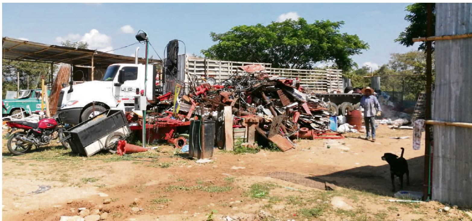
Varias comunas de la ciudad de Neiva se han visto afectadas por algunas chatarrerías ilegales que causan problemas ambientales y sociales.

Lo anterior, según el jefe de la cartera, porque los habitantes de calle en su gran mayoría son consumidores de drogas y en este momento están captados por el microtráfico, lo que significa que, las chatarrerías, los habitantes de calles y grupos delincuenciales actúan en asocio.