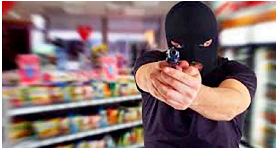
Han sido 5 los establecimientos comerciales hurtados en el Huila en diciembre.

Si bien es cierto es una buena noticia para el sector, no se puede bajar la guardia en cuando a cuidados y recomendaciones que se deben seguir para continuar reduciendo el delito.