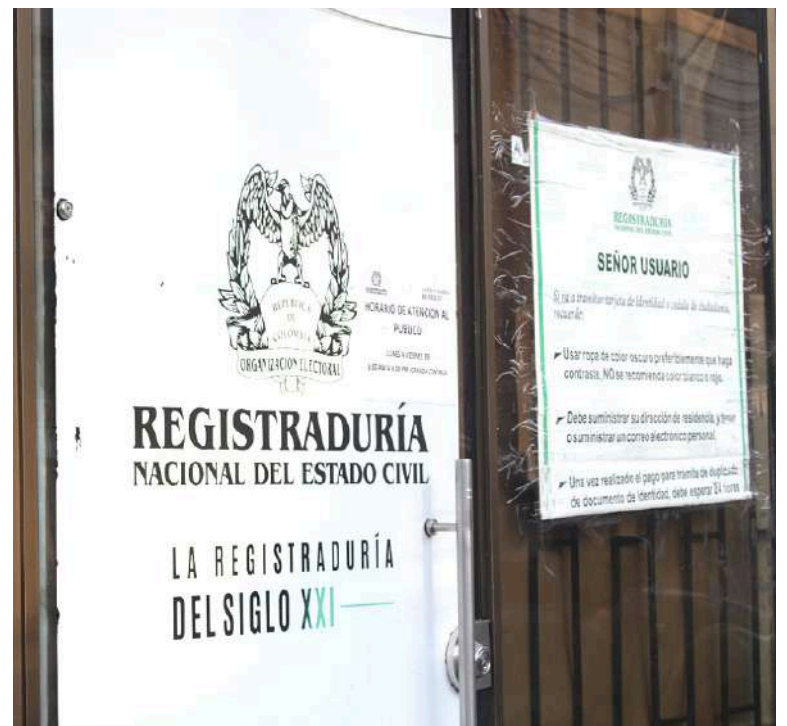
Desde el pasado mes de octubre se anudan esfuerzos y articulación para lo que serán las elecciones territoriales del 2023.

Y es que, en efecto, una de las banderas de la entidad para el próximo año es seguirle apostando a los documentos digitales que generan más seguridad y evitan tanta tramitología. Por eso, de la misma forma, se logró avanzar en el registro civil en línea mediante una dinámica titánica que se extenderá hasta enero del 2023.