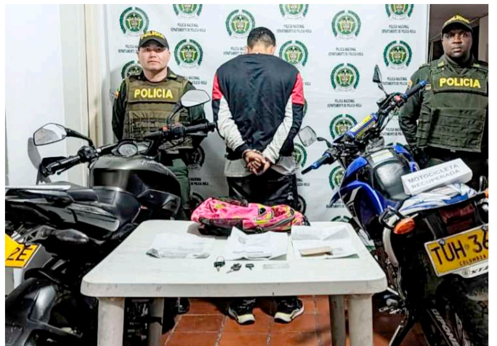
El presunto delincuente con la motocicleta y otras pertenencias hurtadas.

Según el comandante del Quinto Distrito de Policía Pitalito, el teniente coronel Ricardo Castro Garzón, “unidades de Inteligencia Policial y la Seccional de Investigación Criminal, adelantan las respectivas indagaciones para dar con la individualización de los otros delincuentes que participaron en este hurto”.