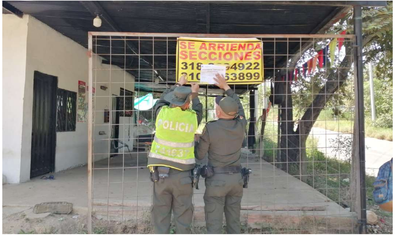
Se han sellado varias chatarrerías.

“En este momento el sellamiento es transitorio, se someten a un proceso de monitoreo de buenas prácticas si cambian las cosas, de lo contrario, son sellos definitivos”.