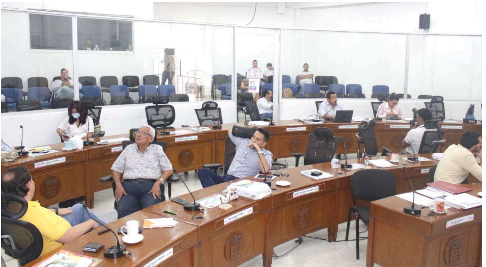
Ocho concejales dieron el visto bueno para agilizar el trámite.

Así, las cosas, una vez hechas las explicaciones entre las partes, la buena noticia para los 3.200 maestros en Neiva es que no recibirán el nuevo año sin plata en el bolsillo.