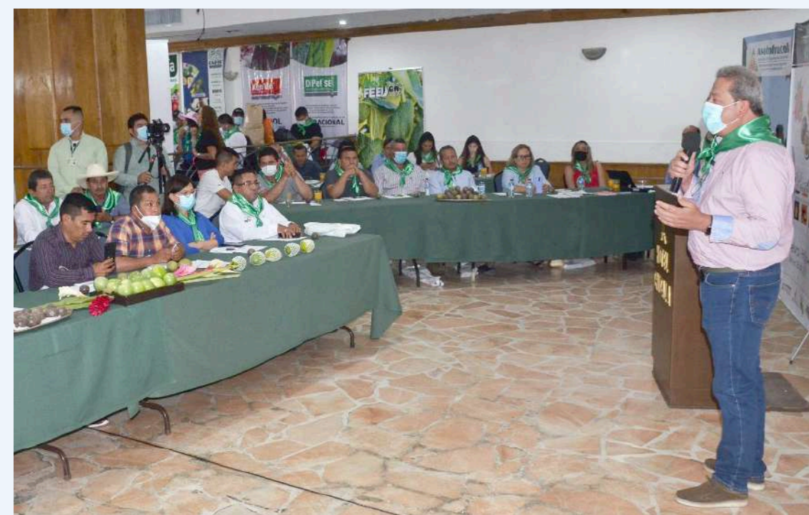
En Pasifloras hay dos proyectos en ciencia y tecnología por valor superior a 5.300 millones para maracuyá y granadilla.

Finalmente, el Gobernador del Huila, dio a conocer que ya se trabaja en otro convenio con Ecopetrol y Alcanos de Colombia para llegar con gas domiciliario a zonas rurales de los municipios de Neiva y de Tello.