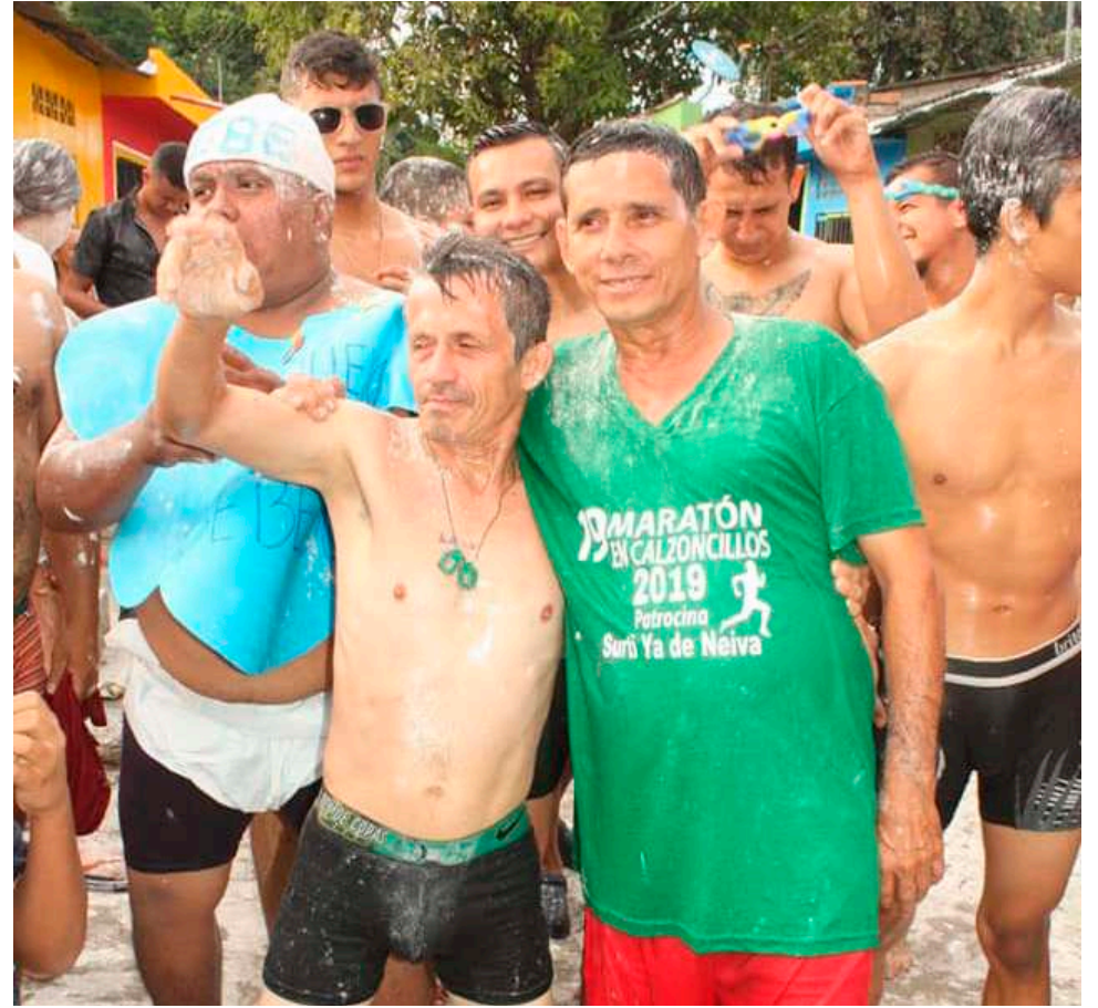
Uno de los más ganadores sigue participando cada año.

“Los invitamos a todos los amigos del barrio, de los barrios cercanos y lejanos, igual que a quienes por estos días visitan la ciudad para que nos acompañen el sábado y sean testigos de un evento que nació como un reto de un grupo de amigos y llega a su versión 22, ya con un nombre al punto que hay quienes la equiparan con la tradicional carrera por las calles de Sao Paulo en Brasil”, concluyó.