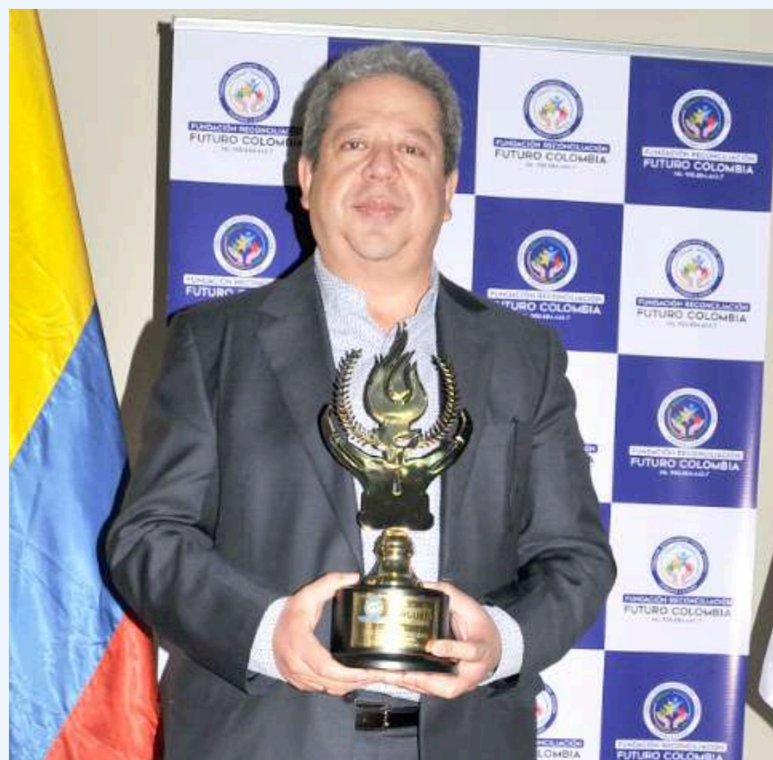
El gobernador del Huila se destacó a nivel nacional por su gestión de proyectos en Ciencia y Tecnología.

■ Un reconocimiento por su destacada trayectoria, brillante hoja de vida y aportes al desarrollo de Colombia, en donde se destaca como el mejor Gobernador de Colombia en gestión de recursos y proyectos de regalías de Ciencia, Tecnología e Innovación, en un trabajo articulado con todos los actores de los sectores productivos del departamento.