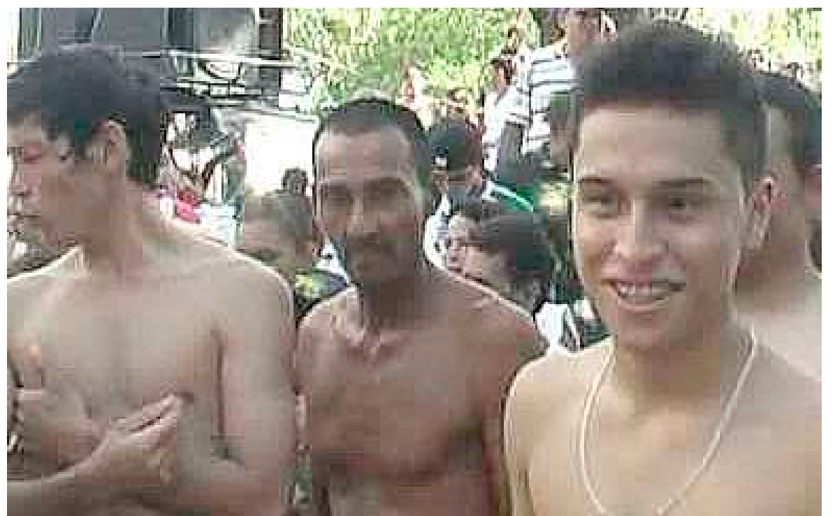
Recuerdos de una de las primeras versiones

“Hay mucha gente que está pendiente para tomar parte en la carrera, ante todo los que vienen del exterior, para esta versión tendremos participantes de México y de Venezuela, están con ganas de entrar a la competencia”