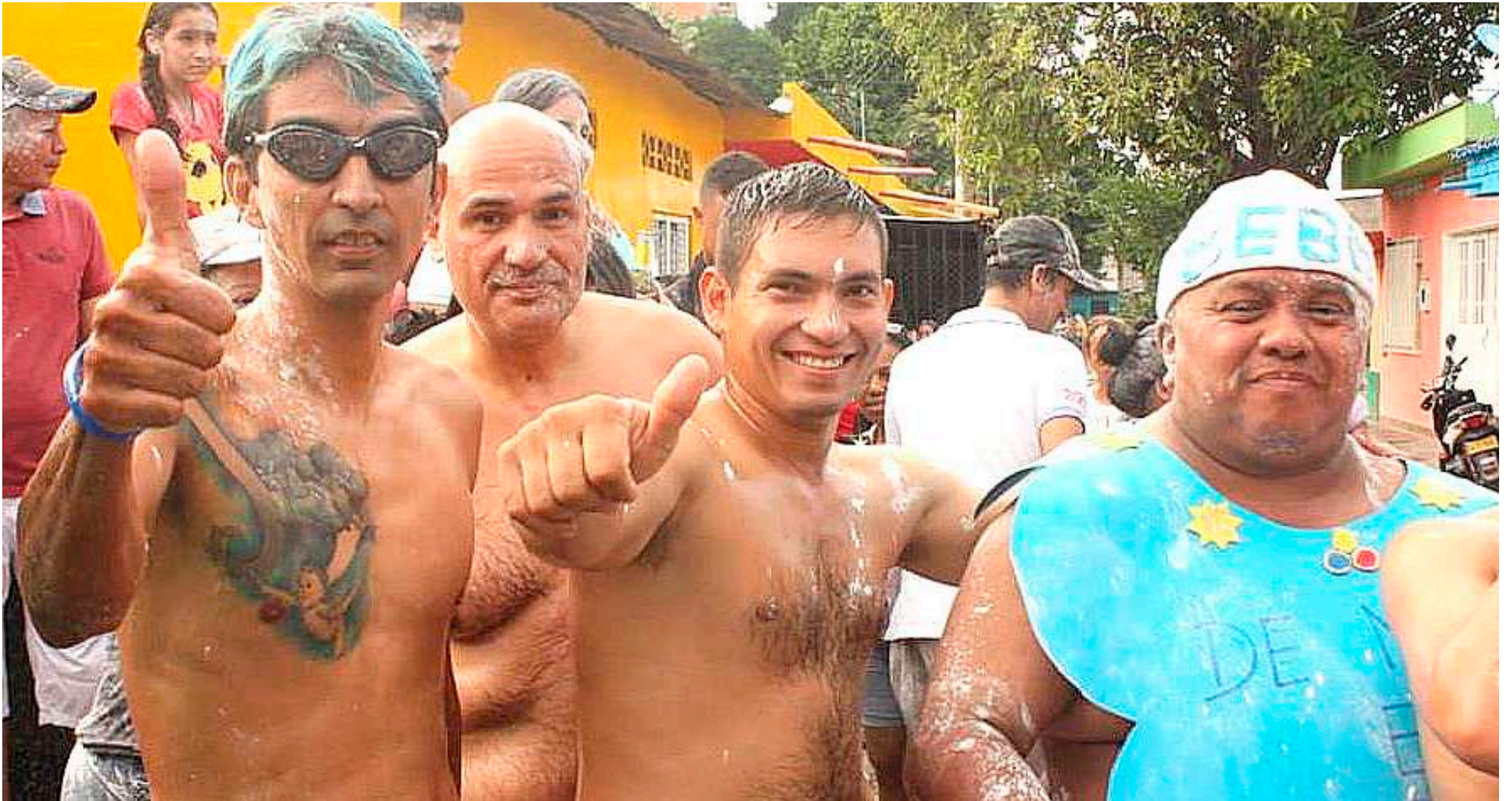
Este año será la versión 22 de la carrera en calzoncillos del Emayá.