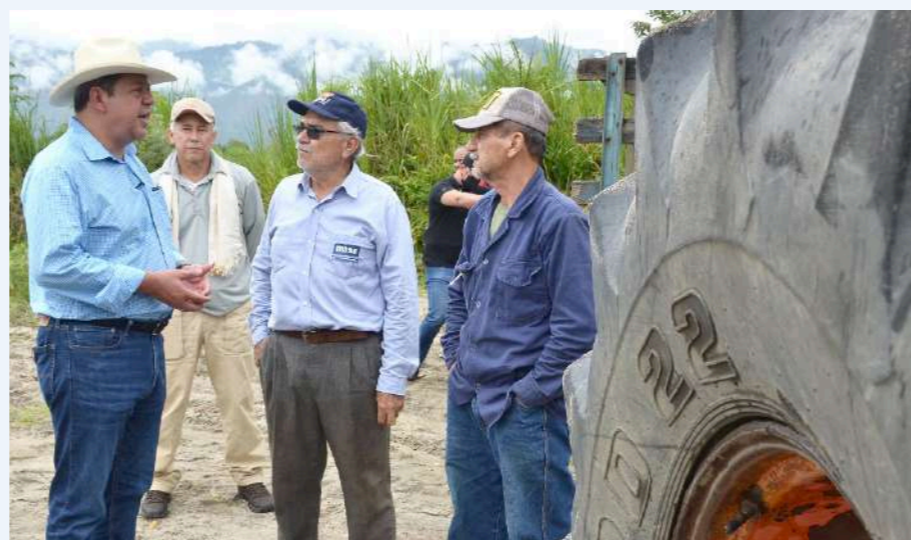
En ganadería estará financiado con recursos del Ministerio de Ciencia Tecnología e Innovación, por un monto de $7794.758.208, y ejecutado gracias a una alianza de la Gobernación del Huila, Agrosavia, Universidad Corhuila, y Comité de Ganaderos, el cual está enfocado en incrementar la productividad y competitividad del sector ganadero bovino de leche en el Departamento del Huila

En ese sentido se vienen ejecutando proyectos por el orden de los $31.192.790.415, de la mano de aliados estratégicos como Agrosavia, Cenigaa, Fedearroz, Asohofrucol, Cepass, Universidad Surcolombiana, SENA, Universidad Corhuila, y la UNAD, donde el resultado de las investigaciones será clave para la toma de decisiones a futuro.