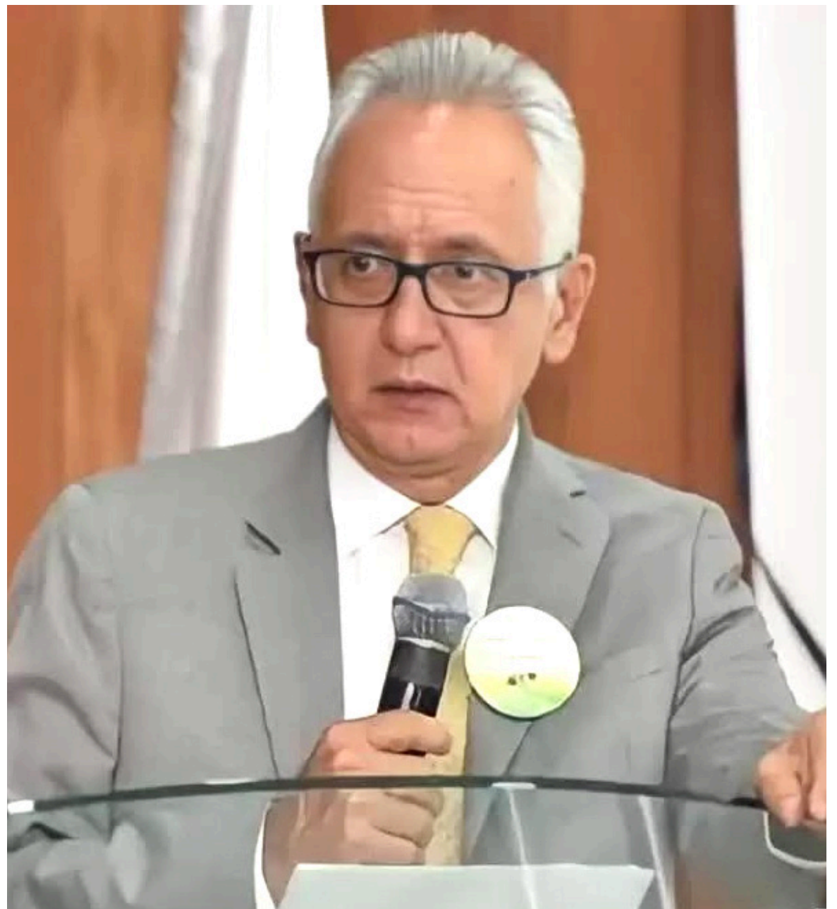
Guillermo Alfonso Jaramillo, ministro de Salud y Protección Social.

: Una de las dudas más frecuentes de los usuarios del sistema de salud sobre los cambios con la reforma está relacionada con los medicamentos, pues muchos de ellos los recogen en la sucursal habitual de su EPS, pero parece que esto no cambiará por el momento.