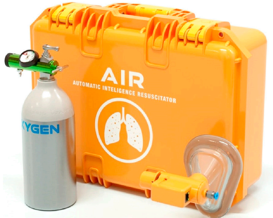
La tecnología es automática y solo cuenta con un botón que se emplearía para indicarle a la máquina si es el paciente es un adulto o un niño.