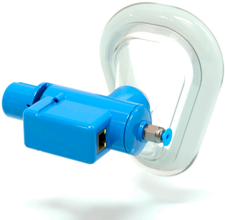
El software incluido en el REA cuenta con código protegido creado de manera exclusiva para el mencionado equipo.