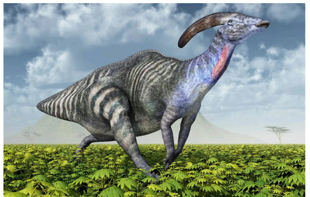
Los fósiles del parasaurolophus se han encontrado en Canadá y en Estados Unidos.