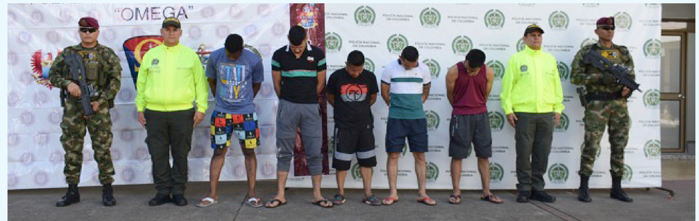
Las autoridades en el Huila, han acertado golpes contra las disidencias.

Los detenidos deberán responder por los delitos de concierto para delinquir agravado, homicidio agravado y tráfico, fabri-