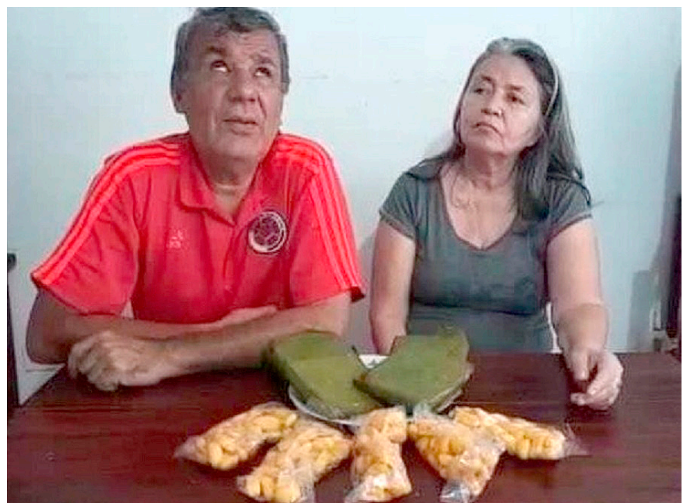
Chocolate Maná es el nombre de la empresa integrada por una pareja con discapacidad visual.

“Nosotros compramos en Rivera y ahora en Teruel porque buscamos los sitios donde menos utilicen abonos químicos para tratar de hacerlo orgánico y no cualquier cacao nos sirve, así que