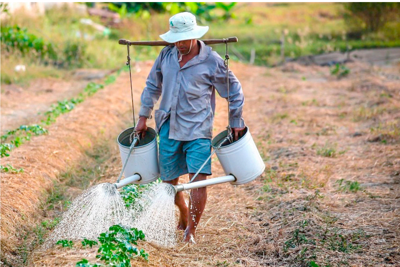
Los esfuerzos, deberán enfocarse en sofisticar y diversificar los aparatos productivos de la regiones del país.

“En otras palabras, el mundo ideal es uno en el que existen estos esfuerzos de desarrollo productivo desde el nivel local arropados con esfuerzos desde el nivel nacional”.