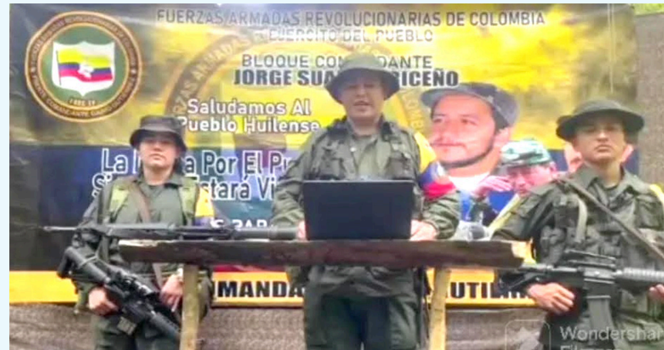
En días pasados se conoció un video, donde las disidencias confirmaban su presencia en el Huila.