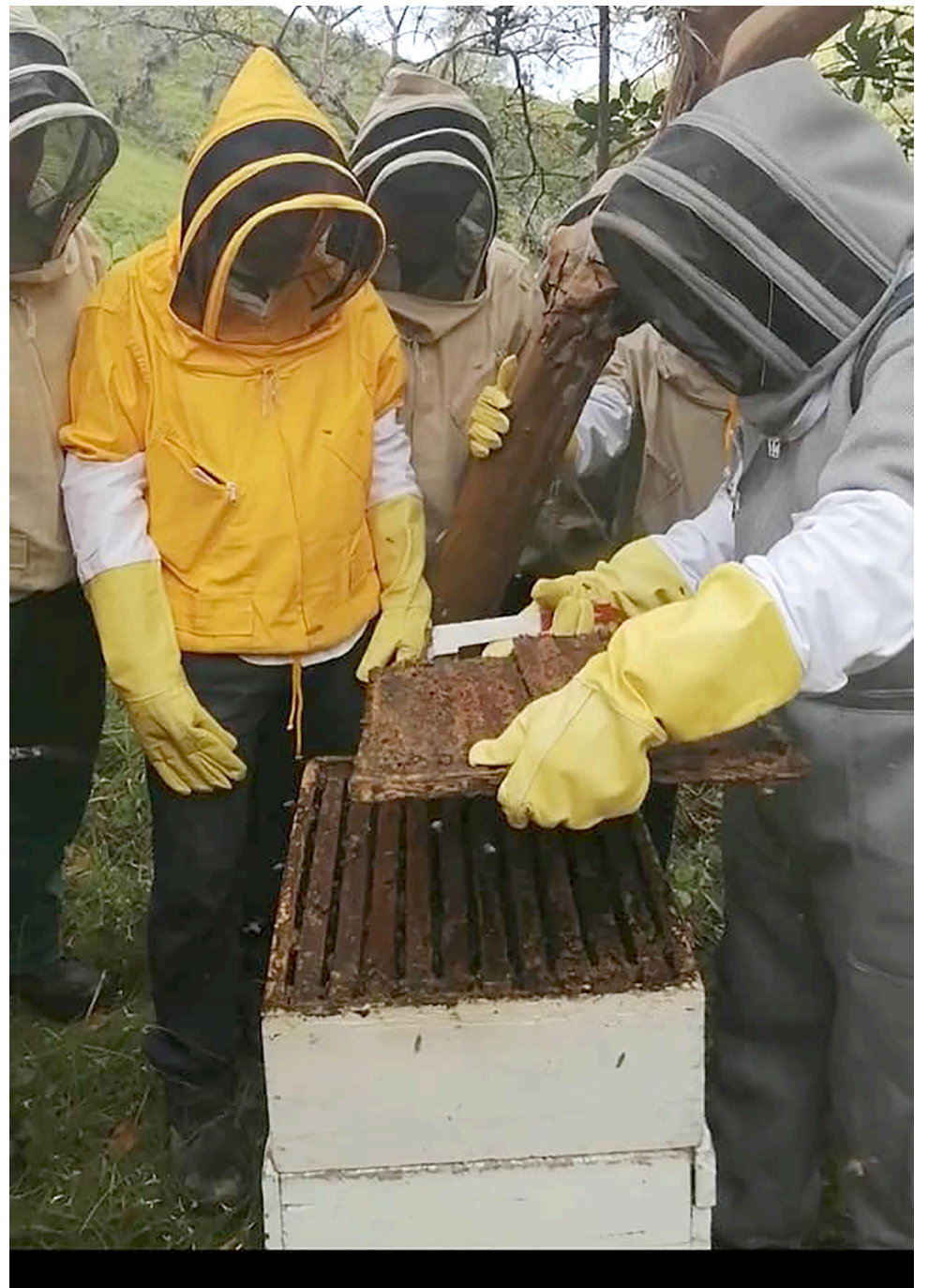
En Coapi, hay cerca de 315 beneficiarios, los cuales están organizados en 16 asociaciones municipales.

“Sumado a que es gravísimo que dejen de existir abejas, ya todos sabemos que las abejas son el ente primario para la polinización de todos los cultivos, llámese arvenses, frutales, café, entre otros”, Moyano Urriago,