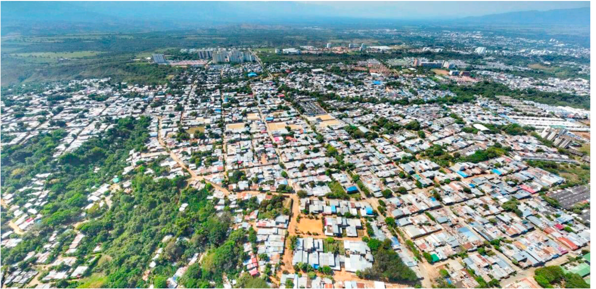
La Cepal resaltó que la Comisión Regional de Competitividad e Innovación, es un referente para el resto de los departamentos del país.

ese sentido lograr mayores niveles de prosperidad para todos nuestros habitantes que es lo que se trata todo esto”, puntualizó.