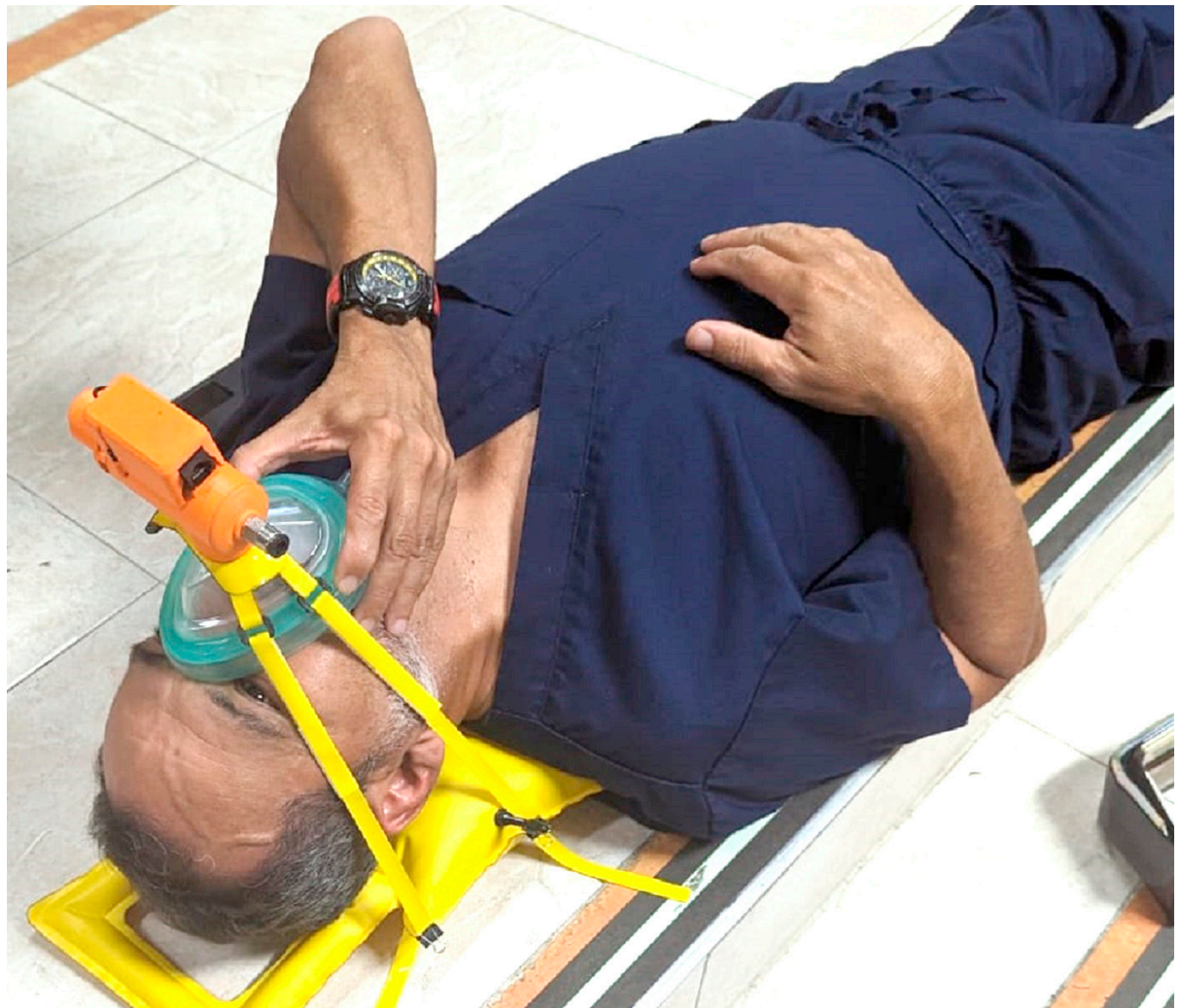
El equipo cuenta con media hora de autonomía. Después de abierto el maletín se inicia todo, la persona no tiene que hacer nada adicional.

La tecnología creada en el departamento del Huila garantiza media hora de autonomía, tiempo en el que se podría salvar la vida de una persona mientras llega el equipo de profesionales tratantes.