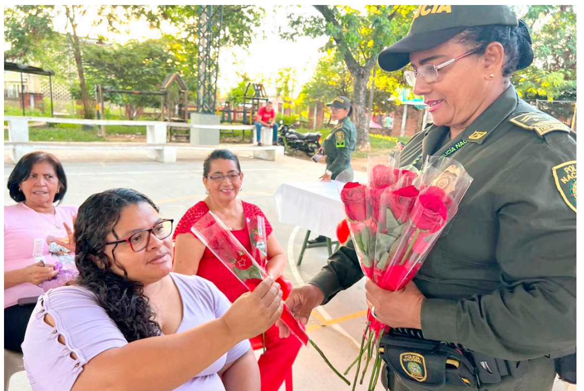
Policía Metropolitana de Neiva celebró el día de las madres a las mamás de los niños y jóvenes del grupo cívico infantil y Juvenil de la comuna Nueve.