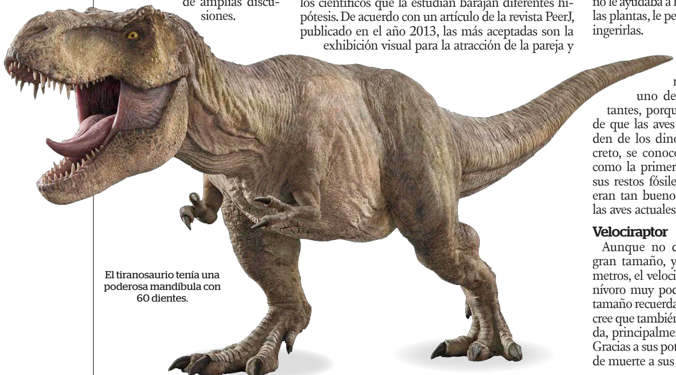
El tiranosaurio tenía una poderosa mandíbula con 60 dientes.

Se estima que su longitud rondaba entre los 10 y 14 metros, mientras que su peso se encontraba alrededor de cuatro o siete toneladas. Sus brazos de pequeño tamaño suele ser su característica más llamativa. Este aspecto ha sido objeto de amplias discusiones.