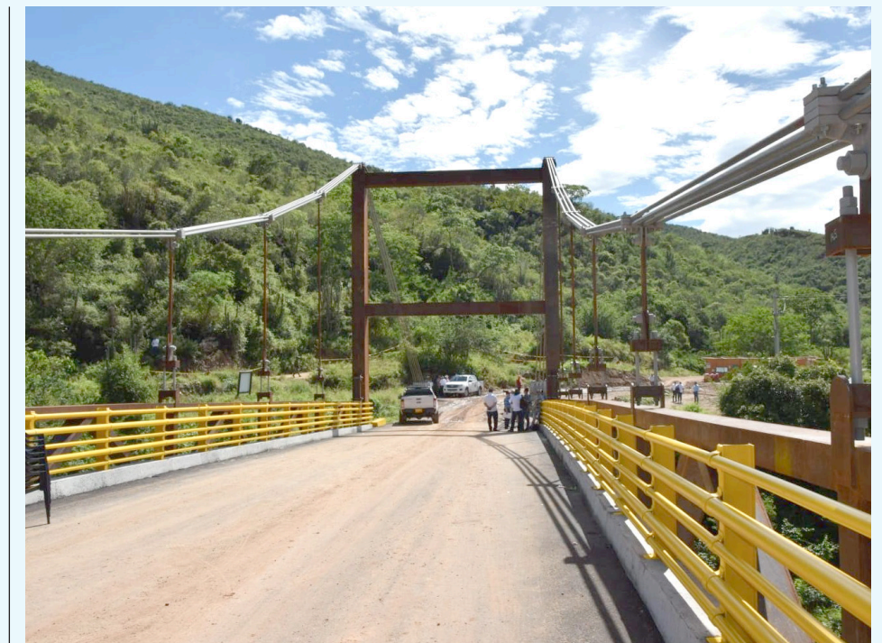
El puente 'Las Delicias' fue inaugurado el pasado fin de semana.

El mandatario de los tolimenses señaló que llevará el caso hasta el Alto Comisionado para La Paz.