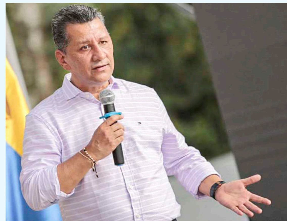
Ricardo Orozco, Gobernador del Tolima.

Finalmente, el mandatario señaló que afortunadamente se realizó el día sábado sin contratiempos, sin embargo, sigue latente esa preocupación por todos los gobernantes del país como el Meta y Caquetá.