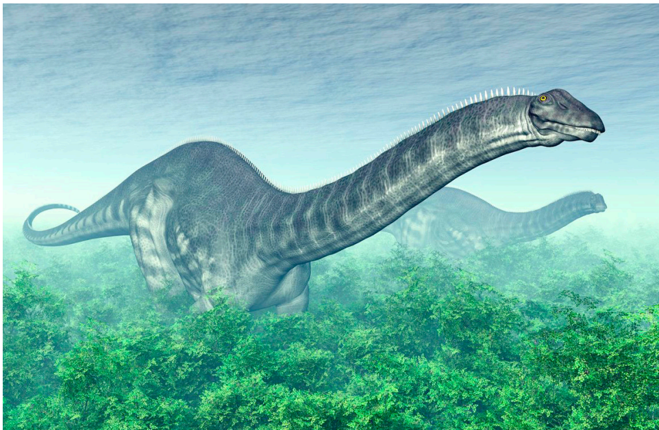
El apatosaurio es un dinosaurio saurópodo que vivió hace unos 150 millones de años.