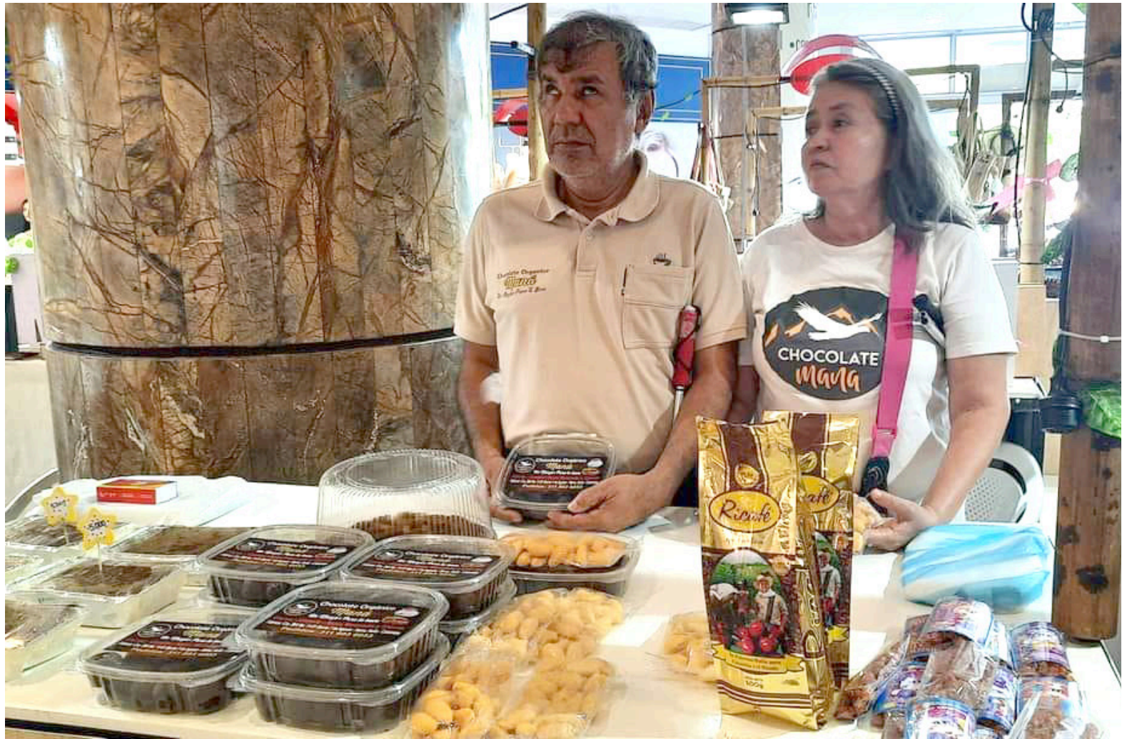
El departamento del Huila tiene gran potencial y el papel de la comunidad es fundamental para que se logre.