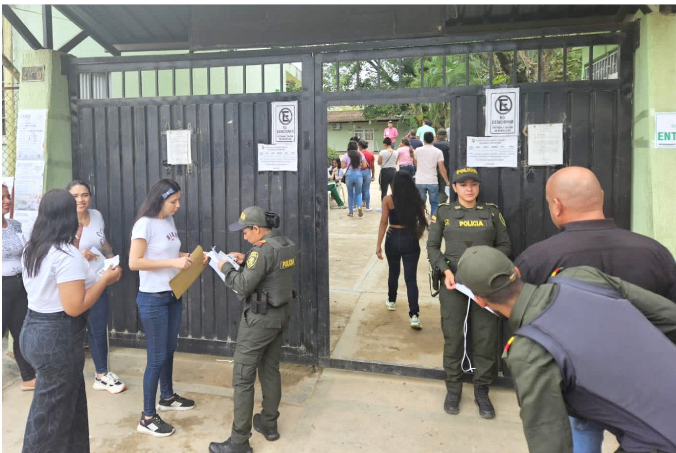
La jornada electoral en el Huila fue en su mayoría tranquila, aunque se registraron incidentes como la captura de personas con órdenes judiciales en diferentes municipios.

El departamento vivió una jornada pacífica y participativa, con incidentes mínimos, indicaron las autoridades de policía en el Huila.