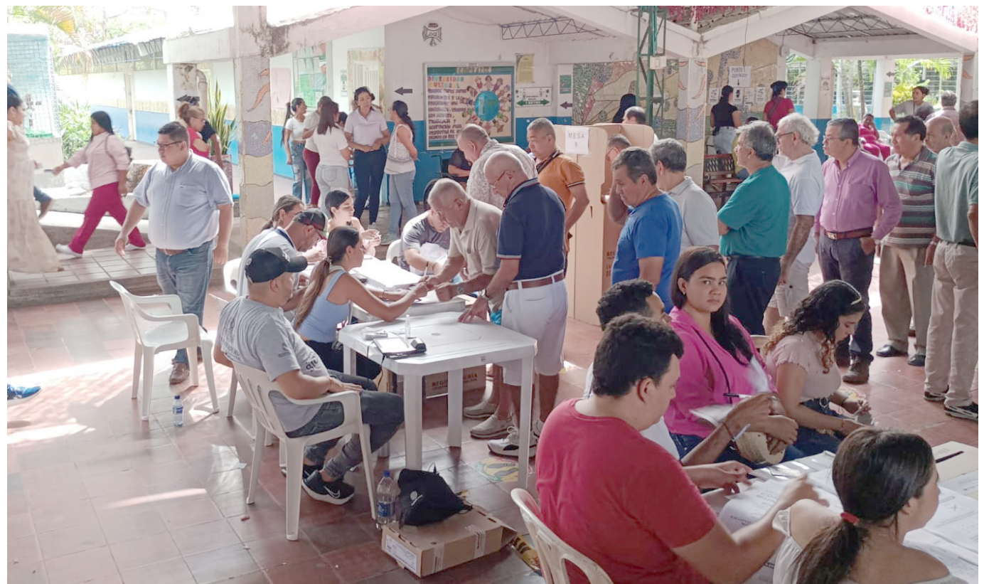
No hubo capturas relacionadas con delitos electorales.

reportes y denuncias desde diferentes municipios del país, por constreñimiento territorial, publicidad política y suspensión de elecciones.