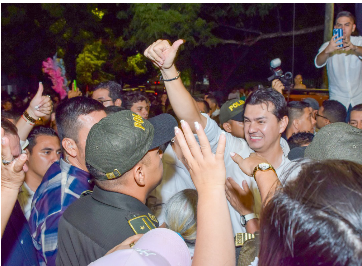
Con el dedo en señal de victoria, el exconcejel, celebró el triunfo.