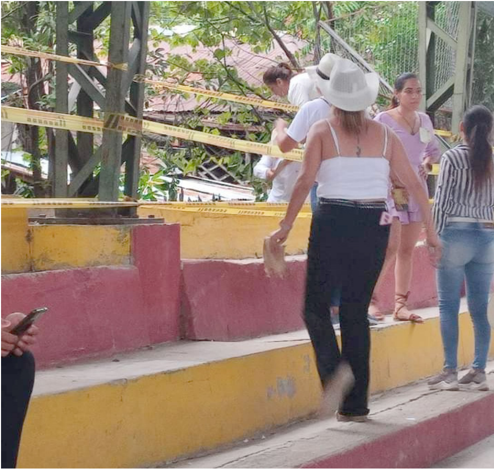
Situación vivida en el municipio de Baraya.