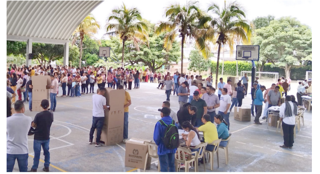
Estos serían los nuevos diputados del Huila ■ ESPECIAL POLÍTICO 6-7