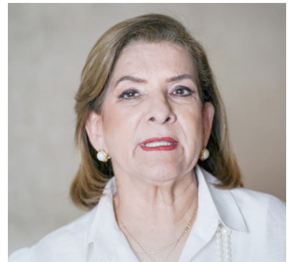
Margarita Cabello, procuradora general de la nación.

Asimismo, Procuradores Territoriales de Antioquia, Arauca, Bolívar, Cundinamarca, Nariño, Putumayo, Risaralda y Sucre envían