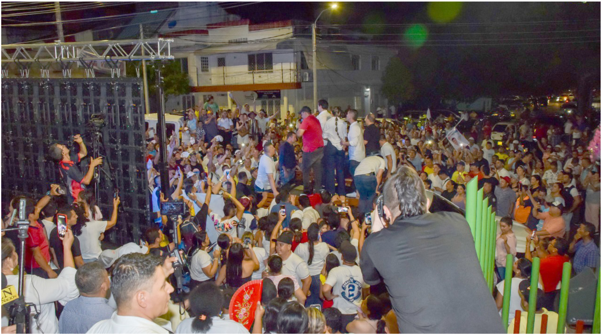
El festejo de la victoria, tuvo lugar en la sede de campaña, cerca del Parque de la Música.