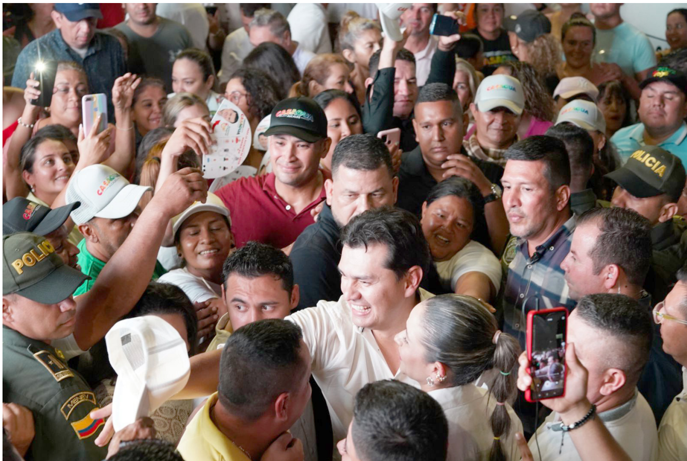
Cientos de seguidores llegaron a felicitarlo.