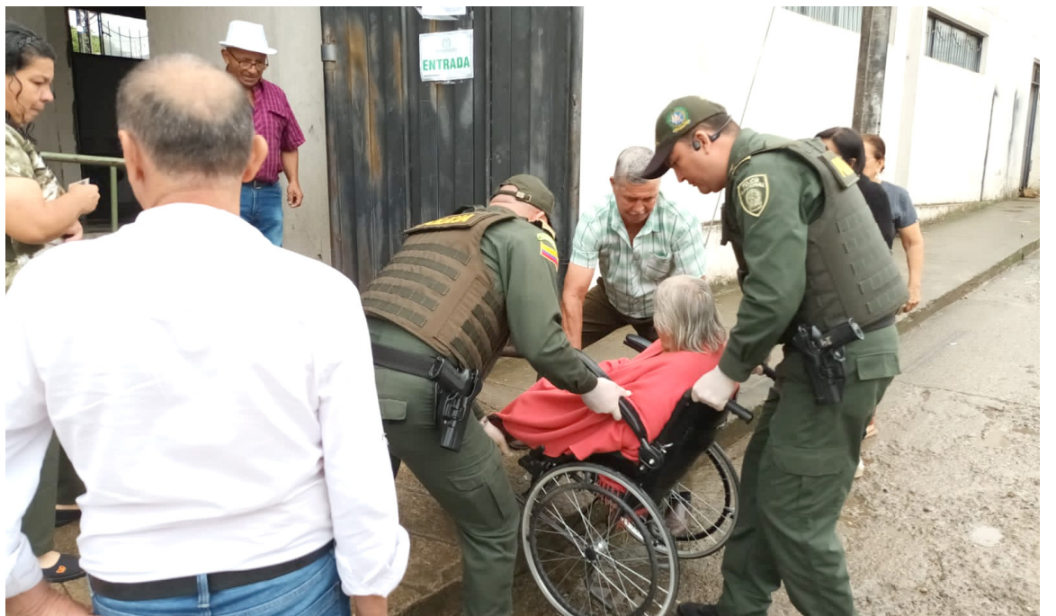
El acompañamiento y la empatía de los uniformados del Departamento de Policía Huila en cada uno de los municipios, con las personas de la tercera edad y quienes sufren de alguna limitación física.