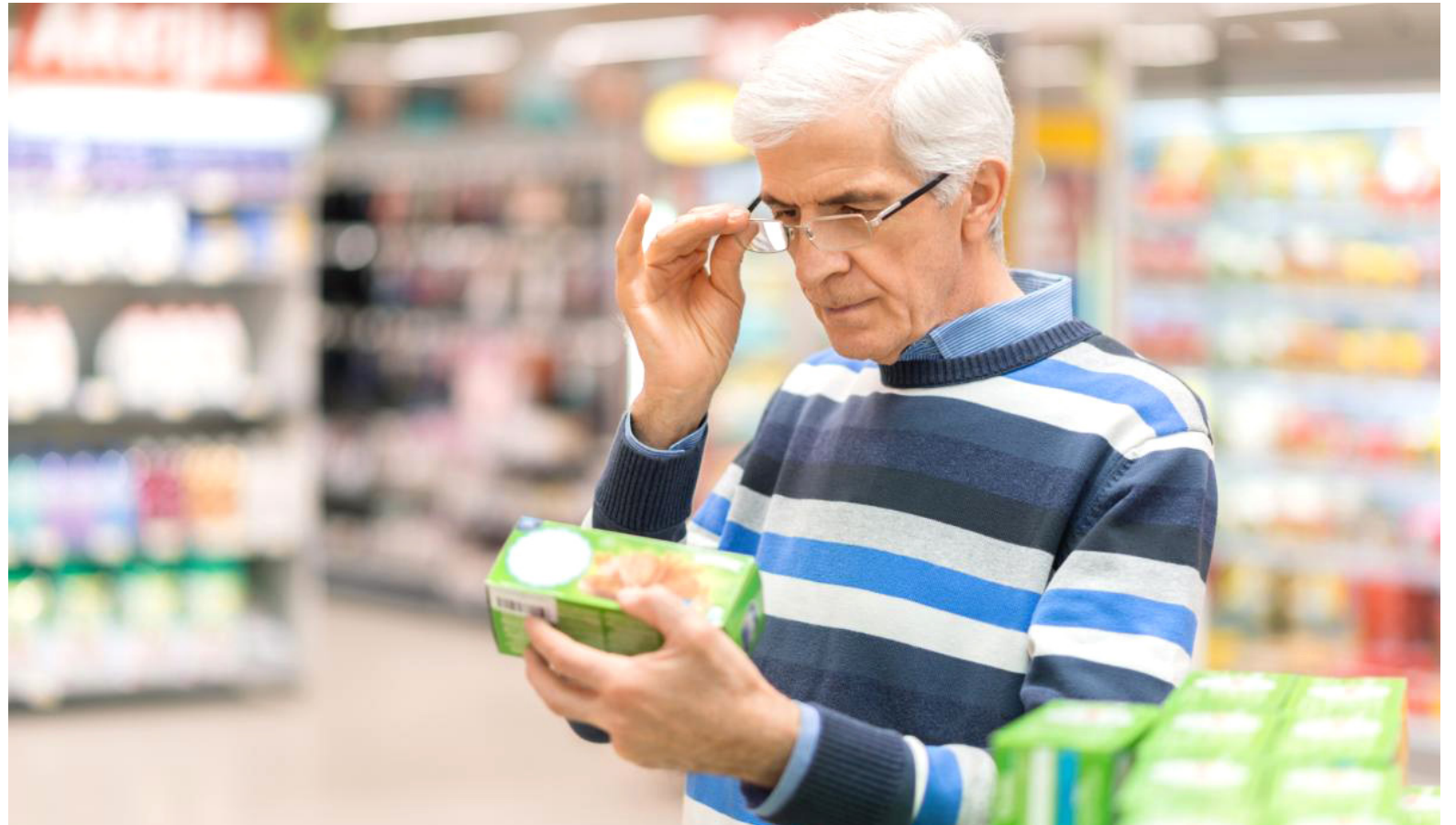
Los impuestos saludables entran a regir el 1 de noviembre de 2023.

De manera concreta, estos son los productos sujetos al IBUA: