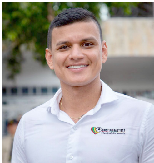
Cristhián Rubther Bautista, concejal por el partido Movimiento Unidos Por Neiva.