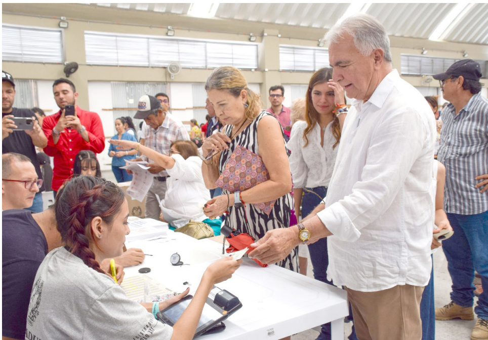
El nuevo gobernador Rodrigo Villalba Mosquera junto a su familia, ejerciendo su voto en las elecciones del Huila. Su liderazgo y compromiso son reconocidos en la región.