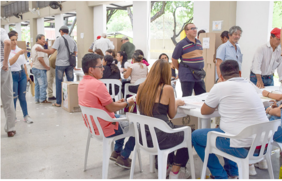
Los opitas eligieron a sus alcaldes ■ ESPECIAL POLÍTICO 10-11