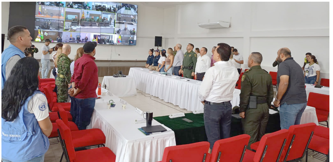
A pesar de un incidente en Iquira, las elecciones en el Huila transcurrieron en paz y normalidad, con una alta participación ciudadana en los 37 municipios.

El Partido Liberal emerge como el gran vencedor en el Huila, asegurando 3 puestos en la Asamblea con un total de 99,079 votos, en una jornada electoral que refleja una diversidad de representación política.