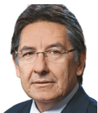
Néstor Humberto Martínez Neira

A la hora de los balances de la jornada electoral de este domingo, solo quedará claro que el Gobierno sufrió una aplastante derrota, que los alternativos cargan templanamente con el desgaste de la coalición oficialista y que nuestro sistema político y electoral está enfermo, al extremo de que no sabemos quién ganó las elecciones. No me imagino la tarea de los editores logrando un titular que identifique, para sus lectores, cuál fue la colectividad que hoy obtuvo mayores adhesiones.