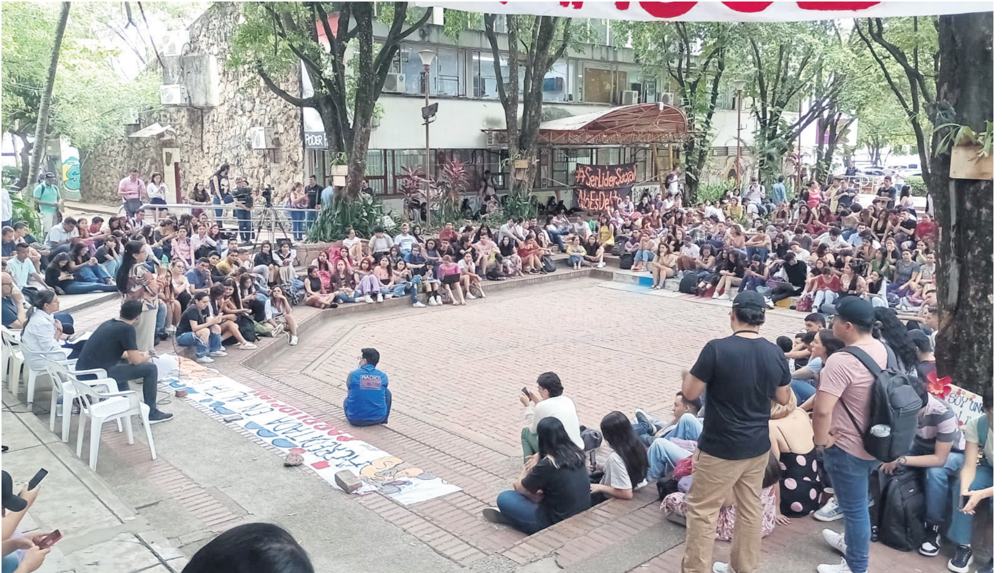
El foro se dio en las ágoras de la Universidad Surcolombiana.