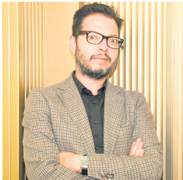
Juan David Correa, Ministro de Cultura.

“Se me dirá que la teoría y las ideas que les he expuesto hoy están muy bien, pero que el reto de cualquier gestión es hacer que esos ideales se expresen y consigan insertarse en la sociedad; que las políticas públicas bajen y se hagan realidad. Creo, sin temor a equivocarme, que en este Ministerio y en la gestión cultural colombiana hay estupendos ejemplos de colaboración que han producido resultados innegables. Se me ocurre pensar en la política de patrimonio a través de empeños como las Escuelas Taller; la de lectura, a través del Plan Nacional de Lectura