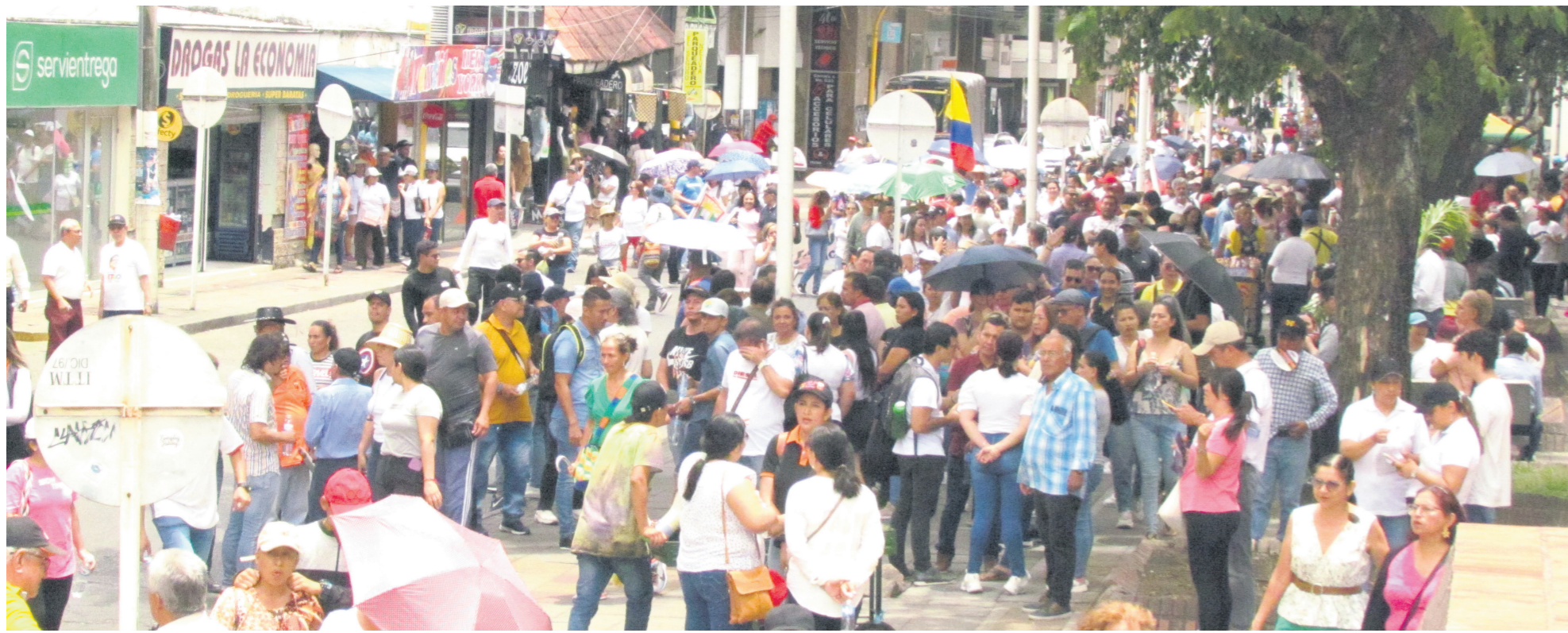
Los profesores demandan un mejor servicio de salud.