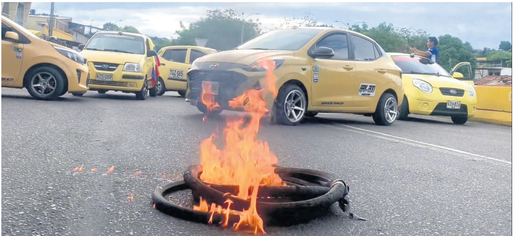
Los taxistas de Colombia, luego de entrar en paro por el alza al precio de la gasolina, entraron a concertar medidas con el ministerio de Transporte.

a entregar y lo dijo el ministro de Transporte, que eso no se le va a llevar directamente al conductor del taxi ni va a llegar en cada tanqueada. Entonces la pregunta es ¿Cómo hace la estación de servicio, de qué manera la estación de servicio podrá entregarle al taxista el precio preferencial? Tendríamos que ver porque solamente se le daría a los que están inscritos en el RUNT. ¿Las estaciones de servicio tendríamos que tener un chip o un código QR en el cual nosotros identifiquemos eso? La otra pregunta que nos estamos haciendo nosotros es ¿Cuánto va a ser el monto que va a canjear o cuánto va a ser la cantidad que tanquearía el taxista?, y la tercera es ¿Cómo haría o cuál sería la parte logística para devolverle o entregarle a las estaciones lo que se le va a dar de diferencia? Porque es que nosotros compramos en la planta a un solo valor. Entonces vamos a mirar si vamos a un solo valor y lo vendemos a un precio, así no hay ningún problema, pero si voy a vender a dos precios, entonces o lo asumimos nosotros como estación de servicio que no estaríamos en condiciones y luego lo asume el ministerio de Minas y Energía. ¿Pero en qué condiciones se les devolvería ese valor a las estaciones de servicio? La logística es lo que no tenemos claro” indicó Luz Mila Moyano.