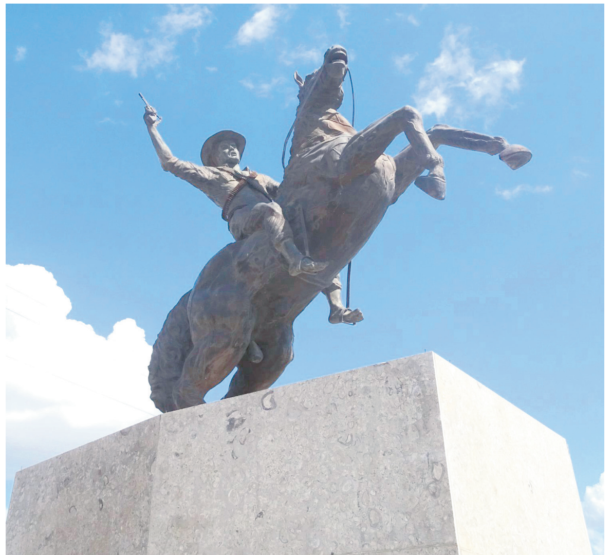
Un nuevo relato, sin “tumbar monumentos” ni borrar lo hecho hasta ahora.

“El horizonte del Ministerio”, no son unas promesas burocráticas, sino una propuesta para construir un nuevo relato, sin “tumbar monumentos” ni borrar lo hecho hasta ahora.