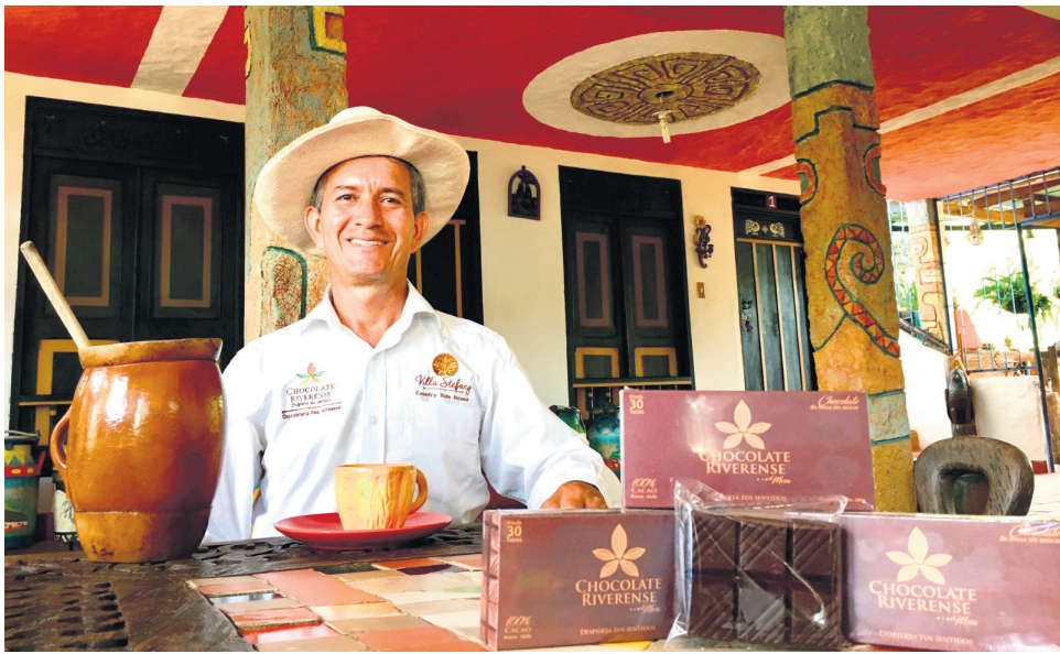
La Secretaría de Desarrollo Económico y Turismo del Huila viene trabajando en diferentes estrategias para la creación de una ruta de cacao.