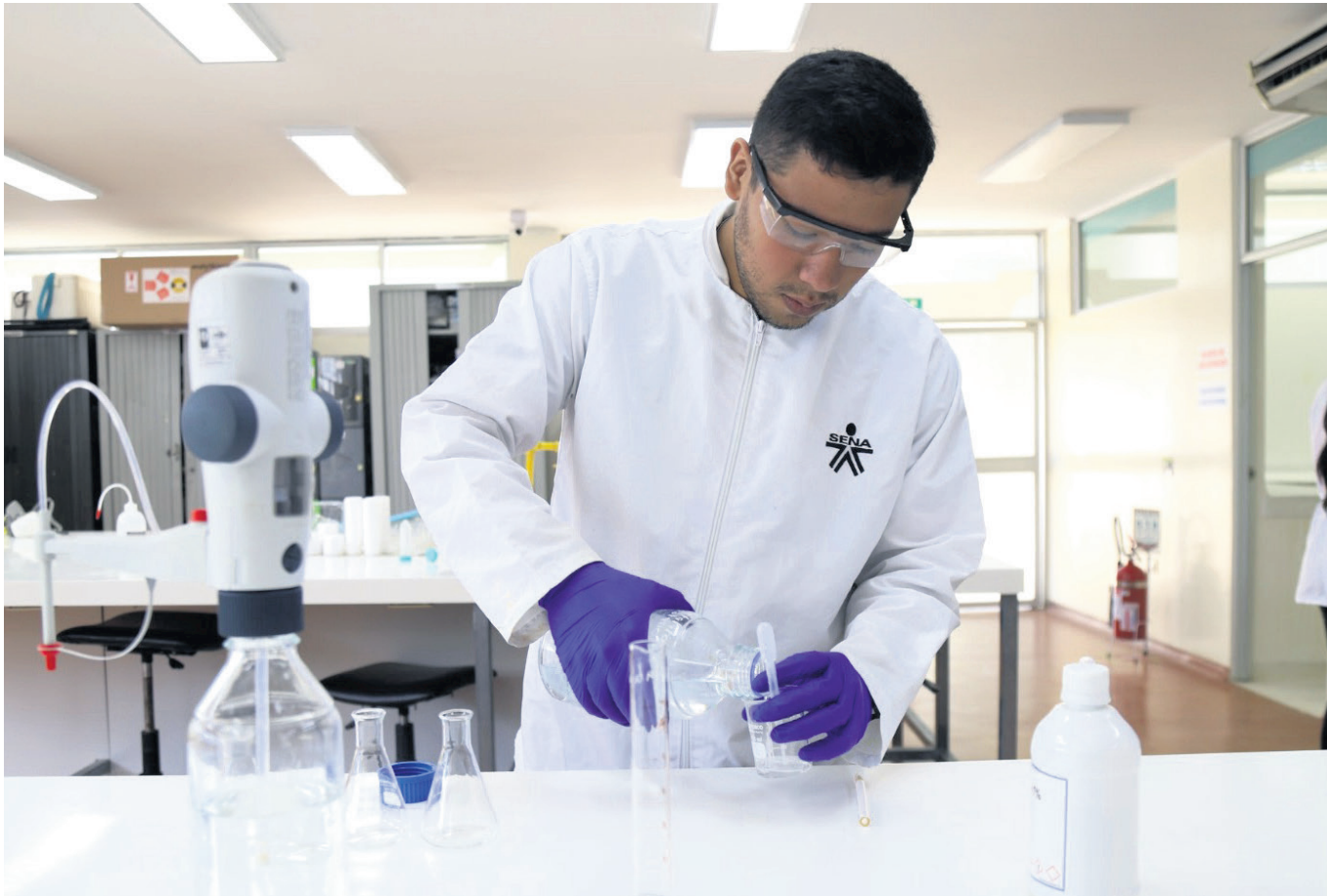
El centro formativo de Garzón, solo cuenta con 8 ambientes o salones de formación.

tes que quieran hacer parte de los programas de formación” indicó el sindicalista.