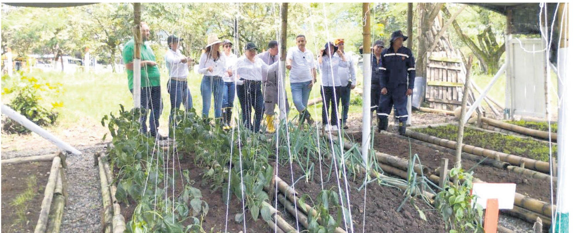
El centro de Desarrollo Pecuario no cuenta con una granja propia que le permita tener animales.

La deserción de aprendices es una de las falencias más resaltadas por el SINDESENA que afecta la garantía educativa de los programas de formación.