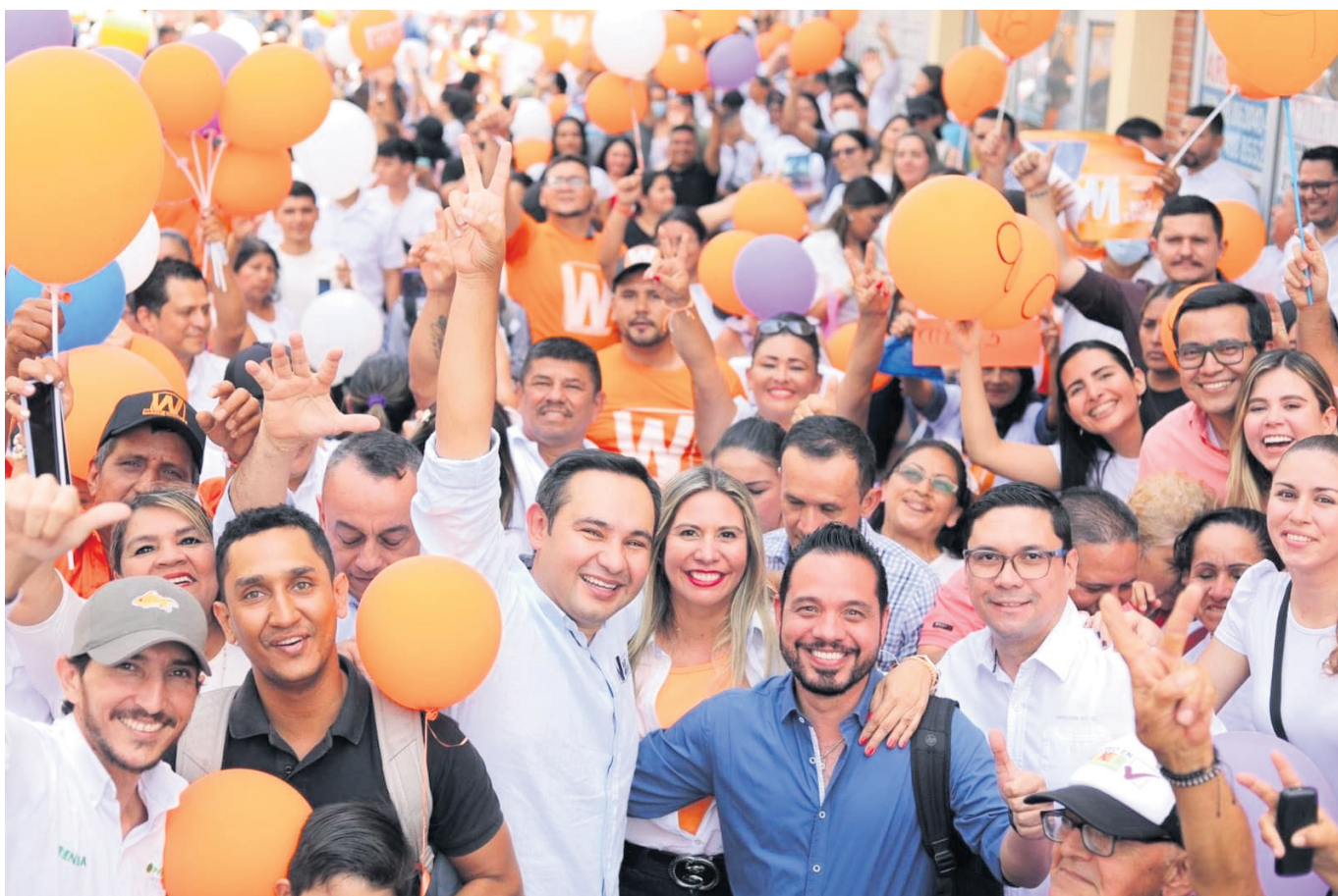
El candidato viene realizando recorridos por la ciudad socializando su proyecto.

Wilker ha logrado despertar mucho más entusiasmo palpable entre los ciudadanos, quienes valoran la oportunidad de conocer de cerca al candidato y entender sus planes para el futuro de la ciudad.