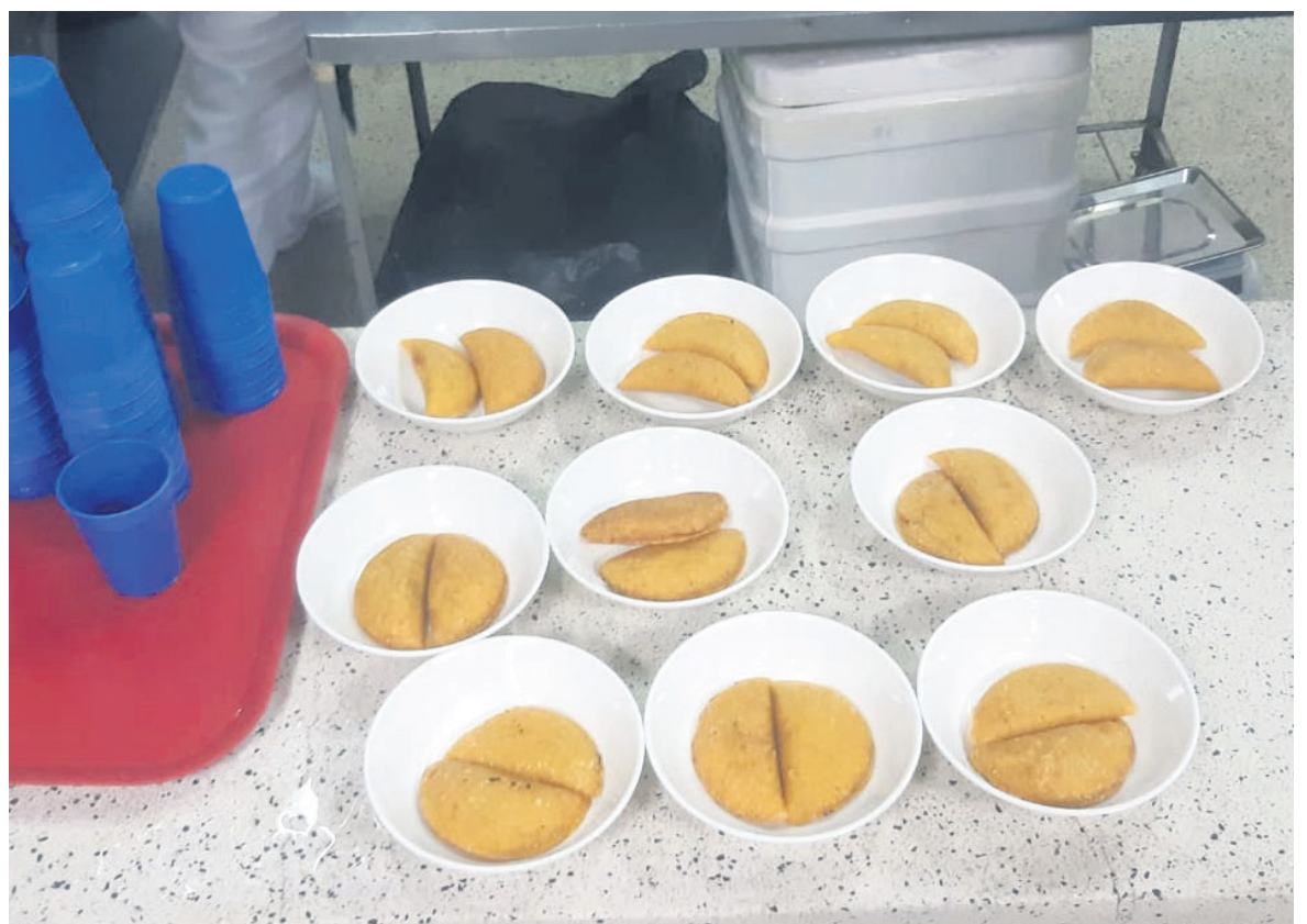
Denuncian poca cantidad y calidad de los alimentos dados a universitarios.