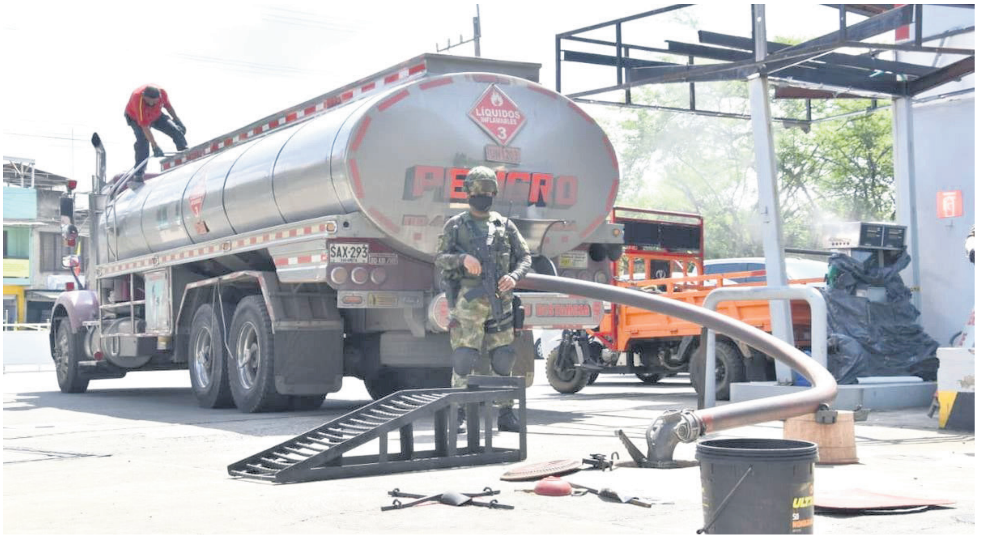
Los precios de la gasolina varían hacia el sur del Huila por el costo del transporte.