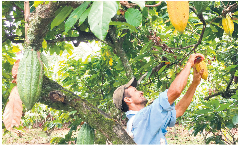
A través de la Secretaría, se vienen fortaleciendo rutas y circuitos turísticos.