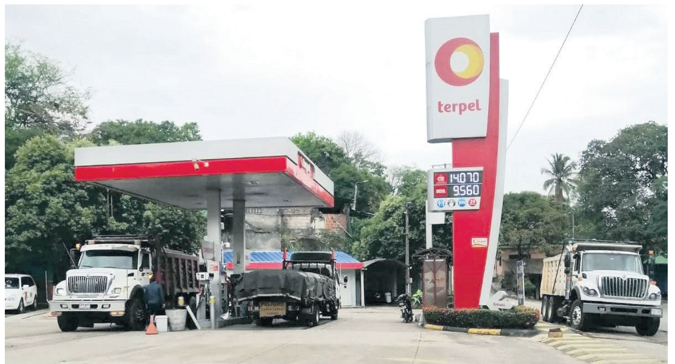
La gasolina ha tenido un aumento de $600 pesos.

Entre las estrategias que plantea el gobierno para la aplicación de la tarifa preferencial para taxis, se estaría acordando una identificación de propietarios y conductores a través del pago de seguridad social y haciendo un estudio sobre los kilómetros recorridos por cada vehículo a diario, en la semana y al mes.