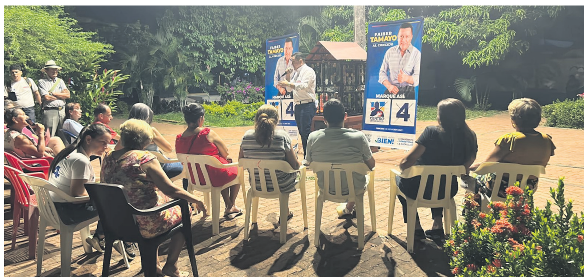
El candidato socializa con las comunidades su trabajo.

“Fui el ponente y el defensor para pagar los honorarios de los ediles; recordemos que fue sancionado por el Congreso de la República y aquí estábamos demorados en reconocerle a los ediles sus honorarios, yo fui el ponente”.