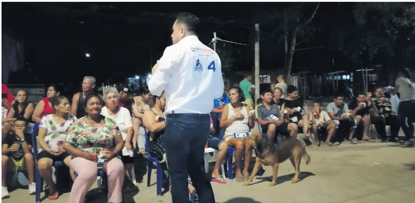
El concejal viene socializando con la comunidad su proyecto para seguir aportando a la ciudad.

En mi gestión como concejal durante estos tres años y medio, permítame decirle y refrescar la memoria de los neivanos y los huilenses, pues en el primer año presenté un proyecto de seguridad, un proyecto de seguridad que fue intentado hundir dos veces en la Corporación Concejo de Neiva. Luego de ser aprobado por el Concejo fue revocado por el alcalde en dos oportunidades. Se sancionó, hoy es un acuerdo municipal, pero la actual administración no lo puso en vigencia ni lo ha tenido en cuenta. Es un acuerdo municipal que hoy es letra muerta, porque