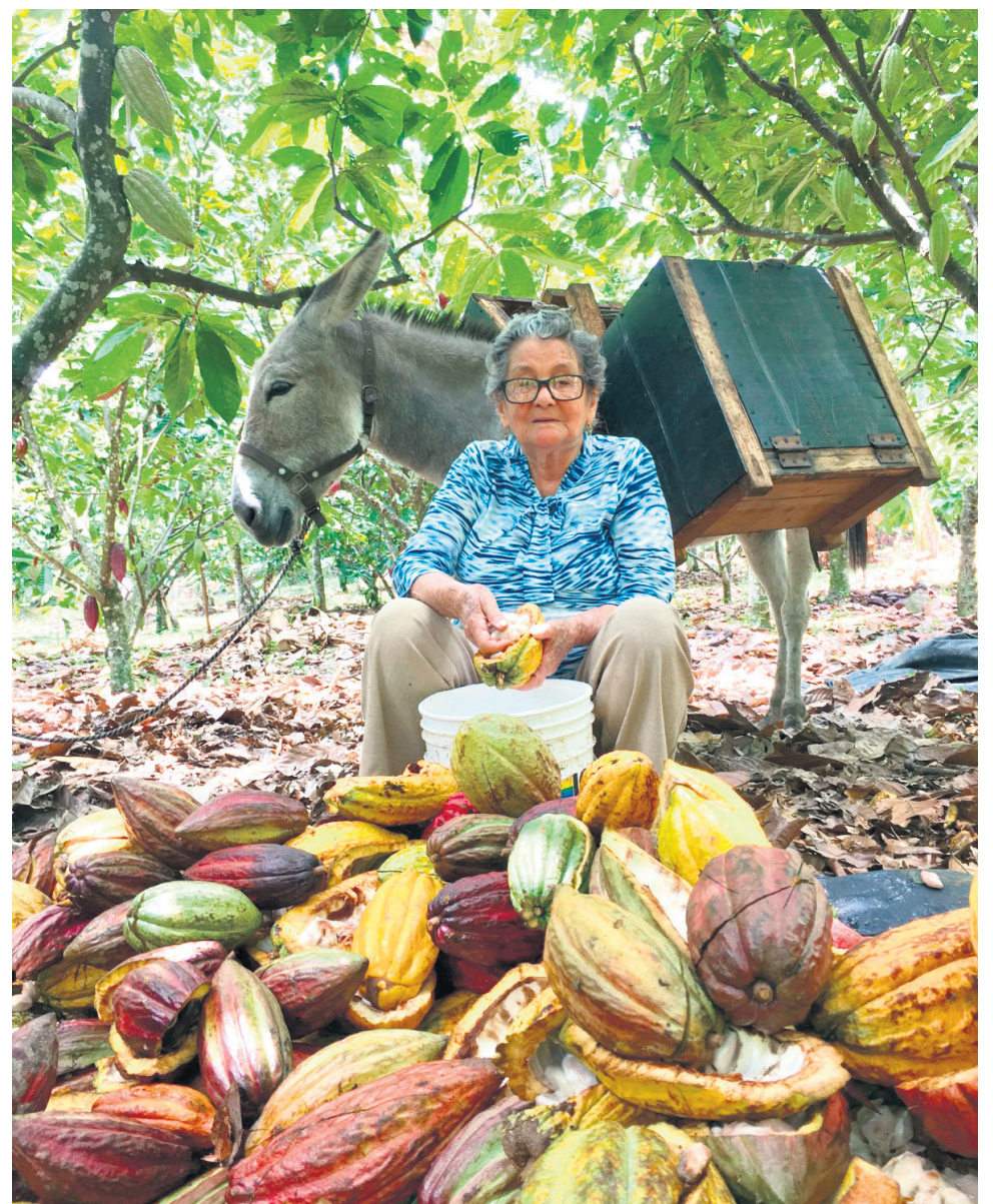
La casa campo tiene una oferta de hospedaje, que nació luego de que colegios y empresas empezaran a visitarla para conocer la experiencia del cacao.

una oferta de alojamiento para los visitantes que deseen sumergirse completamente en la experiencia cacaotera. Desde chocolatinas hasta trufas exquisitas y salsas para acompañar pan y galletas, Villa Stefany ofrece un abanico de sabores y conocimientos.