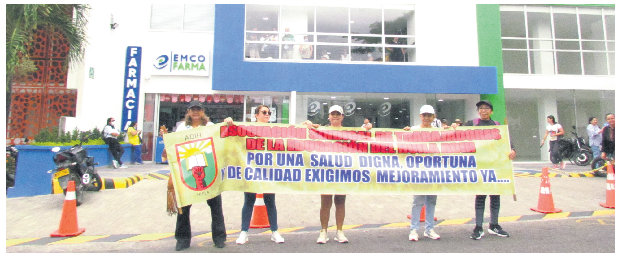
Las docentes protestaron frente a Emcosalud.