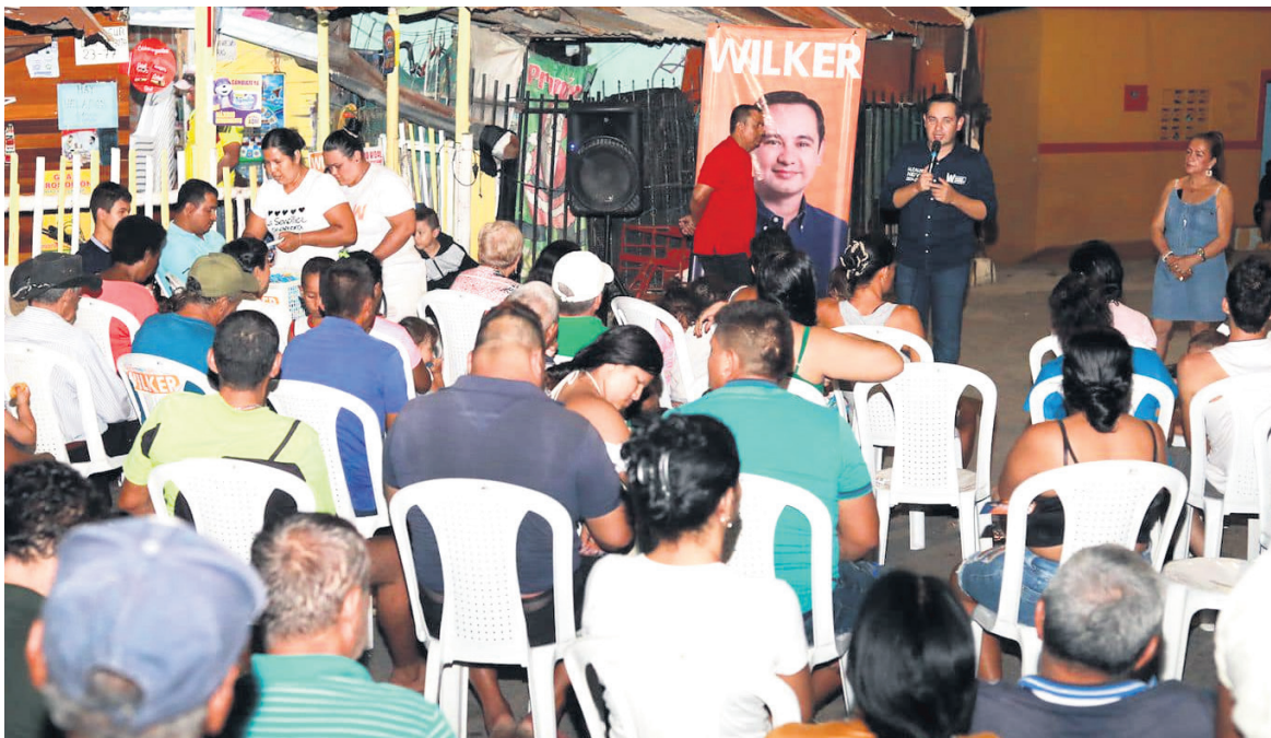
Bautista cuenta con un gran apoyo por parte de los neivanos.