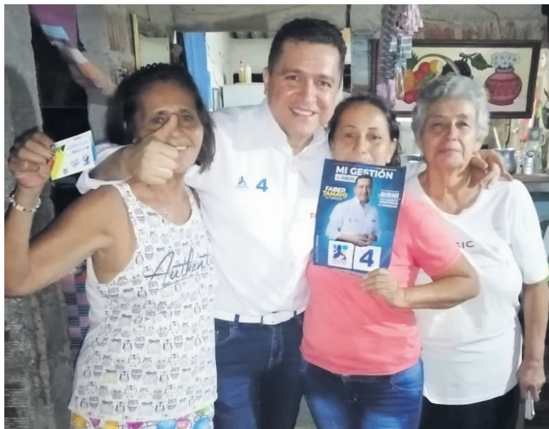
Faiber cuenta con el apoyo de la comunidad.