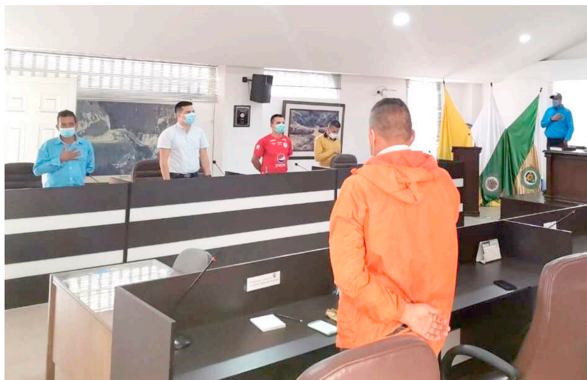
El concejo municipal está dividido en torno a la situación planteada que finalmente afecta es a la comunidad.

Así quedó abiertamente planteado que el tema pasa por desacuerdos de tipo político y ahora todo depende que puedan sentarse las partes para llegar a esos acuerdos que permitan realizar los proyectos y ante todo que no se pierdan los recursos.