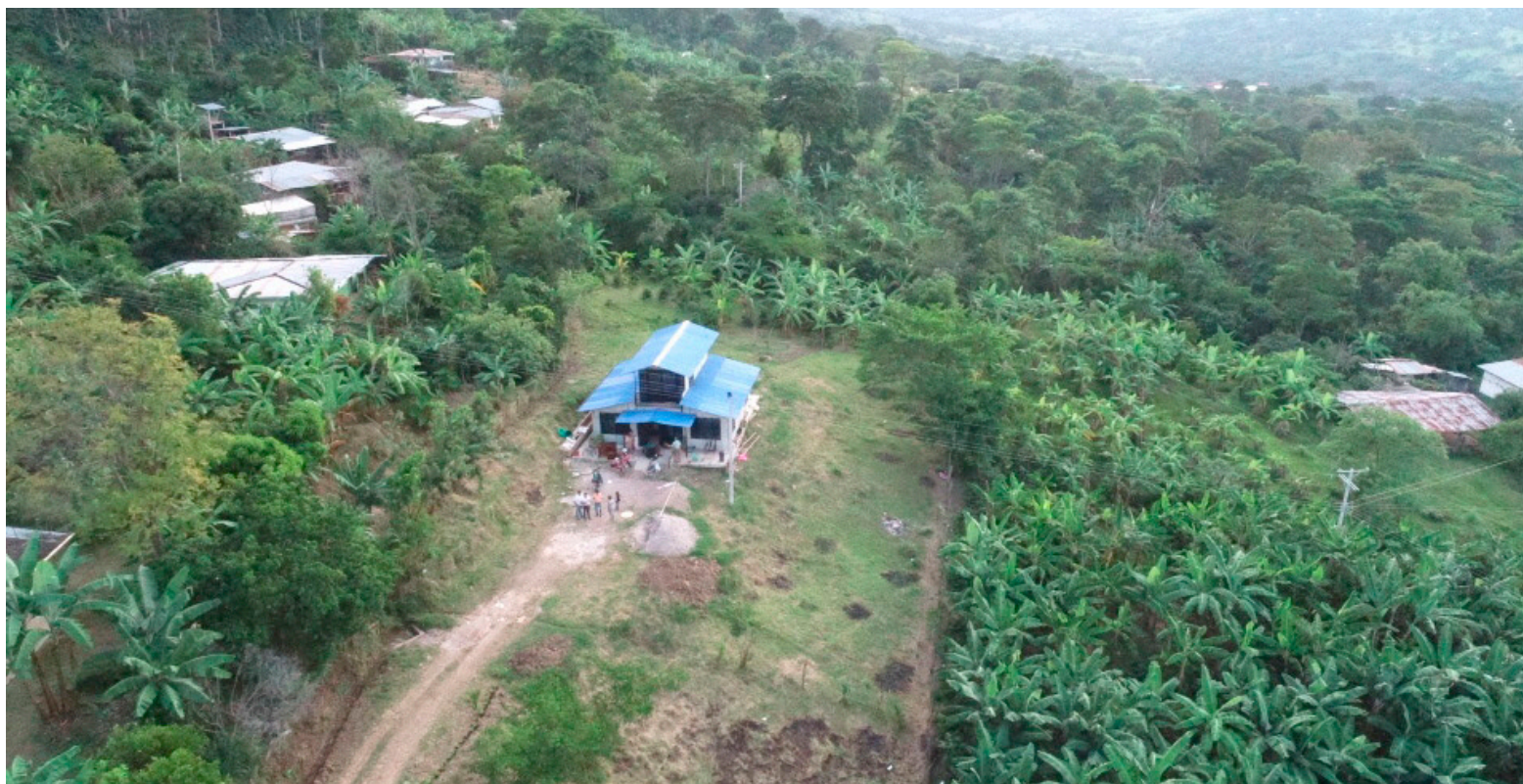
La zona rural especialmente reclama placas huella para mejoramiento vial.

La Personería municipal, acompaña los procesos de la comunidad en el municipio de Timaná. El titular de ese despacho en la