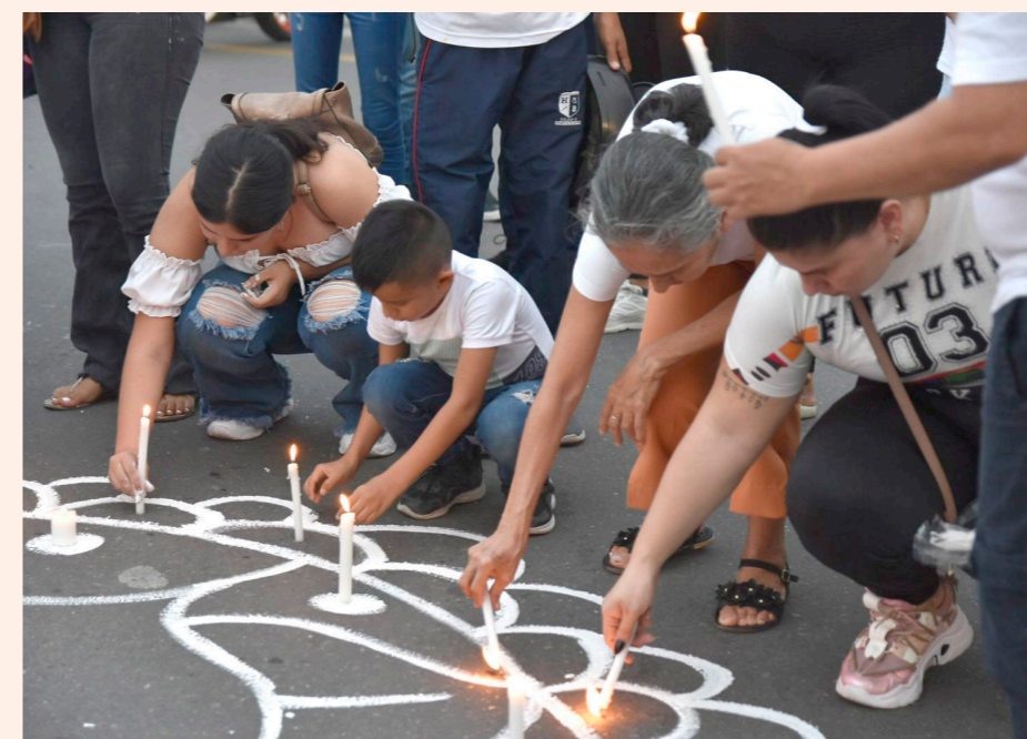
Comunidad en general también acompañó a la familia en el velatón.