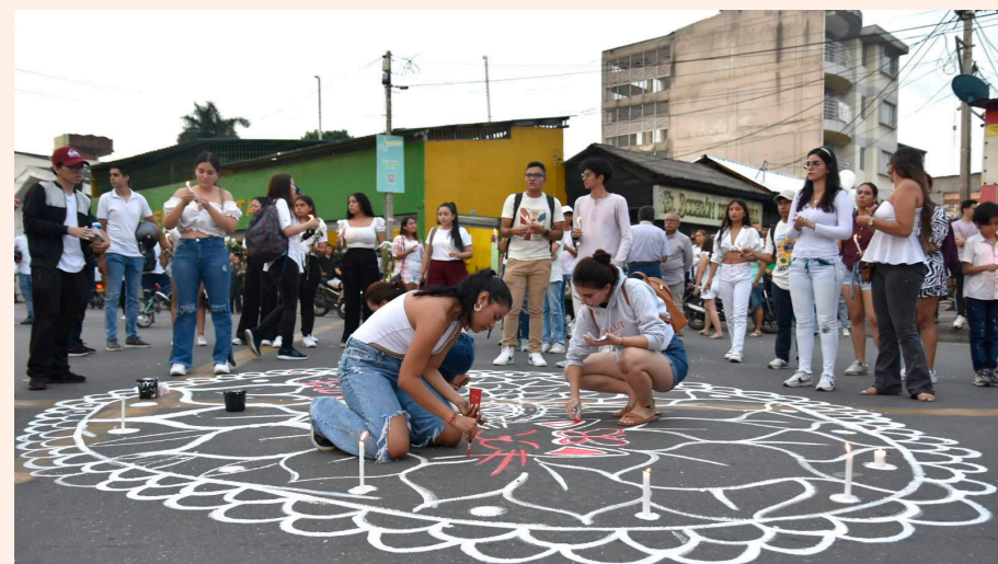
Durante el velatón, sus amigos pintaron una mandala, justo en el lugar donde se accidentó la joven.