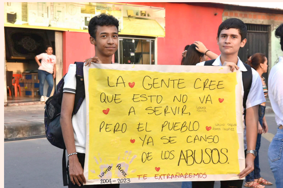
Muchos de los asistentes pidieron respeto por la vida.