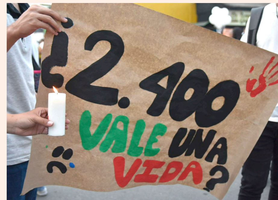
La familia de la joven pide que se haga justicia