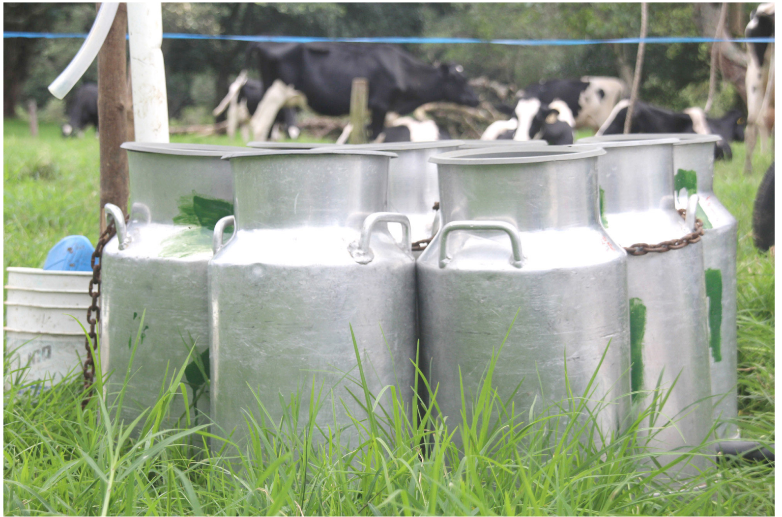
De acuerdo con Tecnigán, la idea es especializar a los productores en un producto de leche con un enfoque de producción de crías.

“Es decir, que todo lo que produzcamos, en este caso carne y terneros, que es la especialidad en el Huila, podamos unirlos y tener esa comercialización con un mejor precio y un mejor encadenamiento productivo; que conlleve más adelante a una formalidad en la producción. Buscamos que nuestros productores reciban un pago justo, se garantice su comer-