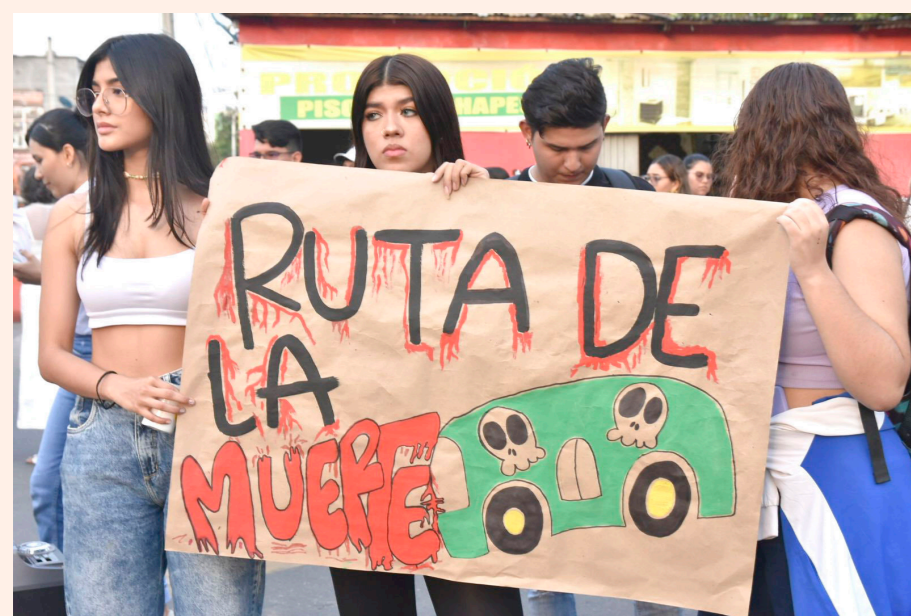
Con pancartas y mensajes de rechazo por estos hechos, los amigos de la joven protestaron.