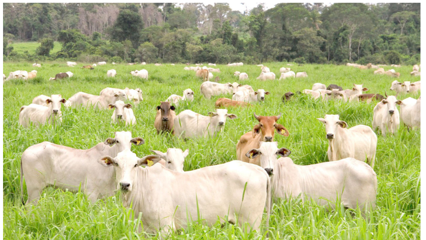
En 25 municipios del Huila, se ejecutará el proyecto de extensión agropecuaria para ganadería.

“Se espera que esta iniciativa fortalezca el sector ganadero del Huila y genere un mayor bienestar para los productores, así como una mayor rentabilidad para las familias y la región en su conjunto”.