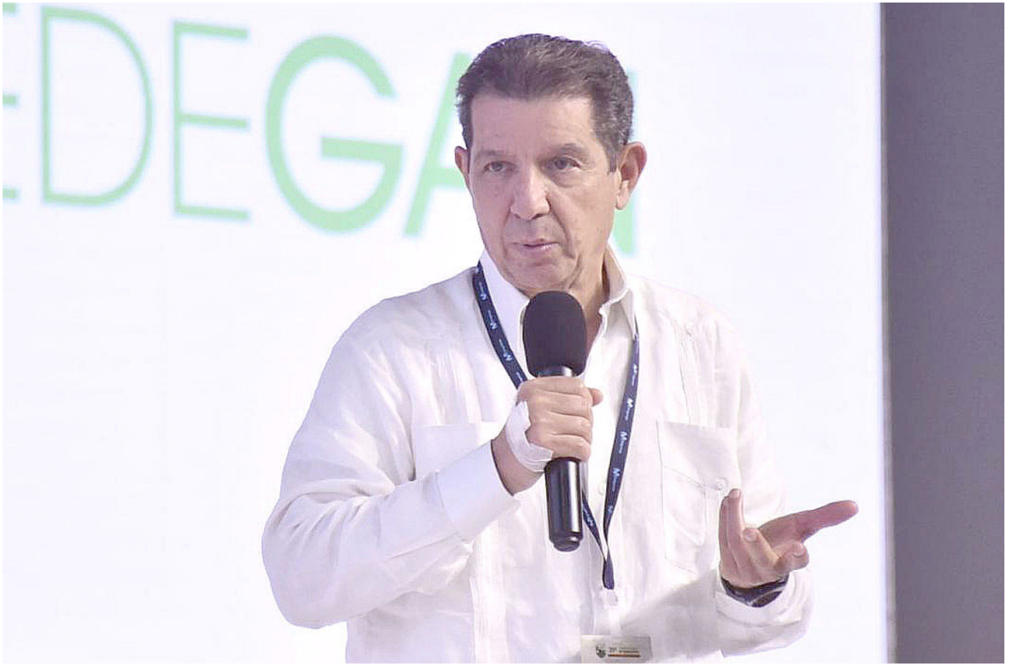
José Félix Lafaurie, presidente de la Federación Colombiana de Ganaderos, Fedegán.