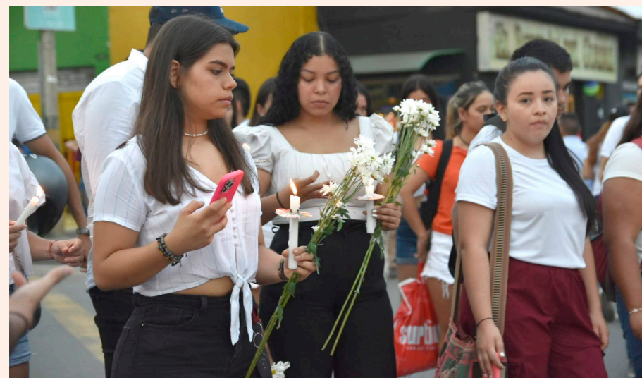
El velatón se realizó en el centro de la ciudad.