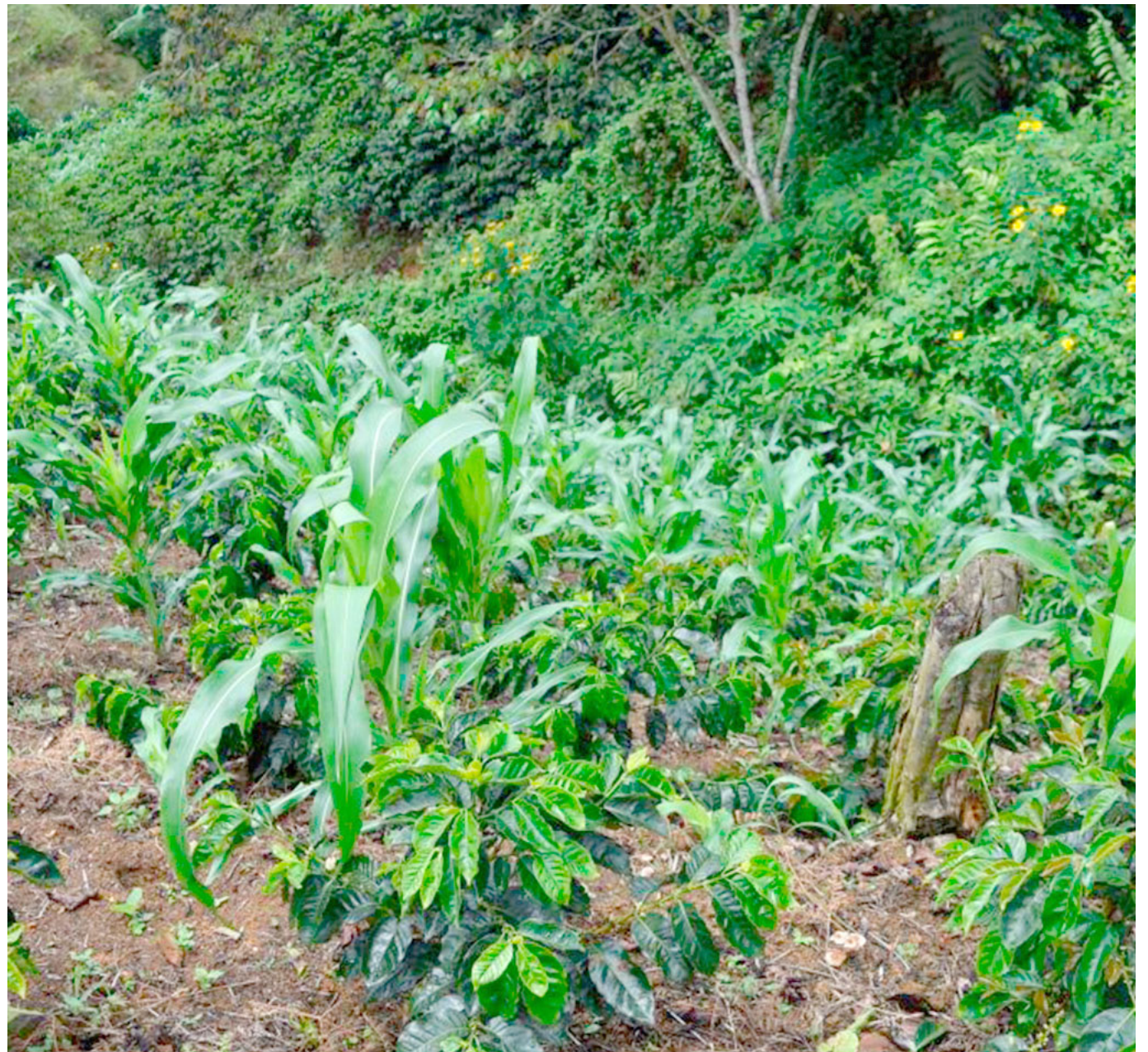
El maíz y el frijol son los principales cultivos alternos para sembrar junto con el café.

“Tenemos un serio problema de pobreza de la población campesina caficultora, para afrontar este problema debemos aprovechar que estamos en una coyuntura única en el país, que es un gobierno que hace una oferta social muy ambiciosa”