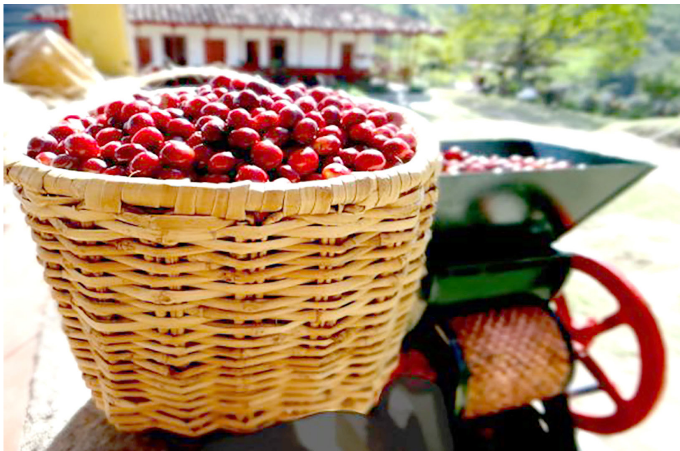
La candidata señaló que en el Huila, se seguirán fortaleciendo los sistemas de calidad en el café.

Tenemos que establecer una norma en los estatutos de cuota que puede oscilar entre el 30 y el 50% de las mujeres en los organismos de representación municipal, Comité Departamental y Comité Nacional. Claramente se requiere una colaboración de todos los demás miembros de la familia, especialmente de la familia cafetera, donde desde los hombres se garantiza la participación de la mujer en la representación y que él pueda asumir unos roles que ordinariamente hace la mujer.