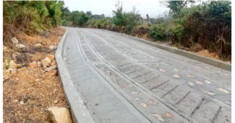
Placas huellas como estas son las que requiere la comunidad en Timaná.