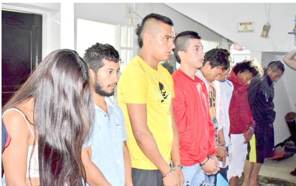
Los capturados, ya fueron judicializados por las autoridades.

Luego de su presentación ante las autoridades competentes en donde los mismos implicados se vieron sorprendidos por las evidencias recolectadas que presentó el ente acusador ante el juez, se les determinó medida de aseguramiento en centro carcelario y en el centro de internamiento FEI de la ciudad de Neiva.