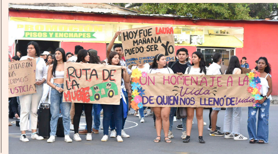
Por cerca de una hora estuvo paralizado el tránsito en la zona.