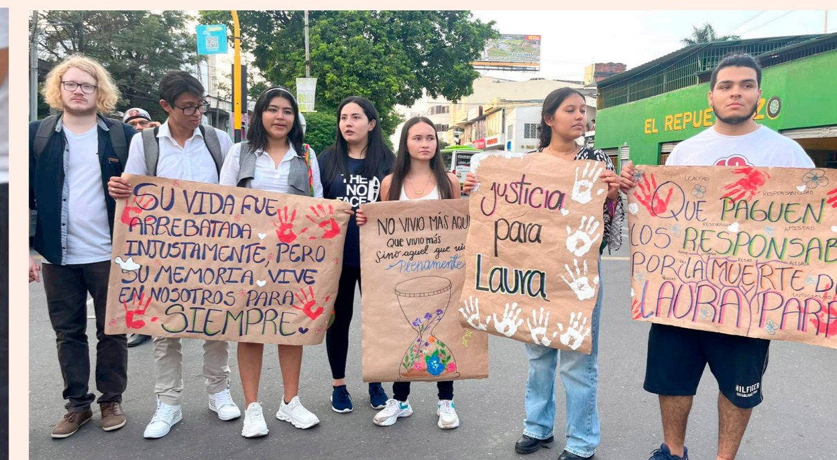
Varios jóvenes estuvieron presentes en esta velatón.