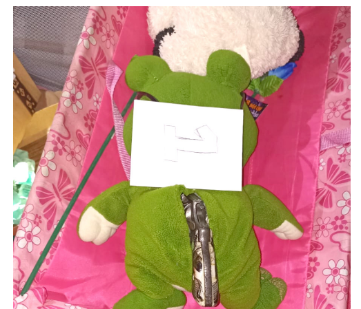
Varias armas de fuego, fueron halladas escondidas dentro de peluches.

En el operativo participó la Fiscalía General de la