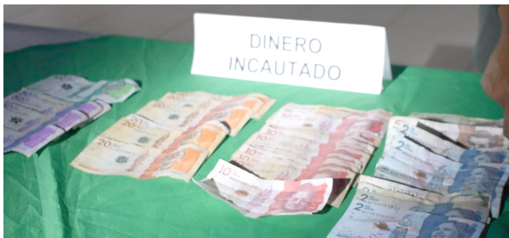
Durante los allanamientos fue incautado dinero en efectivo.

Luego de 18 meses de investigación, en los que los uniformados lograron recolectar evidencias y denuncias de la comunidad por las afectaciones que venía causando una estructura criminal denominada 'Los Jordán' en el municipio de La Plata. "llegaban consumidores de todas las edades, desde la mañana hasta altas horas de la noche para adquirir los estupefacientes y planear otras acciones delictivas, fue desarticulada esta estructura criminal conformada por al menos 15 personas, las cuales, comercializaban más de 500 dosis diarias en el municipio de La Plata y que con sus tentáculos afectaban municipios aledaños como Nátaga, Paicol, Tesalia y La Argentina", indicó el Coronel Gustavo