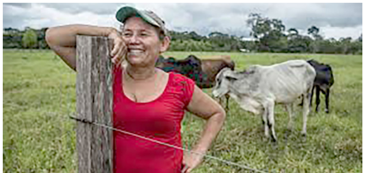
El proyecto atenderá a 6.298 productores de café, 2.427 ganaderos, 1.228 cacaoicultores, 915 cañicultores y 163 productores dedicados a actividades de ganadería ovino-caprina.

familias capriculoras y 135 familias productoras de ovinos. Para llevarlo a cabo, se contratará un equipo de 18 profesionales que