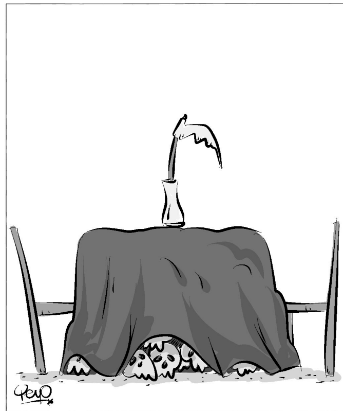
LA MESA CON EL ELN

tamos llegando a la necesidad de reubicar la Fiscalía General; nada justifica que permanezca en la Rama Judicial, si ya no toma decisiones judiciales. Lo mejor es que se adscriba al Gobierno Nacional, responda ante la opinión por los aciertos o desaciertos del Gobierno en las políticas públicas encaminadas a la persecución del delito y opine a nombre del Gobierno; sujeta además al control político del Congreso.