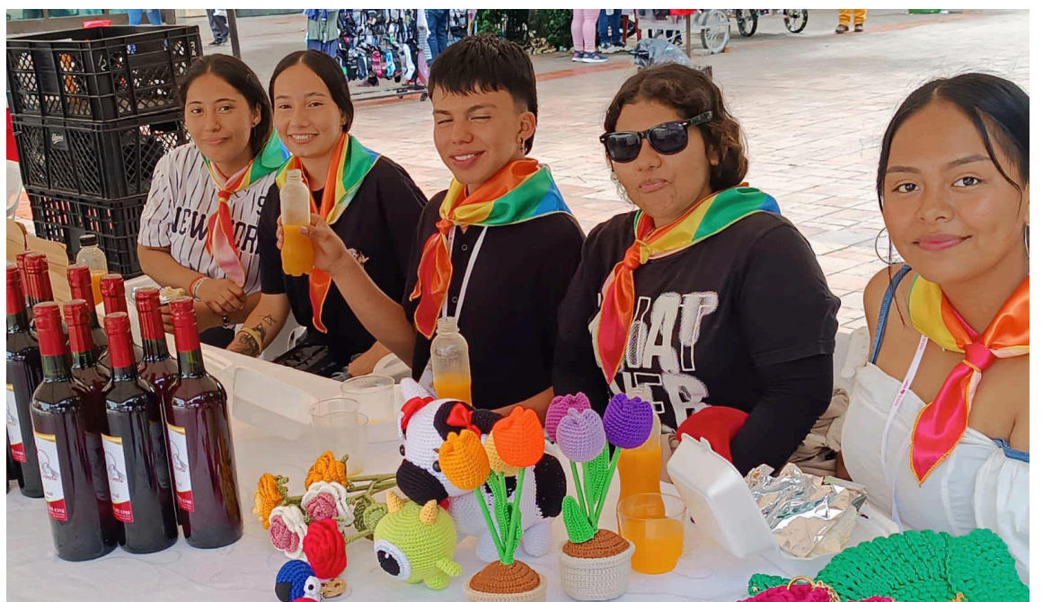
Se llevó a cabo en la Plaza de Banderas de la Gobernación del Huila, la Feria Departamental LGBTQ+ Comercial, Artesanal y de Emprendimiento “Muestra Tu Orgullo de Colores” en el marco de la conmemoración del día del Orgullo LGBTQ+ con participación de diferentes municipios de nuestro Huila Grande.