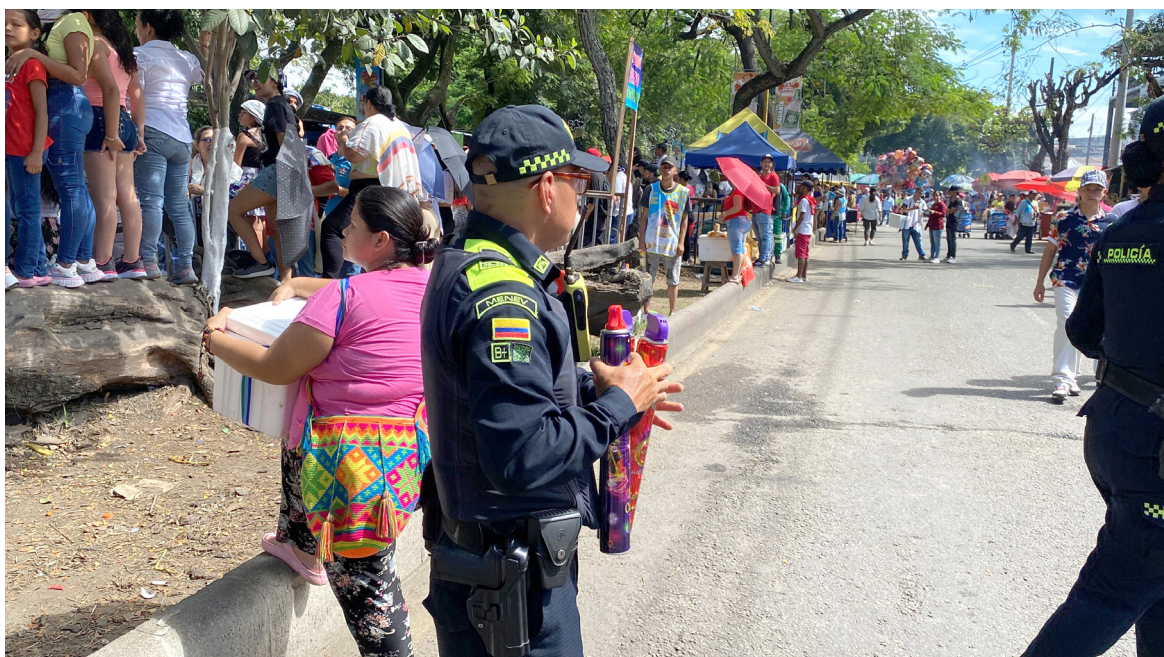
El uso desmedido de espuma durante los eventos es un ejemplo de cómo la cultura y las tradiciones pueden chocar con las regulaciones modernas.

Las Festividades Sampedrinas de este 2024 en el departamento de Huila, que se llevaron a cabo del 14 de junio al 01 de julio, fueron un periodo de intensa actividad turística, cultural y musical.