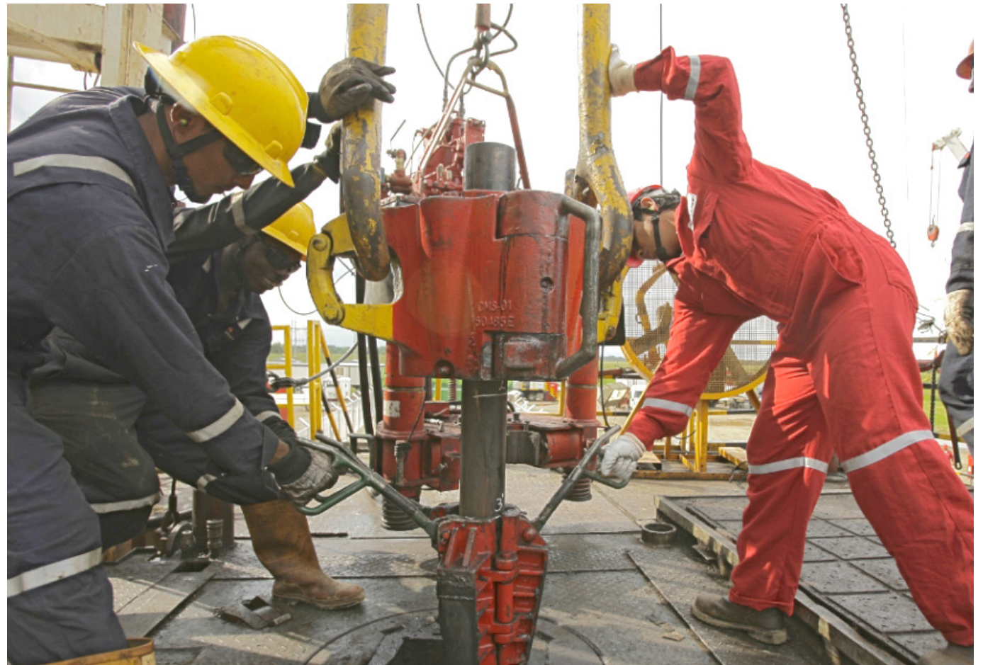
El Huila continúa siendo un pilar fundamental en el panorama petrolero colombiano,

Actualmente, Huila contribuye significativamente al panorama energético nacional. A pesar de una disminución del 46,1% en su producción en la última década, el departamento continúa siendo un actor integral en la industria petrolera colombiana.