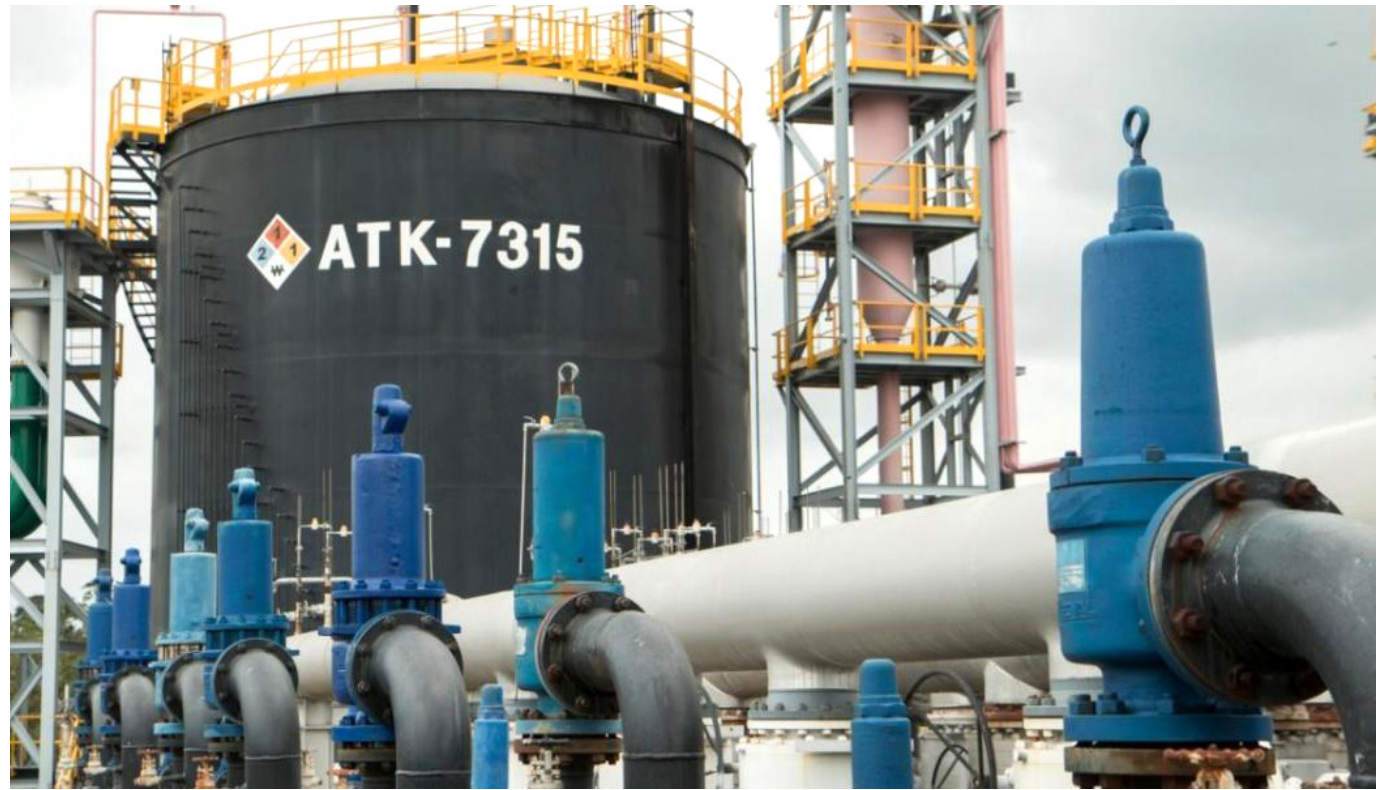
Como muchos otros departamentos, Huila ha experimentado una reducción en el número de taladros operativos

La producción petrolera no está exenta de impactos ambientales y sociales. Aunque se han implementado medidas para mitigar estos efectos, el departamento enfrenta el desafío de equilibrar el desarrollo económico con la preservación ambiental y el bienestar de las comunidades locales.