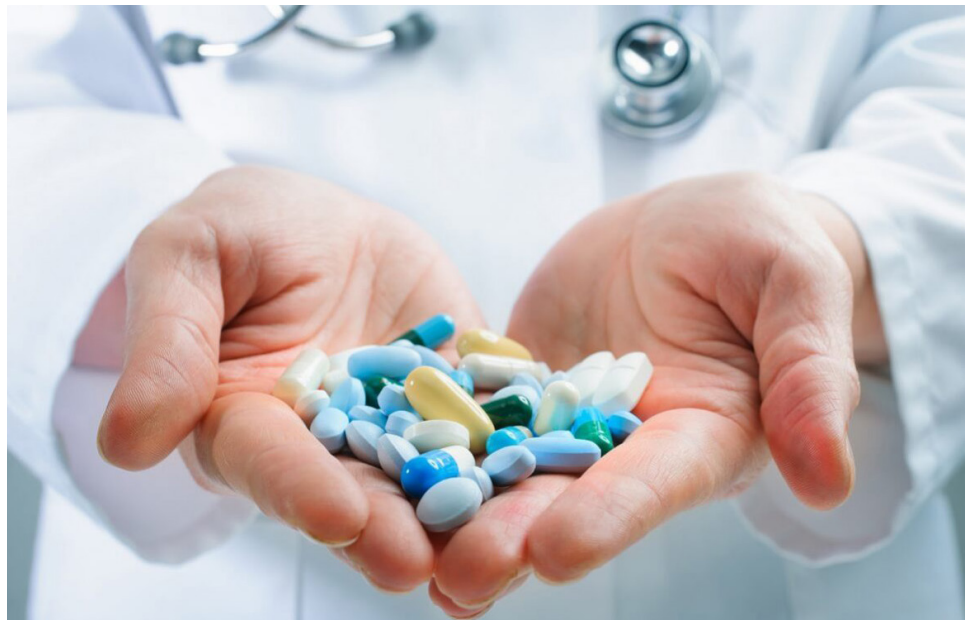
La adquisición de medicamentos únicamente a través de farmacias autorizadas y bajo la supervisión de profesionales de la salud es crucial para garantizar la seguridad y eficacia del tratamiento.

Varias compañías, como Novo Nordisk Colombia, se han unido a este llamado mediante campañas de concienciación. A través de su campaña “Tu salud no es un juego”, Novo Nordisk brinda información a los consumidores