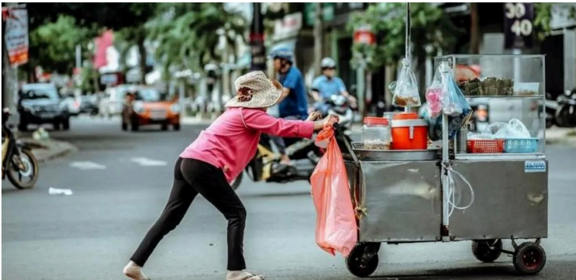
La informalidad laboral, que se ubicó en 56,3% en abril de 2024, está entre los principales causantes de la pobreza en Colombia.

de $160.302, y para un hogar de cuatro personas fue de $351.480, y para un hogar de cuatro personas fue de $1.405.920, estos se definen así: - Población pobre: Representa