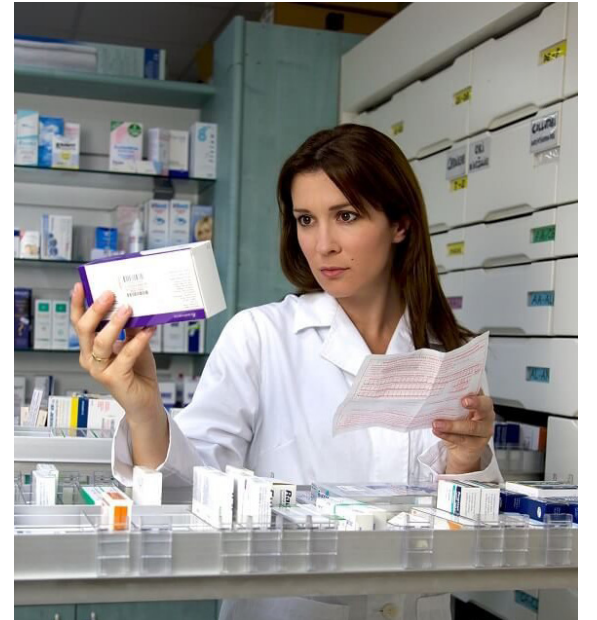
Medicamentos falsificados incautados por las autoridades en Colombia.

“El objetivo de esta campaña es promover una mayor conciencia colectiva sobre esta realidad. El uso de medicamentos sin la prescripción previa de un experto y los riesgos asociados con los medicamentos falsificados atentan contra la salud, seguridad y, en ocasiones, la vida de las personas. La eficacia de los fármacos depende en gran medida de que un especialista de la salud haga la formulación correcta de acuerdo con el perfil del paciente para el que está indicado el medicamento”, afirma