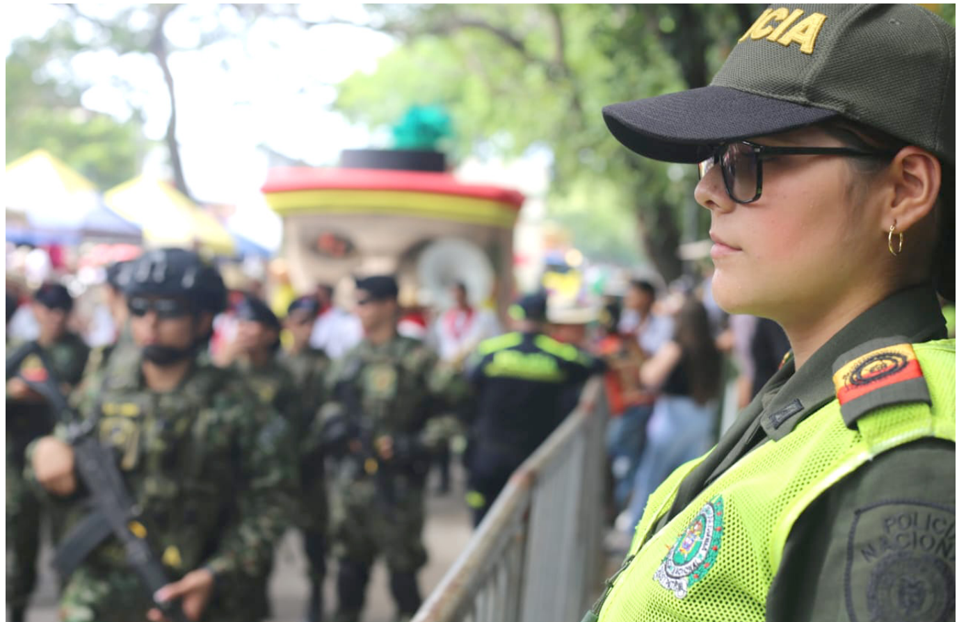
La disminución del 18% en lesiones personales y del 60% en hurtos a personas

El balance operativo incluyó la realización de más de 1.759 operativos en 37 municipios, resultando en 148 capturas (29 por orden judicial), la incautación de ocho armas de fuego sin permiso y la recuperación de 27 vehículos. Estos logros son presentados como resultado de una planificación estratégica y operatividad eficiente de las unidades policiales.