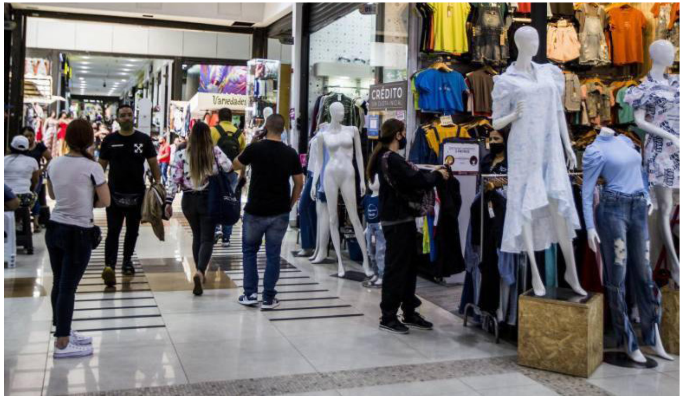
De acuerdo con una encuesta realizada a las marcas participantes, hubo un significativo incremento.

Un crecimiento en las ventas del más de 20%, con respecto al mismo puente de San Pedro del año pasado, fue el balance de la primera Primatón, que se cumplió del 28 al 30 de junio, en más de 19.000 puntos de venta a lo largo y ancho del país, confirmó Fenalco.