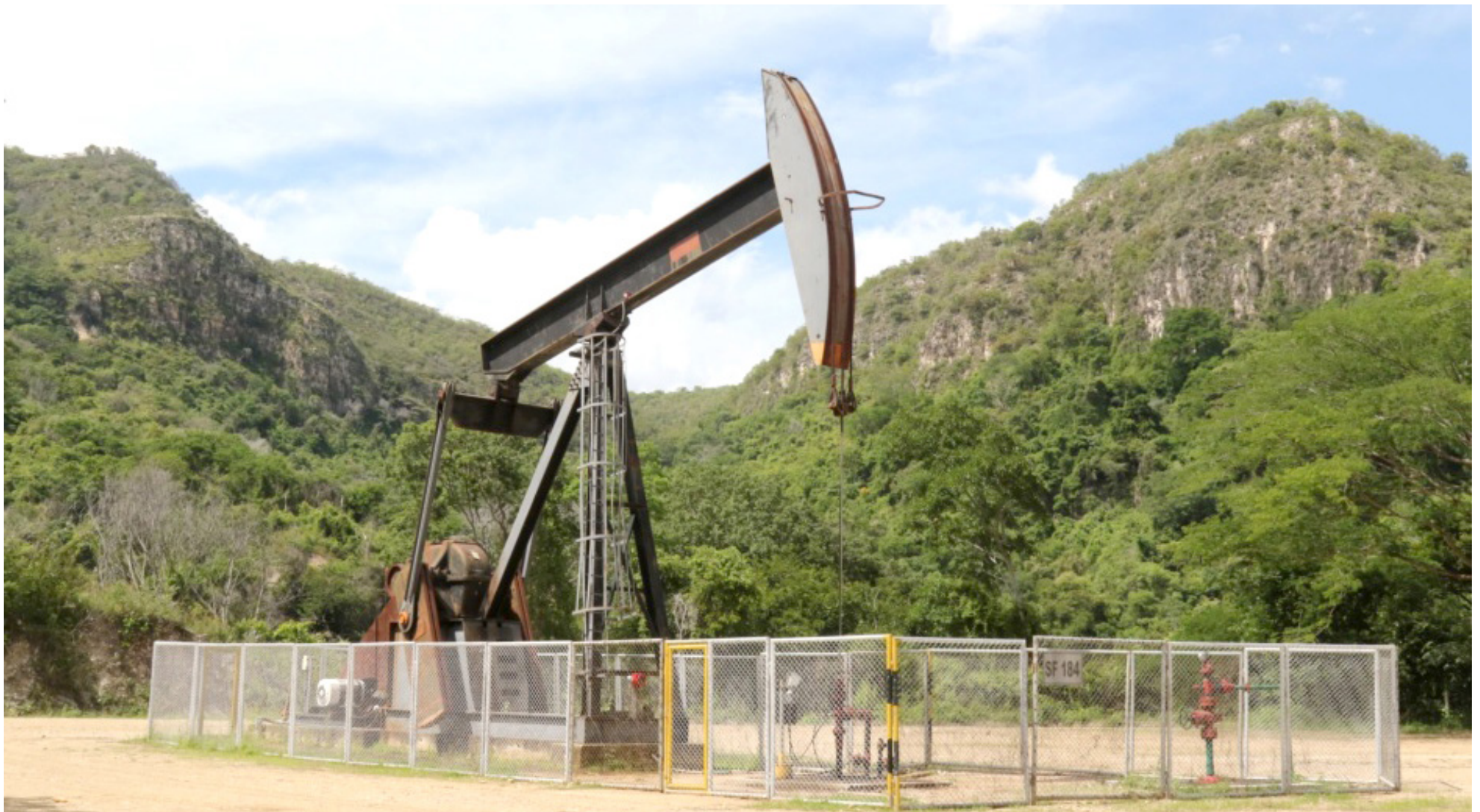
La situación actual plantea interrogantes sobre la viabilidad económica en materia de explotación

A pesar de los desafíos, el Huila presenta un potencial considerable para incrementar su producción de petróleo. La implementación de tecnologías avanzadas de recuperación y la atracción de inversiones estratégicas podrían ser clave para revitalizar la industria petrolera en la región.