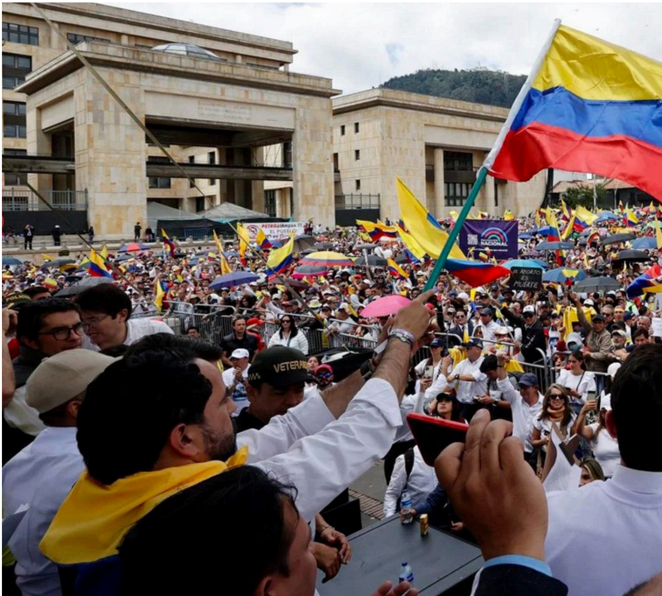
El derecho a la huelga y protestas quedaron por fuera de la Reforma Laboral.