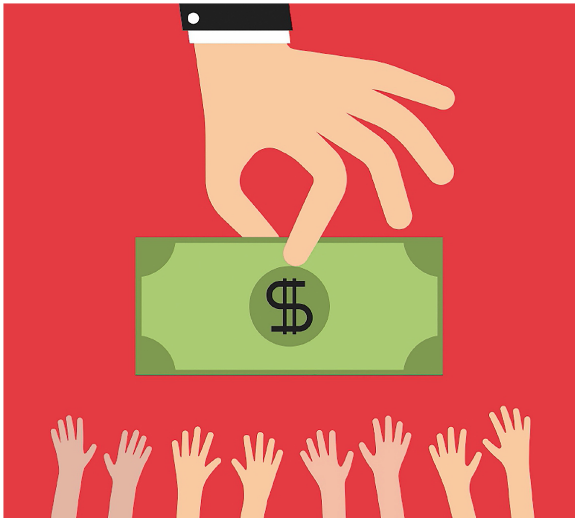
La clase media en Colombia abarca al 29,9% de la población, según el Dane.

El Dane reveló que, en 2022, el 36,6% de la población colombiana se encontraba en condición de pobreza monetaria, una disminución de 3,1 puntos porcentuales en comparación con el 2021. A pesar de esta reducción, la pobreza sigue afectando significativamente a más de un tercio de los colombianos.