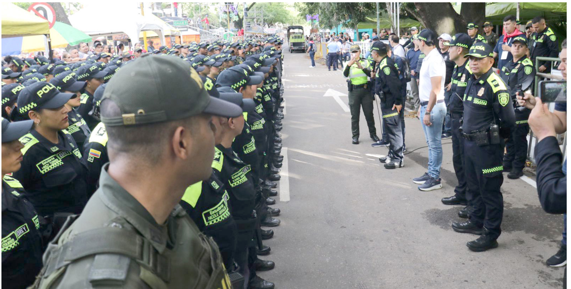
Más de 1.600 policías cubrieron 280 actividades durante las festividades

■ Al finalizar la edición 63 del festival del bambuco, se presentaron una serie de balances que destacan una notable reducción en varios tipos de delitos. Este año, las autoridades han calificado el periodo como uno de los más seguros de los últimos tiempos. Sin embargo, es necesario ponerle la lupa a estas cifras y las implicaciones que conllevan.