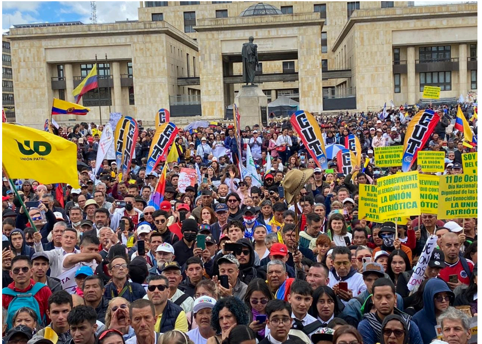
El próximo 18 y 19 de julio del año en curso, habrá marcha en Bogotá de respaldo al Gobierno Nacional.

aspecto es el recargo nocturno, que deberá sufragarse a partir de las 7:00 de la noche, pues nosotros queríamos que estuviera como estaban antes, que era a partir de las 6:00 P.M.”