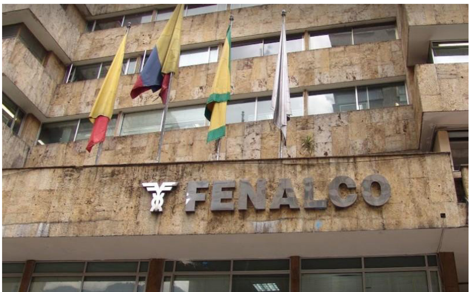
Una clase empresarial, distante a los cambios en beneficio de los trabajadores.

La Ministra anotó: “Colombia es cofundadora de la OIT desde 1946 y allí siempre ha estado el tripartismo, o sea que estos convenios han sido consultados y aprobados por parte de los empleadores, trabajadores y los gobiernos, así que hoy lo que debemos nosotros hacer, es que otros convenios se puedan ratificar y a la luz de eso, trabajaremos el derecho colectivo que tiene la reforma laboral”.