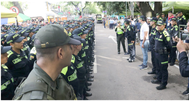
Así le fue al Huila en seguridad durante el San Pedro