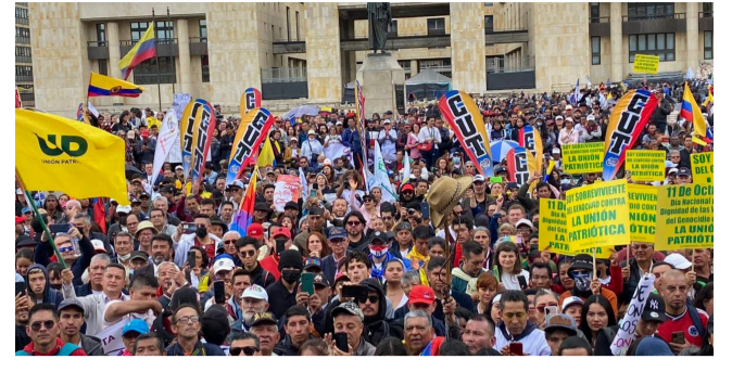
La CUT en el Huila habla de la Reforma Laboral