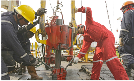
Huila entre los 10 departamentos que más producen petróleo