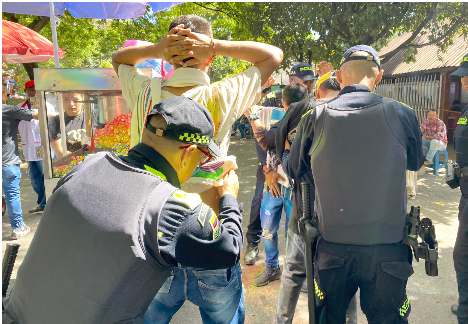
Eventos de tal magnitud presentan desafíos significativos en términos de seguridad y orden público.

En suma, lo que está en juego es mucho más que estadísticas y cifras. Se trata de la seguridad, la paz y la convivencia armoniosa de todos los huilenses y sus visitantes. Que este balance en parte positivo de 2024 sea un punto de partida para un futuro donde la cultura, la seguridad y la convivencia sean los pilares sobre los cuales se edifiquen nuestras fiestas. La tarea está lejos de estar concluida, y el compromiso de todos es esencial para que Huila continúe siendo un ejemplo de seguridad y cultura en Colombia.