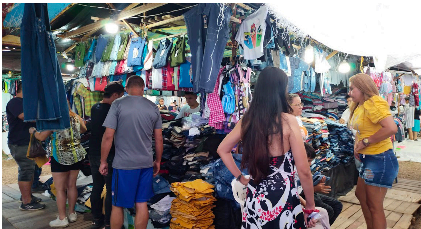
El reporte de los establecimientos que se vincularon y de los administradores de los centros comerciales afiliados al gremio.

positiva de los consumidores subrayan el potencial de crecimiento y consolidación de la Primatón como un evento clave en el calendario comercial.