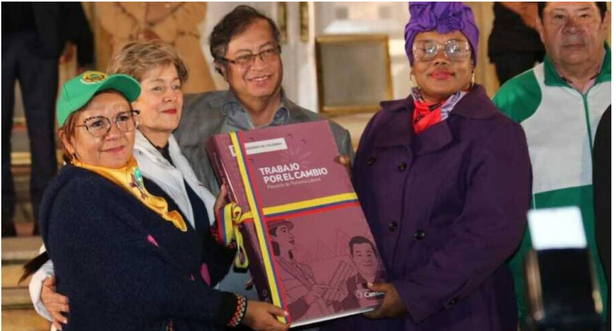
Uno de los puntos destacados de la reforma laboral del Gobierno Petro es que se entregará un bono de $223.800 a adultos mayores que no se pensionaron para ayudarlos a salir de la pobreza.

el 36,6% de los colombianos, quienes no logran cubrir una canasta básica de alimentos y otros gastos esenciales. Aunque hubo una ligera disminución en estos números en años recientes, el porcentaje sigue siendo significativo.