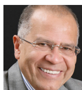
Alfonso Gómez Méndez