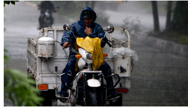
El Huila y 'La Niña'