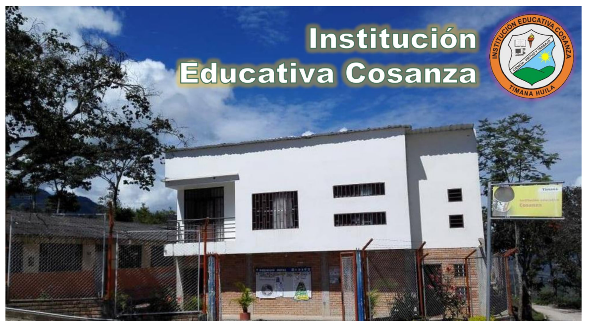
Para el caso de la Institución Educativa Cosanza, la responsabilidad recae en la rectoría del colegio, a quien se le otorgaron 5 días para adelantar gestiones y cubrir las 22 horas reconocidas y pagadas.

En Timaná, Huila, la lucha por el derecho a la educación se hace visible: niños de diversas veredas enfrentaron una crisis educativa, instaurando acciones legales para superar la falta de docentes y la vulneración de su derecho fundamental.