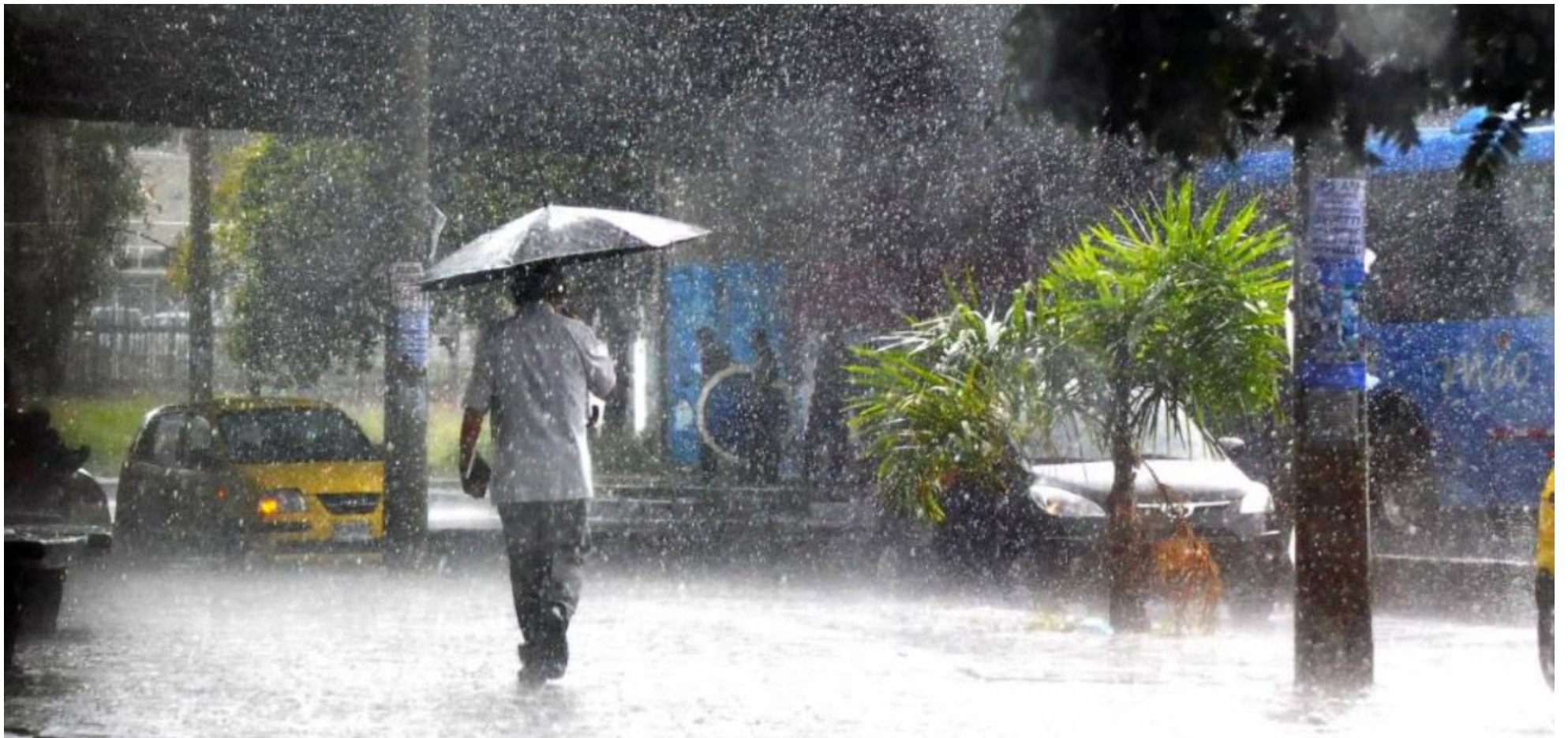
Marzo marca una transición entre la temporada de menor precipitación y la primera temporada lluviosa en la región Andina, según el Ideam

■ Se pronostica que el fenómeno de El Niño se debilite hacia una fase neutral, marcando la transición de marzo entre las estaciones de menor y mayor precipitación en la región Andina. A pesar de ello, el Ideam indica que el Huila experimentará escasas lluvias durante este periodo.