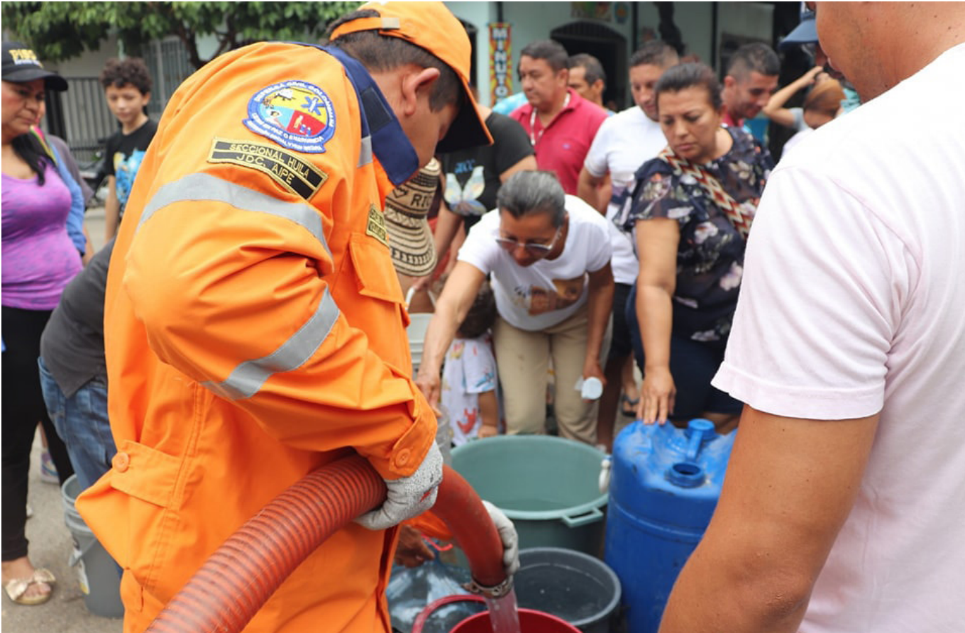
Más de 15 mil personas se vieron afectadas con esta situación.

taminado, terminan en el río Aipe, fuente de captación del acueducto de este municipio, que brinda el agua potable a más de 15 mil usuarios en el casco urbano.