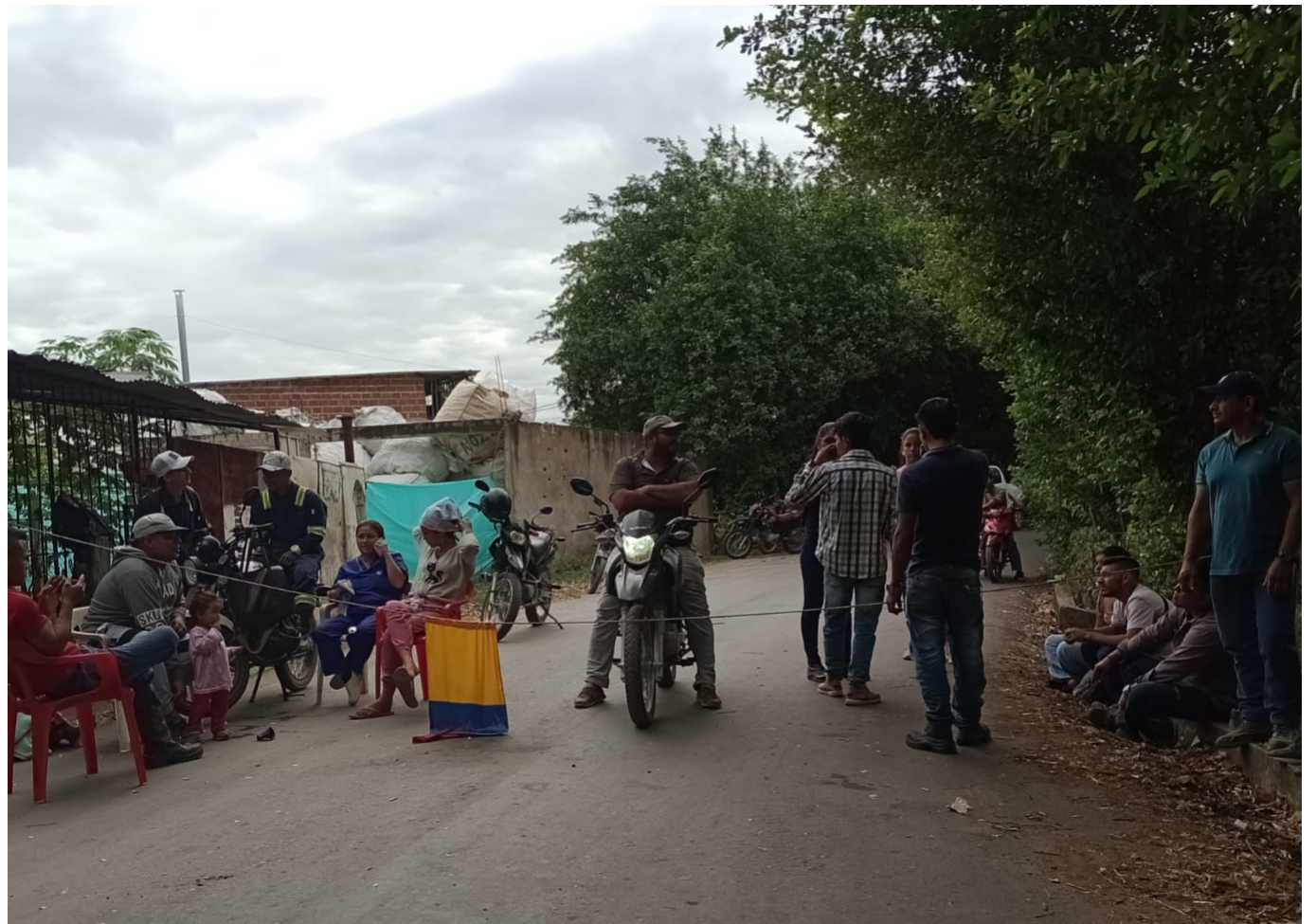
Ante protestas de 2023, las 'basuras', tuvieron que ser llevadas a Girardot.

dos, se montan en la caja y tienen en su poder armas de fuego, hechizas. La idea es invadir el territorio al otro y eso es un triunfo para ellos, pero ponen a nuestras tripulaciones de 'carne de cañón', porque ante la reacción del otro grupo, puede haber un enfrentamiento armado y nosotros estamos ahí como 'escudos'", agregó el directivo.