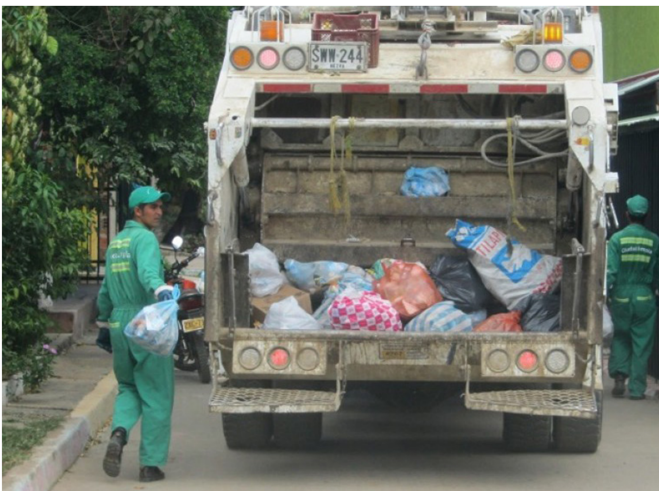
Neiva produce diariamente, 350 toneladas de residuos sólidos.

"Otro tema a trabajar es la indisciplina de la gente. Nosotros entregamos el microcentro de la ciudad limpio a las 6:00 A.M. y ya hacía las 9:00 A.M. está sucio. A mí me han llamado y yo les he contestado, que ya no es mi responsabilidad", señaló, el directivo.