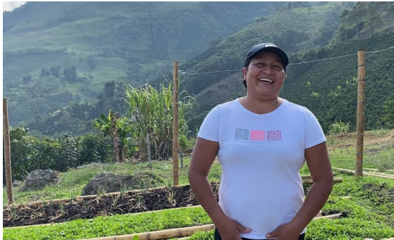
Huertas caseras: economía en crecimiento