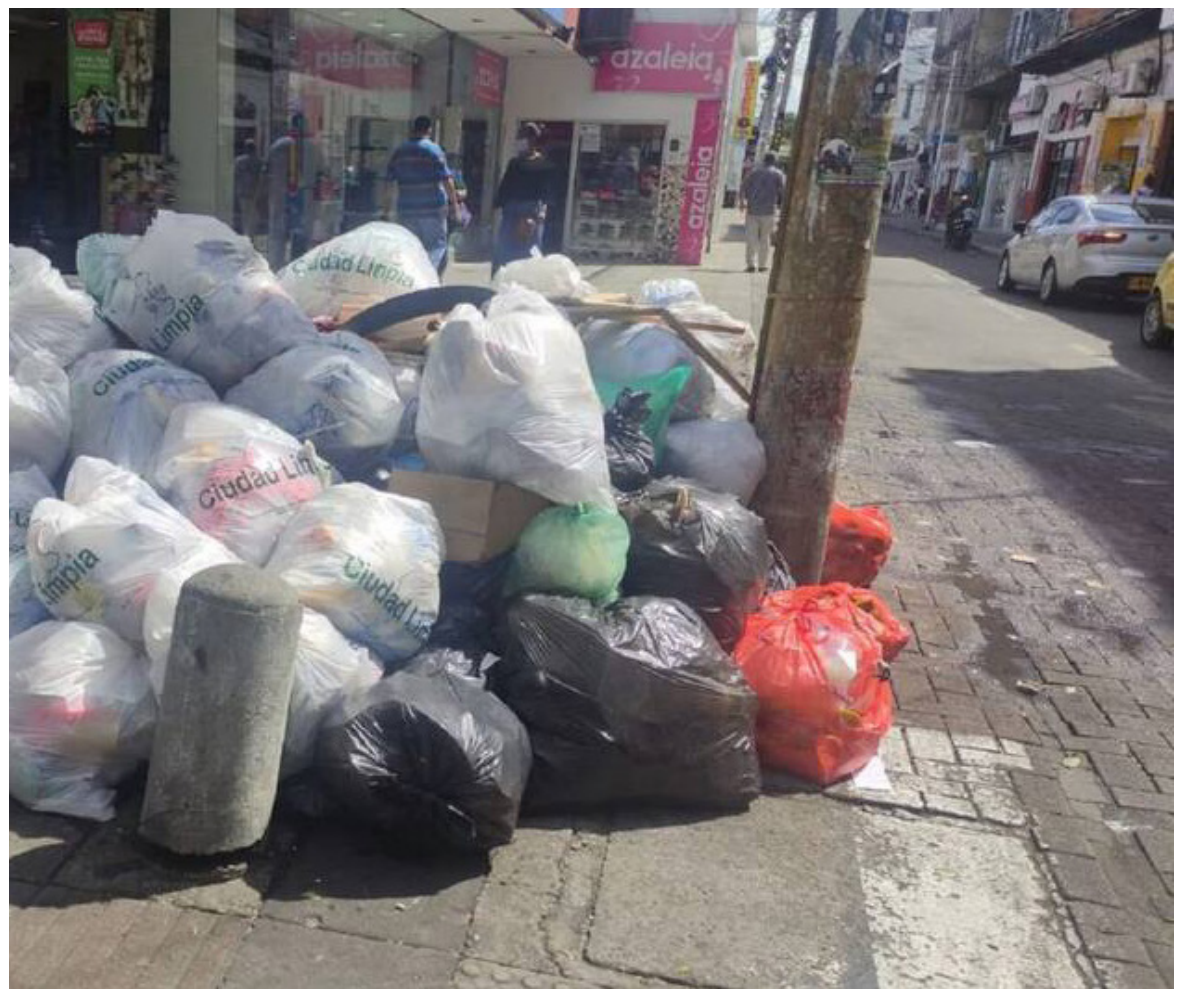
¿Habrá que imponer comparendos ante indisciplina ciudadana?

“Tendría que existir una coordinación con los grupos de recicladores, y decirle cuando ustedes pasen a recoger el material en la calle, solamente llévense la bolsa blanca, cuando Ciudad Limpia, pasa transporta la bolsa negra y cuando pase la empresa especializada en el manejo de los residuos orgánicos, toma la verde. Se hizo