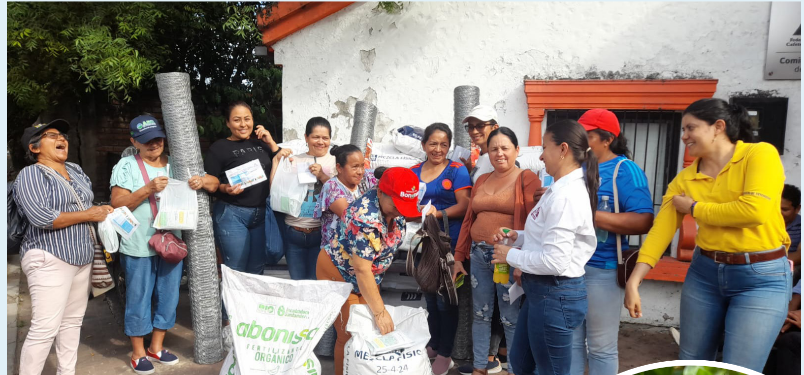
De manera constante y juiciosa, estas mujeres han logrado sacar adelante este proyecto, en alternancia con cultivos de frijol y café.

taria de las comunidades rurales, sino que también está fortaleciendo la economía local al abrir nuevas oportunidades comerciales para las mujeres cafeteras comprometidas con la tierra y el desarrollo sostenible.