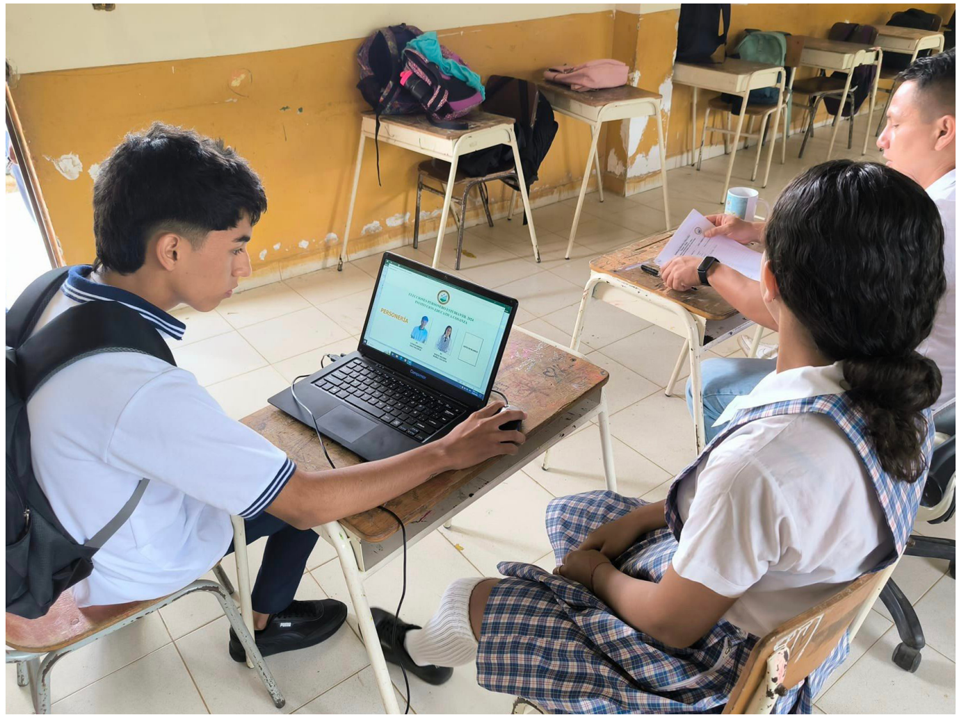
La Secretaría de Educación del Huila autorizó horas extras para normalizar la prestación del servicio educativo en Timaná, tras acciones de tutela por falta de docentes en varias sedes.

El juzgado de Timaná dictaminó medidas específicas para garantizar el derecho a la educación en la Institución Educativa Cosanza, tras una crisis educativa que afectó a zonas rurales.