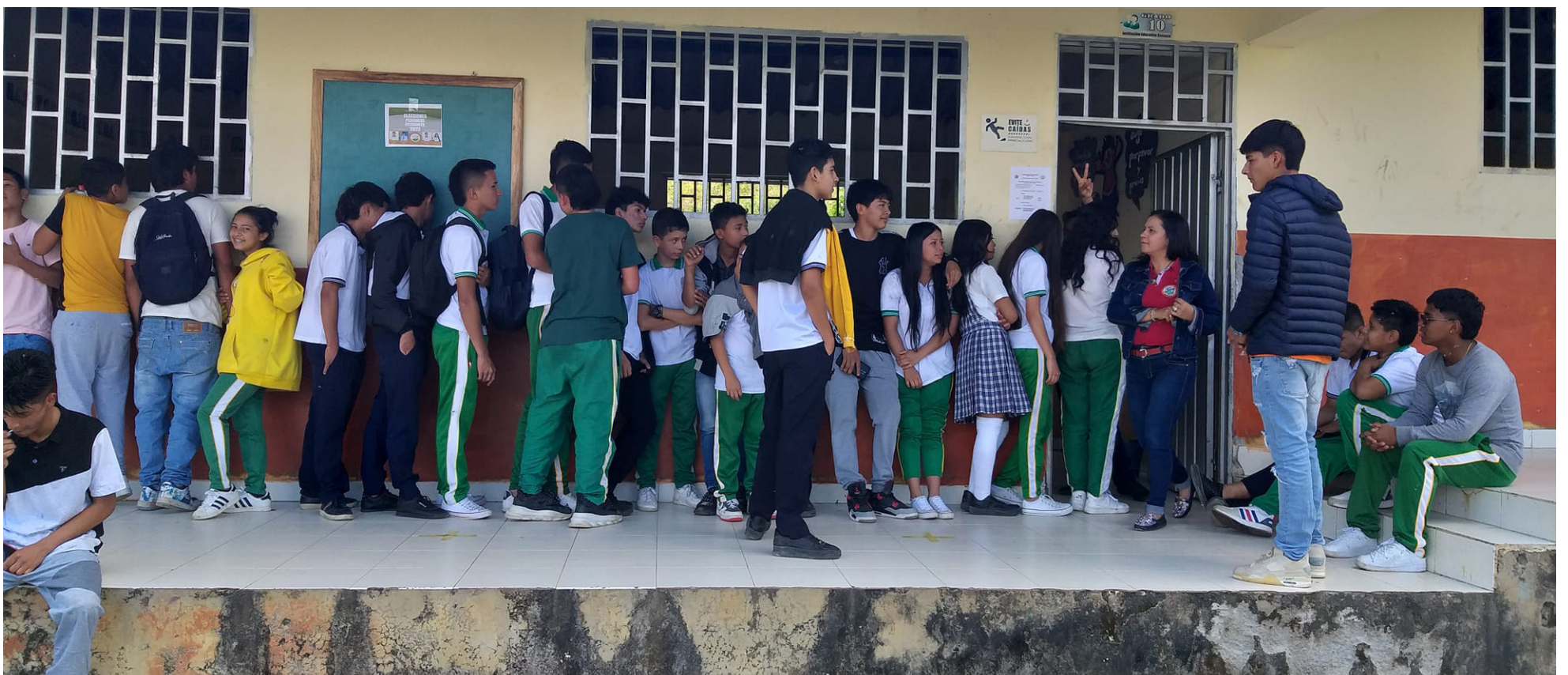
El juzgado de Timaná concluyó que, efectivamente, la Secretaría había nombrado docentes, considerando superada la situación en estas sedes.

En este contexto, la Secretaría de Educación Departamental autorizó las horas extras para la Institución Educativa Cosanza de Timaná, Huila, bajo la responsabilidad de la señora rectora. El propósito de esta autorización fue normalizar la prestación del servicio educativo. Para lograrlo, se instó a la rectora a hacer uso de la disponibilidad presupuestal con los docentes en propiedad que están bajo su responsabilidad en la institución educativa y en las sedes que ella dirige en calidad de líder y docente directiva.