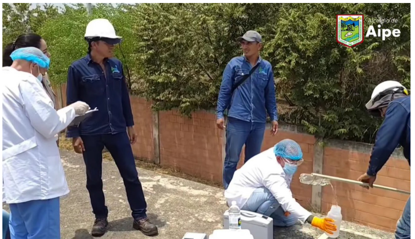
La Secretaría de Salud Departamental realizó toma de muestras de los tanques del acueducto de Aipe.

Hasta que no se conozcan los resultados de las pruebas realizadas por la Secretaría de Salud Departamental y de un laboratorio especializado, no se podrá emplear el agua de los tanques del acueducto de Aipe.