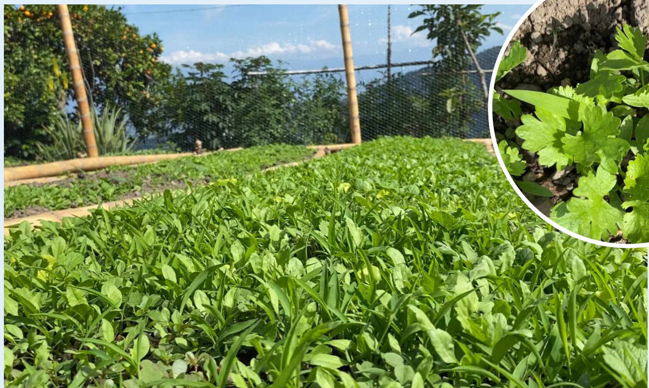
Legumbres, frutas, hortalizas, entre otros, son los productos que están siendo cosechados en las huertas y que implican seguridad alimentaria y ahorro en el bolsillo.

Cada pequeña planta es una declaración de independencia alimentaria y un recordatorio tangible del poder colectivo para transformar positivamente nuestro entorno. Y así, a medida que las huertas caseras florecen, así lo hace nuestra capacidad de cultivar un futuro más verde, consciente y resiliente para las generaciones venideras.