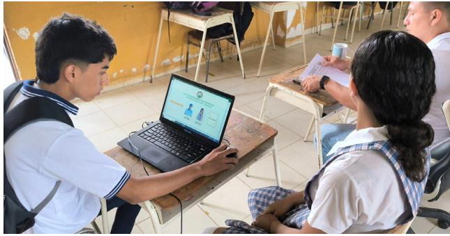
Los niños de Timaná defendieron su derecho a la educación