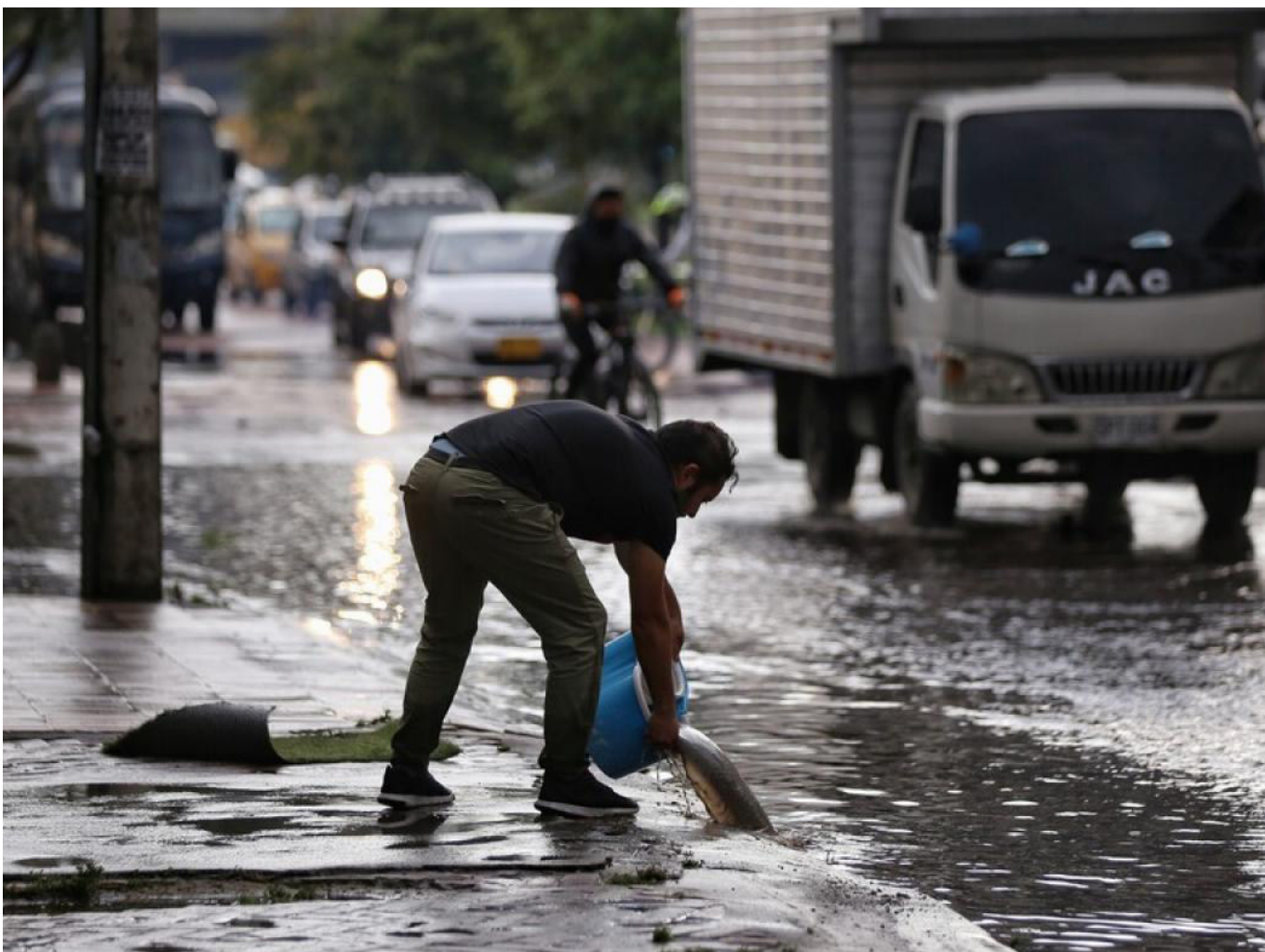
Colombia enfrenta una fase neutral en la transición de El Niño a La Niña. Instituciones nacionales preparan planes de contingencia ante la incertidumbre climática.

La combinación de estos elementos provoca que los vientos alisios, constantes y fuertes, desplacen con mayor intensidad las aguas cálidas del océano Pacífico hacia el oeste, provocando la emergencia de aguas frías desde las profundidades marinas y dando lugar a climas extremos en diversas partes del mundo.