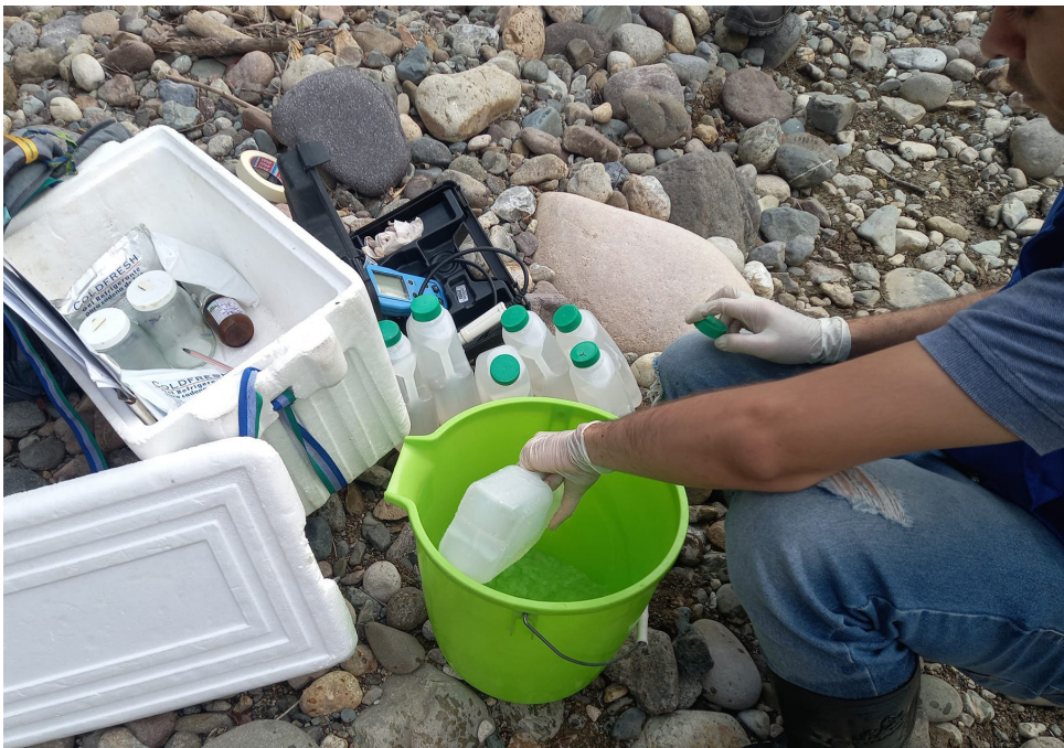
Un laboratorio especializado estará procesando las muestras tomadas directamente del río Aipe.

municipal en la medida de la información que se tiene de la posible contaminación de la fuente hídrica Chiquila, que es de la jurisdicción del municipio de Neiva, en la vereda Quebradón Bajo del Corregimiento de San Luis, está