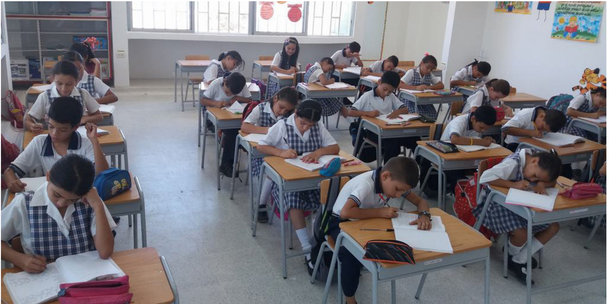
Niños en las sedes de Paquíes, Sicandé y La Cruz enfrentaron la suspensión de clases por la carencia de docentes de primaria, generando acciones de tutela para proteger su derecho a la educación.