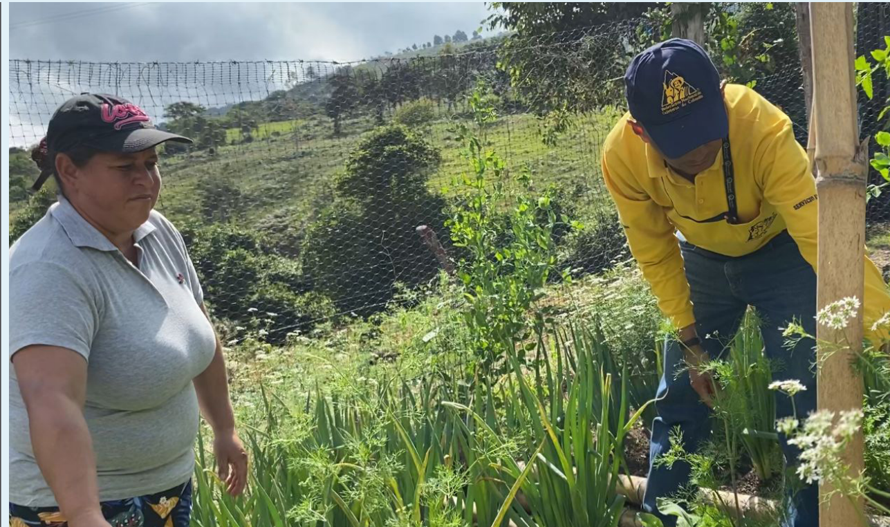
Con recursos del FoNC, estas mujeres hacen parte del proyecto piloto que involucra a 40 beneficiarias con insumos y semillas.

Estas mujeres han recibido las herramientas necesarias para cultivar sus propios alimentos, marcando un hito crucial en el camino hacia la autosuficiencia y la prosperidad para las familias campesinas.