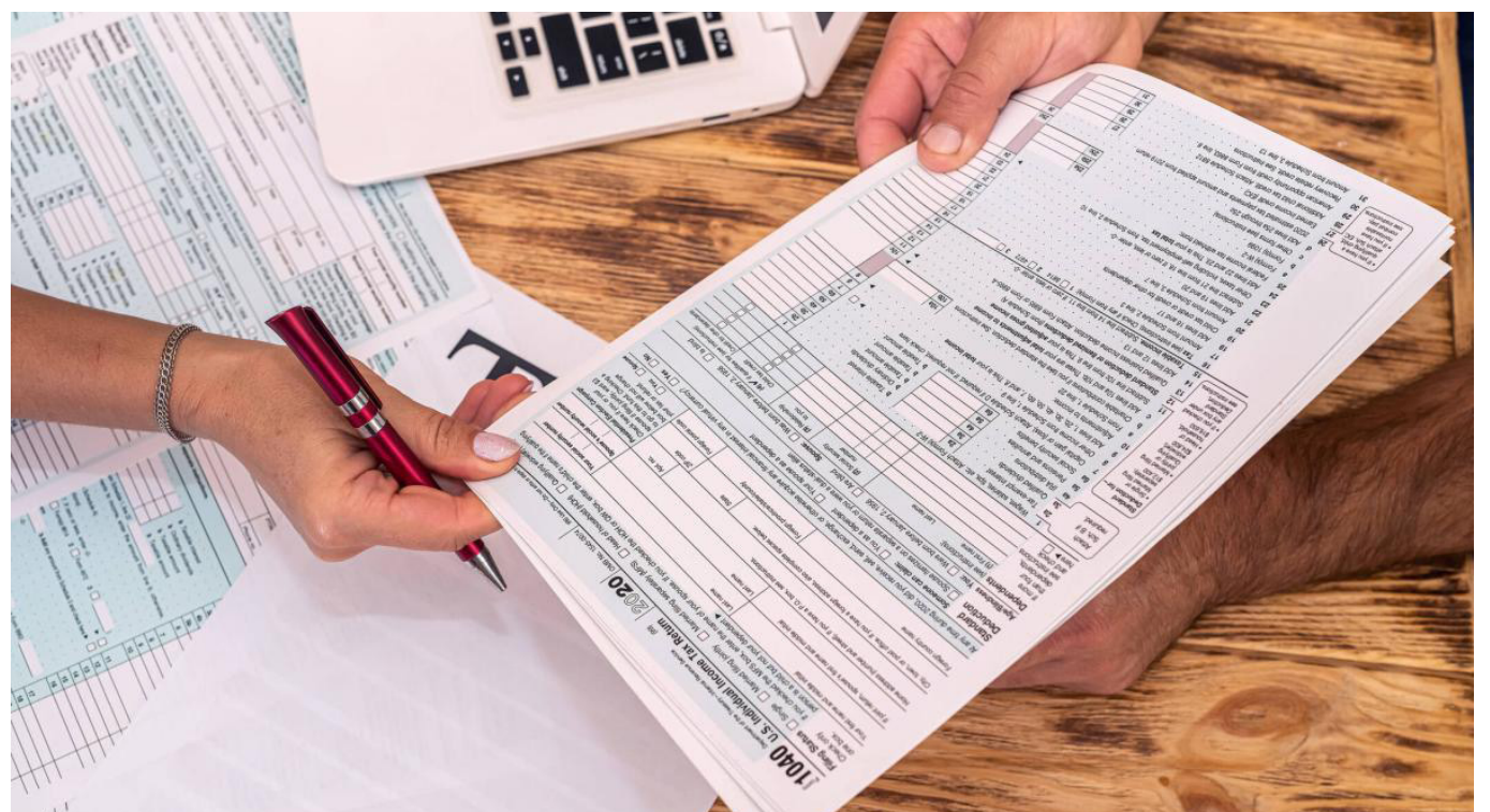
Las declaraciones del impuesto sobre la renta con beneficio de auditoría, quedarán en firme en 6 o 12 meses, según el incremento del impuesto neto de renta.

Las opiniones son responsabilidad de los socios de Araque Asociados Consultores Tributarios y Legales. Nos basamos en el entendimiento de las normas vigentes y en el conocimiento del derecho tributario, y puede no ser compartido por las autoridades tributarias. Consúltenos en www.araqueasociados.com Preguntas y sugerencias en el correo: contacto@araqueasociados.com . Atención personalizada: Carrera 5 No. 14-32 oficinas 5, 7 y 8 Pasaje de la Quinta de Neiva, Huila, teléfonos 321 452 3315.