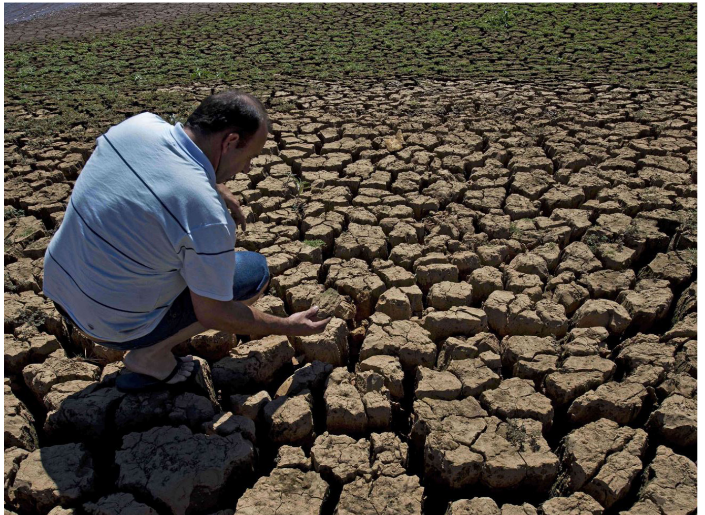
A pesar del inicio de la temporada de lluvias, el Huila experimentará escasas precipitaciones durante este periodo, según indicaciones del Ideam.

Según reportes preliminares, febrero podría establecer un récord como el mes más cálido registrado globalmente, atribuido al cambio climático y al fenómeno de El Niño.