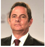
Germán Vargas Lleras

No era broma aquello del decrecimiento como nuevo paradigma de desarrollo económico y social.