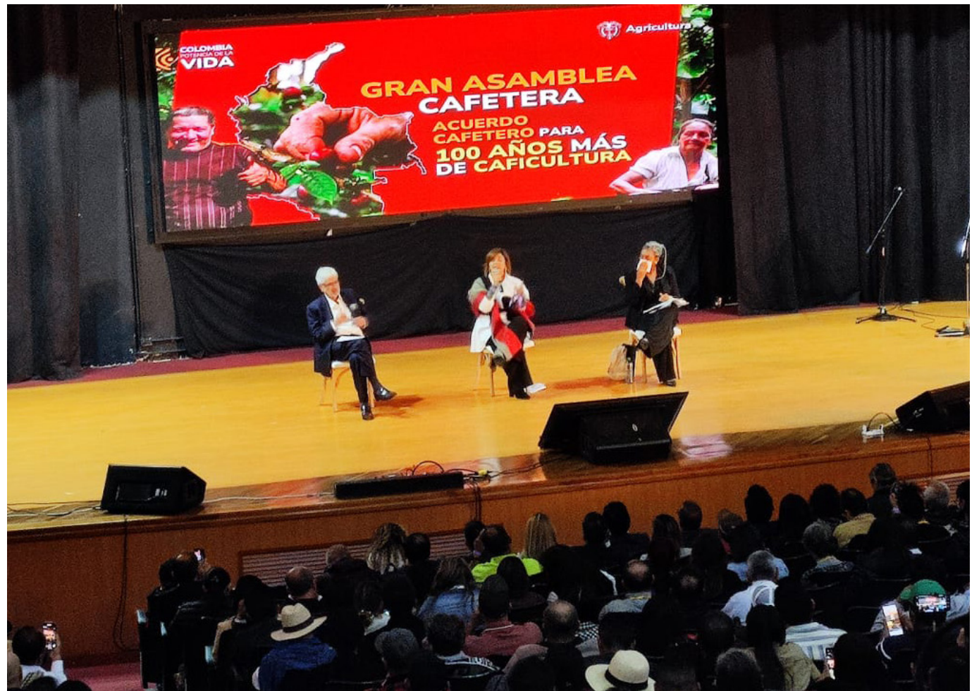
Cumbre Cafeteros. Presidente Gustavo Petro y la ministra de Agricultura, Jhenifer Mojica.

Luego de una larga espera, finalmente los pequeños productores de café pudieron escuchar al presidente Gustavo Petro, quien no ahorró palabras para criticar el manejo que hasta ahora ha tenido el sector.