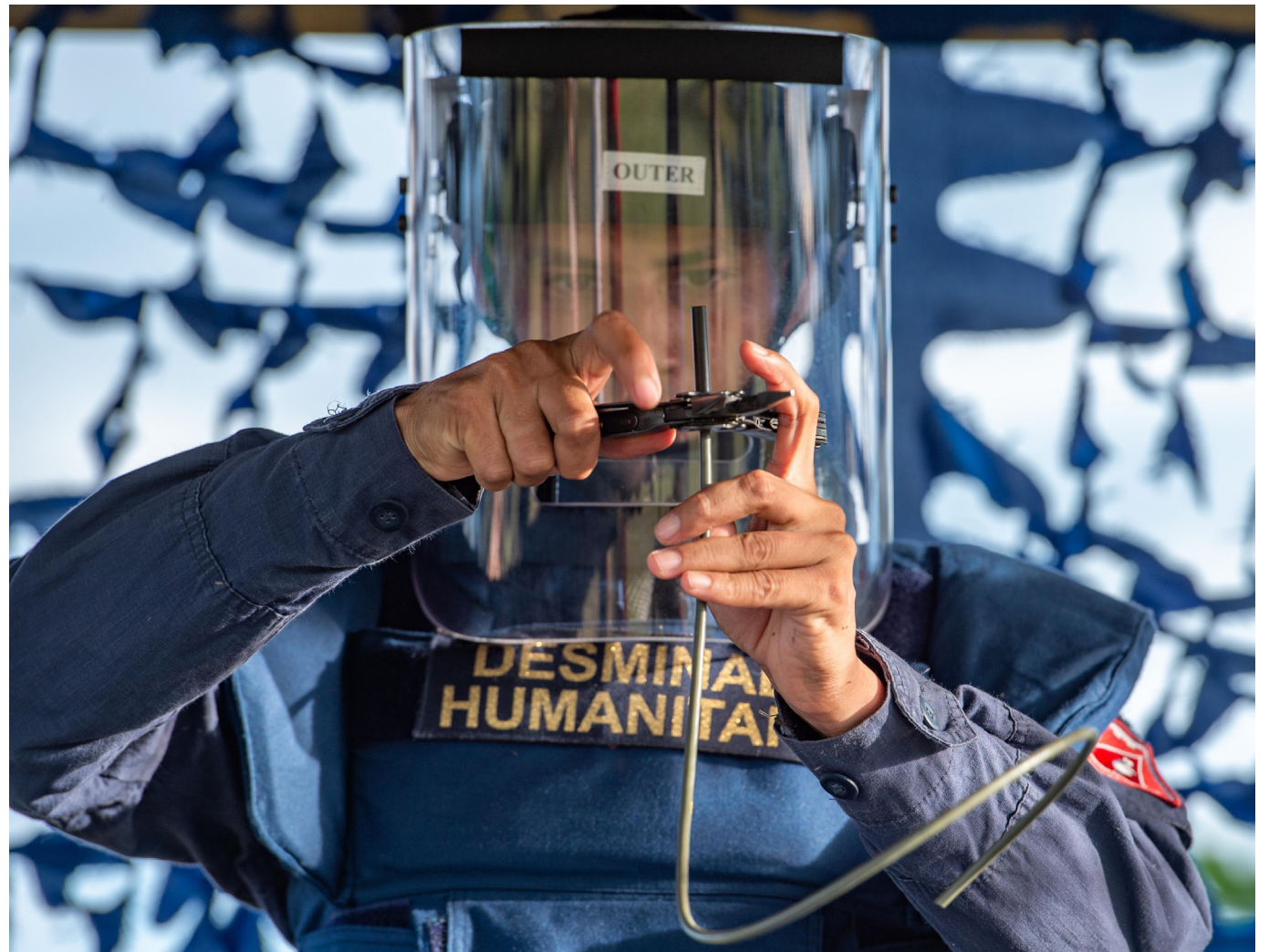
Los grupos armados organizados residuales intentan contaminar nuevamente los suelos huilenses con minas antipersonal, lo que requiere una respuesta coordinada de las autoridades y la población civil.

La Brigada de Ingenieros de Desminado Humanitario libera diariamente más de 2.600 metros cuadrados de artefactos explosivos en Colombia, reflejando el compromiso del gobierno con la seguridad y los Derechos Humanos.