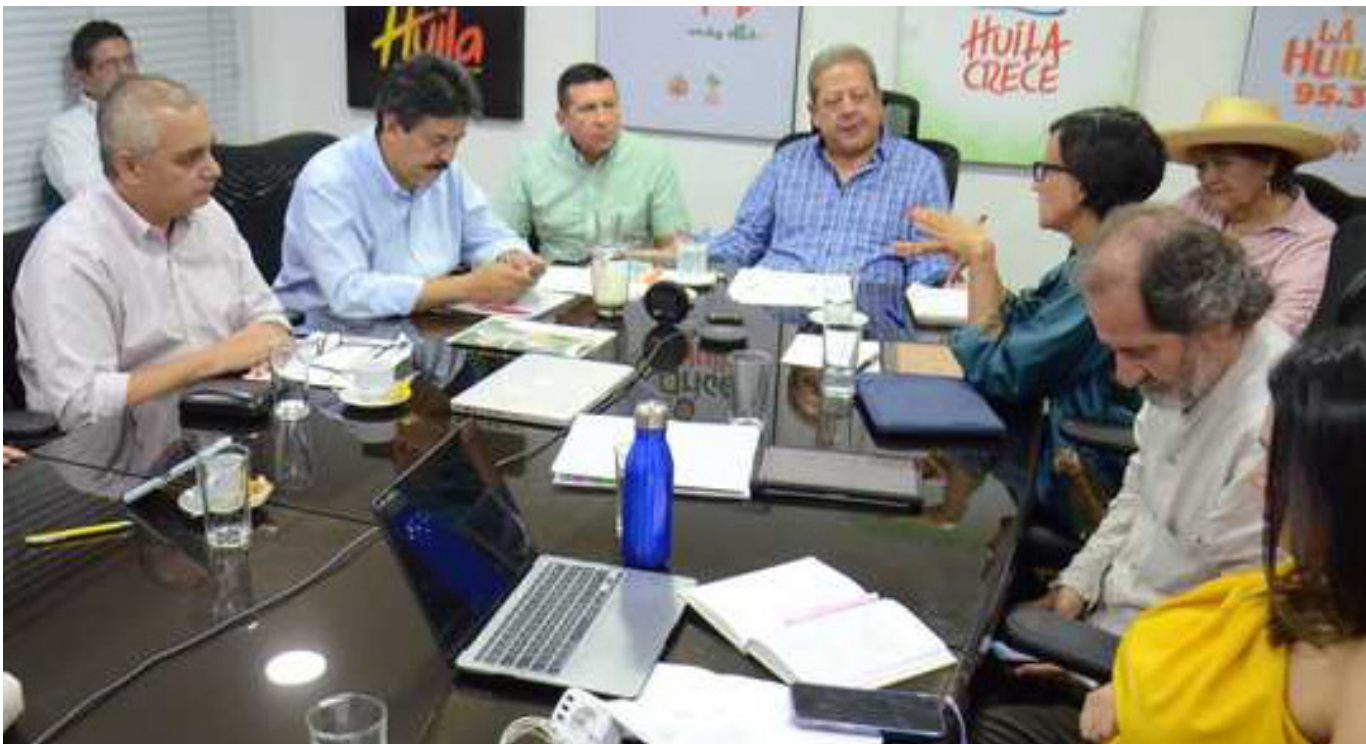
La ministra de Ambiente, Susana Muhammad, en reunión sostenida donde se adquirieron unos compromisos.

resolver los conflictos socioambientales derivados del proyecto. “Hago un llamado a consolidar un bloque público entre entidades nacionales y locales para defender lo público y hacer cumplir las