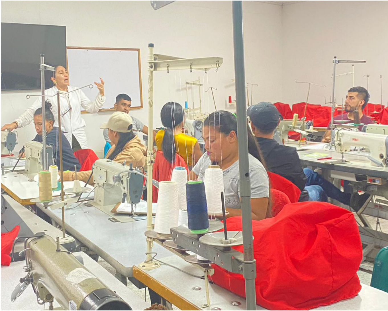
Veintiocho 'trans' hicieron el curso de modistería.

va con impacto, dentro de los municipios aledaños.