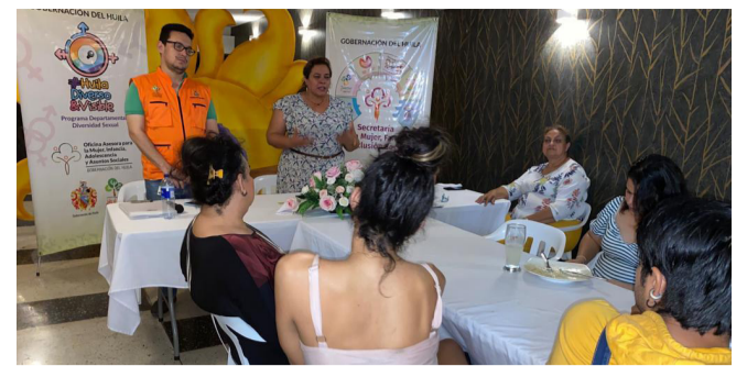
Listas Mesas Municipales de Diversidad Sexual