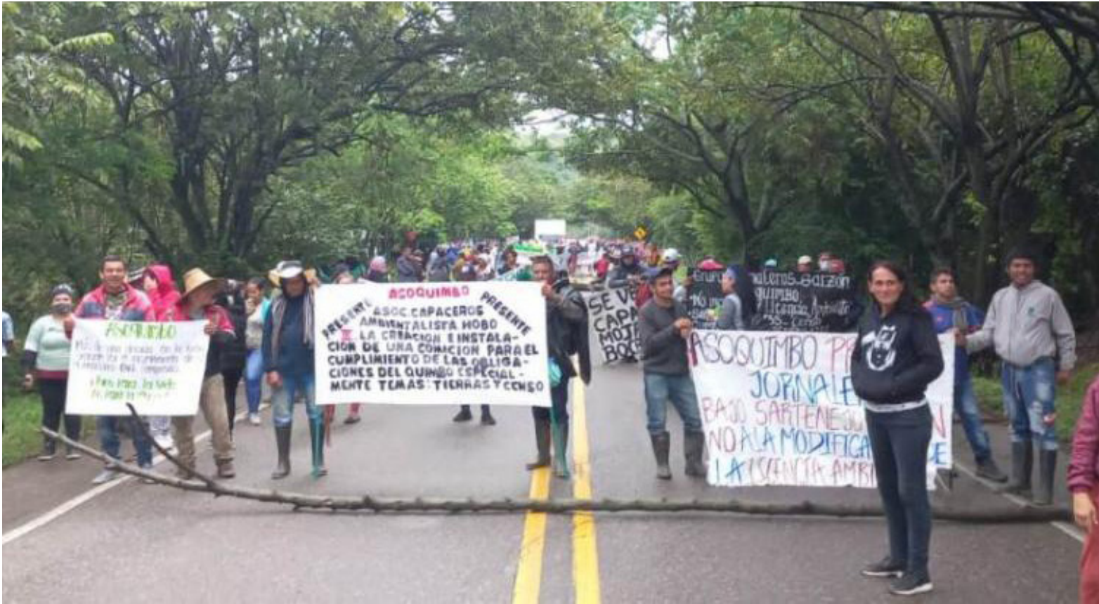
Los demandantes protestaron en el sector de Río Loro.

peticiones, la comunidad tomó las vías de hecho en el centro poblado río Loro, ubicado entre los municipios de Gigante y Garzón y cerró el paso de la vía, que afortunadamente se logró negociar.