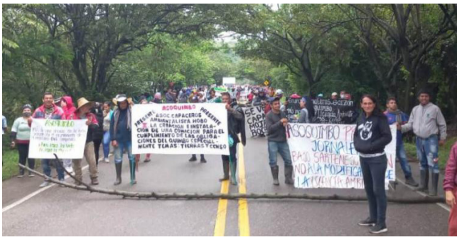
427 familias reconocidas por afectación del Quimbo