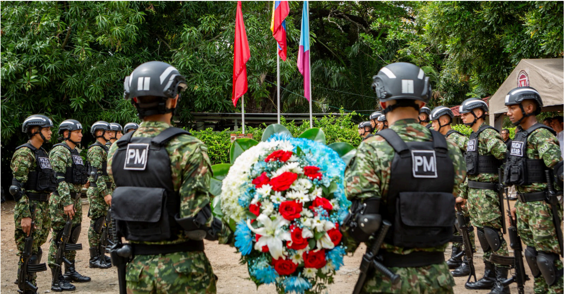
En el Día Internacional de la Sensibilización contra las Minas Antipersonal, el Ejército de Colombia entrega la zona I del municipio de Paujil, Caquetá, para libre tránsito de más de 14.500 habitantes.

prohibido en las normas del Derecho Internacional Humanitario.