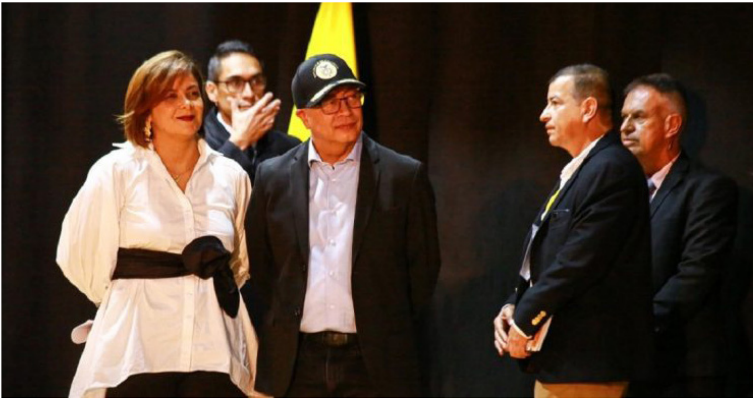
El presidente Gustavo Petro y la ministra Jhenifer Mojica anunciaron la compensación del 80% para las familias caficultoras, generando debate sobre la propiedad de los fondos.

mediata en la Federación Nacional de Cafeteros para garantizar una representación efectiva de los intereses de los productores de café en Colombia.