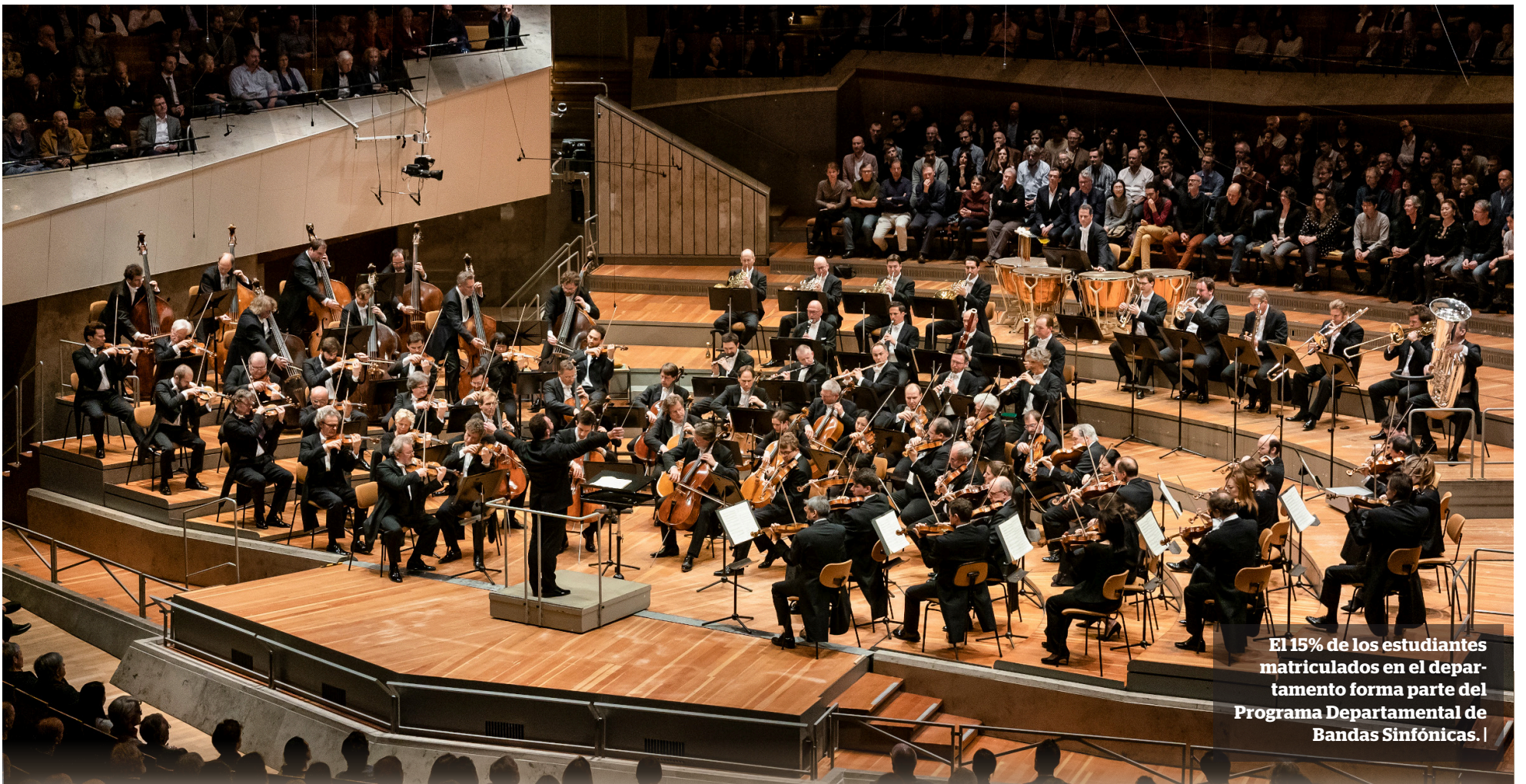
El 15% de los estudiantes matriculados en el departamento forma parte del Programa Departamental de Bandas Sinfónicas. |