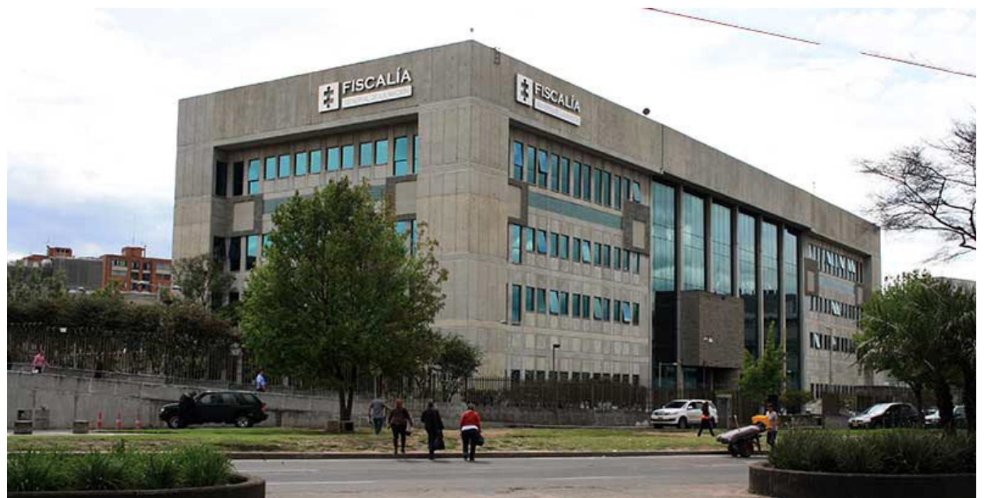
Grupo Elite de la Fiscalía, investiga la violencia por prejuicio.

Ante este panorama, instamos a las autoridades pertinentes a llevar a cabo una investigación exhaustiva y transparente para llevar a los responsables ante la justicia, recordando la aplicación de la Directiva 006 de 2023 de la Fiscalía que establece parámetros en la recepción, investigación y judicialización de casos en donde las víctimas son personas con orientaciones sexuales e identidades de género diversas.