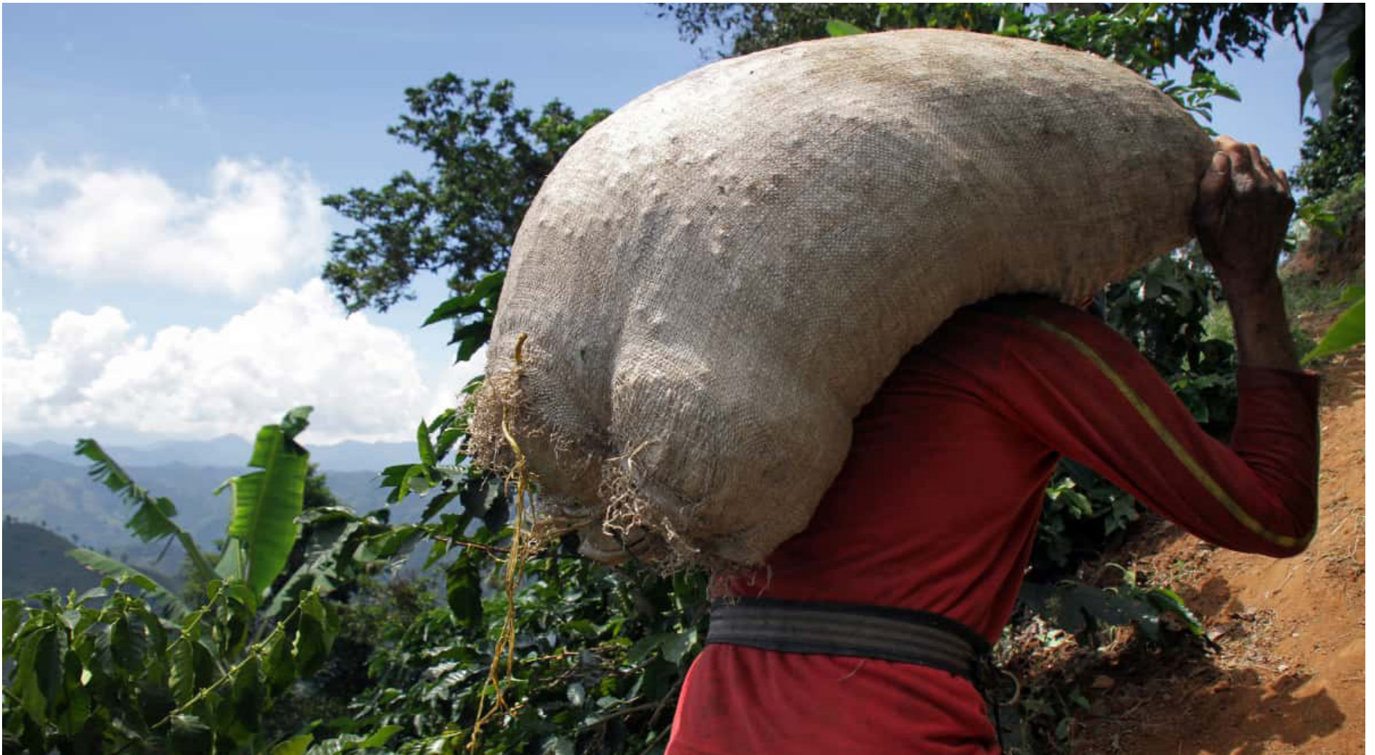
Los caficultores, aseguran que esos dineros son los aportados por ellos y que ni el gobierno Duque y Petro han puesto su parte.

■ Ante el anuncio del Gobierno Nacional de activar el Fondo de Estabilización de Precios del Café, de la cual, las familias obtendrían una compensación del 80 por ciento. Los caficultores, aseguran que esos dineros son los aportados por ellos y que ni el gobierno Duque y Petro han puesto su parte.