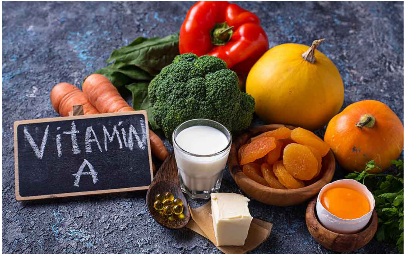
Las vitaminas son clave para cuidar la salud visual.

Una opción más es la vitamina E, un compuesto antioxidante con efectos positivos en la visión, que incluyen la prevención o retraso de enfermedades como las cataratas y la degeneración macular asociada a la edad.