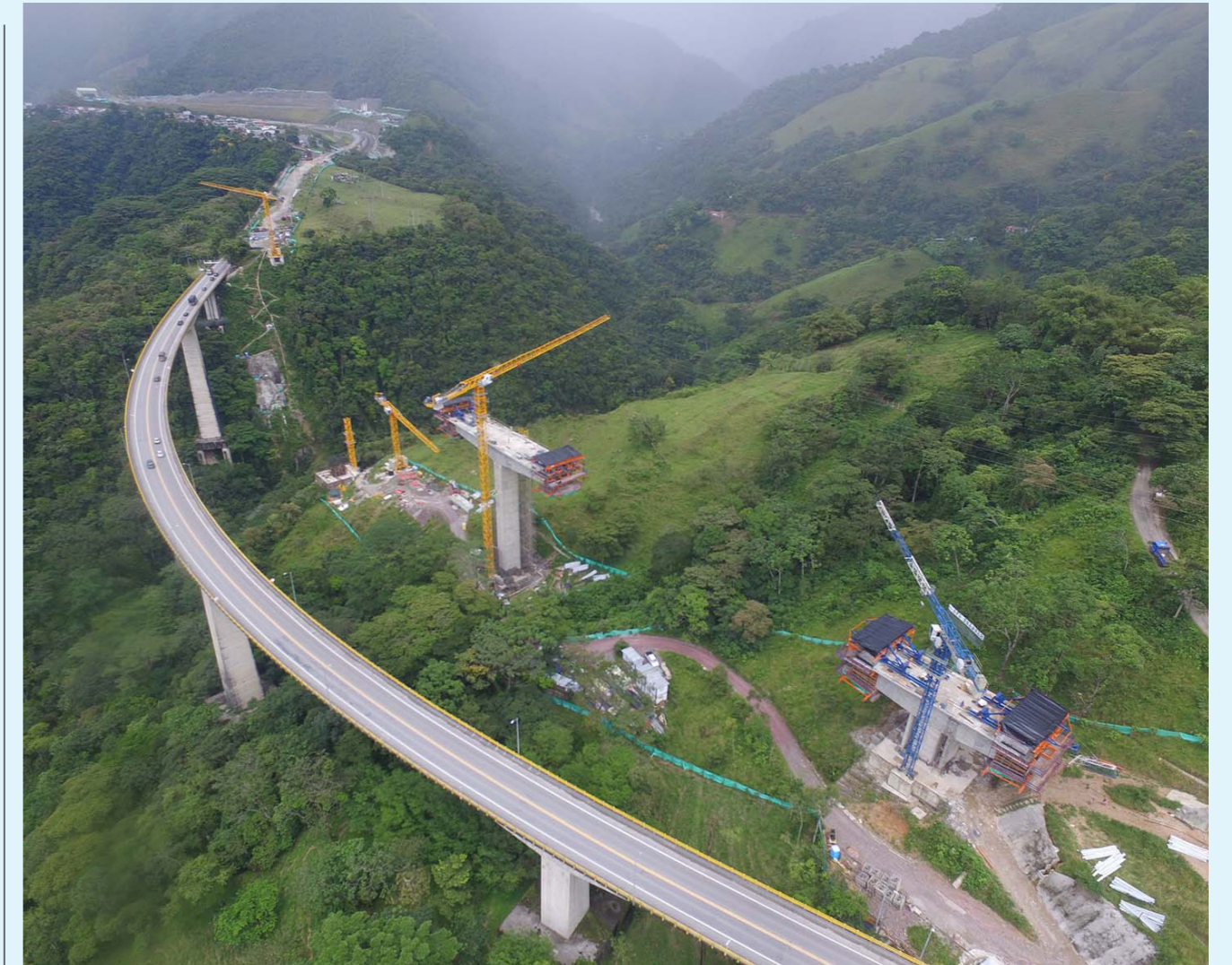
El documento presentado por la ANI sobre el estado actual de los puentes en Colombia sigue en proceso de revisión y evaluación por parte de un equipo técnico de la Contraloría.

De otra parte, los Puentes Susumuco, Estaquecá y Aserrió, que hacen parte de la Concesión vial Bogotá - Villavicencio, presentan problemas estructurales y geotécnicos que requieren reparación inmediata.