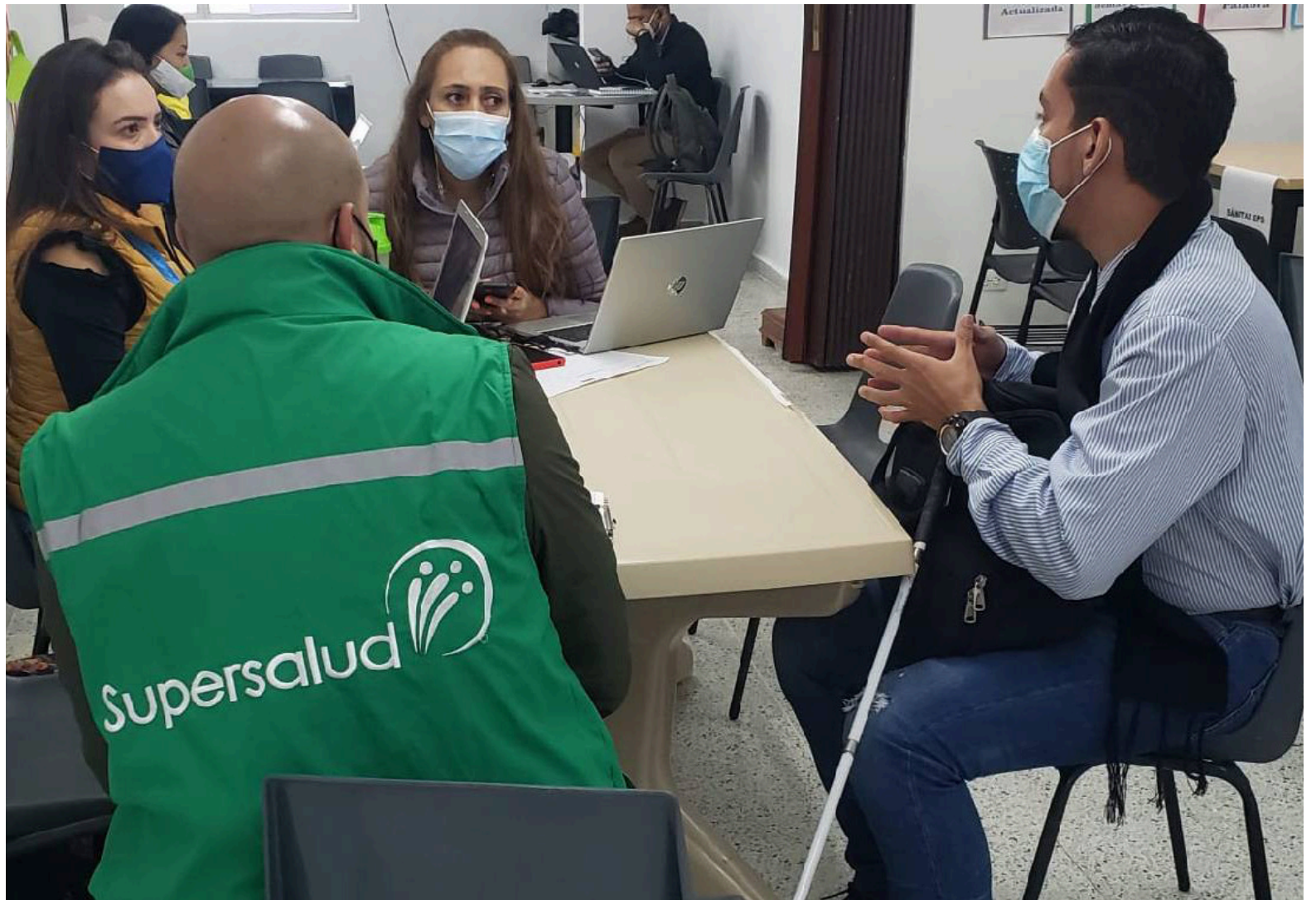
La Supersalud no tendría personal suficiente para administrar las EPS intervenidas.

Según la información presentada por la Contraloría, consignada en el informe que conoció Caracol Radio, ninguna EPS interve-