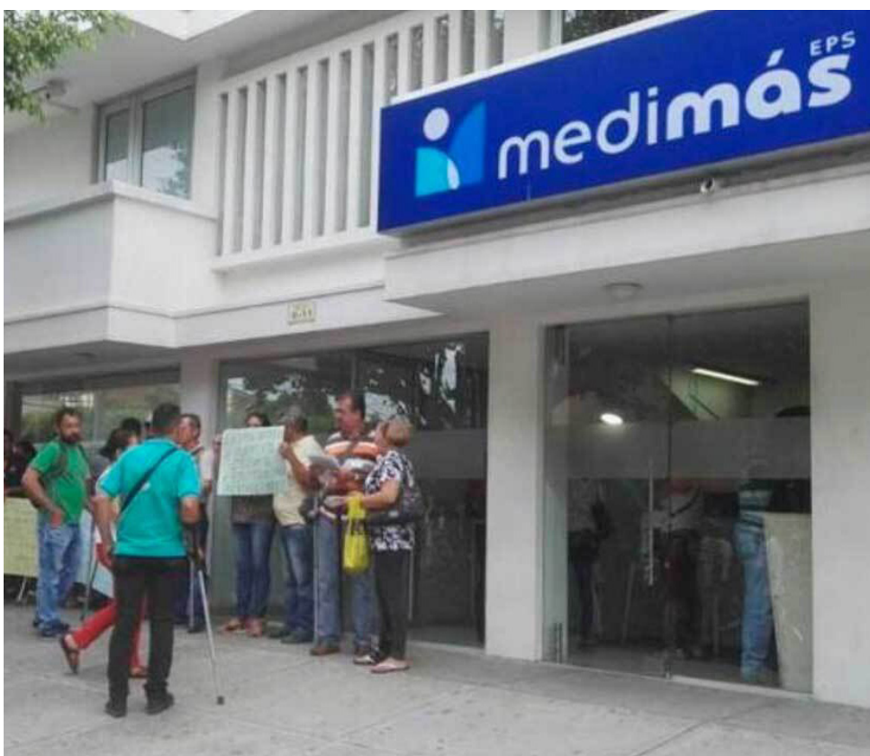
Medimás, EPS que contaba con más de 1,5 millones de usuarios, fue liquidada en el gobierno de Iván Duque.

El informe de la Contraloría también indica que el proceso de liquidación de las EPS afecta el flujo de recursos, ya que se paraliza durante dicho proceso.