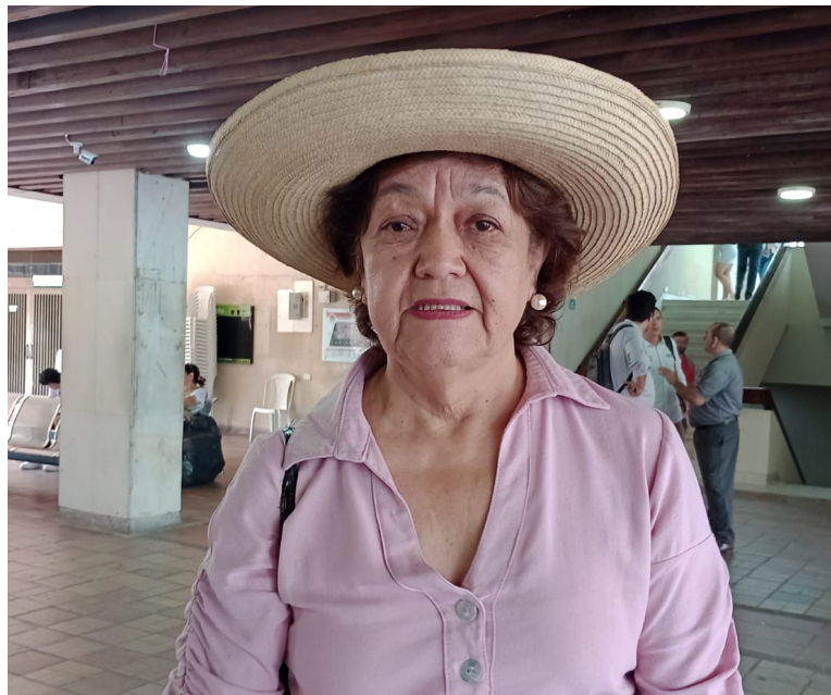
Leyla Rincón, representante a la Cámara por el Huila.

En este sentido, la jefe de la cartera ambiental también recaló que está claro que Emgesa no está cumpliendo la licencia ambiental, lo que implica que se deben tomar acciones que requieren escalar la acción pública y política más allá de la licencia para