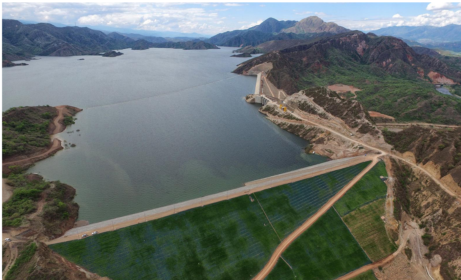
El proyecto hidroeléctrico el Quimbo, dejó más personas afectadas.

“Efectivamente, hay una afectados quienes no han sido censados, no están en las bases de datos de la empresa Enel, entidad a cargo del proyecto hidroeléctrico el Quimbo y aquí lo que se busca es que se han escuchados, y se revisen cuales exactamente son sus perjuicios y que les reconozcan los daños o en su defecto se puedan dar las com-