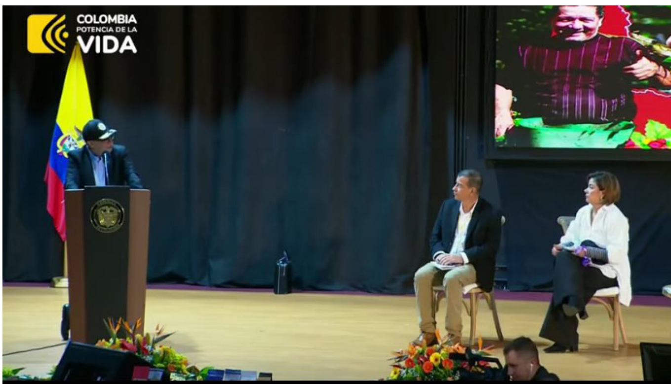
Petro entrando para reunirse con los caficultores.

El tema de la salud lo enlazó con el de los cafeteros, al señalar que “en representación del trabajo de los caficultores lo que hicieron fue destruir el mundo del café. Perdieron la Flota Mercante Grancolombiana, vendieron el Banco Cafetero. Privatizaron todo. Es la misma historia de las EPS”.