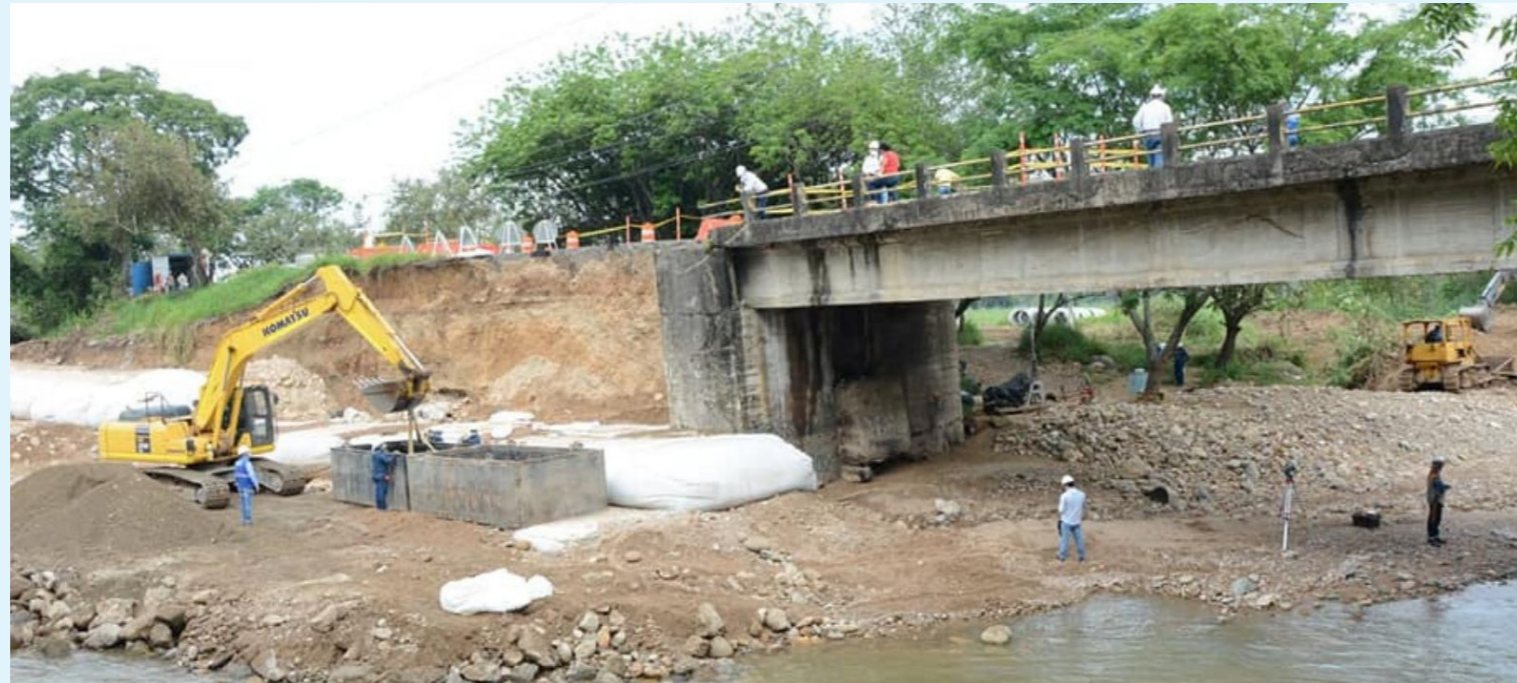
El Puente Arenoso II, que hace parte de la Concesión vial Santana - Mocoa - Neiva y está ubicado entre Neiva y Campoalegre.

La ANI también ha informado que esta afectación está siendo suplida con el segundo Puente Arenoso II que construyó el concesionario en la segunda calzada de esta vía, que es paralelo al puente colapsado y que está en servicio bidireccional para todo tipo de vehículos desde el 14 de julio de 2023.