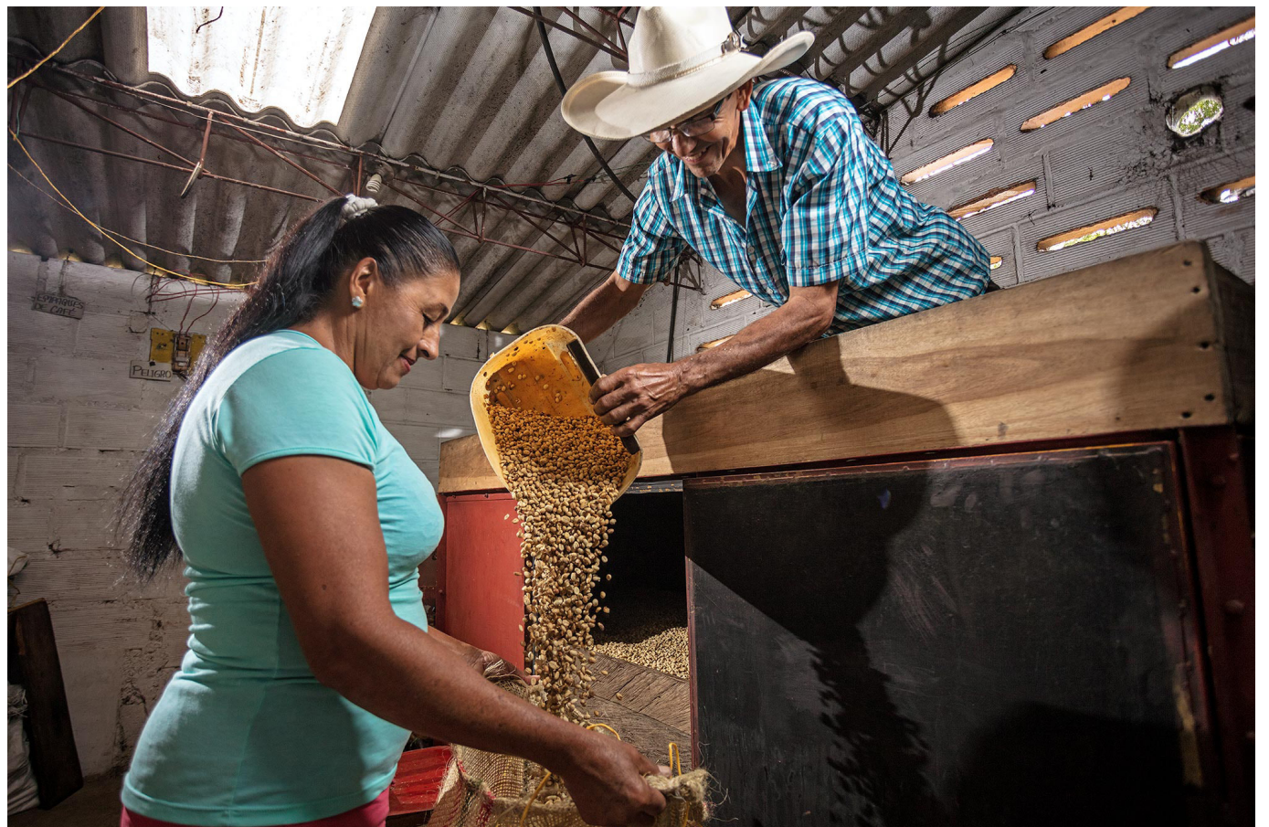
Los caficultores están insatisfechos ante la activación del Fondo de Estabilización, reclamando que los recursos provienen de sus propios aportes.

La Unión de Caficultores de Colombia demanda una activación real del Fondo con aportes significativos por parte del Gobierno, buscando soluciones integrales para el sector y respaldo en momentos de crisis.