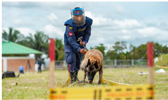
Desminado humanitario avanza en el Huila