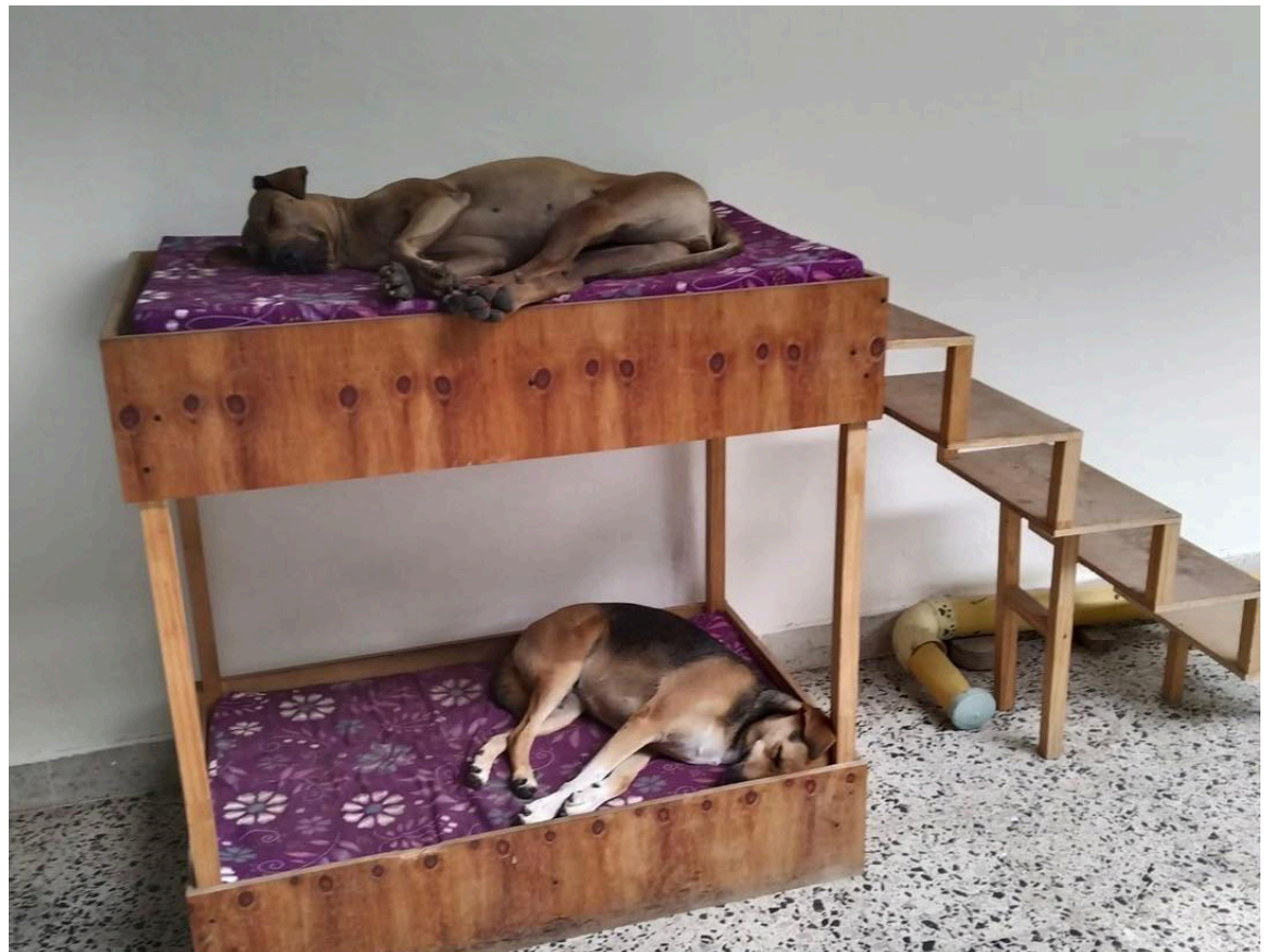
Las mascotas de la Universidad Surcolombiana descansan en las instalaciones. A quienes permiten este hermoso acto con los animalitos, un aplauso.