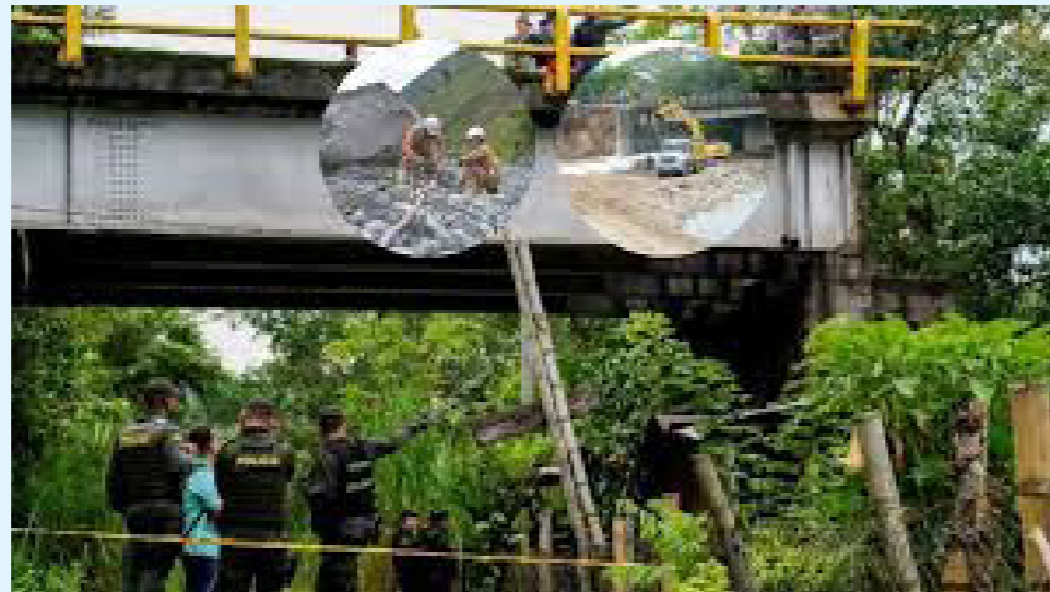
La Agencia Nacional de Infraestructura expuso los departamentos con más puentes en estado crítico, dentro de los cuales están Huila, Putumayo, Antioquia, Boyacá y Cundinamarca.

vigente y en espera de los estudios, diseños y permisos necesarios para su reparación y rehabilitación, los cuales, según la ANI, son a cargo del concesionario de este corredor vial.