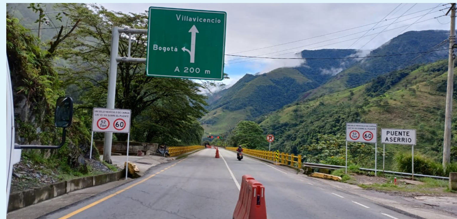
La ANI, mediante un oficio emitido el 22 de marzo de 2024, remitió respuesta a este requerimiento.

La ANI, mediante el Oficio Nro. 20245000102051 del 22 de marzo de 2024, remitió respuesta a este requerimiento, la cual actualmente está en proceso de revisión y evaluación por parte del Equipo Técnico de la Contraloría Delegada para el Sector de Infraestructura.