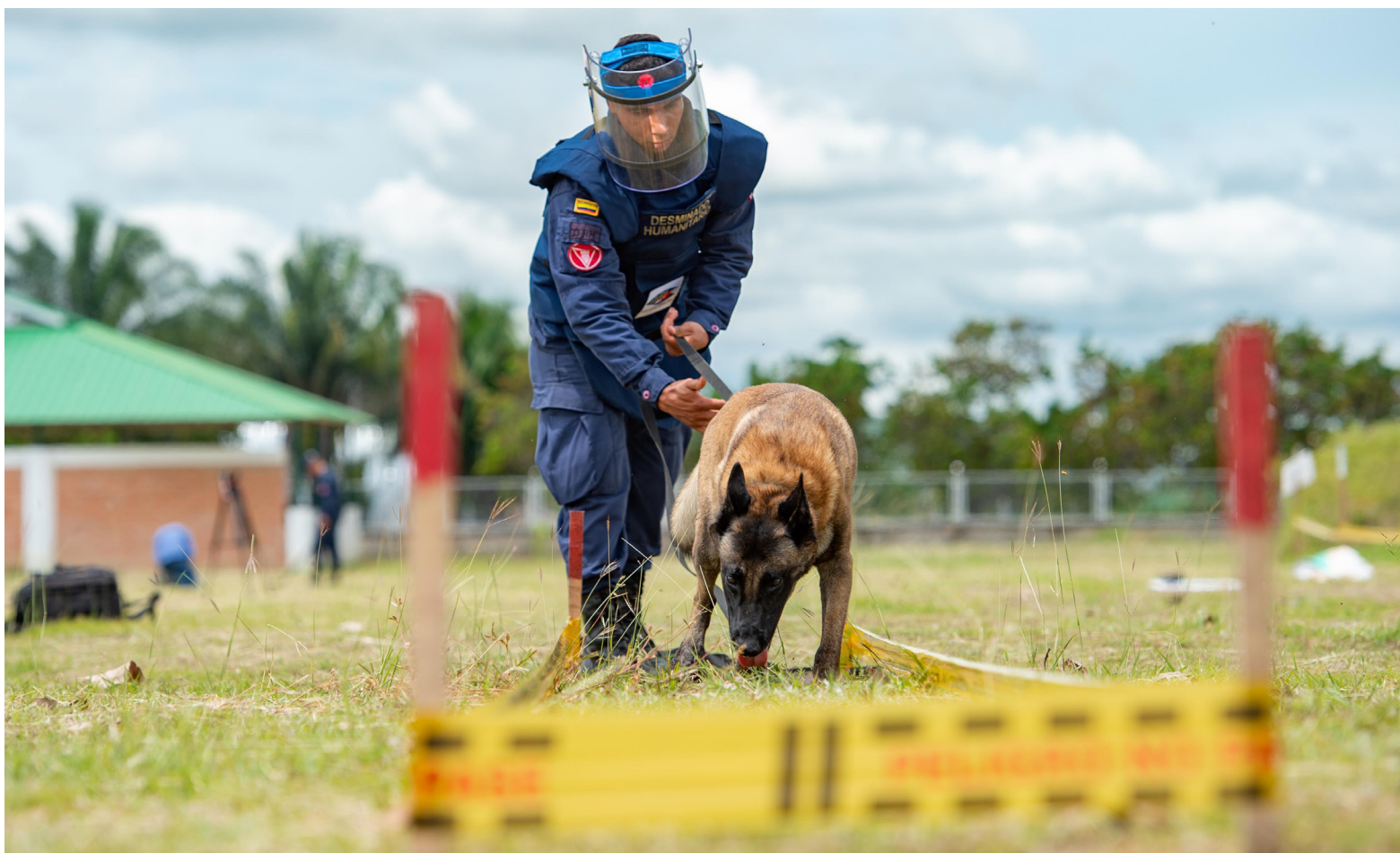
Batallón de Desminado Humanitario N.º 5 en el Huila ha descontaminado 36 de los 37 municipios del Departamento desde marzo de 2017.

Con misa en acción de gracias, ofrenda floral y un stand ubicado en el parque Santander de la ciudad de Neiva, la Novena Brigada a través del Batallón de Desminado Humanitario N.º 5, conmemoró el Día de la Sensibilización contra las minas antipersona, haciendo un energético llamado a rechazar su uso letal, el mismo que está