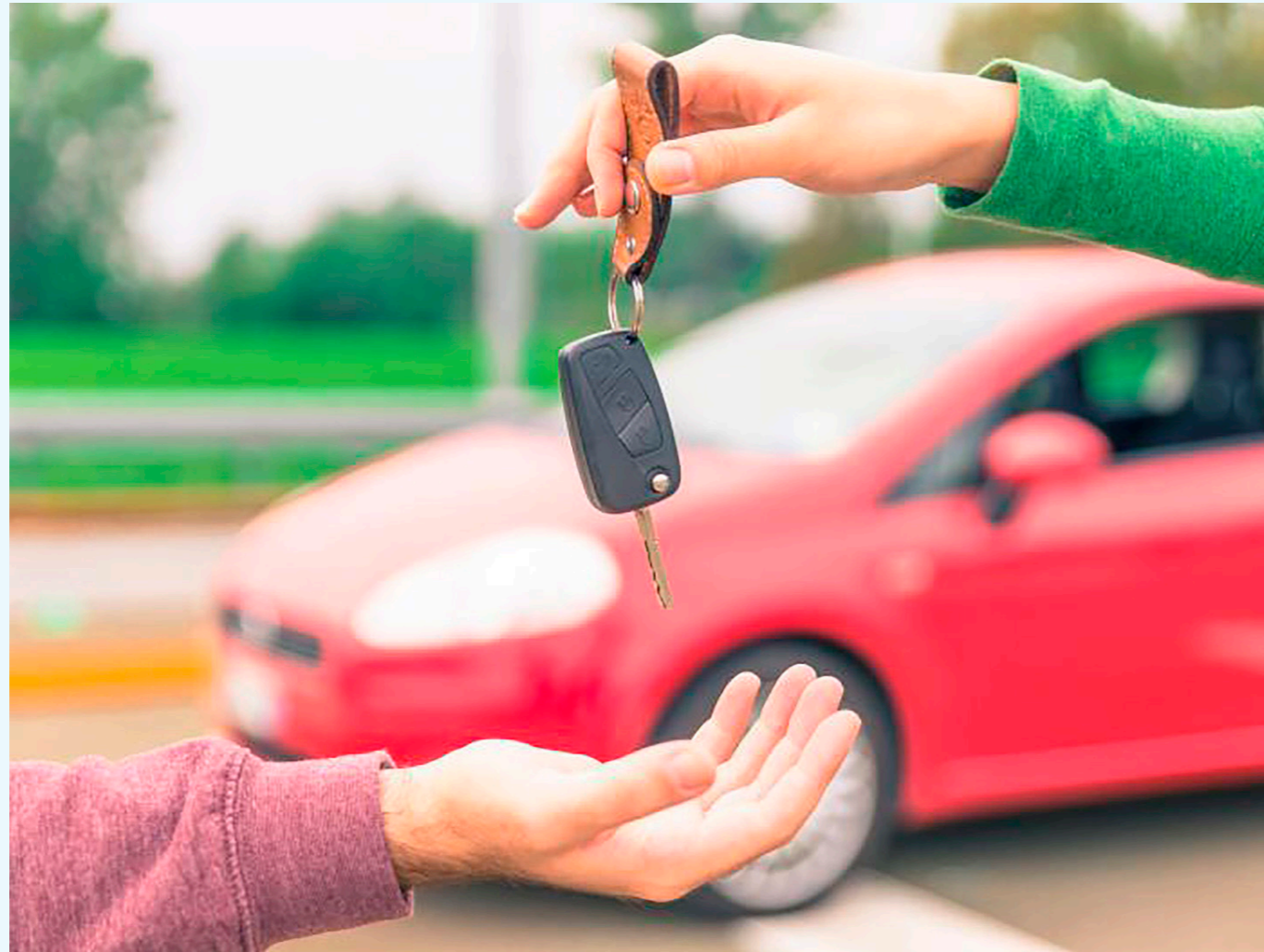
Frente a la dificultad de tener un vehículo nuevo muy costoso y la falta de disponibilidad, el consumidor opta por el usado.

Las cosas fueron mejorando para 2021, allí el mercado se