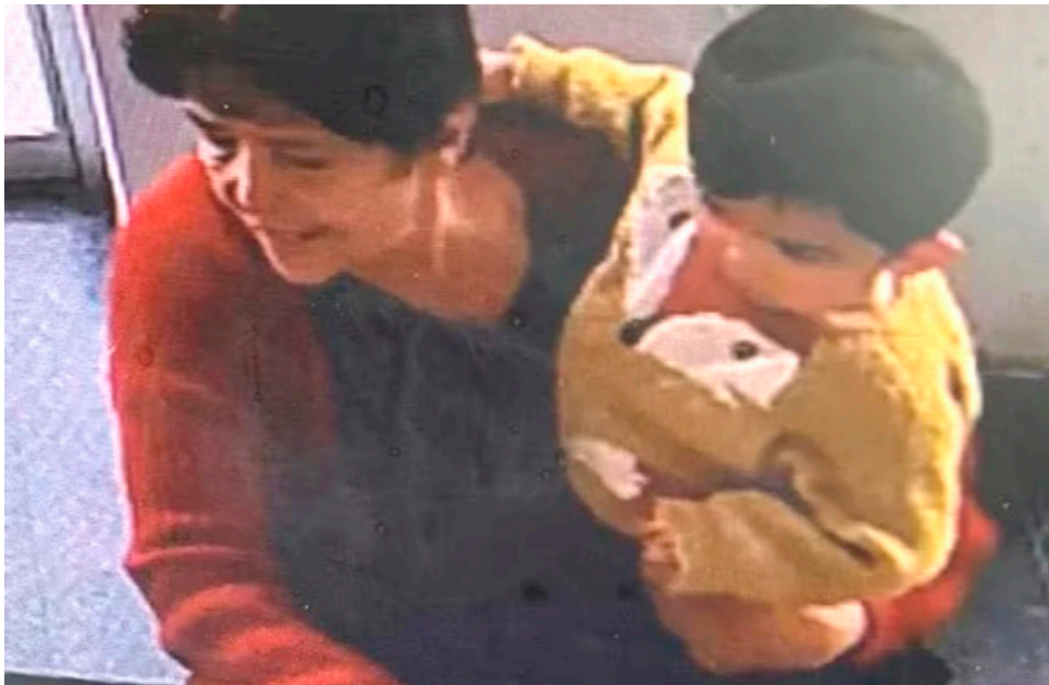
Hallan a la abuela y a su nieto de 13 meses que habían sido reportados como desaparecidos.

■ En el Huila fueron hallados abuela y nieto que habían desaparecido de la localidad de Kannedy en Bogotá. Según familiares, los dos habían salido de la vivienda, pero les habían perdido la huella.