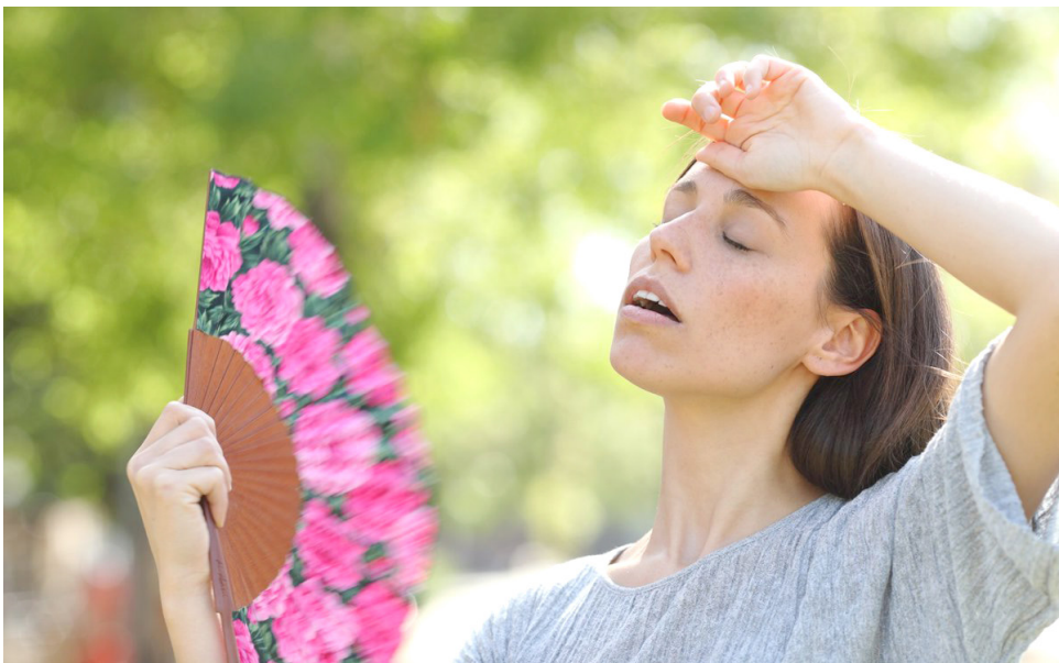
Son varias las alternativas implementadas por los opitas.

Aire acondicionado: si bien no es un ventilador, es el sistema de climatización más utilizado en regiones de clima cálido. Se destaca por tener un sistema de enfriamiento instantáneo y un mayor control sobre la temperatura del espacio donde está. Hay que tener en cuenta que su instalación y consumo de energía tiene un costo elevado.