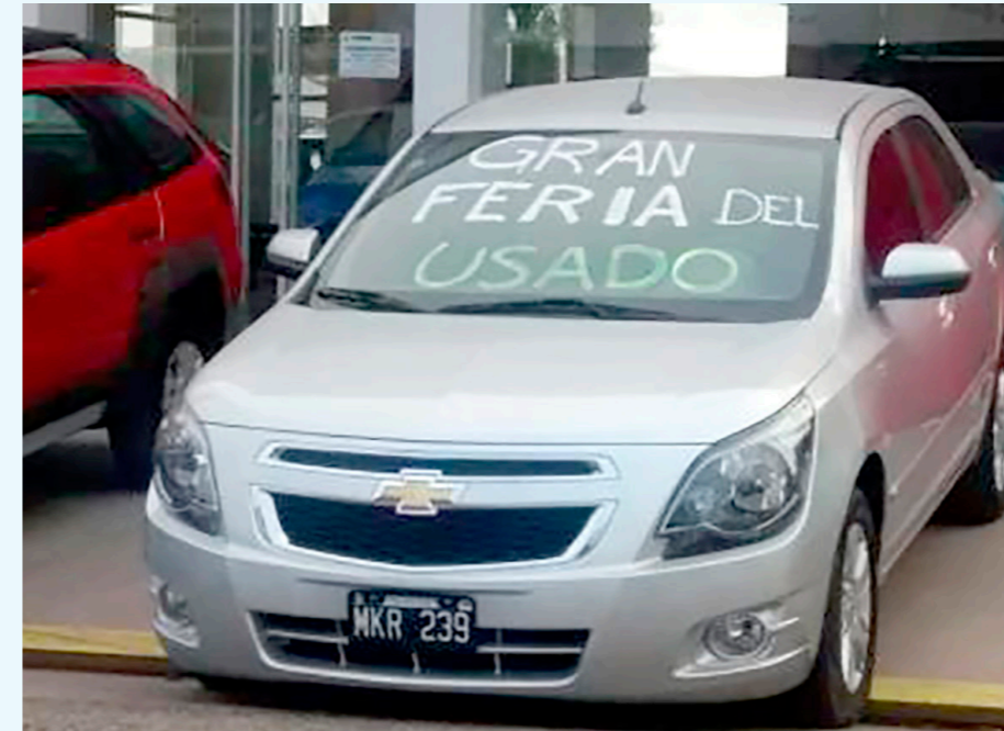
Hay caída en los precios del mercado.

Con la reciente caída del dólar, parece que la nor-