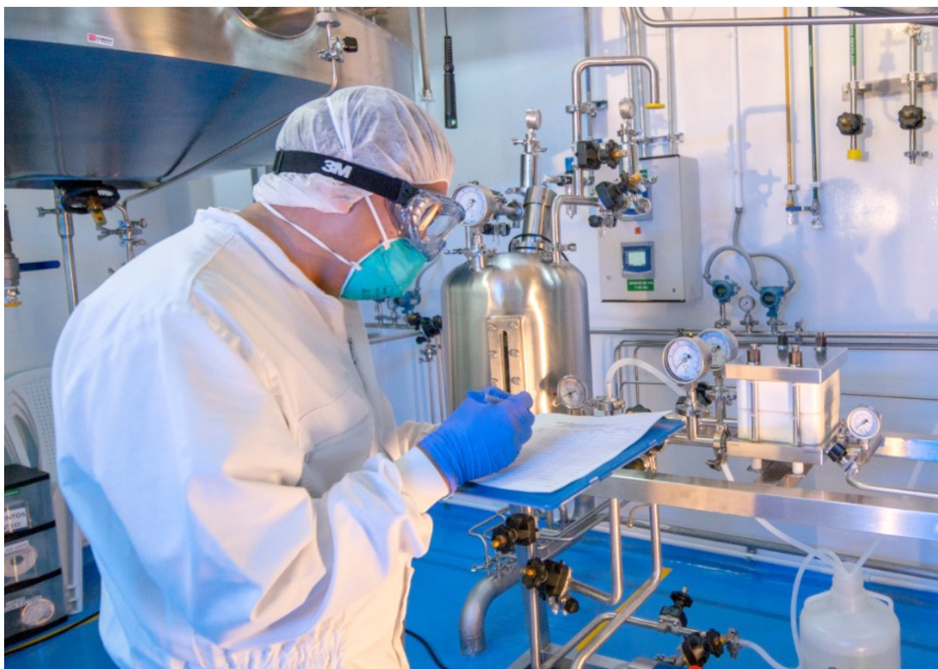
Ya hay autorización de las primeras 400.000 vacunas y se espera el ingreso de dos millones adicionales.

El Secretario indicó que gracias a varias visitas realizadas al embalse de Betania, se pudo establecer que los niveles de mortalidad son los normales.