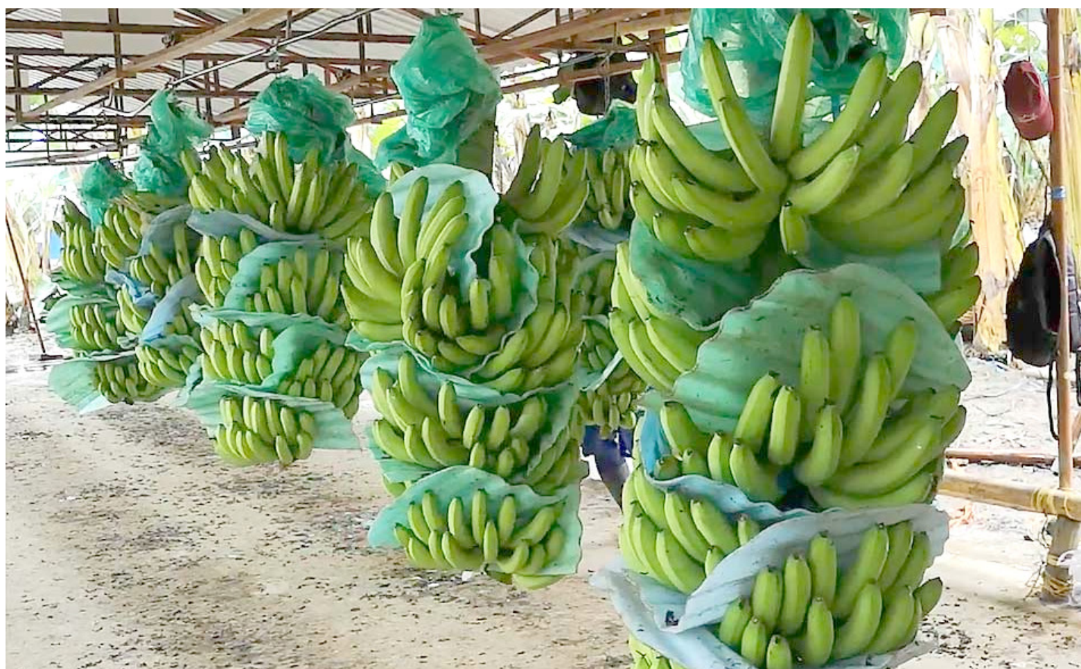
La apuesta va también a la transformación del producto, hojas y tallo de la planta para llegar a nuevos mercados.

A iniciado con éxito la producción y comercialización de semillas de plátano de alta calidad.