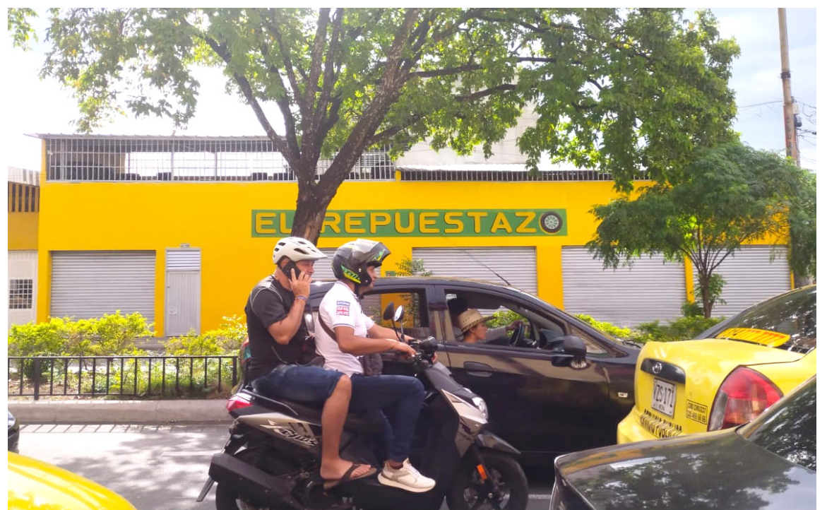
Seguimos observando en Neiva, los nuevos 'cascos' que utilizan algunos motociclistas en su afán por desplazarse por la ciudad.