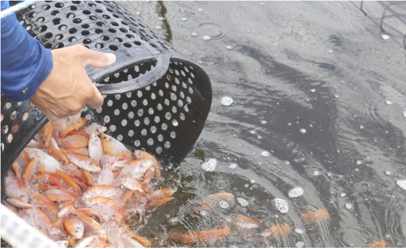
Según el ICA, la bacteria fue ingresada en material genético introducido de manera ilegal al país.

“Se vacuna cada uno de ellos y la vacuna o el biológico queda en la cavidad abdominal del pez para hacer toda la protección que hace cualquier vacuna, luego el ingresa al cuerpo se genera una resistencia frente al ataque de la bacteria”.