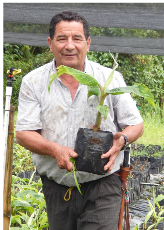
La comercialización de semilla de plátano de calidad es una gran apuesta.

El Gobierno Departamental ha sido un impulsor clave de este progreso. Mediante diversas iniciativas, ha fortalecido el subsector de las musáceas (plátano y banano). Un proyecto destacado es el "Desarrollo de modelo productivo de plátano con énfasis en material de propagación que atienda el problema de productividad y seguridad alimentaria derivadas de la emergencia causada por el COVID-19 en el departa-