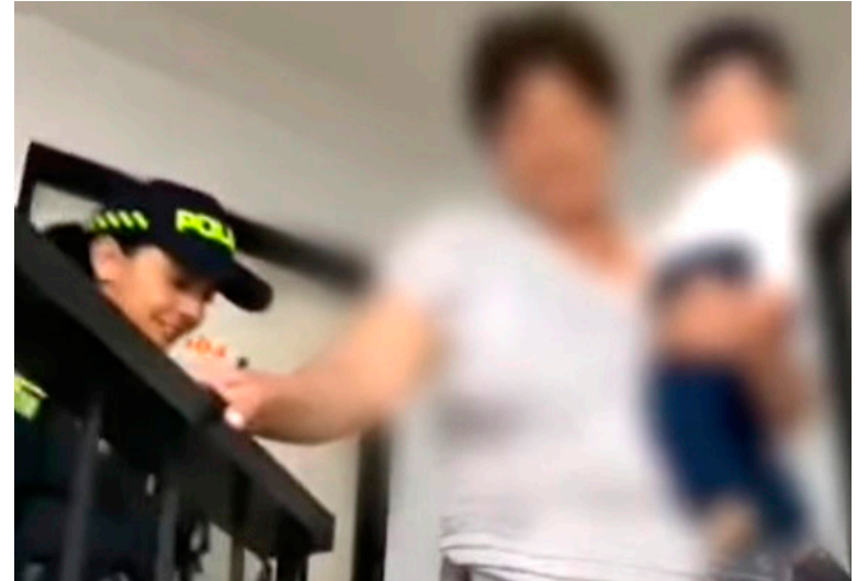
La Policía terminó hallándolos en el municipio de Pitalito.

La mujer sufre algunos problemas mentales, que habrían motivado su actuar. La mujer y su nieto fueron hallados sanos y salvos en Pitalito.