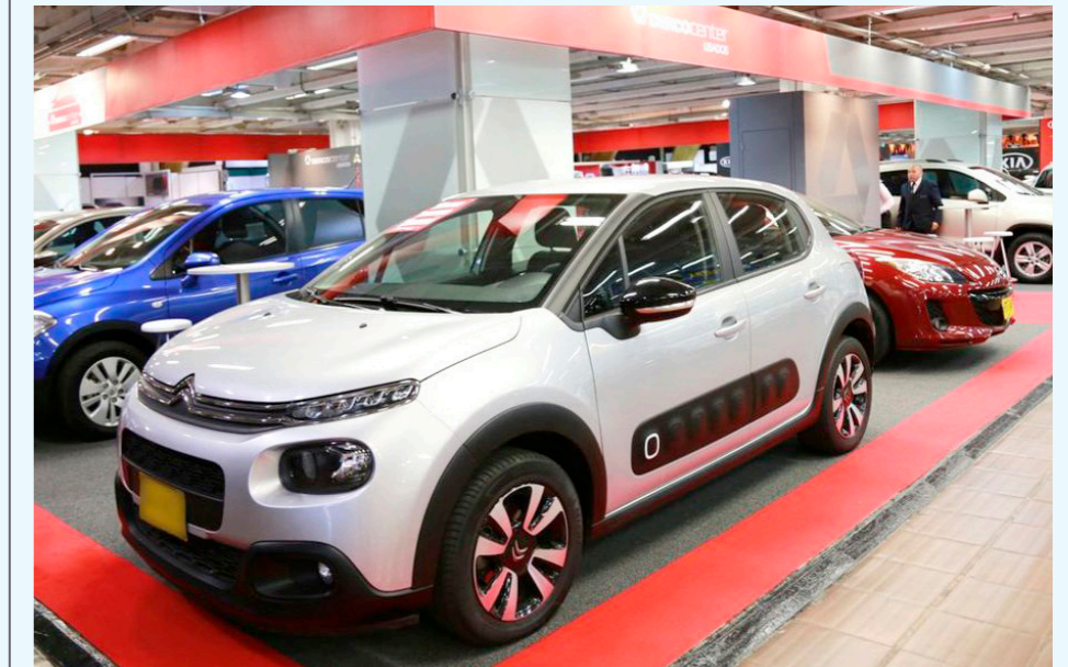
Carros usados siguen bajando de precio en Colombia: estos modelos están entre 20 y 40 millones.

Mala noticia para los dueños de carros usados; perderían millones, entérese del porque bajó su precio.