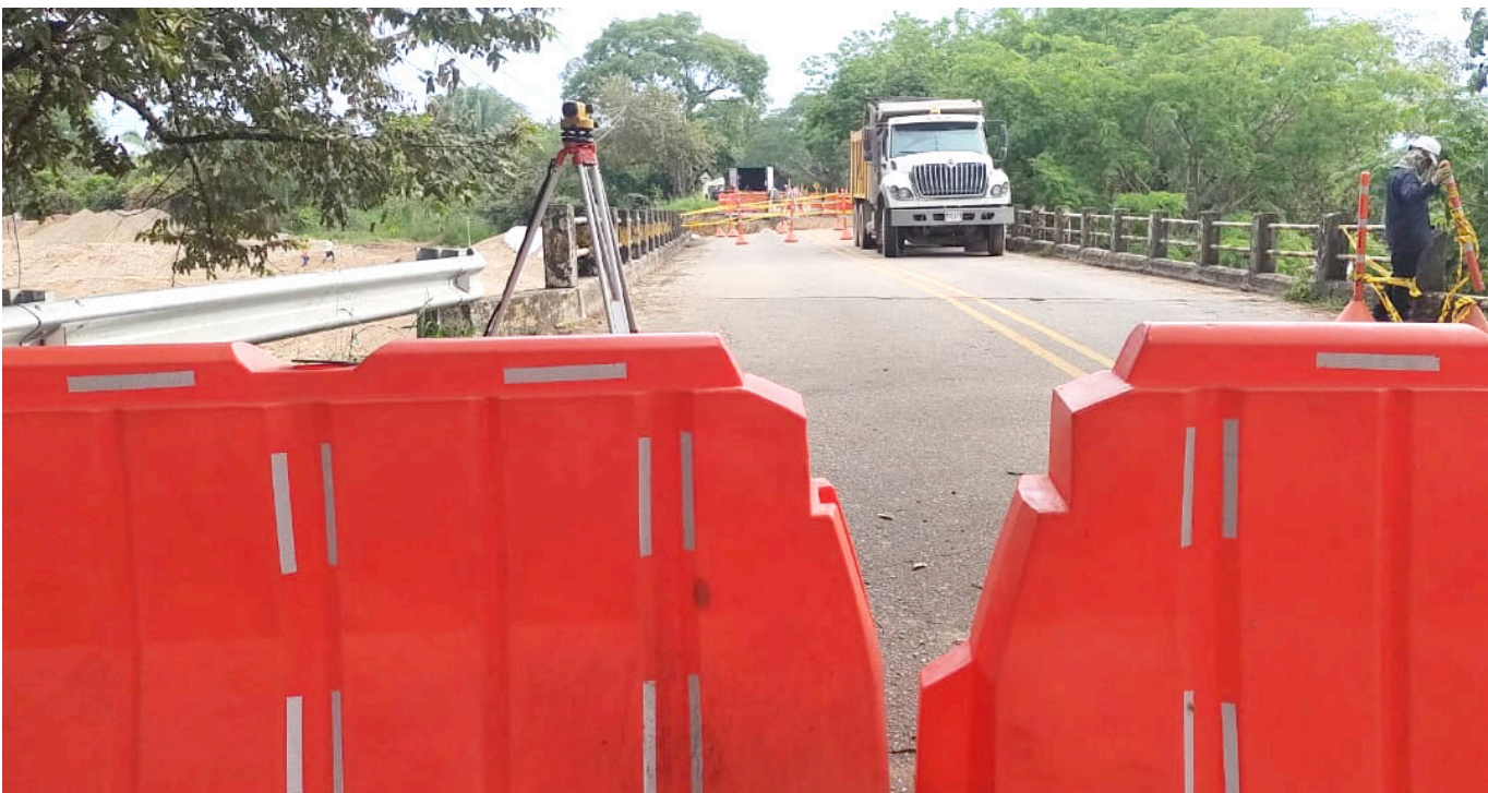
En este importante proyecto se harán 90 kilómetros de vías en doble calzada, representados en 22 km de la doble calzada Neiva - Campoalegre.

Estas obra comprenderá una longitud de 21.9 km, pero además se proyecta la construcción de 11 puentes nuevos, dos intersecciones y cinco retornos.