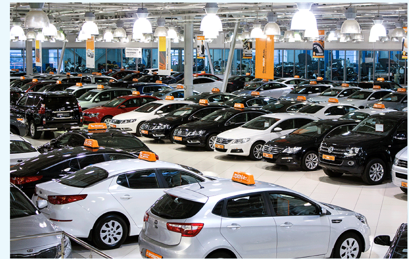
Según cifras del Registro Único Nacional de Tránsito (RUNT) en el año 2020, se traspasaban cerca de 1.200.000 carros por año.