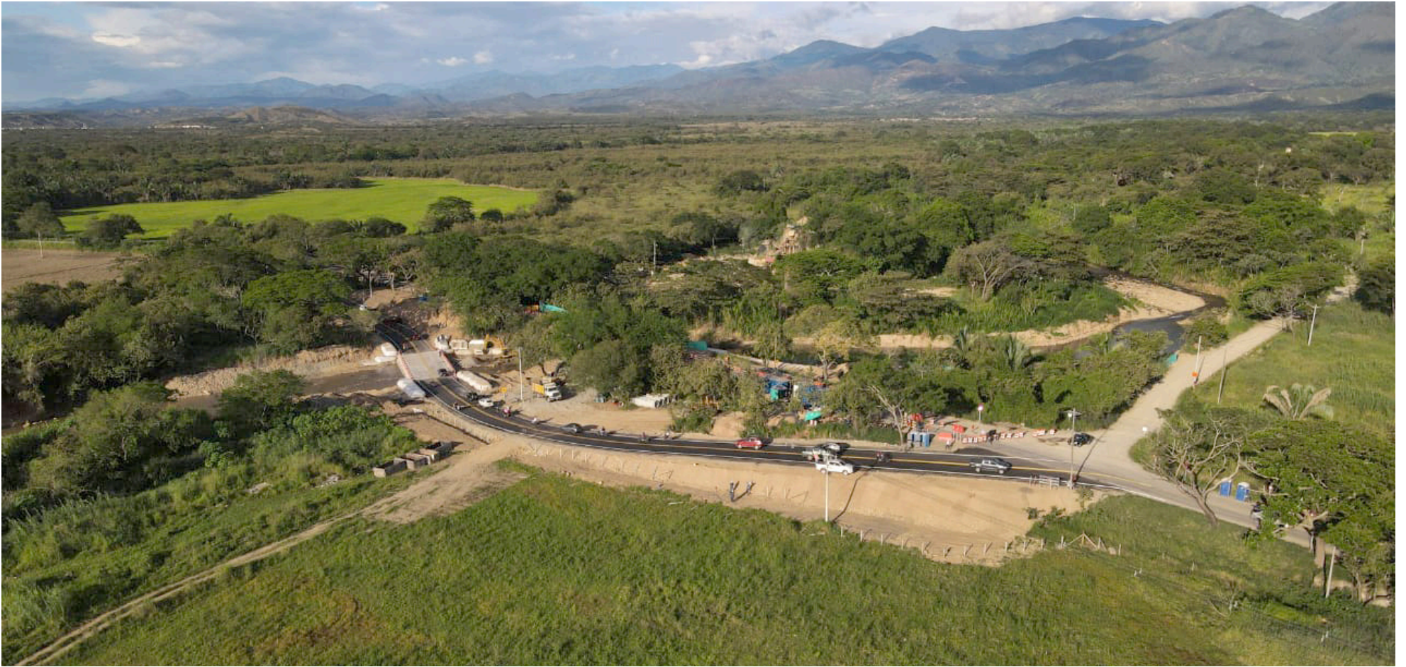
La entidad señaló que también avanza a buen ritmo la rehabilitación del corredor vial.

las regiones para generar prosperidad y mejorador movilidad a los usuarios viales”, señaló la entidad.