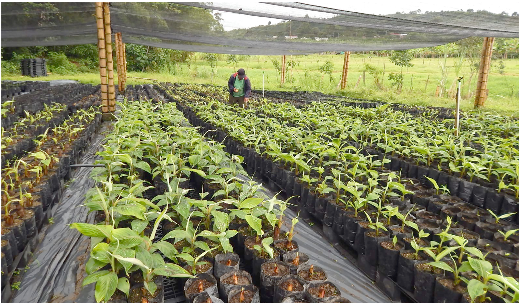
El Huila le apuesta al plátano como industria.