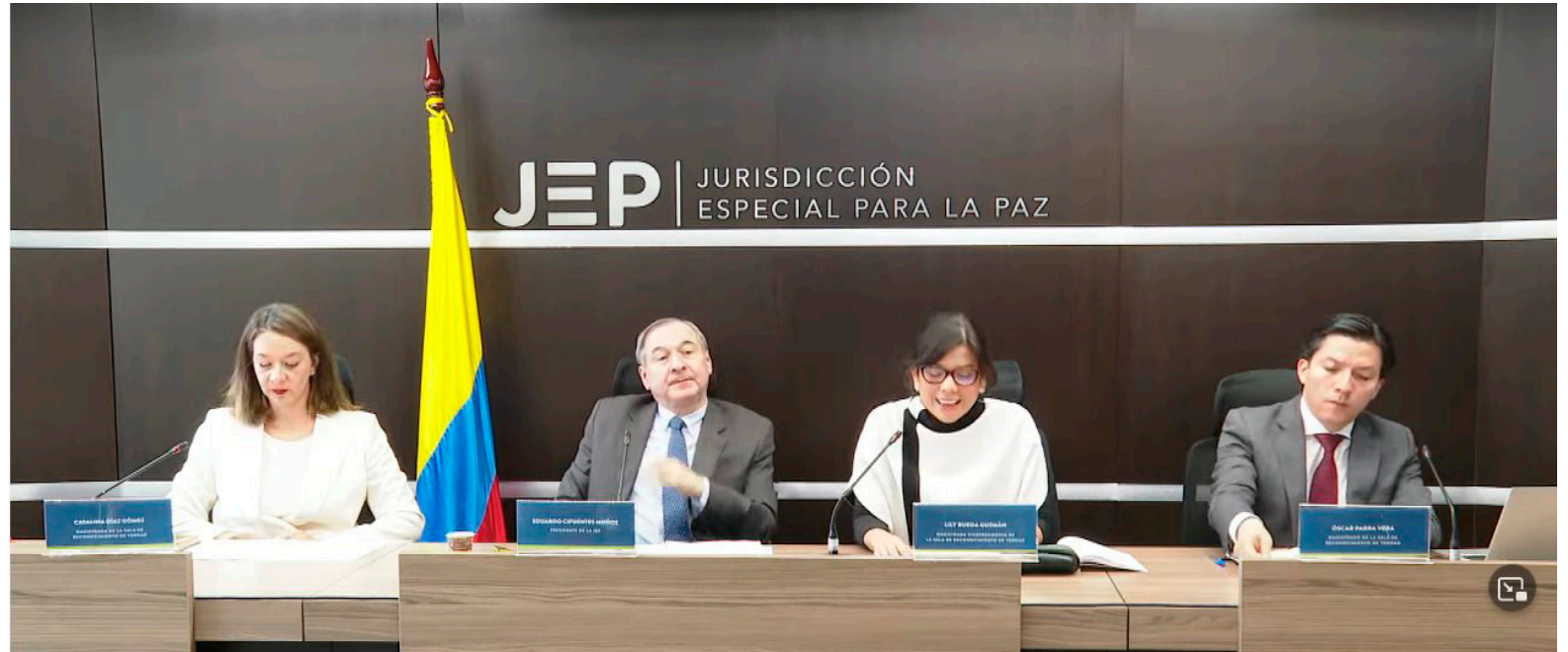
La Sala de Reconocimiento de la Jurisdicción Especial para la Paz.