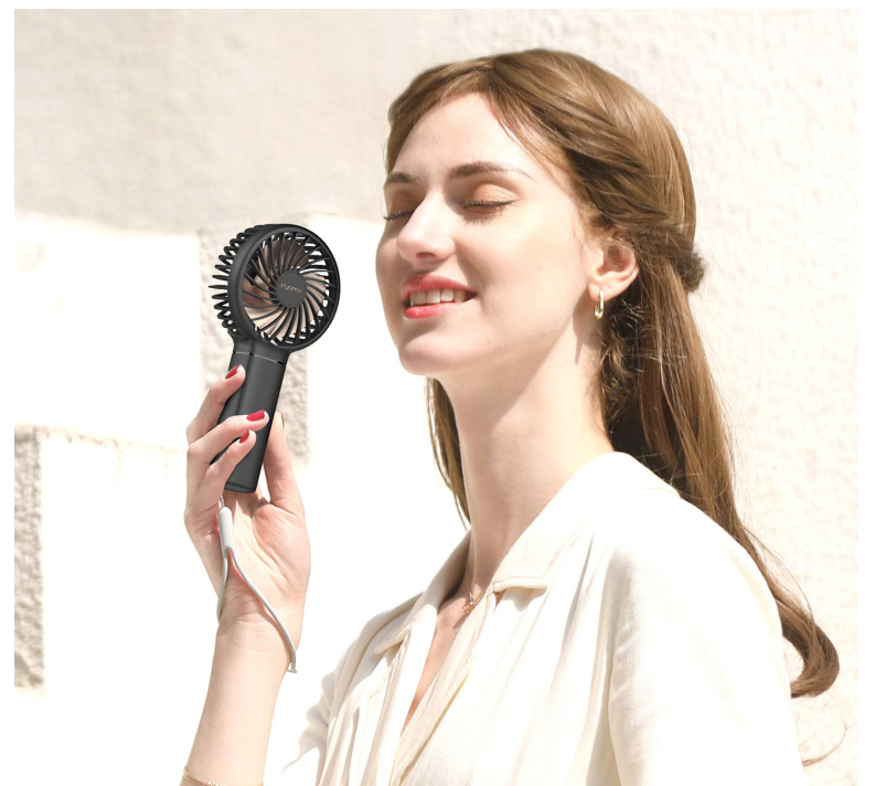
Se espera un incremento considerable en la venta de ventiladores convencionales y en aires acondicionados.

La temporada seca, ha hecho que cientos de opitas recurran a métodos para sobrellevar las altas temperaturas.