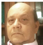
Luis Humberto Tovar Trujillo

Hace ya algunos días, cuando comenzamos a conocer las bestialidades del gobierno, entre otras muchas, pero la más importante es el deterioro de las instituciones, comenzando por la Fuerza Pública, la aniquilación en su dignidad y honor, y me sorprendió en su oportunidad unas declaraciones "rabiosas" pero, además, con alto contenido de valor, compromiso, y verdad histórica del General Zapateiro, cuando le dijo al presidente: "Primero fue el ejército y luego la república".