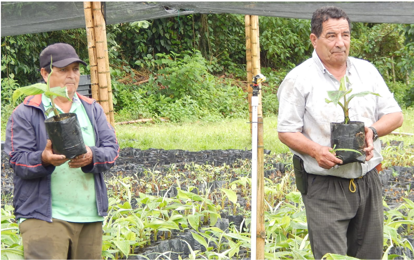
Más de 60 familias en Zuluaga hacen parte de esta apuesta.

Hoy, el esfuerzo de estas asociaciones ha dado sus frutos, ya que han iniciado con éxito la producción y comercialización de semillas de plátano de alta calidad. Los pedidos no solo provienen de los municipios del departamento del Huila, sino también de otras regiones del país. Esta actividad se ha convertido en una gran oportunidad de negocio para las organizaciones, lo que, sin duda, redundará en una mejor calidad de vida para los asociados y sus familias.