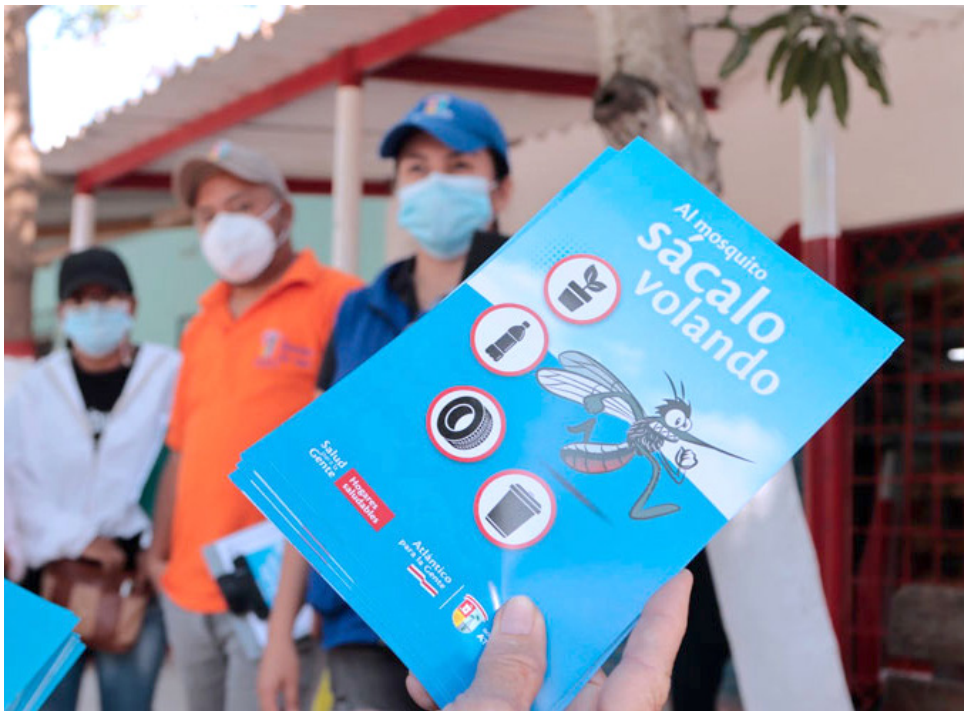
El dengue se previene tomando medidas contra los mosquitos que lo transmiten.