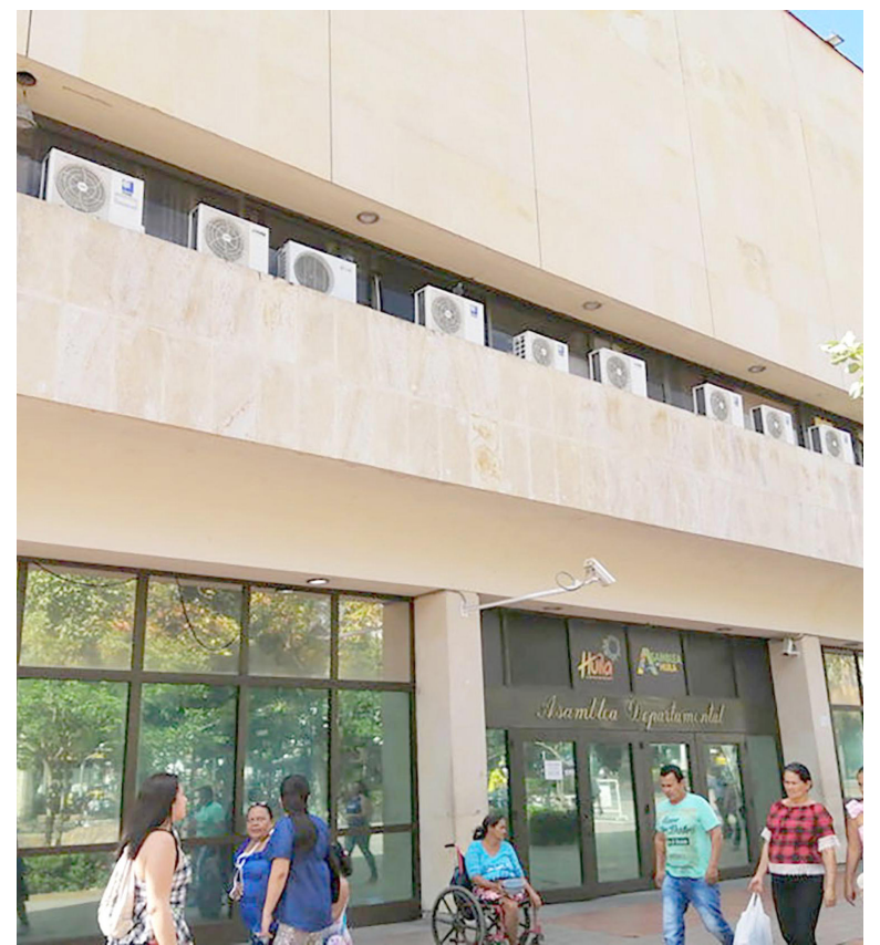
Asambleístas pidieron garantías de seguridad.

“Otras personas han recorrido el edificio a sus anchas y esto lo sabe el señor Gobernador y él tomó acciones en cambiar su cúpula de seguridad porque le pareció que no estaban atentos a esas situaciones”.