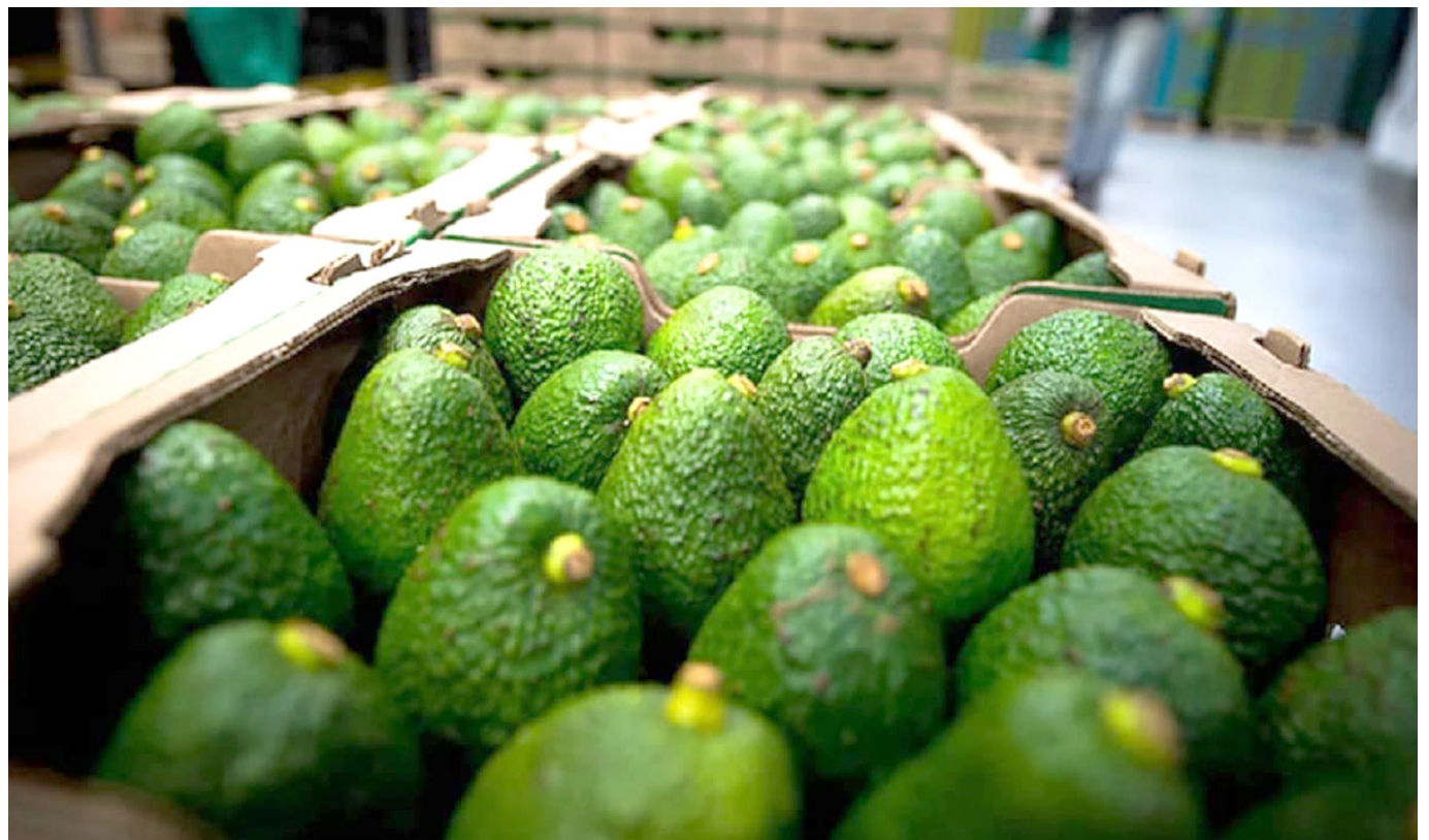
Del 95% de aguacate que se exporta en el país tricolor corresponde a la variedad Hass dada la preferencia del consumo en el exterior.

Por ahora, están en proceso de formalización para trabajar con una sola identidad. Ya tienen Comité Departamental de Productores de Aguacate, pero no está legalmente constituida, así que, se encuentran avanzando en eso.