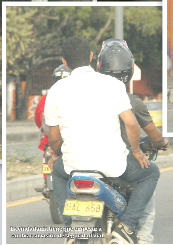
La ciudadanía tiene que empezar a cambiar su visión de seguridad vial.