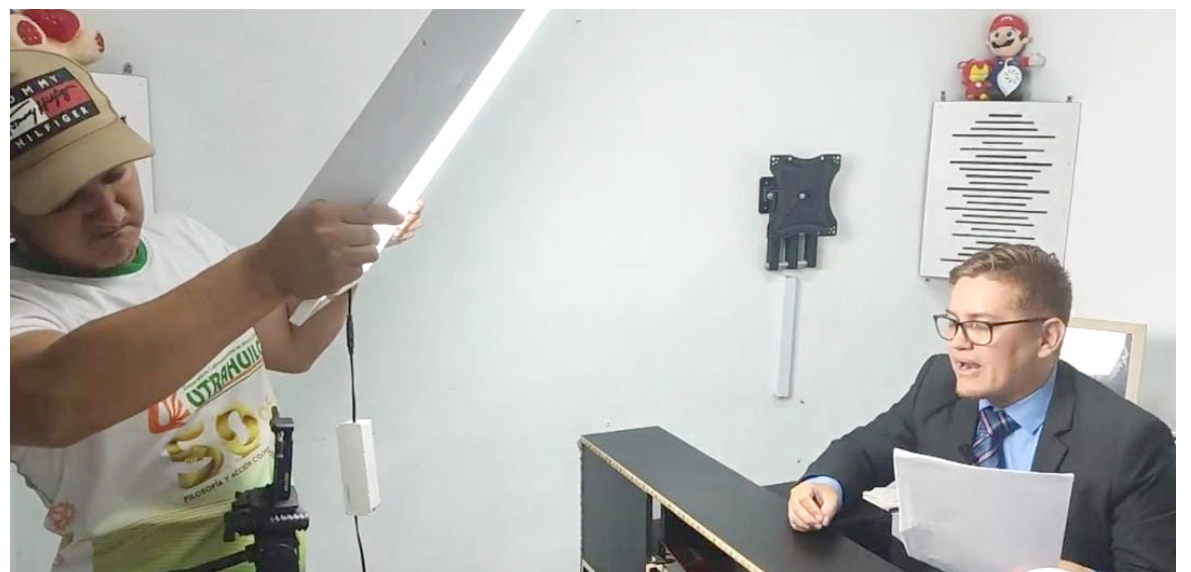
Los hermanos en una de sus producciones, con las cuales pretenden narrar las historias de su pueblo.