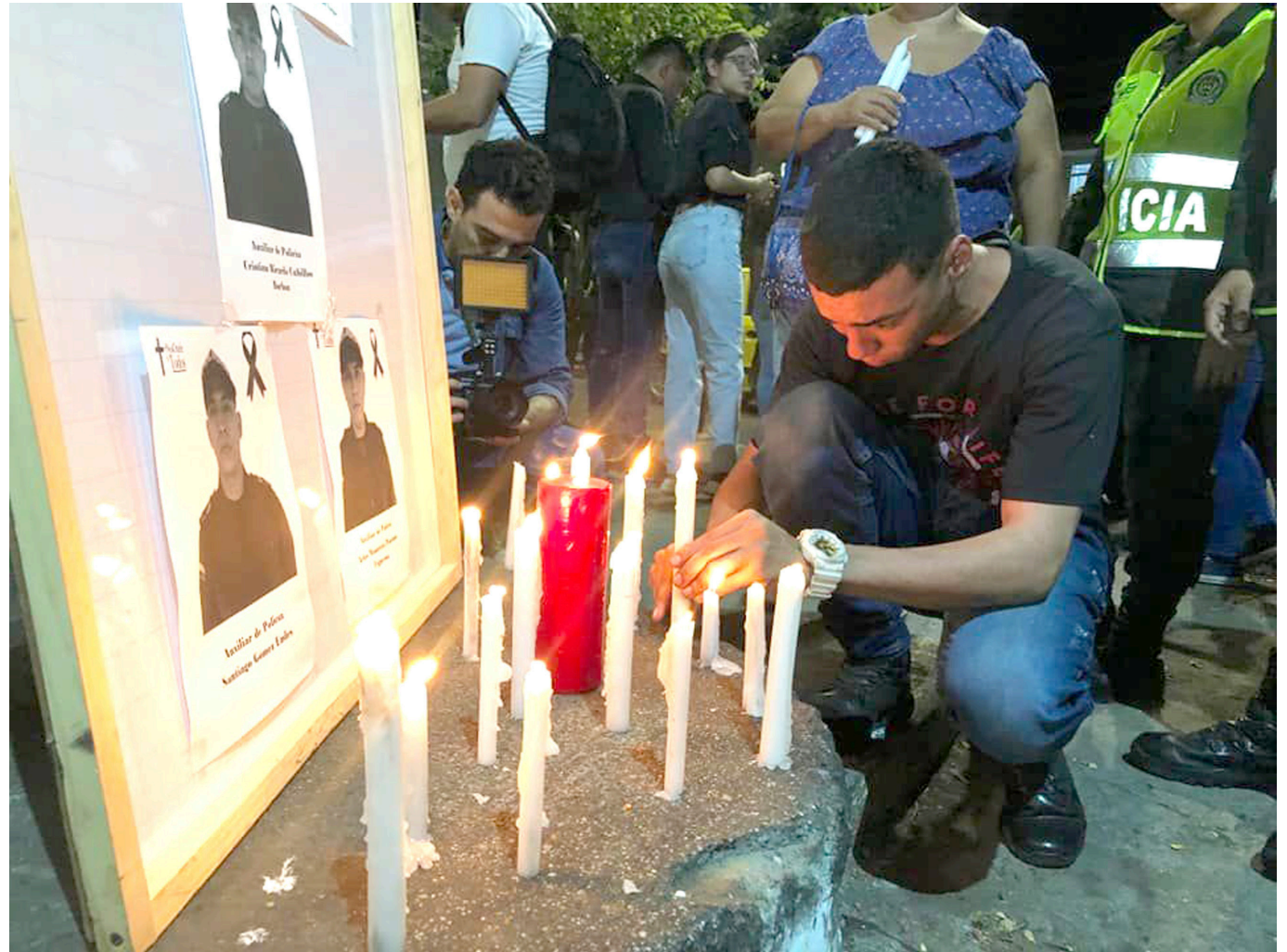
En medio de velatones se les rinde homenaje a los héroes de la Patria.