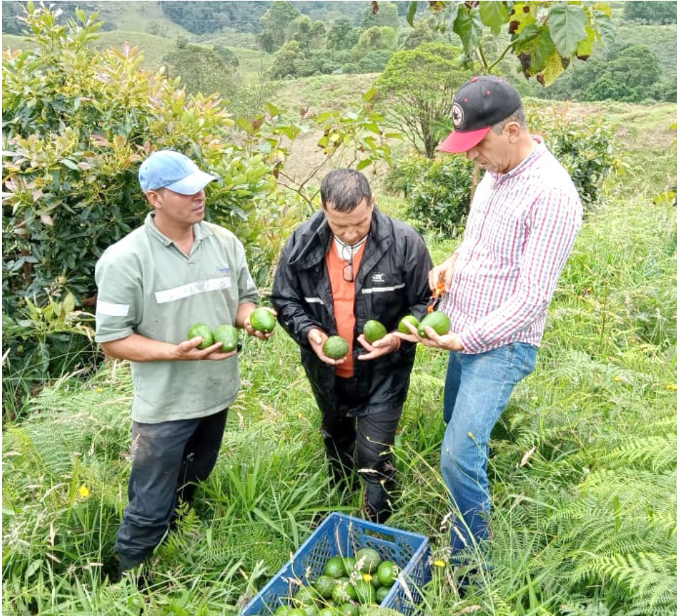
Del 100% de la producción, el 60% es para exportación y del otro 40% un 20% es de consumo nacional, el otro 20% no lo compran y está condenado a ser enterrado.

quien pueda determinar con certeza las pérdidas ocasionadas en la producción de aguacate Hass, durante las lluvias atípicas registradas durante el 2022. A diferencia de otros gremios productivos, ellos no cuentan con el talento humano para ejecutar esas evaluaciones y tener información precisa. Sin embargo, según algunas indagaciones extraoficiales realizadas con los productores, se podría indicar que han registrado pérdidas del 50% de producción en el departamento del Huila.