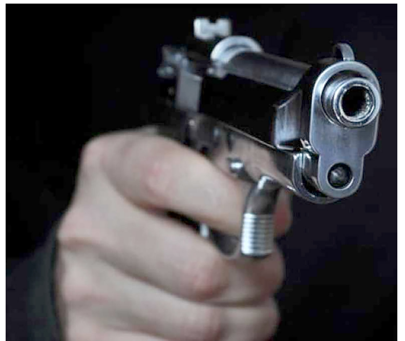
Los delincuentes llegaron armados y se alzaron con las cajas registradoras que contenía el dinero en efectivo de las ventas.