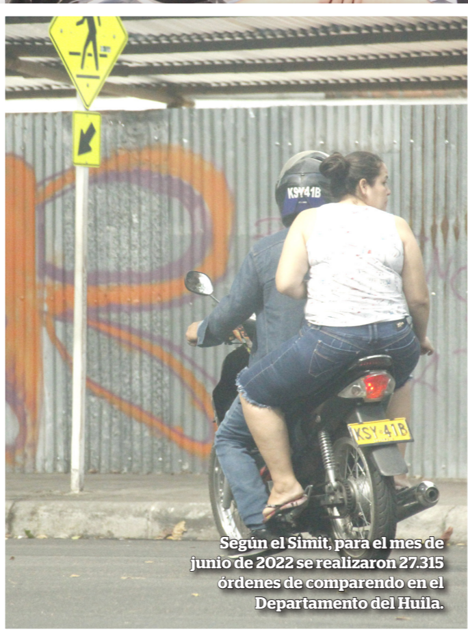
Según el Simit, para el mes de junio de 2022 se realizaron 27.315 órdenes de comparendo en el Departamento del Huila.