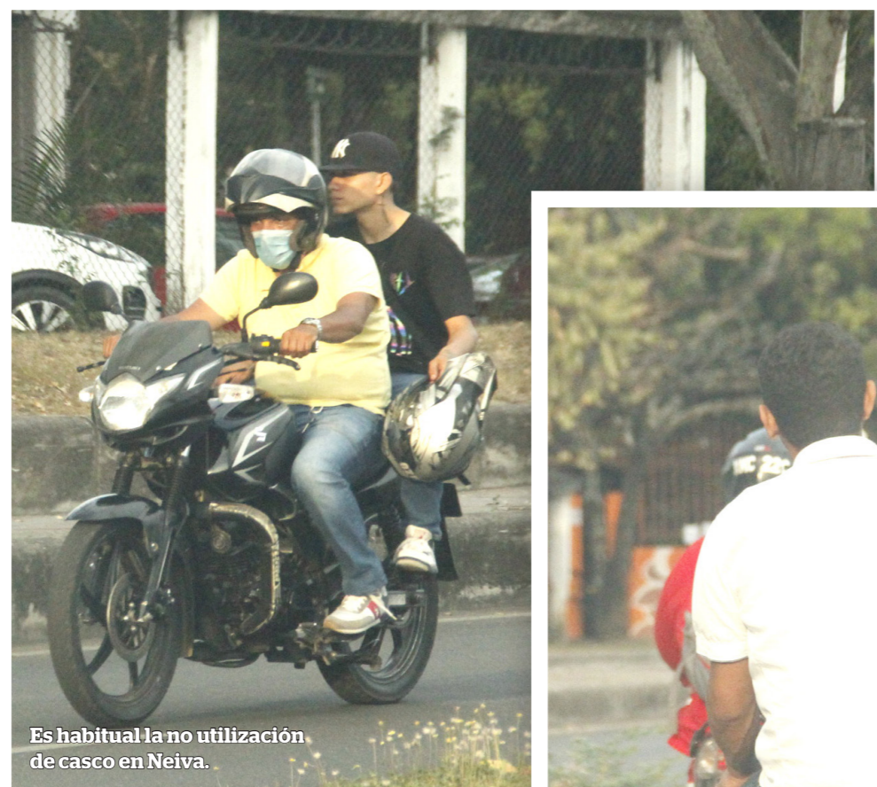
Es habitual la no utilización de casco en Neiva.