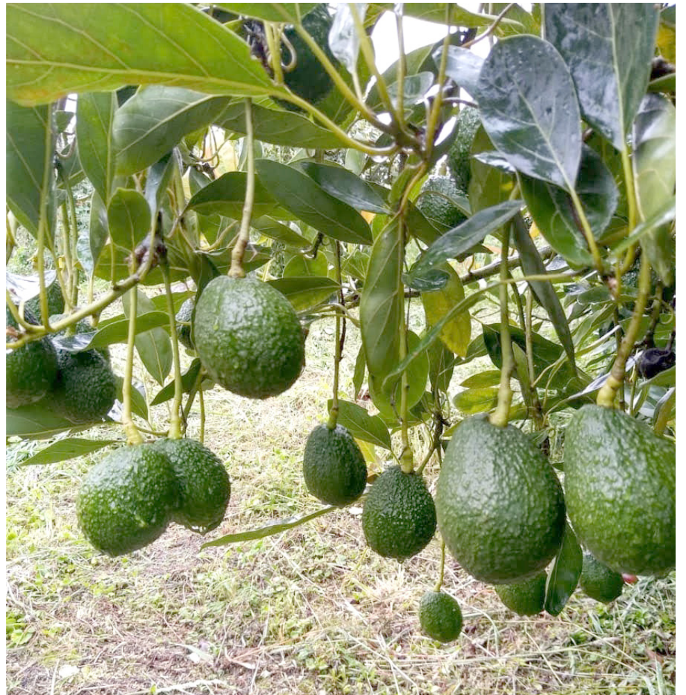
La producción de aguacate Hass cada vez aporta más a las dinámicas económicas del país.

De acuerdo con el secretario técnico de la Cadena de Aguacate, infortunadamente en el país no hay quien pueda determinar con certeza las pérdidas ocasionadas en la producción de aguacate, durante las lluvias atípicas registradas durante el 2022. Sin embargo, según algunas indagaciones extraoficiales realizadas con los productores, se podría indicar que han registrado pérdidas del 50% de producción en el departamento del Huila.