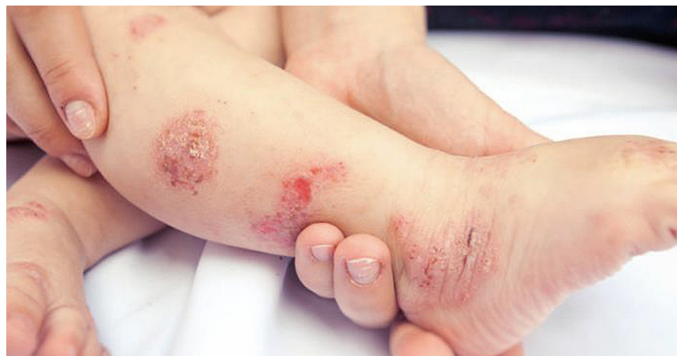
Esta enfermedad se da por un defecto genético (que usualmente es hereditario) de la barrera cutánea que produce que la piel se resienta.