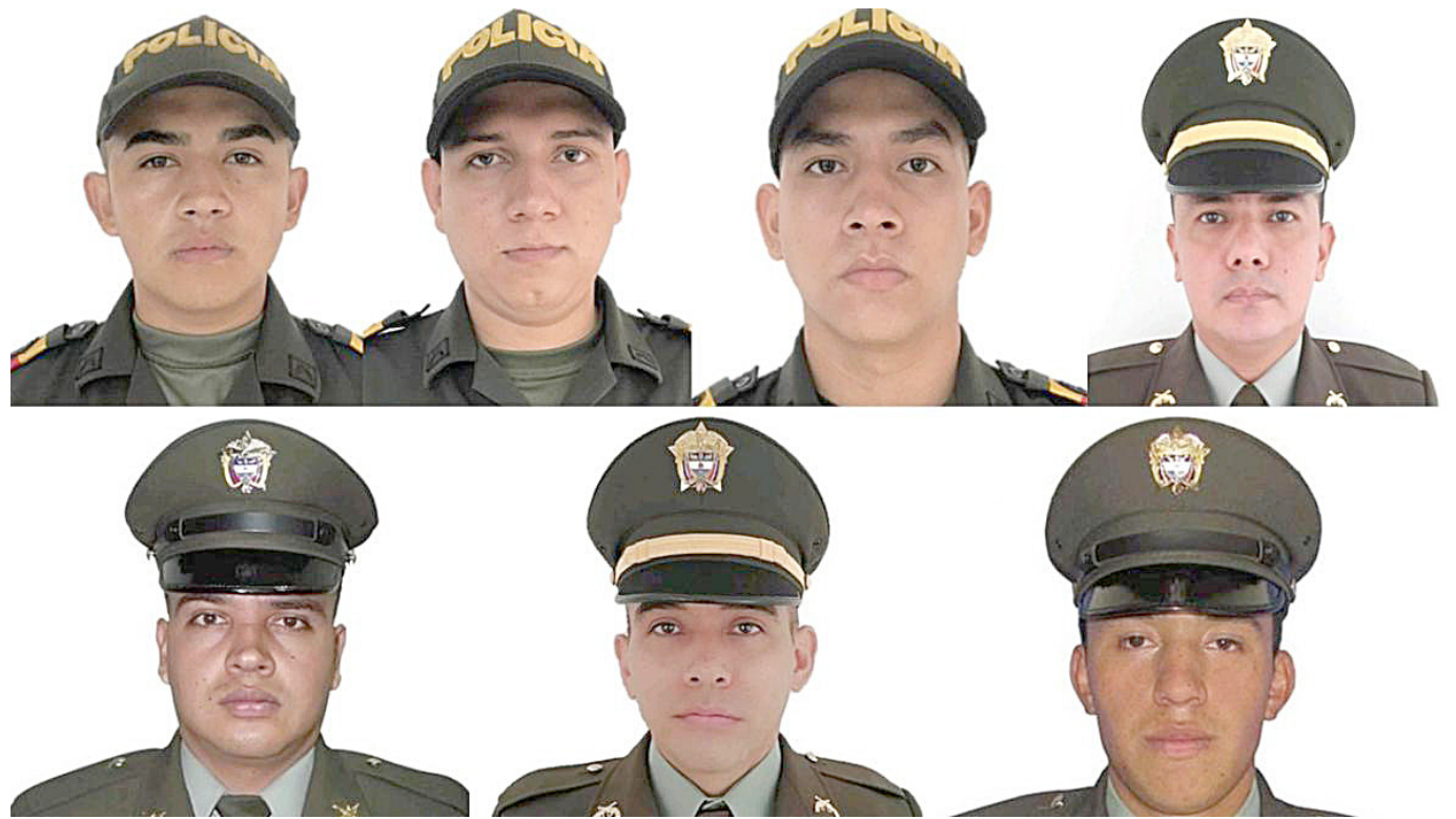
Siete son los rostros de los 7 uniformados muertos en la emboscada.

“Al parecer activaron un campo minado al paso de los uniformados y luego los remataron con ráfagas de fusil”, fueron las declaraciones dadas por moradores de la zona quienes tuvieron que recordar la época de violencia que vivió el corregimiento y que deja rastros del conflicto armado que parece no dar tregua ni en