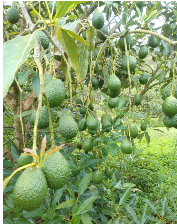
Bajo esta realidad, cada vez es más riesgoso abastecer la seguridad alimentaria.

“Hay tantas debilidades en las estadísticas de Colombia que puede uno dudar de la precisión de las mismas, pero podemos decir sin temor a equivocarnos que, según nuestras cuentas podemos estar en 2.500 hectáreas”.