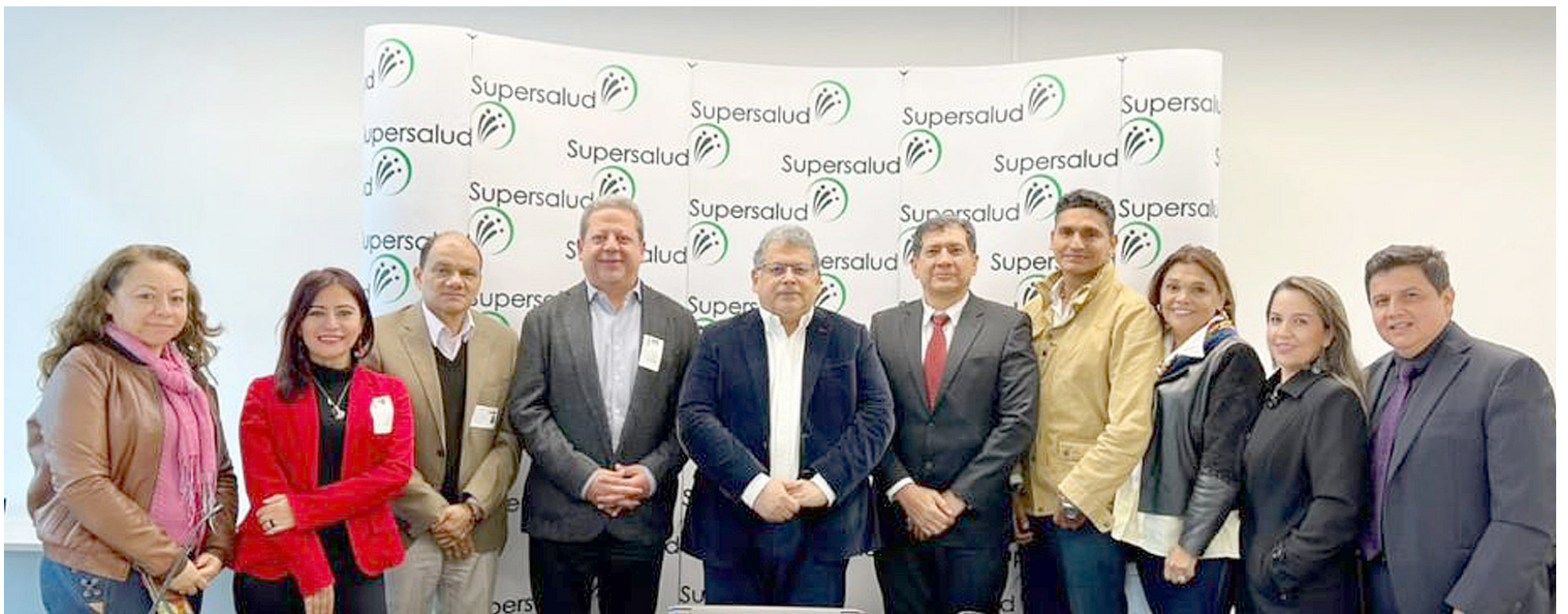
La SuperSalud hace seguimiento a cierre de EPS Comfamiliar y a las garantías para la prestación de los servicios.

■ El reciente cierre de la EPS Comfamiliar, vuelve a poner el dedo en la llaga sobre las crisis del sector salud en Colombia. 540.136 usuarios debieron ser trasladados a otras EPS, con las implicaciones que esto tiene para la red prestadora. La SuperSalud anuncia garantías para la prestación de los servicios y tratamientos a los usuarios. Entre tanto son varios los enfermos que se ven afectados.