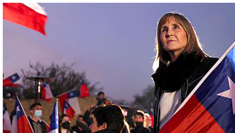
Chile rechaza por abrumadora mayoría proyecto de nueva Constitución. Con el 99,4 % de los votos, el ‘No’ se impone con el 61,8 %.

chilenos estaban citados para aprobar o rechazar una nueva Constitución que buscaba cambiar la actual carta magna que rige al país desde 1980, escrita durante la dictadura de Augusto Pinochet.