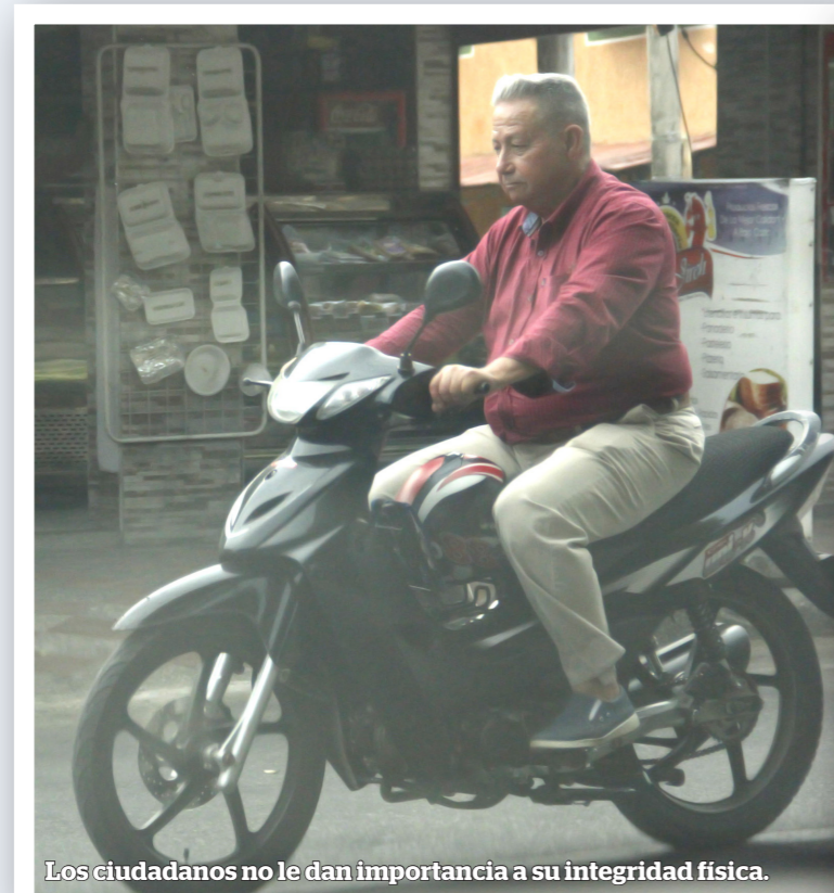
Los ciudadanos no le dan importancia a su integridad física.

En ese sentido, queda claro que el ordenamiento aludido obliga a las personas a utilizar implementos de protección cuando conducen motocicletas. Sin embargo, en la capital opita, muchas personas se 'pasan por la galleta' esta ley. Situación que resulta muy grave en el entendido del amplio número de motos que a diario circulan por sus calles, al punto de saturarse completamente algunas vías, especialmente en horas pico. A pesar que muchos comparendos se realizan cada día, algunas personas continúan negándose a acatar las normas.