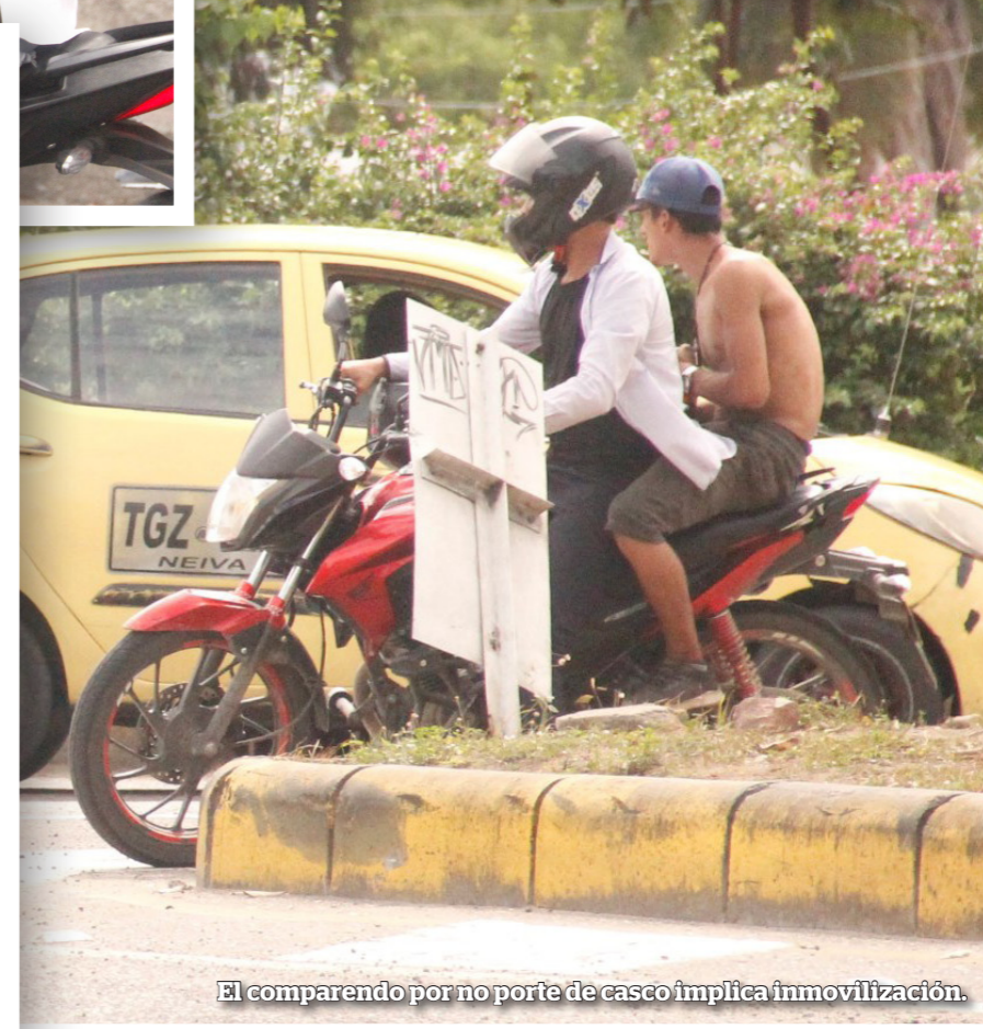
El comparendo por no porte de casco implica inmovilización.

mayo 5.079 y junio, 4.610. Como se puede observar, el mes de mayor imposición de órdenes fue mayo. En los últimos tres años, fue el 2020 el que más registró comparendos pues para el mes de junio se realizaron 6.830 para un total 28.979 órdenes durante el primer semestre.