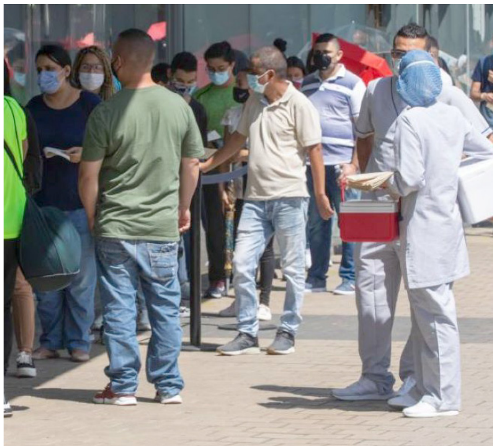
Los usuarios son los directamente afectados.

riesgo tanto la vida de sus afiliados como la estabilidad financiera de sus redes de prestación”. Producto de estos procesos, más de nueve millones de pacientes tuvieron que ser trasladados a otras EPS.