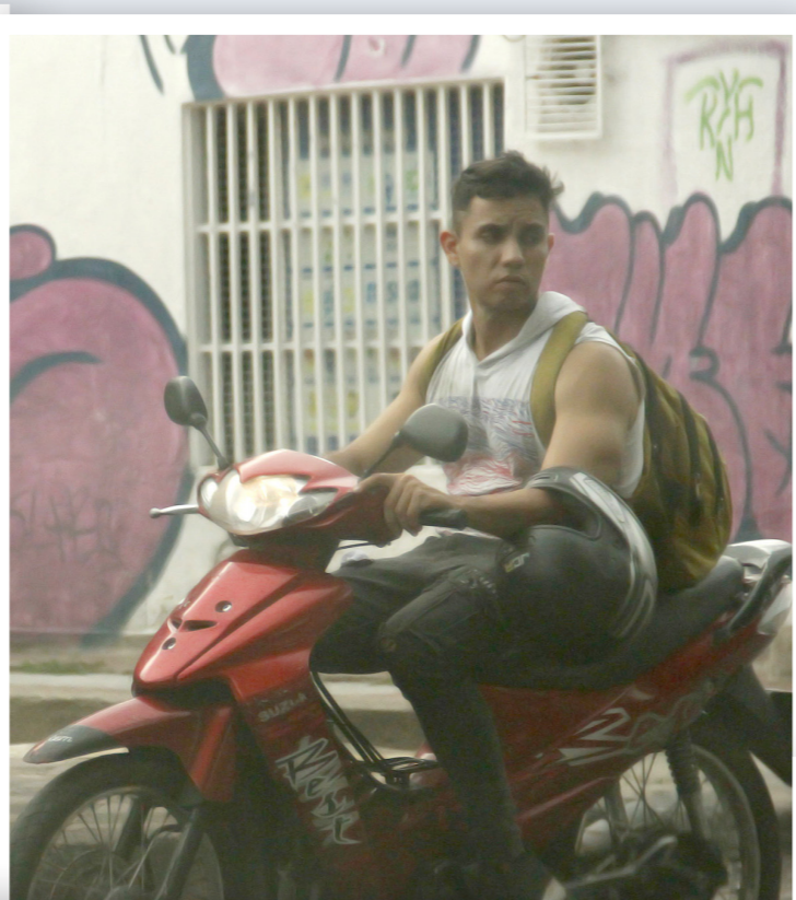
El comparendo por no utilización del casco es el más frecuente.