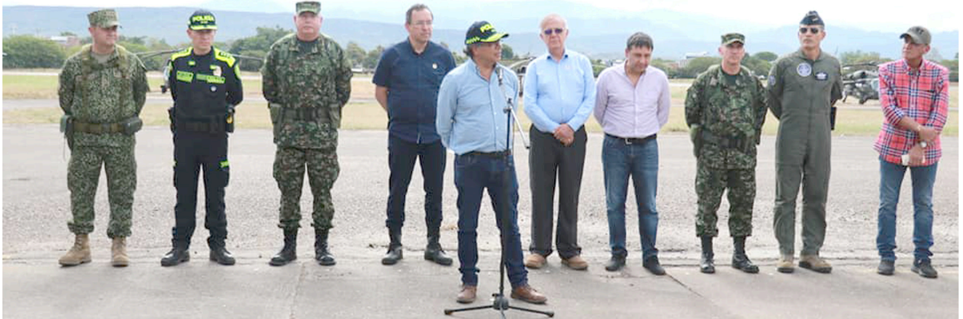
El presidente de la República Gustavo Petro llegó a la ciudad para apersonarse de la situación y luego de recorrer la zona hizo varios anuncios.

maleza que le sirvió de camuflaje para poder escapar del sitio de los hechos antes de que llegaran los asesinos a rematar a sus 7 compañeros; la idea era no dejarlos con vida, razón por la cual no bastó un artefacto explosivo, sino que el odio y el resentimiento entraron en forma de ráfaga de balas al cuerpo de los uniformados.