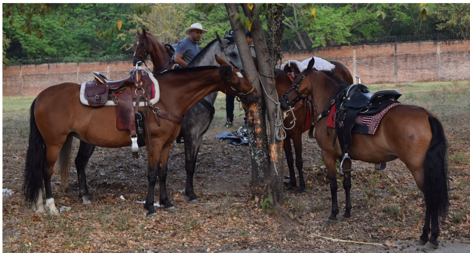
El respeto por los animales debe ser una prioridad.

Las festividades de San Juan y San Pedro seguirán siendo una parte integral de la identidad de Neiva y del departamento del Huila, pero es necesario que evolucionen para reflejar los valores contemporáneos de respeto y protección hacia todos los seres vivos.