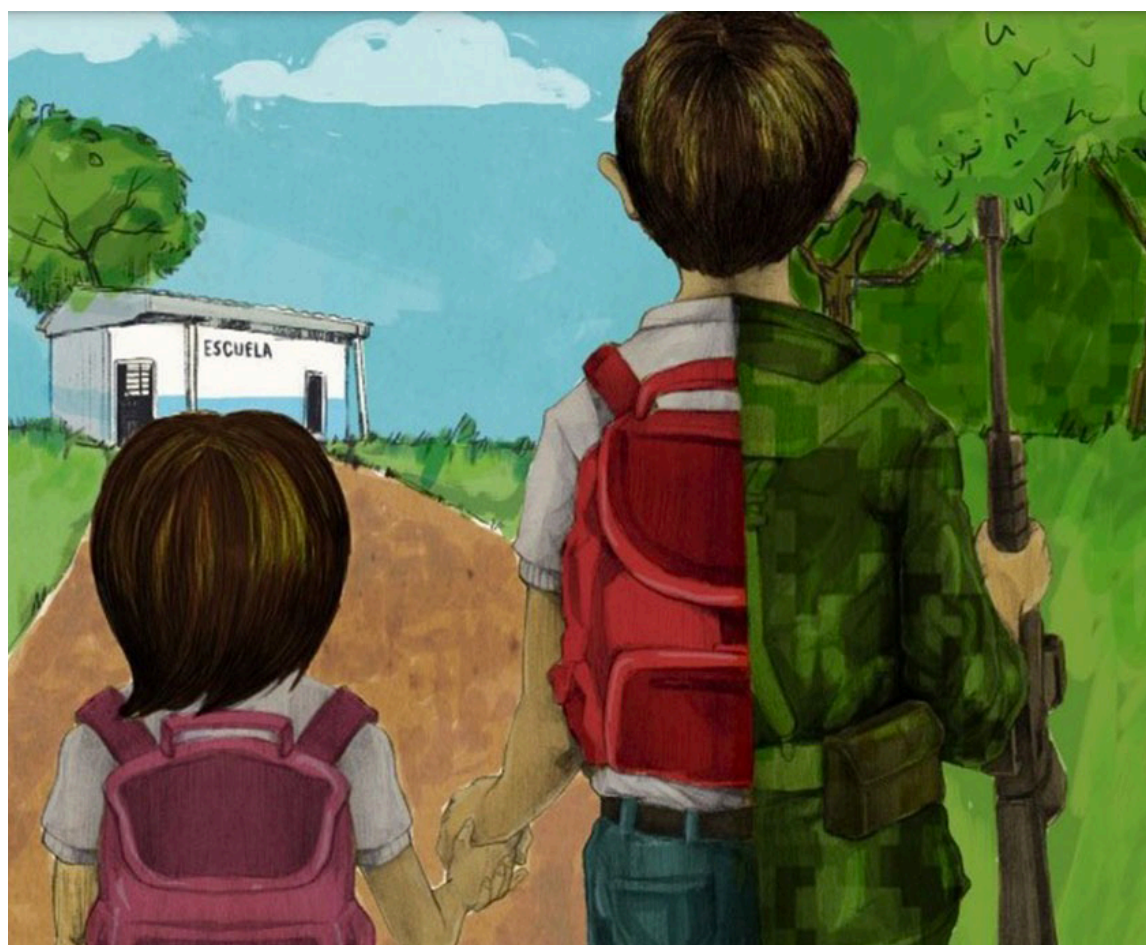
Las Disidencias extorsionan a las familias para que les entreguen a sus hijos, de lo contrario deben abandonar sus territorios.

La ejecutiva, agregó que han tenido numerosas denuncias por fraude, hemos encontrado, tramitadores, personas inescrupulosas, prestan sus ‘servicios’ aparentemente y ellos solo esperan acceder altos porcentajes de las indemnizaciones y los trámites no tienen ningún costo. “La invitación es a denunciar casos, donde le estén pidiendo dinero para adelantar cualquier trámite”.