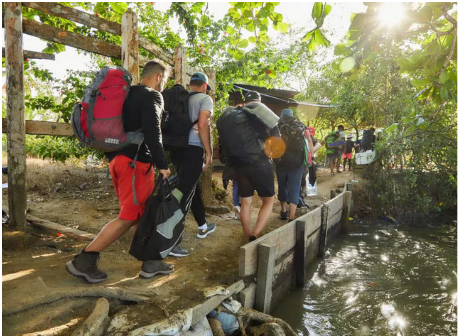
A Neiva en este 2024, llegaron 600 personas desplazadas por la violencia.