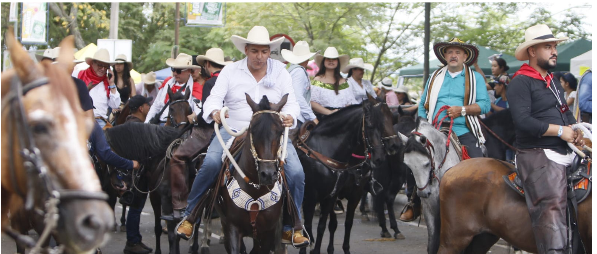
Las cabalgatas son una tradición que se remonta a varios siglos atrás.

Las festividades de San Juan y San Pedro en Neiva, Huila, son una tradición profundamente arraigada en la cultura local. Cada año, durante el mes de junio, la ciudad se llena de música, danzas y eventos tradicionales, siendo las cabalgatas uno de los principales atractivos. Sin embargo, este año las cabalgatas han generado una fuerte controversia debido a las denuncias de maltrato animal.