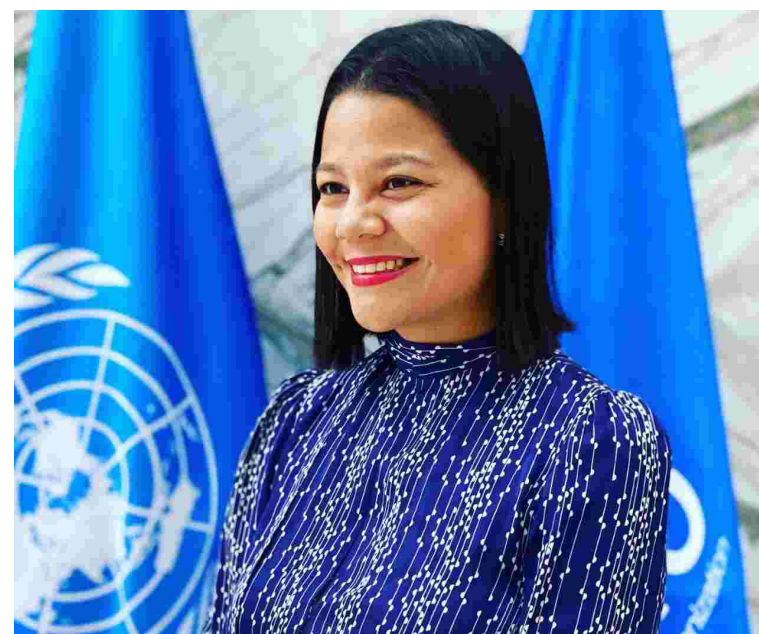
Figura de la semana

Vea columna completa en www.diariodelhuila.com