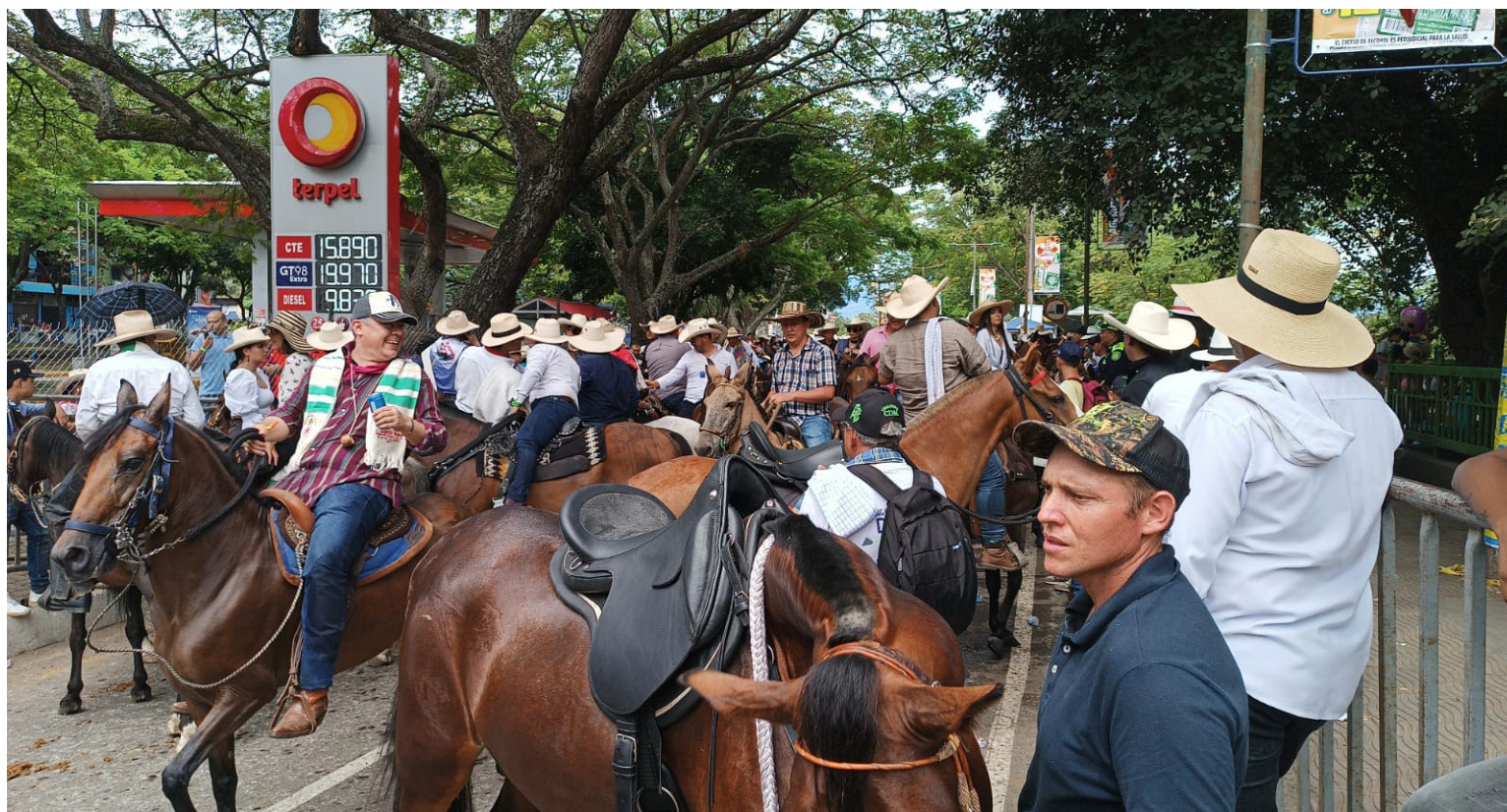
Preocupación por el maltrato animal observado durante las cabalgatas.

“No necesariamente. Lo importante es que se implementen me-