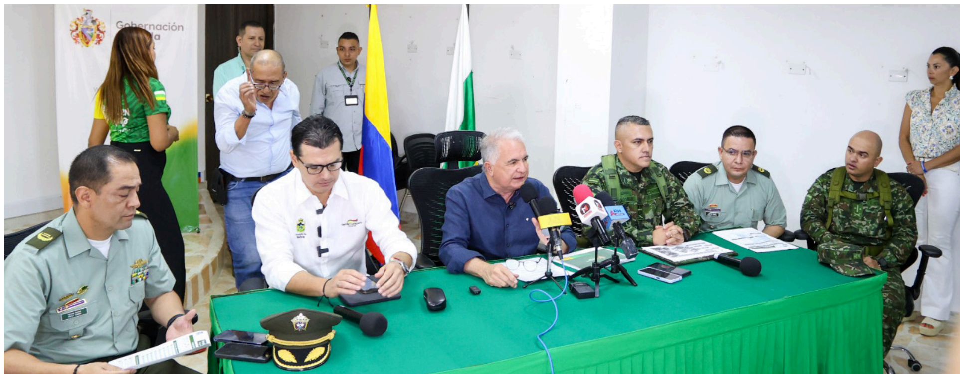
Las autoridades gubernamentales, policiales y militares, entregaron un balance de las festividades.

más visibles de la ciudad que es algo elemental. Por lo anterior, desde nuestra Administración Municipal, empezamos a embellecer algunos sitios, como el puente ‘El Tizón’ que es la ‘puerta’ de entrada a la ciudad, además adelantamos un plan de ornato para este fin”.