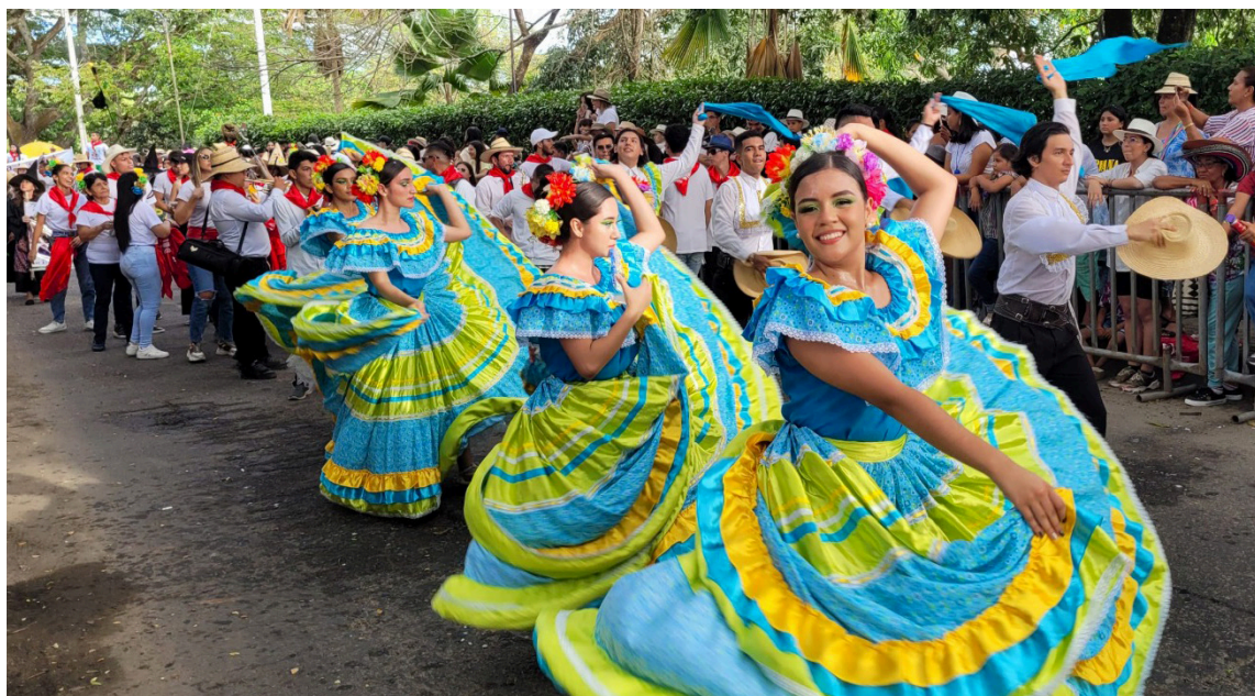
La Gobernación del Huila, va a evaluar las actividades ‘Sampedrinas’.

El mandatario, agregó que hubo reducción de delitos en el Departamento, en cuanto al homicidio, se redujo el homicidio en