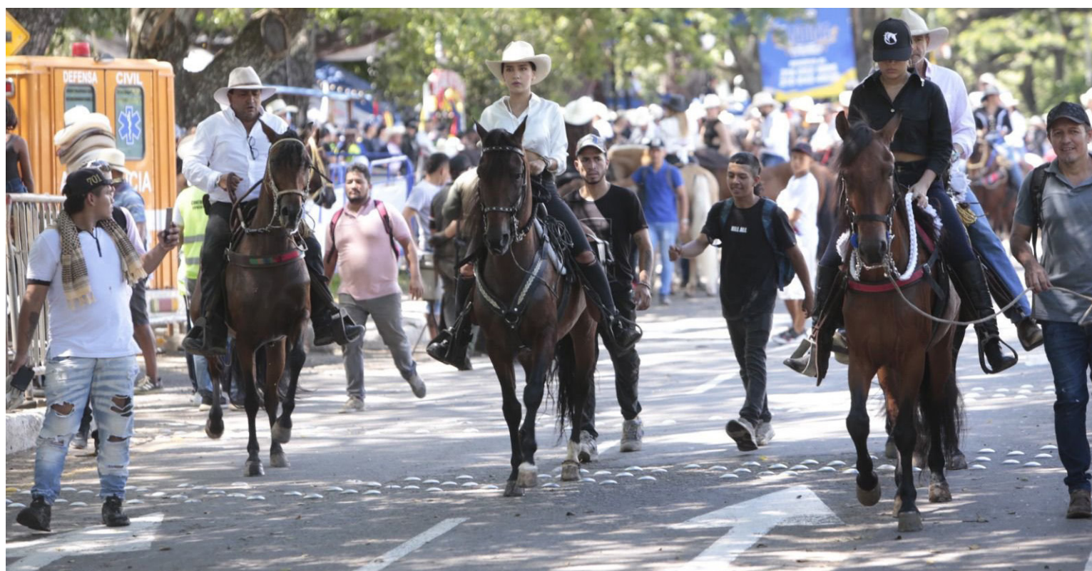
Desde Asobares indicaron que la cabalgata ‘Cacica Gaitana’ fue un fracaso.

El directivo, se mostró solidario con los vendedores ambulantes, porque este año adquirieron las carpas, “y vi a algunos de ellos llorar, porque realizaron una inversión y no lograron ganancias, y allí le llamó la atención a CorpoSanpedro, para que cuando tomen la decisión de realizar esos cambios, primero tienen que estudiar cuales son las consecuencias. Ellos no tuvieron en cuenta a los gremios”.