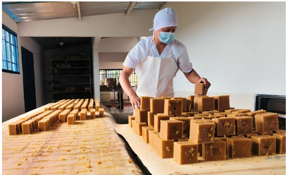
Hace falta apoyo para que los productores se tecnifiquen.

■ En el municipio de Isnos, existen 400 establecimientos dedicados a la producción de panela y solo 20 han sido apoyados por el Gobierno Nacional y para que no haya sobreproducción, se regulan los tiempos y en cuanto a cantidad ofertada, cada tres días, producen 5.000 bultos de este endulzante.