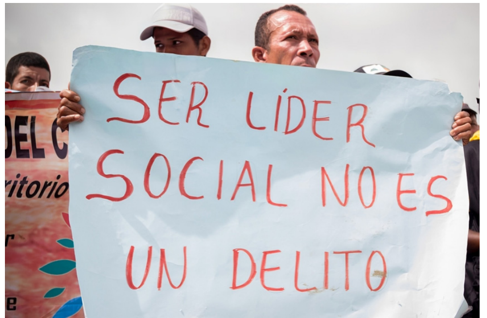
La MOE señaló que en el 2024 las cifras de agresiones han aumentado.