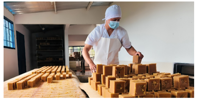
Paneleros sin apoyo en el Huila