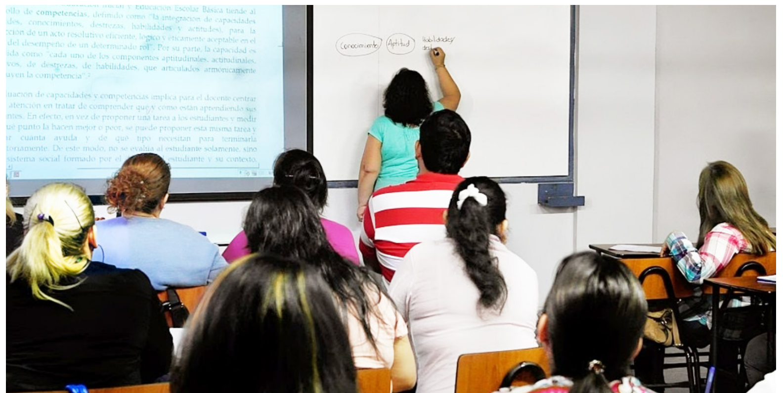
Hay dos casos de profesoras, asediadas en las comunidades donde laboran, hechos que ya son investigados.

Según fuentes extraoficiales, el afectado alcanzó a ser trasladado al Hospital San Antonio de Padua, donde desafortunadamente, perdió la vida a causa de las gra-