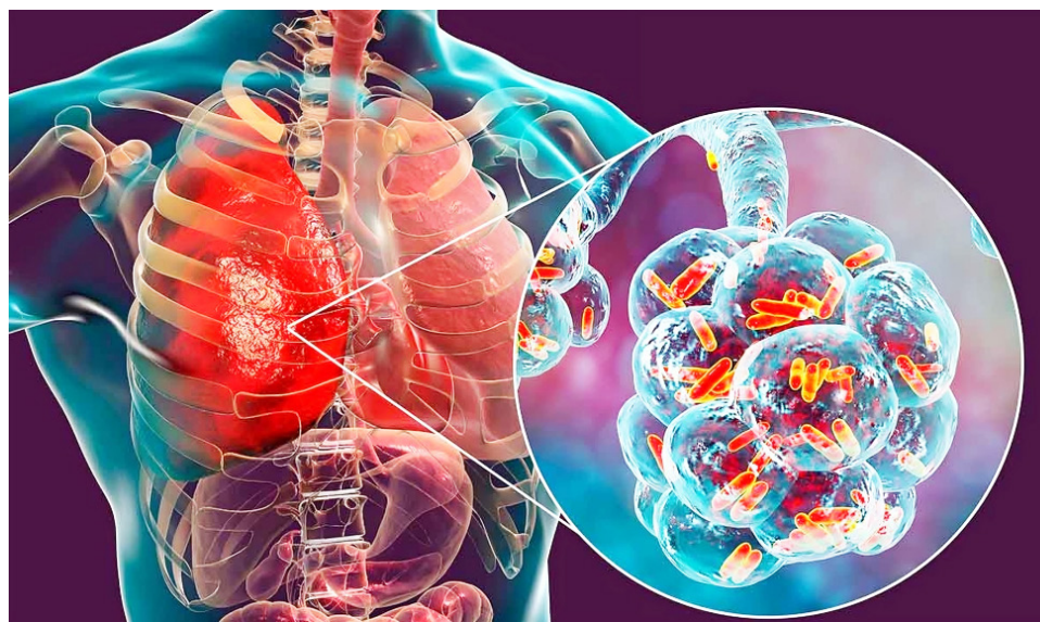
Cuando se contagia en niños menores de cinco años, la causa de la infección en el 95 por ciento de los casos son virus de buen pronóstico, pero un pequeño porcentaje puede padecer varias complicaciones, entre ellas otitis, sinusitis y neumonía.