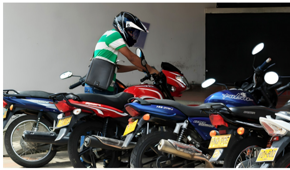
Hurtos y asesinatos tienen en 'jaque' a la capital opita