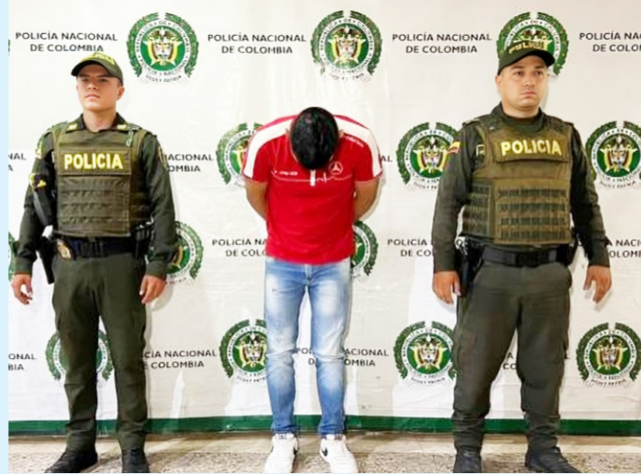
En estos siete meses se han desarrollado en total 1065 capturas, entre 7 y 10 personas a diario.