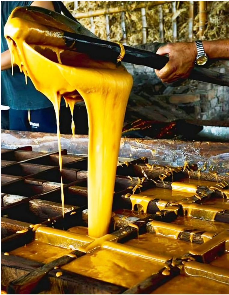
En Isnos regulan la producción de panela para no afectar el precio.