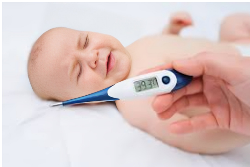
La Infección Respiratoria Aguda (IRA) constituye un grupo de enfermedades que se producen en el aparato respiratorio.

A pesar de una ligera disminución en comparación con el año anterior, la situación sigue siendo crítica, con áreas del país mostrando variaciones significativas en los casos. La alta incidencia de virus respiratorios y la falta de respuesta efectiva destacan la urgencia de medidas preventivas y de tratamiento para proteger a los más vulnerables.