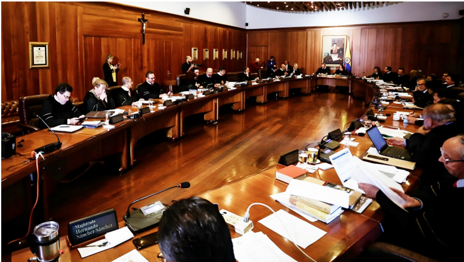
Consejo de Estado ordenó, 25 de enero de 2024, nombrar de inmediato a comisionados de la Creg.

normas dentro de un marco regulatorio”, resaltando la importancia de respetar la división de poderes y competencias establecidas por la ley.