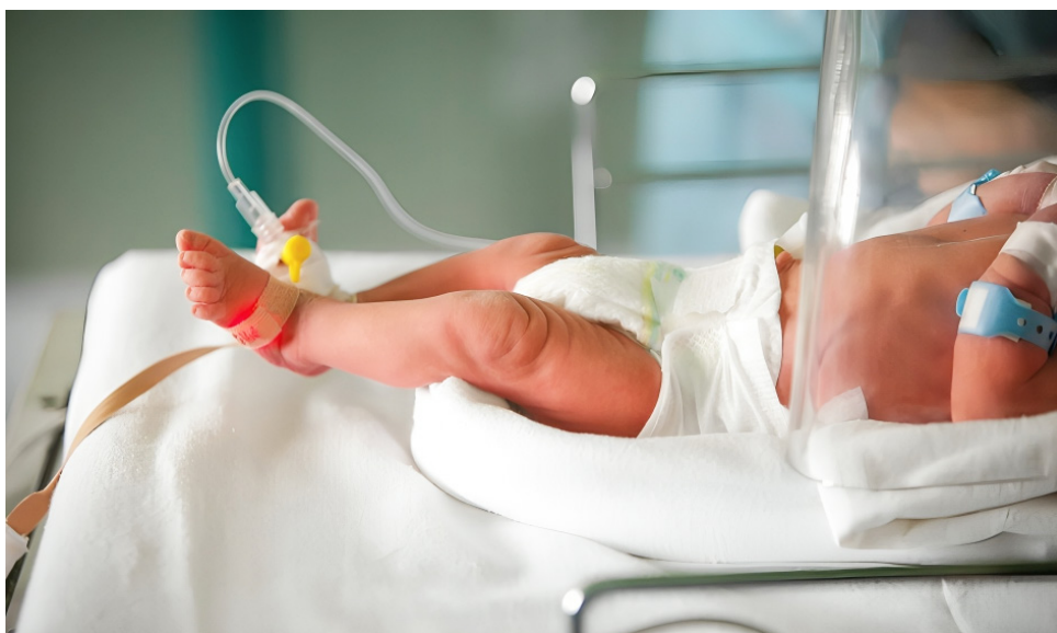
La Infección Respiratoria Aguda (IRA) constituye un grupo de enfermedades que se producen en el aparato respiratorio.

riaciones significativas en la cantidad de muertes probables en diferentes regiones del país. Departamentos como Chocó, Atlántico, Tolima, Risaralda, Vichada y Antioquia, así como Bogotá, han mostrado diferencias notables en las muertes notificadas. A nivel municipal, ciudades como Uribe, Cumaribo, Medellín, Magangué, María la Baja, Bajo Baudó, Riohacha, Ciénaga, Puerto Gaitán (Meta) y Barrancabermeja también han experimentado importantes variaciones en los casos reportados.