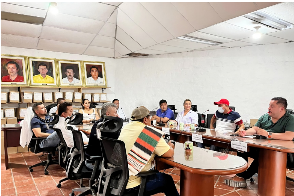
Tres concejales de Rivera han sido amenazados este año.