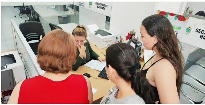
Ojo, se vienen cambios en el Impuesto Predial y el ICA en Neiva