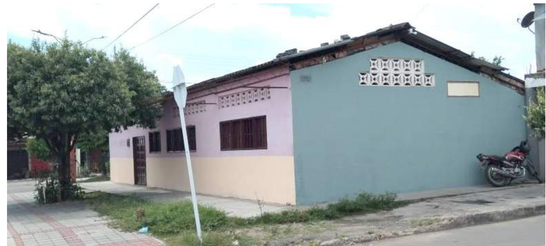
Este era el lugar en donde funcionaba el puesto de salud.