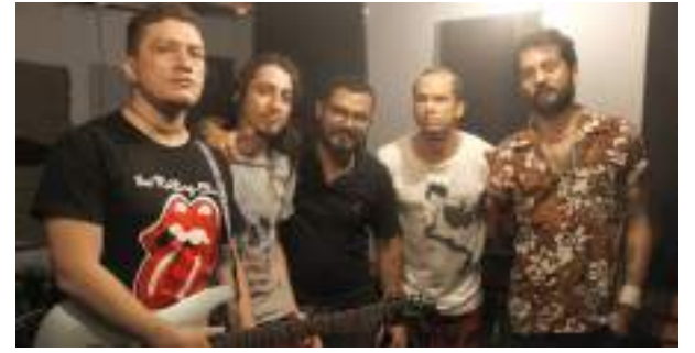
Bandas de rock hacen música con las uñas