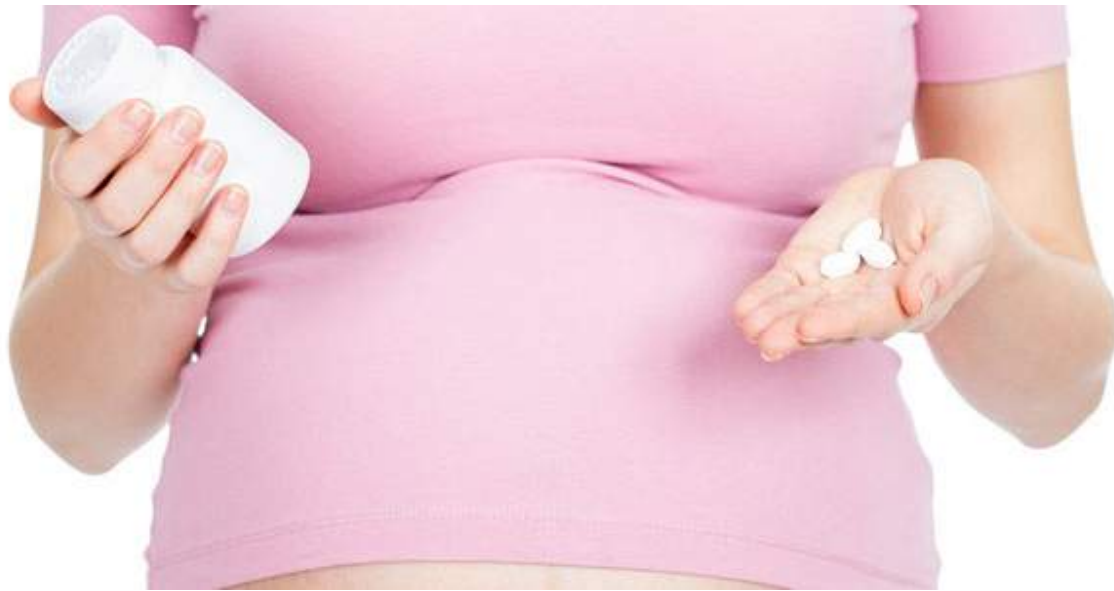
El acetaminofén en el embarazo no es recomendable.

Según Sznajder, su nuevo estudio confirma estas tendencias y también fue el primero en observar una asociación entre el uso de paracetamol durante el embarazo y los problemas de sueño de los niños.