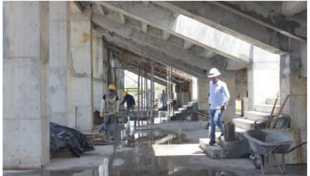
Se espera que en diciembre ya sea culminada la obra

sala de enfermería y el componente eléctrico”, puntualizó.