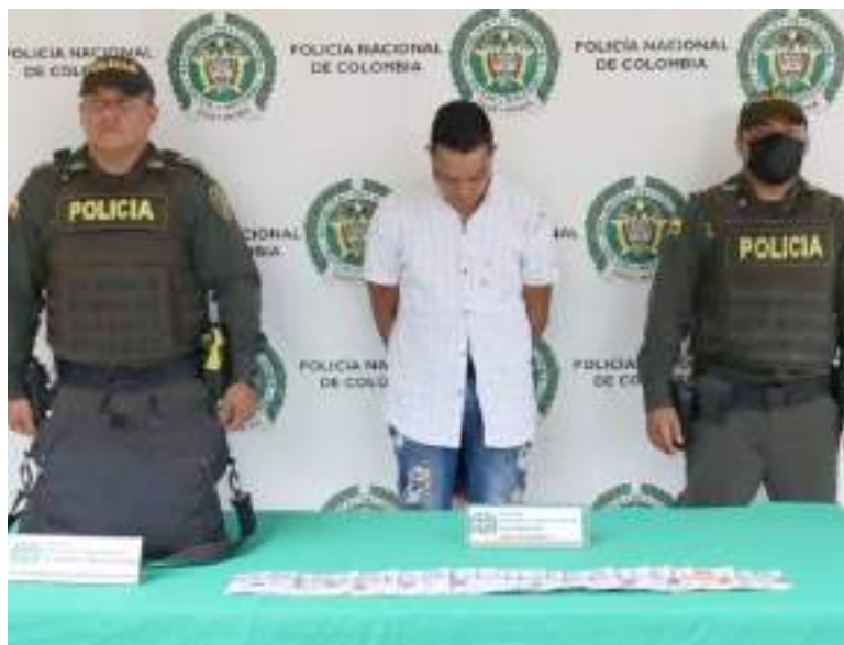
Capturado en flagrancia