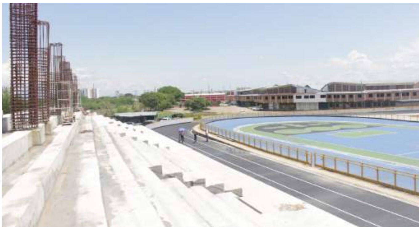
Aún falta una tercera fase que comprende el alumbrado pública y luminaria

La ilusión es grande y no es para menos, pues el escenario deportivo se alcanzó a denominar como uno de los tantos 'elefantes blancos' existentes.