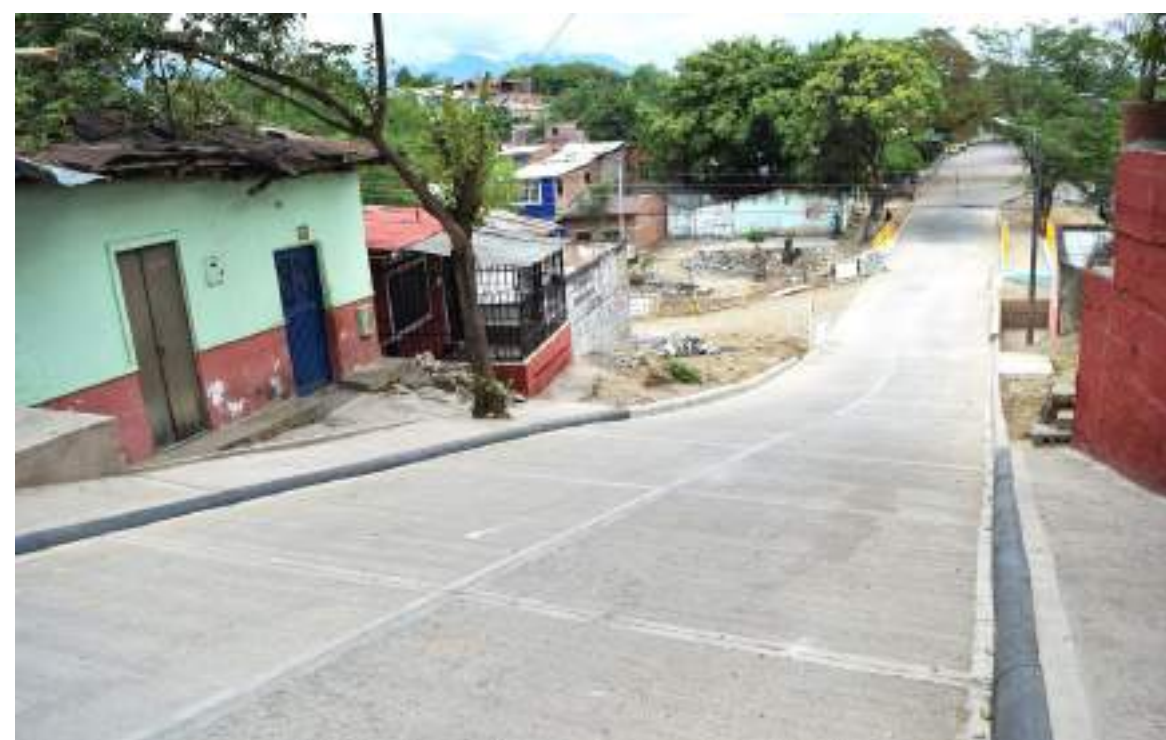
Calle que comparten con Ventilador.

Este caso es un llamado a los habitantes de todas las comunas en la ciudad para que formen parte de sus organismos de representación comunitaria, como son la JAC, pero que sean proactivos en esos organismos.