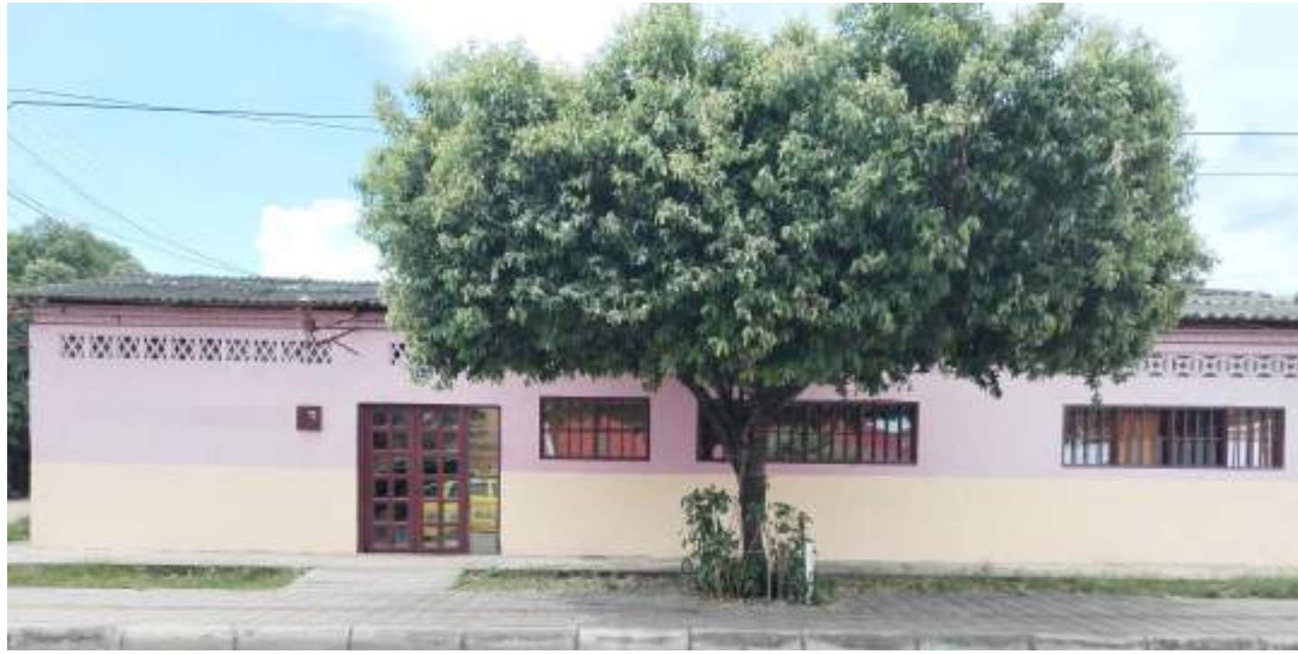
Una de las viviendas en litigio por parte de la JAC del barrio San Martín