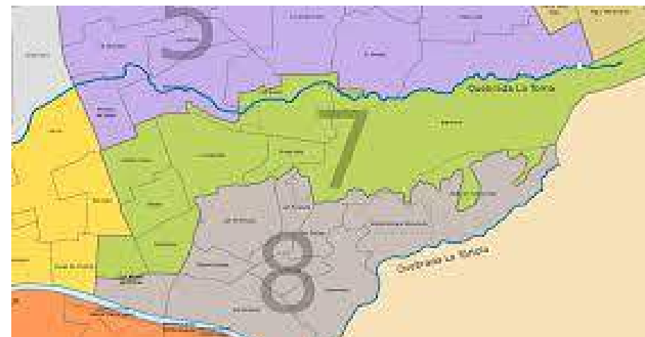
El barrio pertenece a la comuna siete de Neiva.

Los integrantes de la recién elegida y reconocida JAC del barrio San Martín, se encontraron con toda una 'papa caliente' al asumir y querer tener control sobre todos los bienes que deben administrar