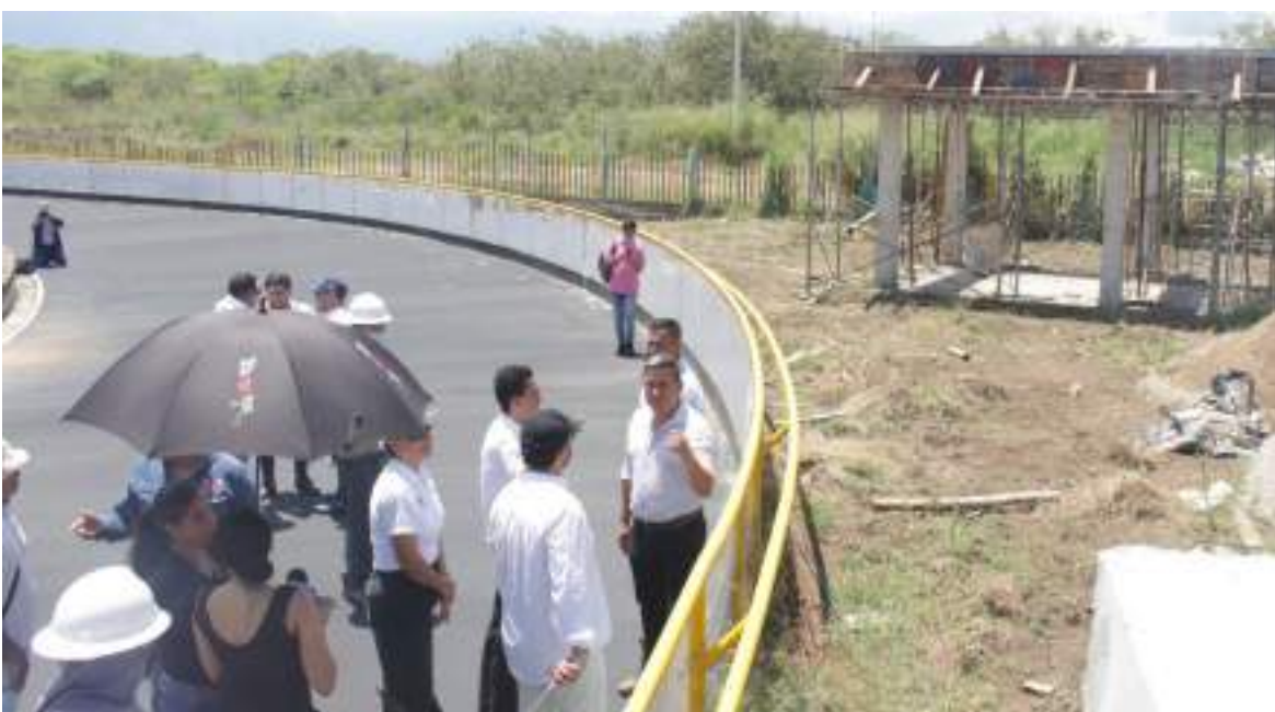
La segunda fase de este proyecto terminaría con una inversión mucho más alta de la prevista

Finalmente, el espacio que contará con seguridad en la entrada será entregado en diciembre y se espera que en febrero se pueda estar avanzando con su utilización. Diario Del Huila, intentó comunicarse con la secretaria de Deporte para conocer especificidades de la entrega, pero infortunadamente, no se logró el espacio para entregar dicha información.