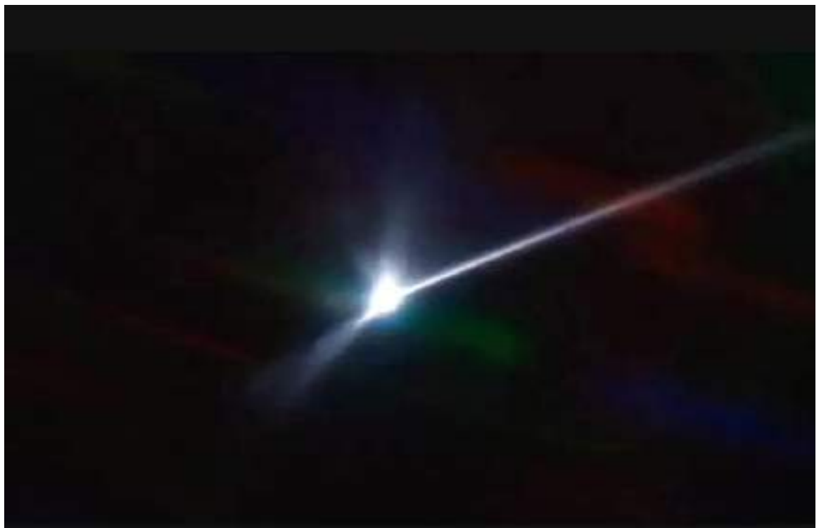
Una nueva imagen reveló que el asteroide que fue impactado deliberadamente por la sonda Dart de la NASA dejó un rastro de escombros que se extiende por miles de kilómetros. Un telescopio en Chile capturó la notable imagen de una estela similar a un cometa que se extiende detrás de la roca gigante.