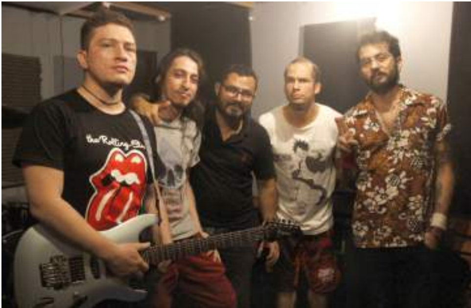
Amigos casuales hacen música en Nokrono.