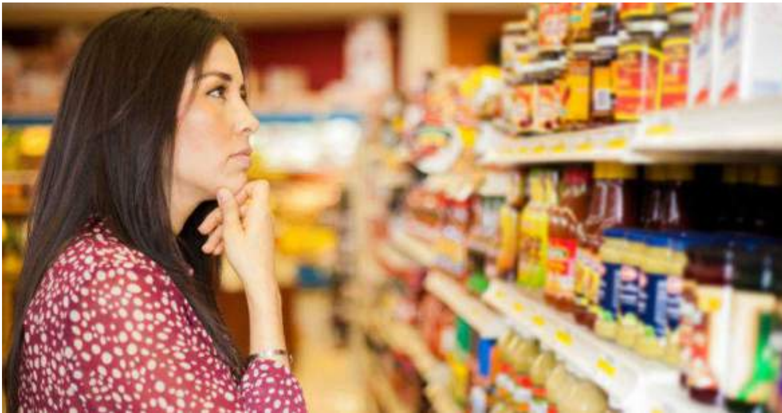
El costo de vida afecta mucho más a las personas de bajos recursos.

Es así como las medidas de aumentar las tasas de interés, lo que busca a mediano y largo plazo, es “aumentar el desempleo, haciendo que se abaraten los costos de la mano de obra, y eso ayuda a que las empresas y la economía de capital, pues abaraten sus costos y sigan produciendo. Muy contrario sería una política económica, que, en vez de subir las