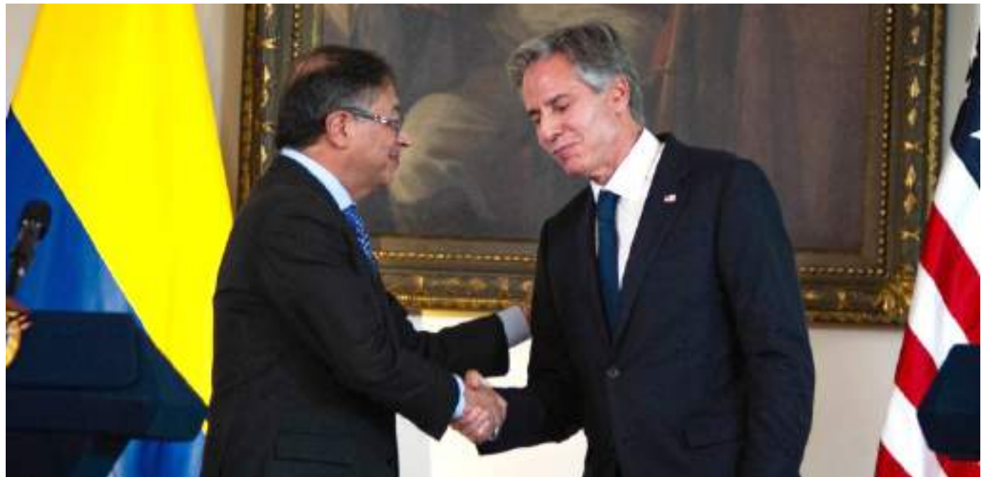
Estrechón de manos a la izquierda el presidente de Colombia Gustavo Petro, y a la derecha secretario de estado Antony Blinken

El secretario de Estado de Estados Unidos Antony Blinken, es el segundo alto funcionario del gobierno Biden en visitar territorio colombiano desde que Gustavo Petro es presidente.