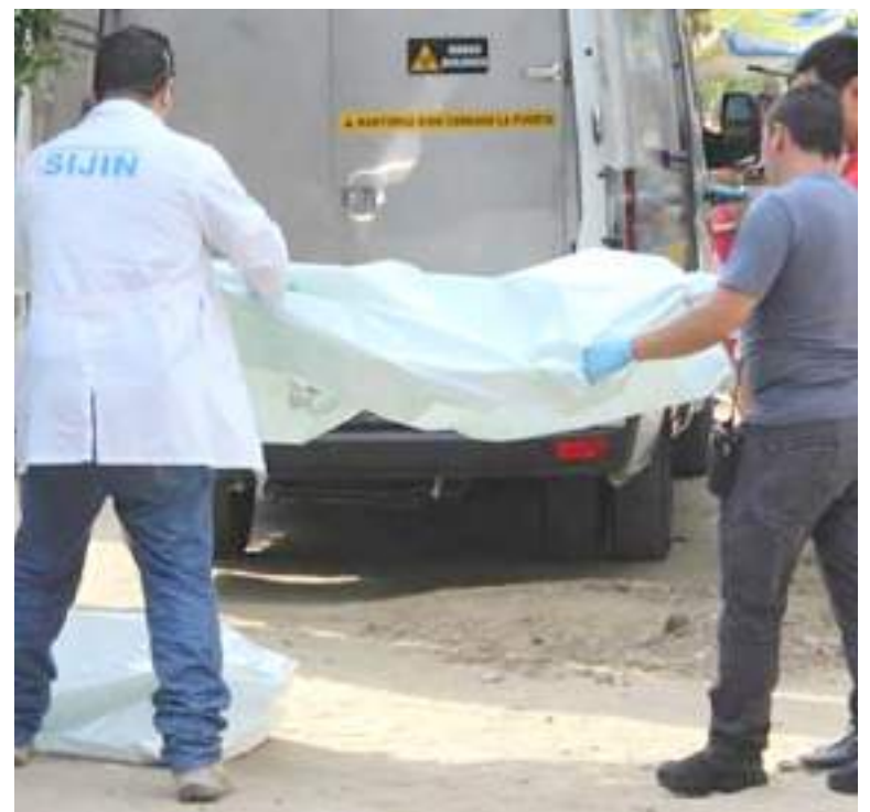
El crimen se cometió en Pitalito

por los delitos de homicidio agravado y hurto calificado y agravado, por los que no aceptó su responsabilidad. Otros cuatro