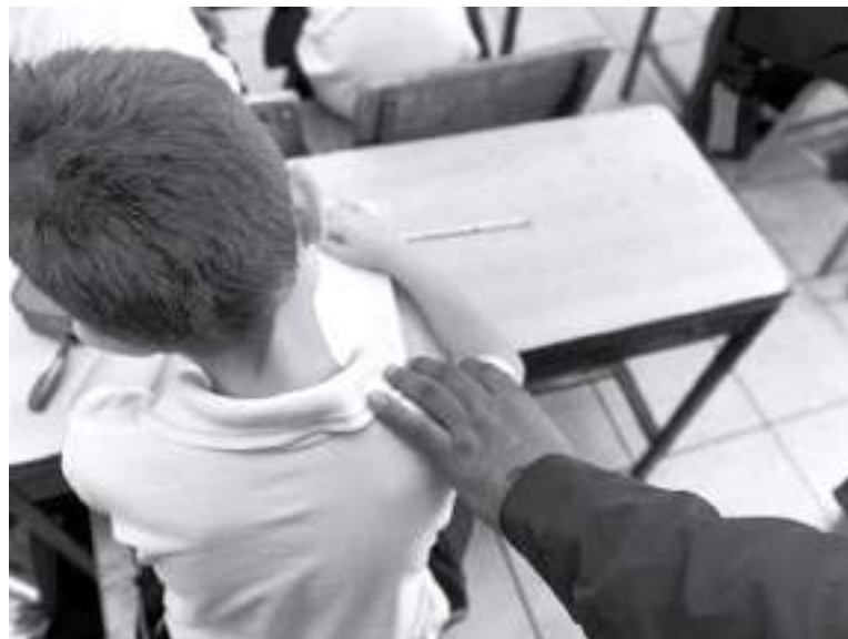
Hasta donde ellos conocen en el departamento opita hay más de 30 procesos que avanzan a pasos de tortuga y solamente les dan trámite de escritorio

poca contundencia con la que se interponen las denuncias.