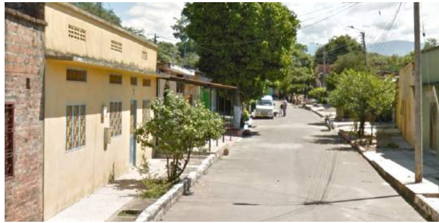
Unas de las vías principales en San Martín.