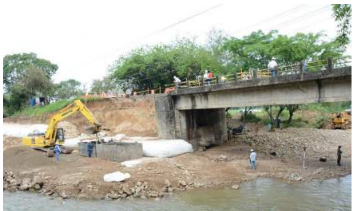
Luego de habilitado el paso por el puente alternativo, se siguen los trabajos de reconstrucción de la vía principal.

Por el momento se encuentran enfocados los trabajos en la unidad funcional 3, es posible que se hagan unas intervenciones antes de lo previsto puesto que se cuenta con la licencia ambiental,