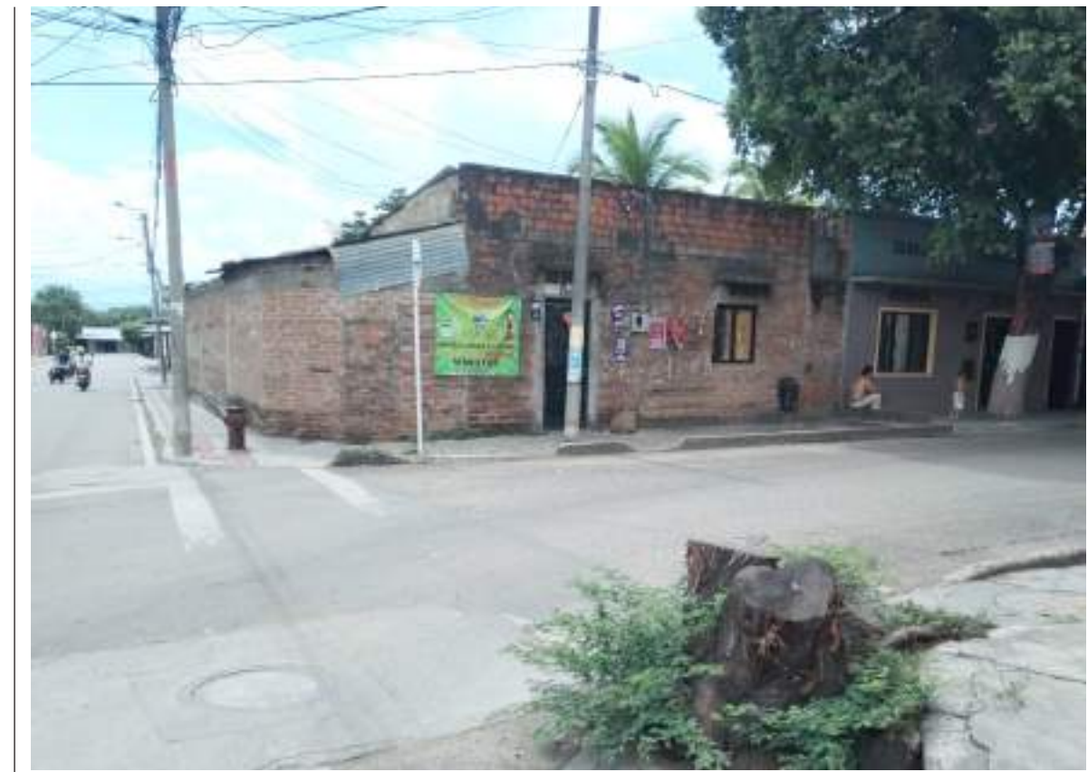
Casa del club de amas de casa.

"Los bienes e inmuebles públicos no se pueden vender ni enajenar. En caso de ser de la comunidad, debe de ser la asamblea de afiliados la que debe decidir que hace con esos bienes inmuebles".