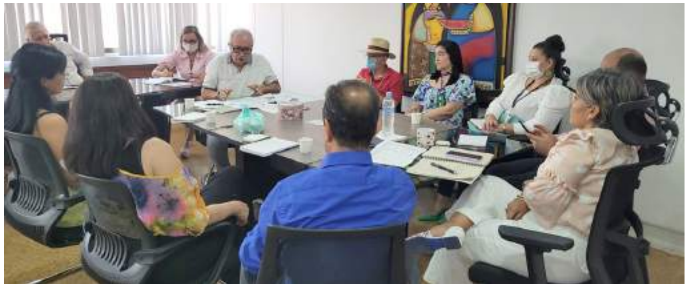
La violencia sexual en los planteles educativos es una situación que viene preocupando.

Las instituciones educativas afrontar una realidad lamentable que viene preocupando a la institucionalidad, se trata de la violencia sexual que se vive precisamente al interior de algunos planteles formativos.