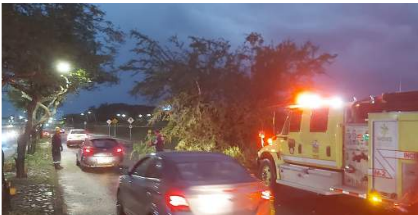
Carrera segunda, con avenida pastrana, cerca del denominado centro de eventos club del norte.

La carrera 1, es una de las principales arterias secundarias del barrio cándido que conduce al centro de salud del barrio, al colegio INEM de ese sector, y al ser principal conexión con la carrera segunda que va de norte a sur de la ciudad.