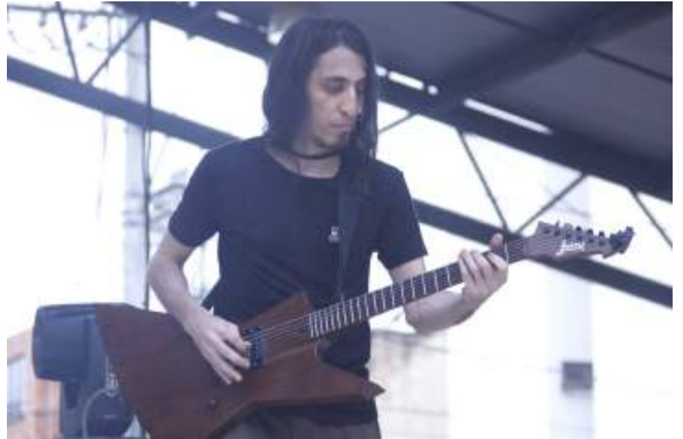
El bajista marca el ritmo al que se toca.