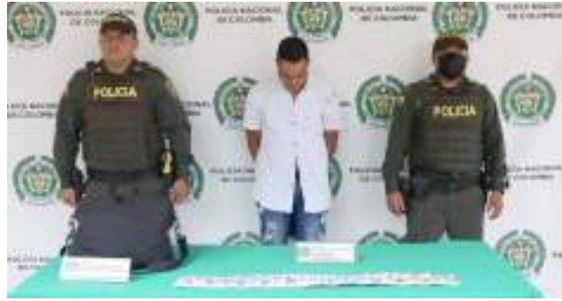
Capturado en flagrancia