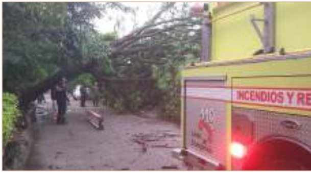
A prepararse para las lluvias