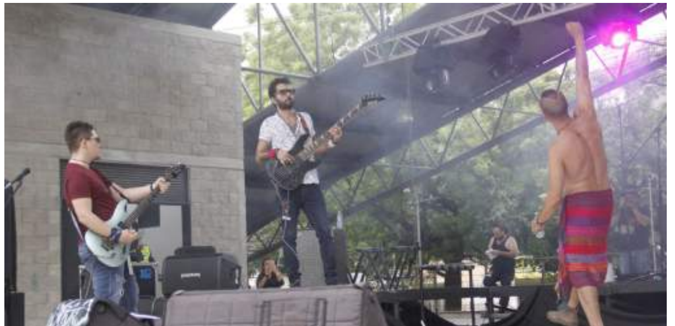
Presentación en el Festival de Neiva.

“La banda surge de la necesidad de hacer música de un grupo de músicos que nos conocimos de manera casual, surgió la idea de hacer un proyecto musical, en mi caso nunca había estado con una banda”.