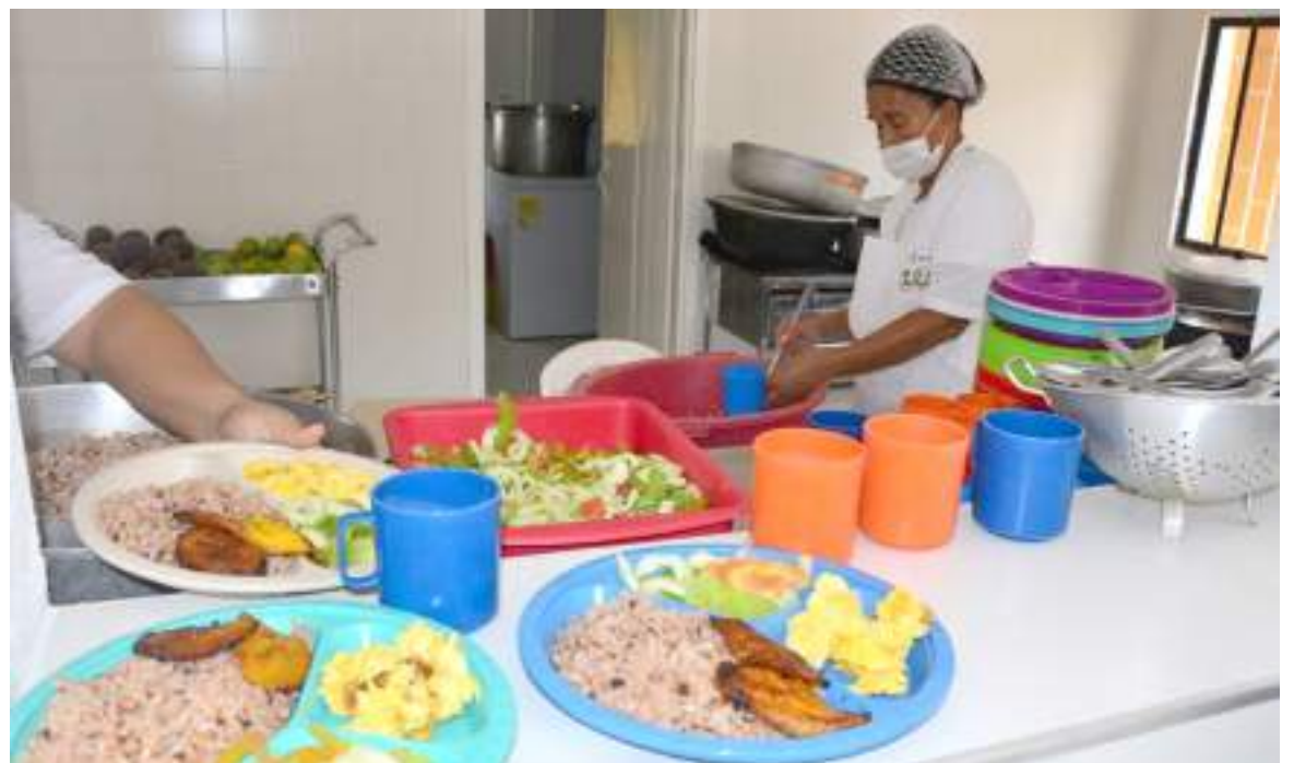
Neiva está dentro de las ciudades que deberán rendir informes ante la Procuraduría.

Así mismo aclaró que se debe a unas correcciones que son “normales en el proceso” ya que obedecen a “errores en la información que uno envía que en algunas ocasiones no coincide a veces por impresión, por ligereza, pero eso ya quedó claro, nosotros ya salimos de esa lista”, indicó.