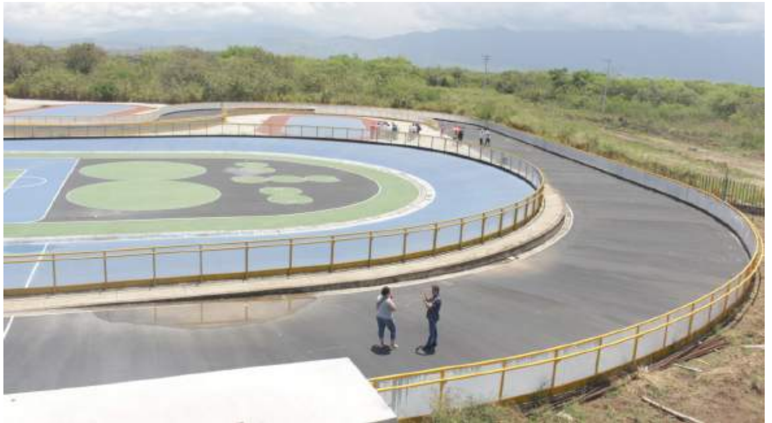
Luego de cuatro gobiernos municipales parece que por fin será un hecho el patinódromo de Neiva