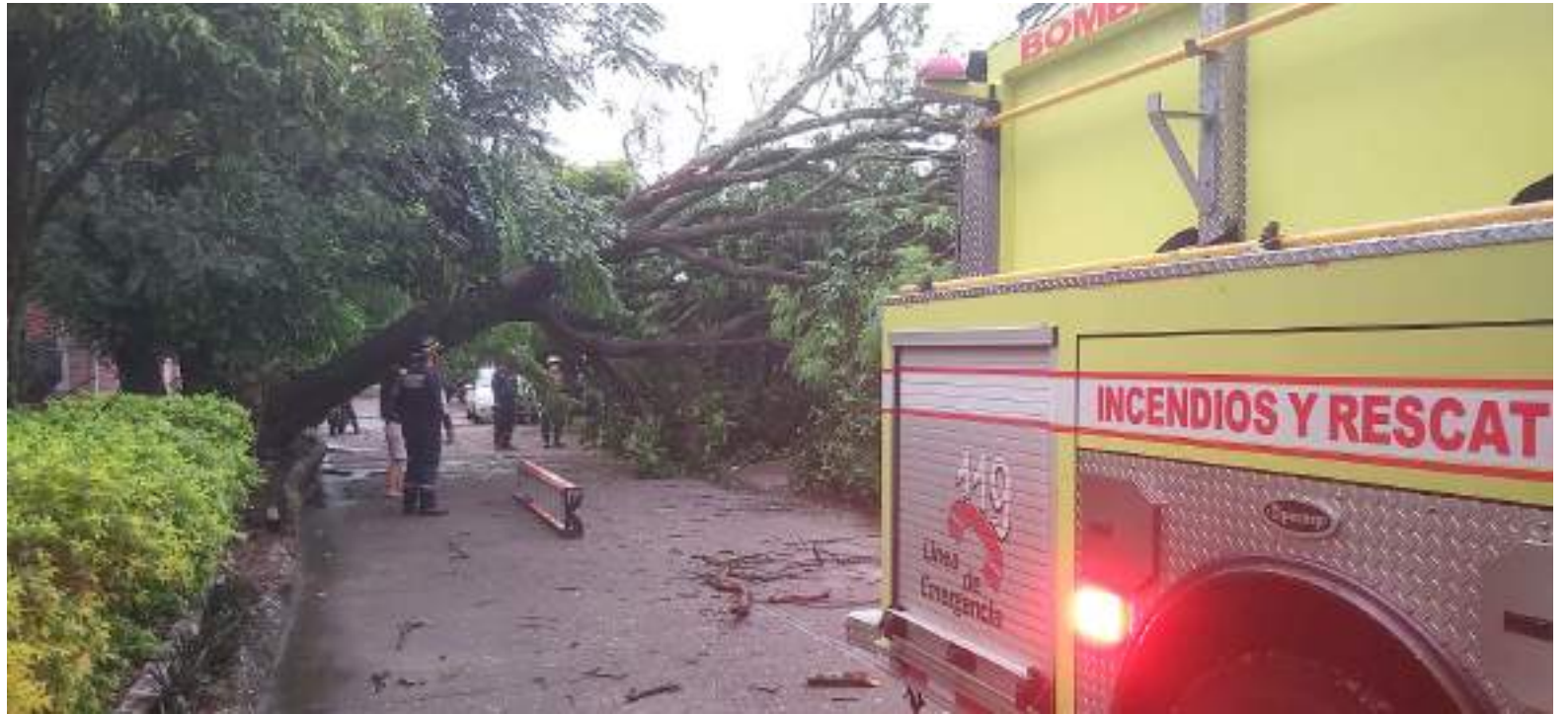
Carrera 1c, número 34-42 barrio cándido, comuna 1

También hubo bloqueos en el sector de la carrera segunda, con avenida pastrana, cerca del