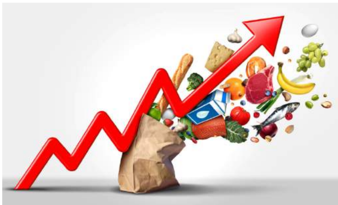
Precios de la producción y la economía siguen en aumento.

Añade que “la inflación en Colombia es un fenómeno que se da principalmente porque el país es un tomador de precios internacionales; Colombia, tiene una balanza comercial negativa, donde es más lo que se importa, de lo que se exporta, y al subir el