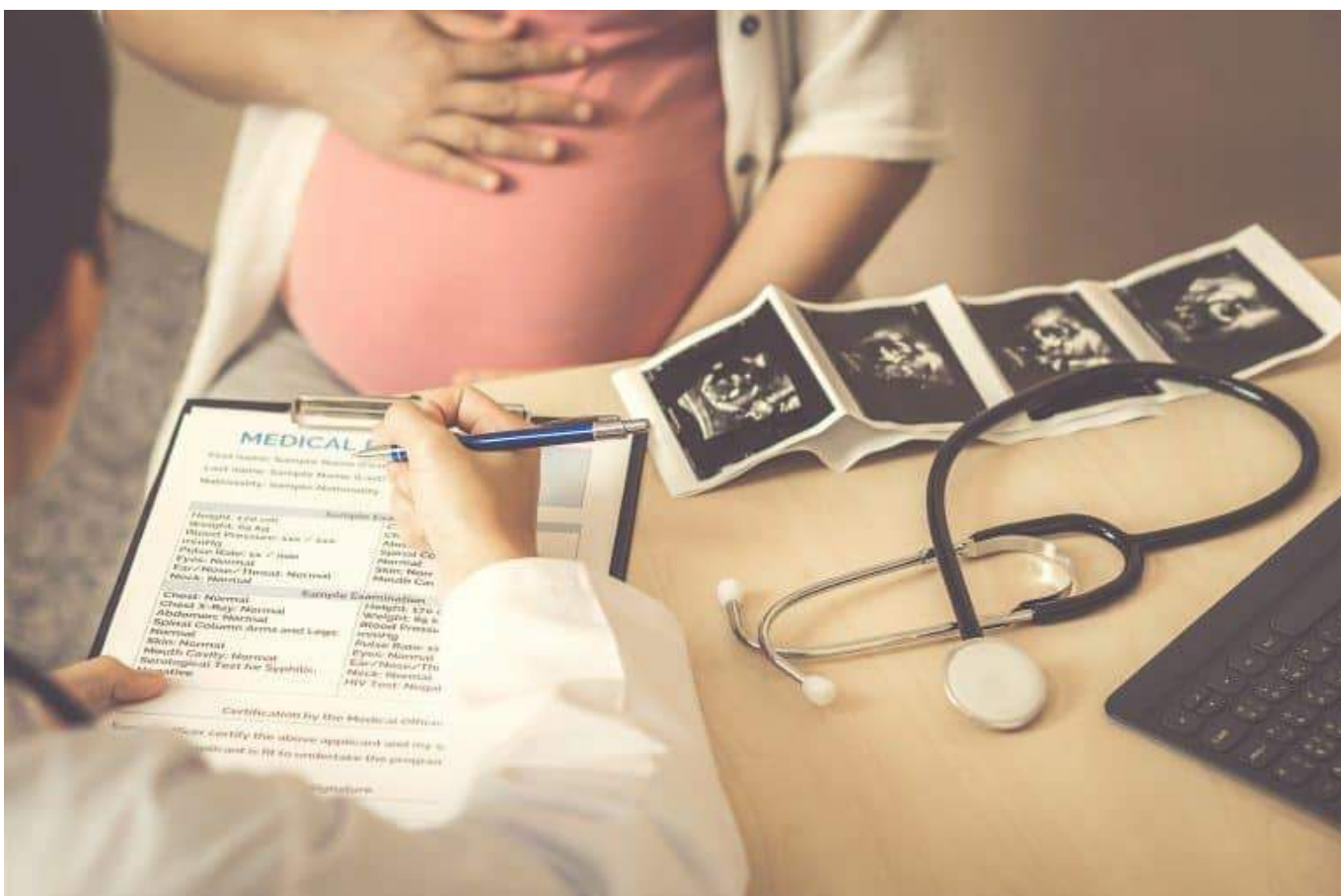
Puede causar daños irreversibles en el feto.

“Aunque la medicación puede proporcionar alivio en el momento, las investigaciones indican cada vez más que puede haber efectos posteriores que podrían ser perjudiciales para el desarrollo del niño”.