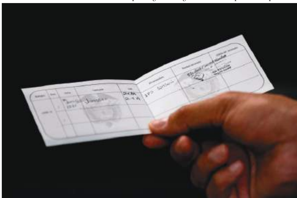
El lado positivo es que en Colombia el 73 % de la población ya tiene al menos una dosis de la vacuna contra el covid.

Para poder lograr el objetivo, las autoridades han asegurado que se debe continuar haciendo búsqueda activa. Además, se debe hacer pedagogía para convencer a quienes no quieren aplicarse el biológico de los beneficios del mismo.