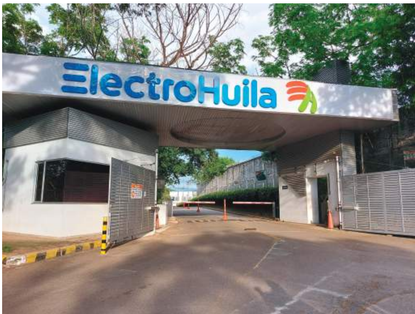
La Electrificadora del Huila tienen cerca de 700 empleados entre planta y contratistas.

Sin embargo, el Gobierno sin hacer mucho aspaviento, expidió la Resolución 2725 de noviembre 11, donde se incluye una frase que ha despertado tormentas políticas a escala regional. El texto en el objeto de contratación dice: "Prestar servicios de asesoría integral y banca de inversión al Ministerio de Hacienda y Cré-