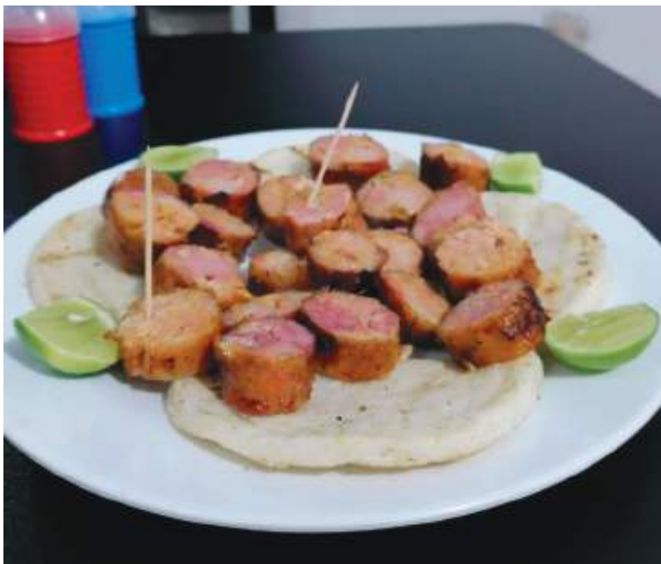
Un evento en el cual los comensales tendrán un menú amplio y provocativo para deleitar su paladar.

Será 'la plazoleta de comidas rápidas más grande de la ciudad en este diciembre', el encuentro perfecto para deleitar unas buenas papas a la francesa con salchichas bañadas usualmente en salsa de tomate o la salsa de su gusto o acompañarlo con una hamburguesa, en fin, habrá mil maneras de combinar la deliciosa comida callejera con el profesionalismo y la buena sazón de sus chef. La actividad será este jueves 9 y viernes 10 de diciembre en el parque Santander de Neiva.