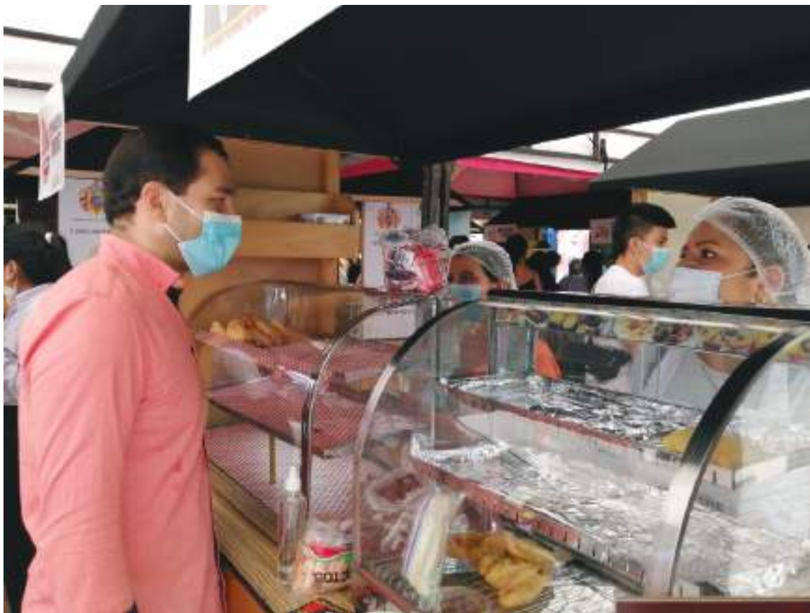
Tal como se tenía previsto, este jueves 9 y viernes 10 de diciembre, se llevará a cabo en el parque Santander, 'El Festival de las Comidas Rápidas'.