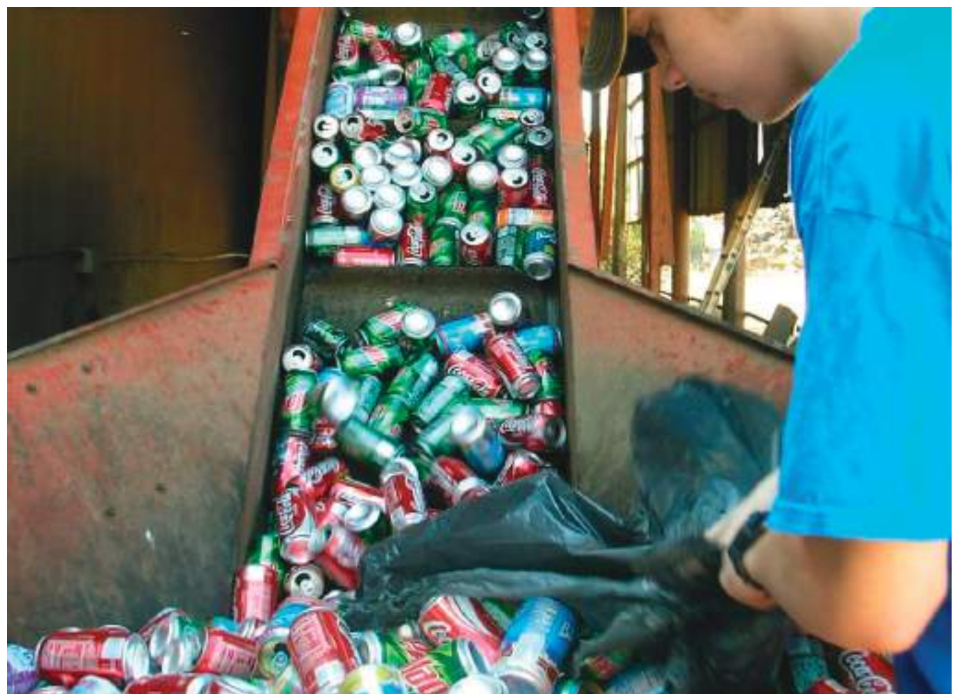
Los empleos en sectores económicos verdes desde el punto de vista del producto final y funciones de trabajo en todos los sectores desde una perspectiva de proceso respetuoso con el medio ambiente.

En el informe se reveló que en el año de la pandemia y las res-