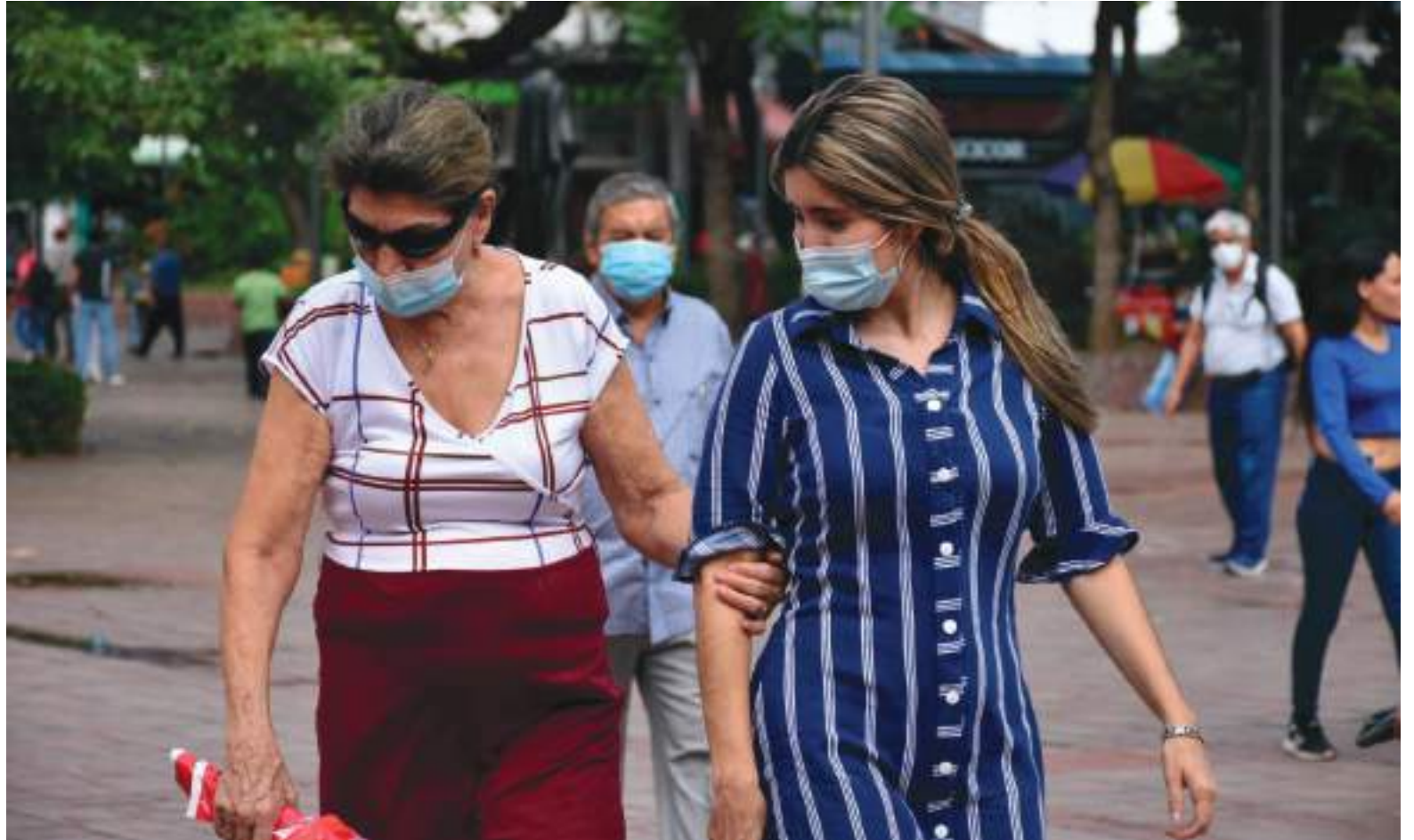
El porcentaje de ocupación de Unidad de Cuidados Intensivos en el departamento al cierre de la jornada es del 49% y en la ciudad de Neiva en 66%.

El Ministerio de Salud y Protección Social reportó, este lunes 6 de diciembre, 1.698 casos nuevos de covid-19 en Colombia. En las últimas 24 horas se procesaron 51.687 pruebas de las cuales 33.266 son PCR y