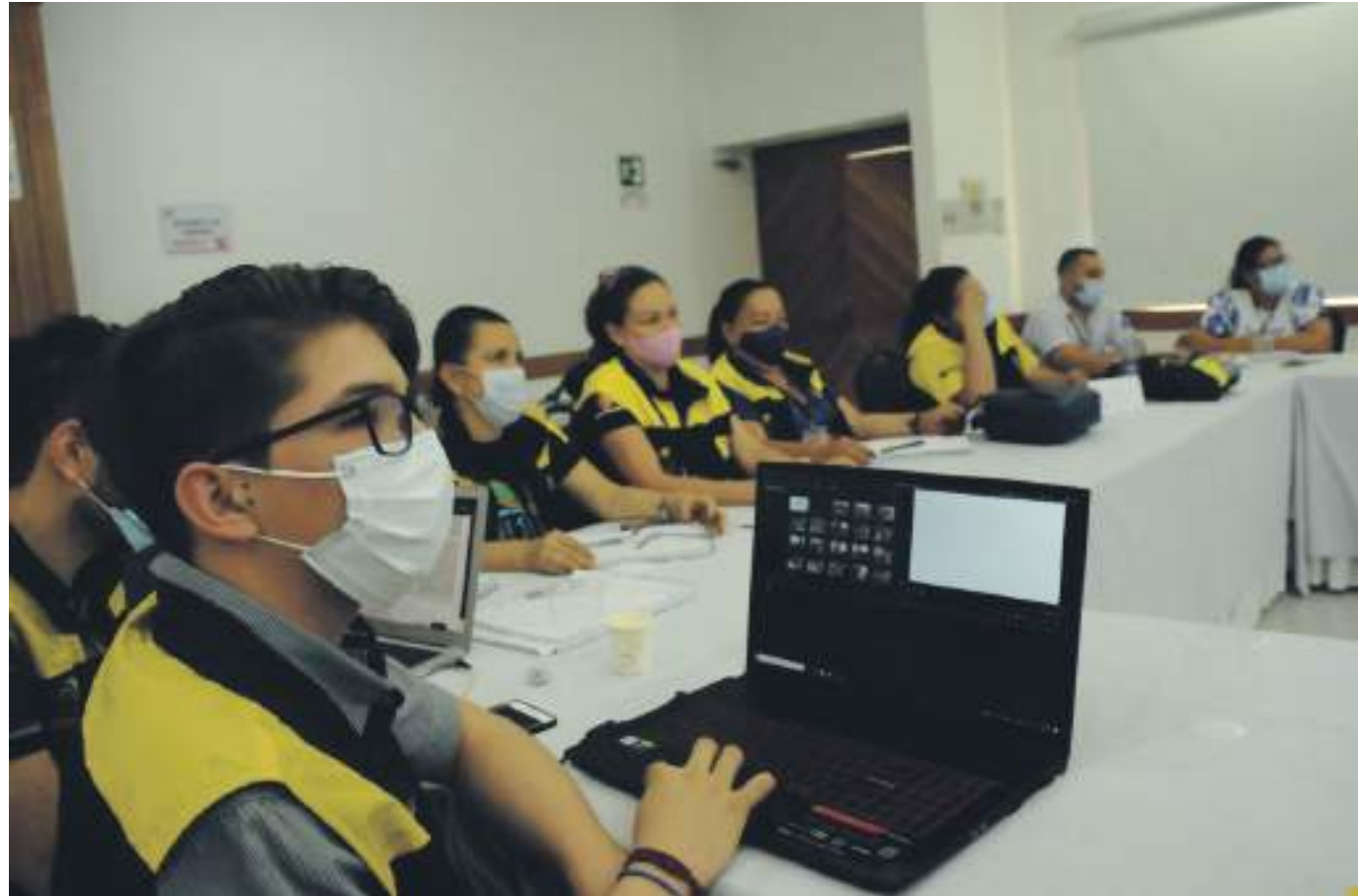
En el evento se desatacá la importancia del trabajo que realizan los Vigías.

En el evento, hubo espacio para reflexionar acerca de la situación del turismo cultural con sostenibilidad en el departamento. Es este contexto, preocupa el gran número de los denominados ‘miradores’ y otros espacios atractivos, que han emergido a lo largo del territorio huilense en el úl-