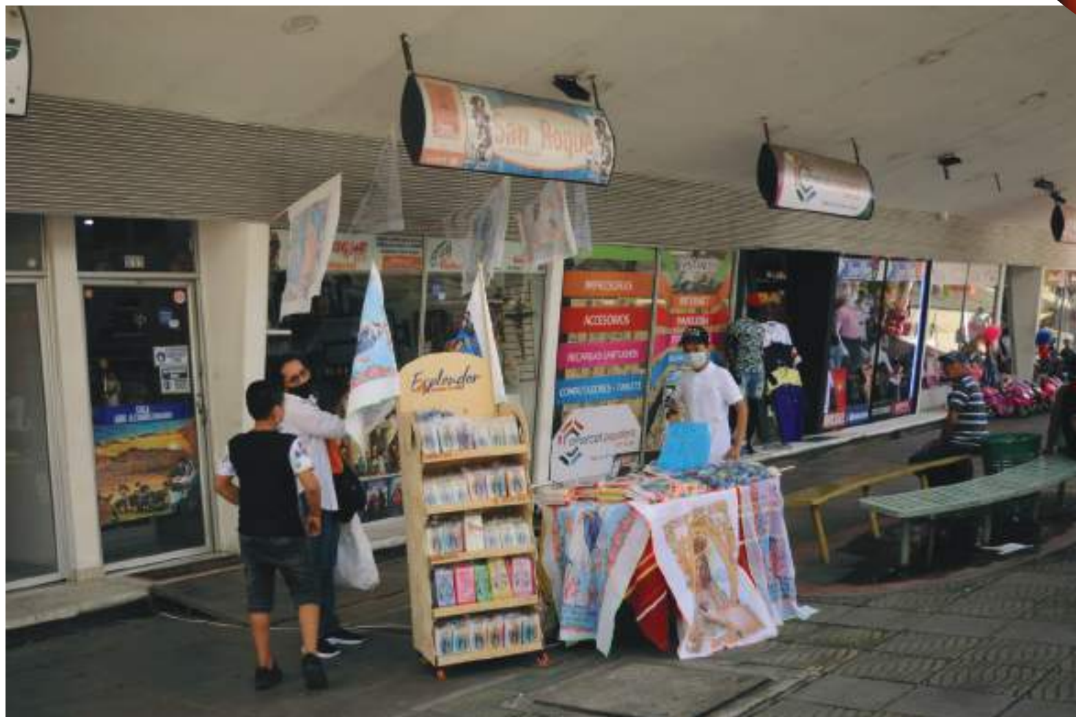
La oferta es variada de cara a la noche de las velitas

Creyentes de miles de lugares en el mundo y en la ciudad encienden velas para celebrar el acontecimiento histórico y se ha mantenido la tradición de iluminar esta noche de diciembre.