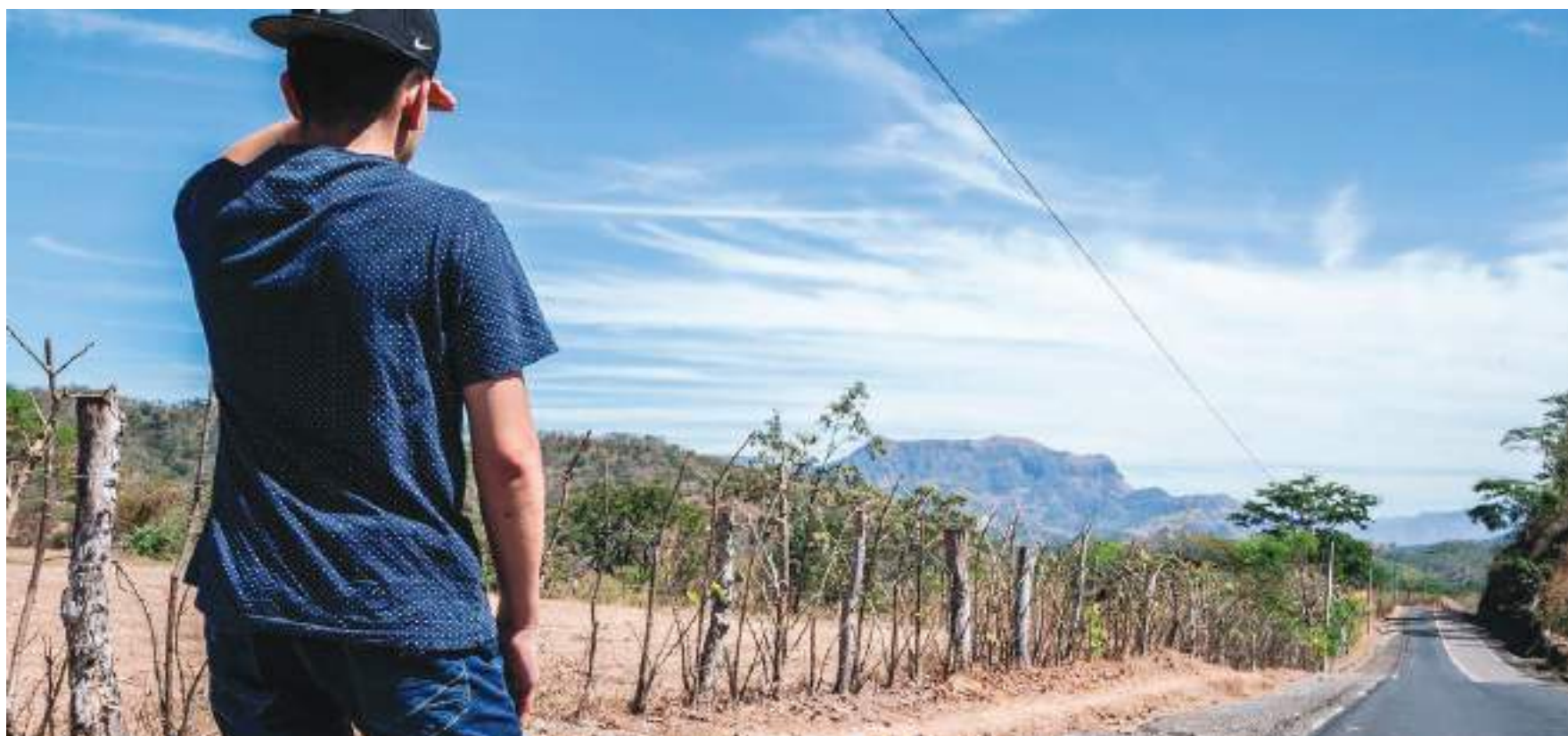
Los empleos de tipo ambiental consisten en todas aquellas acciones que permitan reducir las presiones sobre los recursos naturales.

En el año de la pandemia y las restricciones por bioseguridad, se generaron 124.044 empleos de tipo ambiental en el país, consistentes en todas aquellas acciones que permitan reducir las presiones sobre los recursos naturales, a través de su protección y aprovechamiento sostenible, en todo el proceso de producción.