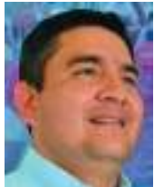
Juan Felipe Molano Perdomo

Desde esta columna invito a todos los actores de la política nacional y regional, como a quienes ejercen su derecho al voto y esperan vivir en un país cada día más democrático, a que sin temores aceptemos que a todos nos fue muy mal con las elecciones de consejos de juventudes, donde lo mínimo que esperábamos era una alta participación.