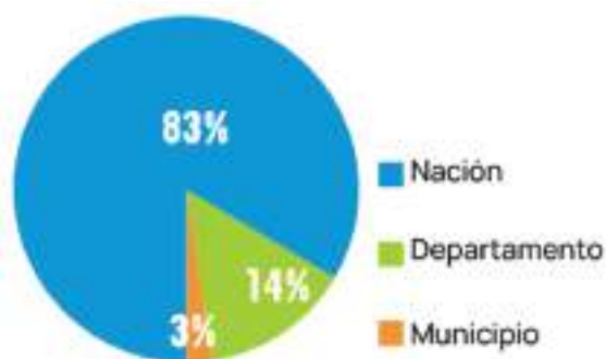
Participación accionaria de la Electrificadora del Huila.

De esta forma el Gobierno Nacional sigue buscando cómo conseguir los recursos necesarios para garantizar que los programas sociales que viene ejecutando desde que inició la pandemia del Covid-19 estén financiados, por lo que, desde mediados de año anunció su interés por desinvertir en algunas empresas del