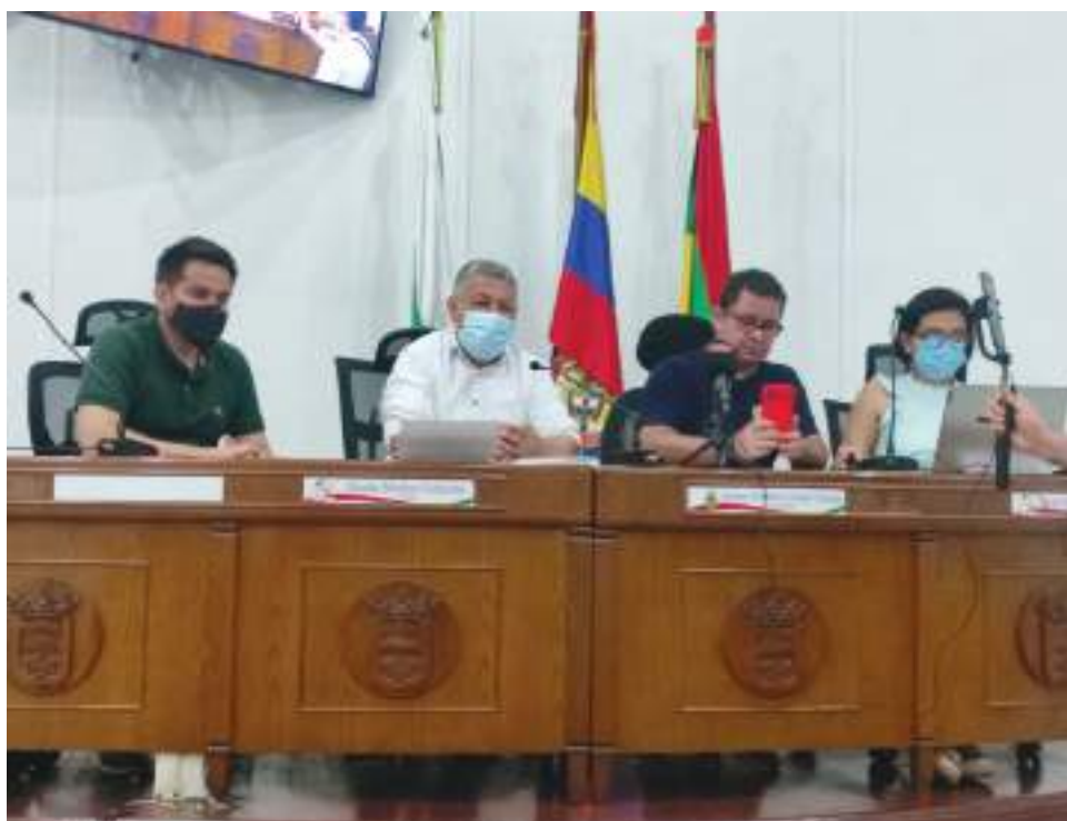
El Concejo de Neiva entregó un informe sobre el avance del proceso de selección de Institución de Educación Superior, para seleccionar el nuevo Contralor Municipal, en el marco de la Resolución 075 del 25 de noviembre de 2021.

Aclaró que el proceso no se suspende, y que con los abogados de la mesa directiva se tomará una decisión para enseguida redactar los actos administrativos a seguir. “El primer acto administrativo es declararlo desierto en firme, por parte de la mesa directiva. El comité evaluador tiene todo nuestro respaldo, pues la mesa directiva es la que lo ha delegado. Segundo, se mirará las fechas para inmediatamente convocar un nuevo proceso, una nueva apertura para que se pueda presentar nuevamente instituciones de educación superior que quieran llevar a cabo la prueba académica para elegir la terna tanto de contralor mu-