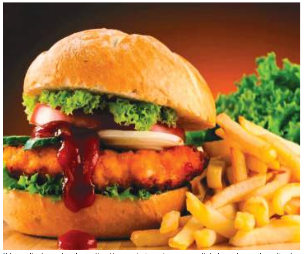
Esto con fin de ayudar a la reactivación económica, así como se realizó el pasado mes de septiembre con el Festival de la Empanada.