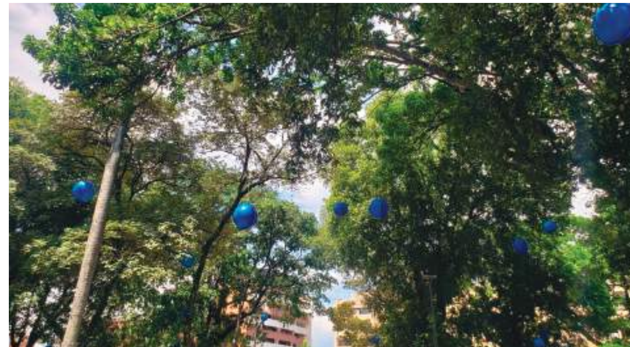
Será también el encendido del alumbrado navideño por parte de la Administración.

de, por las velas buscando aprovechar la fecha especial. “Rocinante (como llama a su carreta) es la campeona, es la que más vende gracias a que los productos son de bajo precio y están al alcance de todas las familias neivanas. Los niños y las mujeres son las que más llevan”, señala, con optimismo.