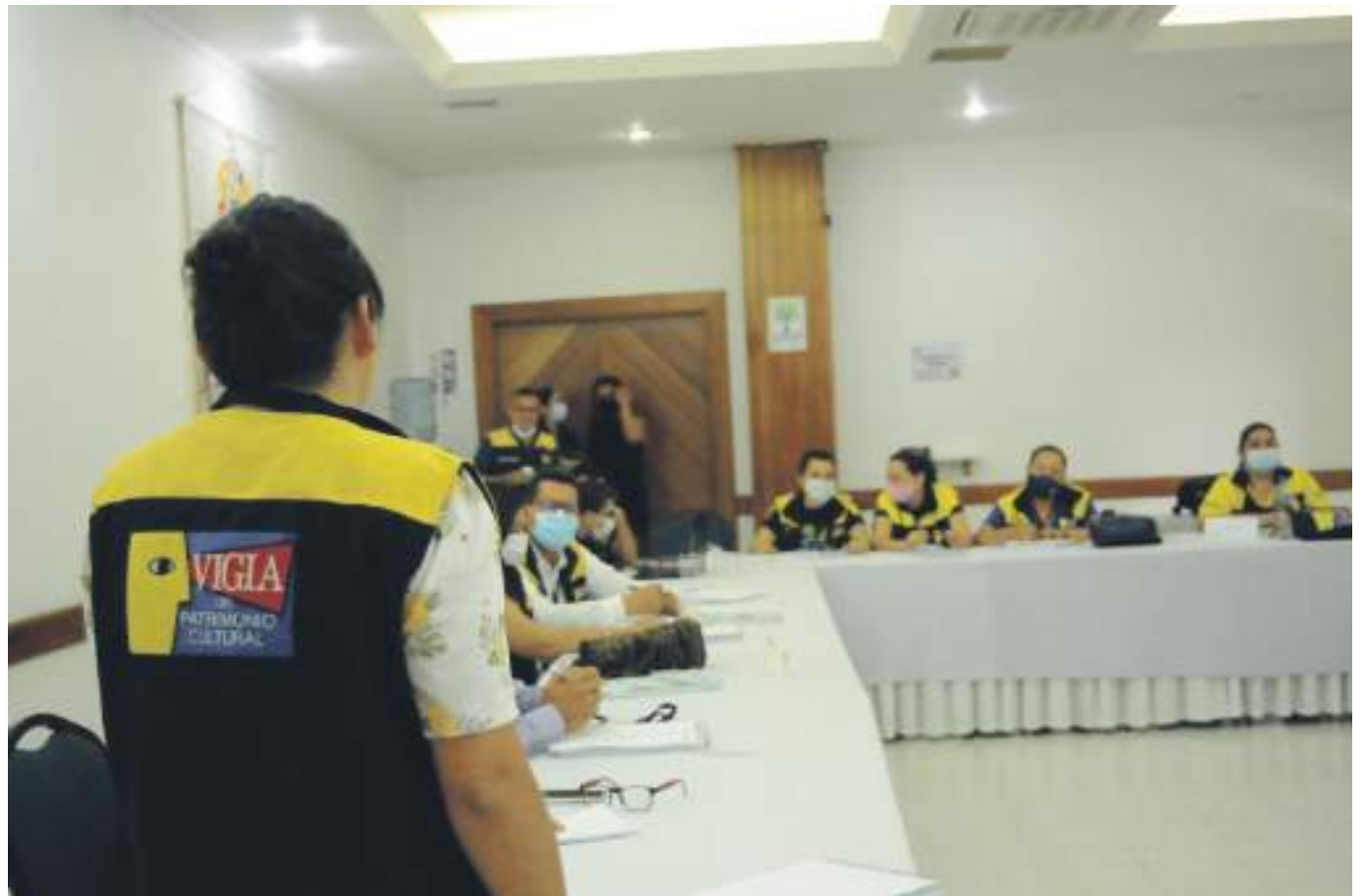
En el Hotel Chicalá en Neiva, se desarrolla el evento que reúne a los coordinadores de los grupos de vigías del patrimonio cultural del departamento del Huila.

“Este es de los pocos programas que a nivel nacional existen, donde, si bien es un programa del Ministerio de Cultura, las inicia-