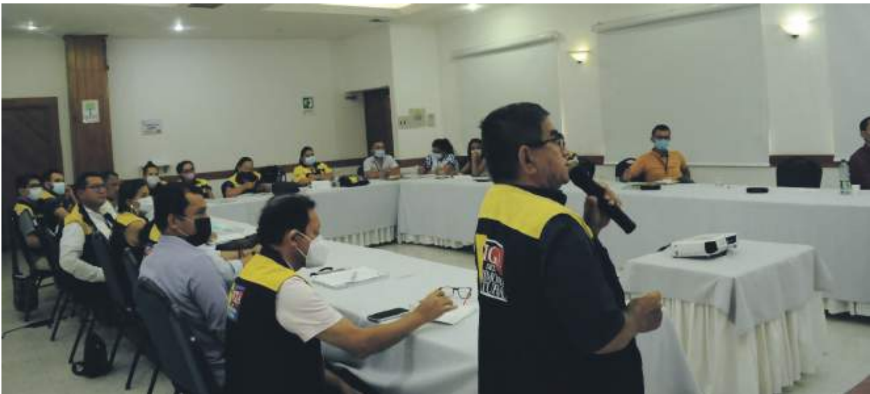
En el encuentro, los Vigías también se capacitan en identificación, valoración y levantamiento de inventarios del patrimonio inmaterial en cada uno de sus municipios.

Finalmente, resaltó que en las diferentes convocatorias de estímulos y concertación, se dio apertura a una línea para que los diferentes grupos puedan acceder a recursos económicos para financiar sus proyectos e iniciativas que de los territorios tienen los grupos de vigías del patrimonio.