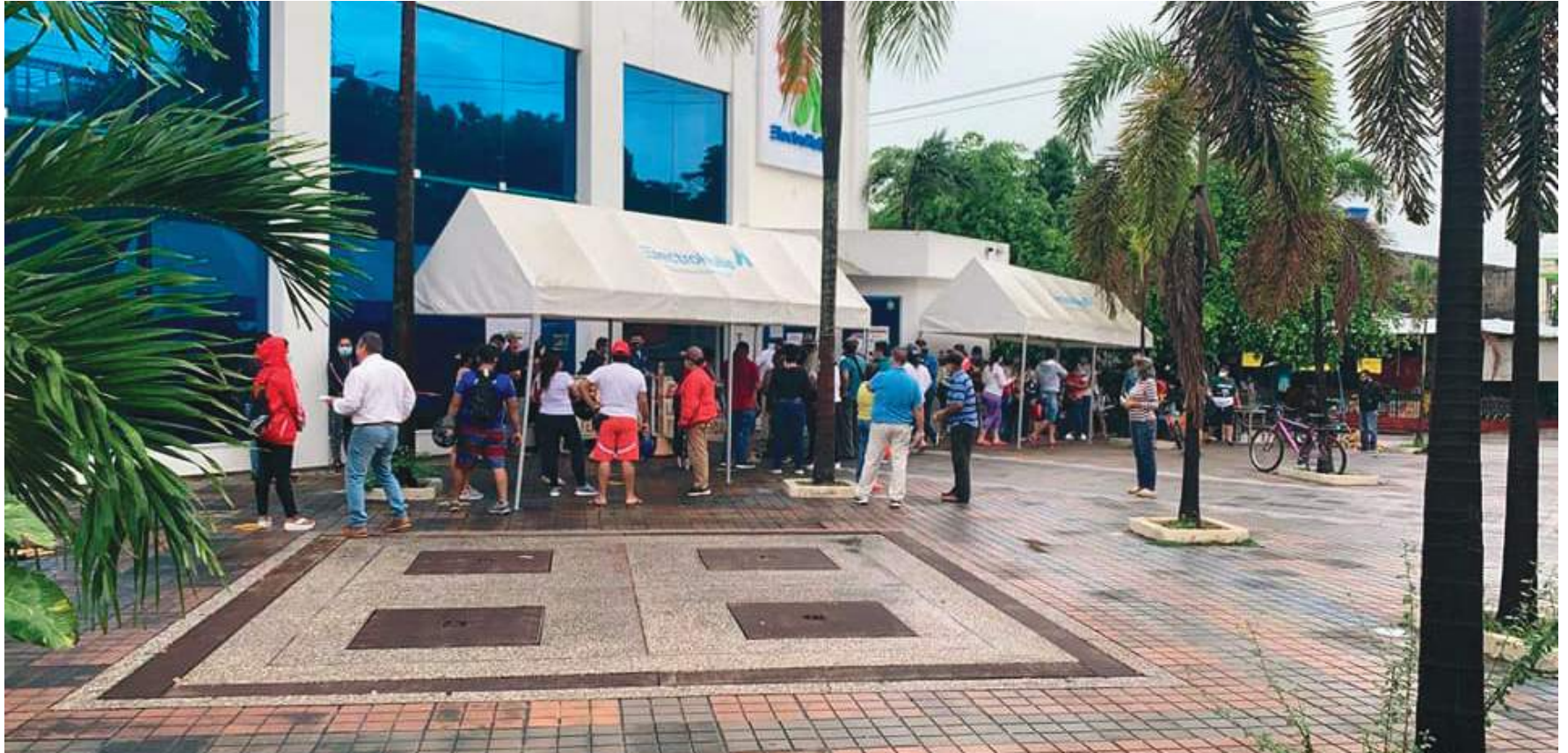
El patrimonio de Electrohuila es de 396 mil millones de pesos.

gane el contrato “deberá realizar la valoración, y de ser procedente analizar, diseñar, elaborar e implementar el plan o programa de enajenación de la participación accionaria de la Nación en empresas del sector eléctrico”.