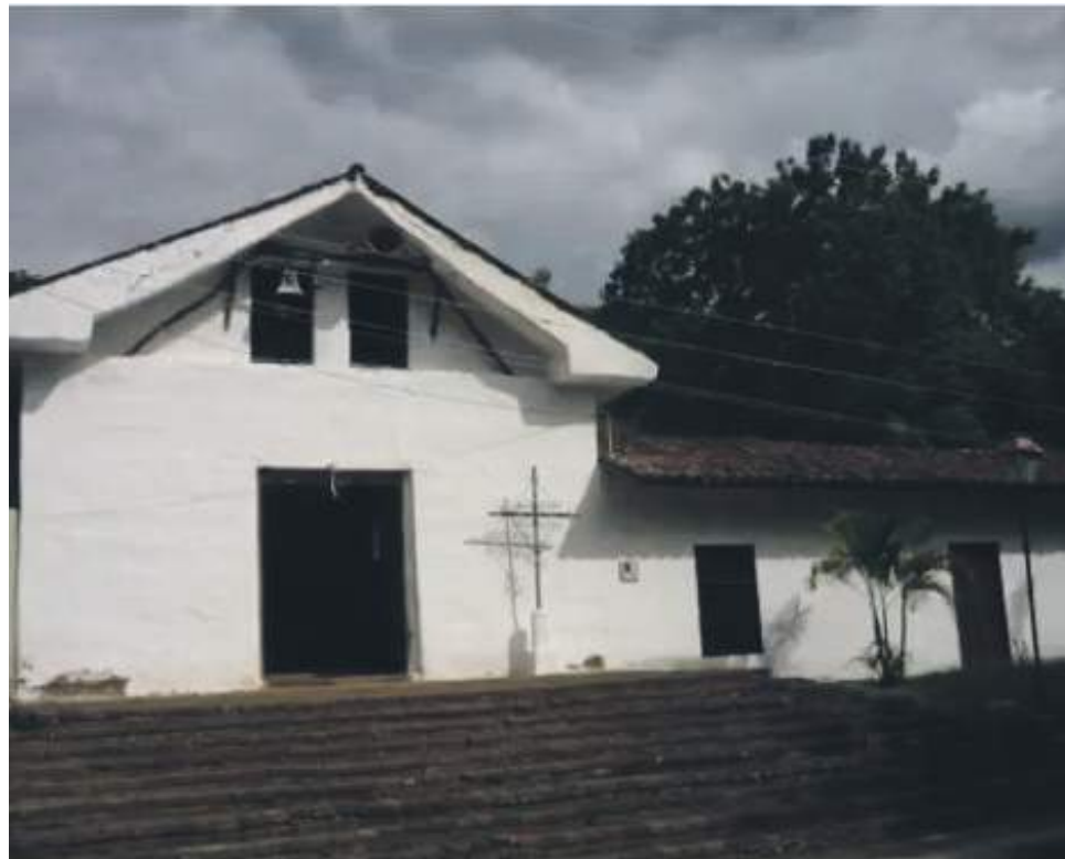
Los Vigías del Patrimonio Cultural son el enlace entre la comunidad y la oficialidad.