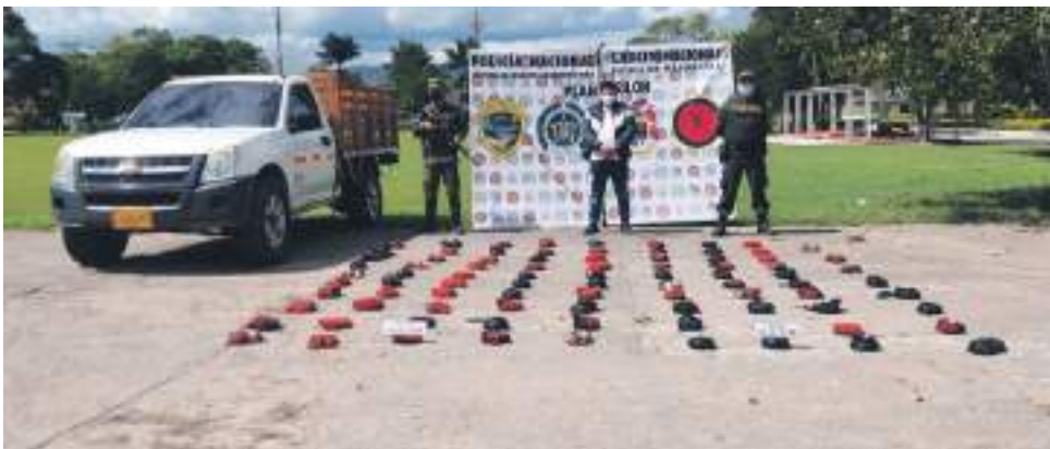
La operación permitió ubicar un vehículo particular con las características referenciadas por la fuente humana.

Las operaciones contra el tráfico de estupefacientes, nuevamente neutralizaron las pretensiones de las bandas criminales de pasar por el Huila cargamentos de sustancias ilícitas. Las dos acciones permitieron la incautación de 79 kilos de marihuana tipo Cripuy.