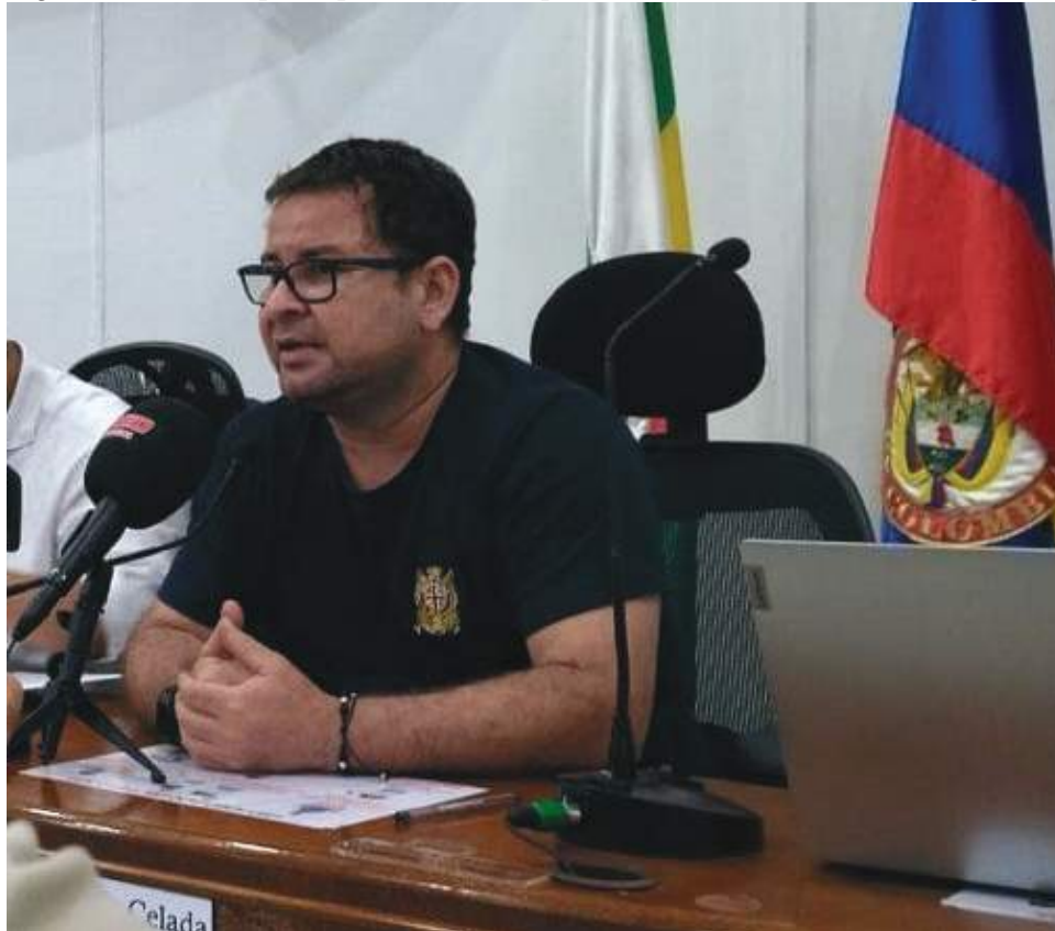
Al proceso de selección solo se presentó la propuesta de la Universidad Distrital Francisco José de Caldas, pero no cumplió con la documentación requerida.

En diálogo con el presidente del Concejo de Neiva, indicó que en la propuesta de la Universidad Distrital Francisco José de Caldas, no presentaron las hojas de vida o los perfiles del equipo que llevaría a cabo la prueba académica, siendo esta una garantía