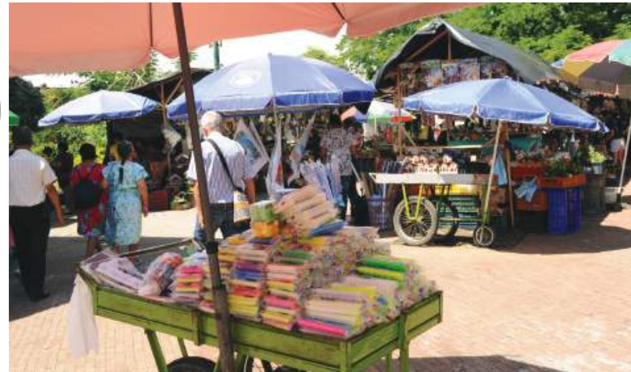
Los vendedores informales esperan hacer su navidad.