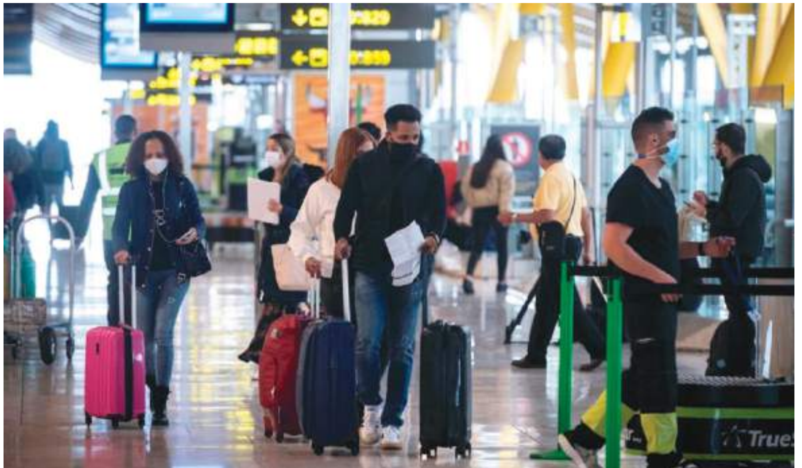
Para evitar un aumento descontrolado de contagios en la temporada de fin de año, el Gobierno de Colombia determinó limitar la entrada de turistas extranjeros al territorio nacional.

A pesar de estas cifras, el Gobierno volvió a imponer restricciones, pero se indicó que esto es necesario para proteger la vida de todos. El objetivo es evitar que este final de 2021 e inicio de 2022 se lleguen a cifras de contagios de covid exageradas, así como las registradas hace un año, cuando se superaban los más de 20.000