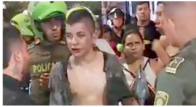
Justicia por ‘mano propia’ en Neiva ■ Neiva 2-3