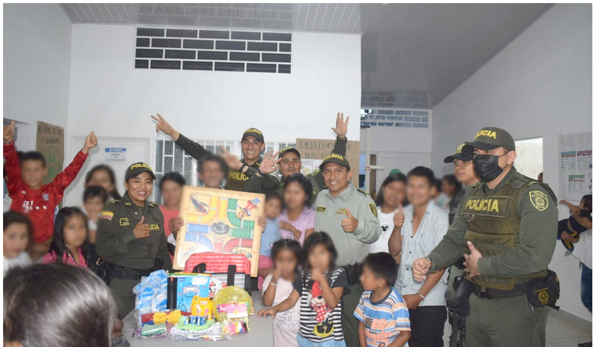
La alerta de desplazamiento de 500 personas, 152 familias, incluidos 273 menores de edad, de 10 veredas e integrantes del pueblo Nasa, y el riesgo que sufre la población civil en La Plata.