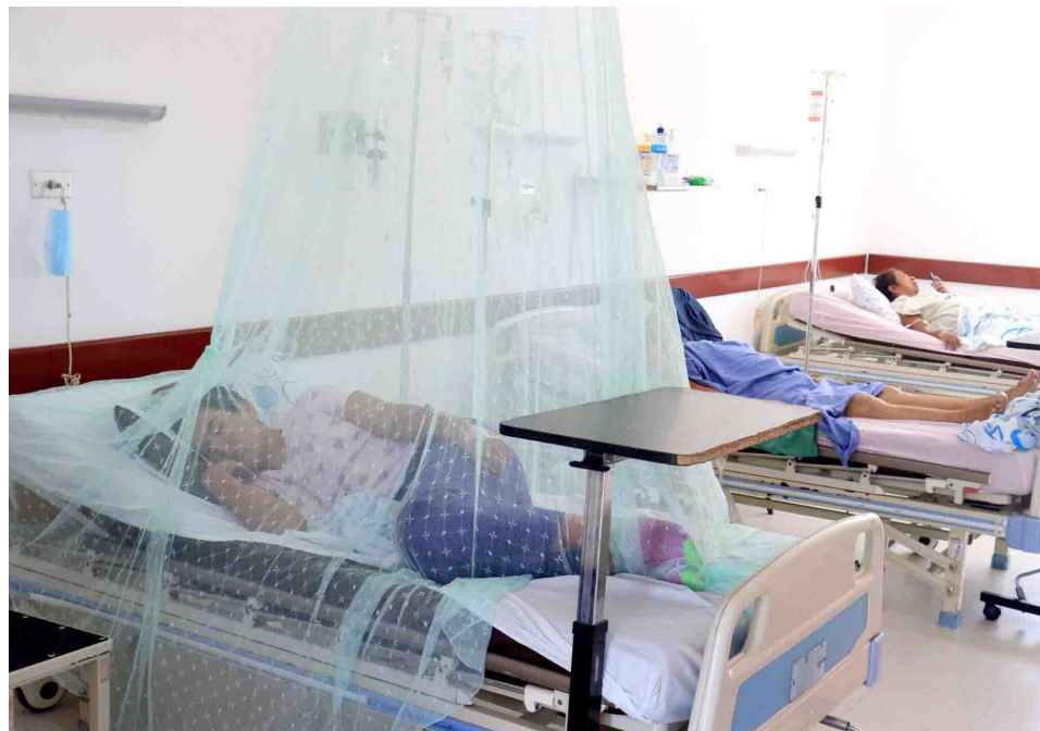
Las autoridades han adelantado jornadas de limpieza y eliminación de criadero mosquitos para hacerle frente al dengue.

“A semana epidemiológica 30 de 2023, la incidencia nacional de dengue es de 174,7 casos por cada 100.000 habitantes en riesgo; para el mismo periodo de 2022 la incidencia fue de 104,9 casos por 100.000 habitantes. De las 38 entidades territoriales departamentales y distritales de Colombia, Bogotá es la única entidad sin po-