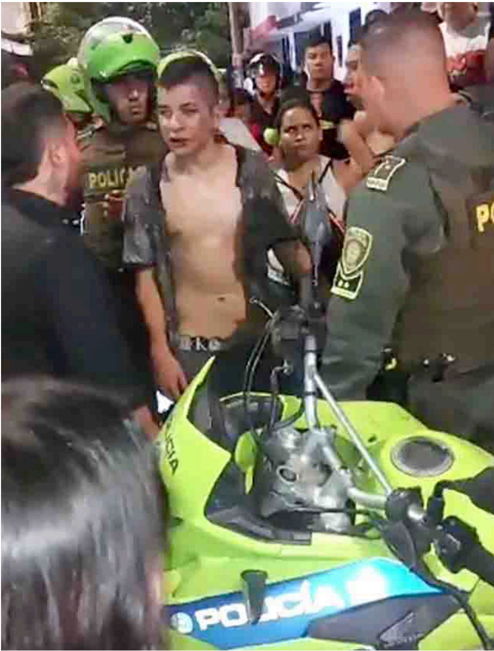
Los señalados fueron entregados a la Policía.

hombres intentan esquivar y escapar del lugar. Un hombre que graba mientras los sujetos salen de una casa, asegura que son 'ra-