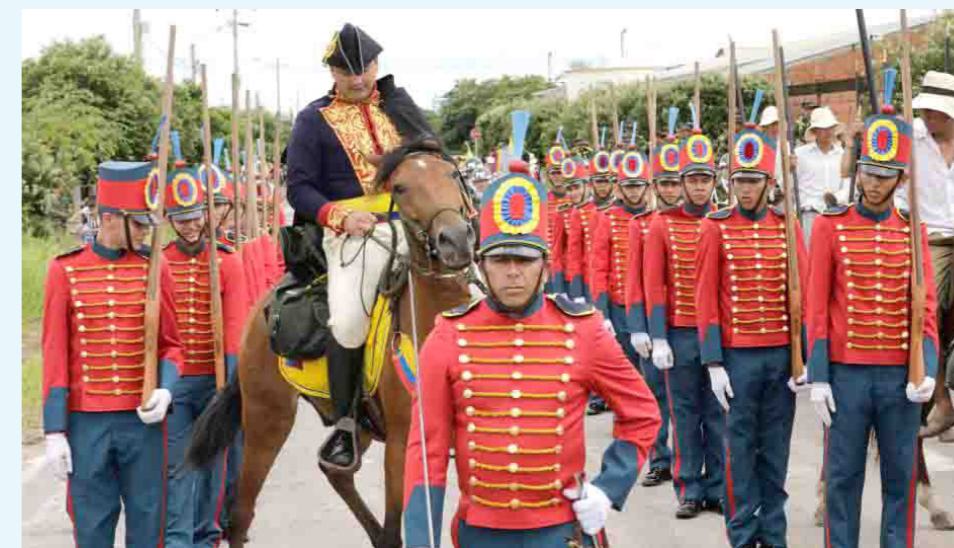
Esta es una de las celebraciones patrias de Colombia.