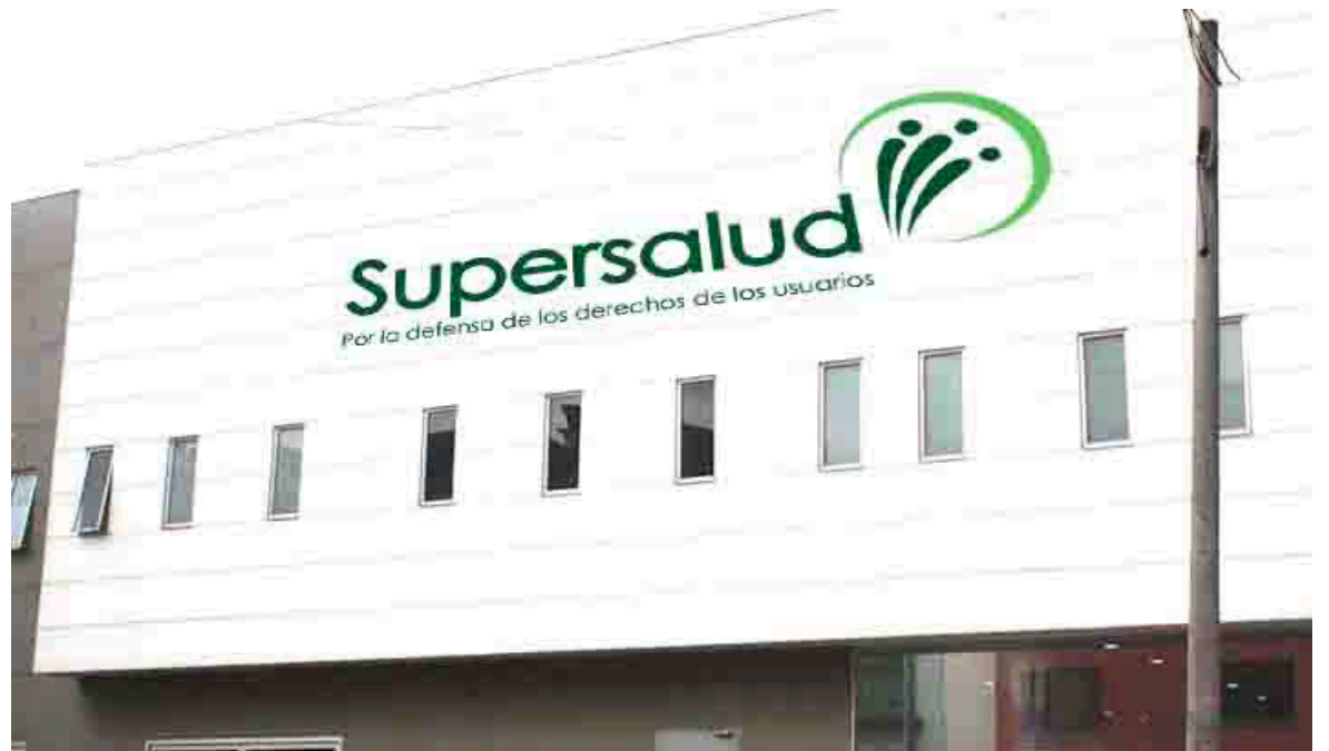
La Supersalud intervino la EPS.

El ente de vigilancia y control aseguró que una de las situaciones que más le preocupaban tenía que ver con las demoras que se estaban presentando para entregarles los medicamentos a los afiliados, pues esa era la principal causa de los reclamos que se venían radicando desde enero de este año.