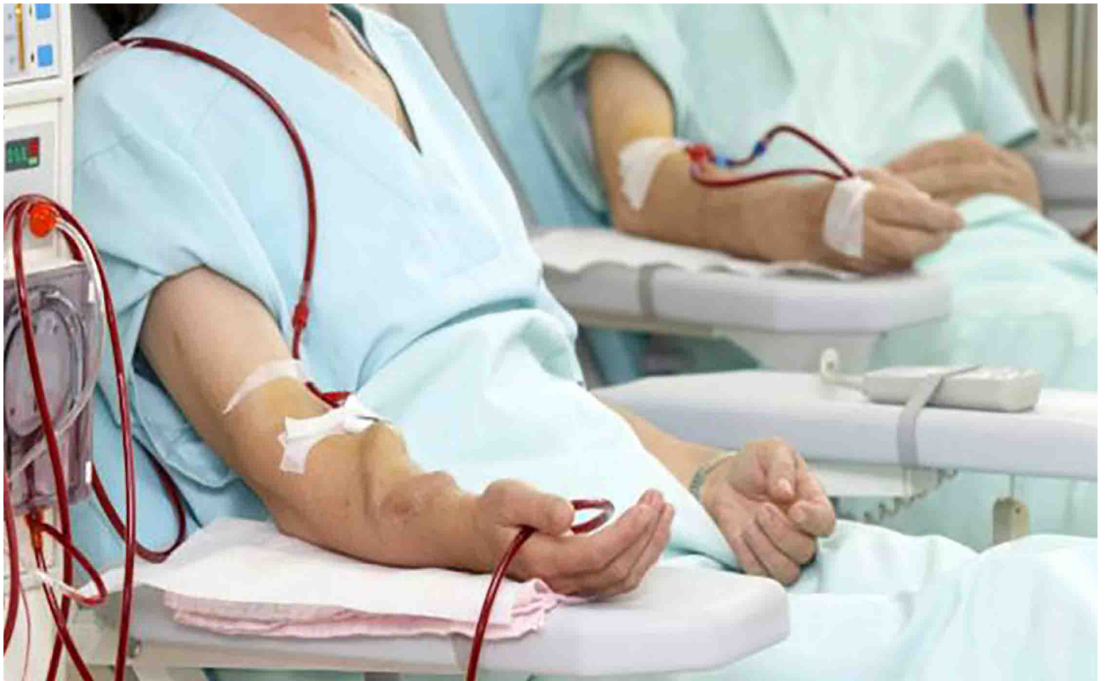
No les van a prestar el servicio de salud por que la EPS no paga.