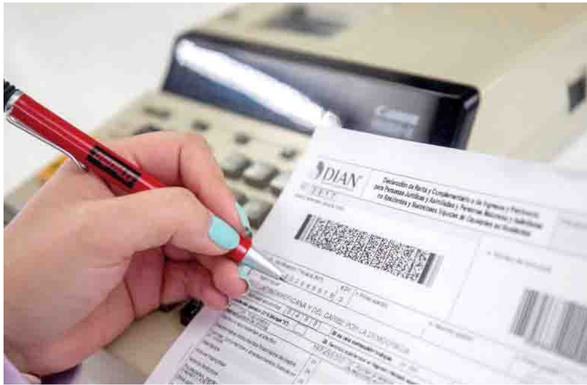
“Como no residente fiscal en Colombia, no le obliga a declarar los ingresos de fuente nacional si le practicaron retención en la fuente”

5. Si no se otuvo ingresos en Colombia pero sí patrimonio, no le obliga a declarar no importa la