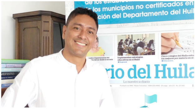
“Démosle la oportunidad a Hobo” ■ Política 6-7