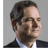
Germán Vargas Lleras

Los ciudadanos están agobiados por el crimen y exigen respuestas contundentes de la autoridad.