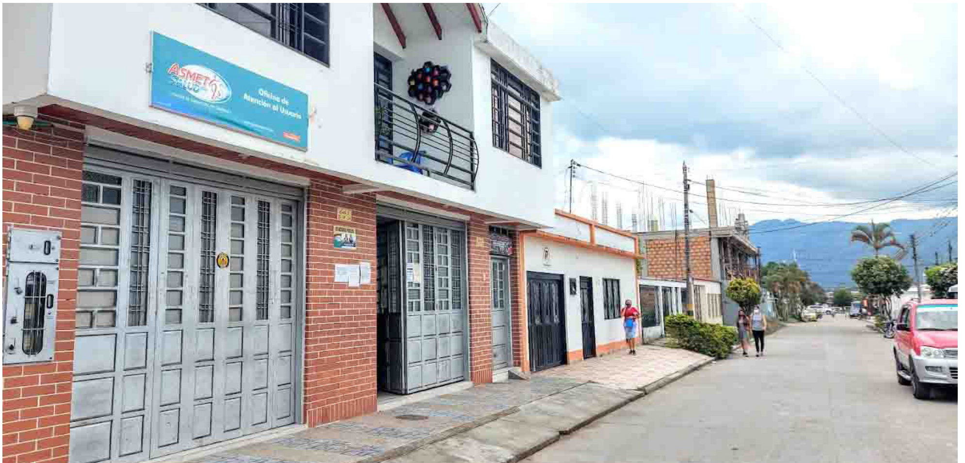
Al parecer la entidad de salud, no ha pagado la asistencia a Nefrouros.