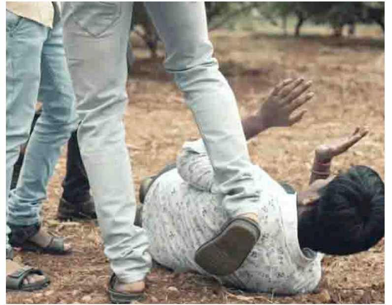
Estos hechos se dan ante los robos.

“Cuando una sociedad no confía en sus instituciones ni en aquellos que están encargados de mantener la seguridad, se puede llegar al extremo de tomarse la justicia por cuenta propia”, agrega el investigador.