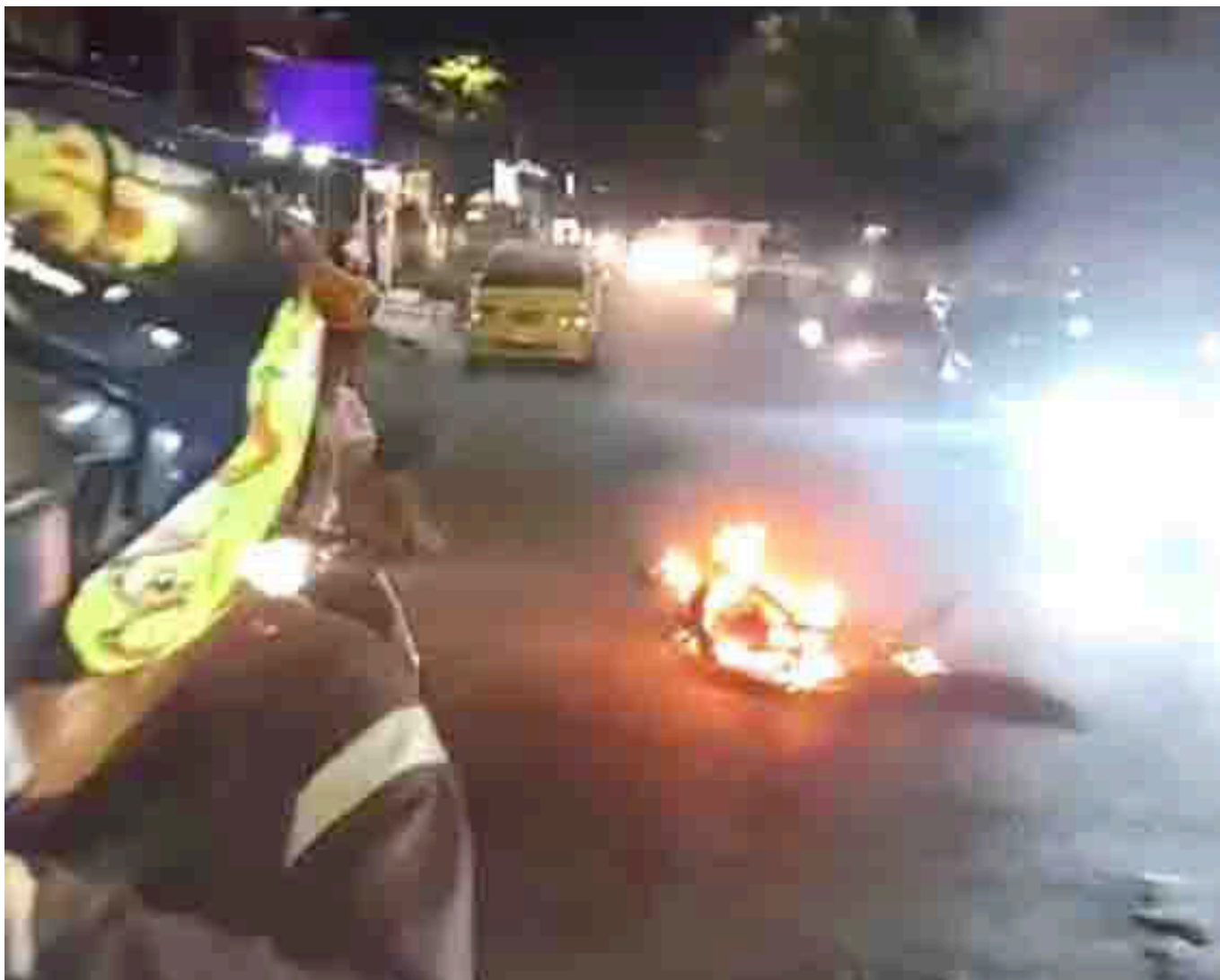
La moto en la que iban los sujetos fue quemada.

La noche del pasado sábado una mujer resultó herida, al parecer en un hecho de hurto, la ciudadanía reacciona y señalan a dos jóvenes de haber cometido el hecho, por este motivo varias personas, la emprendieron en su contra, les pegaban puños y patadas.