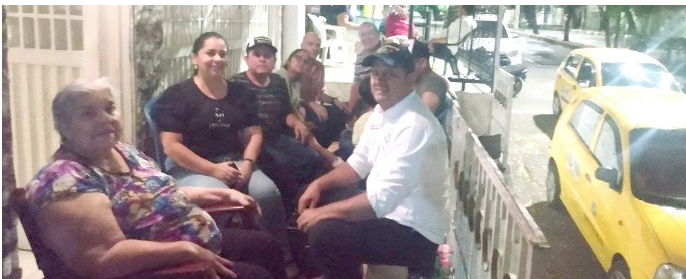
El candidato viene socializando con las comunidades.

En esta candidatura, van a encontrar no solamente un amigo, sino una persona que va a gestionar, que se realizará control político a la administración municipal, que lo que queremos con el gremio taxista. Esto va muy enlazado con la comunidad nosotros somos uno de los gremios más importantes de la ciudad y no fuimos tenido en cuenta. Nosotros venimos trabajando en el gremio lógicamente tenemos que hacer un filtro y de debemos profesionalizarnos y ganarnos la confianza de la gente, que sí van a tomar un servicio de taxi, cuenten con que ustedes, sus hijos, su familia van a estar bien, seguros y con un muy buen servicio. Nosotros somos 2.196 taxis en la ciudad, que pueden ser 2.196 cámaras de vigilancia rodantes, brindando también seguridad a Neiva