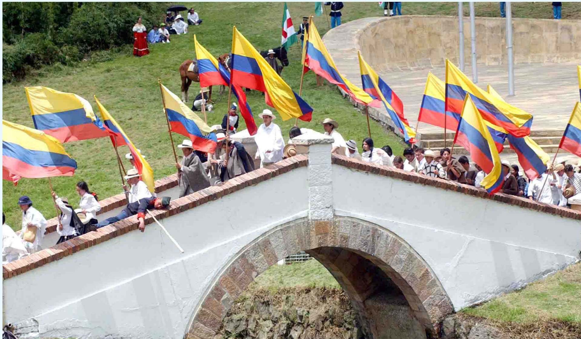
Hoy se conmemora la Batalla de Boyacá.

La Independencia se logró en dos fases. En la primera, de 1810 a 1815, se libraron enfrentamientos entre realistas e independentistas. Sin embargo, las diferencias entre los segundos mermaron su unión, lo que los llevó a librar una guerra civil en el mismo bando, en una etapa tradicionalmente conocida como La Patria Boba. Pasado el tiempo, Antonio Nariño, una de las figuras clave del movimiento, cerró acuerdos de paz y, sin éxito, se enfrentó de nueva cuenta a los seguidos