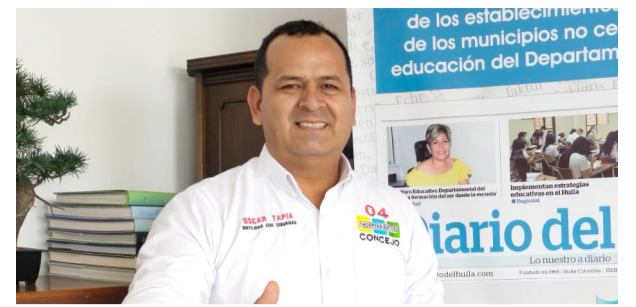
El taxismo busca llegar al Concejo de Neiva ■ Política 9