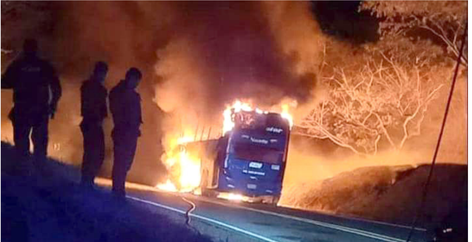
Automotor quemado por la delincuencia.

■ Ante el no pago de extorsiones por parte de empresas de transporte público, dos hombres adscritos aparentemente a las disidencias de las Farc, se hicieron pasar como pasajeros y cuando iban cerca del municipio de Altamira, intimidaron a los usuarios y al conductor del bus de Coomotor, los hicieron descender del carro y le prendieron fuego.