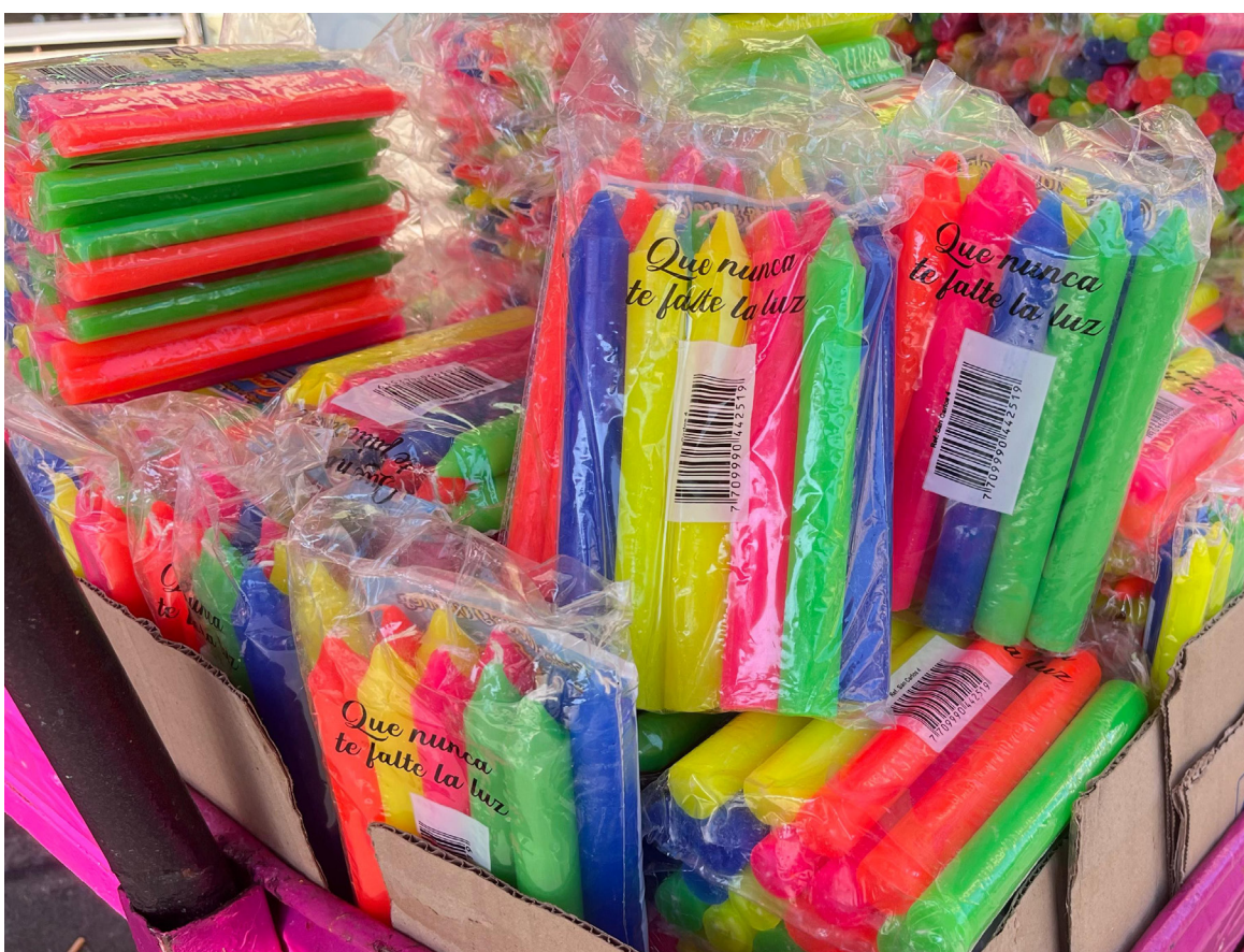
Los paquetes de velitas tiene un precio entre los 2 mil y 7 mil pesos.

Doña Lucila invita a todos los neivanos para que aprovechen este día y salgan comprar sus velitas, además a disfrutar en familia esta hermosa tradición que se celebrará en la noche.