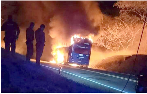
Disidencias habrían quemado bus