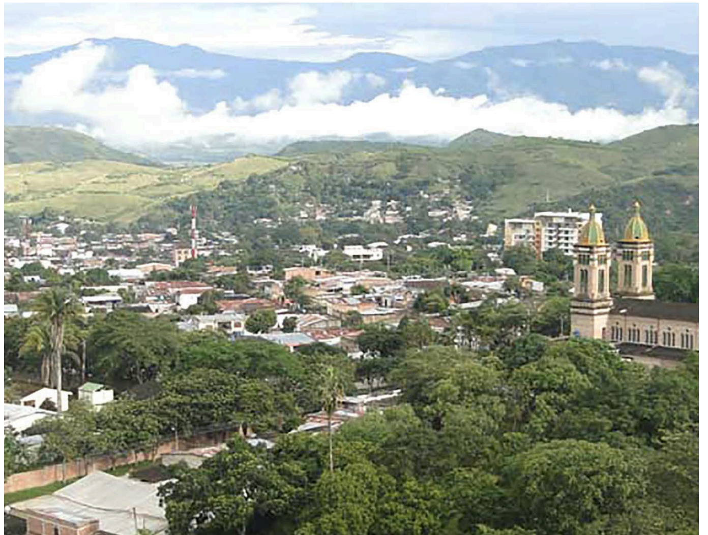
Las tierras que están cerca de los cascos urbanos, se están convirtiendo en fincas de recreo.

Actualmente la Unidad de Restitución de Tierras, ha entregado, 9.000 hectáreas a población víctima que ha sido despojada de sus predios. En el departamento del Huila, se han dado 1.032. Y en varios casos, los reclamantes han fallecido, esperando los títulos y la entidad, se los suministra a los hijos.