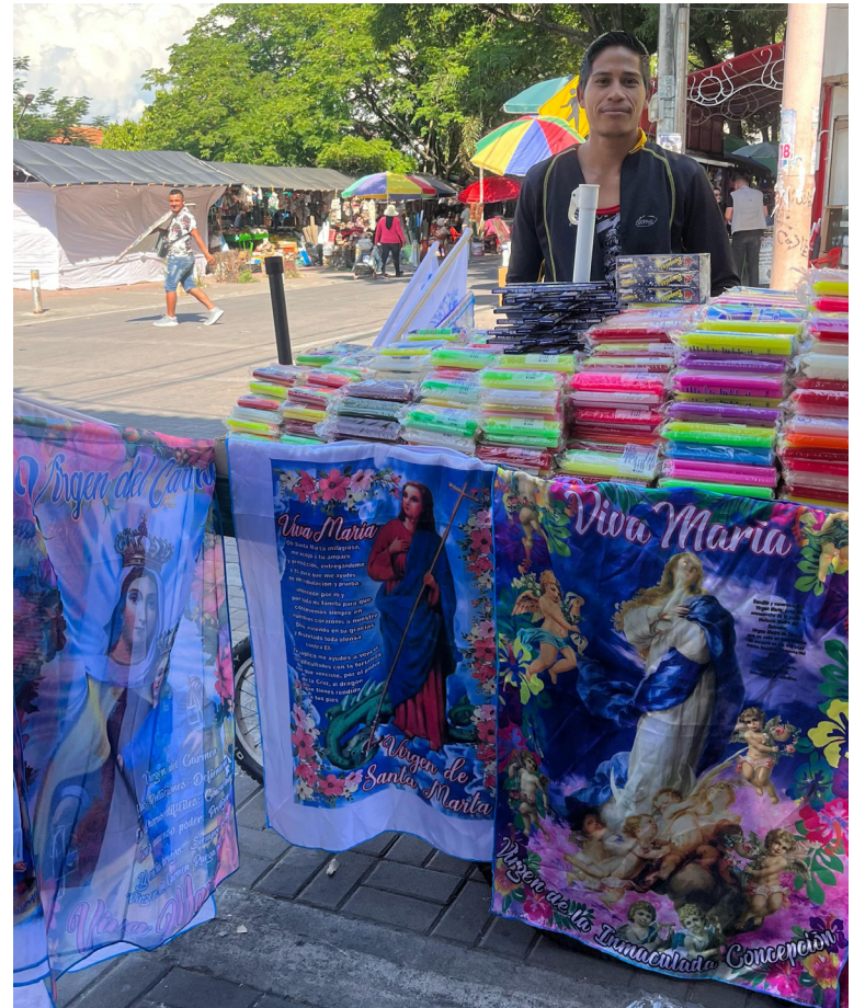
Son varios los vendedores informales que le apuesta a esta tradición.

La Noche de las Velitas no solo es una oportunidad para celebrar