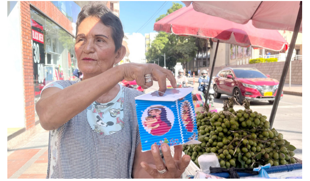
Hoy Noche de Velitas en Neiva