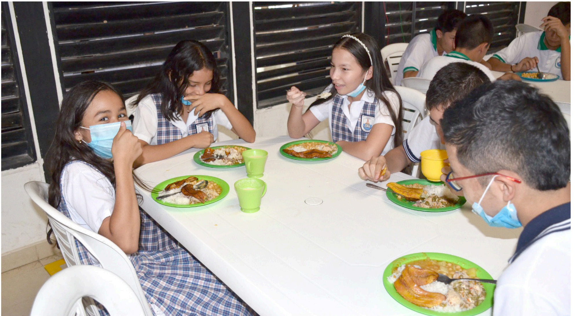
Estas inversiones, destinadas a productos para el Programa de Alimentación Escolar (PAE), beneficiaron a más de 118.000 niños, niñas y adolescentes, consolidando al Huila como líder en compras públicas locales.