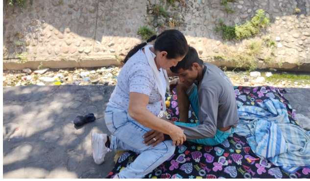
Un Reencuentro Entre Amor y Dolor