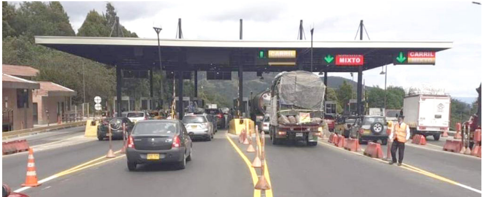
En las vías de Colombia hay cerca de 180 peajes.

Actualmente, aunque el congelamiento de tarifas podría levantarse pronto, permitiendo que los precios de los peajes se incrementen nuevamente, la demanda podría forzar una actualización automática de las tarifas o la implementación de un plan para un aumento gradual. Esta situación encuentra eco en el sector trans-