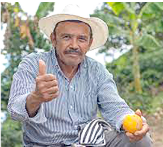
El Gobierno Departamental del Huila, liderado por el Programa de Alimentación Escolar (PAE), invierte más de $106.000 millones en compras locales, impulsando la economía regional.

rante todo el cuatrienio para cumplir con la normativa establecida en la Ley 2046 de 2020. Entre los productores locales que participaron se encuentran la Asociación de Colombia Huila, Asociación de Jóvenes Emprendedores, Don Julio, Don Miguel, Grupo Gerko, Trébol, Asociación de Brisas del Huila, y la Asociación de Jóvenes Agropecuarios, entre otros. “Los agricultores y productores de todo el departamento experimentaron beneficios significativos, especialmente a través de la adquisición de diversos productos como panela, frijol, maíz, plátano, frutas, cárnicos y huevos. Estas compras no solo respaldaron la actividad productiva local, sino que también representaron una inversión sustancial en el sector. En el seno del equipo ejecutivo del Programa de Alimentación Escolar (PAE), destacamos con énfasis estas adquisiciones, las cuales se realizaron en concordancia con la Ley de Compras Públicas Locales”, resaltó la Secretaría de Educación Departamental. A pesar de los desafíos encontrados en el cumplimiento de la ley por parte de algunos alcaldes, la iniciativa de compras públicas locales en el Huila ha demostrado ser un éxito, fortaleciendo los circuitos cortos de comercialización y beneficiando a