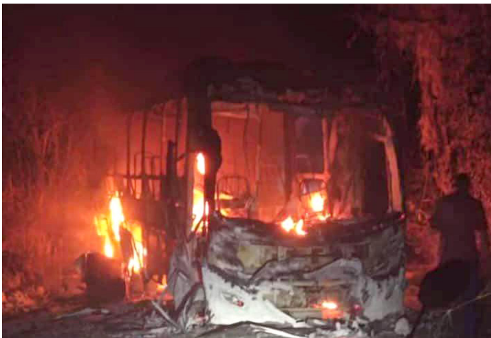
Vehículos incendiados anteriormente.

Ya para finalizar, la cuarta versión del Reloj de la Criminalidad de la Corporación Excelencia en la Justicia presentó un balance sacado del Sistema de Información Estadístico, Delincuencial, Contravencional y Operativo de la Policía (SIEDCO), en el que advierten que el hurto en Colombia aumentó 23% en el primer semestre de este año, mientras que la extorsión 38%.