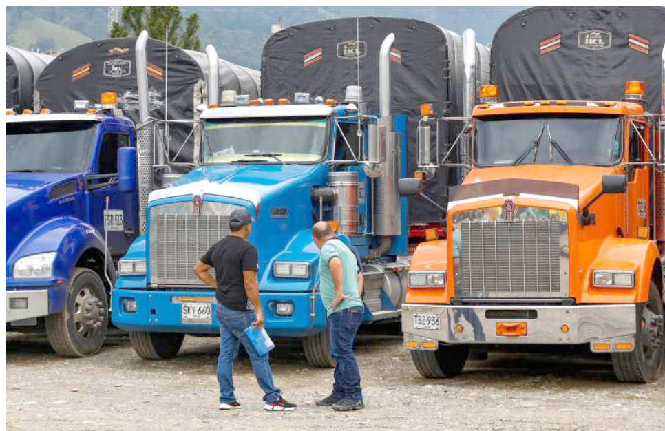
El aumento de las tarifas de peaje se llevará a cabo de manera progresiva en 2024.

El documento detalla que el aumento de las tarifas de peaje se llevará a cabo de manera progresiva en 2024. Además, la intención es hacer el ajuste sin generar un impacto económico inmediato en los usuarios de las vías. Aunque no se especificó el por-