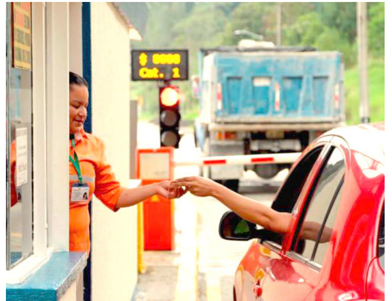
La CCI insistió en que el decreto garantizará la continuidad de la financiación.

Un peaje es un pago que se hace como derecho para poder cruzar una puerta, un puente o para circular por un camino.