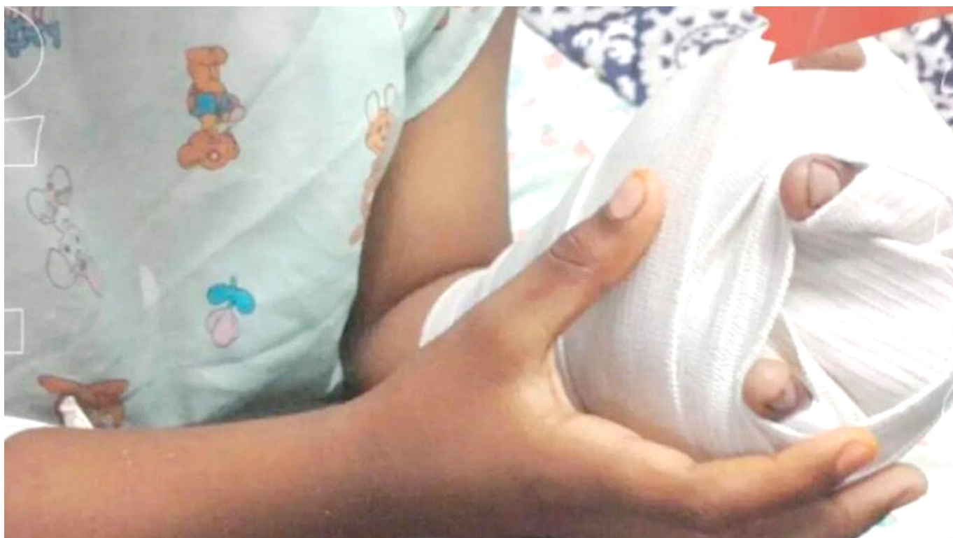
El menor de 9 años, tercer afectado por pólvora en Neiva, presenta posibles daños oculares y quemaduras en el rostro de grado 1.

Hasta el momento, no se han reportado casos de intoxicaciones por consumo de fósforo blanco o metanol en la región. Sin embargo, el llamado a la prudencia y responsabilidad persiste, enfocándose en evitar situaciones que pongan en peligro la sa-