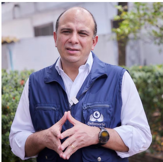
Se destaca que este salario debe cubrir las necesidades básicas de los trabajadores y sus familias, sin ser motivo de explotación laboral ni precarización del empleo.

ser motivo de explotación laboral ni precarización del empleo.