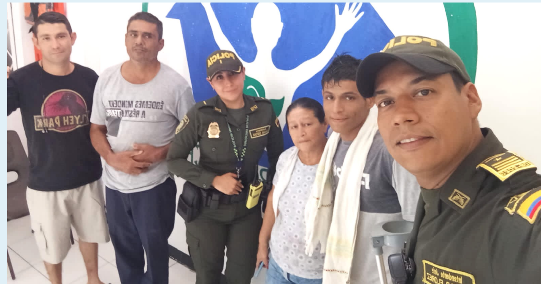
El joven se encontraba en condición de calle desde hace meses en Neiva.

La problemática de los habitantes de calle en Neiva continúa siendo un reto significativo para las autoridades locales, quienes, a pesar de los programas implementados y la colaboración de diversas instituciones, se enfrentan a obstáculos considerables para brindar soluciones duraderas a esta realidad social compleja y multifacética.