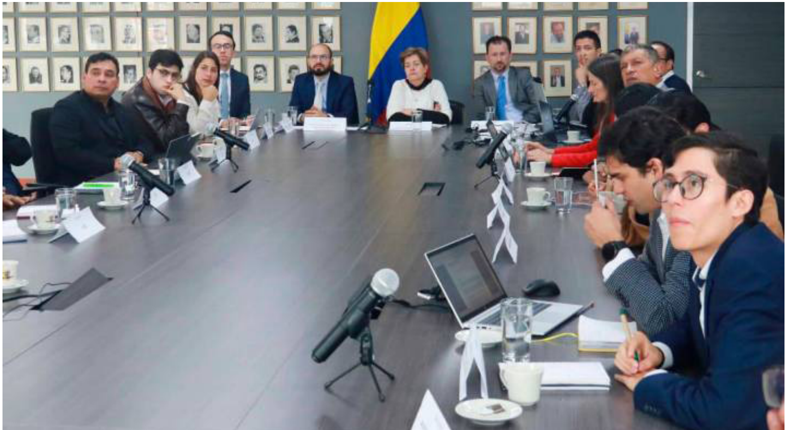
La productividad, en particular, es uno de los elementos críticos, puesto que para determinar el aumento que registrará en 2024, se presentó un dato negativo del -1%.

Se destaca que este salario debe cubrir las necesidades básicas de los trabajadores y sus familias, sin