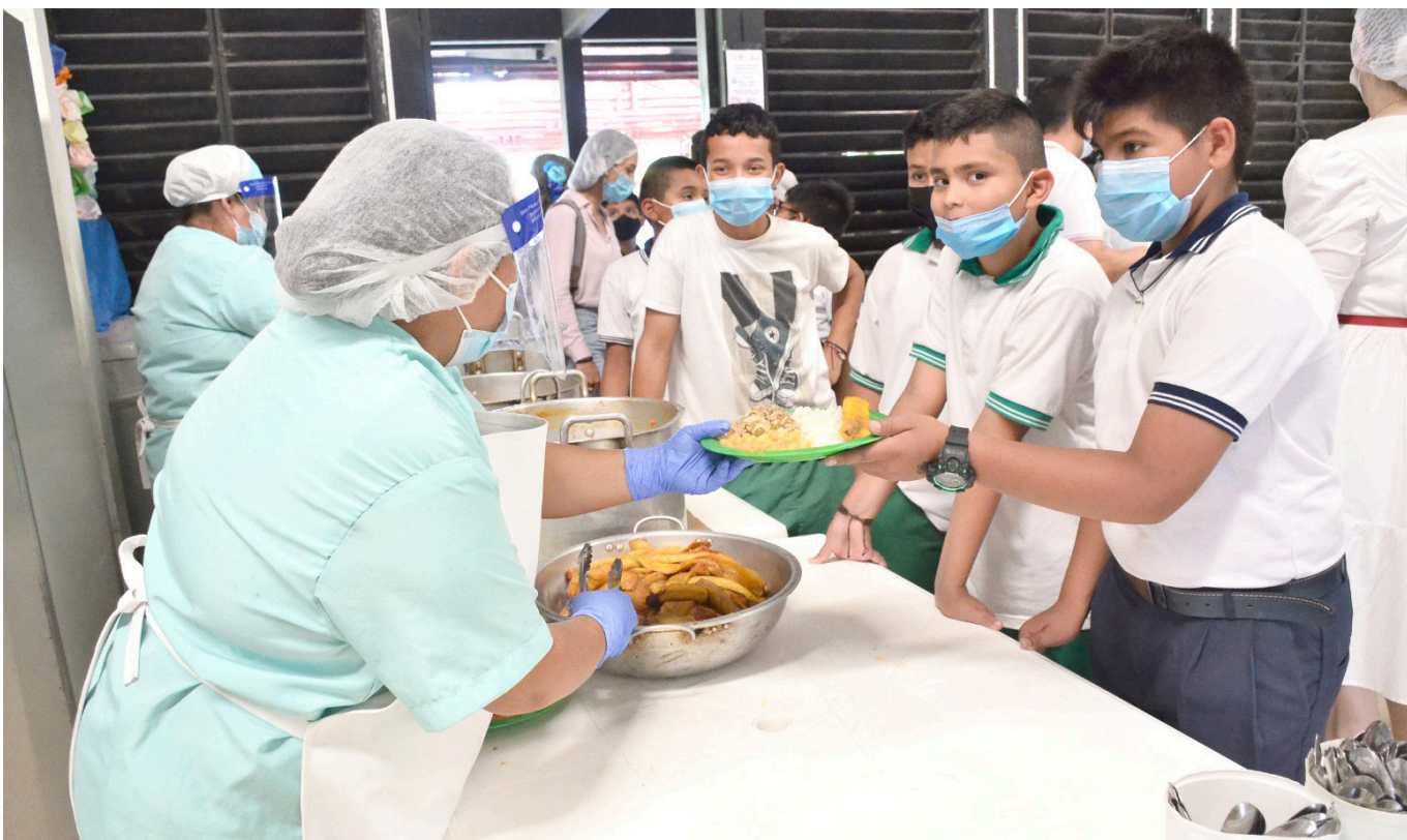
El Gobierno Departamental del Huila, liderado por el Programa de Alimentación Escolar (PAE), invierte más de $106.000 millones en compras locales, impulsando la economía regional.

A pesar de algunos incumplimientos de alcaldes en la implementación de la Ley de Compras Públicas Locales, el Huila destaca a nivel nacional con más de 100.000 millones de pesos beneficiando a productores locales.