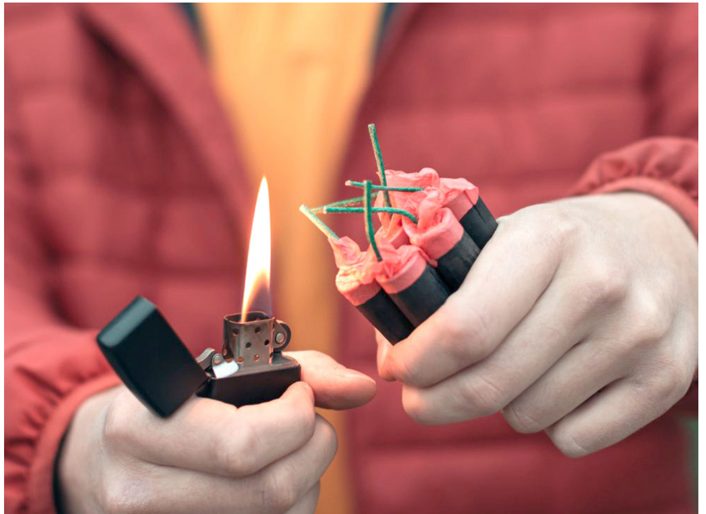
La manipulación irresponsable de pólvora ha dejado tres personas lesionadas en el Huila en los primeros días de diciembre.

En los primeros días de diciembre, el Huila registra un preocupante incremento de casos relacionados con pólvora.