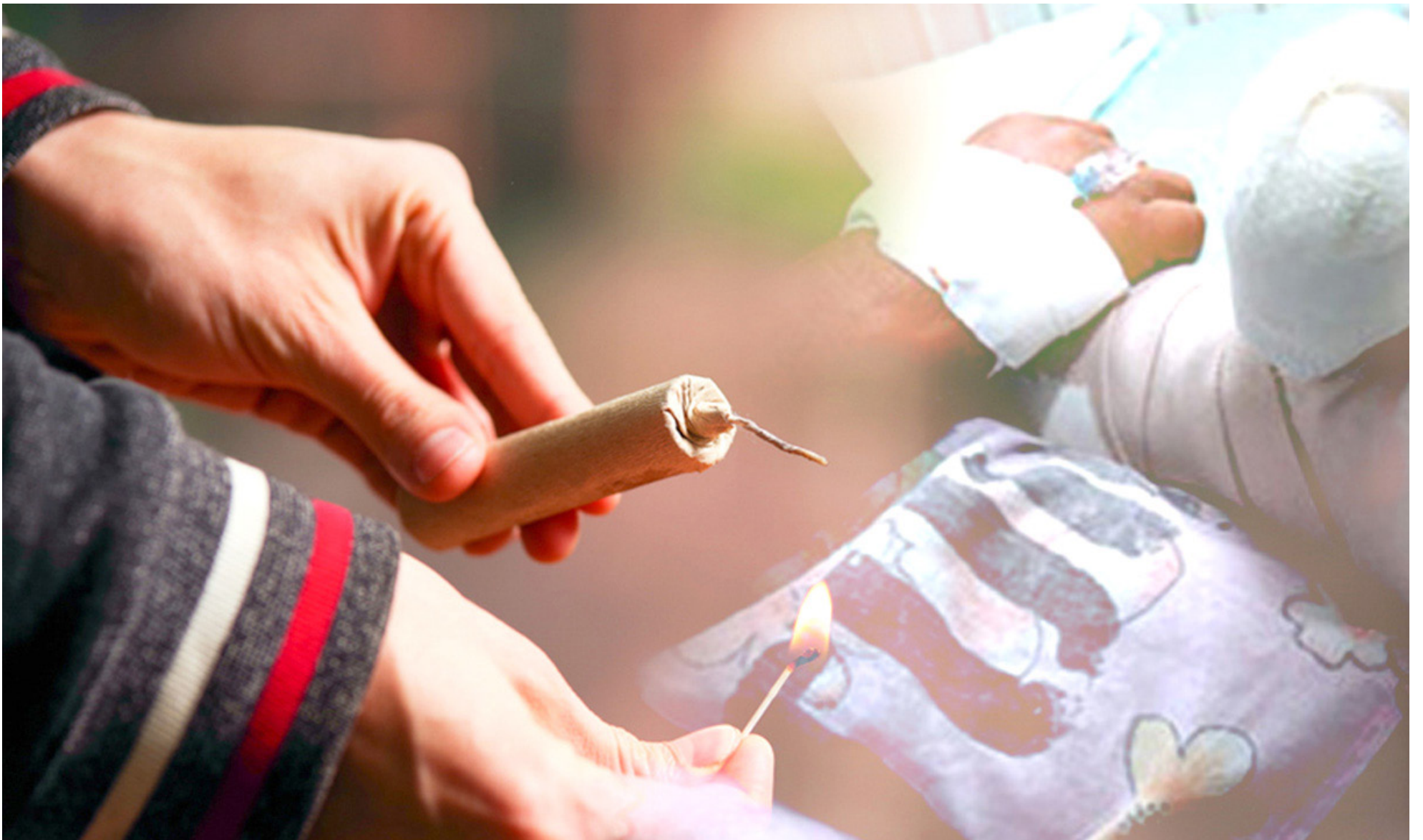
Las multas por el incumplimiento de las regulaciones sobre pólvora podrían alcanzar hasta más de 300 millones de pesos, según la ley 2224 de 2022.

lud y bienestar de la población, especialmente de los más jóvenes, durante estas festividades. La pólvora, en manos inexpertas, puede transformar momentos de alegría en tragedias irreparables.