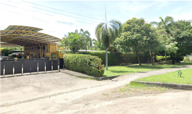
Se 'enreda' construcción de la carrera 7W