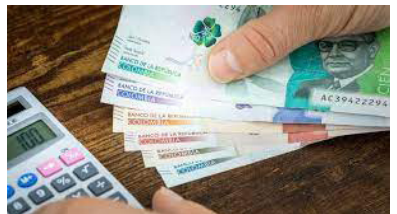
La normativa que fijó el impuesto define que el tributo a aplicar es de 0,00005 UVT por gramo de plástico utilizado.

La reforma tributaria también fijó la reglamentación de Presencia Económica Significativa, apoyada en el Decreto 2039 del 2023. Esta asegura que las plataformas digitales extranjeras deberán pagar un impuesto adicional al del 19% fijado por el IVA,