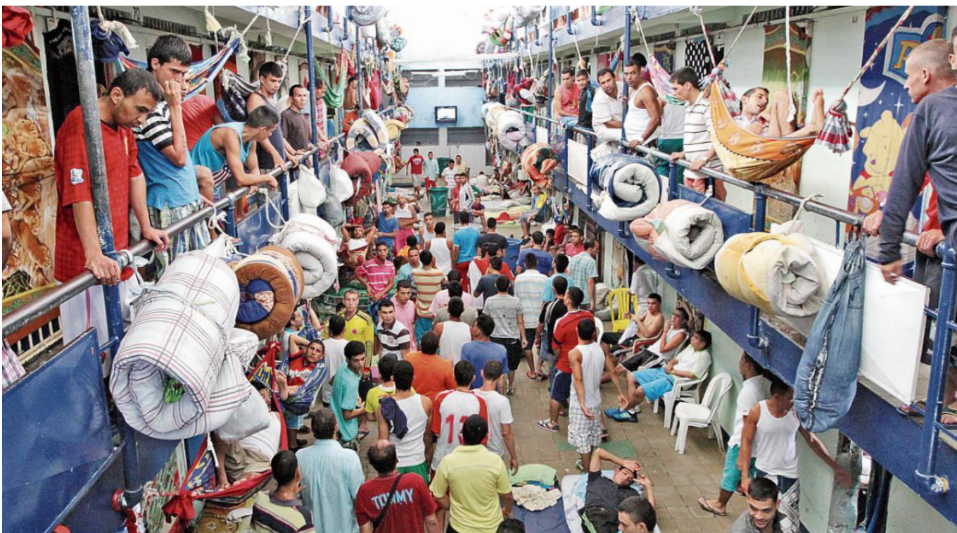
Es importante destacar que estas irregularidades no son un caso aislado en las revisiones realizadas por la Contraloría General a la Uspec.

En relación con esta situación, el ente de control indica que la problemática de aglomeración en las cárceles del país ya sobrepasa el 50%, lo cual podría agravarse ante la posible llegada de los presos colombianos que se encuentran recluidos en el Ecuador.