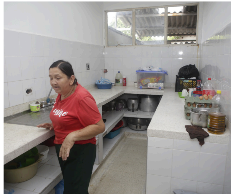
La cocina, es necesario hacerle una ampliación y dotarla de menaje nuevo.

A pesar de las carencias, el personal demuestra dedicación, buscando la manera de brindar momentos de alegría y cuidados con amor a aquellos que han sido abandonados por sus familias.