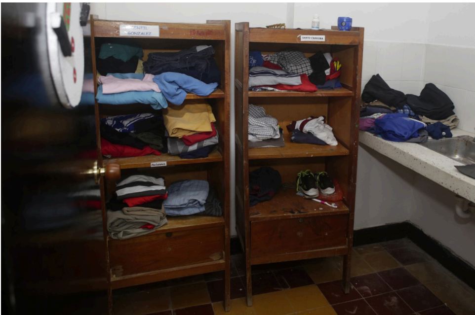
El mobiliario existente donde guardan las pertenencias los abuelos también está obsoleto.