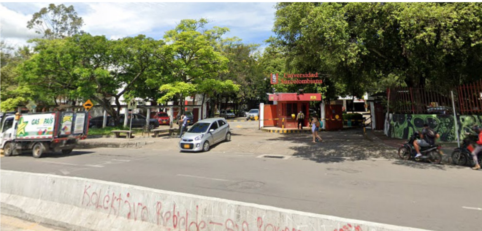
La zona tiene alta afluencia de universitarios.

Ya para finalizar, desde esta cartera, tienen planeado tapar 100 huecos que se encuentran en las distintas vías de la ciudad, que es una de las demandas de la comunidad que peticionaba a las administraciones de turno, pues no más la avenida Circunvalar que tiene alto flujo vehicular.