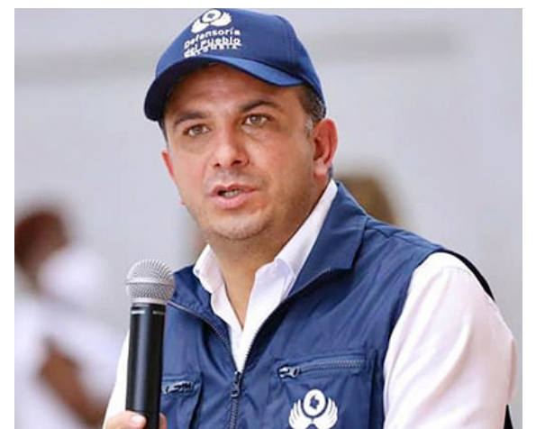
De acuerdo con la Defensoría del Pueblo, durante el primer año del cese al fuego bilateral fueron cometidas 236 violaciones a los derechos humanos e infracciones al Derecho Internacional Humanitario.

Sin embargo, los resultados son fueron positivos. De acuerdo con