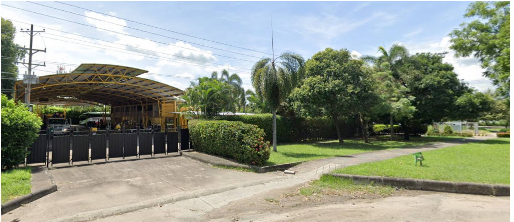
Predio público arrendado a un particular.