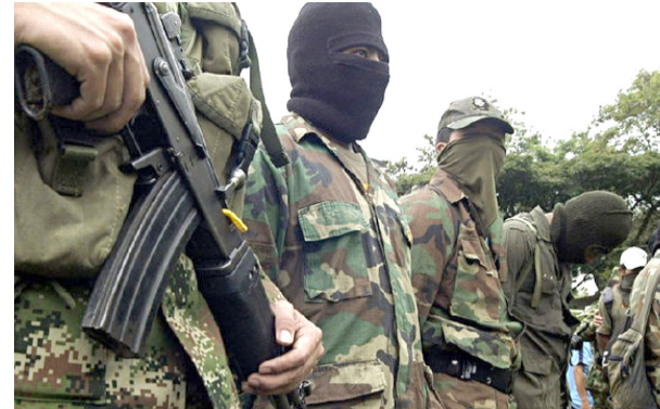
Docentes amenazados en el Huila