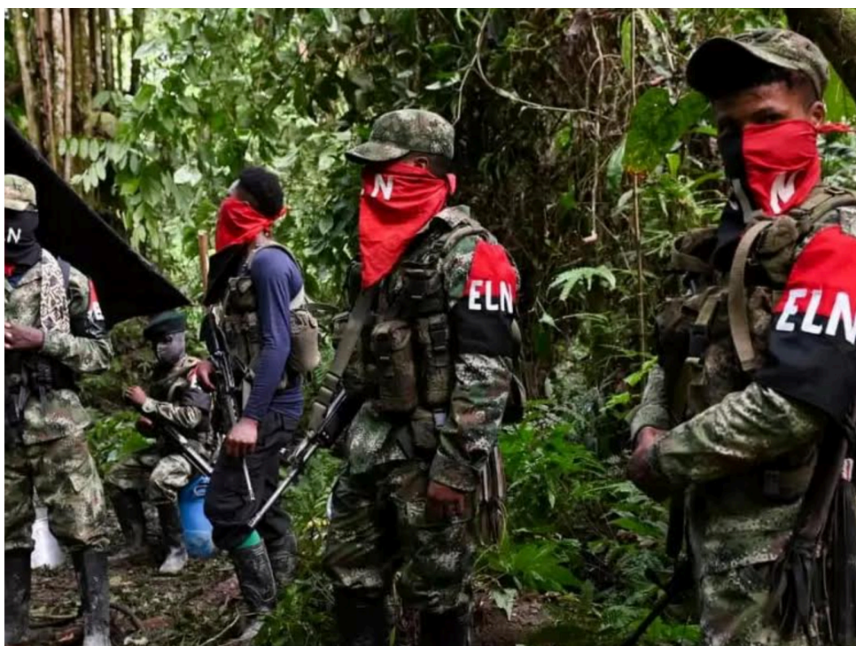
El ELN cometió al menos 59 acciones desde que comenzó el 3 de agosto de 2023 el cese al fuego.

Por su parte, según un informe publicado el martes 6 de febrero de 2024, por el Instituto de Estudios para el Desarrollo y la Paz (Indepaz), el ELN cometió al menos 59 acciones desde que comenzó el 3 de agosto de 2023 el cese al fuego, de las cuales 33 han sido ataques directos a la población.