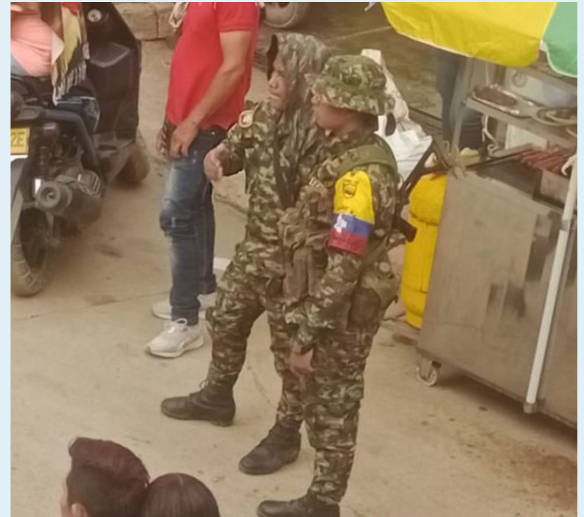
En días pasados hizo presencia la guerrilla de las Farc en este municipio.

Allí se narra que en mayo de 2002, el grupo paramilitar Conquistadores del Yarí inició operaciones en el nororiente del departamento del Huila, en los municipios de Colombia, Baraya,