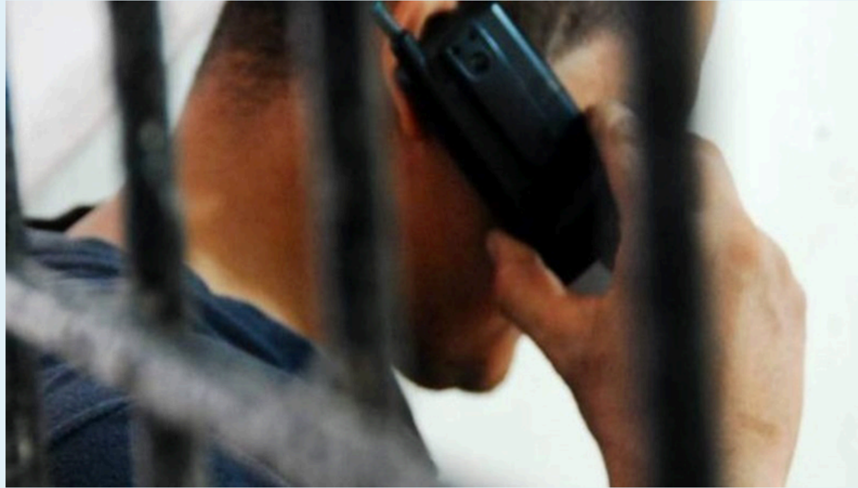
Los docentes ya interpusieron las respectivas denuncias. Van a investigar lo sucedido.

"El objetivo principal de ellos [...] era que iban a hacer limpieza total de ladrones, de drogadictos, de gays, de auxiliares de la guerrilla...".