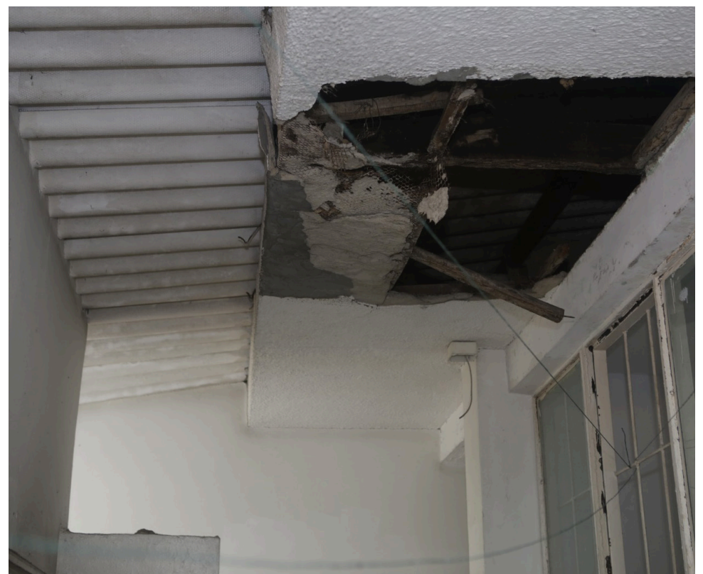
La infraestructura también requiere de una intervención urgente.