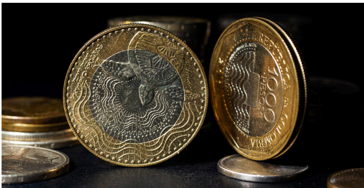
Aunque este tributo no está dirigido principalmente a todos los colombianos, lo cierto es que las plataformas podrían subir su precio para costear dicho rubro.

Marzo 14 (periodo enero - febrero) Mayo 16 (periodo marzo - abril) Julio 15 (periodo mayo - junio) Septiembre 13 (periodo julio - agosto) Noviembre 18 (periodo septiembre - octubre) Enero 16 de 2025 (periodo noviembre - diciembre)