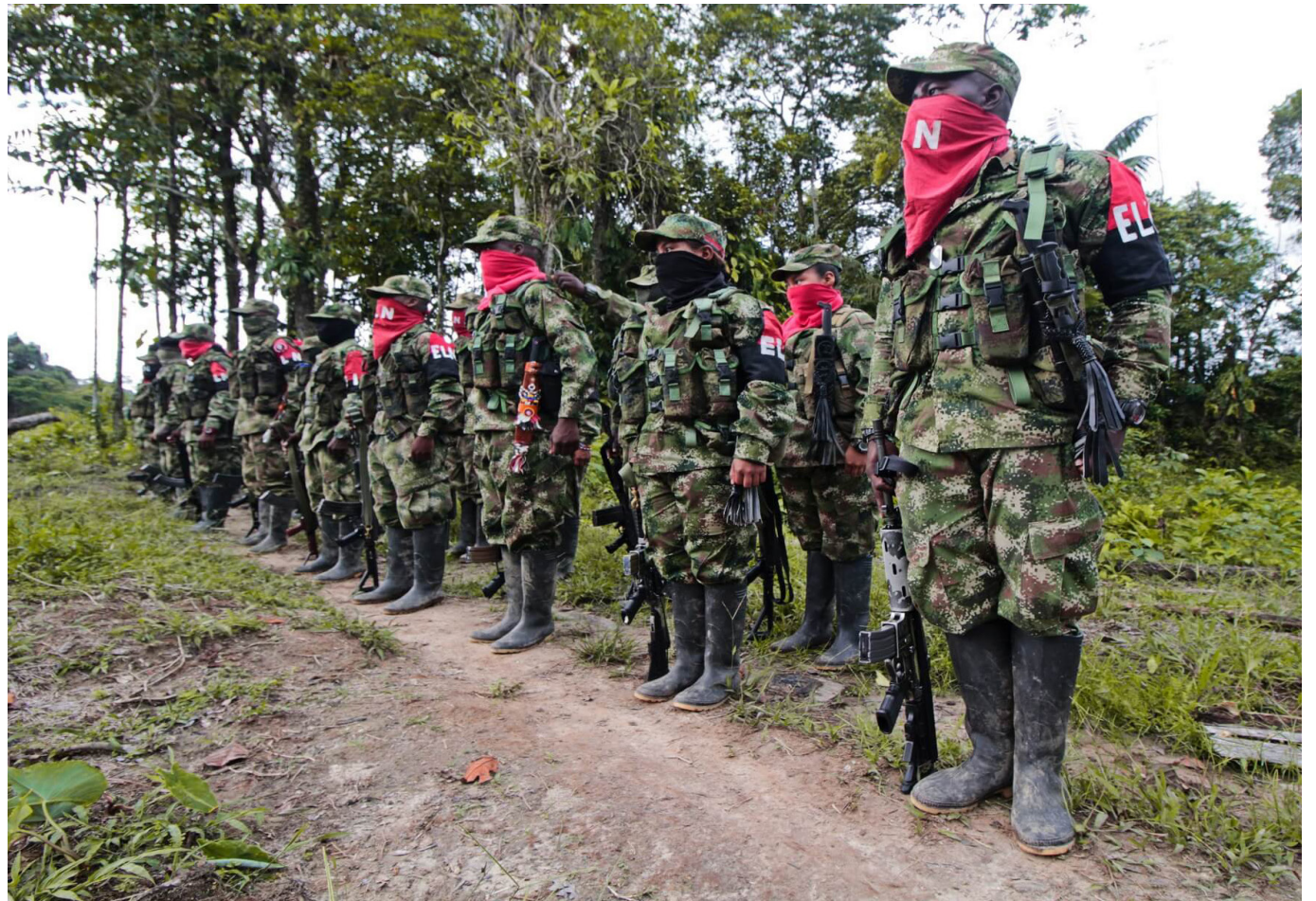
Aunque el Defensor del Pueblo valoró el reciente anuncio de extender 180 días el cese al fuego bilateral, consideró fundamental que el grupo guerrillero muestre compromiso de paz con los secuestrados.

Según cifras de la entidad, durante el 2023 alrededor de 110 hombres y mujeres fueron reportados como secuestrados en el territorio nacional. A partir de 2024, y a raíz del trabajo que la Defensoría ha venido haciendo en las regiones, contabiliza el secuestro de 12 personas.