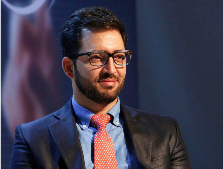
La implementación del servicio de vigilancia electrónica en Colombia, dirigido a los presos que cuentan con el beneficio de casa por cárcel, ha desatado una controversia entre las entidades de control del Gobierno y los responsables de las prisiones en el país.

■ Anomalías detectadas por la Contraloría destacan el cobro del servicio de mantenimiento de brazaletes electrónicos que están inactivos.