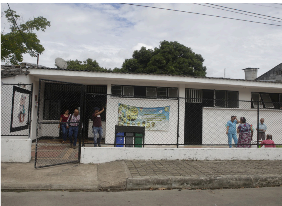
Hoy en día, el hogar funciona en las antiguas instalaciones del puesto de salud del municipio de Tello.

lucha por la dignidad y el cuidado de quienes alguna vez fueron los pilares de sus familias continúa. A pesar de las dificultades, el compromiso y la dedicación del personal, así como la solidaridad de aquellos que desean contribuir, ofrecen una luz de esperanza en medio de la oscuridad.