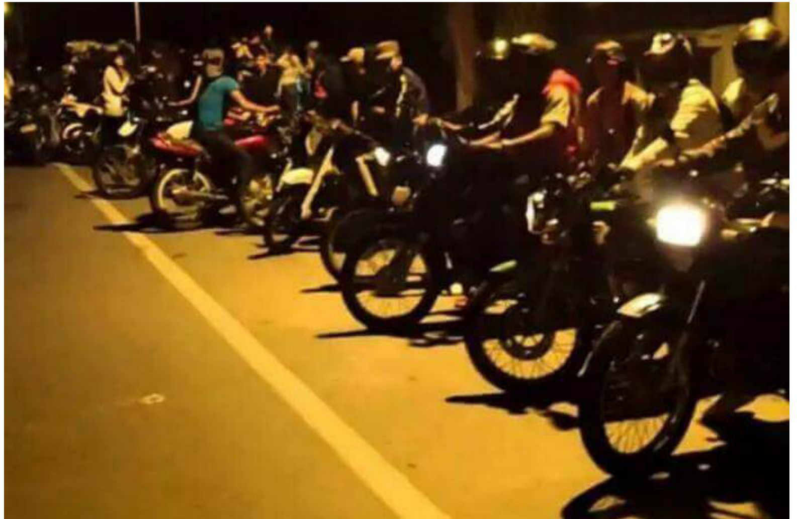
Asimismo, combatirán los 'piqueos ilegales'.

Tal como el hurto a motocicletas, cada 13 minutos saquearon un establecimiento de comercio, y si bien este delito se redujo 7% al registrar 20.642 casos o, en promedio, 115 incidentes diarios, en dos franjas horarias antes del mediodía este delito tendió a cometerse con mayor asiduidad: entre las 12 a.m. y las 12:59 a.m. (78% más casos) y