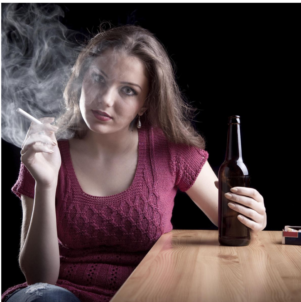
Uno de los peligros de este cáncer es que, en sus primeras etapas, puede pasar desapercibido.

En palabras del presidente del CJD, “es fundamental que los pacientes oncológicos se comuniquen con su equipo médico y su dentista para recibir orientación específica sobre cómo manejar los efectos secundarios bucodentales y garantizar una atención integral durante el tratamiento”. En última instancia, la prevención, la detección temprana y el cuidado dental adecuado son esenciales en la lucha contra el cáncer oral.