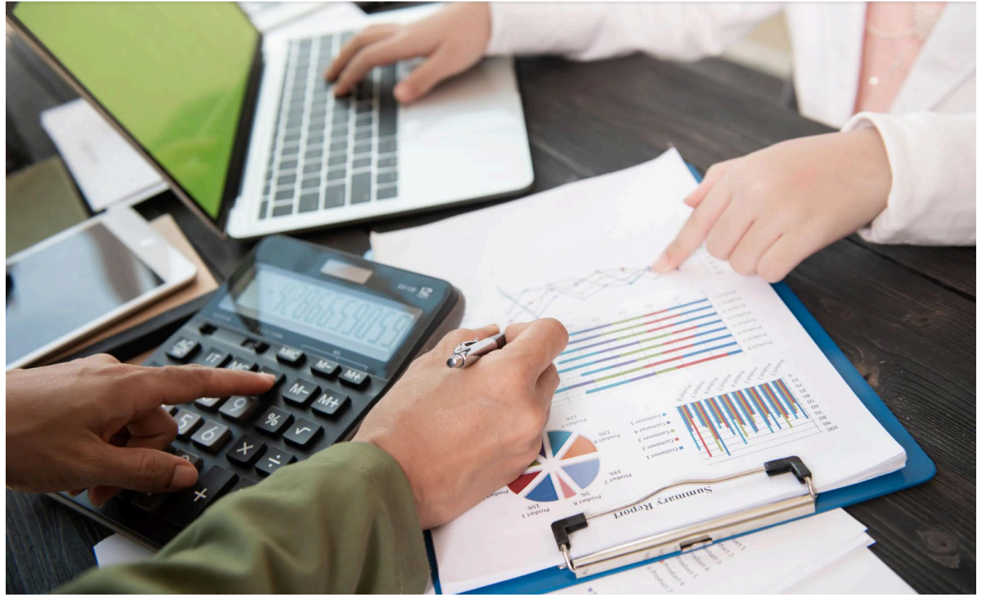
Estos son los impuestos que empiezan a regir en 2024.

En el compás constante de la economía venezolana, los 3.000 bolívares se embarcan en una travesía de transformación a pesos colombianos hoy, lunes 15 de enero, marcando la pauta de las fluctuaciones monetarias en el país.