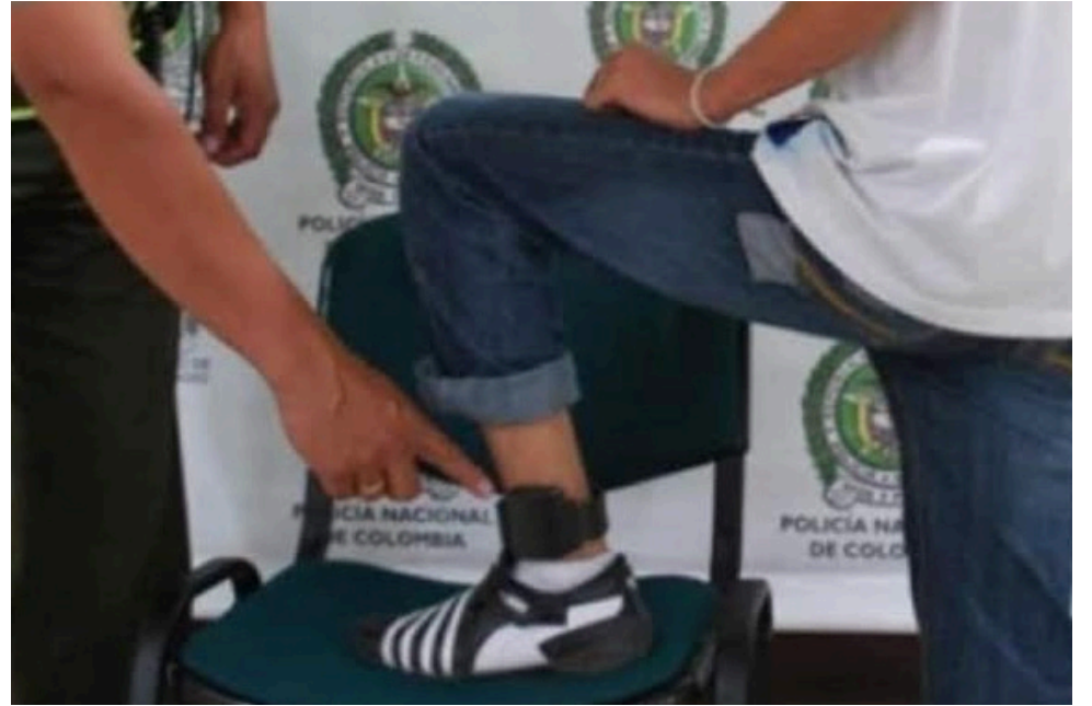
Tras estos hallazgos, se ha revelado que el reporte de facturación mensual no fue debidamente verificado.

La implementación del servicio de vigilancia electrónica en Colombia, dirigido a los presos que cuentan con el beneficio de casa por cárcel, ha desatado una controversia entre las entidades de control del Gobierno y los responsables de las prisiones en el país.