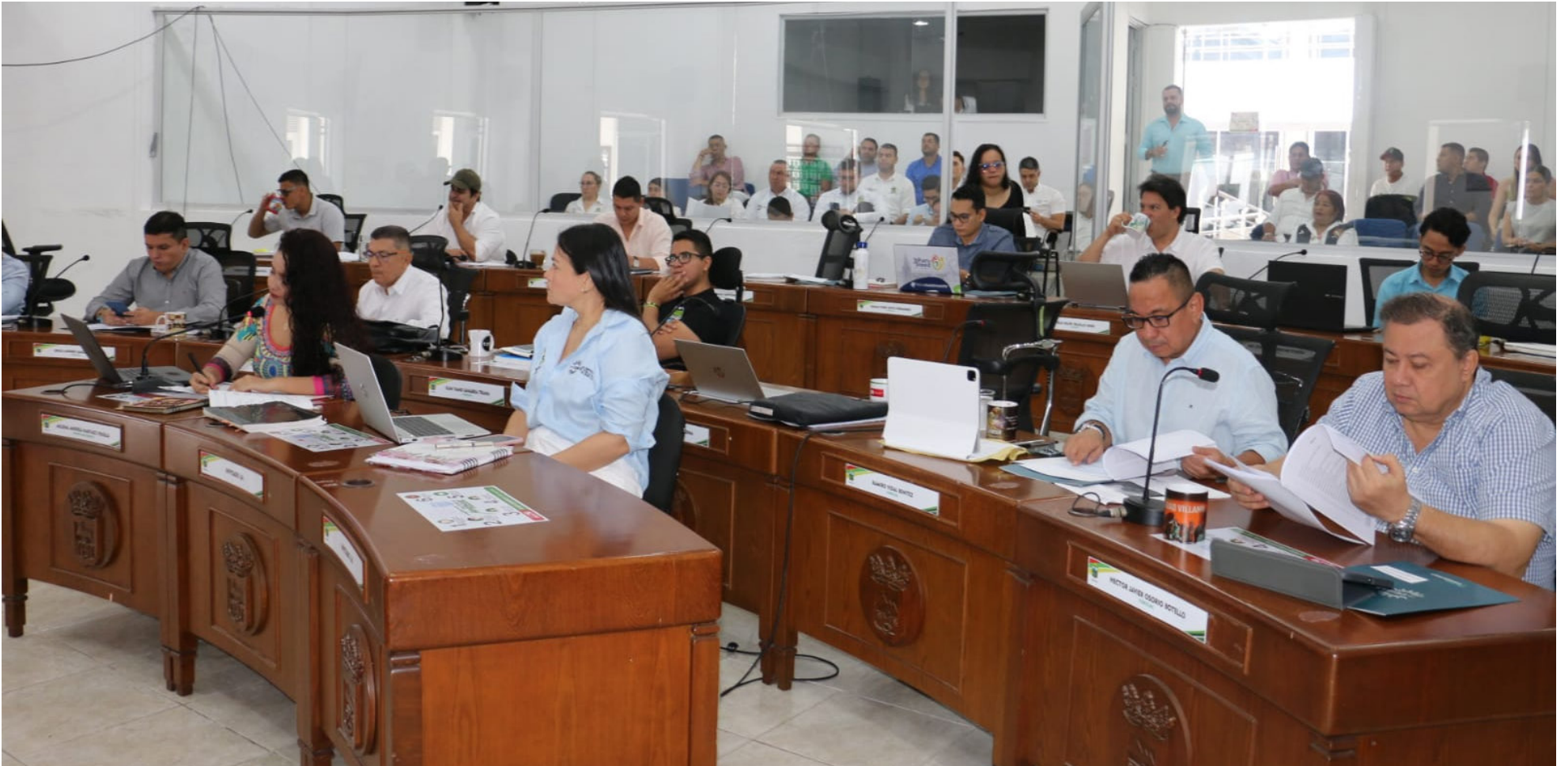
Durante la sesión de control político, los concejales expresaron su preocupación por la situación de Las Ceibas. Hicieron hincapié en la necesidad de implementar medidas urgentes para garantizar la estabilidad económica y recuperar los recursos invertidos en proyectos no viables.

“situación lamentable que está viviendo en estos momentos las Empresas Públicas ad portas de ser intervenida por la superintendencia. Me preocupa muchísimo lo de la PTAR, hoy le dije al gerente que no se le invierta ni un peso más en esta planta de tratamiento de agua residual que han querido muchas administraciones anteriores para hacerla y no es viable, no tenemos licencia, más de cinco mil millones de pesos invertidos allí, agua no contabilizada, hay que hacer un buen plan choque para recuperar estos recursos pero además también le hemos pedido a la junta directiva que por favor empiecen a buscar la manera de cómo recaudamos todos estos recursos que, en cartera hay que recuperar.