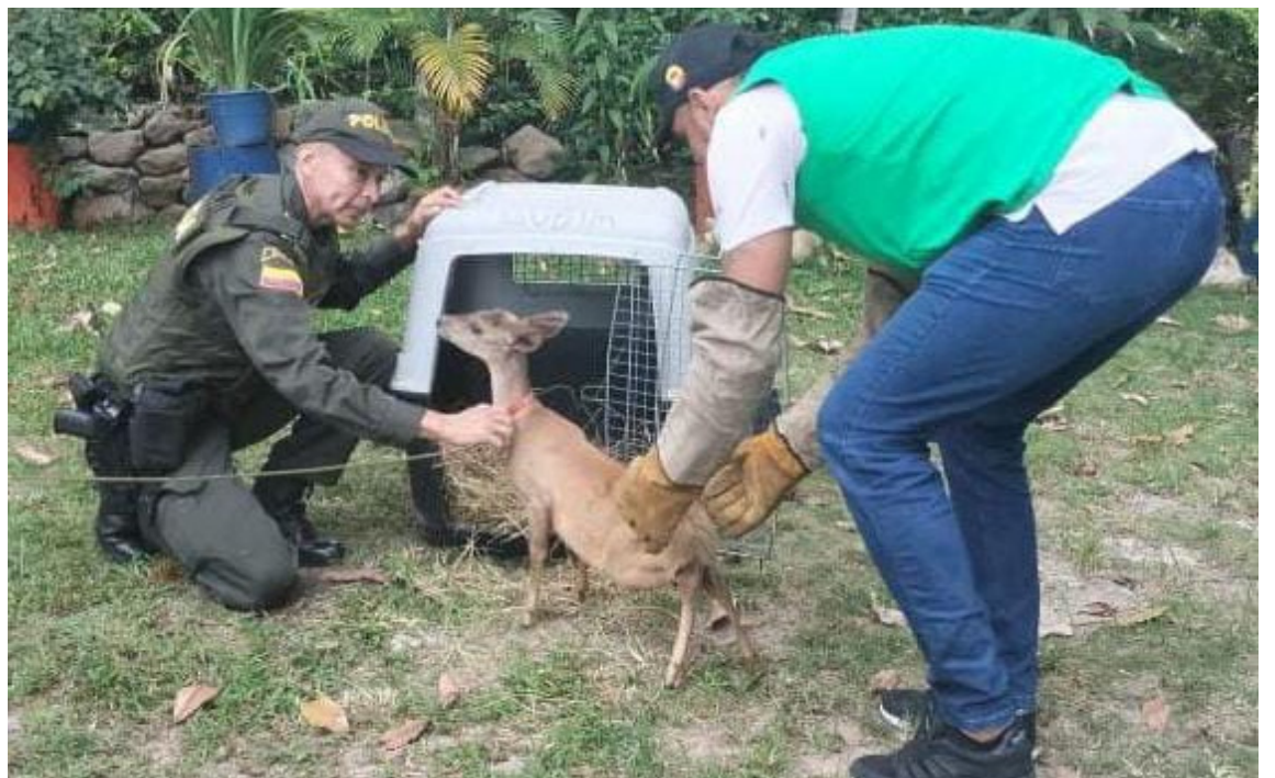
El rescate de un cachorro de venado en el corregimiento de La Ulloa en Rivera por parte de la Policía Metropolitana y profesionales de la Cam.