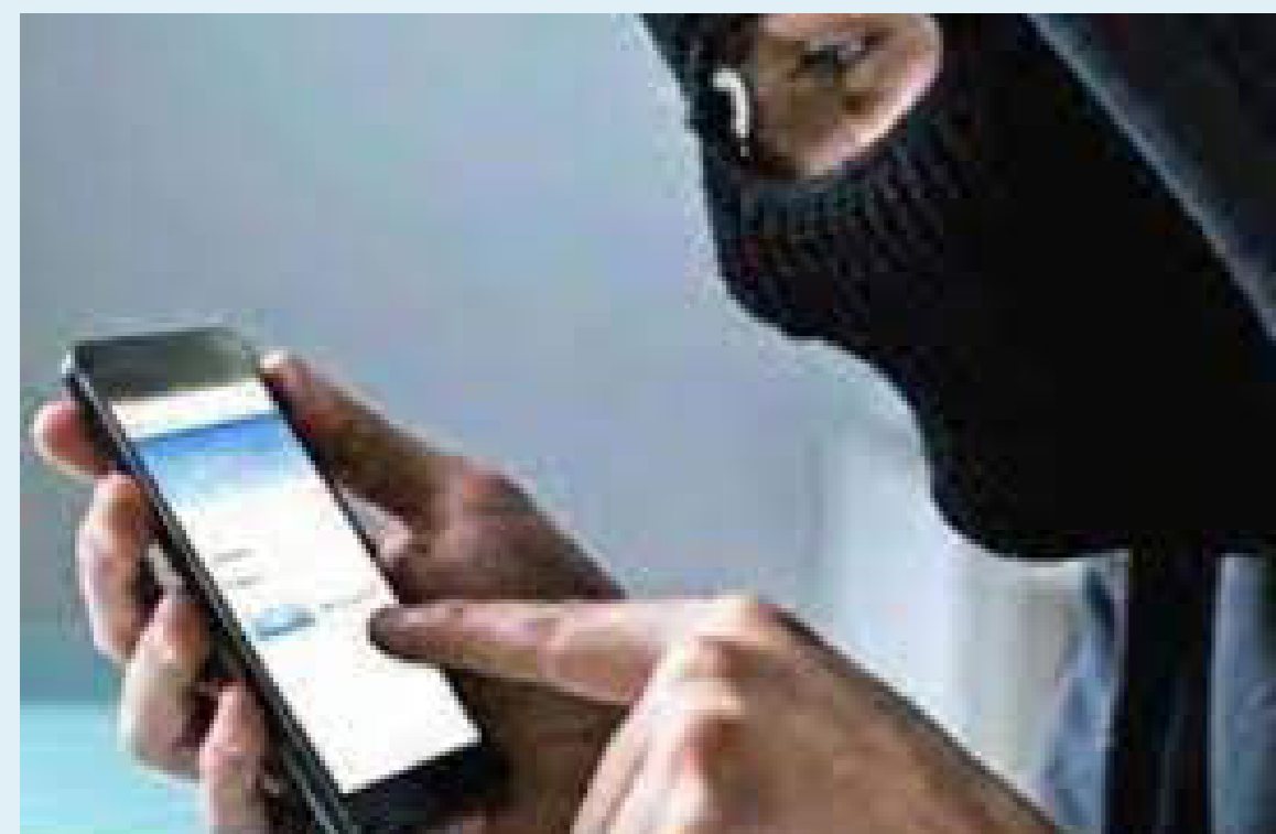
Los docentes fueron amenazados vía telefónica.

Este hecho, a finales del año anterior y este 2024 ha mantenido en alerta a toda la comunidad del municipio. Ahora, ¿Han llegado los paramilitares o es delincuencia? Las autoridades lo determinarán.