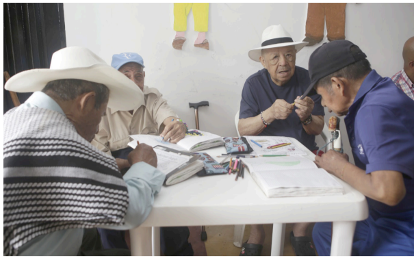
Un hogar en busca de dignidad