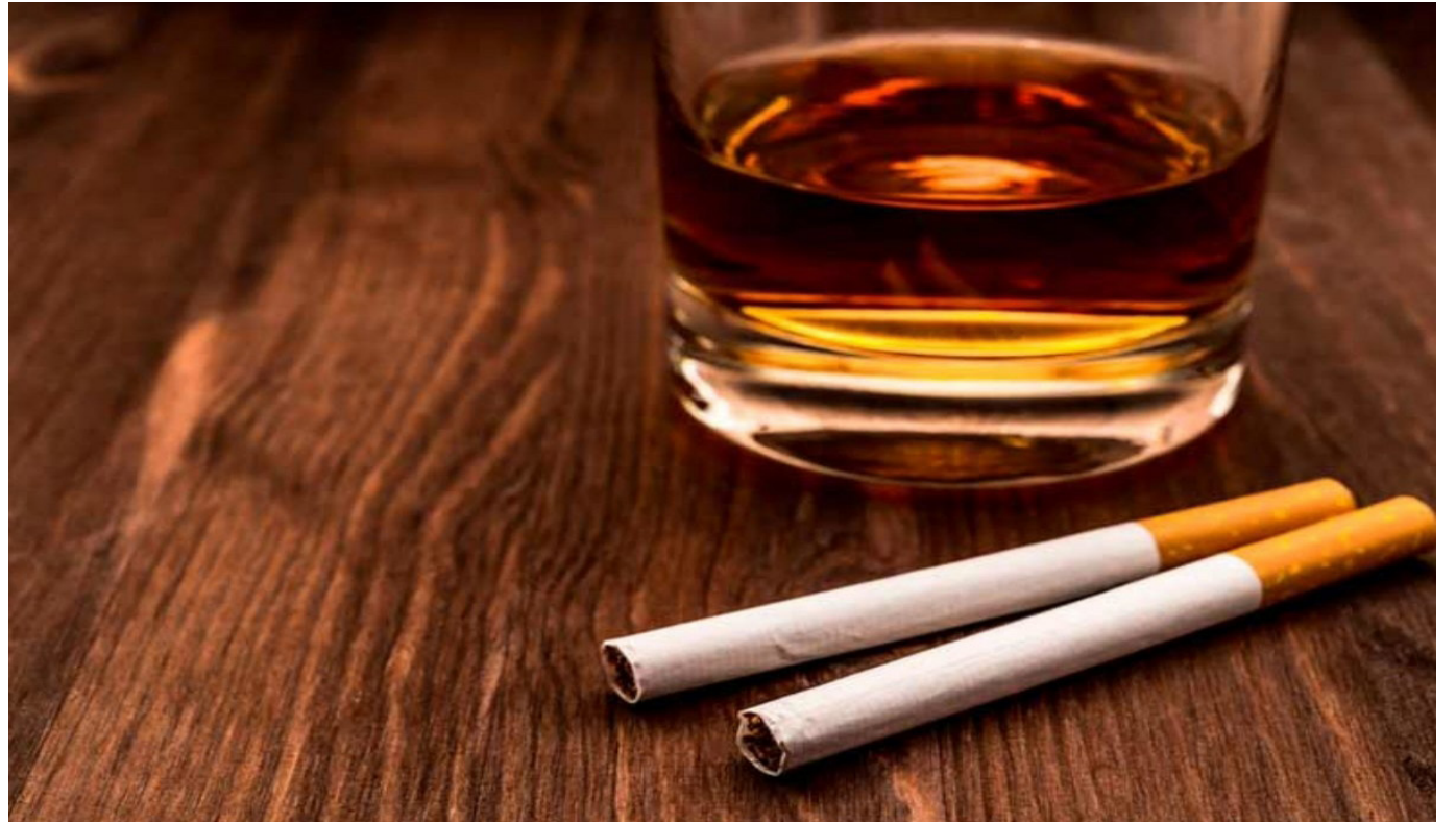
El consumo frecuente de cigarrillo y de licor pueden provocar cáncer.

Según datos de la Sociedad Española de Oncología Médica (SEOM), se estima que para el año 2024 se diagnosticarán aproximadamente 7,603 casos de cáncer oral y de faringe. Además, Castro Reino ha subrayado que al menos el 75 por ciento de los pacientes diagnosticados a partir de los 50 años han sido consumidores de tabaco.