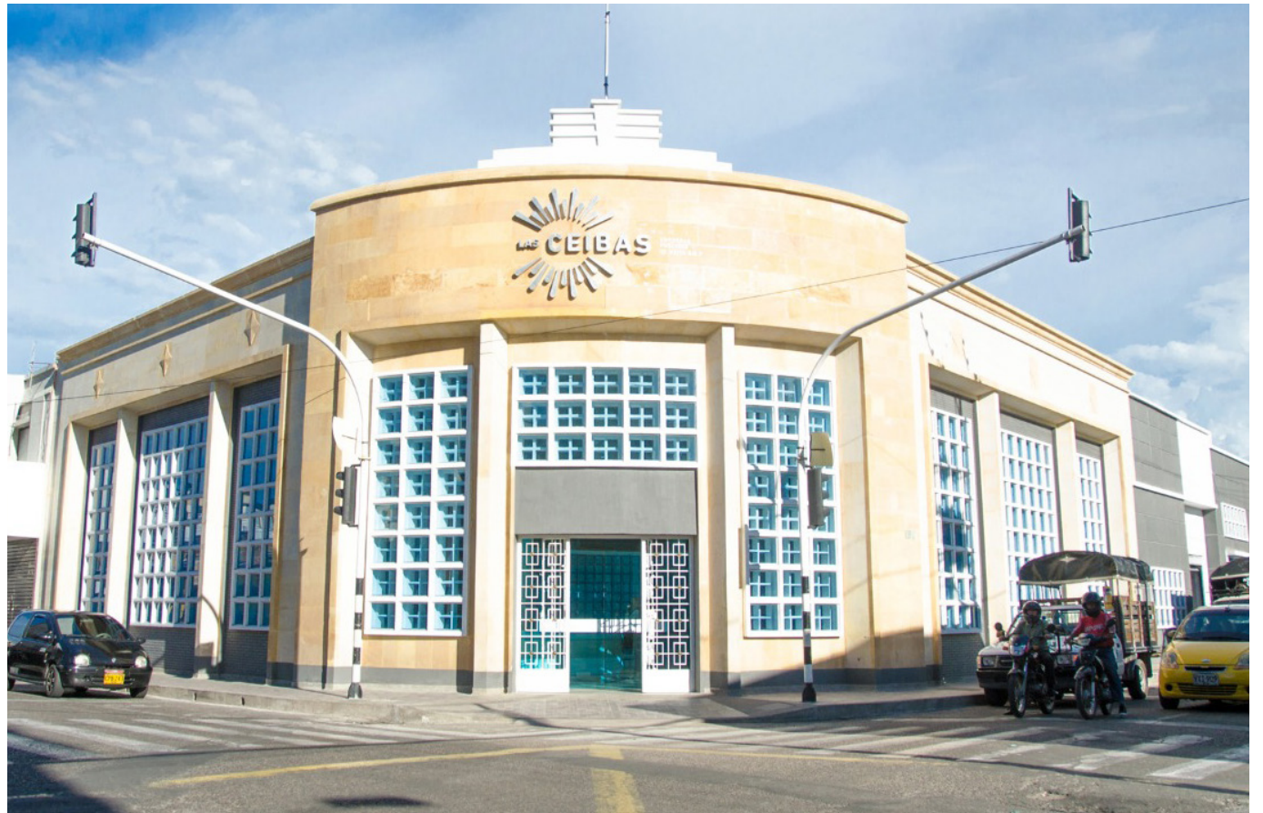
La deuda de 48 mil millones de pesos y multas impuestas amenazan la estabilidad de Las Ceibas, Empresas Públicas de Neiva.

En medio de una crisis financiera, Las Ceibas, Empresas Públicas de Neiva (EPN), enfrentan una deuda pública que asciende a 48 mil millones de pesos.