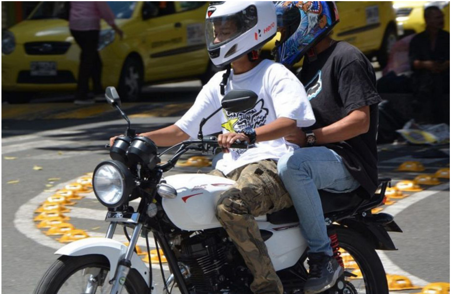
Plantean restringir el parrillero en la ciudad.

La propuesta ‘blindará’ a los adultos mayores de 60 años de edad y a los menores que transitan con sus padres o acudientes.