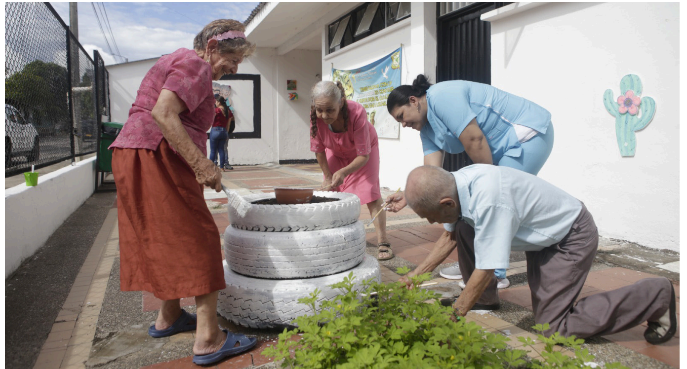
La Casa del Adulto Mayor se convierte en un hogar necesario para los ancianos después de que otra sede, ya obsoleta, fuera descartada por no cumplir con las especificaciones técnicas requeridas.

La Casa del Adulto Mayor 'Max Duque Gómez' enfrenta desafíos que revelan la cruda realidad de quince abuelos que comparten sus días en un antiguo centro de salud del municipio de Tello.