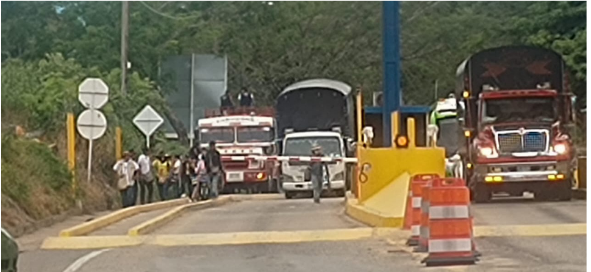
Los manifestantes indígenas del Huila bloquearon pacíficamente el peaje de Los Cauchos como medida de protesta.

Las comunidades indígenas del Huila, representadas por el Consejo Regional Indígena del Huila (CRIHU), se tomaron pacíficamente el peaje de los Cauchos, que comunica a Neiva con el municipio de Campoalegre. Los manifestantes exigen el cumplimiento de los acuerdos establecidos con el gobierno nacional.