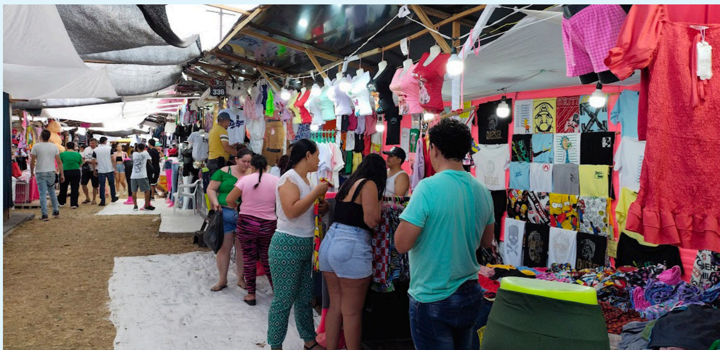
Caídas de construcción, comercio y manufactura llevaron a la economía a crecer 0,6% en 2023.

“En la actual coyuntura, no resulta aconsejable avanzar en una iniciativa de reforma tributaria que pueda resultar gravosa para las empresas y para las familias. Es crucial abstenerse de flexibilizar la regla fiscal o implementar inversiones forzosas. Y, en cualquier caso, debe preservarse un marco fiscal prudencial”, concluyen.