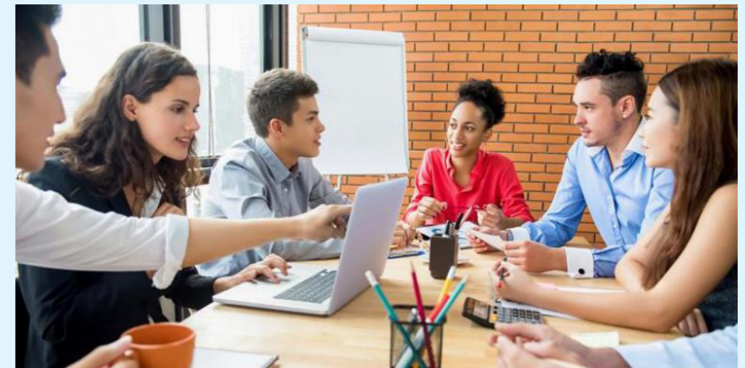
Crecimiento del empleo juvenil y femenino: Planes gubernamentales buscan generar un millón de empleos, priorizando a jóvenes, mujeres y madres cabeza de familia en zonas rurales.