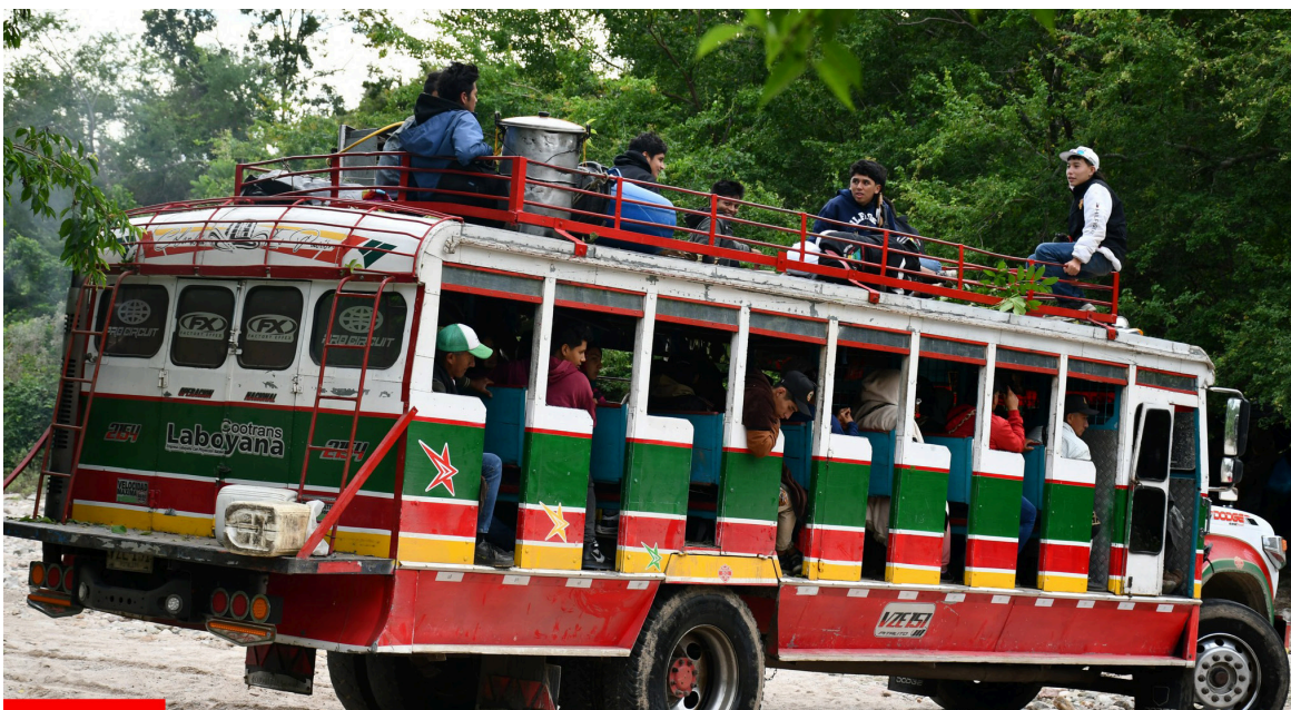
Integrantes de la Minga Indígena del Huila se congregan en el Puente de la Resistencia para coordinar acciones.

Asimismo, el líder indígena, indicó que siguen apoyando las apuestas políticas del ‘Gobierno del Cambio’. Respaldamos la Minga del Putumayo que también han estado reclamando sus derechos como proyecto de vida. “Vamos a estar en coordinación en el marco de unidad y políticas ancestrales. La Minga permanecerá en diferentes espacios estratégicos”.