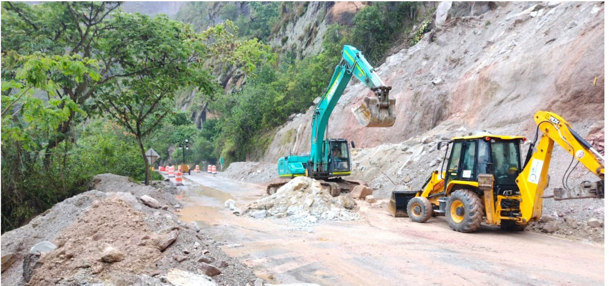
Estarian contratando a operarios de otros departamentos.

■ Una grave denuncia realizó el diputado Armando Acuña, en relación a una posible 'trampa' que estaría haciendo funcionarios, para contratar a operarios que no son del Huila. La denuncia fue realizada por profesionales de la región quienes revelaron lo ocurrido y ya desconfían de los procesos de selección.