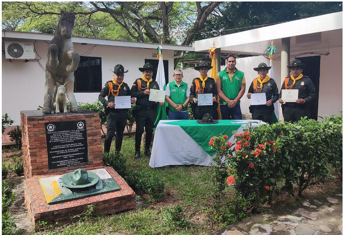
La Corporación Autónoma Regional del Alto Magdalena, hizo un importante reconocimiento a hombre y mujeres de la Seccional de Carabineros y Protección Ambiental adscrita a la Policía Metropolitana de Neiva, exaltando el compromiso de todos los funcionarios, que a diario trabajan arduamente en la defensa de los animales.