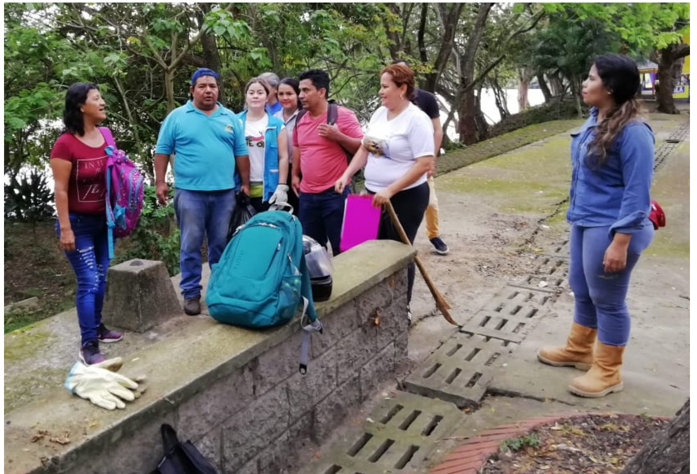
Se va adelantar una jornada de recuperación del Malecón del río Magdalena.

Ya en lo relacionado a las causas que condujeron a la cancelación del Desfile Acuático con las reinas, la secretaria de Cultura, expresó: “deben entender que estamos iniciando un gobierno, que no contábamos con los recursos completos, había que organizar de manera responsable para ver si podíamos hacer un evento sin errores”.