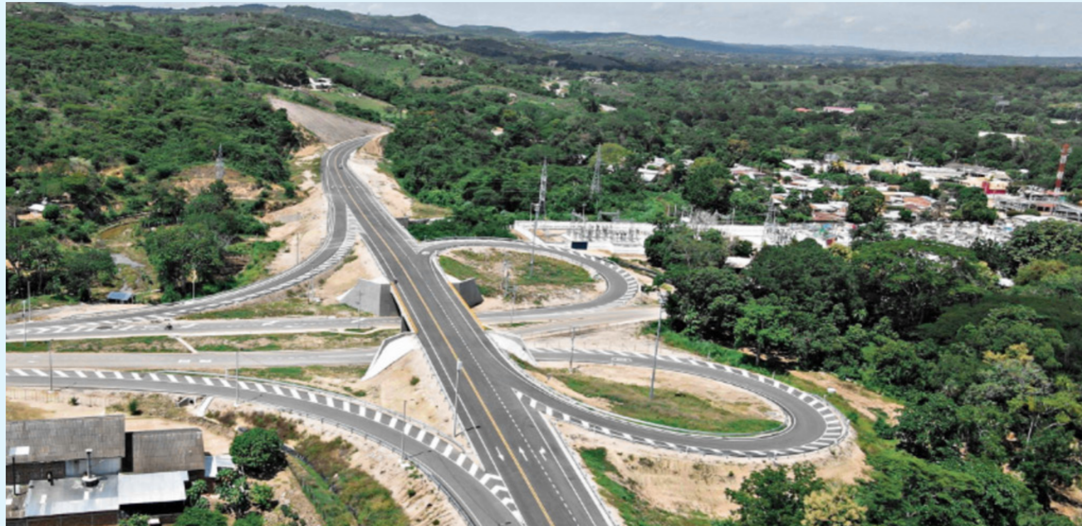
Infraestructura clave para la reactivación económica: Proyectos de vías 4G y 5G necesitan ser acelerados para fomentar la inversión y el empleo en Colombia.

En la carta piden reactivar la inversión privada, que representa alrededor del 90 por ciento de los empleos del país. “Exhortamos a fomentar la colaboración entre el sector público y el privado como factor clave de la reactivación”.