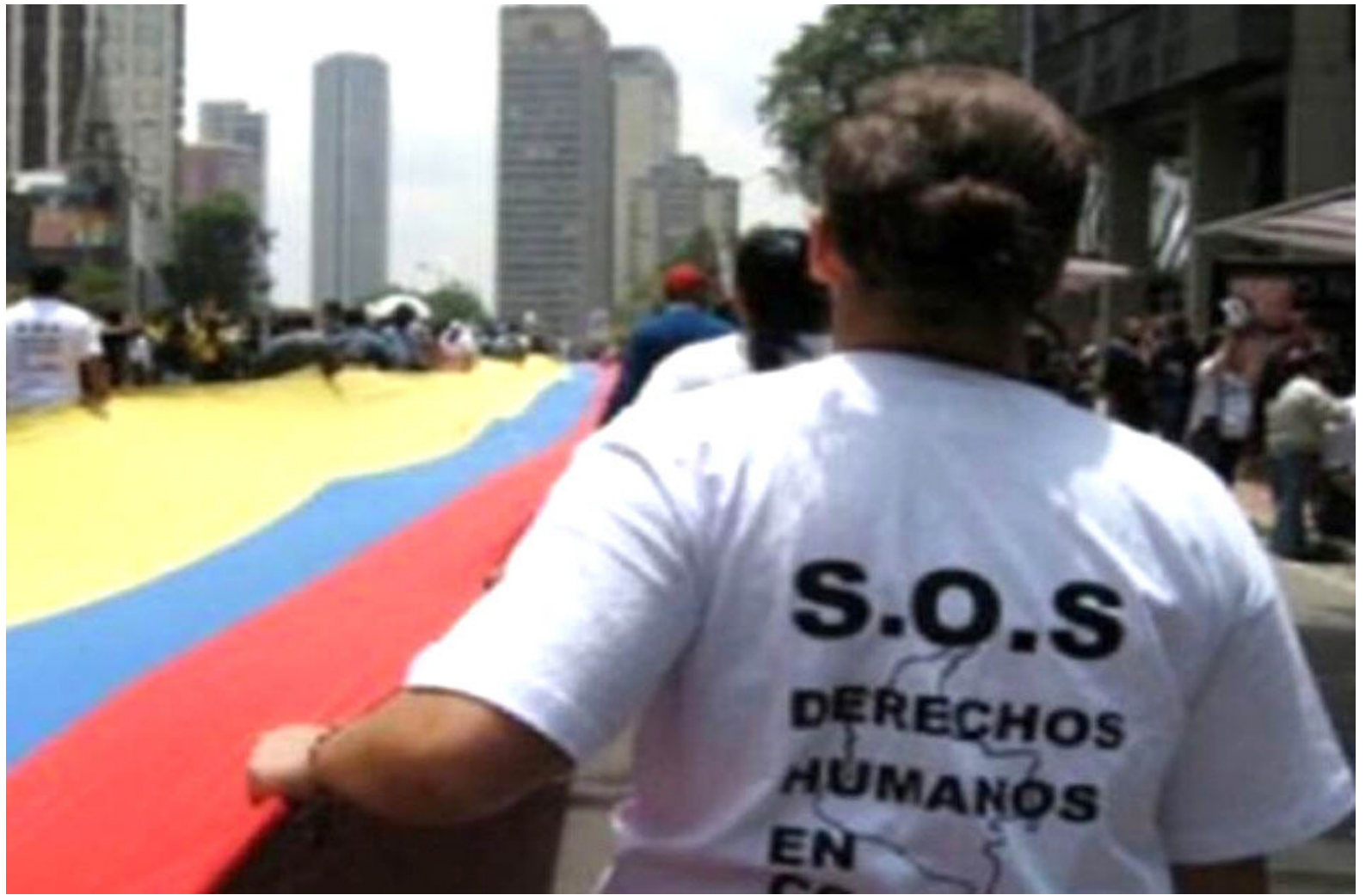
Organizaciones de derechos humanos y la comunidad en general exigen medidas contundentes para proteger a los líderes sociales en el departamento del Huila.

Desde la firma del Acuerdo de Paz en Colombia, el Huila ha sido testigo de una escalofriante ola de violencia que ha cobrado la vida de 37 líderes sociales, según un informe del Observatorio de Derechos Humanos y Conflictividades del Instituto de Estudios para la Paz - Indepaz.