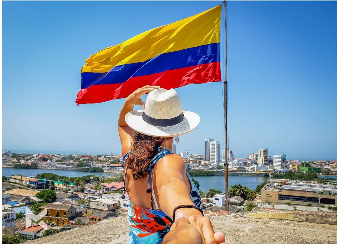
Durante 2023, Colombia cerró con una cifra récord, pues solo en el mes de diciembre, el país acogió a unos 620.000 viajeros.

la Asociación Colombiana de Agencias de Viajes y Turismo reveló cuáles fueron las cifras para los primeros meses del año para el sector. Es clave recalcar que los gastos generados por turistas en bienes y servicios también estimulan las regiones.