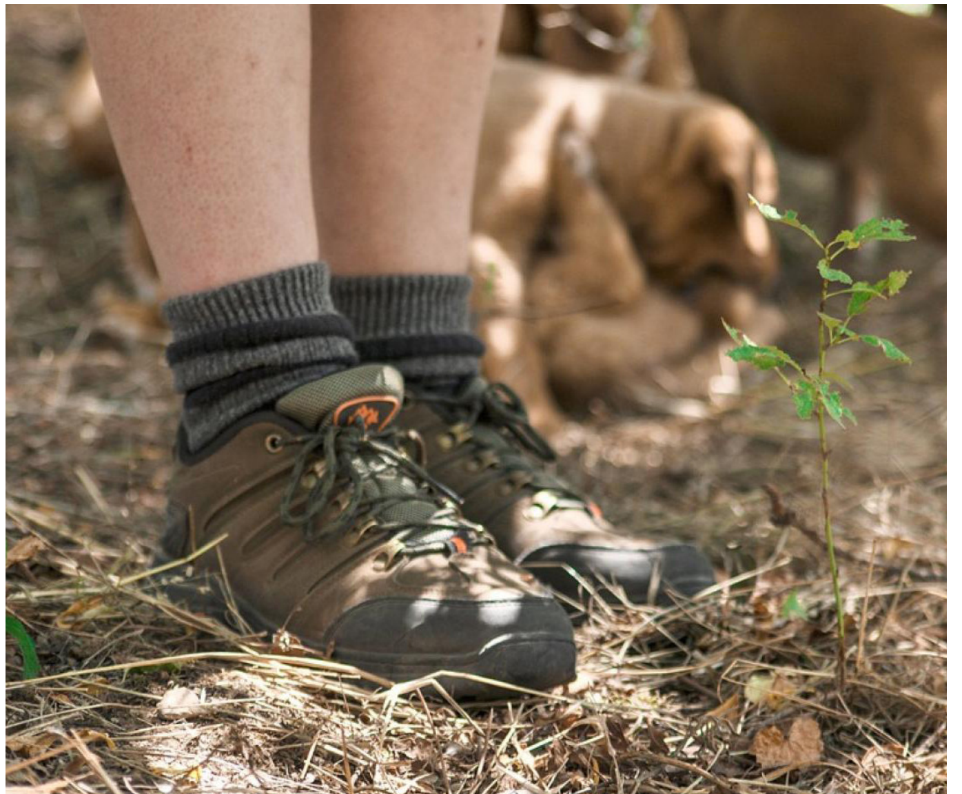
El aumento de la violencia contra líderes sociales es una preocupación creciente en el departamento del Huila y en toda Colombia.

Desde la firma del Acuerdo de Paz en Colombia, el Huila ha sido testigo de una escalofriante ola de violencia que ha cobrado la vida de 37 líderes sociales, según un informe del Observatorio de Derechos Humanos y Conflictividades del Instituto de Estudios para la Paz - Indepaz.