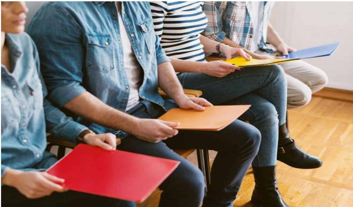
La irregularidad fue dada a conocer por profesionales del Huila.

correctivos, el funcionario expresó. “De no cambiar este panorama, le solicitaríamos a la Interventoría, para que haga cumplir lo establecido en el contrato”.