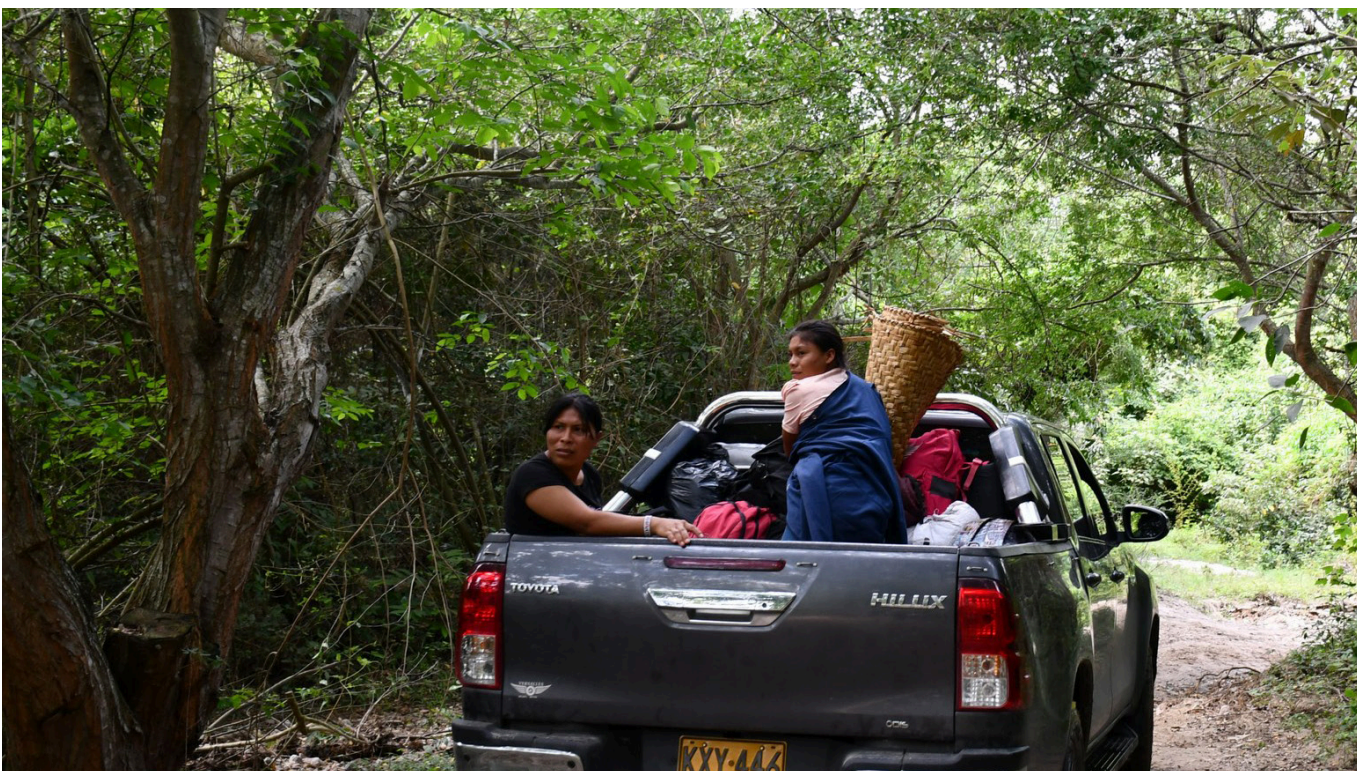
Los líderes indígenas hicieron un llamado a la unidad y solidaridad en la lucha por el reconocimiento y respeto de los derechos indígenas.

La Minga Indígena del Huila reclama atención a sus demandas, respeto a sus derechos y el cumplimiento de los acuerdos para asegurar la pervivencia de las comunidades indígenas en el departamento del Huila.