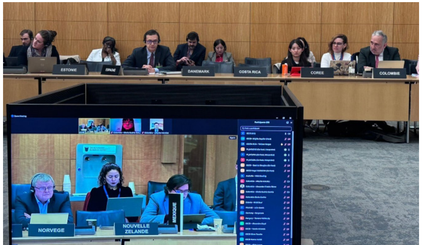
La OCDE recomendó a Colombia eliminar la subcontratación abusiva.

“Nuestros profesionales con formación académica, han hecho el proceso de inscripción, y no salen favorecidos, ¿porque logramos entender lo que estaba sucediendo? Y claro han contratado una muy buena cantidad de personal en la Ruta 45, pero hay un alto porcentaje que no es de la región”, relató el diputado.