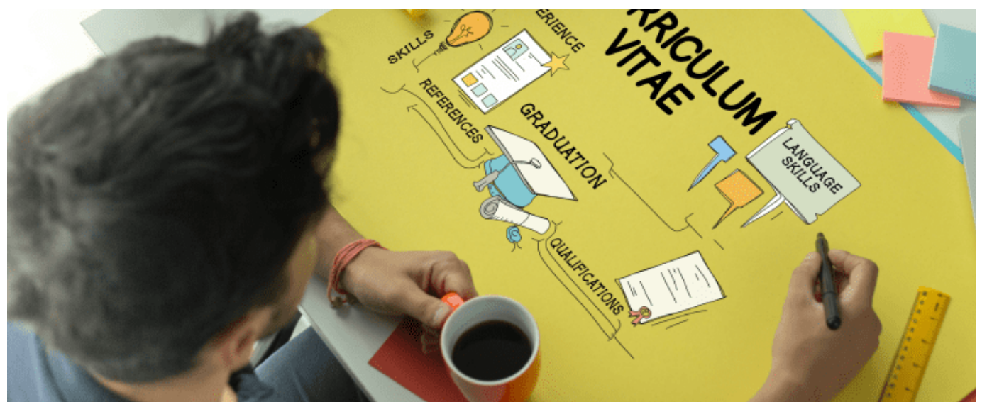
Ya los profesionales de la región, no se estarían presentando al proceso de selección.