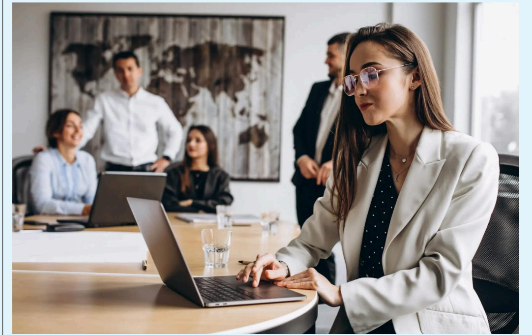
Colaboración público-privada: Académicos instan a fomentar la inversión privada y a evitar narrativas divisivas que afectan la actividad empresarial en el país.

ejecutado menos del 30%. Entre los sectores más influyentes en la reactivación económica y el empleo, destacan por su baja ejecución el sector de