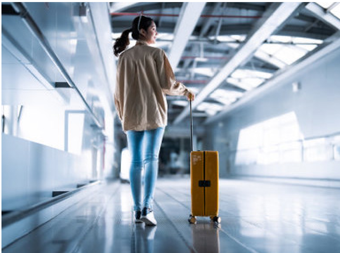
Una joven pasajera recogiendo su equipaje de la cinta transportadora.