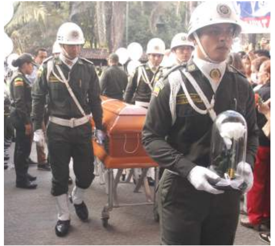
Los féretros de los uniformados fueron llegando uno tras del otro.