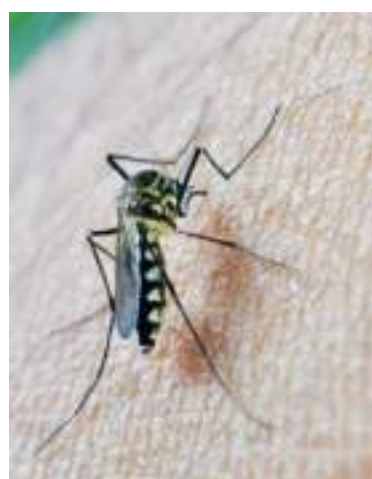
Mosquito transmisor de la enfermedad.

Asimismo, se han fumigado 43.140 viviendas en la zona urbana y rural de Neiva. A lo anterior, se suman las charlas sobre prevención de la enfermedad que se dictan a estudiantes y comunidad en general, llegando a 572 instituciones educativas y se han dictado 35 talleres en las diferentes comunas para los grupos de interés.