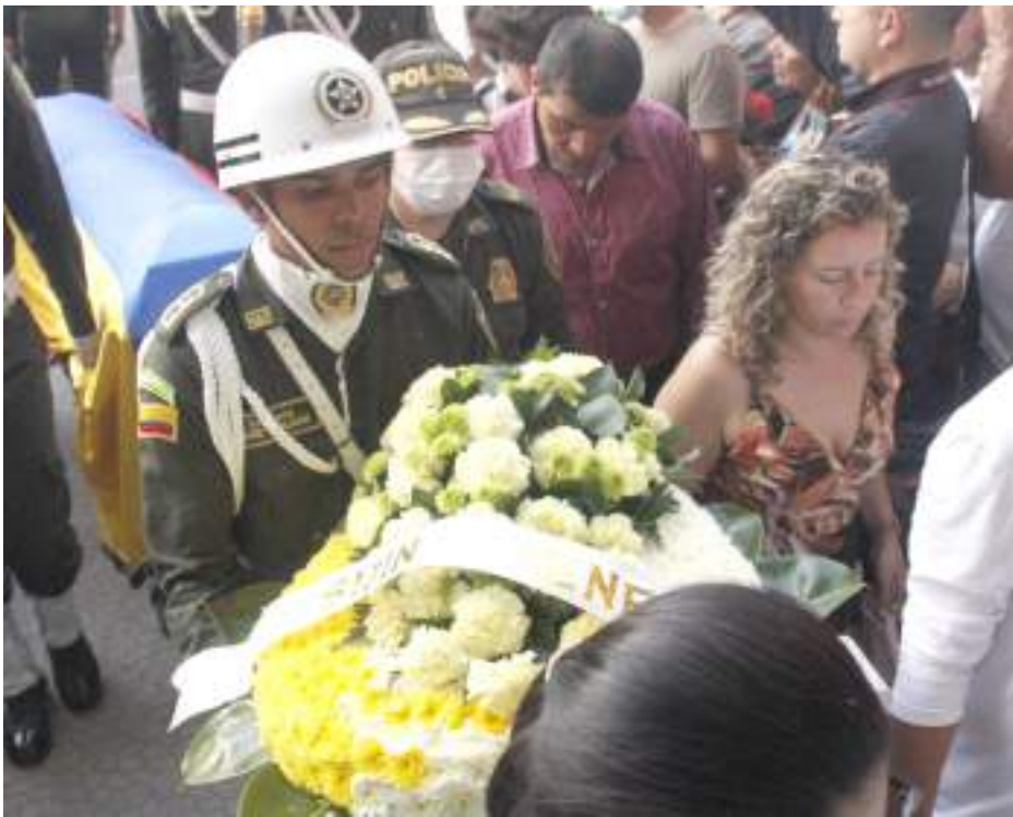
El arribo a la Catedral Inmaculada de Neiva tuvo lugar alrededor de las 5:00 de la tarde.