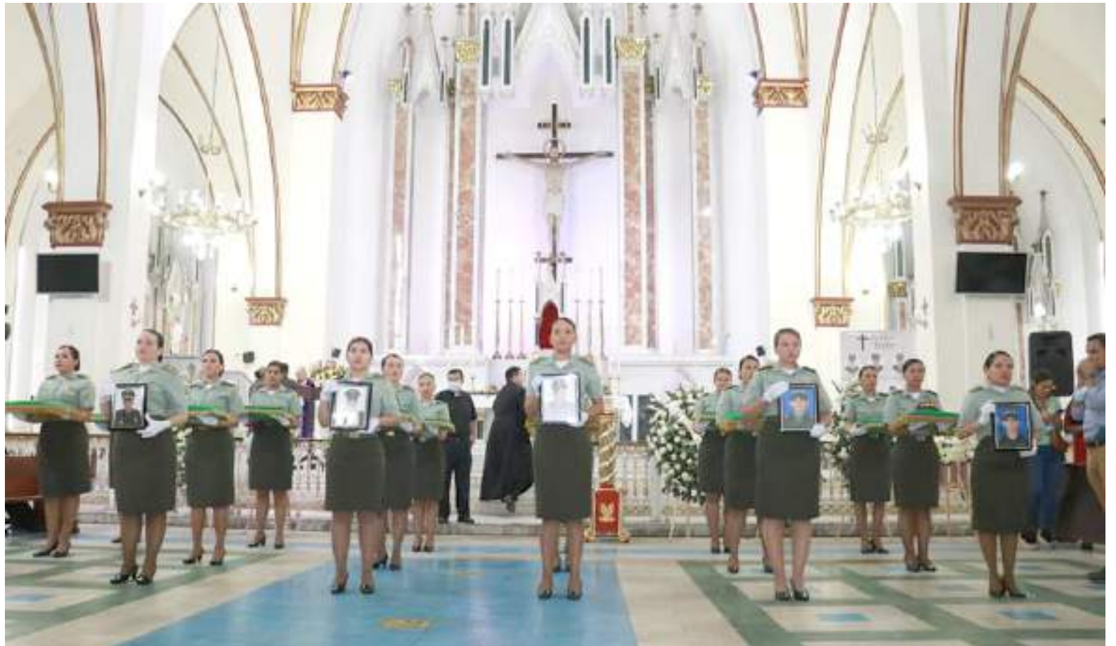
Los actos fúnebres finalmente se realizaron ayer en la Catedral Inmaculada Concepción de Neiva.

Así mismo agregó, mientras se tenía una respuesta, que “necesitamos claridad para poder pedir los permisos para trasladarnos hasta aquí y darles la última despedida a nuestros familiares. Hemos visto demora, según lo que nos han dicho, están esperando que les confirmen en Bogotá porque es una ceremonia protocolaria. Entonces estamos esperando la confirmación. Existió mucha desinformación frente a los actos fúnebres. Anoche había mucho disgusto por parte de los demás familiares de los otros