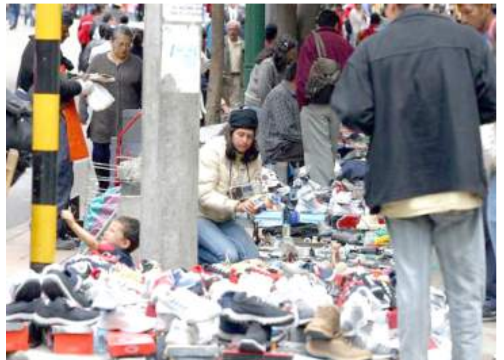
El comercio informal es otra víctima del fenómeno inflacionario.