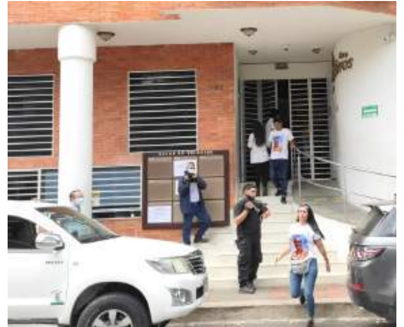
Una larga espera atravesaron los familiares de los siete uniformados asesinados en San Luis, Huila.