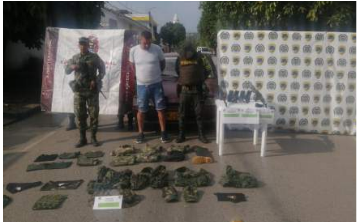
El capturado fue dejado a disposición de la Fiscalía.

En el procedimiento fue capturado un hombre de 43 años de edad, el cual fue puesto a disposición de la Fiscalía URI de turno, como presunto responsable del delito de utilización ilegal de uniformes e insignias.