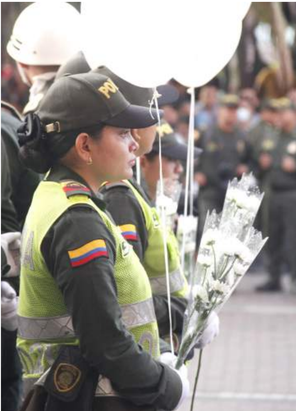
Algunos uniformados no podían ocultar el llanto tras lo ocurrido.

■ En medio de cientos de personas, familiares y fuerza pública, le dieron el último adiós a los uniformados que perecieron en el atentado del corregimiento de San Luis. Las palabras de aliento en la eucaristía permitieron mitigar el dolor de los presentes, quienes no podían ocultar su lamento.