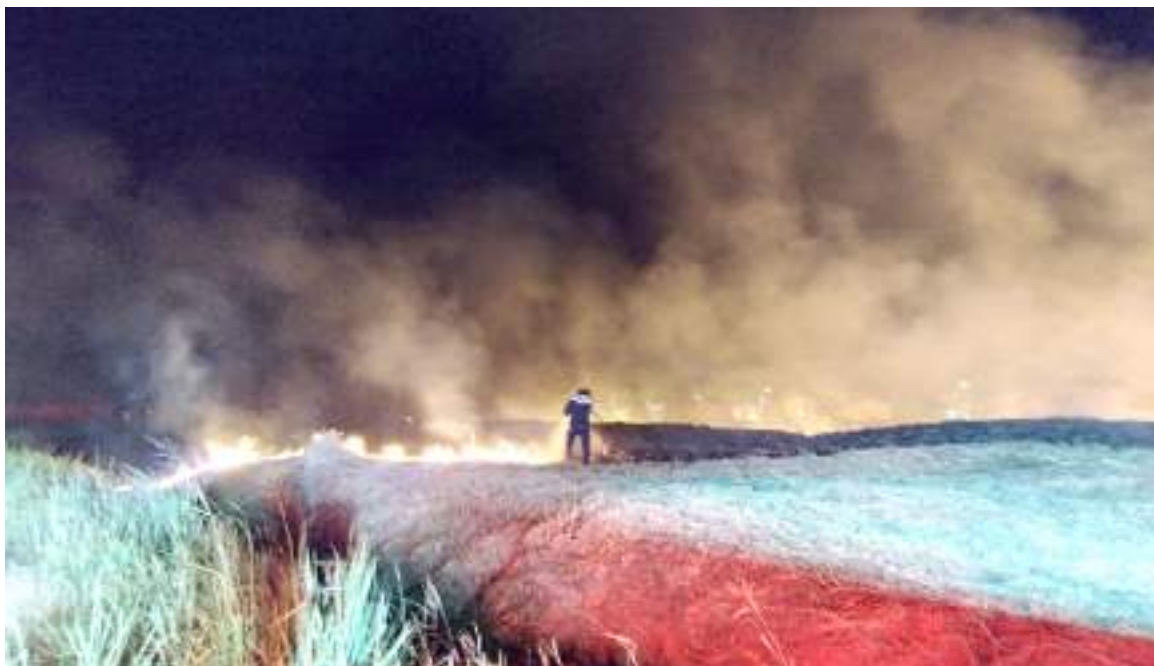
El incremento fue notorio y esto dejó como resultado 432 hectáreas de tierras afectadas.

Pese a que, según el IDEAM y el Ministerio del Medio Ambiente, esta temporada de lluvia marcarán fuertes precipitaciones que empezarán finalizando el mes de agosto y que se esperan que sean aproximadamente un 30% con respecto a los promedios históricos durante este trimestre consolidado, lo cierto es que, las altas temperaturas continúan. Además, precisamente para el mes de septiembre se esperan que en el departamento del Huila existan excesos de precipitación entre el 20% y 50% y para el mes de octubre igual.