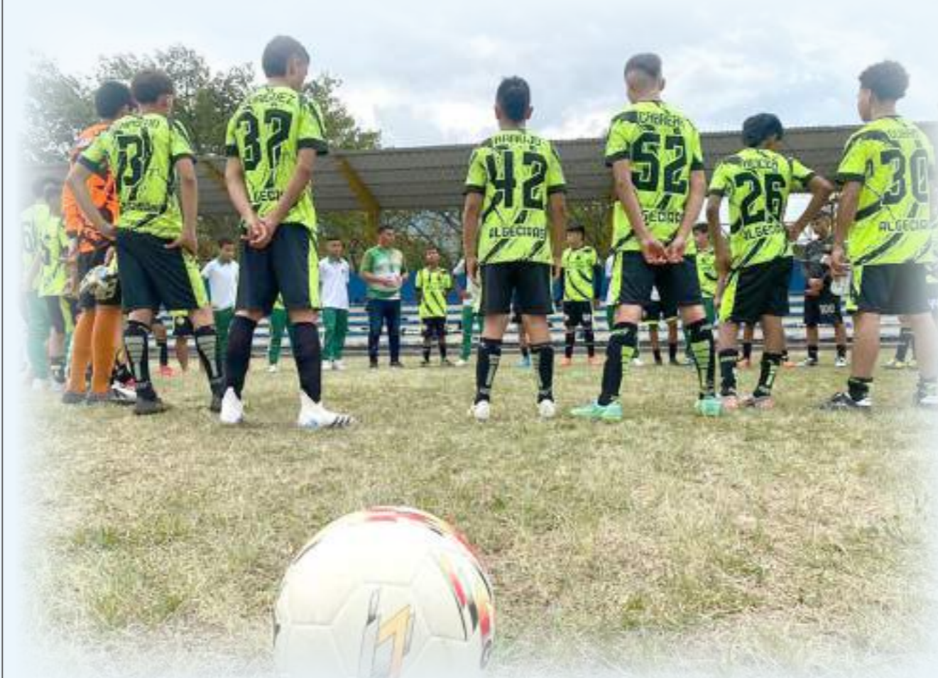
Desde el pasado 31 de agosto se cumplen los zonales de los juegos Intercolegiados en el Huila.

Una nueva cita del deporte intercolegiado se cumple desde el pasado 31 de agosto con la realización de los zonales correspondientes en los diferentes sectores del departamento.