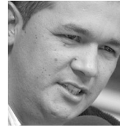
Por: Melquisedec Torres

No está claro el rezago, seguramente colonial, de llamarle doctor en Colombia a cualquier persona con título profesional o sin él, pero con un algún cargo relevante. Esta particular manera de hacerle la venia a quien ostenta algún diploma universitario u ocupa un cargo de importancia es vista desde afuera como cosa extraña. En una de las audiencias del célebre caso Colmenares, el reputado científico y profesor español Miguel Botella, presente como perito, mostró su asombro al escuchar cómo todos en la audiencia se llamaban entre ellos; Botella le dice a la juez: “curioso que aquí todos se llaman doctor y doctora, y a mí me dicen profesor, a pesar de que en esta sala el único doctor soy yo”.