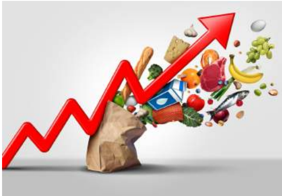
Los alimentos son los primeros afectados con la inflación.