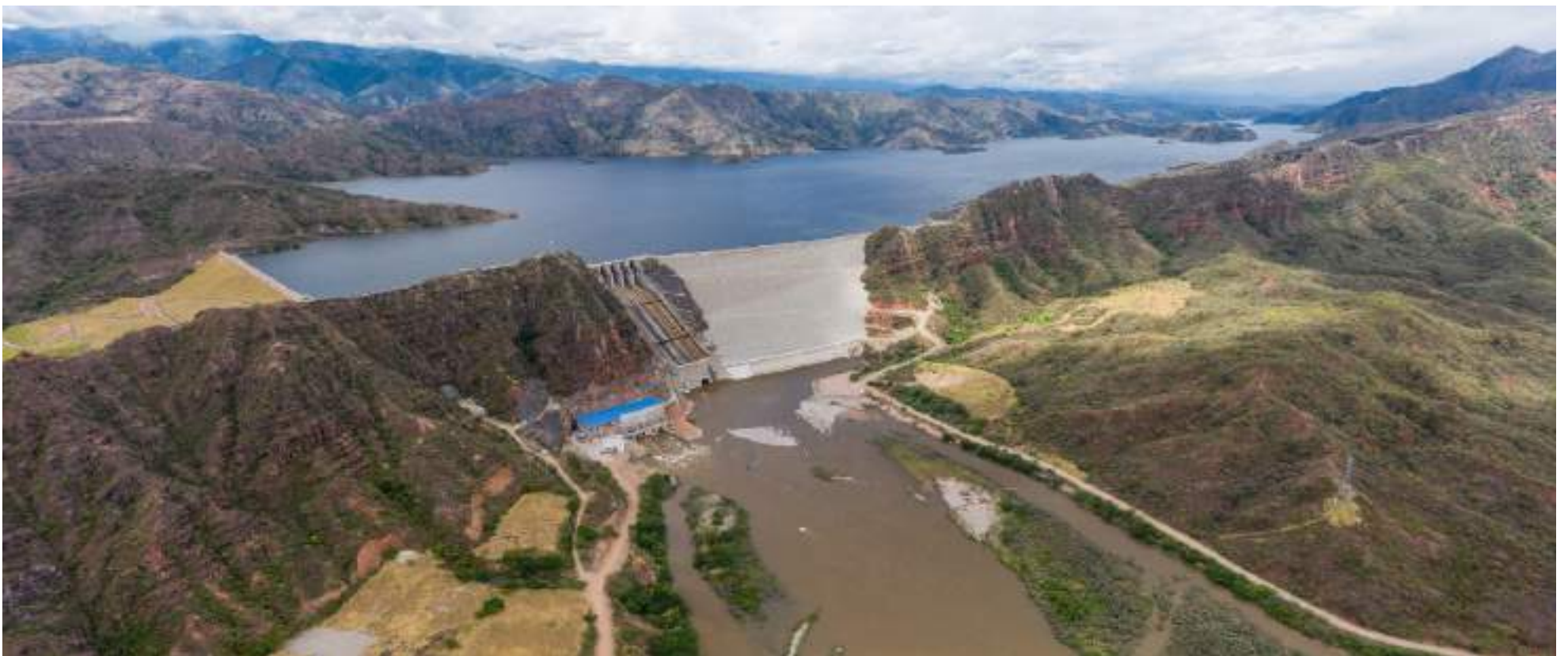
Central Hidroeléctrica El Quimbo.

■ 349 de los 427 beneficiarios han manifestado su apoyo a la propuesta presentada por la Compañía. La solicitud surgió luego de evidenciarse la escasez de la oferta hídrica para riego por gravedad de 2.700 hectáreas, estipulado en el Documento de Cooperación y la Licencia Ambiental de la Central Hidroeléctrica El Quimbo.