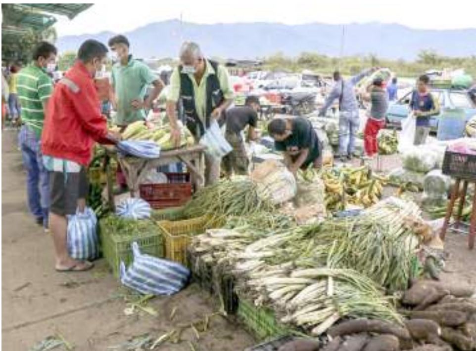
La inflación sigue sin frenarse para el 2022.

La realidad Neivana no es la excepción a ese fenómeno pues el problema de la inflación es un mal generalizado, cuya conexión con otras regiones de la geografía nacional e internacional, es inherente.