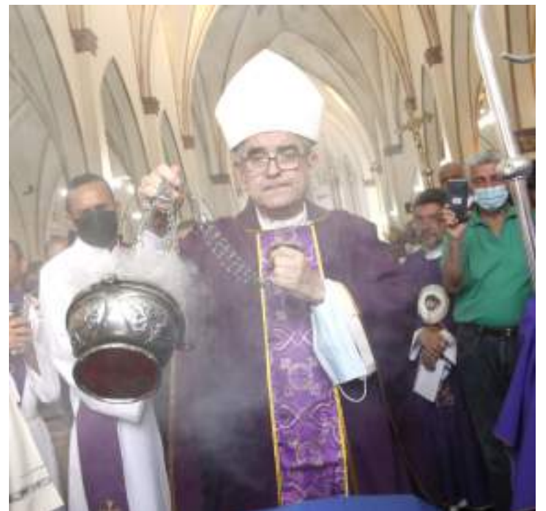
El obispo realizó los protocolos religiosos antes de recibirlos en la iglesia.

Al caer la noche, no solo el recinto eclesial estaba lleno de gente. Las afueras del mismo también. No le cabía una persona más al espacio público donde los vehículos fúnebres esperaban a cada cuerpo para disponerlos a su destino preestablecido.