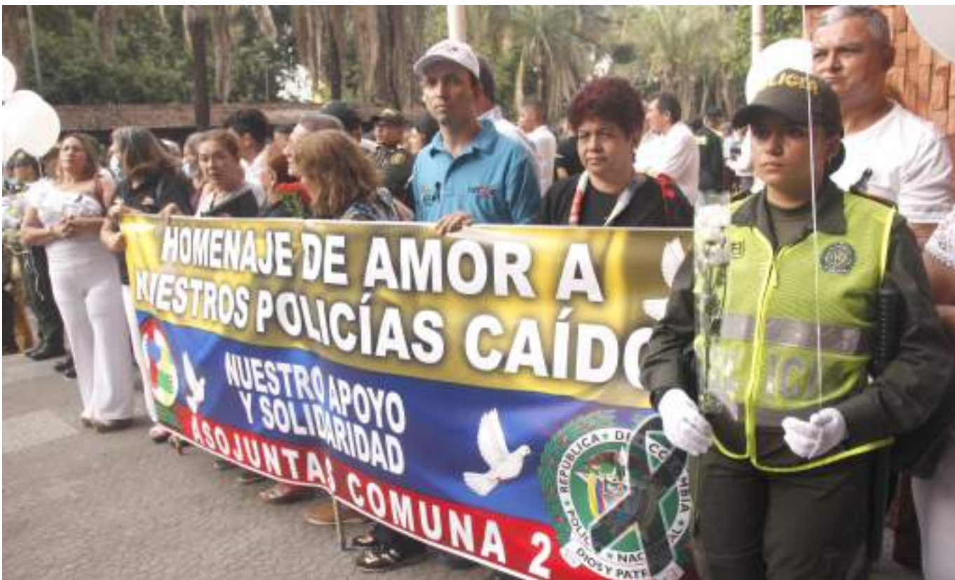
Asociación de Juntas de Acción Comunal, Asojuntas, de la comuna 2, mostró su apoyo de amor para con los uniformados.

espacio para poder detectar cualquier anomalía que amenazara la integridad de los presentes. Policías y soldados de civil custodiaron bien la zona de manera que todo estuviera bajo control.