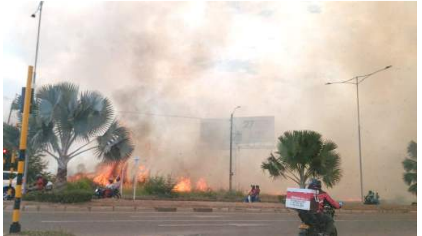
Cerca de 185 eventos de cobertura vegetal, se presentaron durante agosto, lo que equivale a 432 hectáreas afectadas.

Aparte de las hectáreas afectadas también hubo pérdidas puntuales en la flora y fauna silvestre. “Este es el mes de mayor incidencia en incendios forestales, el resto del año fue temporada de lluvias y la otra semana se avencinan igualmente lluvias. Agosto siempre ha sido diferente a otros meses, pero este año fue de mayor intensidad”, mencionó.