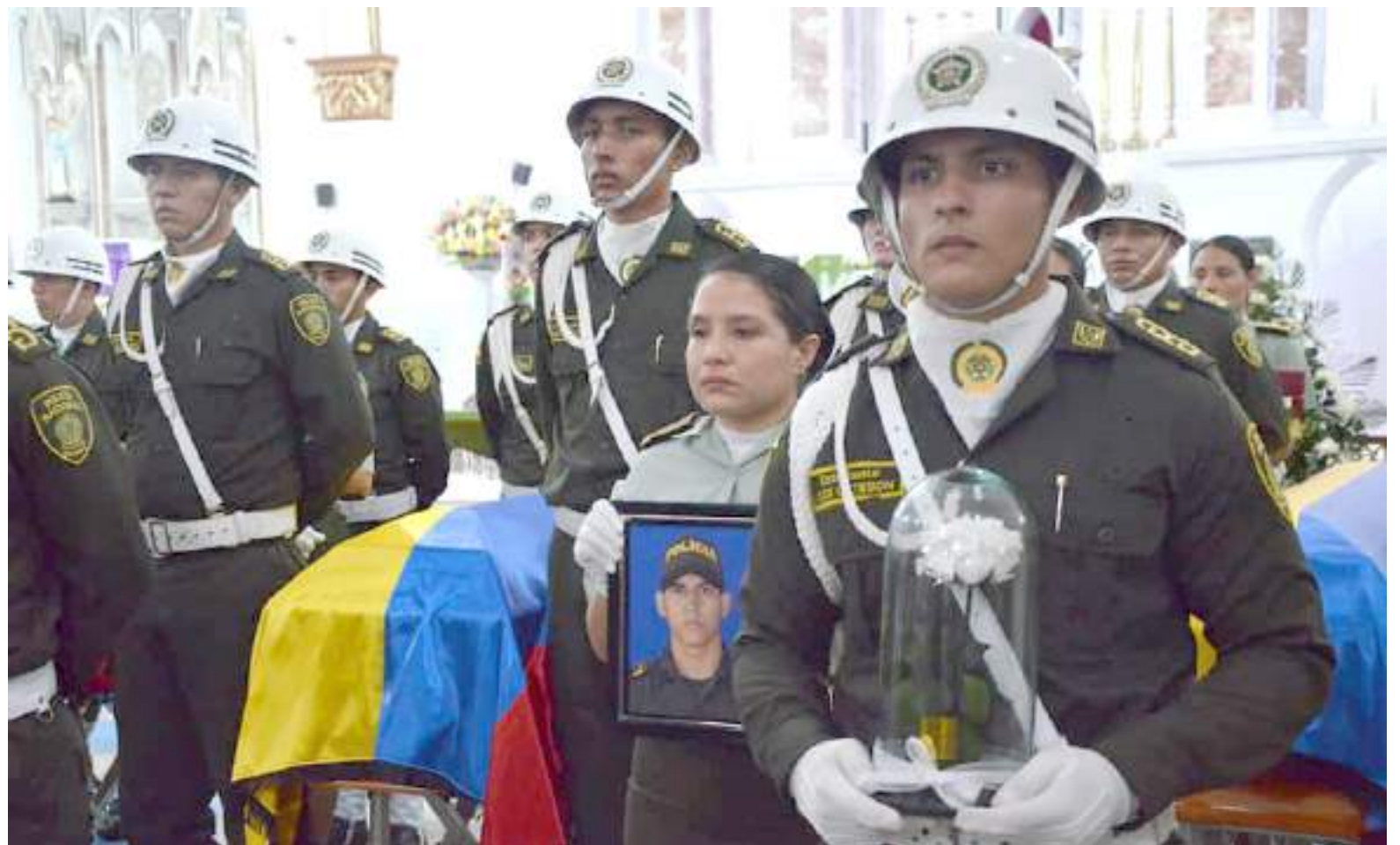
Este hecho en el que fueron asesinados los policías, será recordado como un delito de lesa humanidad que jamás será borrado.

Explicó también que, no ha dicho que todos los habitantes de San Luis sean malas personas. Sin embargo, relató que algunos habitantes del comercio no le vendían ni ‘una bolsa de agua’ a los policías porque al parecer tenían miedo “es más mi hijo me llamó una noche asustado y me dijo papá me quitaron la energía porque quieren hostigar el puesto de policía. No hubo amenazas antes de trasladarlo para San Luis, pero al parecer estando en el corregimiento sí pasó. Eso ya es materia de investigación. Solamente lo que él decía era que lo habían amenazado por estar cumpliendo su derecho como comandante del puesto de policía y tenía que hacer cumplir los derechos que le habían asignado”, concluyó.