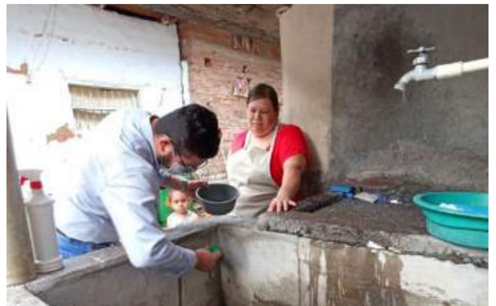
El lavado de albercas dentro de las acciones de prevención.

El último reporte de la Secretaría de Salud del Municipio de Neiva, indica que los casos siguen presentes, que hay una alta incidencia de casos de alarma y además hay casos de dengue grave.