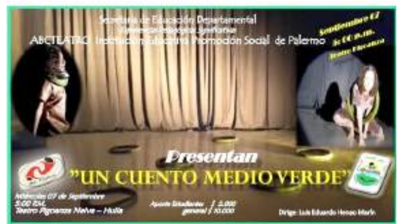
Todas las familias pueden disfrutar de esta grandiosa presentación.