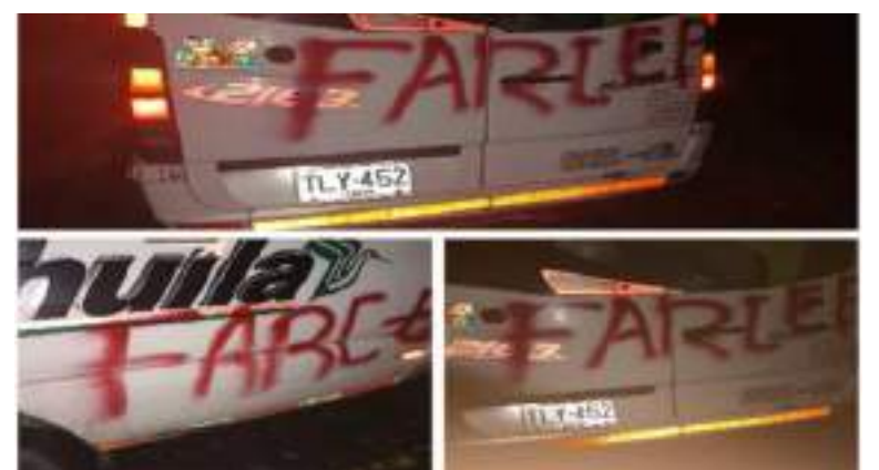
Aun no se identifican las personas que buscan amedrentar a los conductores de vehículos de servicio público que recorren las vías del Huila y el Cauca.