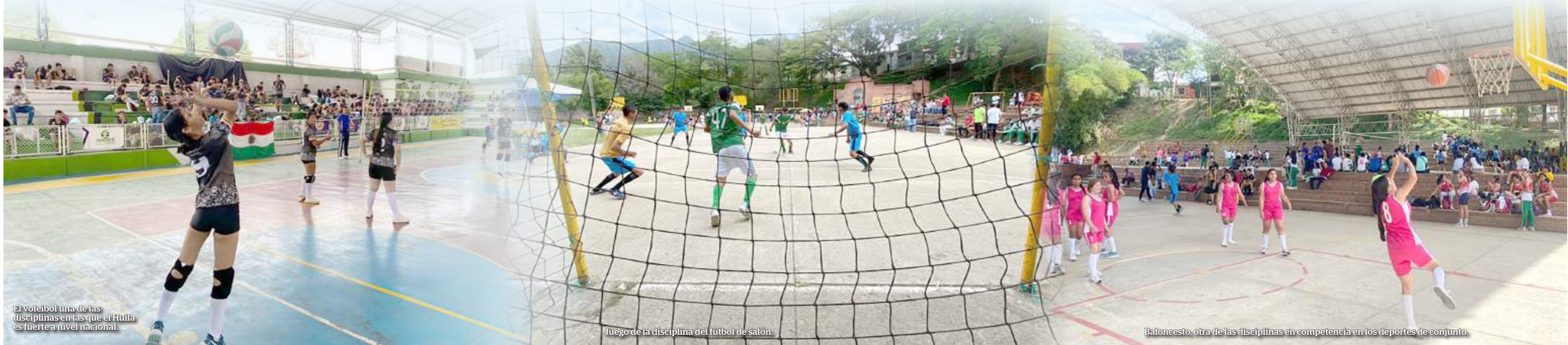
El voleibol una de las disciplinas en las que el Huila es fuerte a nivel nacional.

El Huila al igual que la temporada anterior, espera clasificarse en disciplinas en las que se ha hecho fuerte a nivel nacional como el fútbol de salón, el voleibol y el baloncesto, que siguen logrando figuración en las finales nacionales, por lo que se espera este año no sea la excepción.