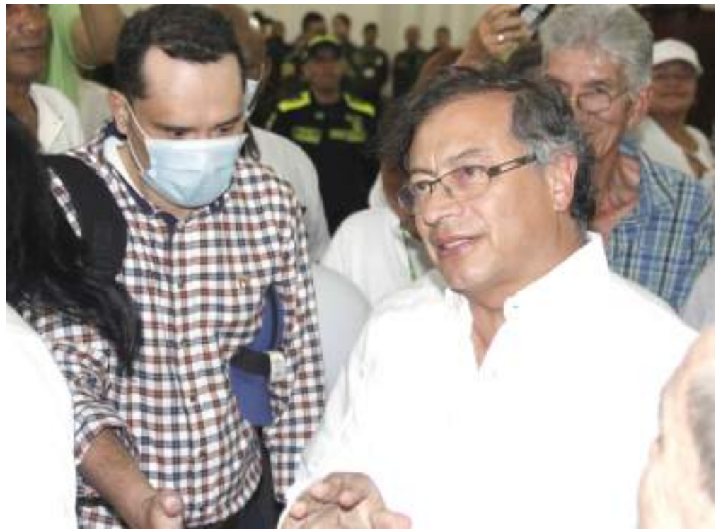
El presidente Gustavo Petro llegó al acto de las exequias alrededor de las 6 de la tarde.