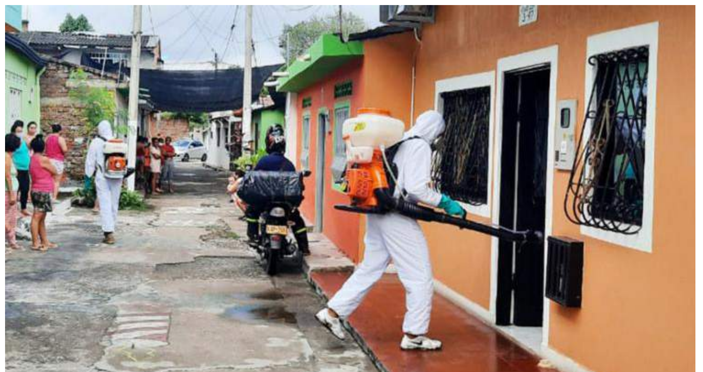
Neiva, en alarma por la alta cifra de casos de dengue.

Hay un caso de posible muerte por dengue que aún está por confirmarse por parte del Instituto Nacional de Salud. Esto según el boletín de la Secretaría de Salud Municipal a la semana epidemiológica 33