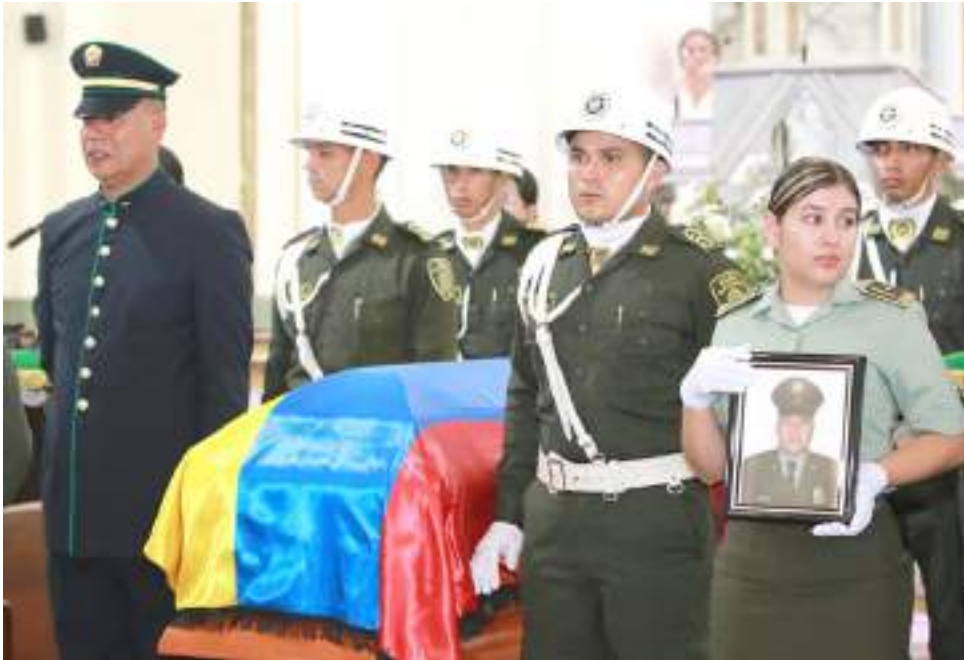
Mediante una ceremonia protocolaria, fueron despedidos los uniformados que dieron su vida por la patria.

en pie ante todas estas situaciones. Le digo a todos aquellos que están al margen de la ley que se rindan y no sean tan cobardes de hacer todo este tipo de atentados contra la patria y las fuerzas militares porque somos nosotros los que brindamos protección”, detalló.