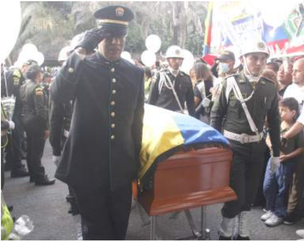
La comunidad esperaba ansiosa la llegada de los cuerpos.