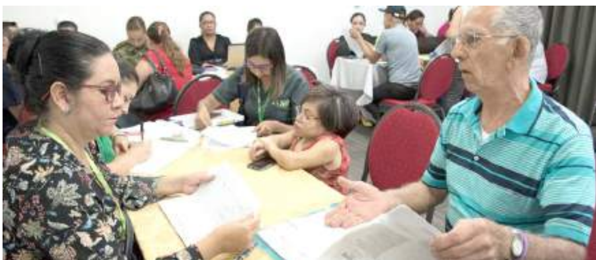
Se definen traslados de algunos pacientes de Comfamiliar a Coosalud.

Igualmente, Coosalud recordó que, como usuarios del sistema de salud en Colombia, los ciudadanos tienen derecho a hacer uso de la libre elección de su EPS.