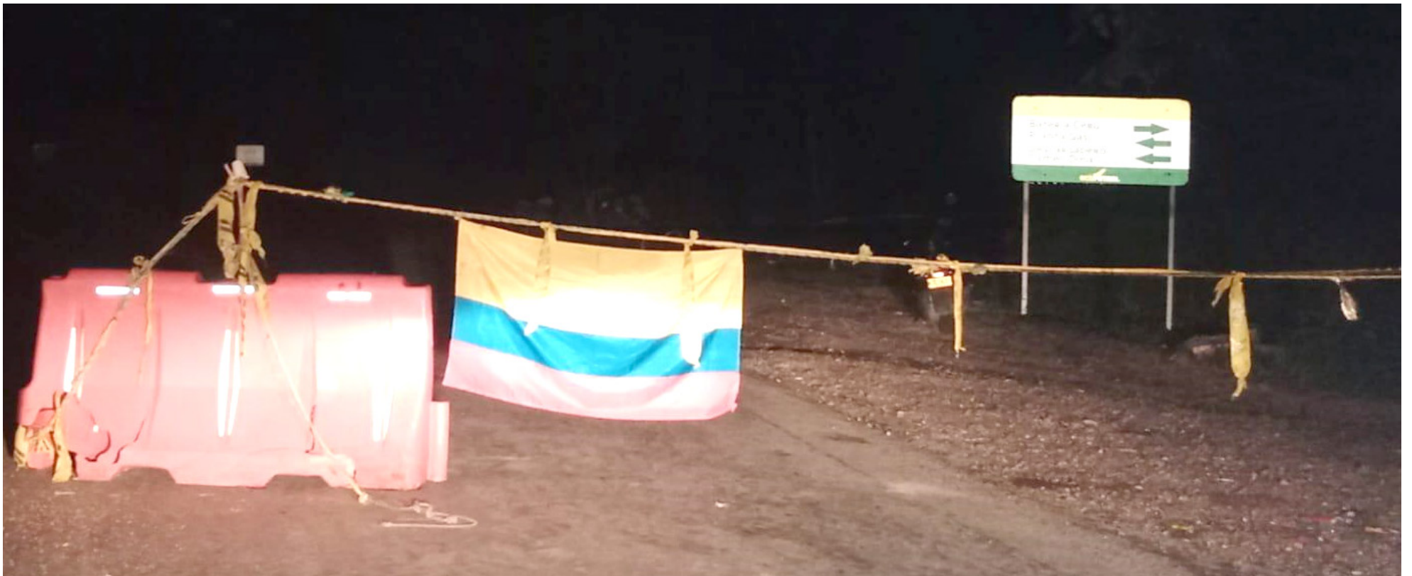
La falta de acceso a los campos de Ecopetrol, podría tener consecuencias graves para el medio ambiente. La empresa advierte sobre el riesgo de fugas no detectadas, daños a la fauna y flora, y contaminación del agua.

ción establecida en el sector está demandando a Ecopetrol la contratación preferencial de trabajadores locales.