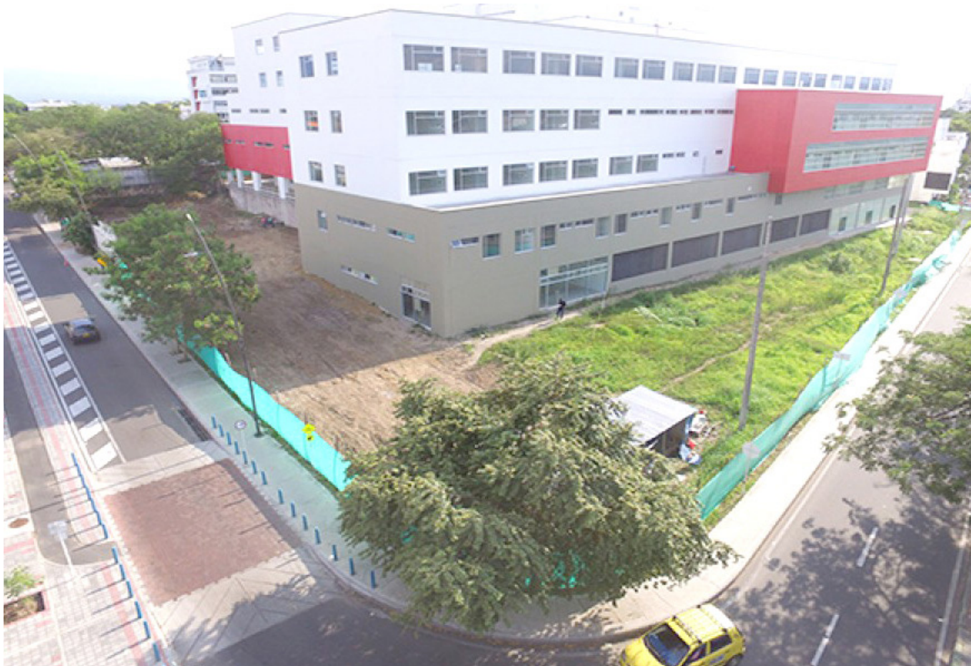
Proyecto Torre Materno Infantil, también es vigilado.

En este sentido la competencia de la Contra-