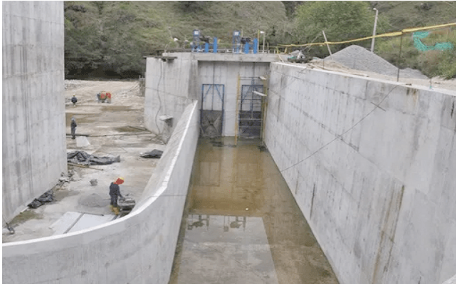
El Distrito de Riego, Tesalia-Paicol, es analizado.

Una investigación exhaustiva de la Contraloría General de la República en el Departamento del Huila ha revelado un sombrío panorama de corrupción, despilfarro y desidia gubernamental. Con un total de 17 proyectos críticos y 36 Elefantes Blancos u Obras Inconclu-