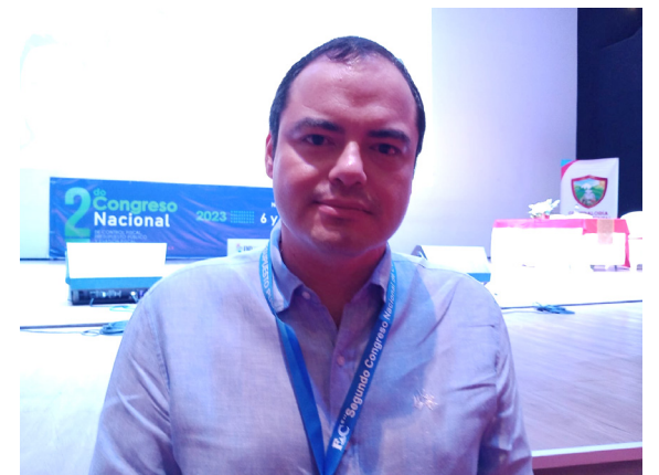
Andrés Felipe Vanegas, contralor departamental del Huila.

lizaciones en materia de hacienda pública y presupuesto estatal, para el correcto desempeño de las funciones a cargo de cada uno de