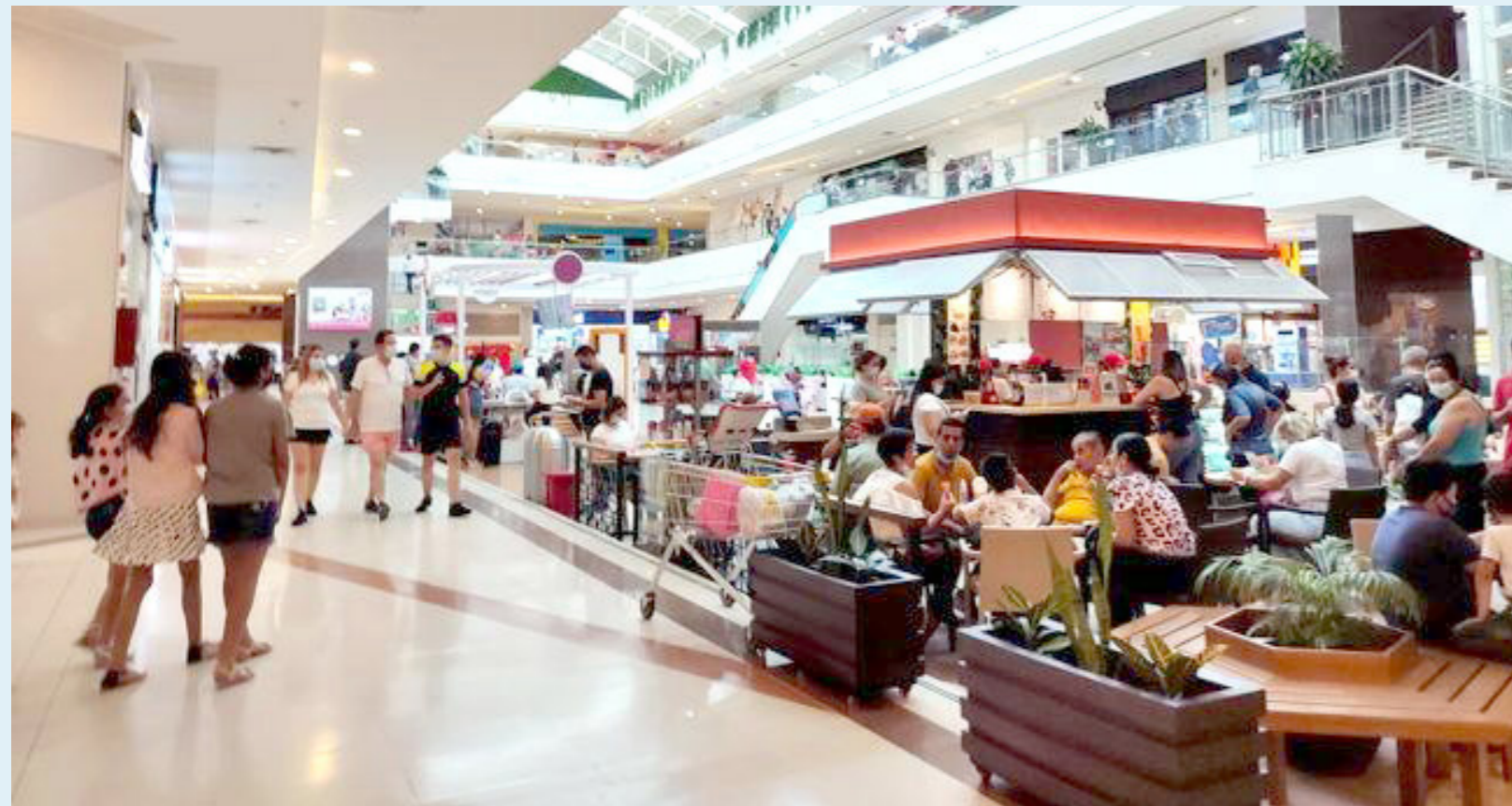
Los viajes son un importante regalo que harán los colombianos.