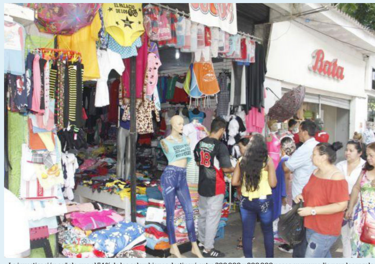
La investigación señala que el 54 % de los colombianos destinará entre 200.000 y 800.000 pesos en promedio para los regalos de Navidad.