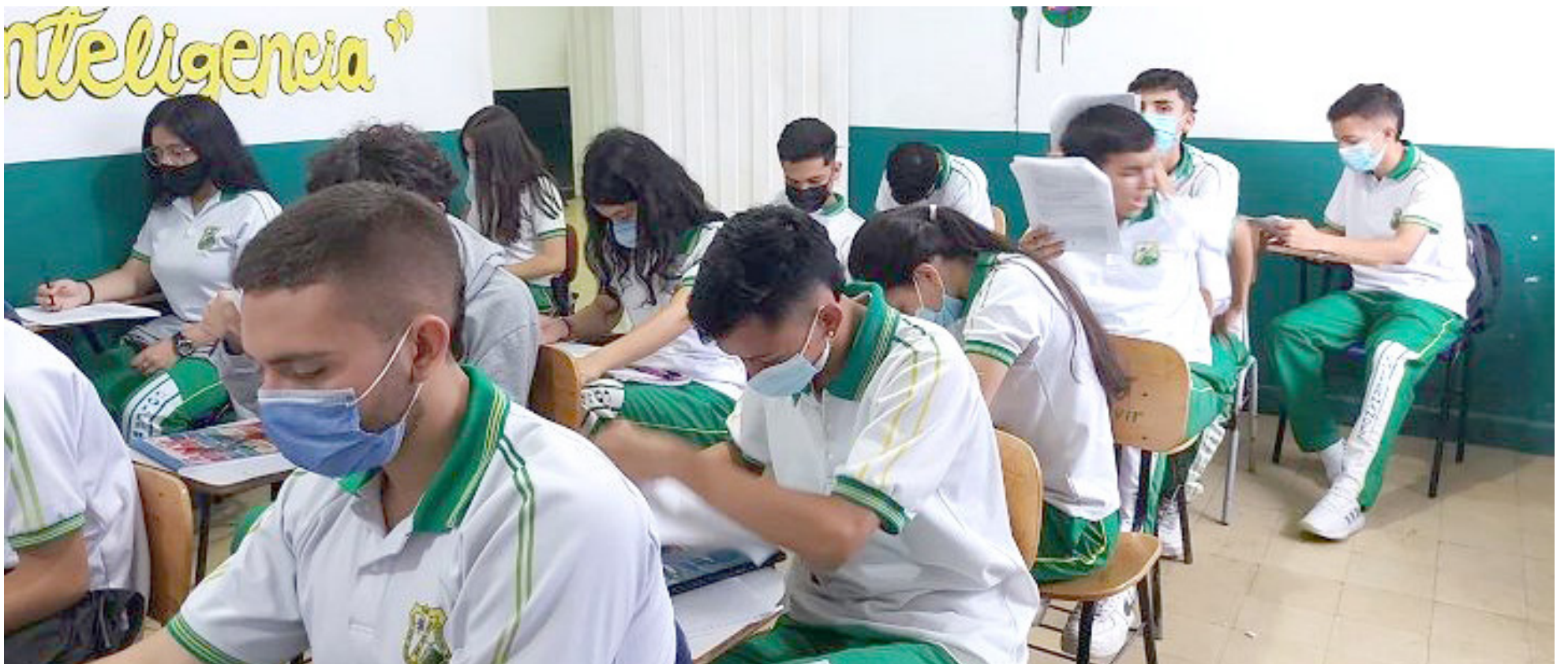
Esta situación se da entre los estudiantes de grado 10 y 11 de bachillerato.

timos años. Estas causas pueden ser variadas y complejas, entre las cuales se encuentran el bajo rendimiento escolar, las dificultades académicas, el trabajo, falta de apoyo familiar, dificultades económicas, así como otros factores