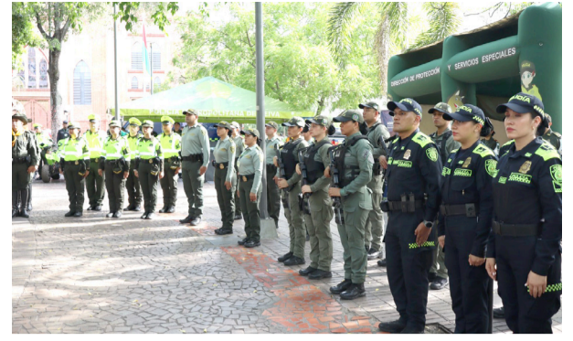
Navidad segura en el Huila