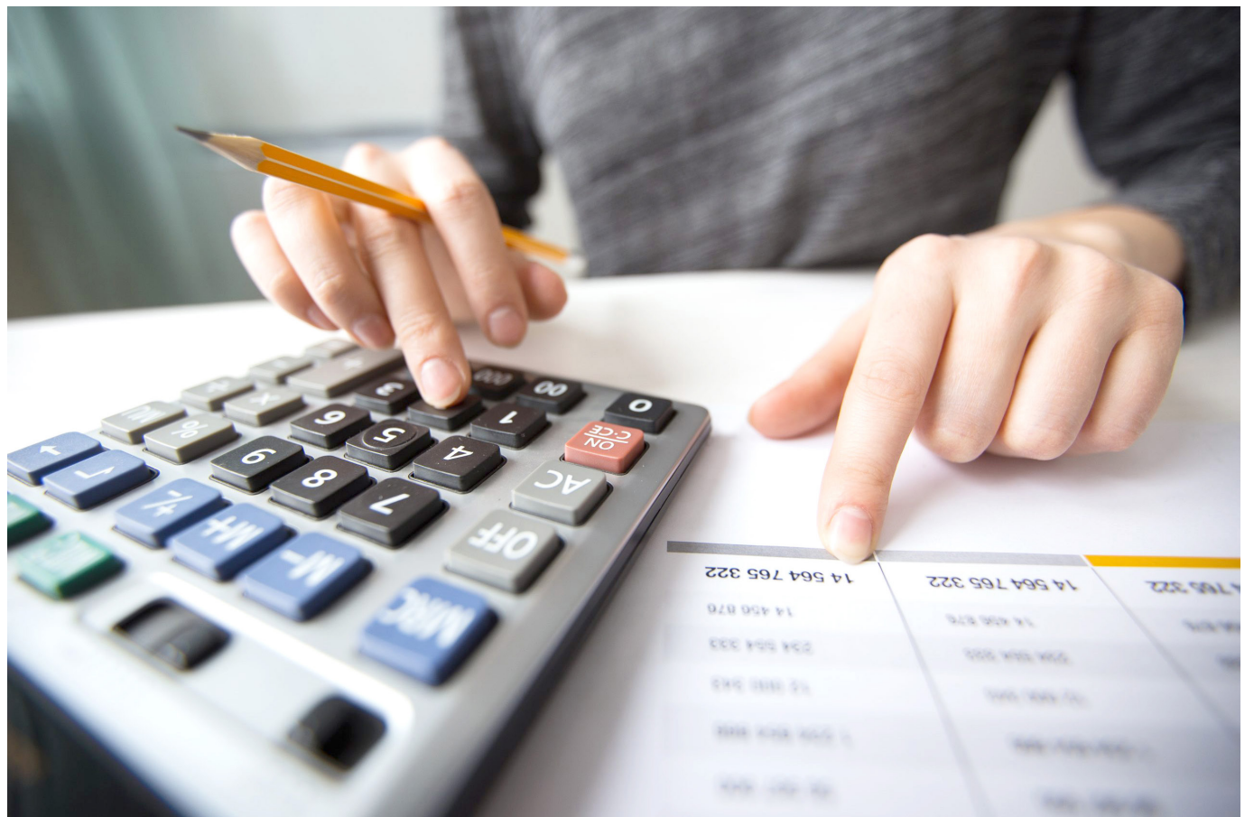
La falta de planeación presupuestal, es la falta que más cometen los funcionarios.

En este sentido en el Huila, la Contraloría General de la Nación identificó 17 proyectos críticos y 36 Elefantes Blancos u Obras Inconclusas, por un total de $5,3 billones. Se declaró de impacto nacional la ejecución del contrato para mejorar el auditorio de la Facultad de Economía de la Usco en Neiva.