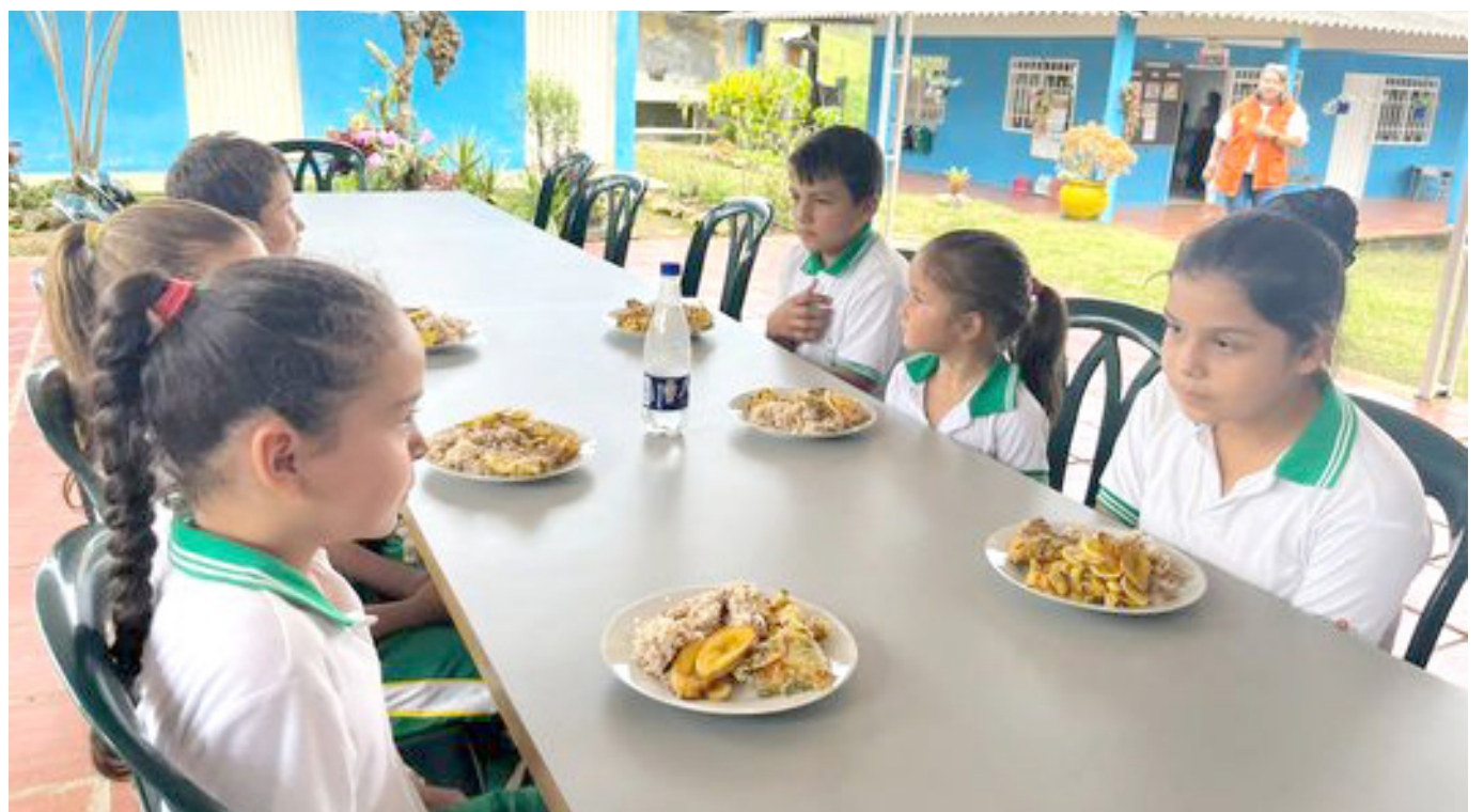
La asignación de recursos económicos por la (Uapa), asciende a $61.000 millones para el 2024.

Finalmente, el director de la Uapa, respecto a la operación del PAE para el 2024, reiteró a las alcaldías y gobernaciones su mensaje a adelantar todos los procesos de planeación contractual para que, en el año 2024, los gobiernos entrantes reciban el PAE contratado y de esta manera se garantice que los estudiantes reciban el complemento alimentario desde el primer día de clase.