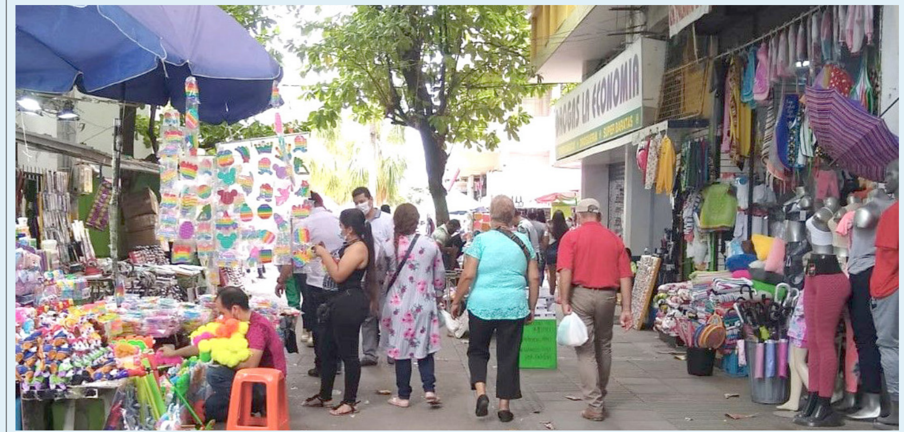
El 17 % comprará juguetes y videojuegos, que año tras año se mantienen en el 'top' 10, entre los más regalados para la época.

Muchas personas se adelantaron a las compras. El 38 % aprovechó el Black Friday y las rebajas activadas. Sin embargo, aún queda un significativo 47 % que comprará durante estos días de diciembre.