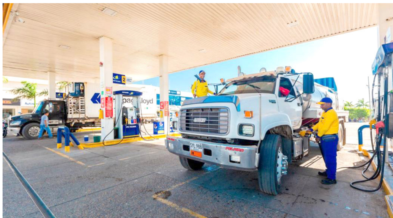
Un galón de diésel (ACPM) pesa 3,2 kilos.

El presidente de Fedetranscarga puntualizó que les preocupa mucho que lleguen a tomar alguna decisión afectando a las industrias e, indirectamente, afectando el bolsillo de todos los colombianos.