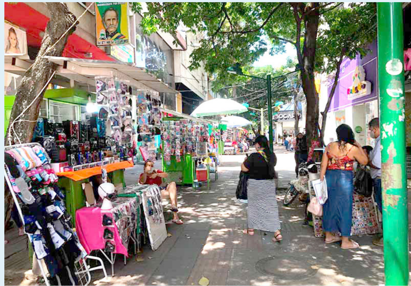
La proyección es que el sector tenga su habitual dinamismo en esta temporada, la más alta en el año.