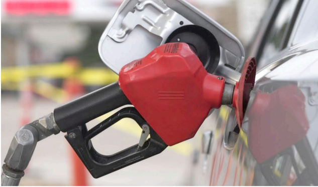
Decreto subirá el ACPM