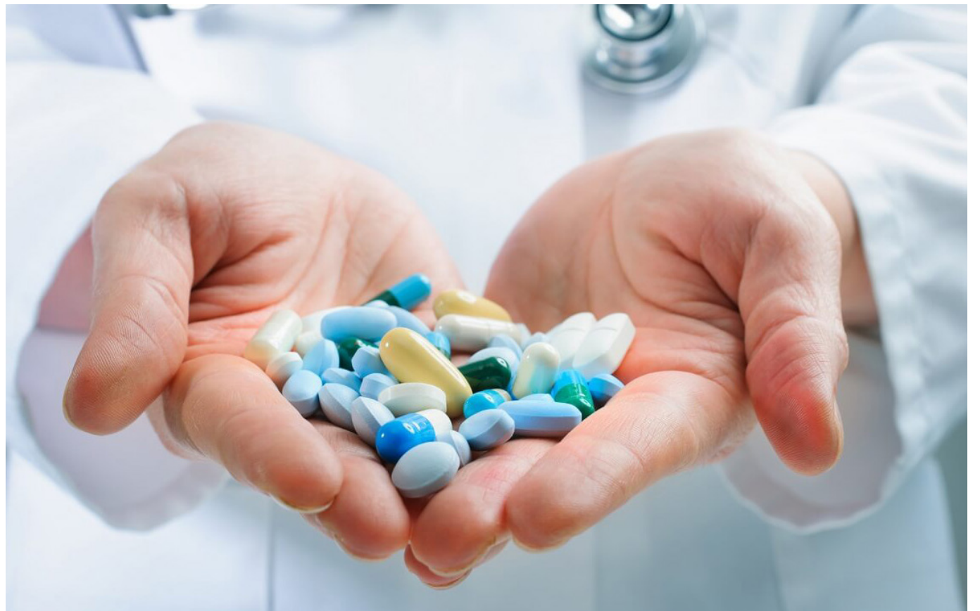
Los donantes para fabricar el medicamento son reclutados a través de las redes sociales y en los campus universitarios unas semanas antes del inicio de la producción.

La compañía biotecnológica francesa MaaT Pharma tiene una nueva planta en la región de Lyon, al sur del país, la más grande de Europa dedicada exclusivamente a medicamentos a base de microbiota (conjunto de microorganismos) que se encuentran en la materia fecal.