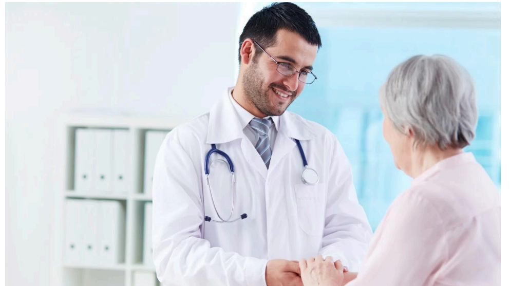
En Francia se fabrica un medicamento con heces humanas cuyo objetivo es mejorar la supervivencia de los pacientes con cáncer y su respuesta a las inmunoterapias, restaurando la microbiota que ha sido dañada por los tratamientos intensivos.