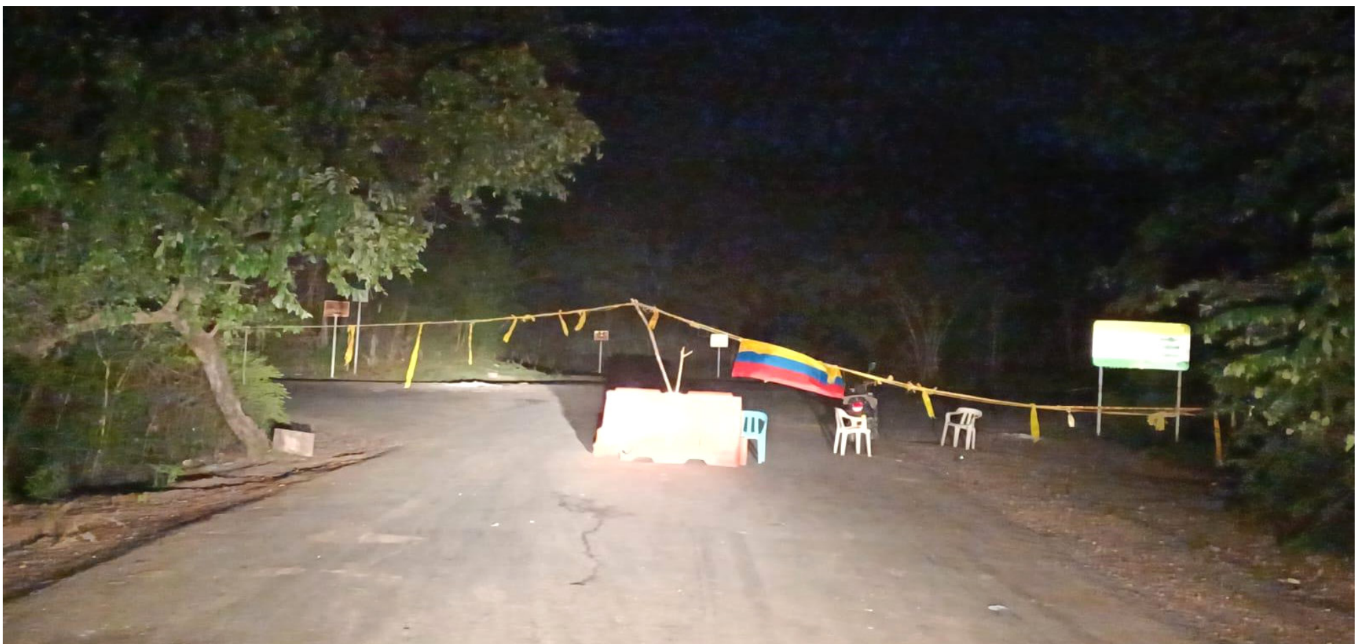
El bloqueo, que persiste desde hace 14 días, no solo afecta las operaciones de la compañía sino que también amenaza el entorno natural.

Ecopetrol advierte que de persistir los bloqueos se pone en alto riesgo el medio ambiente y la integridad de la operación, puesto que no se han podido realizar las actividades propias del mantenimiento de los campos, el apagado correcto de los pozos, la evacuación de Gas Licuado de Petróleo de la planta de gas y, en caso de presentarse un incidente, no habría disponibilidad de personal y equipos para su atención.