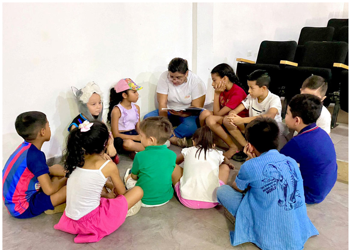
La Biblioteca Departamental Olegario Rivera visitó la Novena Brigada en la ciudad de Neiva y realizó el taller 'Pinta tu arbolito' con el objetivo de fortalecer la motricidad y la técnica de agarre en niños y niñas de 5 a 12 años.