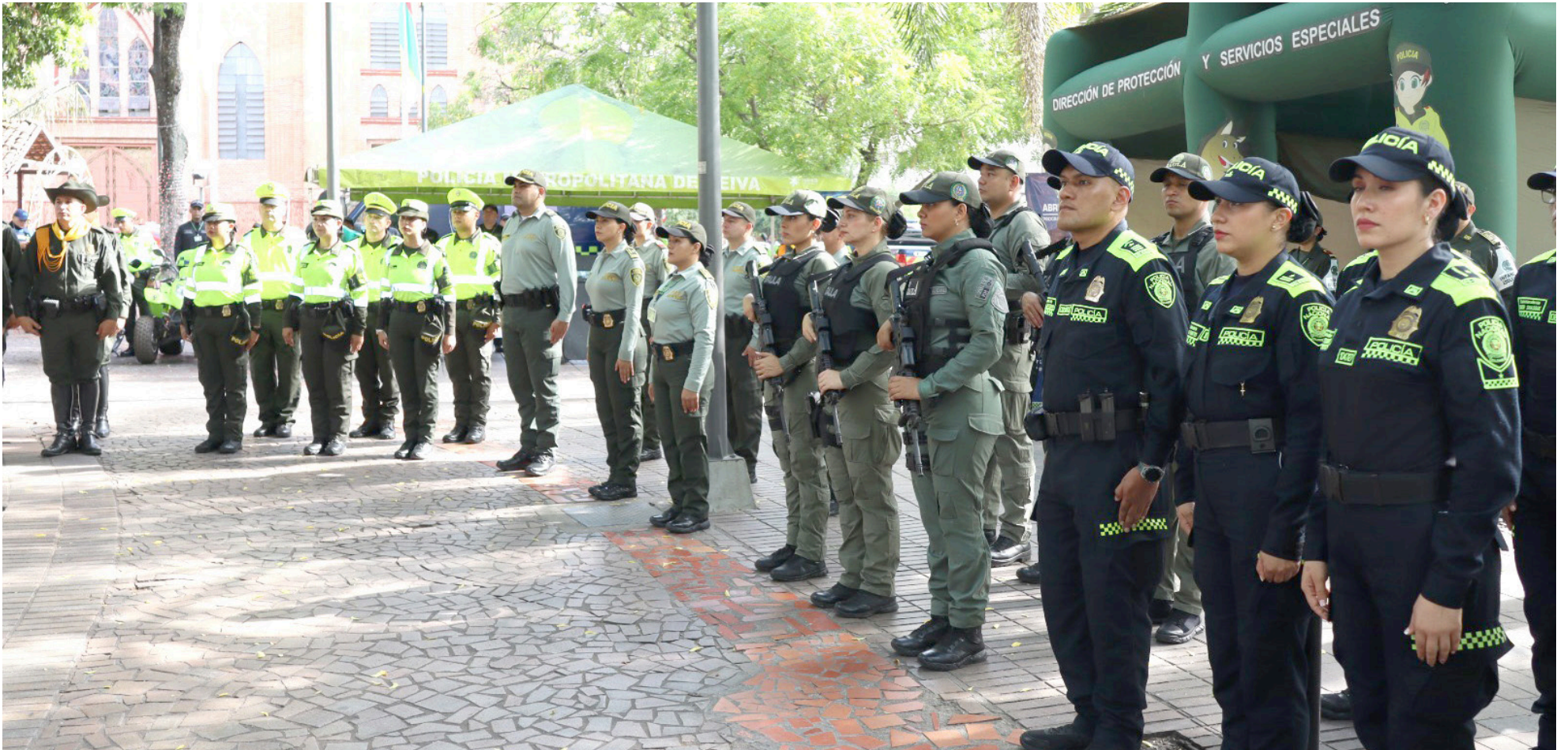
Más de 3 mil policías custodiarán a los huilenses en Navidad y Año Nuevo

■ En el marco de la temporada navideña, que se inauguró oficialmente con la celebración del Día de las Velitas, las autoridades en el departamento del Huila han presentado detalladamente el plan de seguridad que se implementará. Un contingente compuesto por más de 3 mil uniformados estará dedicado a resguardar la tranquilidad y seguridad de los habitantes del Huila.