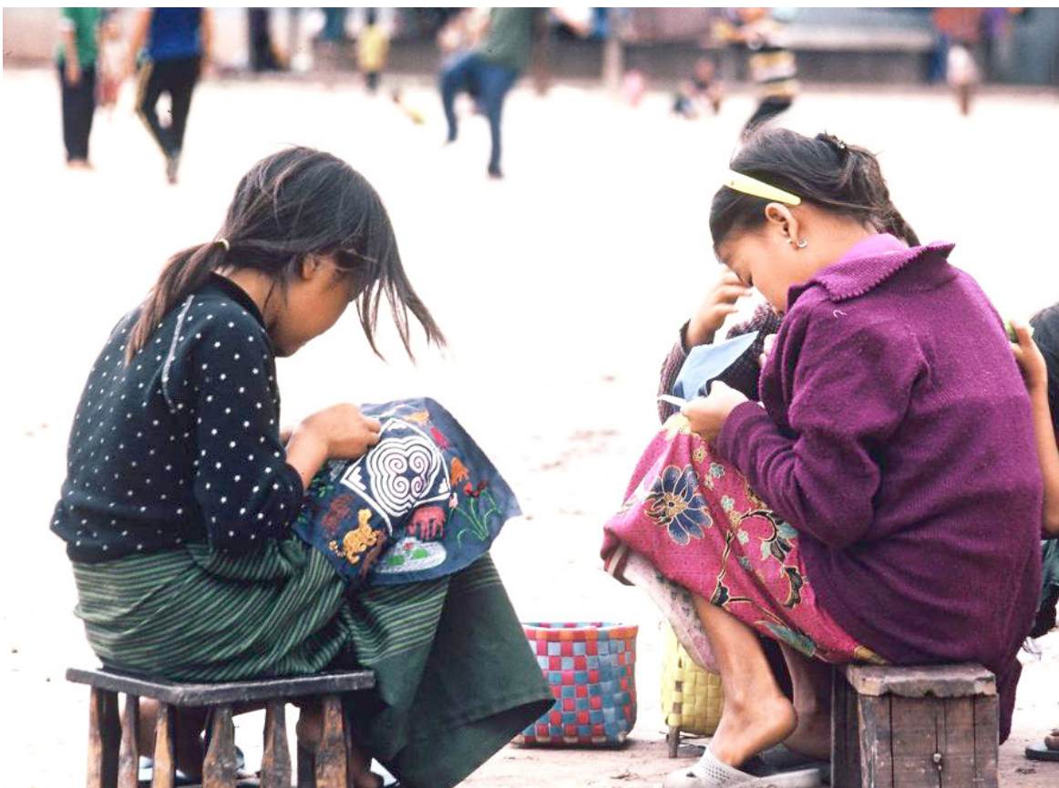
La medida de seguridad también se enfocará en la prevención de acciones delictivas, como la explotación sexual infantil, y en la protección de la biodiversidad.

La Seccional de Investigación Criminal (SIJIN) y la Seccional de Inteligencia Policial (SIPOL) colaborarán con el Modelo Nacional de Vigilancia Comunitaria por Cuadrantes para realizar dispositivos de control en distintos sectores. El Centro Cibernético Policial también estará alerta para prevenir delitos cibernéticos, proporcionando información a través