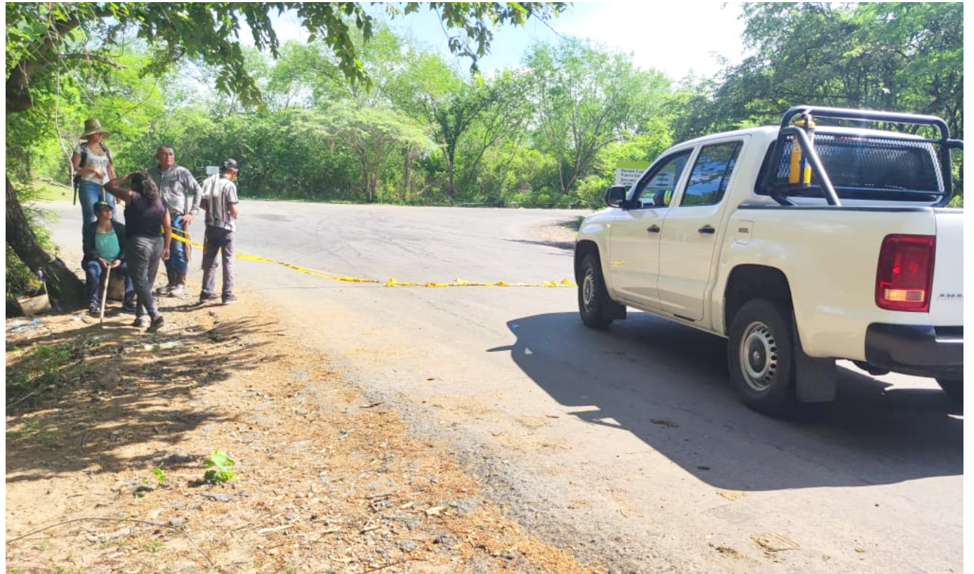
La vereda San Jorge se moviliza para demandar a Ecopetrol la contratación de trabajadores locales, generando un bloqueo, afectando las operaciones de la empresa y generando tensiones en la región.

El bloqueo persistente en la vereda San Jorge, sector Alto, en Neiva, tiene a Ecopetrol lidiando con consecuencias operativas críticas en la Planta de Gas Dina, el campo Palogrande y la Planta de Inyección de Agua Cebú.