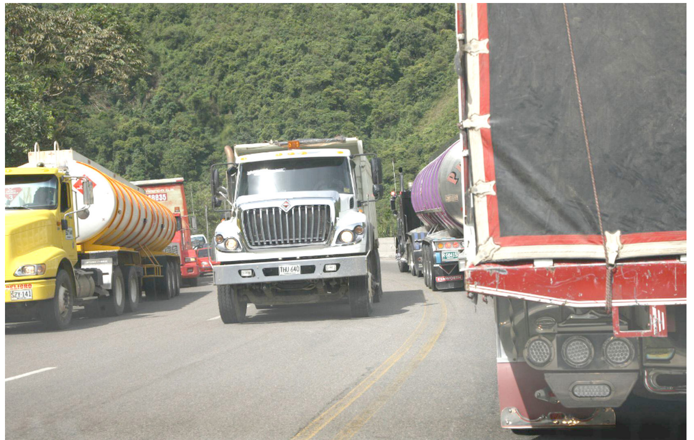
Con el borrador de decreto del Ministerio de Hacienda, el galón de ACPM pasaría de $9.000 a $16.000.

El exministro de Hacienda Juan Carlos Echeverry pidió al ministro Ricardo Bonilla que no avance con esta medida, ya que “manejar precios arbitrariamente contra fulanito y sutanito es la peor política pública”.