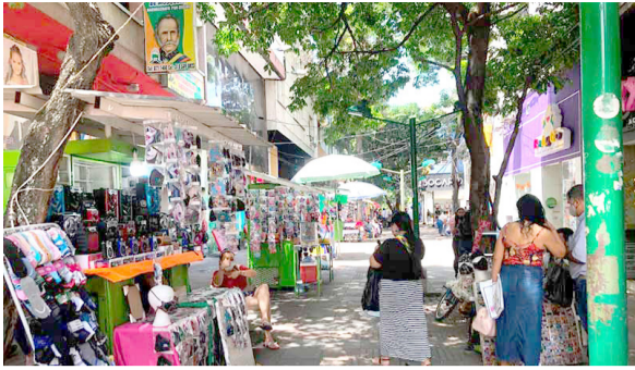
Altas expectativas con la temporada decembrina