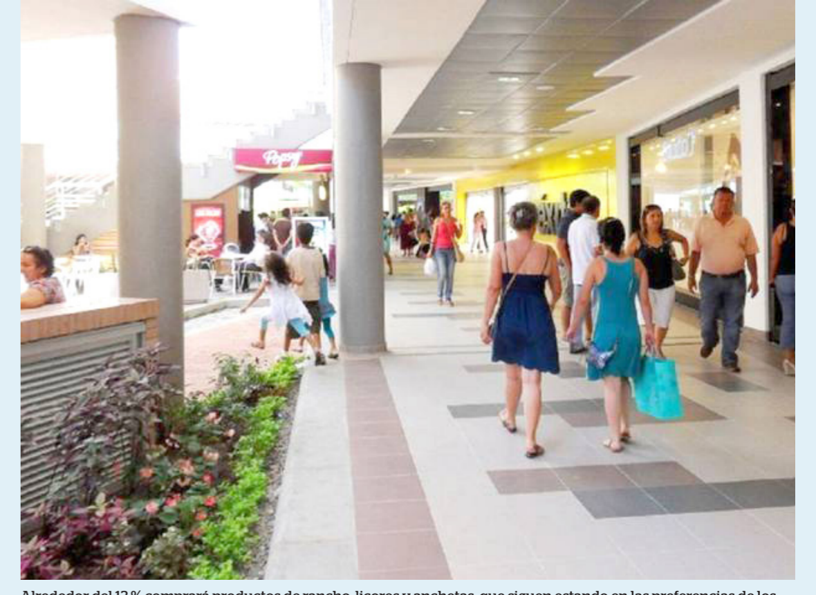
Alrededor del 13 % comprará productos de rancho, licores y anquetas, que siguen estando en las preferencias de los colombianos.