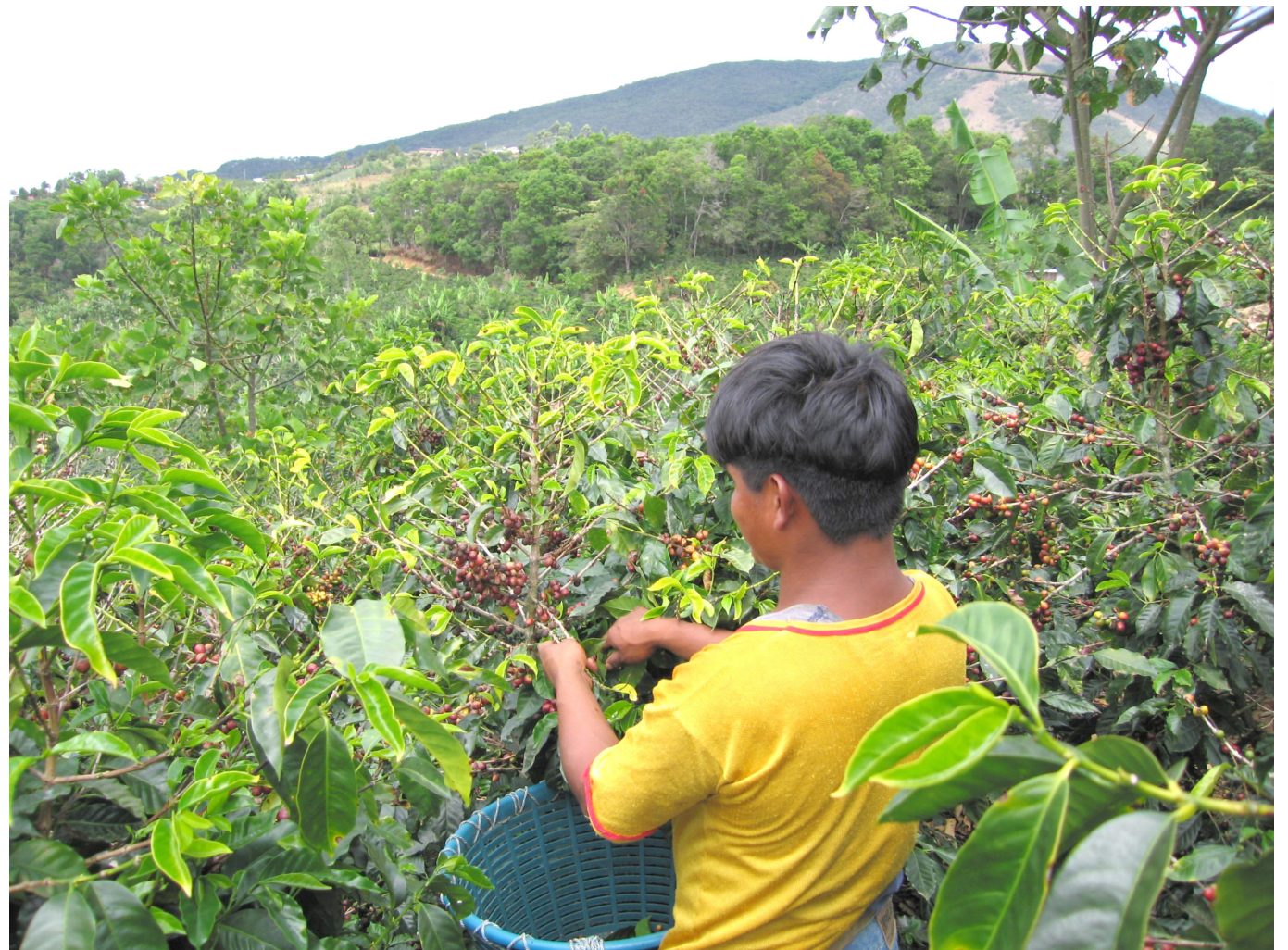
Jóvenes abandonan el estudio para laborar como recolectores de café.