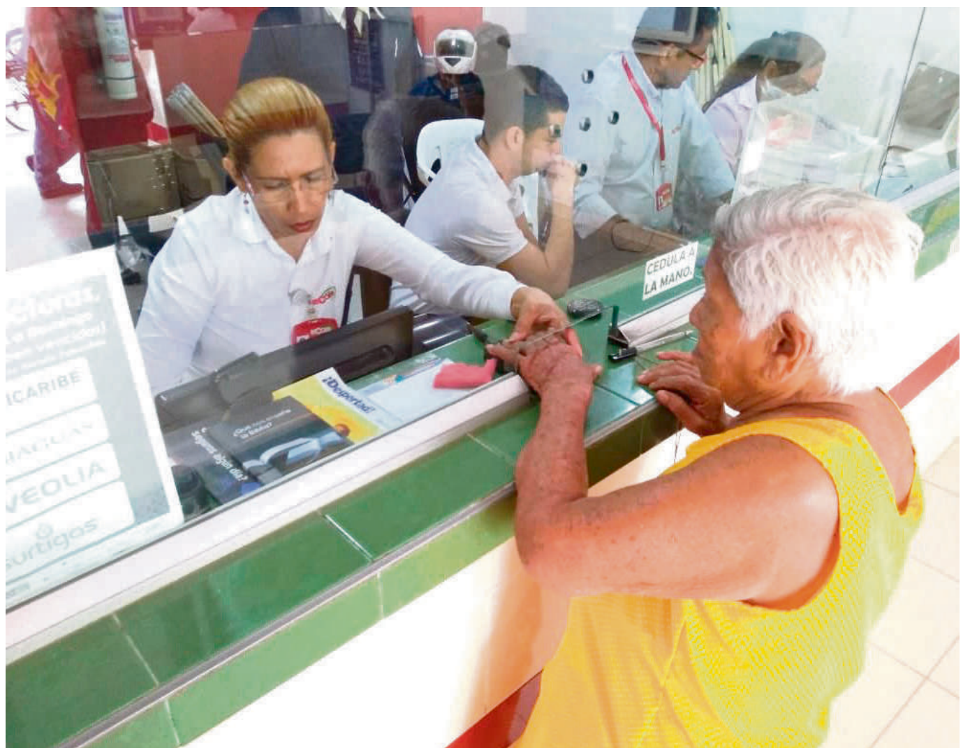
En los próximos días el Gobierno nacional dará los lineamientos para el pago.