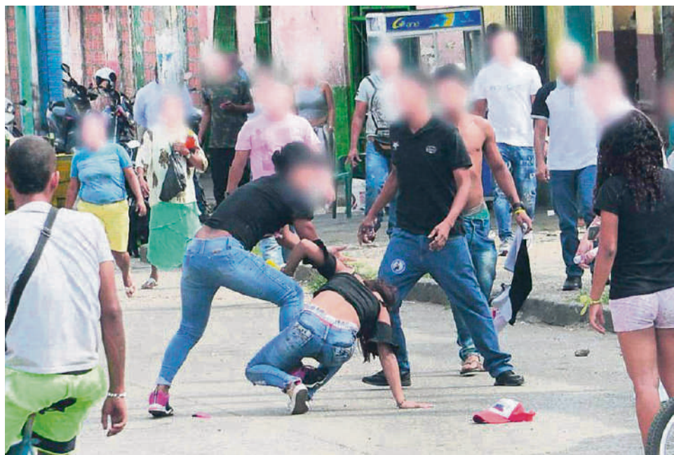
Las riñas y las lesiones personales son un delito que preocupa en el Huila.

Para el caso del hurto a personas se han denunciado 101 ca-