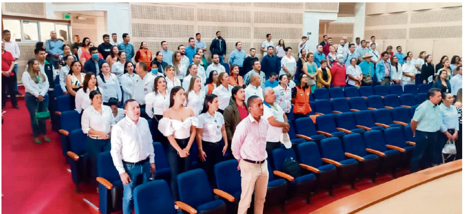
72 trabajadores formalizados.

En la Administración Municipal Aunque esto empezó en EMPITALITO E.S.P., el proceso continúa también en la Administración Municipal “no con todos los trabajadores, pero empezamos con un grupo muy importante. Ya terminamos el proceso en las empresas públicas y ahora estamos con la Alcaldía”, contó el burgomaestre.