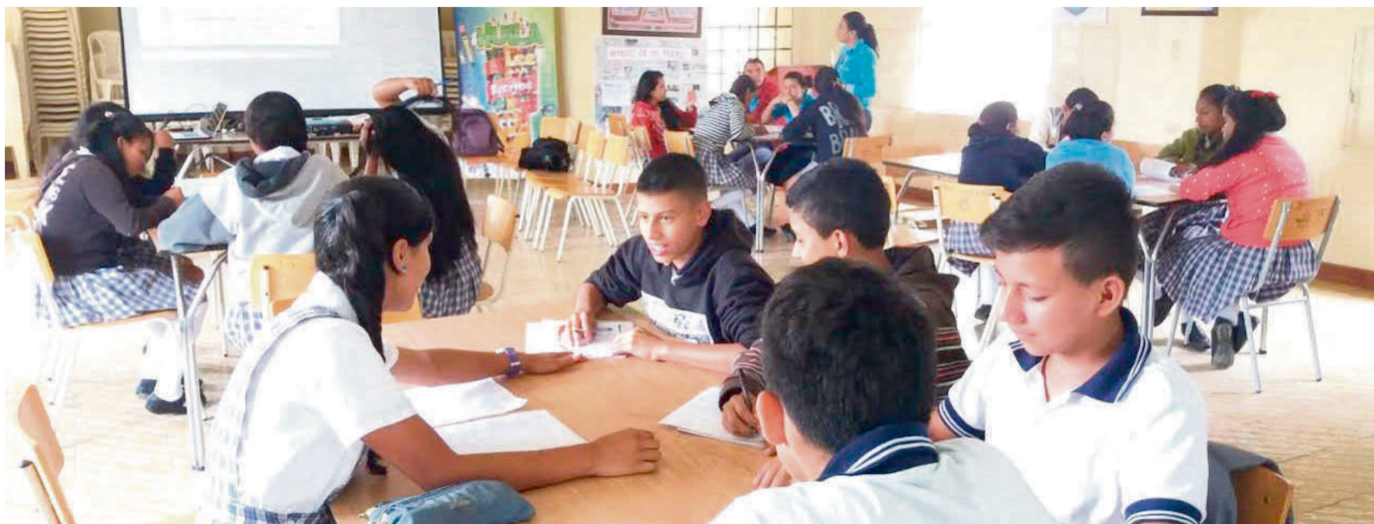
Afortunadamente para este año el panorama parece estar más tranquilo en esa área y se espera continúe de tal forma dadas las estrategias implementadas.

Así lo manifestó Oliveros Crespo, quien expresó que, "en las intuiciones privadas yo tengo mayor tranquilidad porque allí se imparten unas reglas y se cumplen. Eso en obediencia a las reuniones constantes, por eso, en definitiva, son escenarios diferentes y yo quisiera poder contar con los recursos para llegar allá, es decir, llegar a fortalecimiento y capacitación. El señor gobernador Luis Enrique Dussán ha trabajado mucho el tema del Ser para el Hacer, tener una prueba diagnóstica para poder ser mejores personas y eso