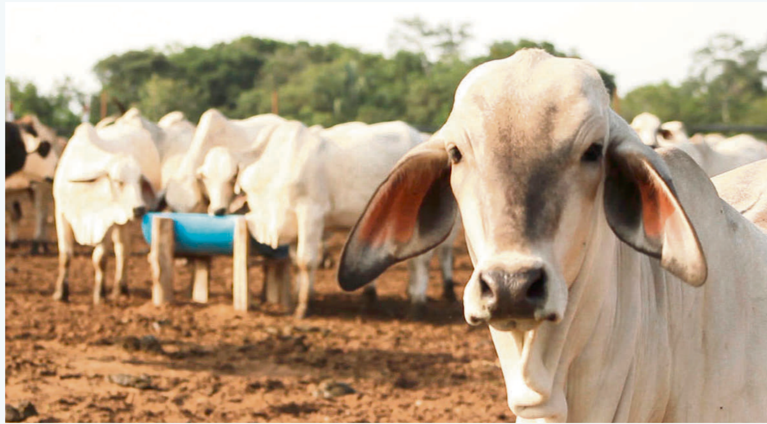
Palermo, Aipe y Pitalito son los municipios con mayor hato ganadero de todo el Huila.

“Es triste pensar en que volvamos 15 o 20 años atrás para retomar unos mataderos municipales”, Muñoz.