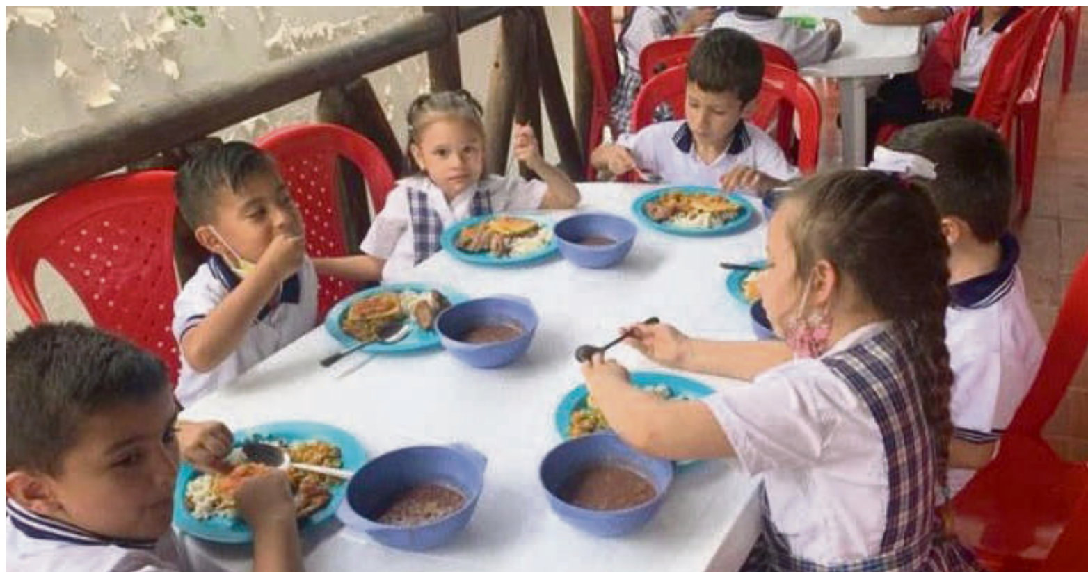
En Neiva, el programa será ejecutado por el operador Unión Temporal Alimentar Calidad 2023.

El operador Unión Temporal Alimentar Calidad 2023 fue oferente, que según la funcionaria cumplió con todos los requerimientos que se exigían en la licitación, por lo cual se podrán distribuir 38 mil raciones diarias en las diferentes instituciones educativas, además de aquellas que funcionan bajo el cronograma de jornada única.