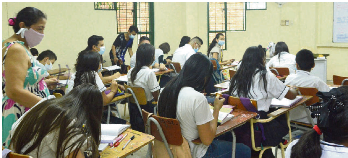
El inicio del calendario escolar en el departamento del Huila durante el año pasado se vio lamentablemente perjudicado por problemas de riñas, drogadicción y uso de armas.

Estas situaciones que obedecían muy seguramente a dificultades internas han logrado erradicarse durante el inicio del calendario escolar del 2023, o al menos, eso es lo que se percibe hasta el momento.