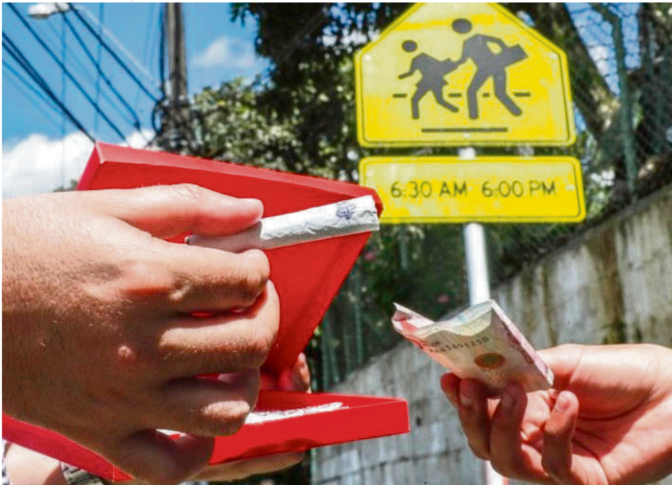
Empero esa preocupación parece que quedó en el pasado y surgió como consecuencia del encierro obligatorio.

es desde la casa. Es importante saber y reflexionar sobre lo que estamos haciendo mal e incentivar los sueños a futuro de todos los niños, adolescentes y jóvenes”.