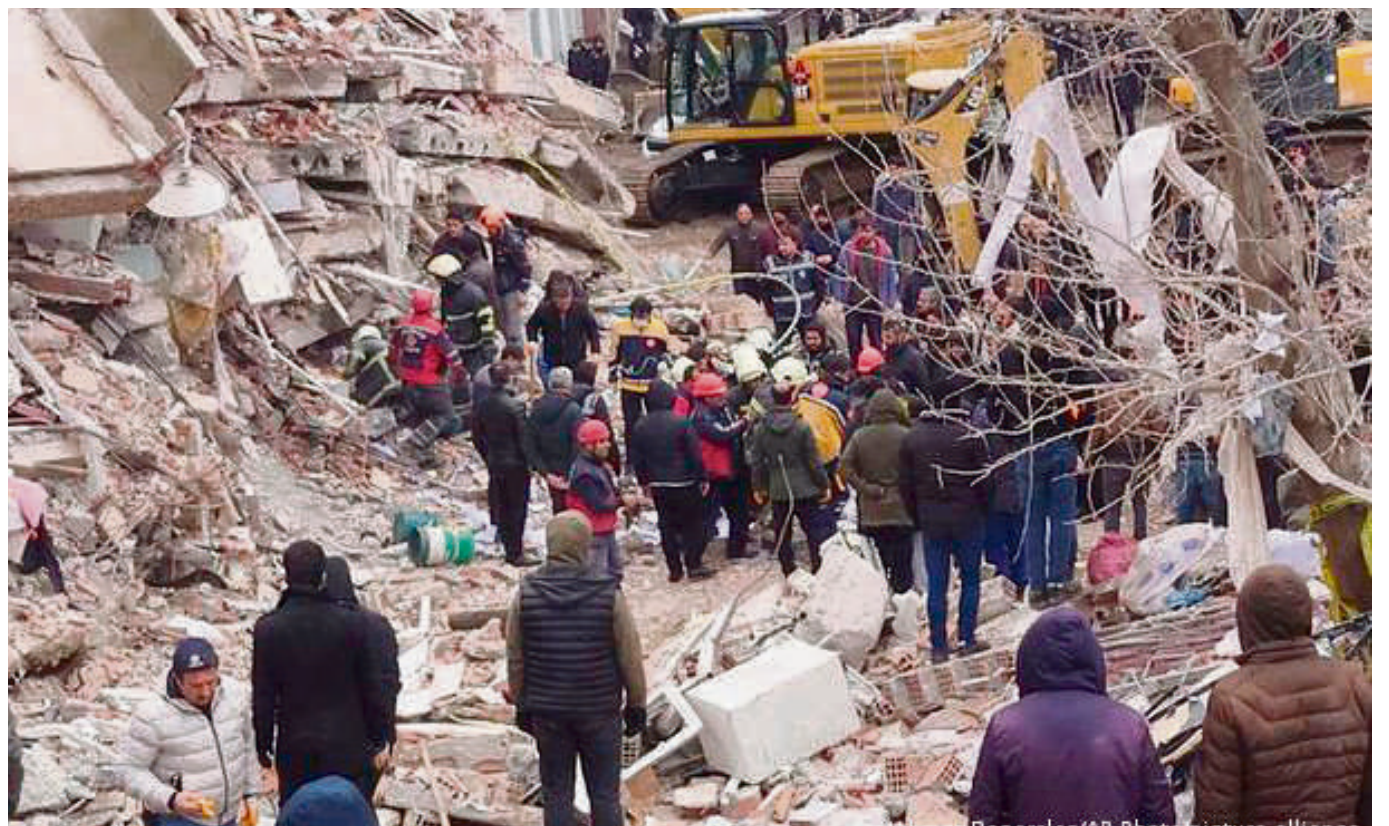
Las cifras de muertos ascienden a 5.000, lo cual podría seguir creciendo.

El tamaño de la falla, de 150 kilómetros de largo por 25 kilómetros de espesor, fue otro de los factores que contribuyeron a la destrucción.