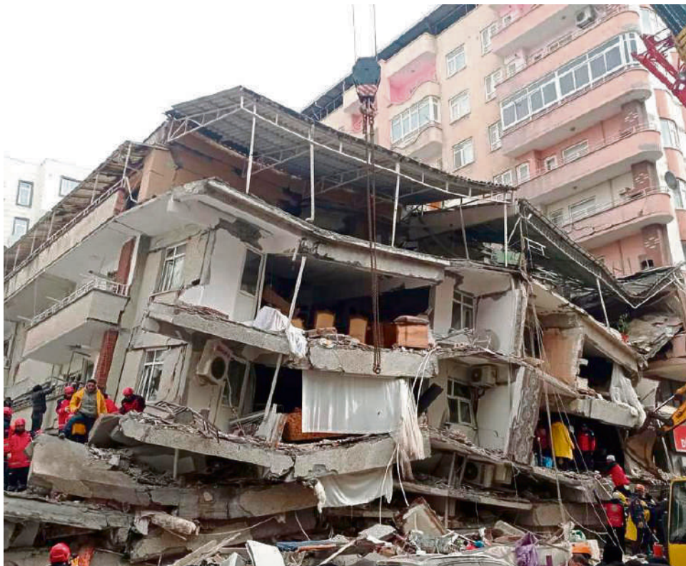
Al parecer las edificaciones no eran lo suficientemente resistentes.

China también anunció el envío de una ayuda de 5,9 millones de dólares, que incluirá unidades especializadas en el socorro en entornos urbanos, equipos médicos y material de urgencia, según un medio estatal de Pekín. De acuerdo con Erdogan, unos 45 países ofrecieron ayuda. Por su parte, el llamado lanzado por el Gobierno de Siria recibió por ahora respuesta de Moscú, su aliado, que prometió equipos de socorro "en las próximas horas", además de 300 militares rusos que ya se encuentran en el sitio para ayudar en el rescate. La ONU también reaccionó, pero insistió en que la asistencia debe llegar a toda la población siria, incluida la parte que no está bajo control de Damasco.