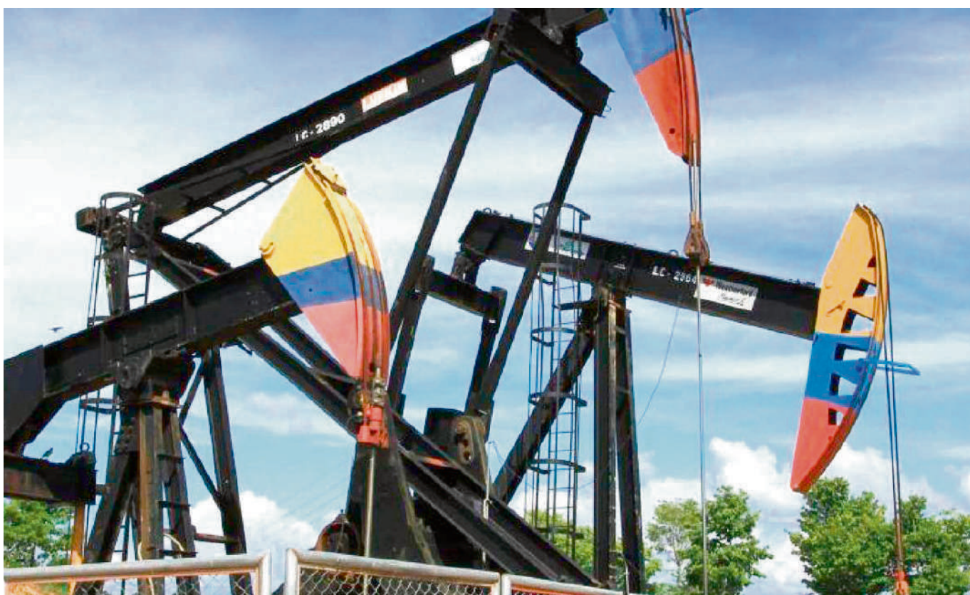
Ese es el lema que lo acompaña con el cual demeritan toda la desinformación que ha circulado a nivel nacional.

Bajo esa lógica, considera que paulatinamente vie-