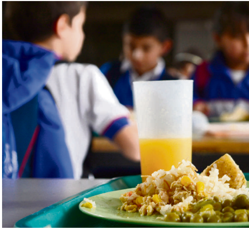
En Pitalito 10.463 estudiantes se benefician del PAE.

Para la vigencia 2023, el PAE departamental tiene un costo de 140.000 millones de pesos, frente a los 125.000 millones de pesos del 2022.