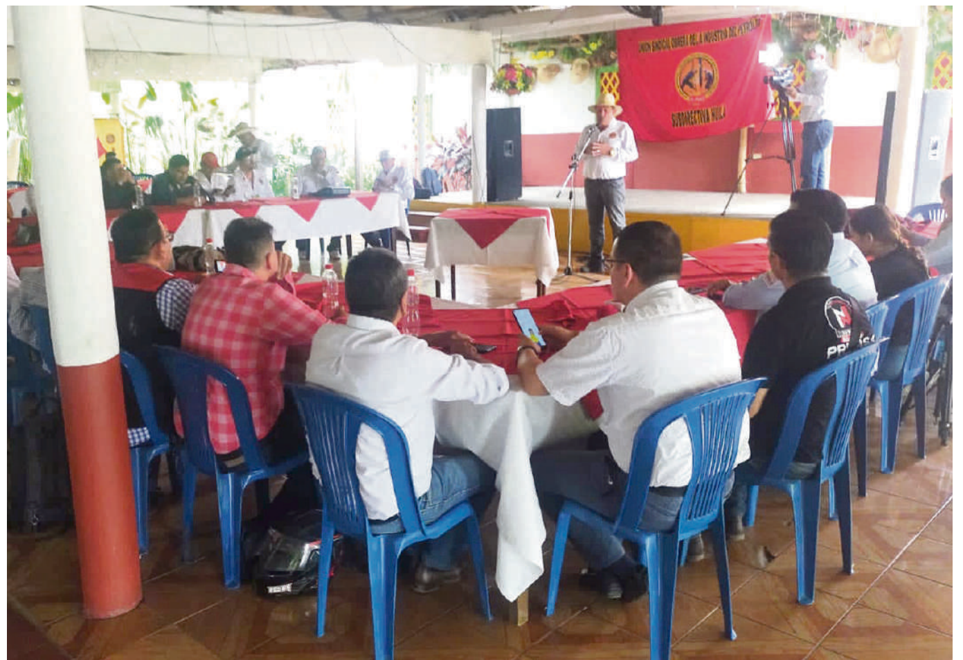
Sus miembros aseguran tener un esquema de seguridad insuficiente, a pesar de ser víctimas de diversas amenazas.

Los actos culturales serán fundamentales en la celebración de los 100 años de consolidación de la Unión Sindical Obrera (USO), la cual, ha sacrificado 136 víctimas durante su histórica lucha.