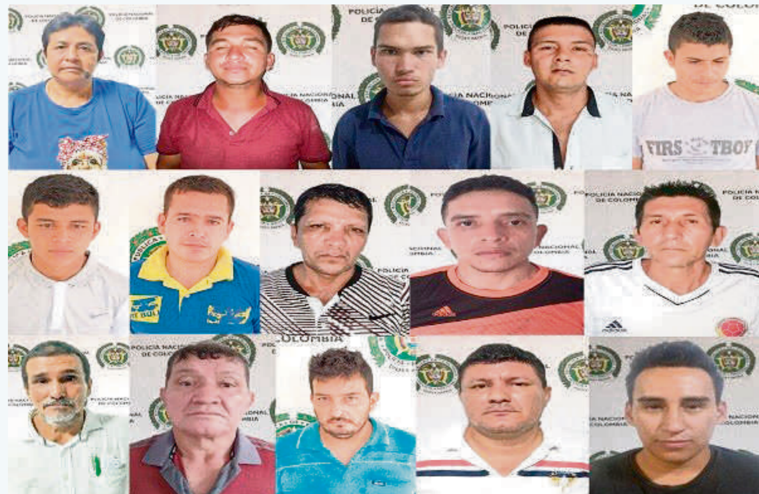
‘Los Frigoríficos’ conformado por 15 personas, se dedicaban al hurto calificado y agravado y abigeato.