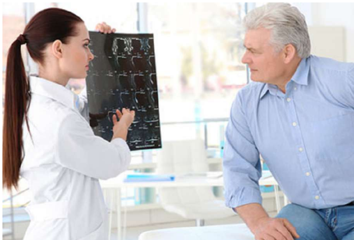
El problema es que, con los años, este proceso de sustitución del tejido viejo se vuelve deficitario, y las células encargadas de formar hueso.

El ejercicio, consumir calcio en la dieta diaria al igual que vitamina D, dejar de fumar o consumir alcohol, reducir la ingesta de alimentos grasos, salados y procesados puede ser una opción bastante buena en el proceso.