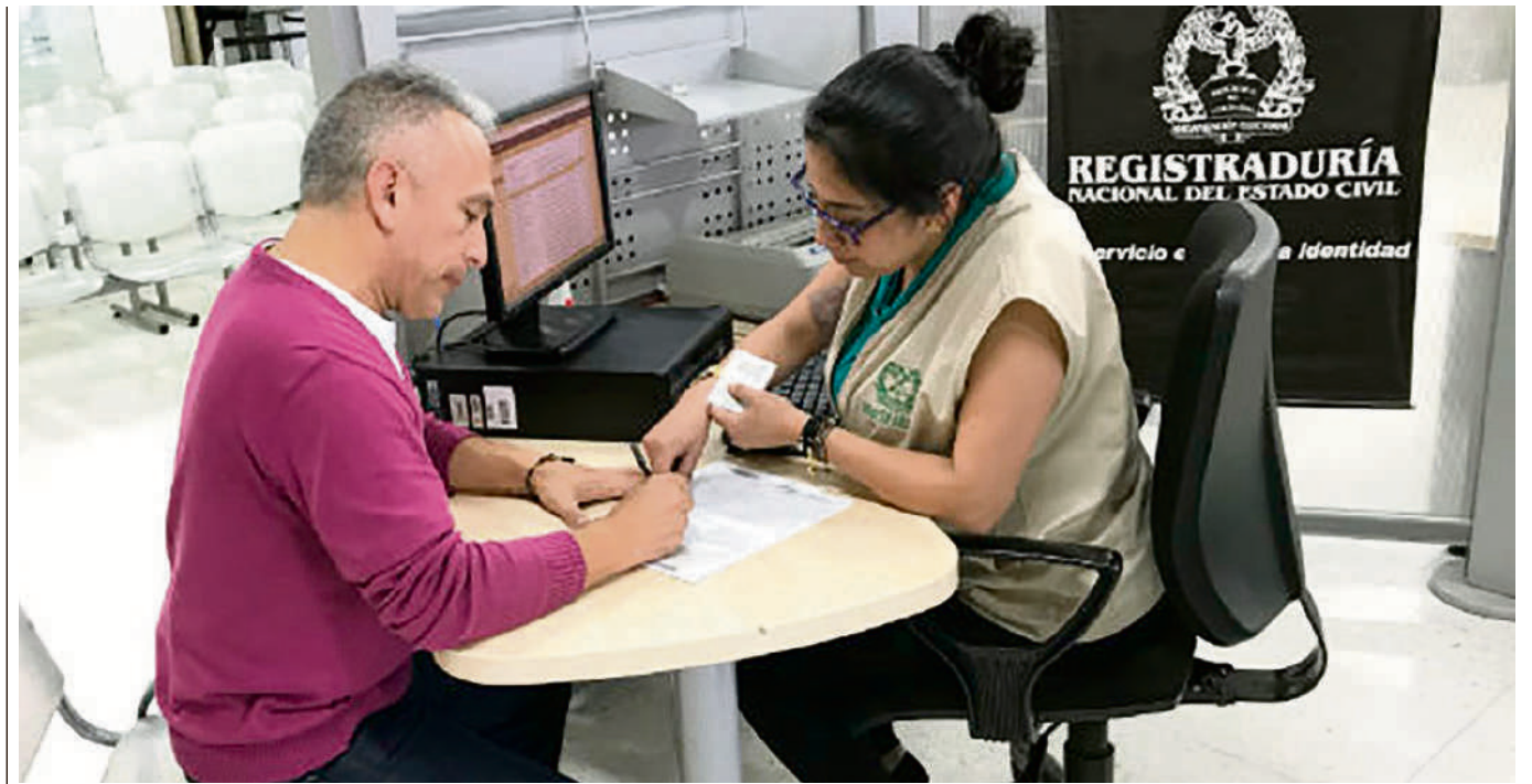
Murcia Olaya seguirá buscando mejorar los procesos dentro de la Entidad.

“De hecho, algunos funcionarios se han molestado por algunas medidas que hemos tomado en los temas institucionales”.