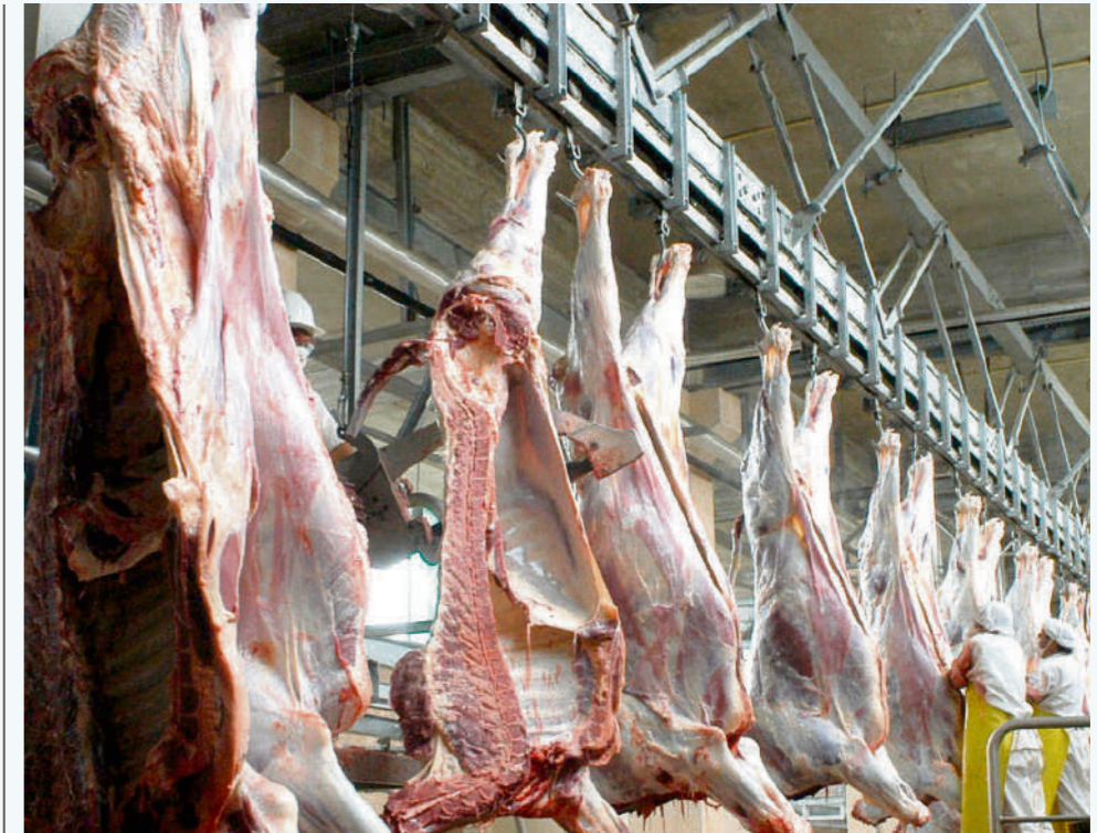
Opiniones encontradas ha generado el tema de revivir los mataderos municipales.

“Así en últimas consigamos la plata para poner en funcionamiento los mataderos municipales, falta la estabilidad financiera y el sostenimiento, de lo contrario corremos el riesgo de que se nos queden ‘elefantes blancos’ en el Huila”, agregó.