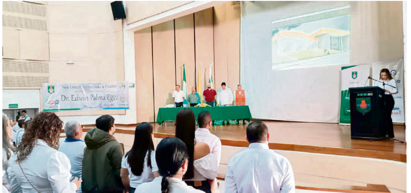
Viceministro de Relaciones Laborales e Inspección Edwin Palma participó en la socialización del proceso de formalización laboral.

De 33 cargos, se pasó a 78 que quedan costando a $5.600 millones de pesos “así dignificamos la vida de las personas y nos ahorramos $611 millones”.