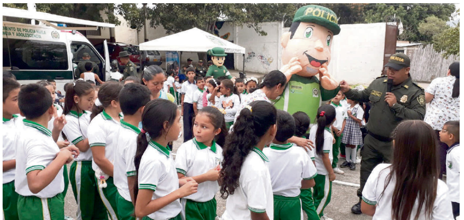
En el momento, aparte de esta situación expuesta, lo que mayor preocupación le demanda es el transporte escolar.

Según la secretaria de Educación algunos padres de familia y rectores dicen que faltan más psicoorientadores en las instituciones y aunque efectivamente se necesitan, para ella es fundamental entender que todos los ciudadanos pueden contribuir en esta área.