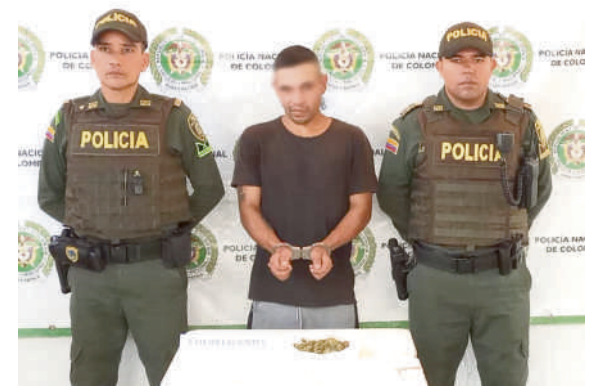
Capturado con 73 gramos de marihuana.