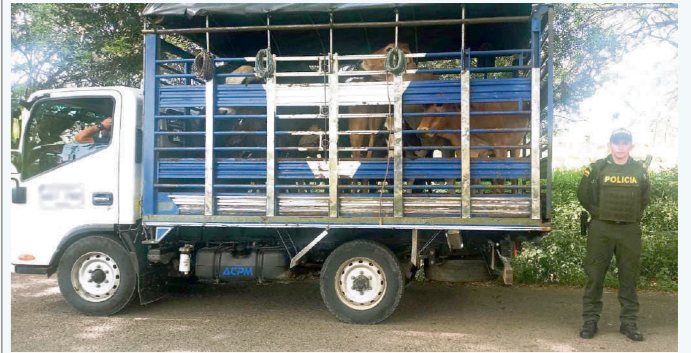
Según las autoridades departamentales, señalan que solo se ha presentado un caso de abigeato en 2023.

También agregó con caras al próximo gobierno, “se pedirá que nos tenga en cuenta por el tema de agroinsumos, pues se nos están incrementando sustancialmente, como por ejemplo las sales y de medicamentos”, finalizó.