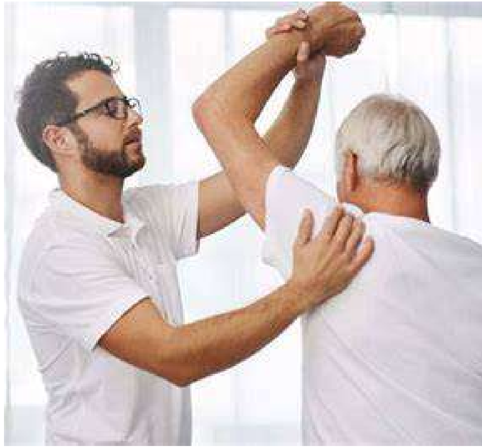
Estar en un constante chequeo médico puede ayudar a descubrir a tiempo algunas patologías.

Aunque se ha dicho que en hombres aparece en edades avanzadas, también hay casos en los que se muestra como una enfermedad prematura que pueden derivar de otras afectaciones.