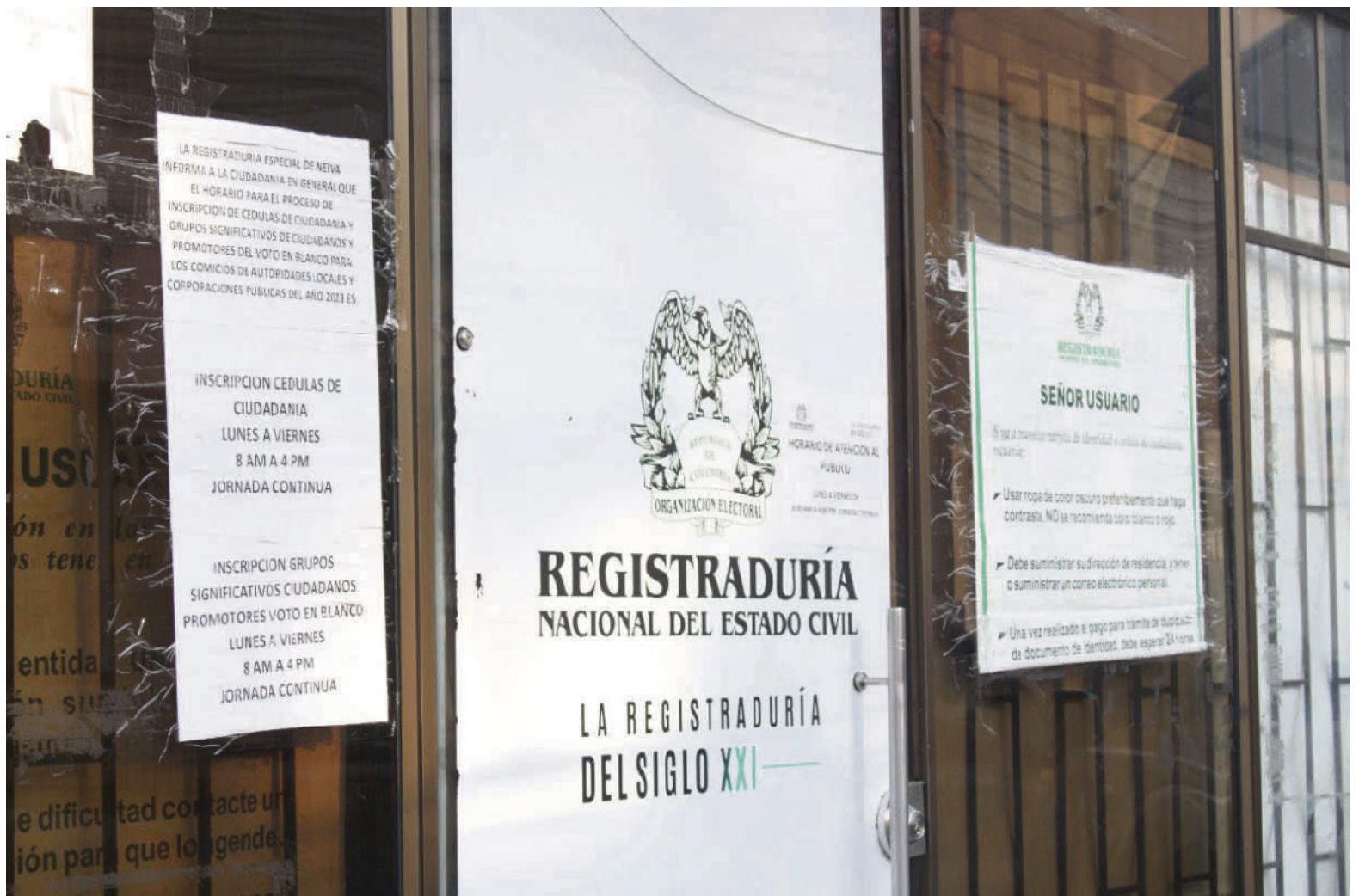
32 procesos disciplinarios se adelantan en contra de varios funcionarios por extralimitarse en sus funciones y cometer faltas.

“Hoy creo que al interior de la entidad se ha avanzado muchísimo en temas tecnológicos y no he escatimado esfuerzos, he recorrido el departamento, he hablado con los registradores y estoy como se dice popularmente ‘apretando tuercas’ en varios temas que me han denunciado por parte de los ciuda-