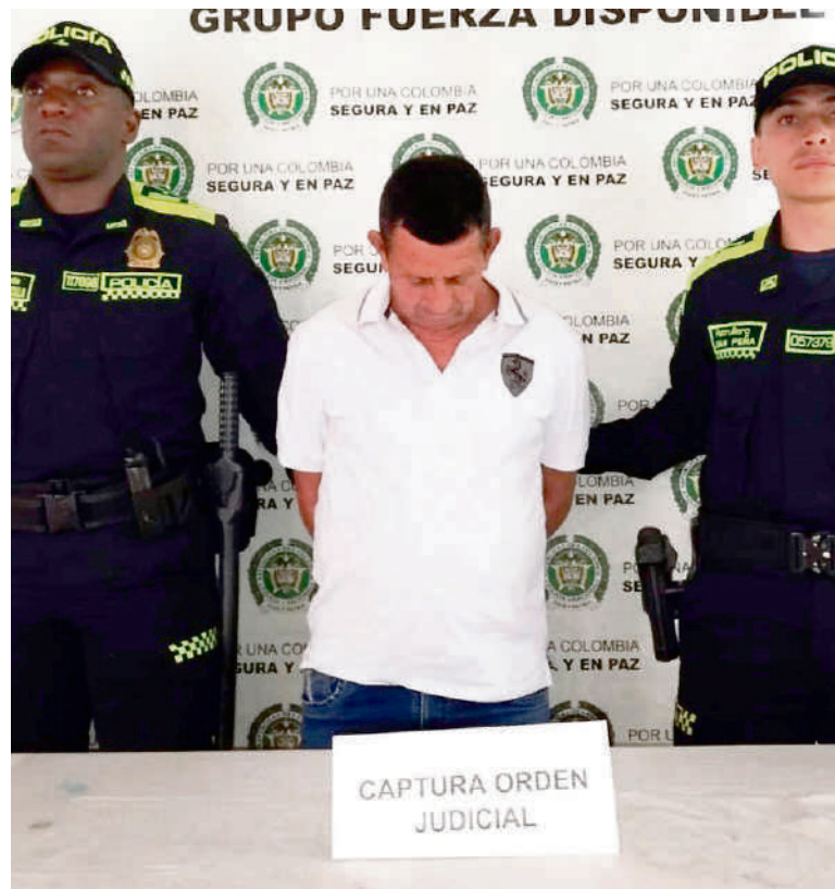
Presunto responsable de los delitos de concierto para delinquir y hurto calificado y agravado en concurso homogéneo y sucesivo

El judicializado formaba parte de ese grupo delictuoso dedicado al hurto a personas en la modalidad de factor oportunidad.