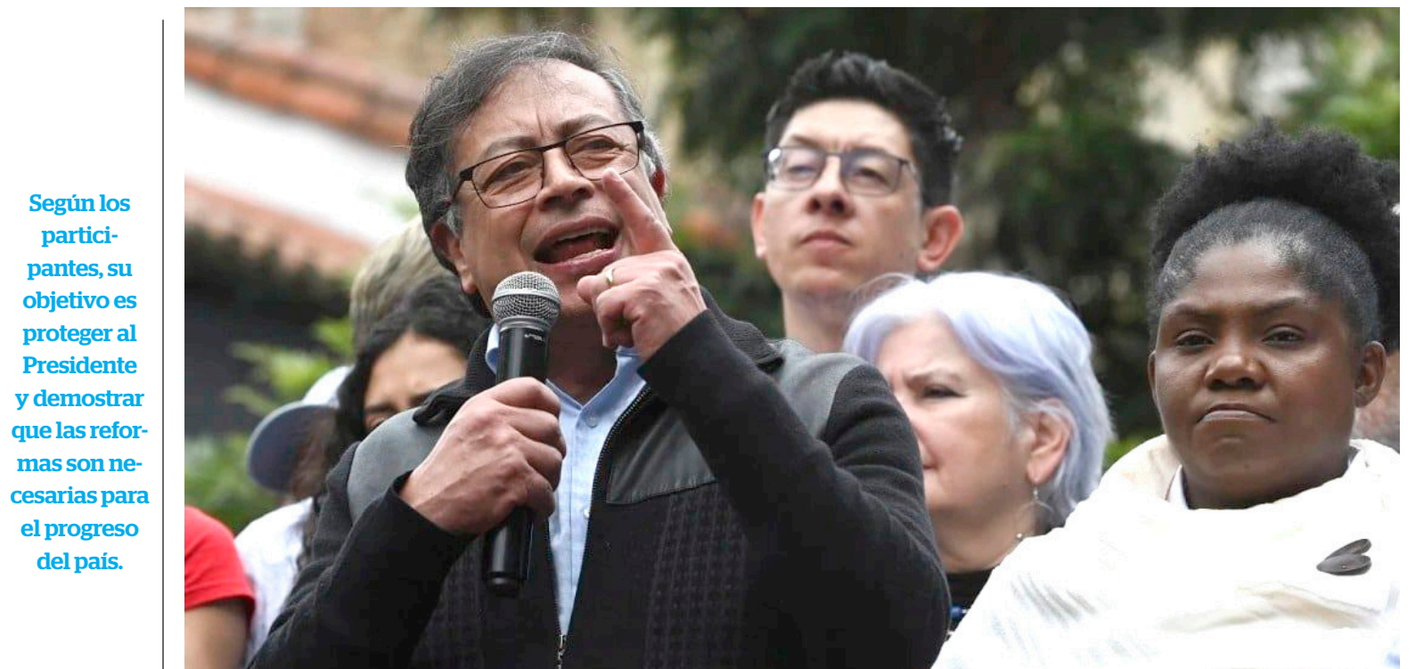
Petro, a diferencia de otras movilizaciones hizo en esta oportunidad un recorrido a pie por Bogotá, y así mismo hizo su discurso.

Según los participantes, su objetivo es proteger al Presidente y demostrar que las reformas son necesarias para el progreso del país.