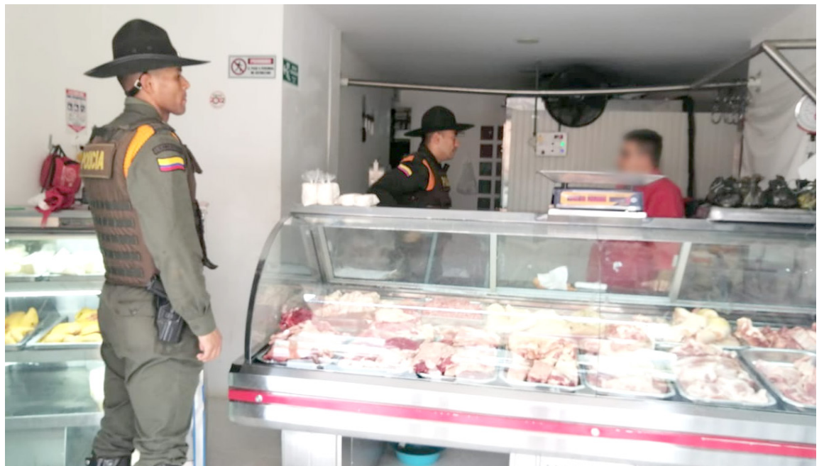
El grupo de Carabineros del departamento del Huila logró la incautación en las últimas horas de 140 kilos de carne de cerdo y res que estaba siendo comercializada en diferentes puntos del municipio de Timaná.