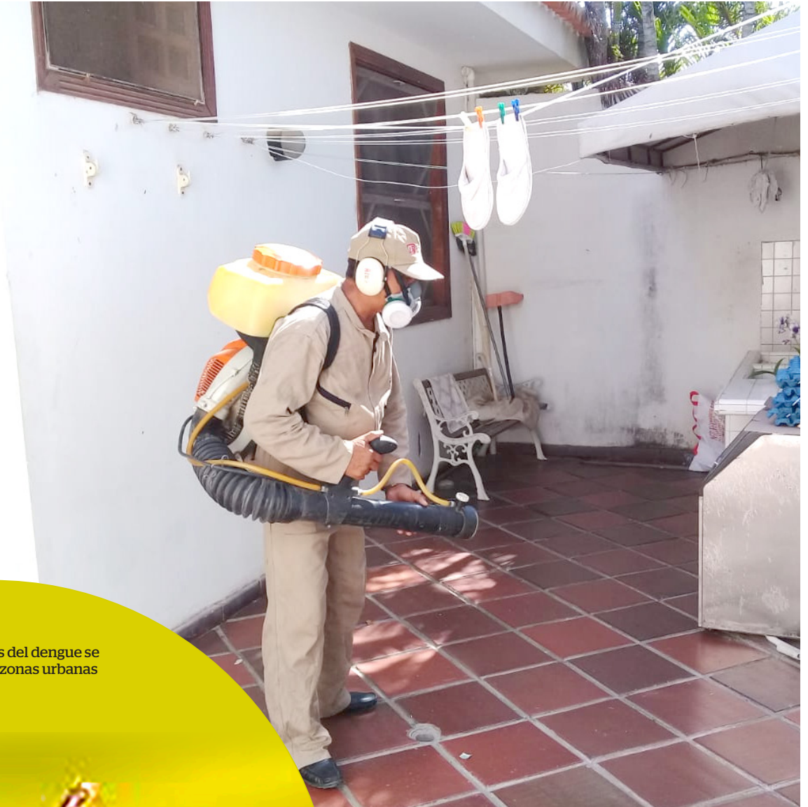
La fumigación permite controlar la reproducción de Aedes Aegypti

En lo que comprende la capital huilense, la Administración Municipal a través de la