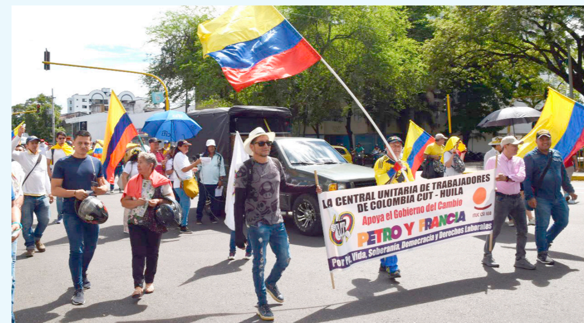
Sindicatos hicieron parte de esta masiva marcha.