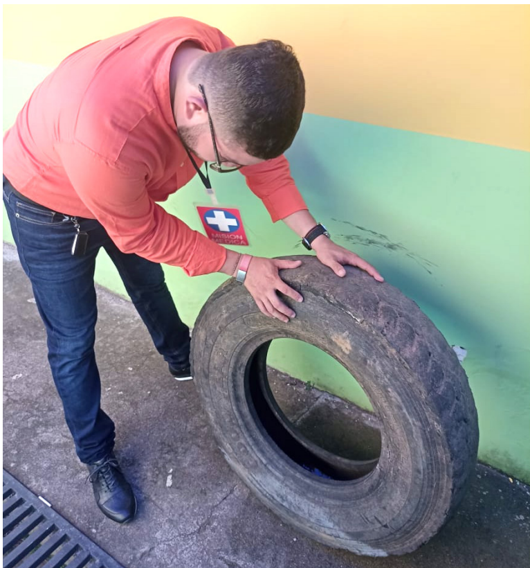
No guardar elementos a los cuales no se les da uso o están en abandono

ría de Salud del departamento. Agregó que los padres de familia deben evitar la automedicación pues puede aumentar el riesgo de complicaciones en este tipo de pacientes. Lo correcto es asistir de inmediato al servicio médico.