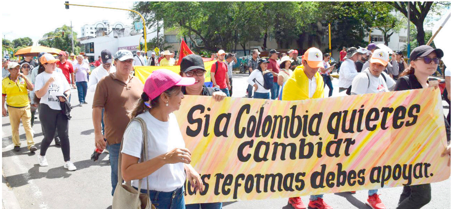
En Neiva, más de 800 personas salieron a las calles para apoyar al Presidente.