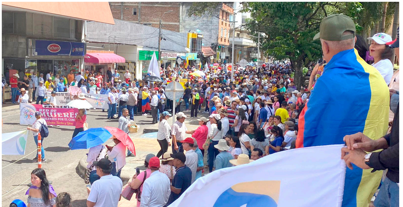
Sin mayores complicaciones terminaron las marchas en todo el país.

Además anunció dos nuevas propuestas que su gobierno presentará en el próximo semestre. La primera de ellas será una reforma a la Ley 30 de educación, con el objetivo de mejorar el acceso y la calidad de la educación