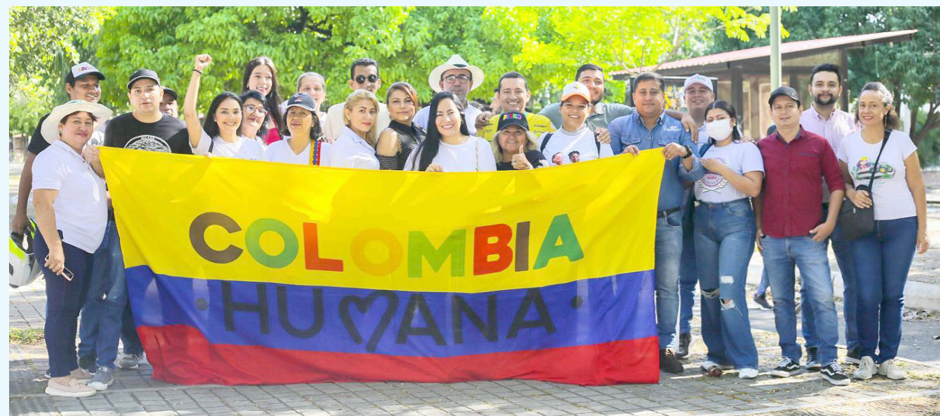
La marcha busca respaldar las reformas de la salud, laboral y pensional.