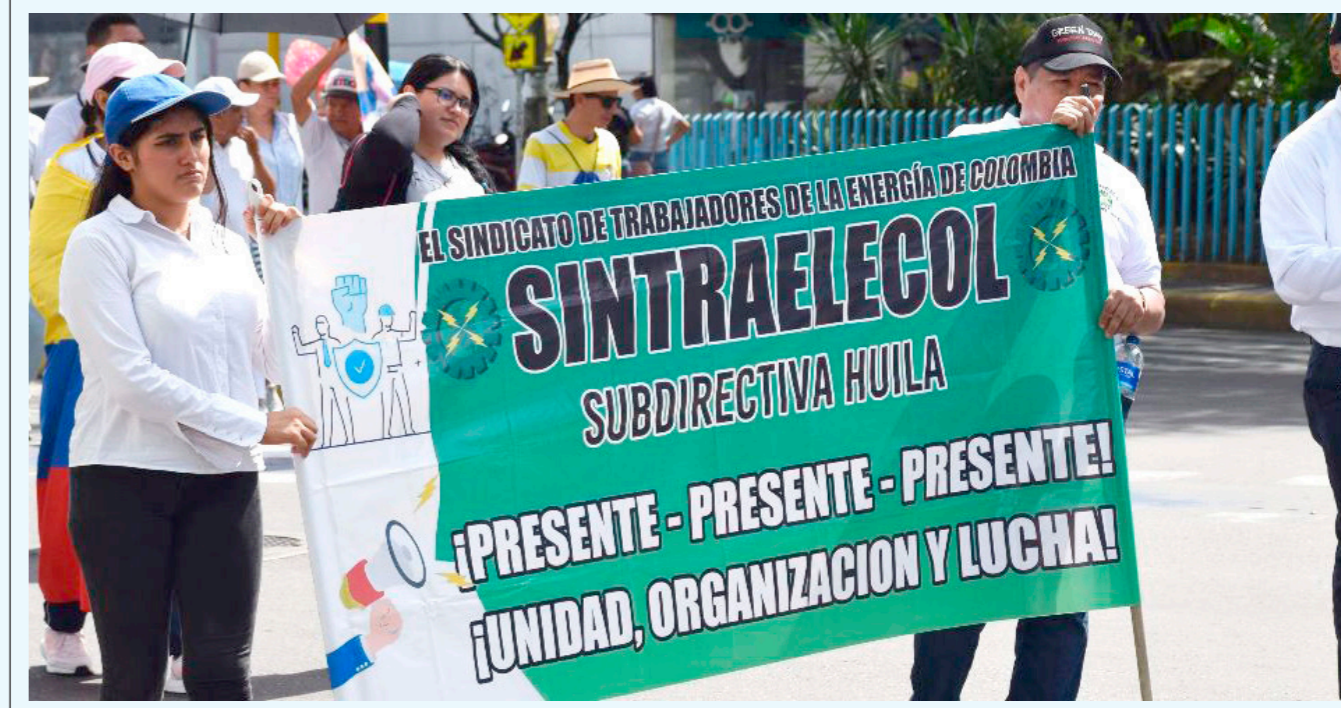
En Bogotá, el presidente Gustavo Petro participó en la marcha.