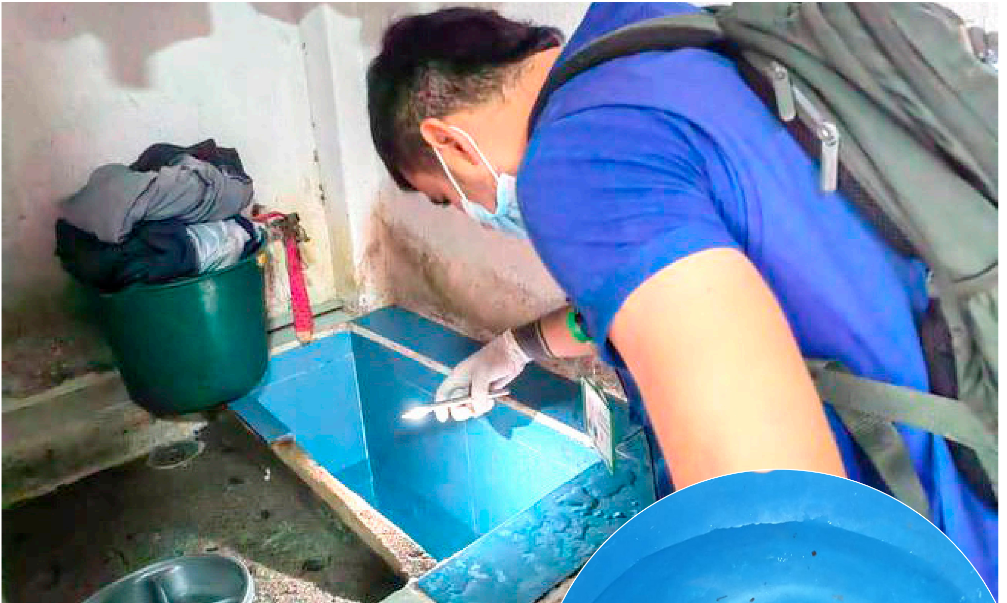
La revisión constante de tanques y su lavado es clave