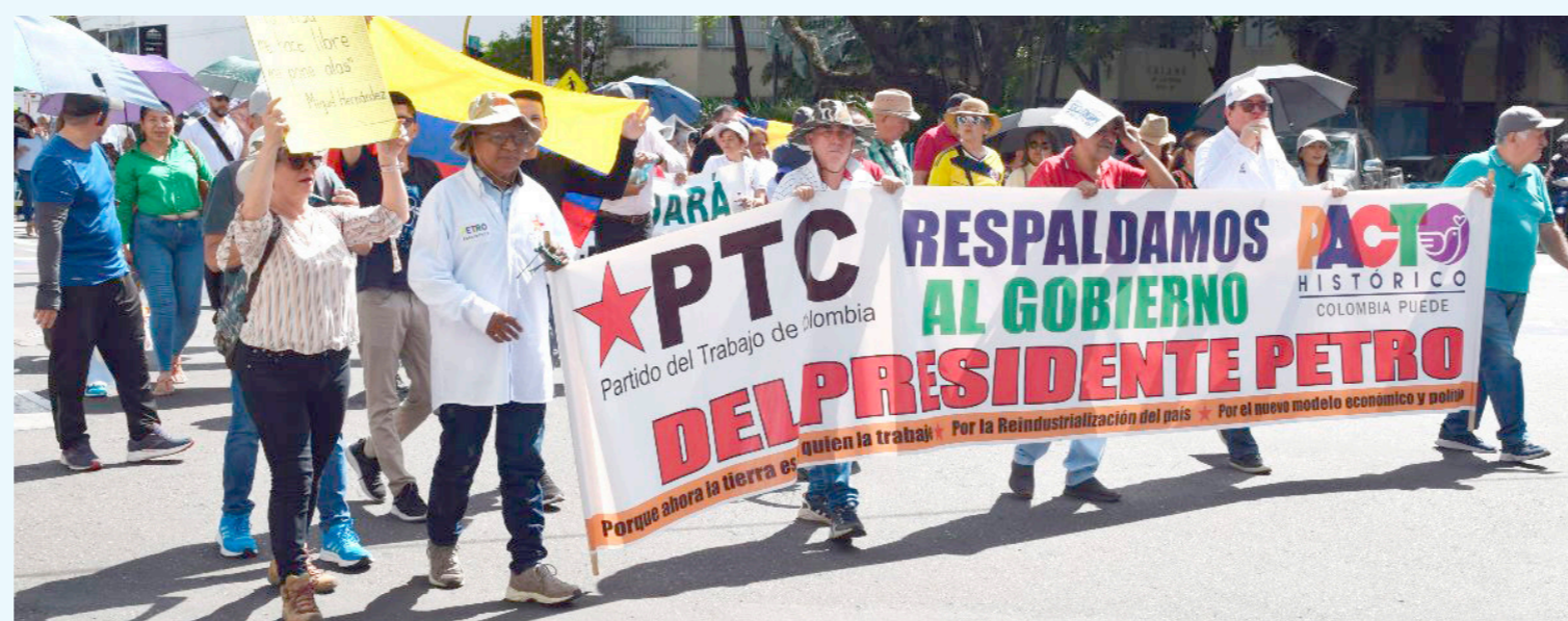
En Neiva, cientos de personas salieron a marchar.