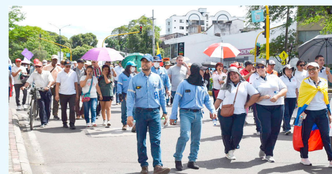
Ni el sol, se interpuso en el recorrido de los marchantes.