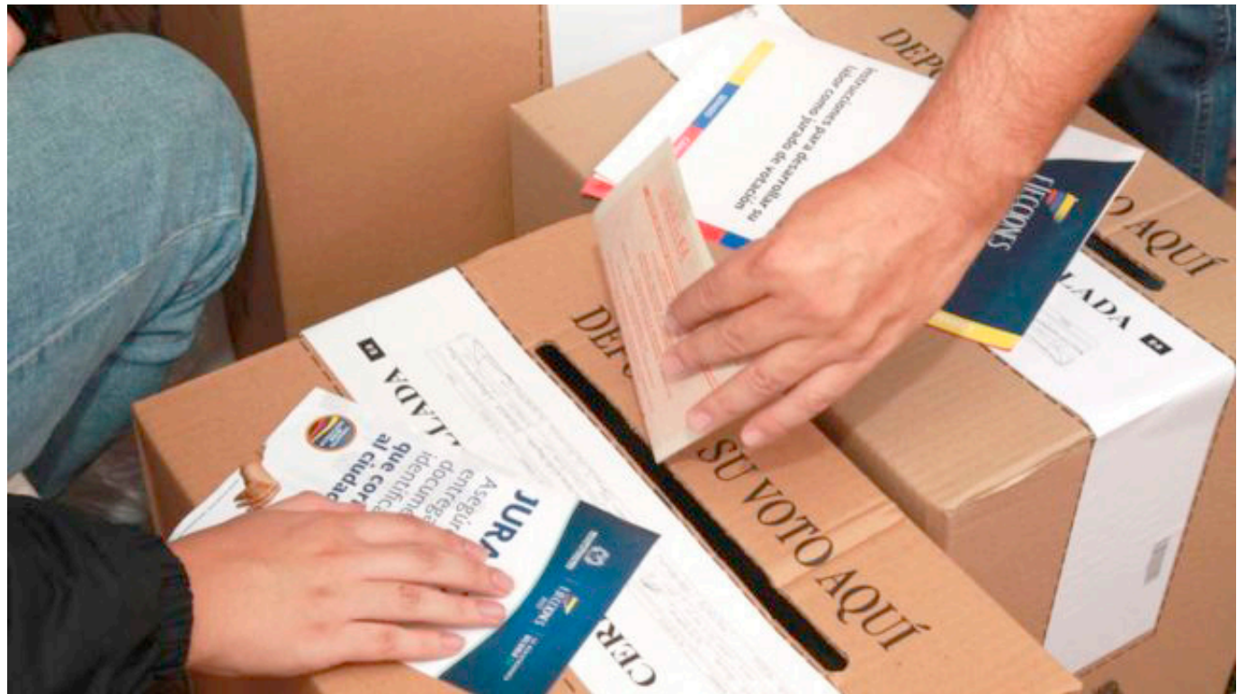
Se busca que con la modificación del Código Electoral, los ciudadanos podrán ejercer su voto desde las 8:00 a.m hasta las 5:00 p.m.

Uno de los cambios más destacados es la ampliación de la jornada electoral. A partir de ahora, los ciudadanos podrán ejercer su voto desde las 8:00 a.m hasta las 5:00 p.m.