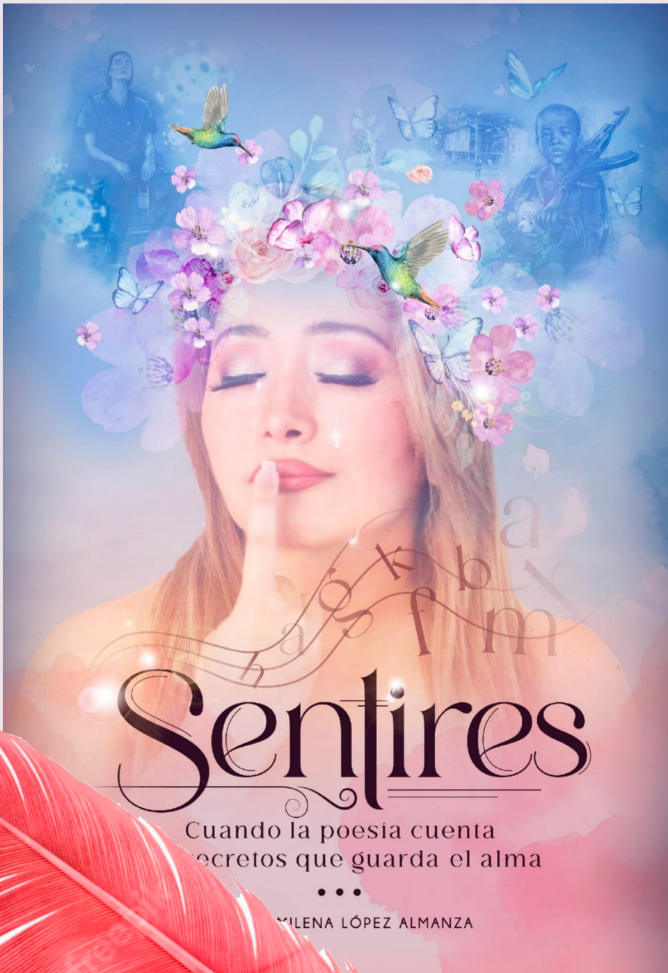
La escritora presentará su libro 'Sentires', donde recopila una serie de poemas.