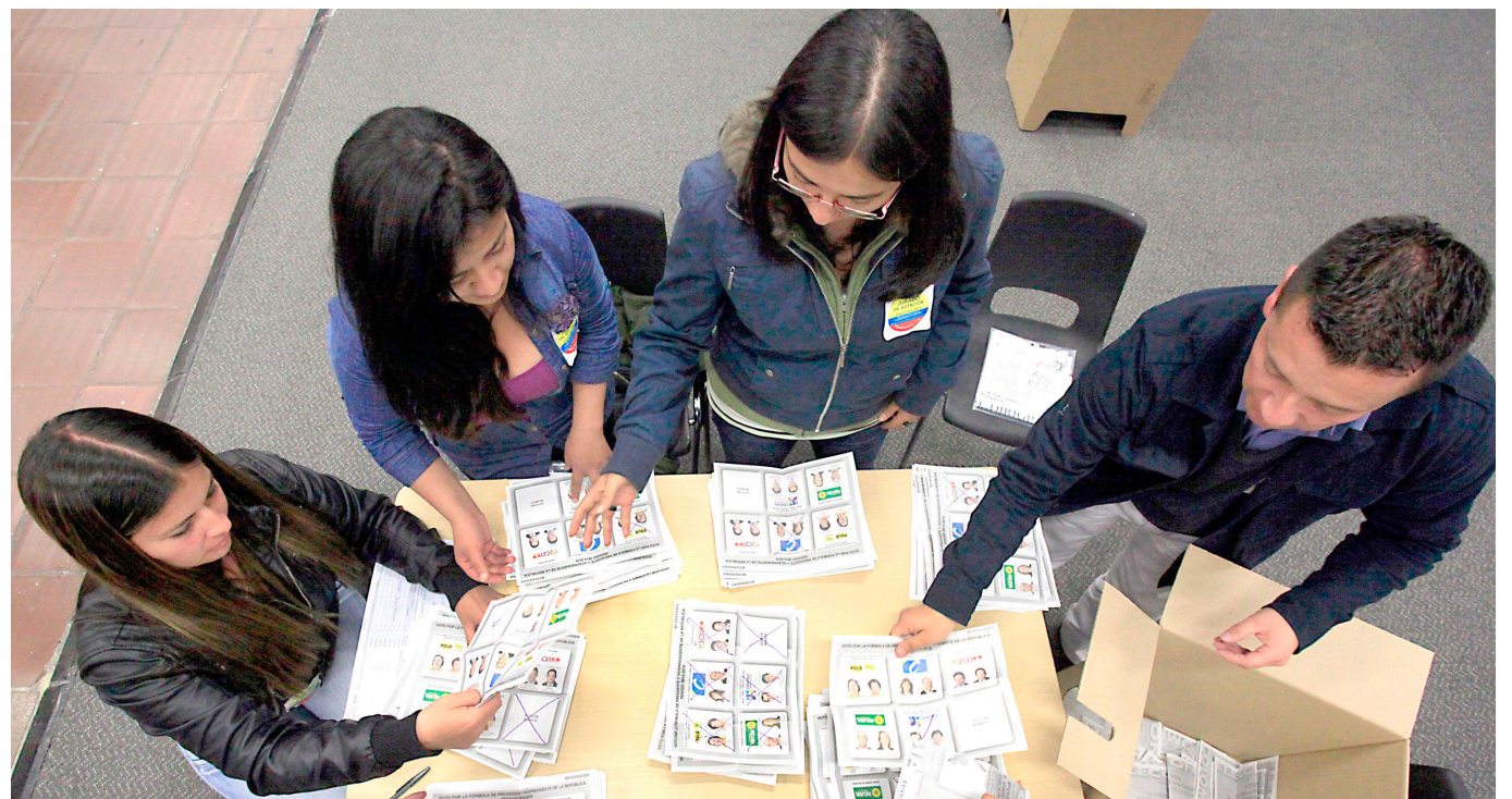
Estos procesos aplicarán para las personas que no asistieron como jurados de votación en las elecciones de 2018, 2017 y 2016.

Y son elegidos mediante un sorteo donde se encuentran los ciudadanos postulados por empresas públicas, privadas, centros educativos, y partidos y