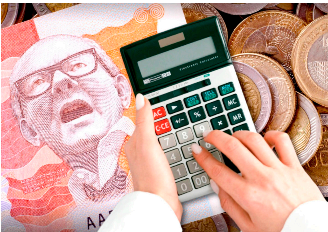
Según la Delegación hay aproximadamente 1.640 procesos de cobros coactivos en el departamento.