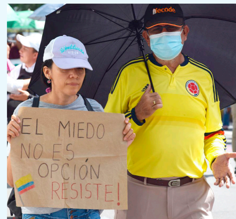
Con carteles y arengas la ciudadanía apoyó a Gustavo Petro.

■ Con una masiva participación se cumplió en Neiva la marcha que respalda las reformas planteadas por el Presidente Gustavo Petro. En el Diario del Huila les presentamos esta foto reportaje de lo que se vivió en la marcha.