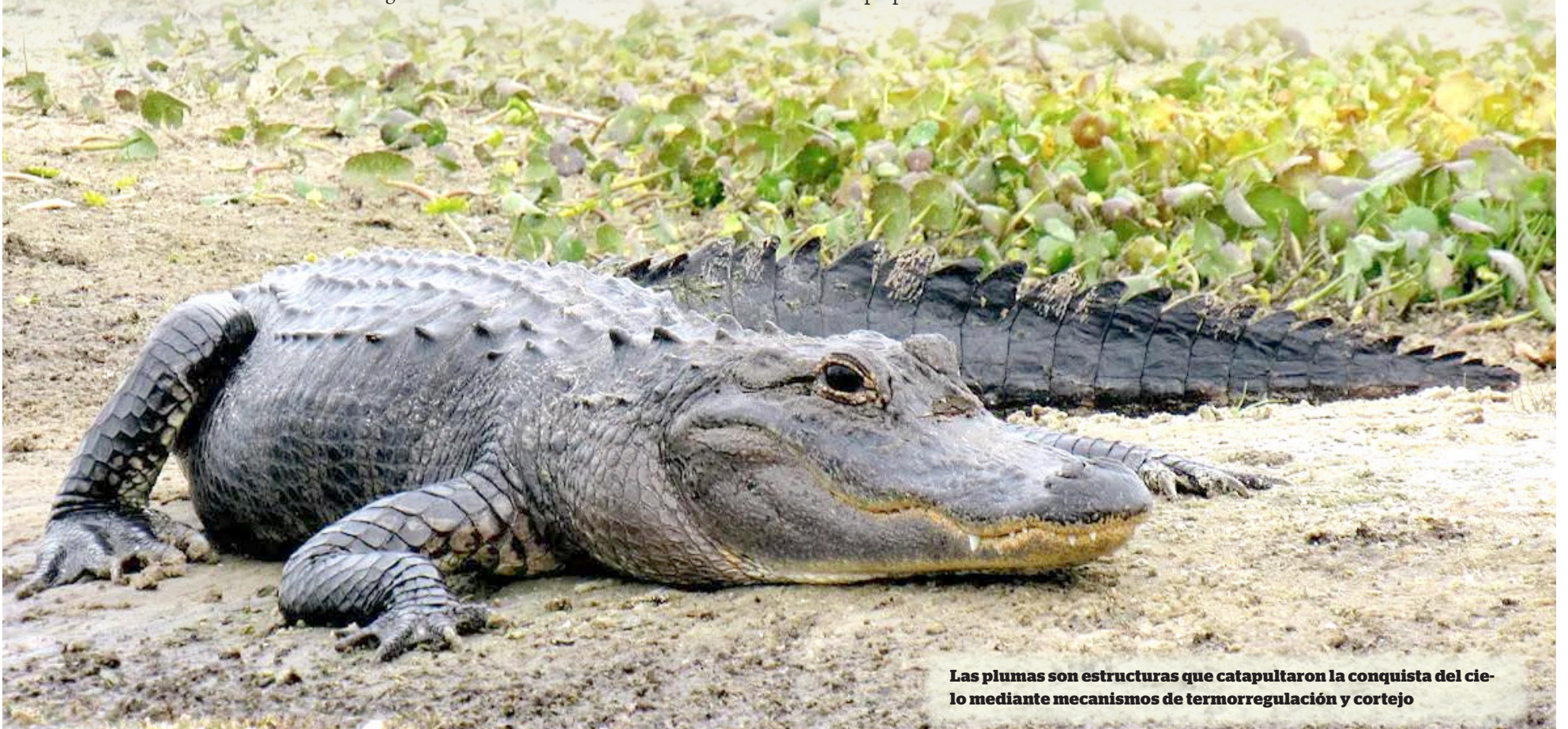
Las plumas son estructuras que catapultaron la conquista del cielo mediante mecanismos de termorregulación y cortejo

Como ves, se trata de un proceso altamente complejo, pues requiere de la sincronización de señales genéticas, momentos concretos del desarrollo embrionario y la presencia de los mecanismos reguladores. Si todo funciona como debe, los caimanes podrían tener plumas, solo que el proceso de formación de estas no se desarrolla así de manera natural.