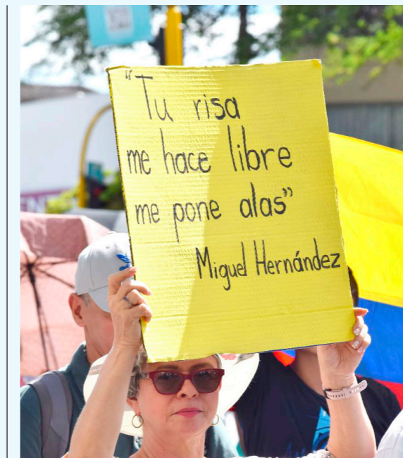
En Neiva, fueron varios los sindicatos y personas que salieron a marchar.

Los neivanos marcharon por las principales vías del país, exigiendo que las reformas continúen sus trámites.