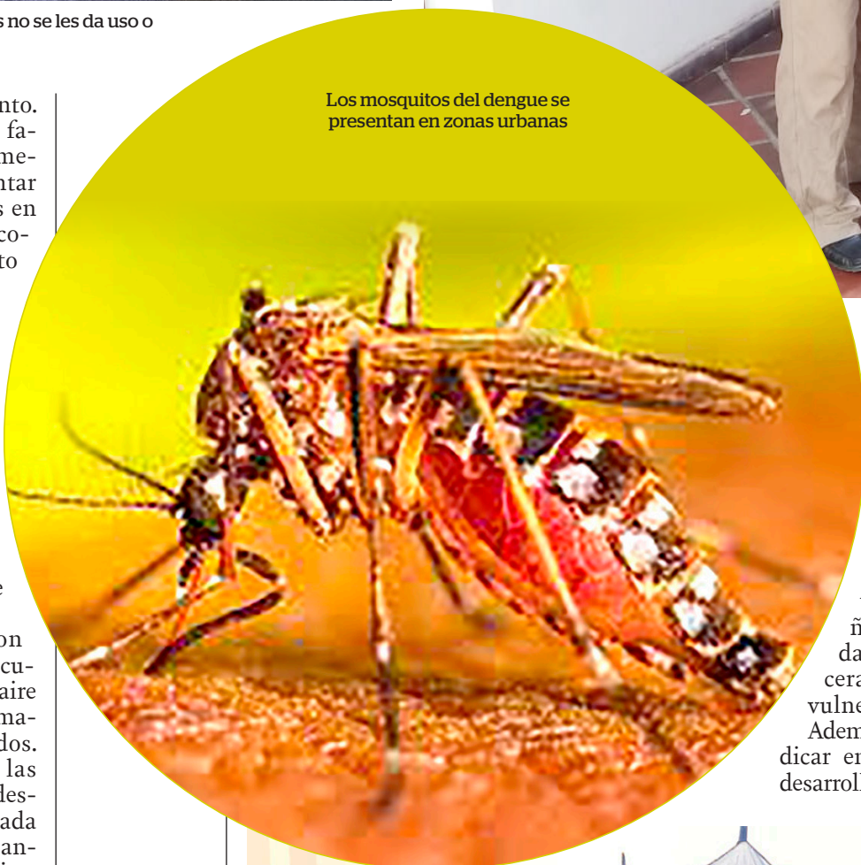
Los mosquitos del dengue se presentan en zonas urbanas

Así entonces es importante unir esfuerzos que permitan colocar freno a esta contingencia de la cual solo es posible emerger mediante la cultura ciudadana y el aporte de cada habitante del departamento es acciones sencillas como revisar las instalaciones de su vivienda y acudir de manera pertinente a los centros de salud. ¡Todos contra el dengue!