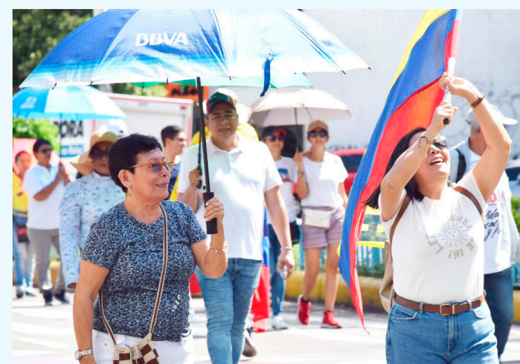
Jóvenes y adultos participaron en esta marcha.