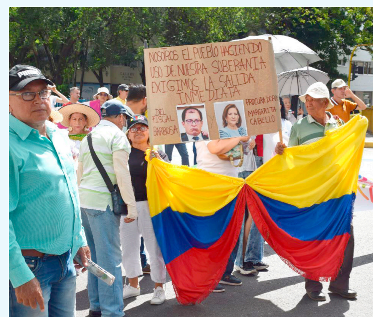
La marcha se realizó en las principales vías de la ciudad.