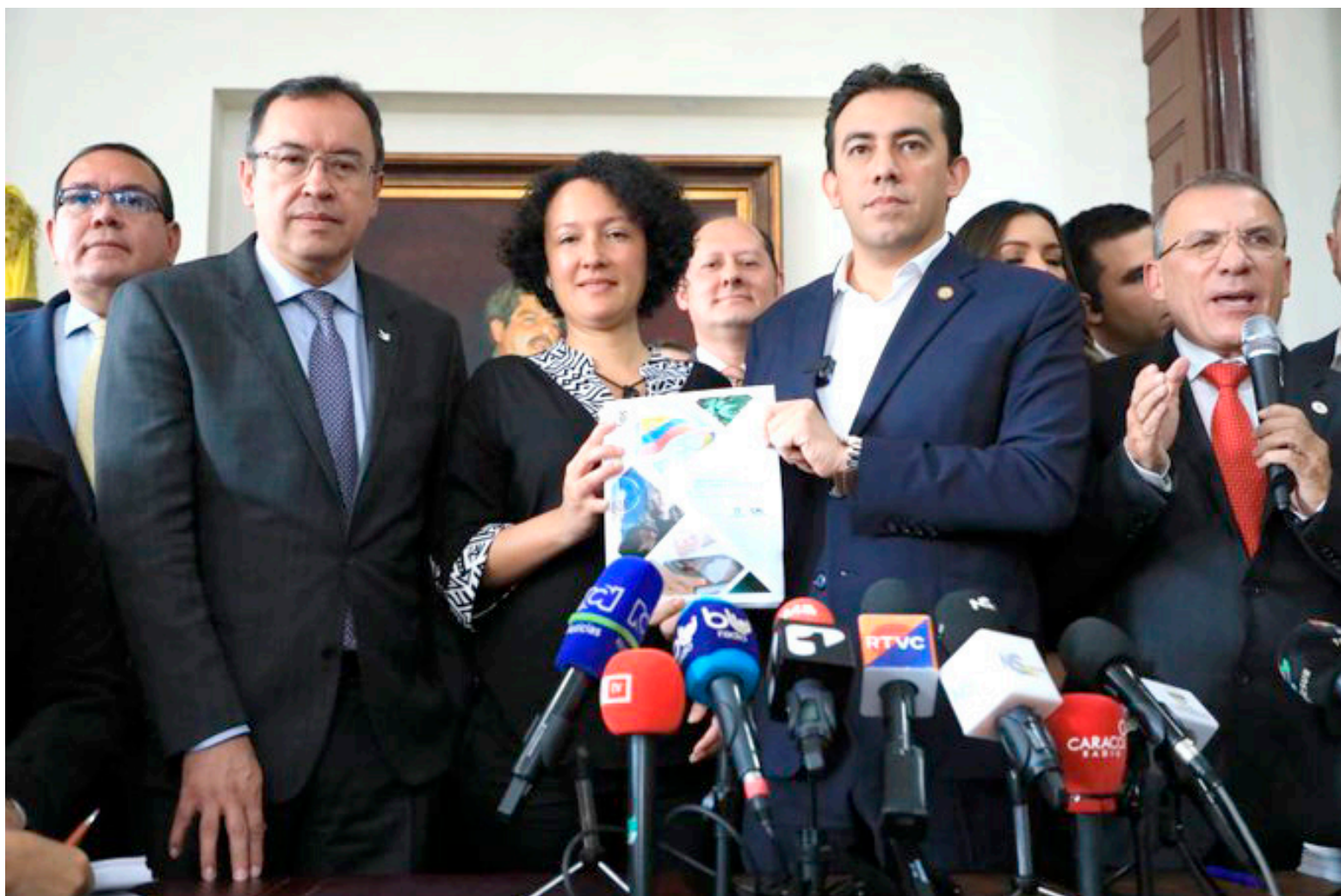
El proyecto de ley estatutaria que reforma el Código Electoral colombiano fue radicado ante el Congreso de la República.

El proceso de aprobación de estos cambios continúa avanzando. Durante los últimos días, la Comisión Primera de la Cámara ha votado a favor del tercer debate del proyecto, el cual ahora pasará a la plenaria para su consideración. Sin embargo, es importante destacar que esta reforma electoral debe ser avalada antes del 20 de junio, dado que se trata de una ley estatutaria.