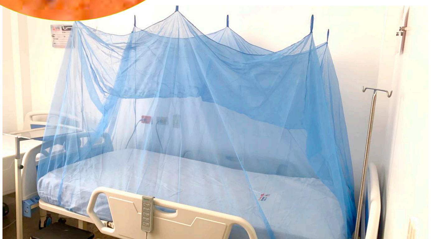
Los toldillos en lugares húmedos son un protector eficiente contra la picadura

El dengue es una enfermedad aguda que puede afectar a personas de cualquier edad, especialmente niños y adultos mayores, causada por un virus transmitido a través de la picadura de mosquitos infectados.