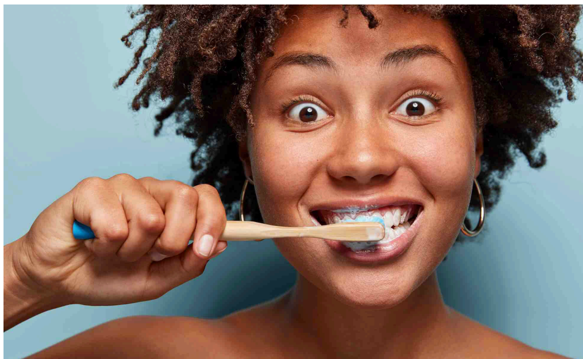
La caries son la enfermedad no transmisible más prevalente en el mundo.

Para la odontopediatra es "fundamental" que los niños se acostumbren a visitar las clínicas desde pequeños. "Es importante cambiar la mentalidad de visitar al dentista solo cuando hay un problema. En el caso de los niños, si ya traen a la clínica dolores, es complicado construir una experiencia positiva".