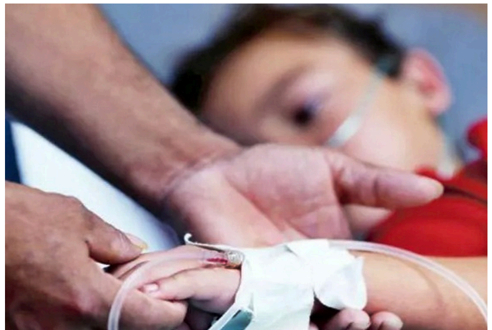
La ocupación de camas de UCI pediátrica en Huila supera el 100%, elevando la alerta roja a niveles críticos en la región.

La Secretaria de Salud Departamental del Huila declaró alerta roja hospitalaria debido al aumento drástico de casos de dengue, lo que ha generado una crisis en la capacidad de respuesta de los hospitales públicos y privados en la región.