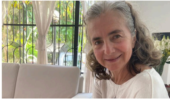
“Quiero ser recordada con una mujer transgresora y revolucionaria”