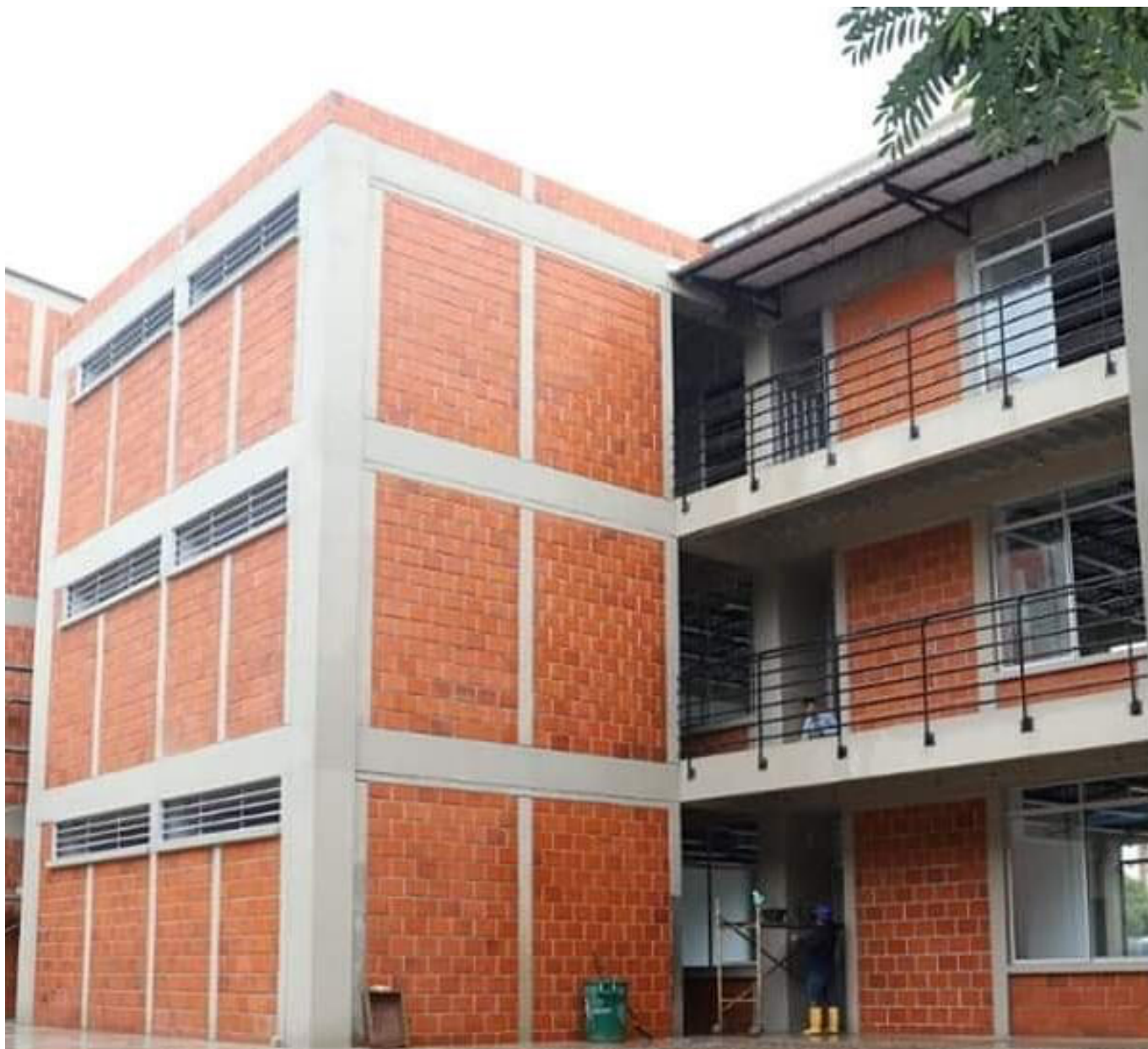
Los alumnos, esperan la entrega de las aulas educativas.

Otro de los temas que tiene la obra del Colegio Cacique Pigoanza, donde se invirtieron $10 mil millones, es que el contrato no contemplaría el enclavamiento del perímetro, por ende la actual administración, deberá gestionar los recursos económicos, para culminar la misma y evitar que se convierta en un 'elefante blanco'.