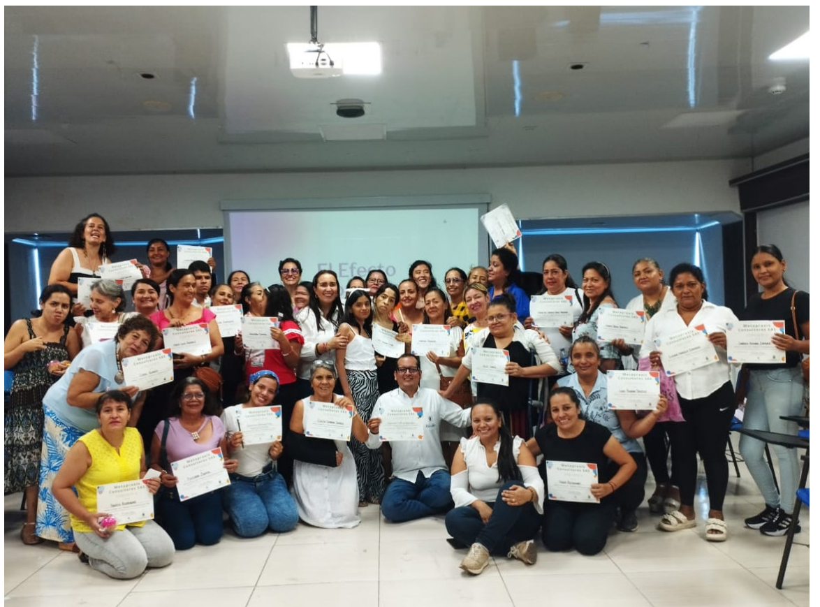
La secretaria de Desarrollo Social e Inclusión, realizó el primer foro dirigido a mujeres con discapacidad y sus cuidadoras, actividad que se enmarca en la programación conmemorativa del mes de mujer.