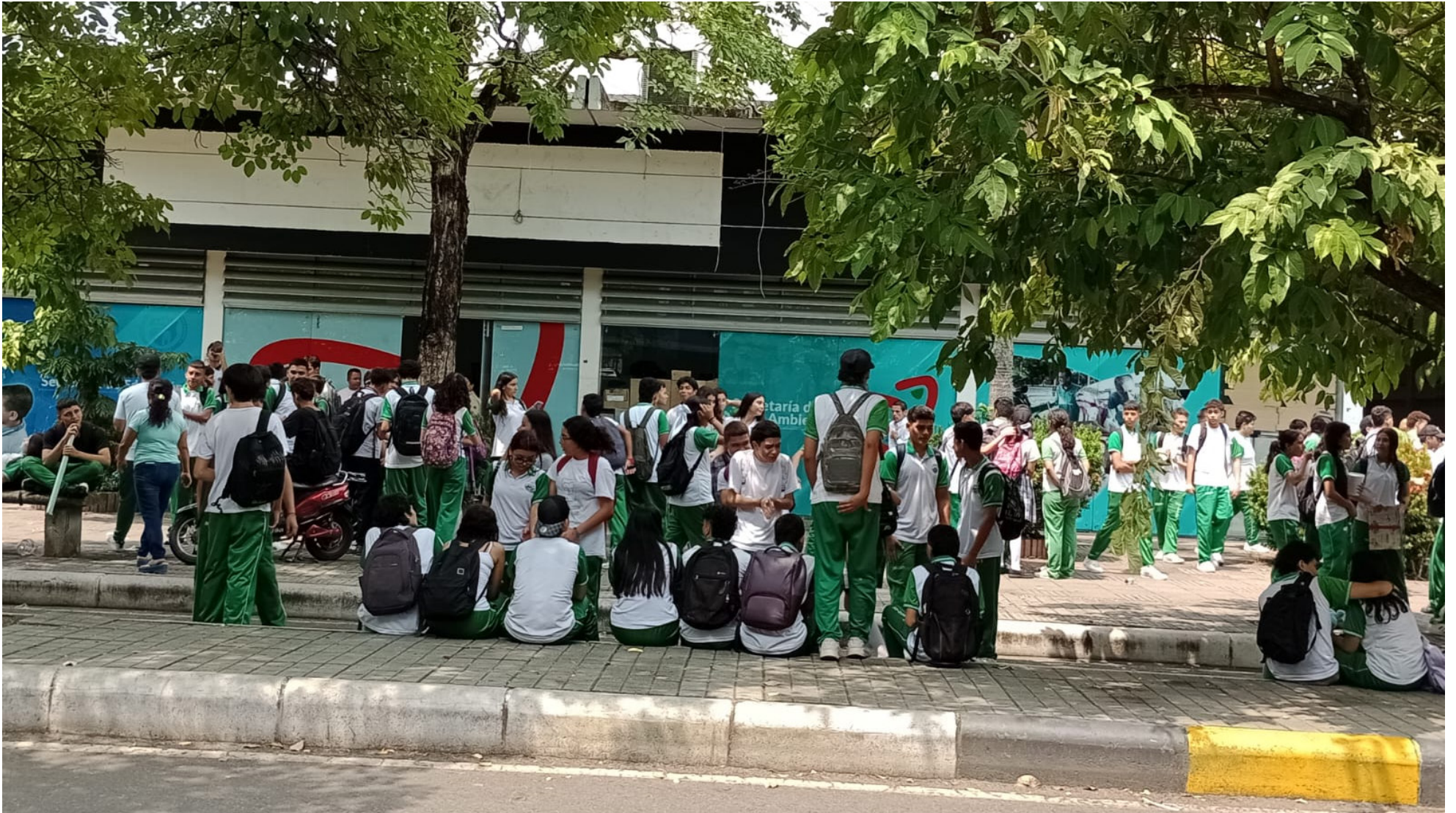
Los estudiantes protestaron de manera pacífica.