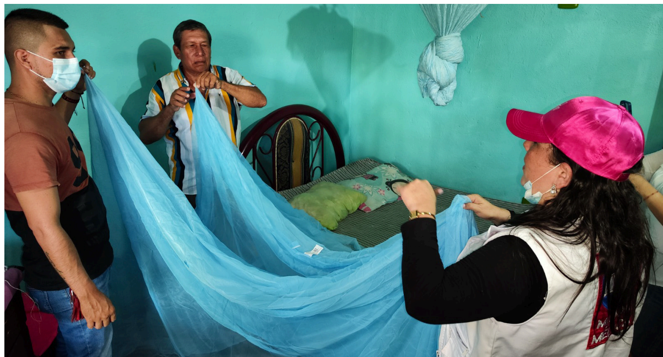
La Administración Municipal de Neiva insta a la población a evitar la automedicación y acudir a centros asistenciales en caso de síntomas persistentes de dengue, siguiendo el plan de contingencia implementado.

planes de contingencia de las direcciones locales de salud y las Secretarías de Salud municipales. El Centro Regulator de Urgencias y Emergencias y Desastres (CRUE Huila) supervisará la oferta y disponibilidad de camas UCI en las instituciones públicas y privadas, buscando mantener la organización y optimización de la red hospitalaria durante la alerta roja. Desde la Secretaría de Salud, se coordinará con los entes territoriales municipales y la red de prestadores de servicios para implementar estrategias efectivas de prevención y control del dengue. La población también se insta a tomar medidas preventivas, como la eliminación de criaderos de mosquitos y la protección personal contra picaduras. En este escenario de crisis de salud pública, las autoridades hacen un llamado a la comunidad a colaborar en la implementación de medidas pre-