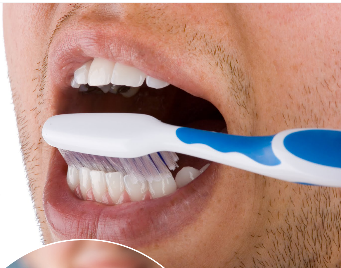
Mantener una sonrisa saludable comienza con el cepillo de dientes.