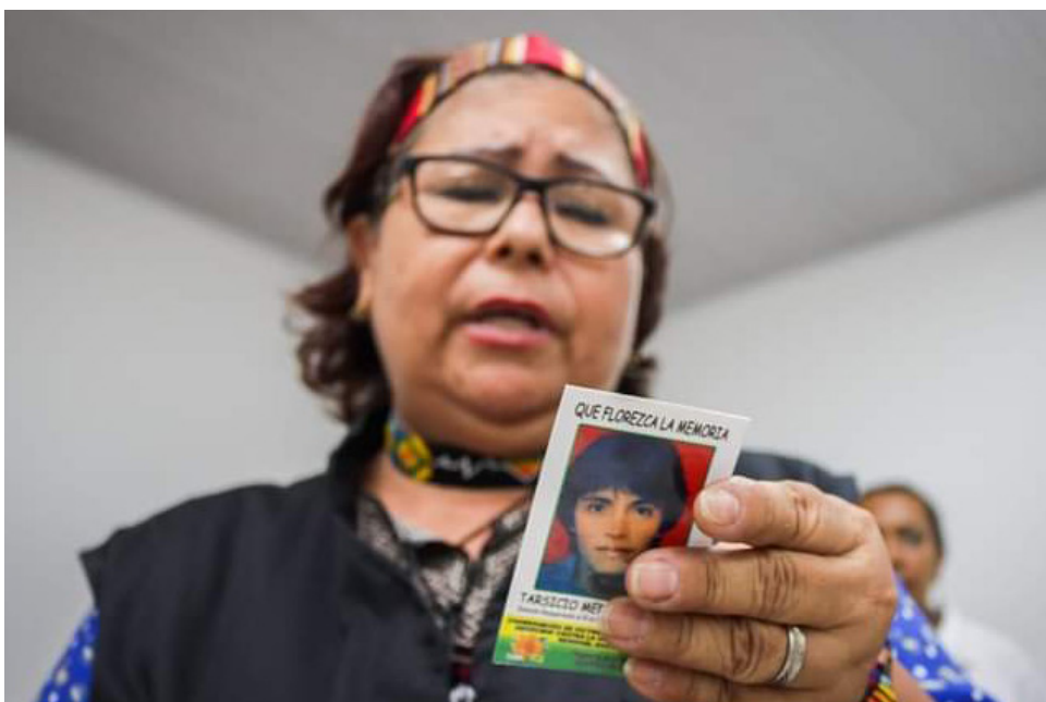
Trabajan con los familiares de desaparecidos.

Desde el momento, no volvieron a tener en el Hospital Universitario Hernando Moncaleano, a una persona en esas circunstancias. "Para mí ha sido un aporte importante, al mejor vivir de una sociedad y apostarle que camine hacia la paz, respeto y a terminar la guerra que ha sido tan dura", finalizó la líder.