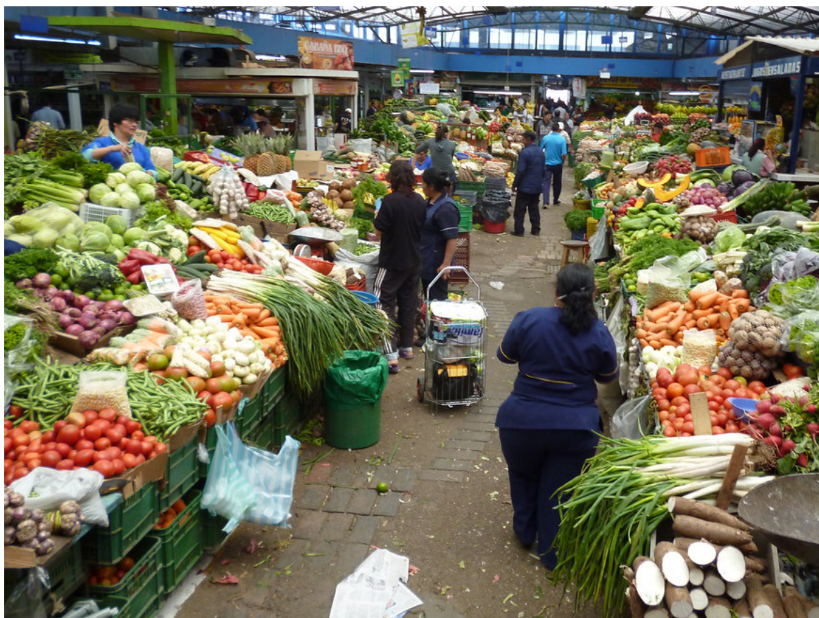
La inflación de febrero en Colombia se ubicó en 1,09%, según el Dane.

De igual forma, las ciudades con menor índice inflacionario fueron Neiva (0,73%), Cartagena (0,68%), Valledupar (0,63%) y Montería (0,63%).