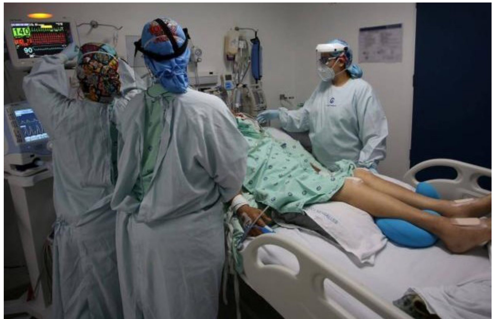
Autoridades sanitarias del Huila declaran alerta roja en la red hospitalaria debido al aumento de casos de dengue.