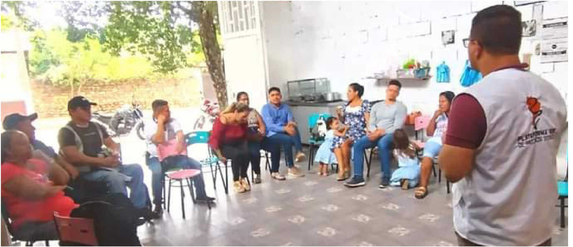
Talleres y trabajo comunitario en defensa de los Derechos Humanos.