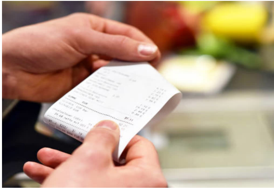
Imagen de referencia. Ictex abre convocatoria de créditos para estudios de posgrado en Colombia y/o en el exterior.

Le siguen Riohacha (9,41%), Sincelejo (8,99%) y Montería (8,88%). La otra cara de la moneda la registran Neiva (6,73%), Ibagué (6,68%), Popayán (6,34%) y Villavicencio (5,57%).