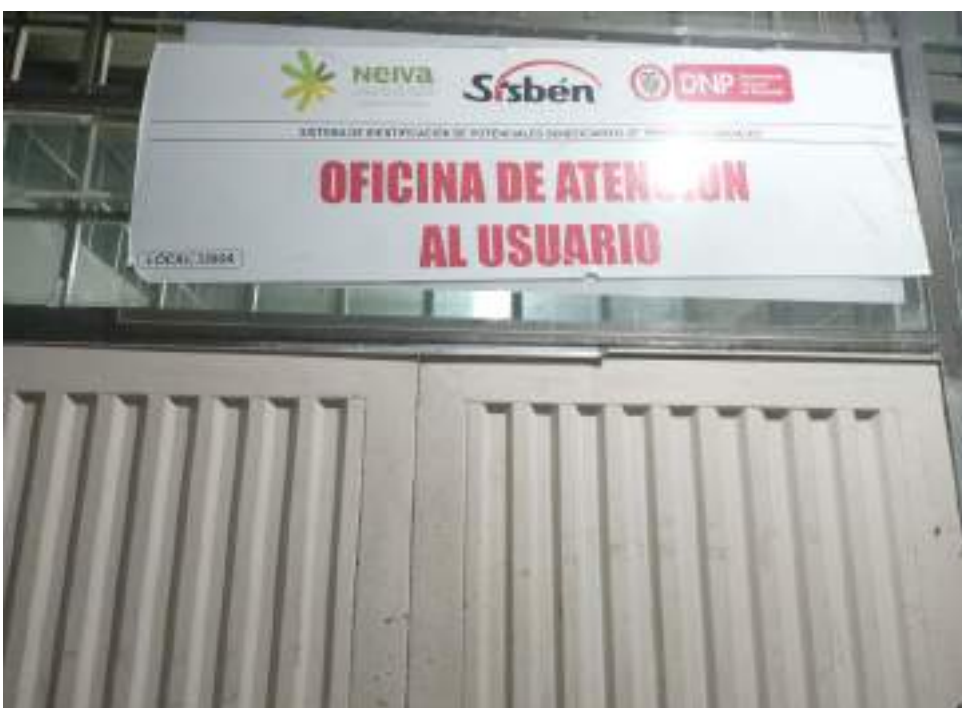
Oficinas del Sisbén en los Comuneros.

Finalmente, dice que, aunque el decreto 616 estableció un plazo de dos meses para adelantar la nueva encuesta del Sisbén IV, esto básicamente por el tema de pandemia, muchos se quedaron sin trabajo y en ese caso los entes territoriales los vincularon al régimen subsidiado sin encuesta, pero los alertaron sobre la necesidad de adelantar el trámite, realmente si no acceden a la nueva metodología, se quedarán por fuera el año entrante.