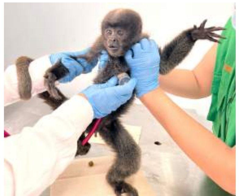
En lo corrido de este año un total de 12 ejemplares de primates han sido rescatados en el Huila.

Aunque cuentan con una gran destreza para desplazarse y escapar de las amenazas, las consecuencias son muy altas cuando no lo logran, pues las pérdidas de especímenes tardan bastante en recuperarse de-