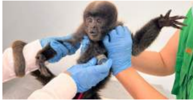
Alerta por tráfico de primates en el Huila