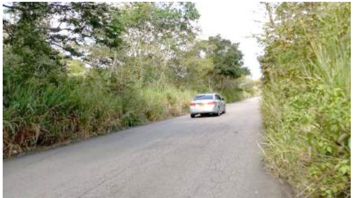
Dos vías terciarias del departamento del Huila serán rehabilitadas.

La obra tendrá una inversión de más de $2.000 millones y un plazo de ejecución de 5 meses a partir de la firma del acta de inicio.