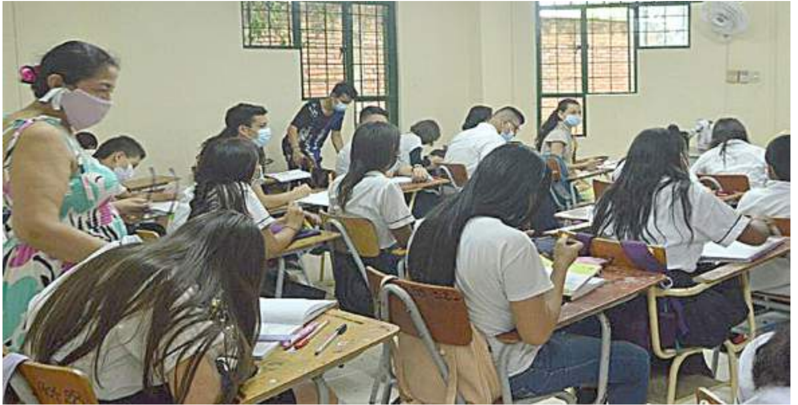
El año pasado la deserción escolar aumentó 43% anual, esta ausencia de estudiantes se debe, principalmente, a los costos de matrículas.

■ La deserción escolar es una problemática nacional que se presenta desde hace varios años. Aunque todavía no se han entregado datos exactos de deserción escolar territorial, lo cierto es que, en un informe preliminar entregado por el Ministerio de Educación se estableció para el Huila un promedio de 4,24%.