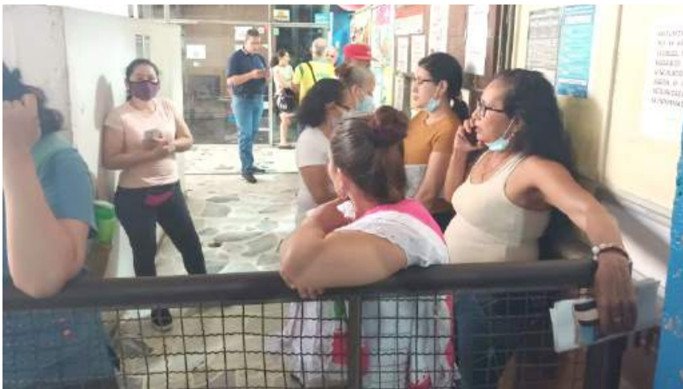
En la zona externa se espera con paciencia.

Muchos se demoraron o simplemente no se han acercado porque en el nuevo esquema, “a quienes no estén en la pobreza extrema, los van a poner a pagar”, dicen.