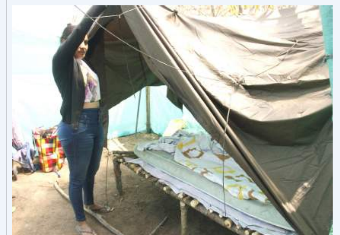
Algunos habitantes hacen actos de posesión.

se encontraba cumpliendo una agenda en la ciudad de Bogotá. Finalmente, se espera que tanto las autoridades como la comunidad lleguen a un acuerdo que beneficie a todos de manera equitativa y justa para que cese el conflicto en la zona.