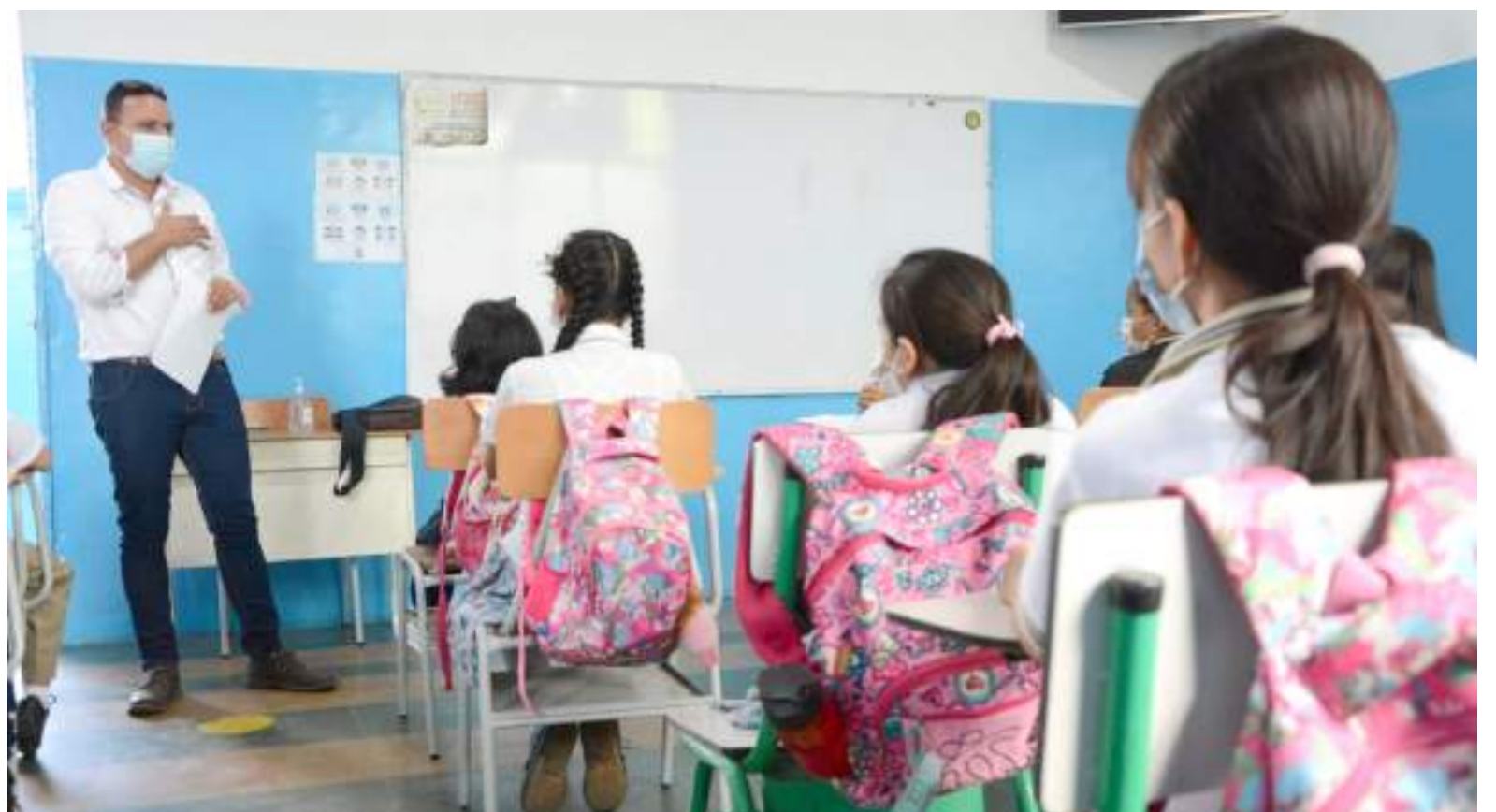
En la capital opita el panorama de deserción escolar actúa con normalidad y hasta la fecha no existe alerta roja de un potencial retiro del estudiantado.

Finalmente, por esa misma línea se trabaja desde la dependencia departamental y ahora lo único que esperan es conocer las cifras oficiales que el Ministerio de Educación enviará en los próximos días, precisamente, para a partir de ello enfocar sus estrategias.