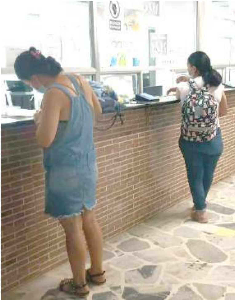
La atención la hacen los funcionarios por orden de turno.

men subsidiado y no sabemos para qué EPS nos van a trasladar”, comenta.