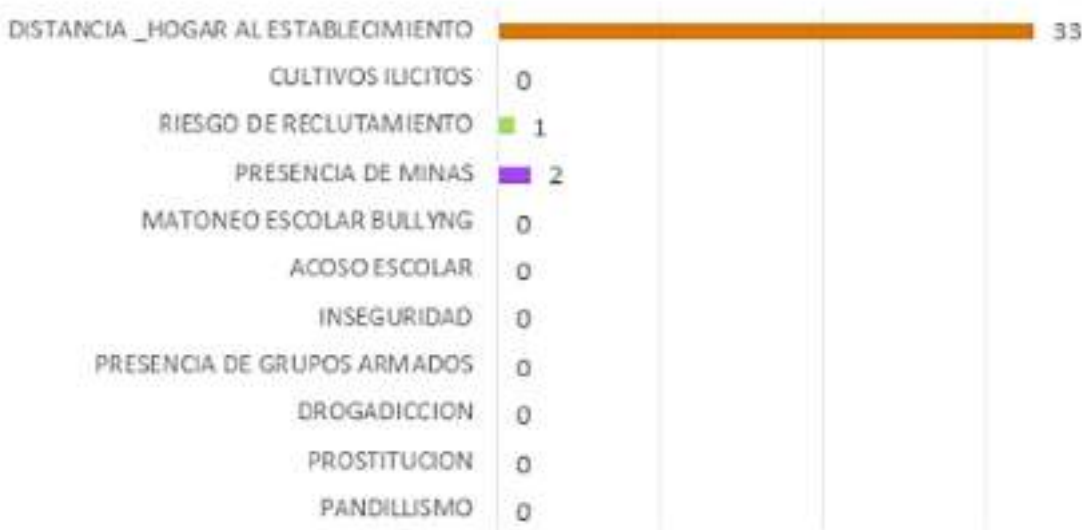
Causas que general Deserción, cifras que se desprenden del informe del MinEducaación.