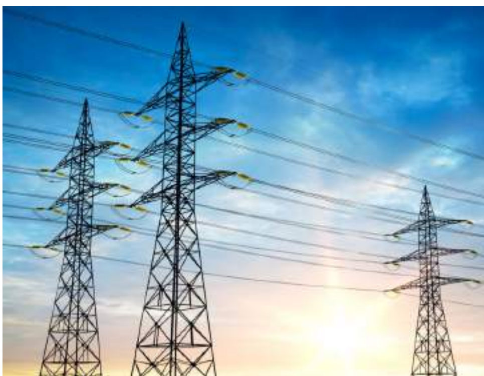
Las tarifas de energía se han convertido en el peor dolor de cabeza de territorios como la Costa, que aseguran estar golpeados por el aumento cada vez más excesivo del servicio y la calidad del mismo.

El jefe de Estado, afirmó que el incremento en electricidad se dan fundamentalmente en la costa Atlántica, por ello ordenó también que el Ministerio de Minas y Energía explicara públicamente a la región Caribe por qué razón crecen tan sustancialmente las tarifas.