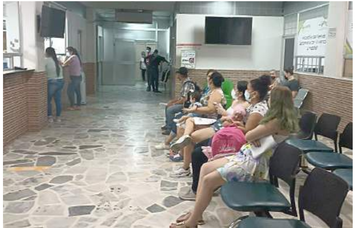
Sala de espera en la parte interna de la dependencia.

“Aquí en la oficina estamos atendiendo de lunes a viernes de 7:30 de la mañana hasta medio