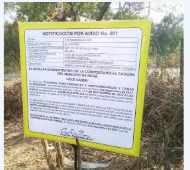
La audiencia se llevará a cabo el día de hoy en horas de la mañana.