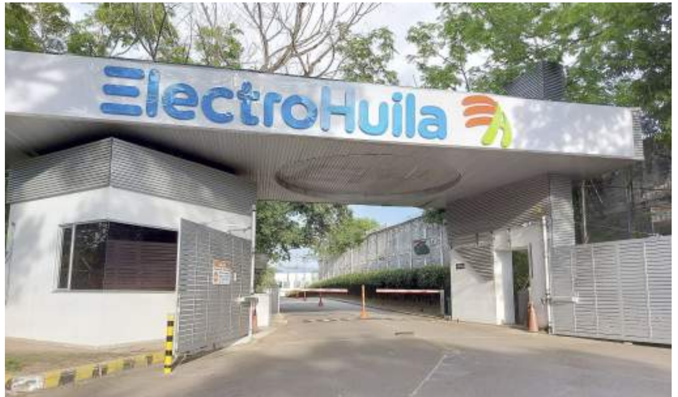
Electrificadora del Huila ocupa el puesto 12 entre las 21 empresas que prestan el servicio, por debajo de la media nacional.

La funcionaria explicó que actualmente la capital huilense se encuentra por debajo de la media nacional con un incremento del 14,57 por ciento, lo cual obedece a diferentes factores que ponen a la empresa entre las que registran un incremento menor en sus tarifas.