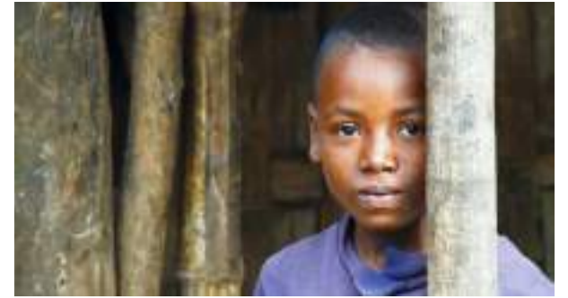
El flagelo de la desnutrición en Colombia