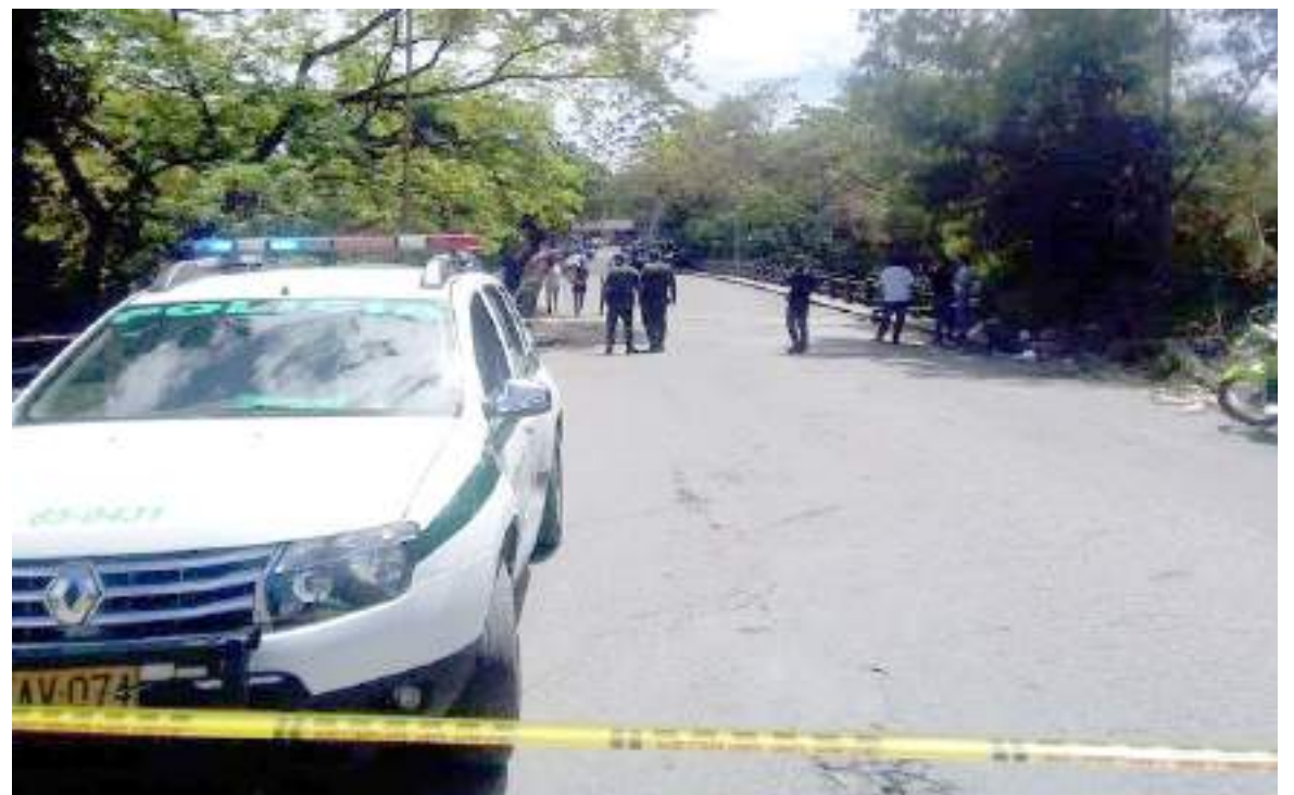
El hecho de violencia se registró en la tarde de ayer.

El presunto implicado, habría sido detenido por las autoridades y deberá responder por el delito de homicidio. Autoridades se encontraban adelantando las verificaciones correspondientes con el fin de establecer la identidad de la víctima mortal.