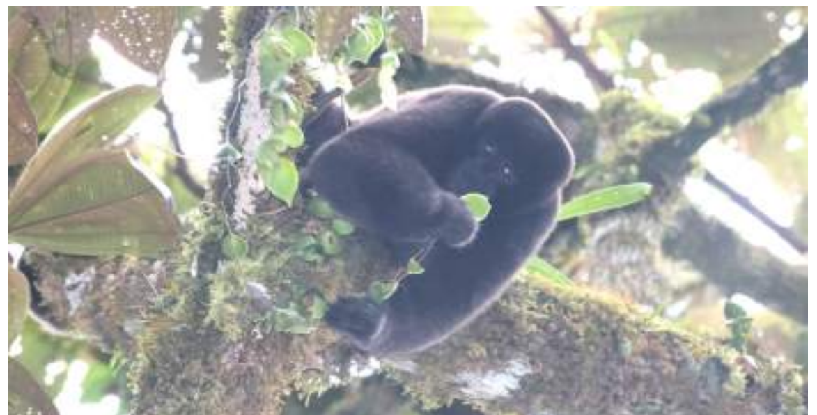
En un recorrido de prevención, vigilancia y control, los integrantes del Grupo de Monitoreo Huellas del Macizo, encuentran a Lagothrix lagotricha; un mono churuco en el municipio de San Agustín. La especie ocupa el segundo lugar en especies de monos más encontrados en estado de cautiverio teniendo en cuenta que se comercializa principalmente como mascota.