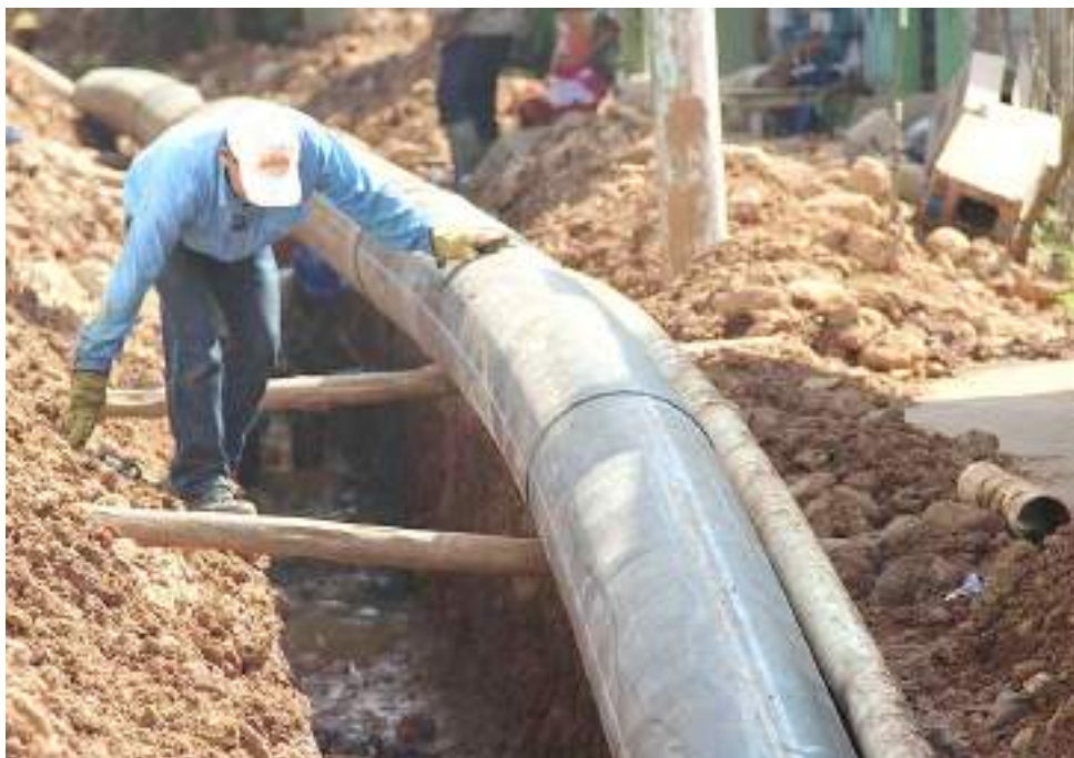
El saneamiento y agua potable también requerían urgencia.

A hoy, de los 91 mil millones de pesos se han ejecutado $78.000.659.481.650. “Es decir, nos queda por contratar $12.340.518.348, de los cuales faltan 6 mil millones de pesos que van para la neonatal del Hospital de Pitalito que es el aporte que va a realizar la Secretaría de Salud Departamental; 1.000 millones de pesos que van destinados para una planta para la Gobernación del Huila; 1.000 millones de pesos para el plan fachada de la Secretaría Departamental de Cultura y 3.840 millones de pesos a cargo de la Secretaría de Vías en Infraestructura”, precisó el Secretario de Hacienda Departamental.