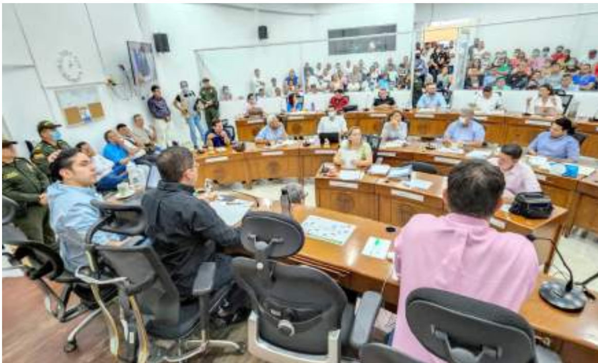
Las 'cartas' ya estarían jugadas, sin embargo, se pueden dar muchas sorpresas.

Finalmente, no estaría muy bien definido cómo serán las finanzas para la deuda que se adquirirá y la que ya se tiene. Además, Vargas concluyó que, “ni siquiera se tomaron la molestia de ajustar los cálculos de intereses correspondientes al nuevo crédito. Eso encarecería mucho más a lo que vamos a pagar el crédito, de verdad no sabemos, en términos reales, en cuanto vamos a pagar el crédito. A grandes rasgos es muy deficiente la presentación de las proyecciones y la manera en que presenta un informe de estos”.