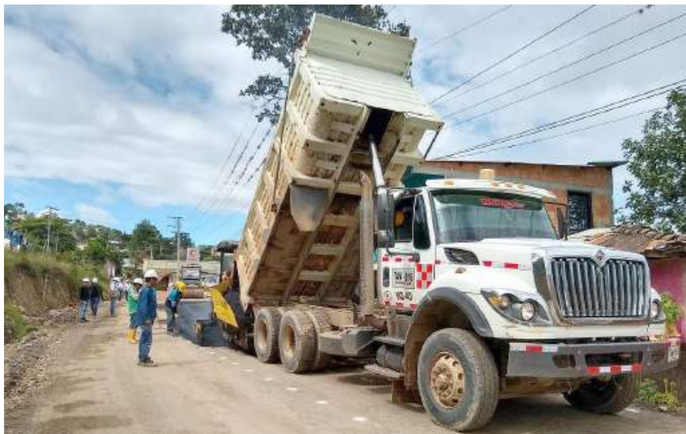
Algunas vías del Huila fueron establecidas como prioridad de inversión.

“En saneamiento iban recursos para los municipio de San Agustín y Suaza; para el Inder Huila iban recursos para la Villa Olímpica de Isnos y de Campoalegre. Iban recursos para la oficina de competitividad que tenían que ver con las tiendas marca Huila que se van a hacer en diferentes escenarios”.