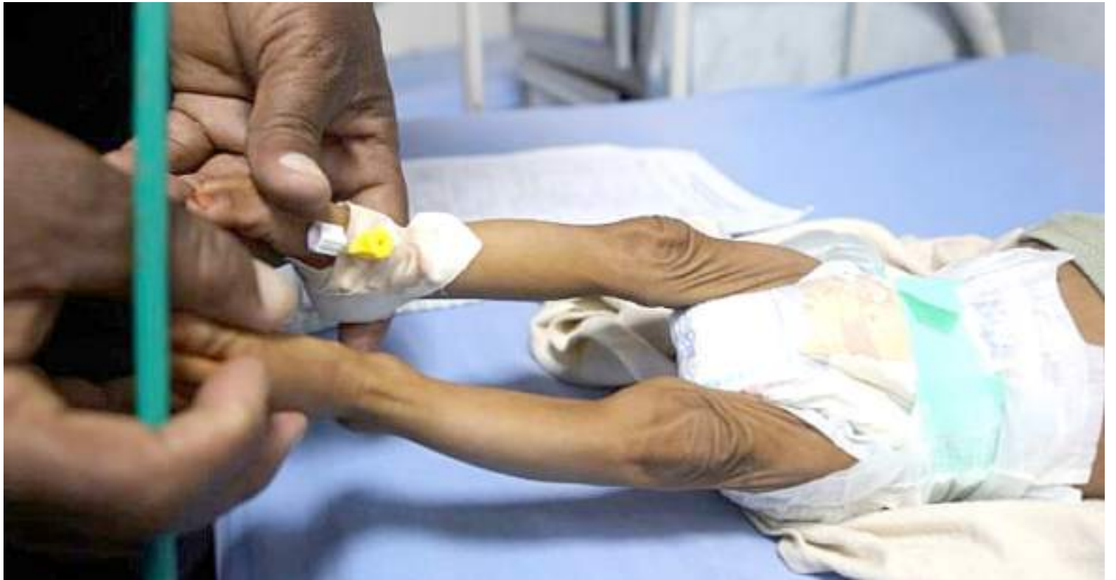
166 menores han muerto por desnutrición en Colombia en lo corrido del año.

La brecha geográfica en el número de muertes por desnutrición es sangrante. El departamento de La Guajira es el más afectado; ahí murieron al menos 49 niños en