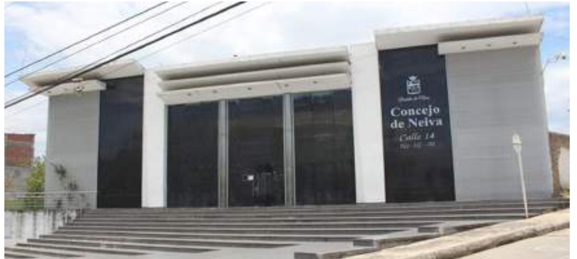
Hoy se llevará a cabo el primer debate del polémico proyecto de endeudamiento por $40 mil millones.

En este caso, si cuatro de siete cabildantes votan positivo el proyecto se aprobaría, pero si la mayoría de votos son negativos, nuevamente se hundiría. Ahora bien, puede pasar que algún concejal no asista y el panorama cambie.