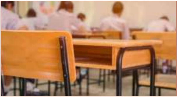
La deserción escolar sigue vigente