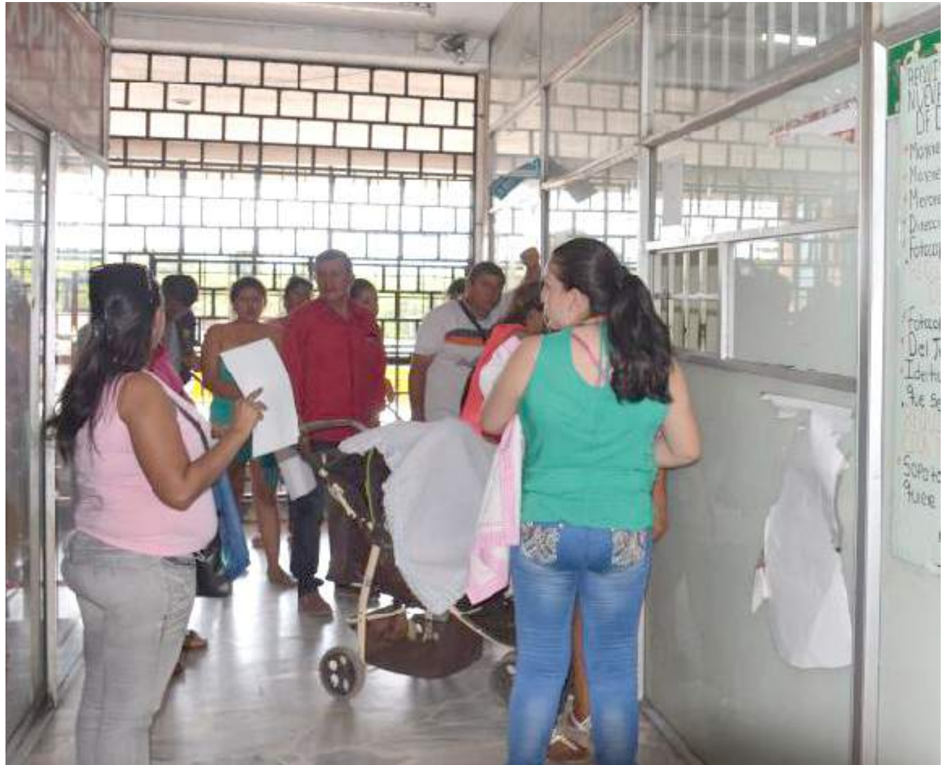
Cientos de personas llegan a diario a las oficinas del Sisbén en Neiva.

Siguen siendo muchos los ciudadanos que llegan todos los días a hacer fila, con el propósito de conocer cuál es su estado frente a la nueva encuesta o simplemente a solicitar que les programen la visita y así cumplir con este requisito que no solo permite acceder al servicio de salud en el régimen subsidiado, sino a todos los programas sociales del Estado. “Muchos se demoraron o simplemente no se han acercado porque en el nuevo esquema, a quienes no