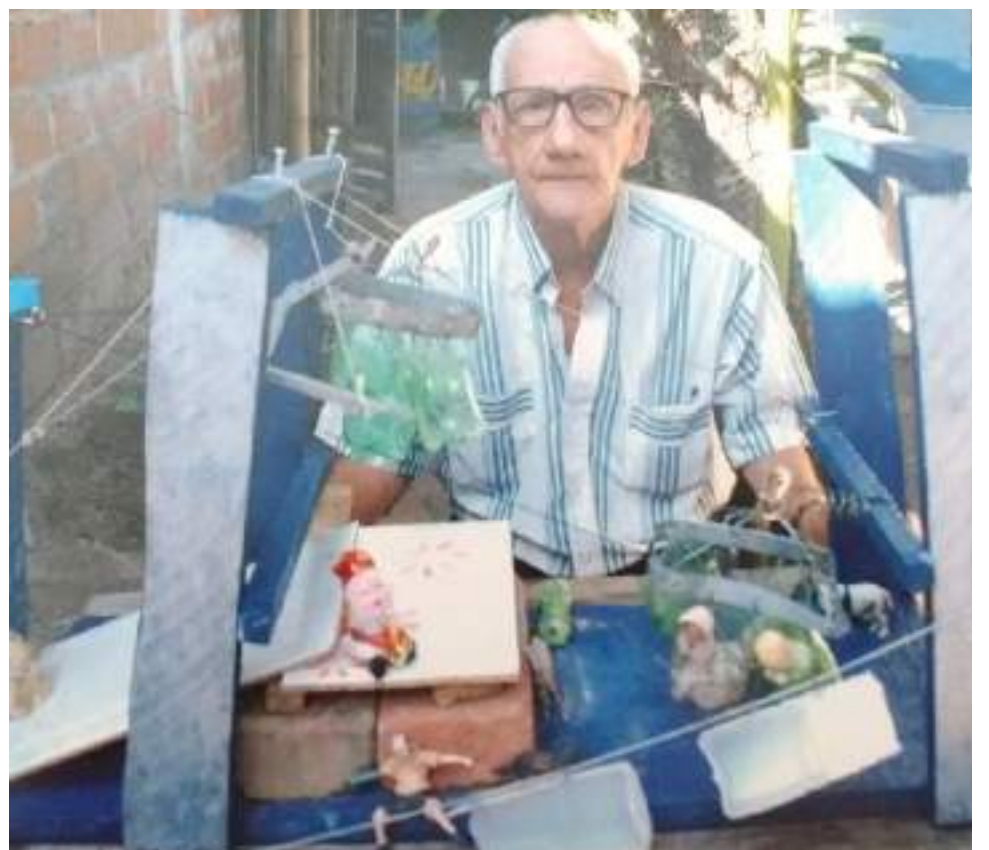
En inventor en su participación en un evento regional.

Con respeto le indagamos si lo han tildado de loco o de iluso, a lo que responde con tranquilidad y sin molestarse para nada, que por el contrario, son muchos los elogios que recibe, “la gente me dice que han visto los videos y que muy bien que siga adelante”. Actualmente vive de los recursos que le entregan sus hijos que lo apoyan.