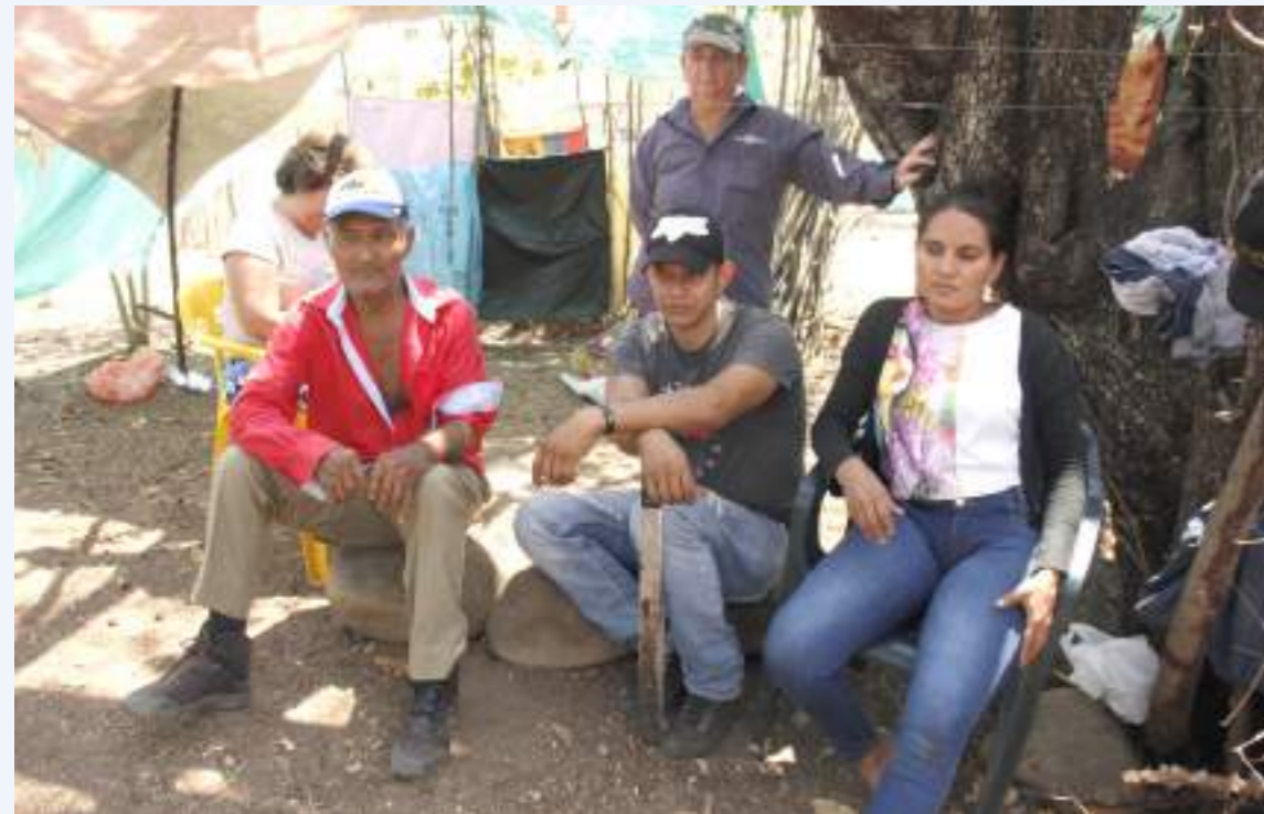
Personas desplazadas y en mal estado de salud hacen parte de la comunidad asentada.