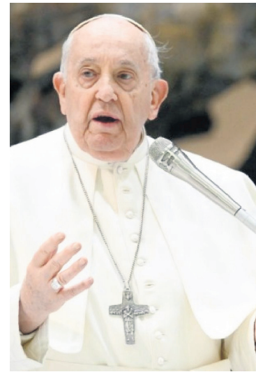
El Papa Francisco.

“Es la vida que nos hace avanzar hacia nuestra identidad más verdadera, la de ser hijos predilectos del Padre, de modo que toda tristeza y obstáculo, todo trabajo y tribulación no puedan prevalecer sobre