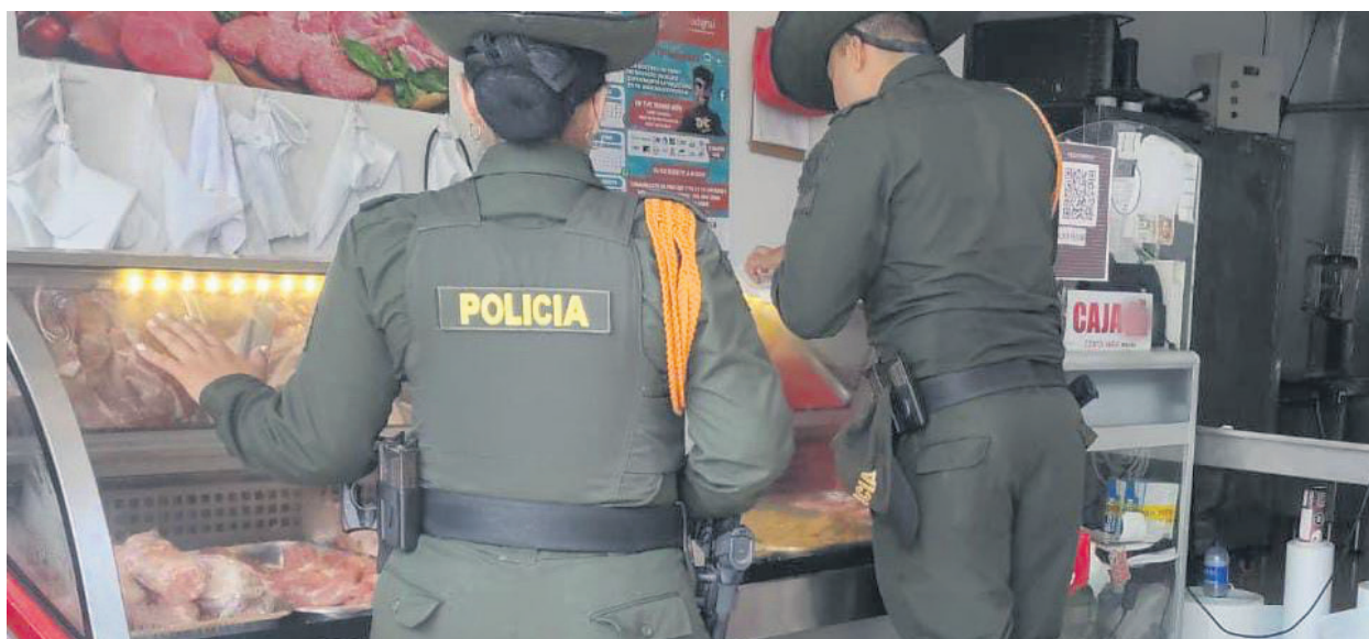
Imagen del día

Hasta el municipio de Rivera, llegaron los uniformados de la Seccional de Carabineros, con el fin de realizar la incautación de aproximadamente 50 kilos de productos cárnicos, los cuales, al verificar la respectiva documentación de procedencia, presentaba inconsistencias.