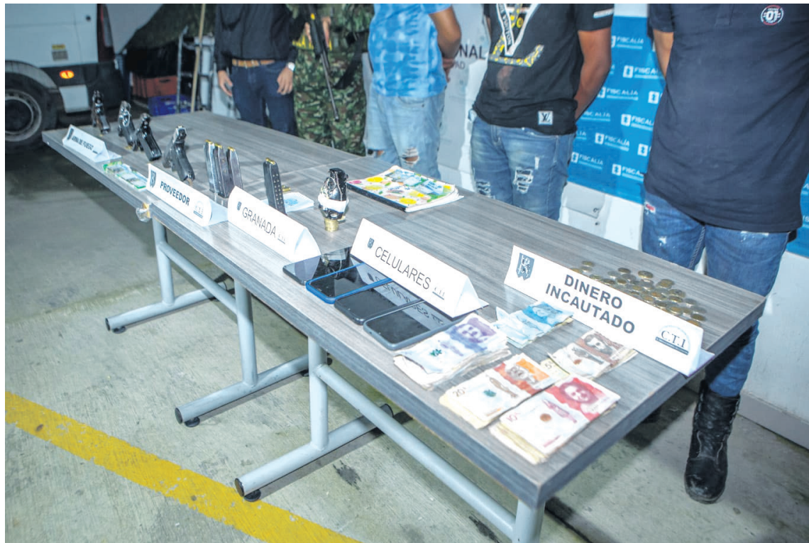
Se incautaron cuatro armas de fuego tipo pistola con sus respectivos proveedores, una granada de mano, cartuchos de diferentes calibres, dinero en efectivo.

Cardozo anunció que en los próximos días se inaugurará una oficina del Gaula Militar en Pitalito, ubicada estratégicamente en la terminal de transporte. El propósito de esta iniciativa es generar confianza en la comunidad, brindando un espacio donde las personas puedan acudir con tranquilidad y seguridad, sin temor a