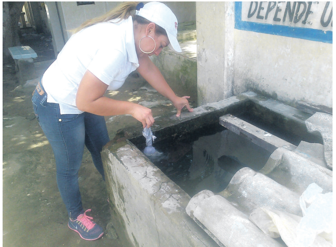
El número de casas visitadas, tienen un 75% de probabilidades de tener criaderos de zancudos.