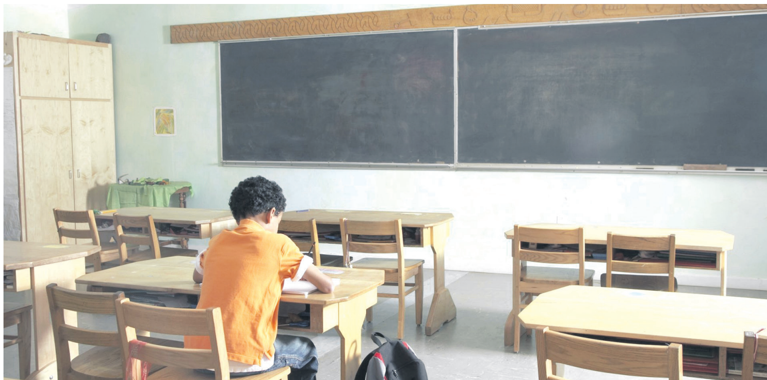
La deserción escolar en las zonas rurales de Neiva es más pronunciada, lo que subraya la necesidad de abordar las diferencias en el acceso a la educación

Según la Secretaria de Educación de Neiva, la carencia de estudiantes matriculados, ya sea debido a traslados, deserción escolar o el cambio a la educación