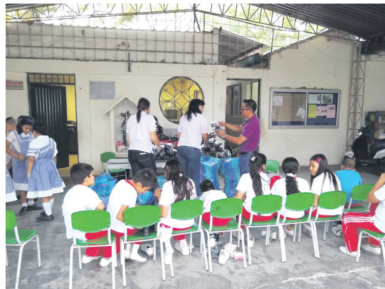
La evaluación cualitativa en 37 instituciones educativas resalta desafíos clave, desde el cambio de domicilio hasta la desmotivación estudiantil, que enfrenta la Secretaría de Educación en Neiva.

En un esfuerzo por revertir la tendencia, la entidad planea realizar una búsqueda activa de niños y jóvenes en las comunas de Neiva. Esto permitirá comprender mejor lo que está sucediendo en las zonas con mayores cupos académicos y tasas más altas de deserción escolar, fomentando la colaboración entre autoridades educativas, familias y la comunidad en general para superar los desafíos actuales y garantizar un futuro educativo sólido para los jóvenes de Neiva.