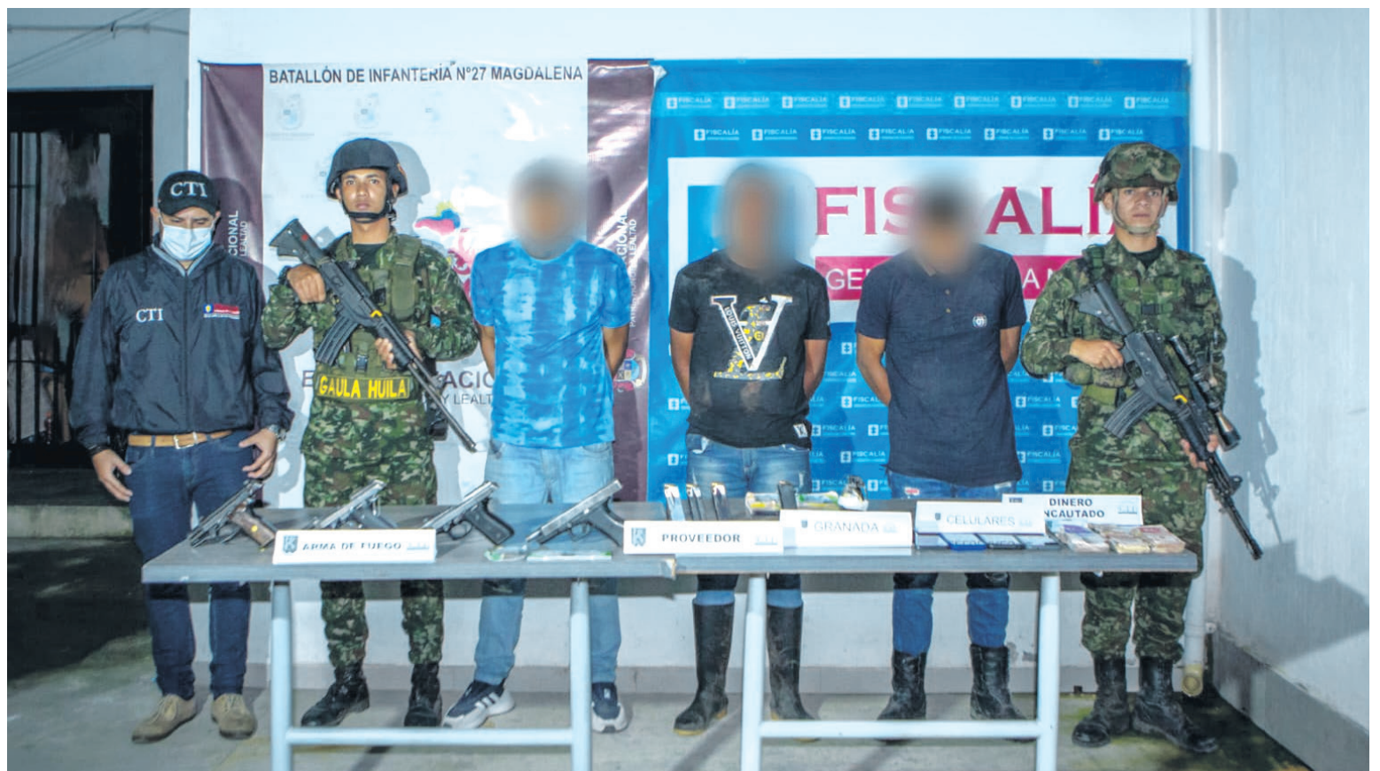
En la imagen, soldados del batallón Magdalena custodian a los individuos capturados durante el operativo militar en una vía rural hacia Pitalito.

Estos individuos tenían la intención de fortalecer sus finanzas a través de la extorsión,