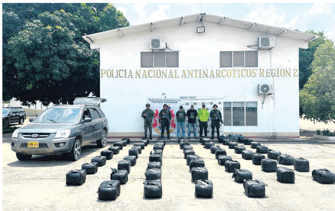
En lo corrido del año, la Novena Brigada, ha logrado incautar hasta la fecha más de una tonelada y media de marihuana, valorada en $2.320.912.500.

Durante el año 2024, la Novena Brigada ha impactado directamente las líneas de financiamiento de las estructuras ilegales, logrando incautar hasta la fecha más de una tonelada y media de marihuana, valorada en $2.320.912.500.