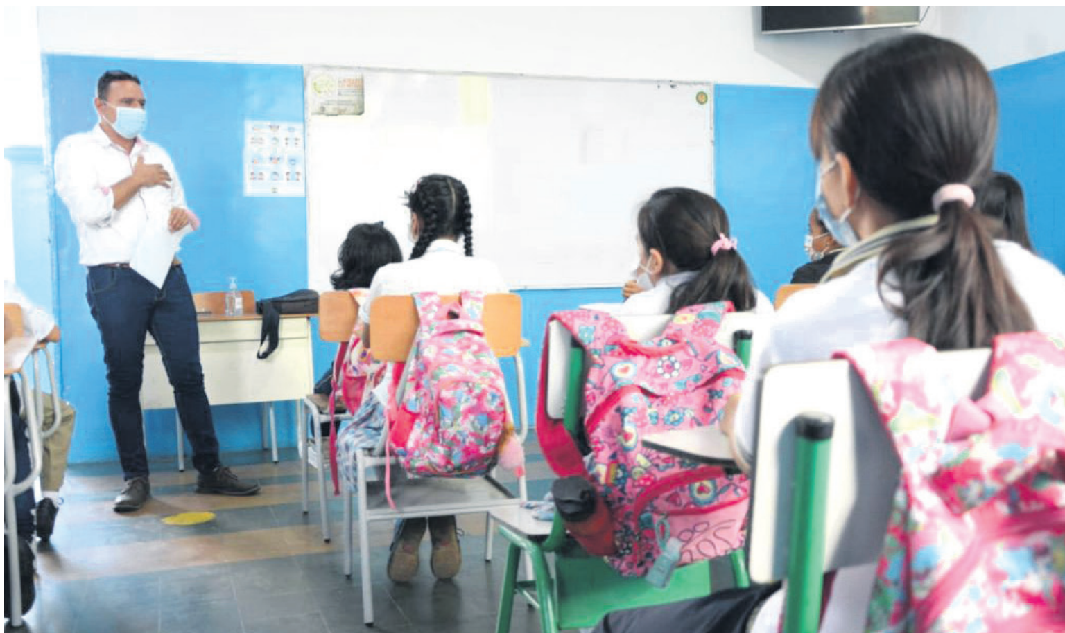
Autoridades educativas de Neiva expresan preocupación por la disminución en las matrículas estudiantiles.

La situación, lejos de ser exclusiva de Neiva, se enmarca en una tendencia nacional que ha llamado la atención del Ministerio de