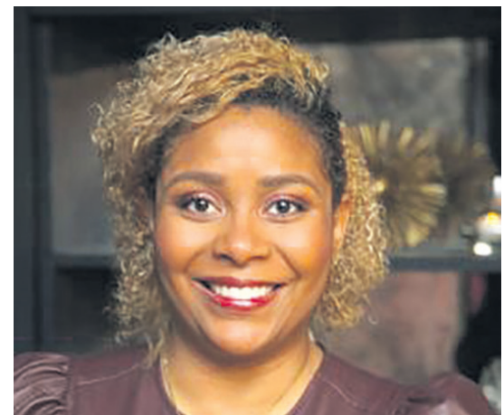
Figura de la semana

Vea columna completa en www.diariodelhuila.com