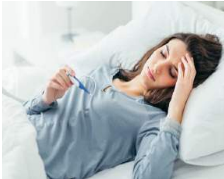
Consumir o utilizar algún producto que no tenga Invima puede generar un deterioro en la salud de quien lo utiliza.

Según la normatividad sanitaria vigente, "El Patrón" correspondería a un producto fraudulento que, al no encontrarse amparado bajo un registro sanitario, no ofrece garantías de calidad, seguridad y eficacia.