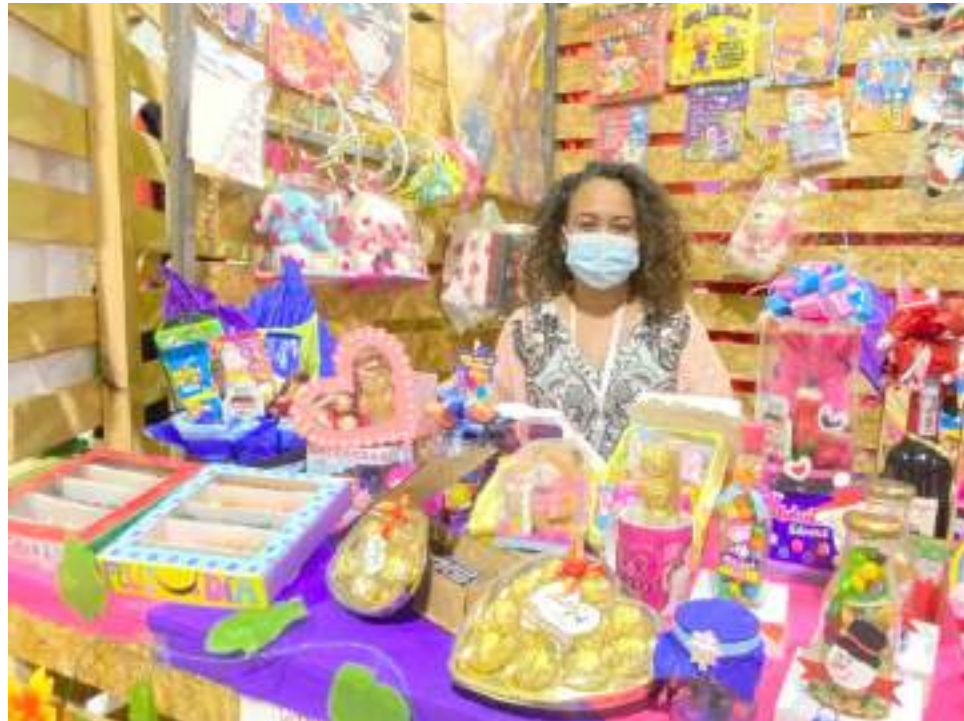
Expo Huila Fest un espacio para los emprendedores del Huila.

Este será el espacio propicio para conocer historias de éxito con conferencistas de talla nacional e internacional, con las mejores charlas de inspiración, conexión y empoderamiento las cuales estarán abiertas para todo el público de manera gratuita.