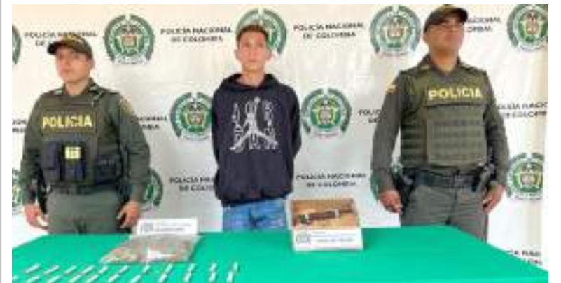
Captura por porte ilegal de armas y tráfico, fabricación o porte de estupefacientes.