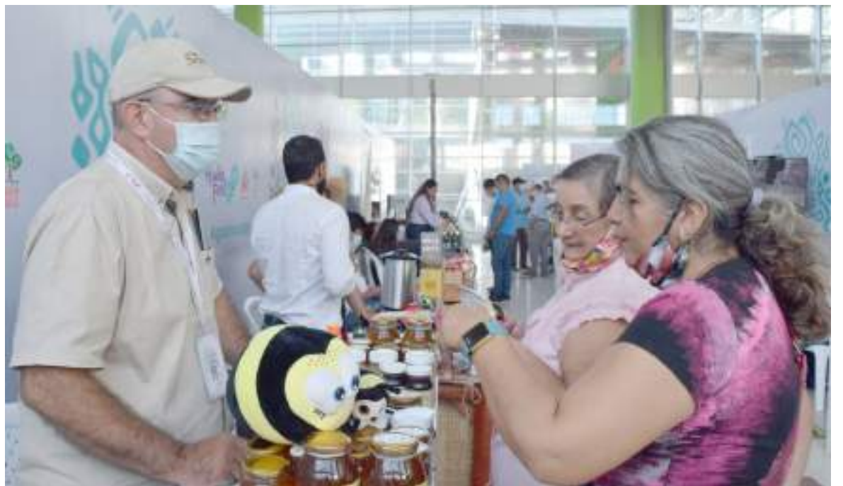
En esta oportunidad Expo Huila Fest, que organiza la gobernación del Huila se fusiona con Expohuila de la Cámara de Comercio.

Expo moda Neiva también estará integrado en el festival Expo Huila Fest con pasarelas, en donde los diseñadores de la región y diseñadores nacionales e internacionales van a poder presentar sus colecciones y así impulsar este sector que vienen creciendo en nuestro departamento.