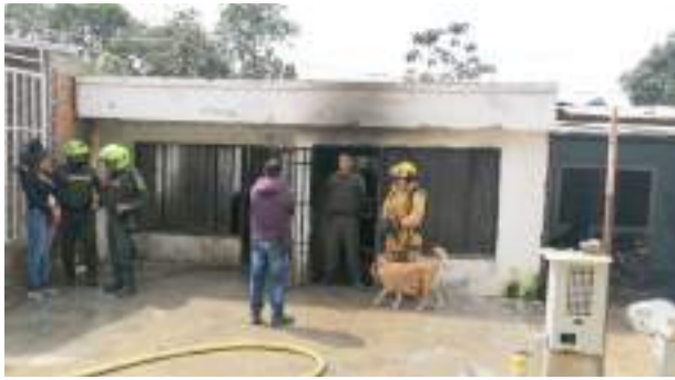
Menor murió calcinada en Pitalito ■ Regional 10-11