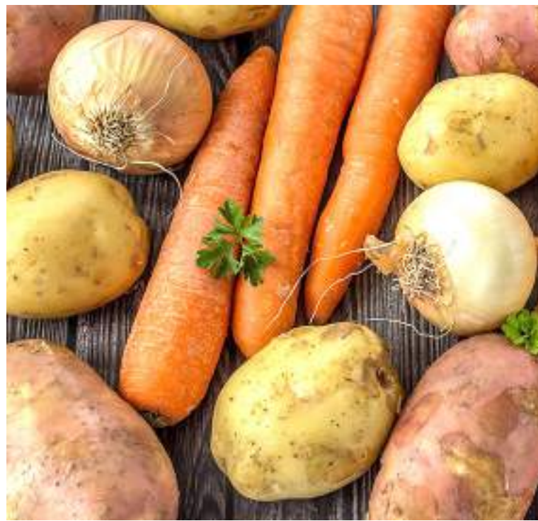
La lista de los alimentos que más subieron de precio en el décimo mes del año, la encabeza la papa, arracacha, ñame y otros tubérculos, así como el café.

Ahora bien, para el 2020 a inicios de la pandemia, la inflación de encontraba en 6.94%, al terminar la pandemia, para agosto del 2020, estaba en 8.53% y hoy, dos años y medio después, llegó al 12,22%.