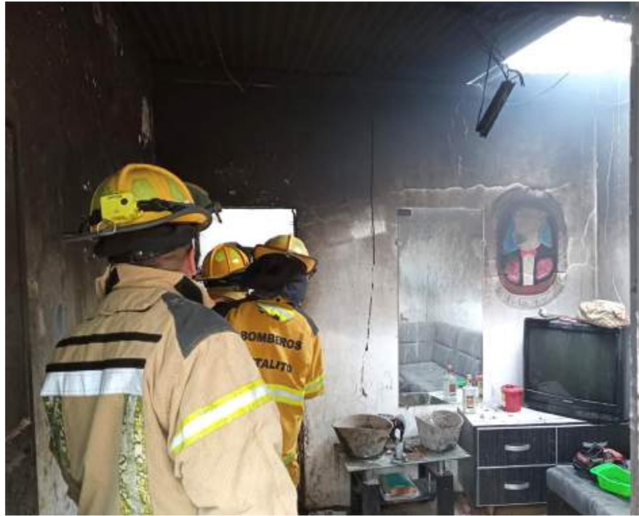
Interior de la vivienda con daños causados por el incendio.

“Murió calcinada, tratando de refugiarse debajo de la cama”, relató uno de los testigos con impotencia, la misma que embargó a todos los que acudieron a tratar de salvar a la menor”.