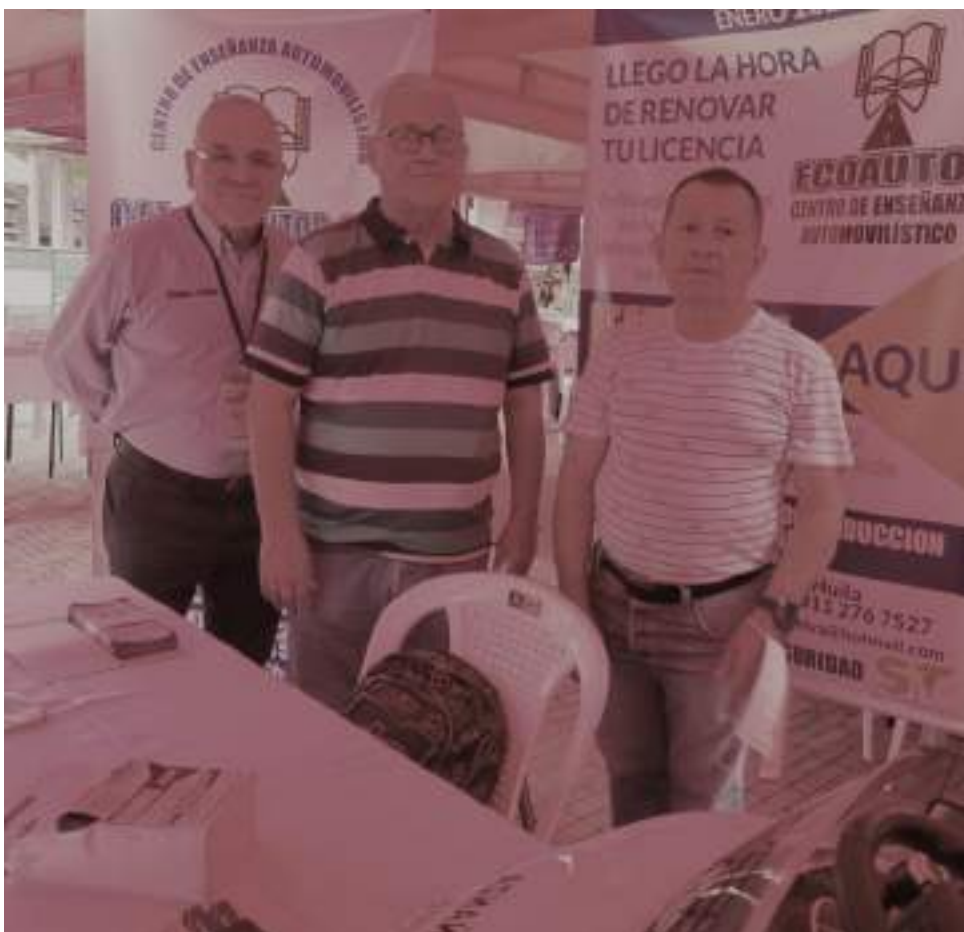
Junto a su esposa e hijos están al frente de Eco Autos.

es mentira, el gobierno se lleva más de la mitad de los recursos que se recaudan, además una exigencia que es uno de los principales controles es que se exige la huella en el momento de homologar la licencia”, sumó.