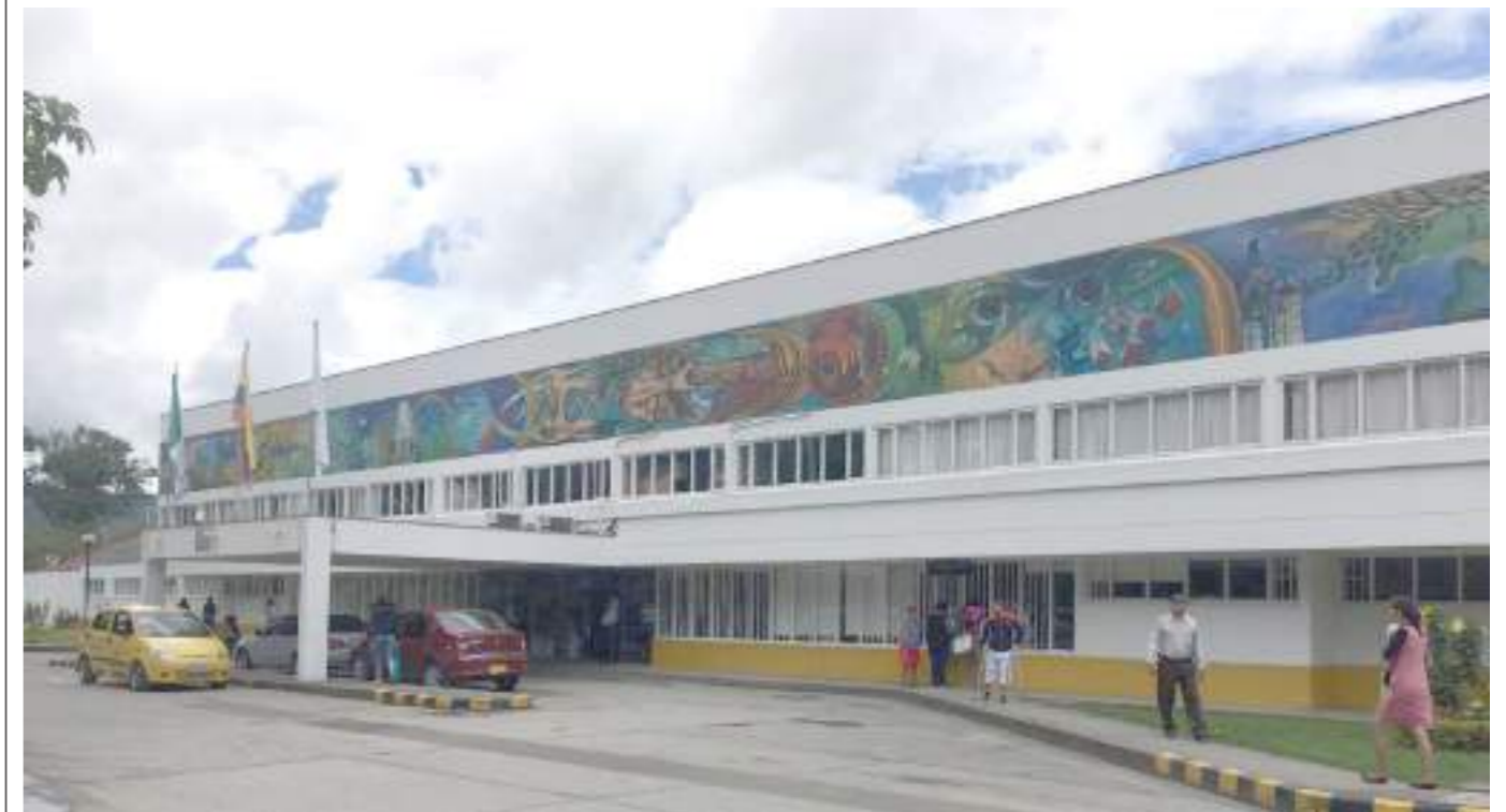
Las dos personas que resultaron asfixiadas por el humo fueron remitidas al Hospital San Antonio.

Se espera apoyo y solidaridad para la familia que además de la pérdida de la bebé, sufrió pérdidas materiales en su vivienda y algunos muebles y enseres.