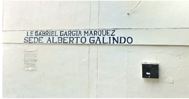
Atracaron Institución Educativa en Neiva ■ Judicial 9