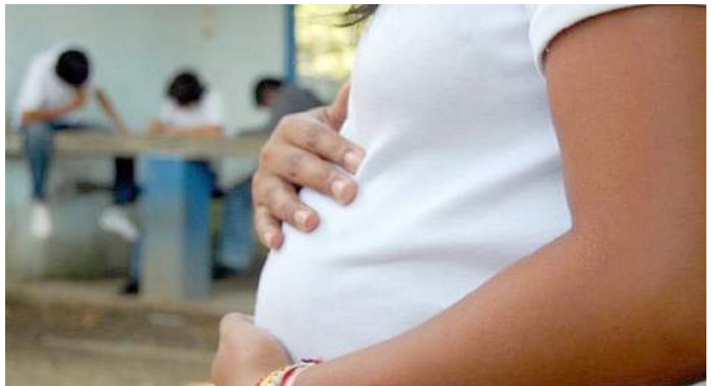
Nacidos vivos en el Huila