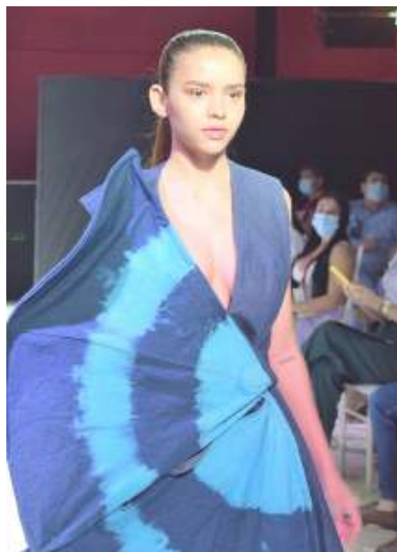
Este evento es una gran vitrina para dar a conocer sus productos y servicios.

La realización de Expo Huila Fest vienen generando gran expectativa en los emprendedores ya que este evento es una gran vitrina para dar a conocer sus productos y servicios, de igual manera la comunidad en general espera con entusiasmo el inicio del evento por las muestras gastronómicas y culturales