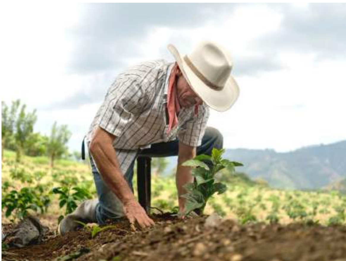
Solo se ha cumplido con el 16% de la meta fijada.

El 28 de abril de 2018 se partió en dos la historia del proyecto hidroeléctrico Ituango, que a esa fecha ya alcanzaba más del 87% de su construcción con cumplimiento de cronograma y presupuesto. "Se hizo el inicio de una contingencia en la que EPM no ha ahorrado esfuerzos y recursos para proteger a la comunidad (a la fecha no hay una sola víctima), cuidar el ambiente y recuperar el control de la futura central de generación de energía para la mitigación de los riesgos aguas abajo de la presa", dice el documento.