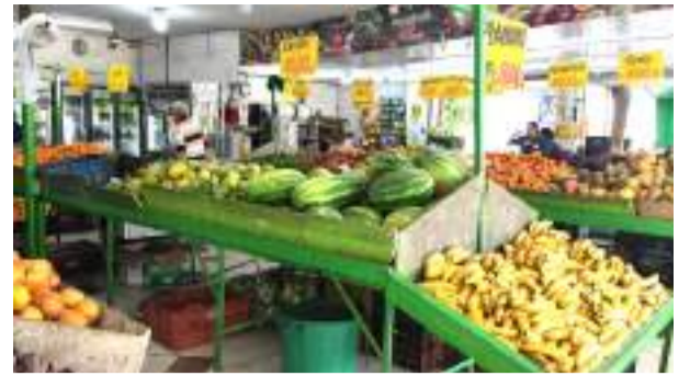
Variaciones en el precio del mercado ■ Economía 7