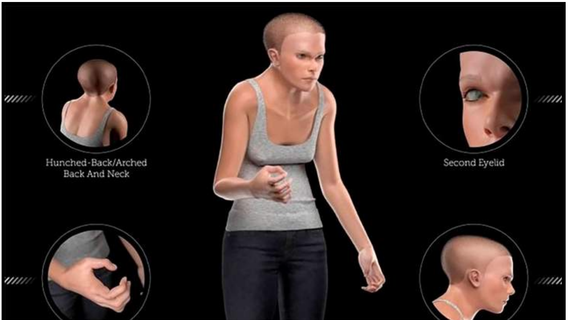
Hunched-Back/Arched Back And Neck