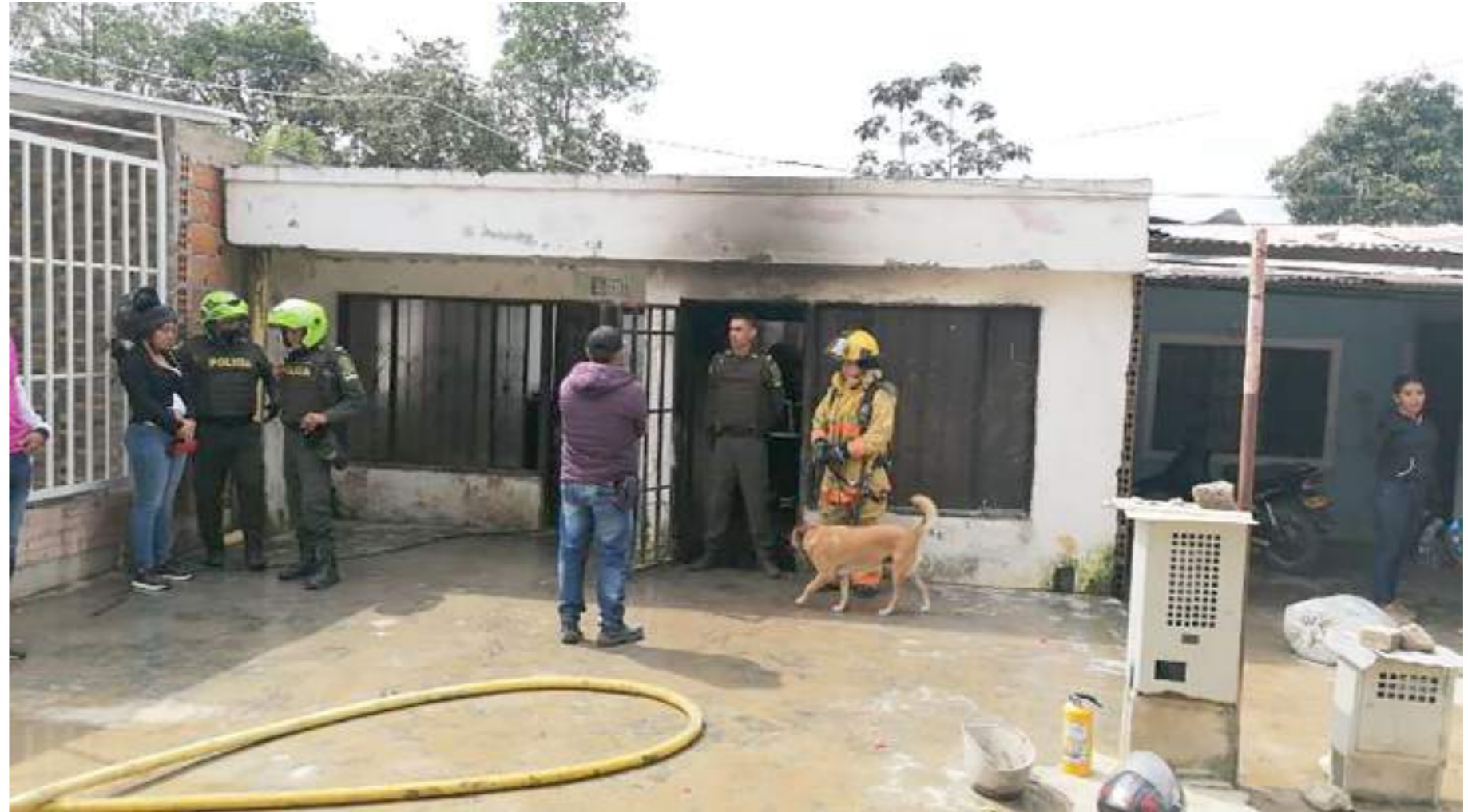
La conflagración en la que murió la menor se presentó en una vivienda del barrio Brisas del Guarapas.