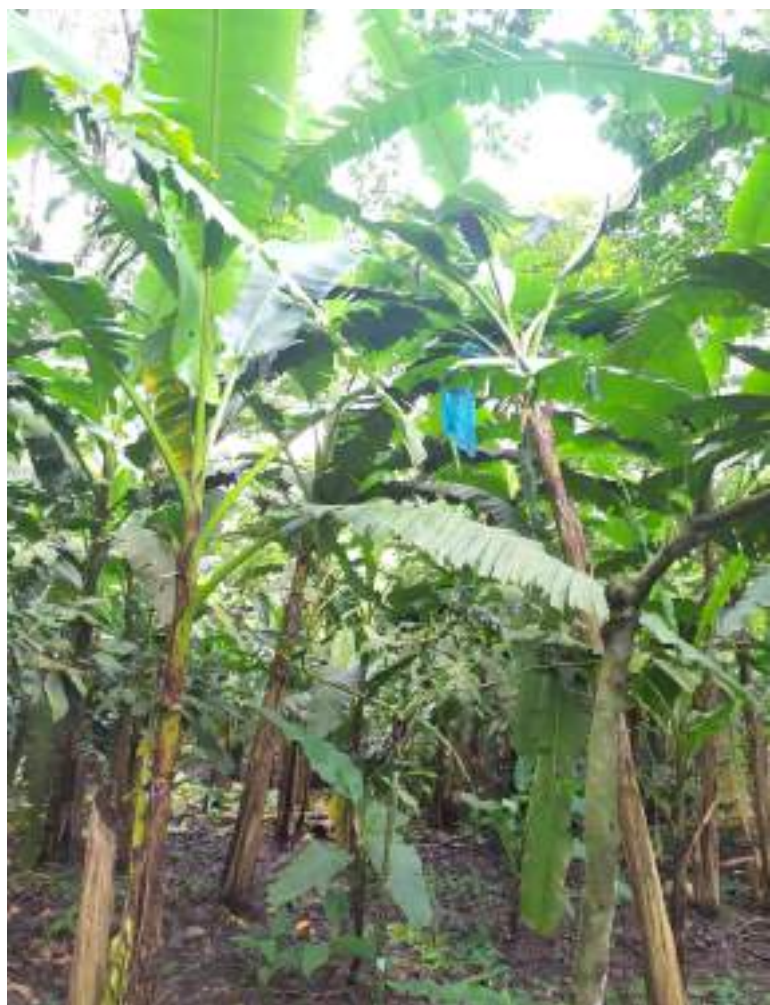
Se trabaja en estrategias para fortalecer la producción de plátano

Ante esto, Diario Del Huila, conoció que en efecto las autoridades competentes avanzaron en las investigaciones y, por ahora, la situación parece estar controlada, pero no se descarta un nuevo capítulo de esta alarmante situación.