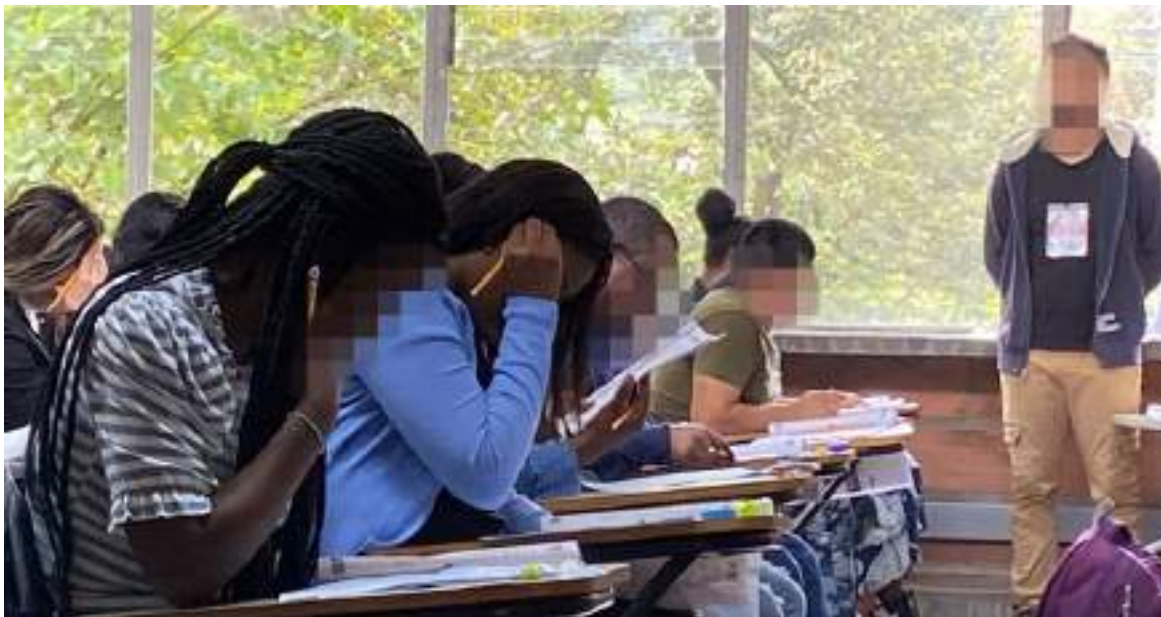
En muchos municipios del Huila los docentes participaron de este acto delictivo, que no se materializó.

Yo las presenté en Pitalito. En un principio nos dijeron que nos iban a encerrar, que en un sitio, pero después nos dijeron que no, que nos lo enviaban al WhatsApp, pero mentiras, ni lo uno ni lo otro.