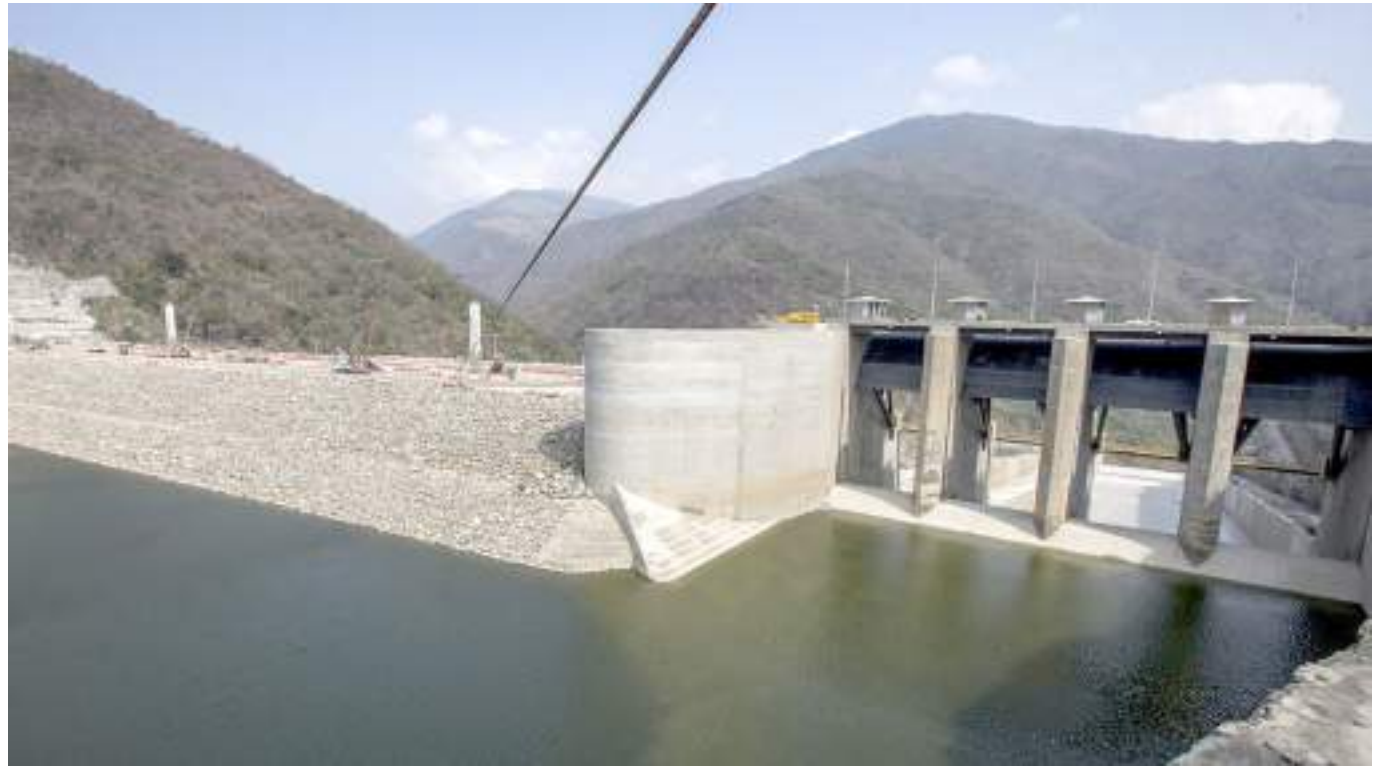
Procuraduría buscará que se restablezcan los derechos a campesinos en la restitución de tierras.

La Procuraduría General de la Nación solicitó al Gobierno nacional fortalecer el proceso de adjudicación de tierras a campesinos establecido en el Acuerdo de Paz, ya que solo se ha cumplido con el 16 % de la meta fijada.