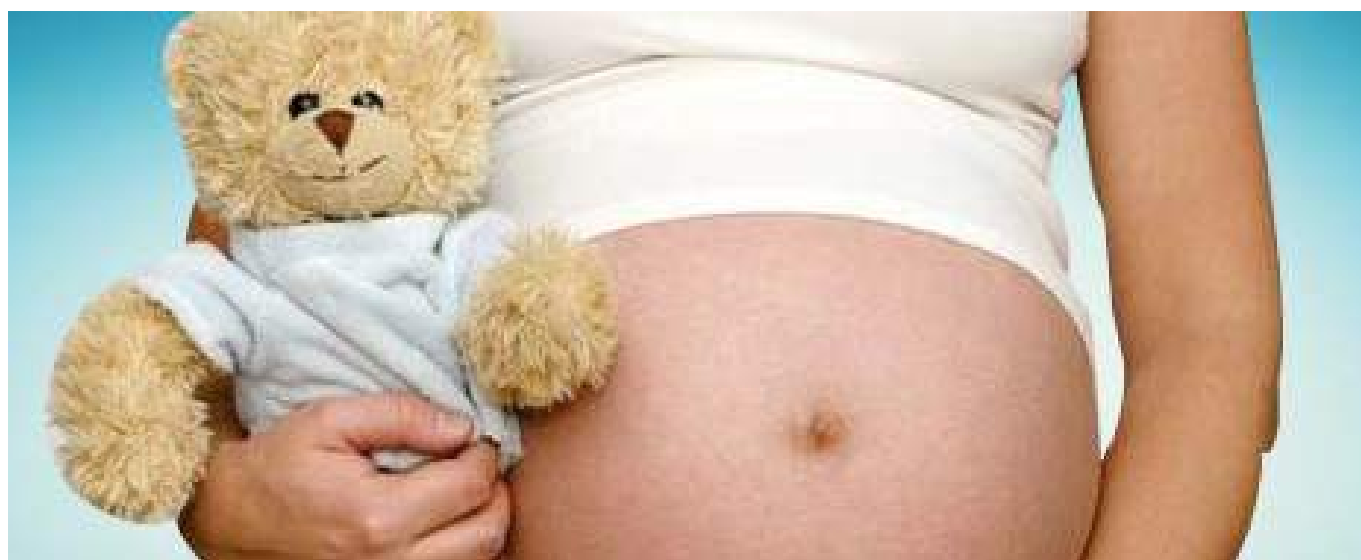
Con corte al 30 de septiembre del 2022, se han presentado 129 nacidos vivos de niñas de 10 a 14 años.

go de edad 2,65 han tenido un nacido vivo.