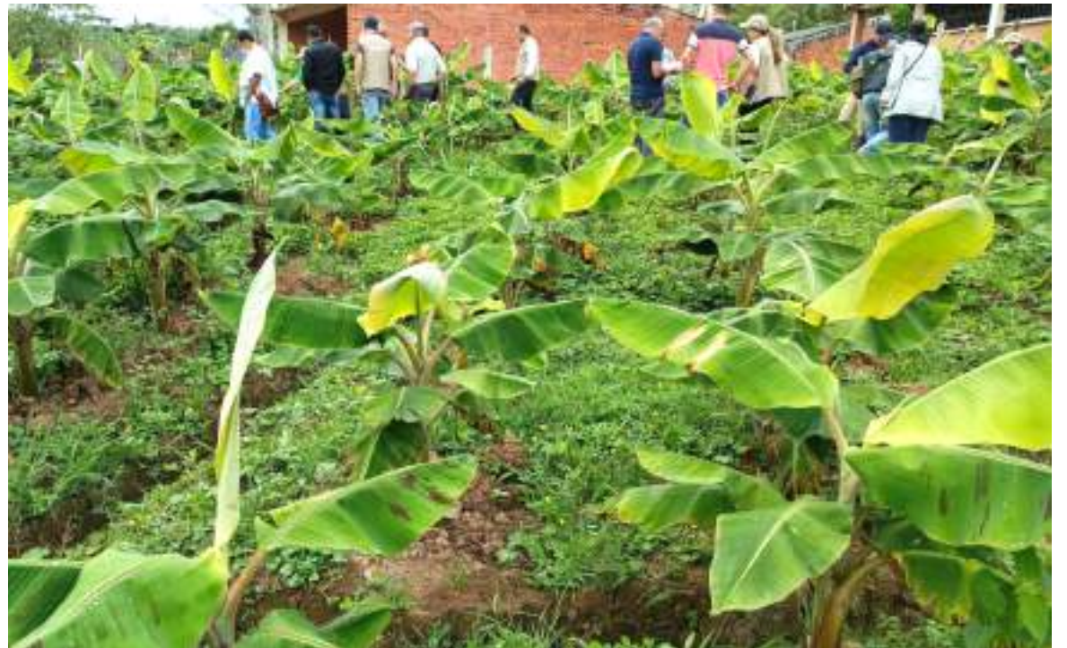
El plátano en el departamento del Huila

Ante esto, Diario Del Huila, conoció que en efecto las autoridades competentes avanzaron en las investigaciones y, por ahora, la situación parece estar controlada, pero no se descarta un nuevo capítulo de esta alarmante situación.