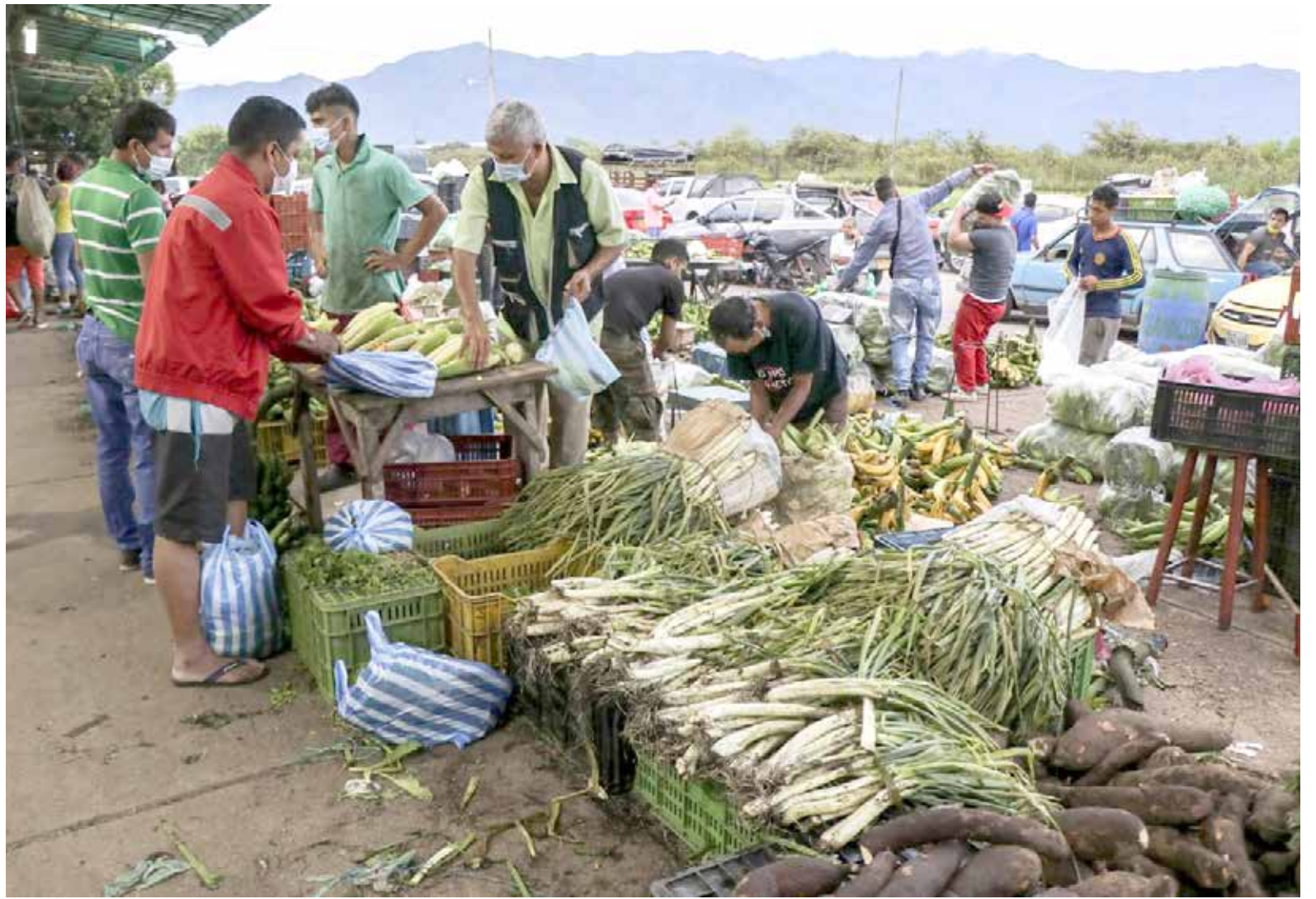
Comparación de precios en Corabastos desde enero hasta octubre, resaltando las variaciones notables en productos como la remolacha, la naranja tangelo y el cilantro.

En contraste, el cilantro (336,4%), el mango tomy (186,4%) y el repollo morado (153%) han experimentado al-