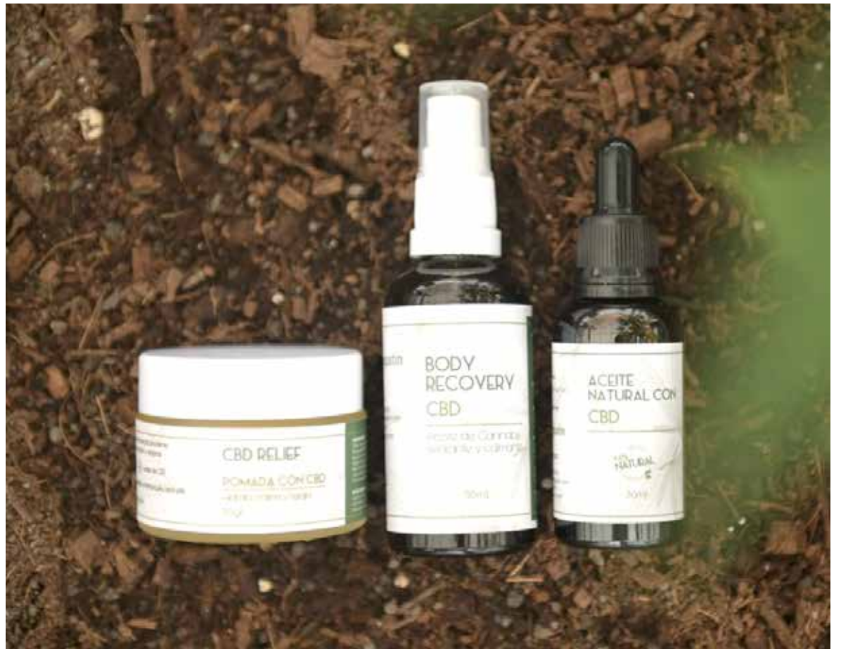
Los retrasos en los registros con el Invima, del Fondo Nacional de Estupefacientes, pueden tardar entre 2 y 3 meses para aprobar una certificación de exportaciones.

El cannabidiol o (CBD), la sustancia a la que nos referimos, tiene efectos terapéuticos probados. Y, lo que es más importante, cada vez son más los profesionales de la salud que son conscientes del potencial que tiene y siguen investigando para saber, cómo este compuesto puede formar parte de los tratamientos médicos.