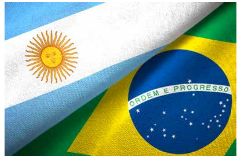
Entre los países que más demanda tuvieron de cannabis de uso medicinal colombiano en 2022 se encuentran Argentina con US$3,8 millones, Brasil (US$1,3 millones).

En 2021, el Ministerio de Salud, junto al de Justicia y de Agricultura, generaron la hoja de ruta del