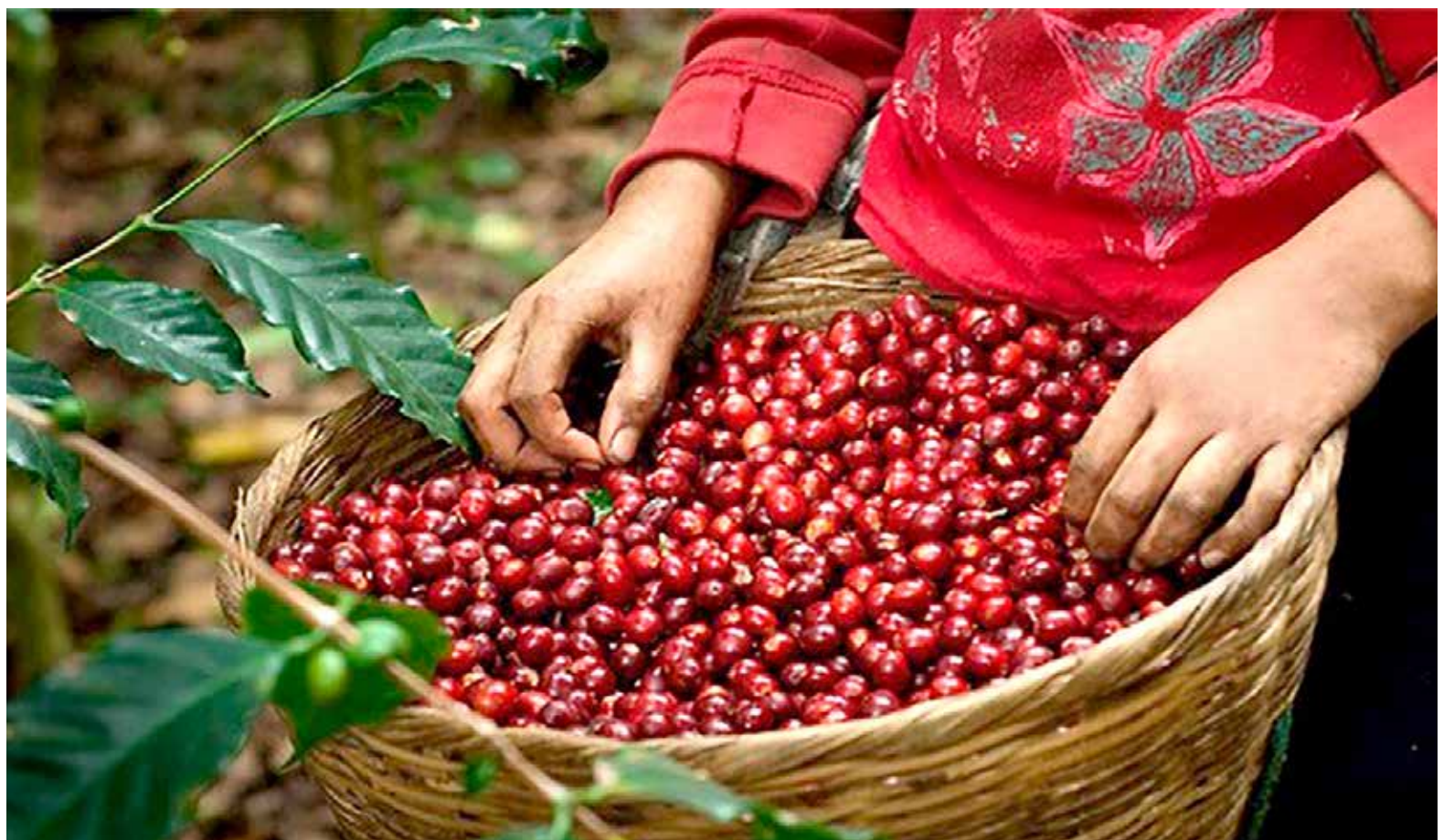
Con un enfoque en la innovación y la colaboración, los caficultores pueden no solo adaptarse a las nuevas regulaciones.

El reloj está en marcha, y cada segunda cuenta para los caficultores colombianos mientras se esfuerzan por cumplir con las regulaciones europeas y encontrar formas creativas de fortalecer su industria, preservando la calidad y la sostenibilidad en la producción de café en el país.