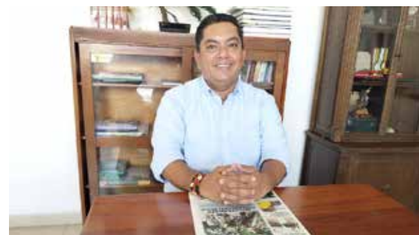
“Es un llamado a la unidad, a trabajar por Aipe”