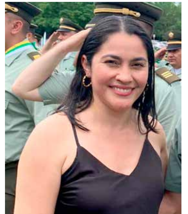
Tania Beatriz Peñafiel, secretaria de Educación del Huila.

En el marco de los lineamientos vigentes del (PAE), existen diferentes tipos de complementos alimentarios, entendido este como un aporte complementario a la alimentación recibida por los estudiantes en sus hogares, cuya entrega se realiza como estrategia de acceso, permanencia y bienestar en el establecimiento educativo