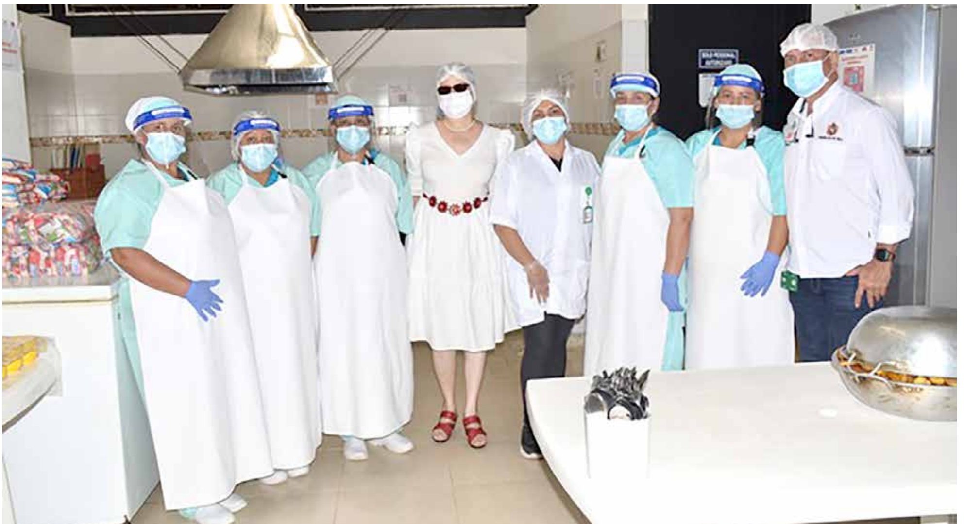
Tres mil empleos directos e indirectos, habría generado este plan.

El coordinador indicó que con el Programa de Alimentación Escolar, generaron en la primera Mesa Pública, más de 3.000 empleos directos e indirectos. “Con satisfacción, se cumplió el objetivo de las compras públicas locales, que también tuvimos una