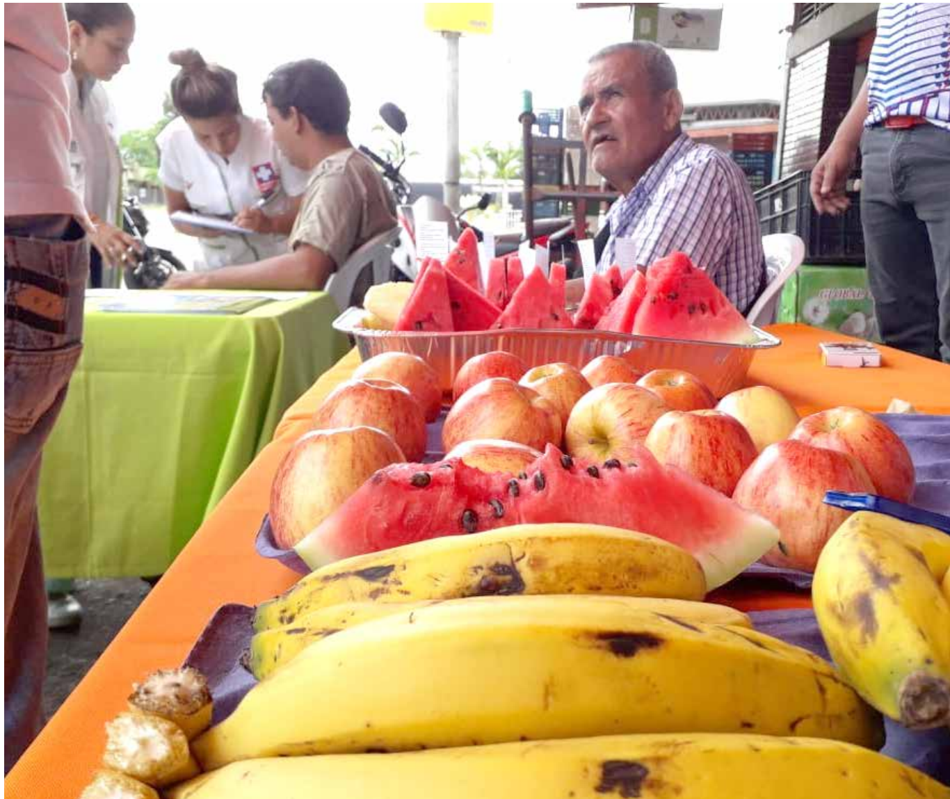
Estos incrementos se atribuyen a condiciones climáticas adversas, especialmente en regiones de clima frío, lo que acelera el deterioro de los productos.

Desde Surabastos en Neiva hasta Corabastos, se ha analizado detalladamente esta situación, anticipando un probable incremento en los precios de los productos más demandados en la próxima temporada de diciembre.