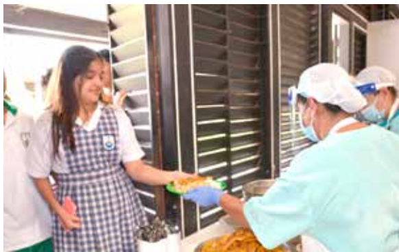
Así terminó el PAE en el Huila