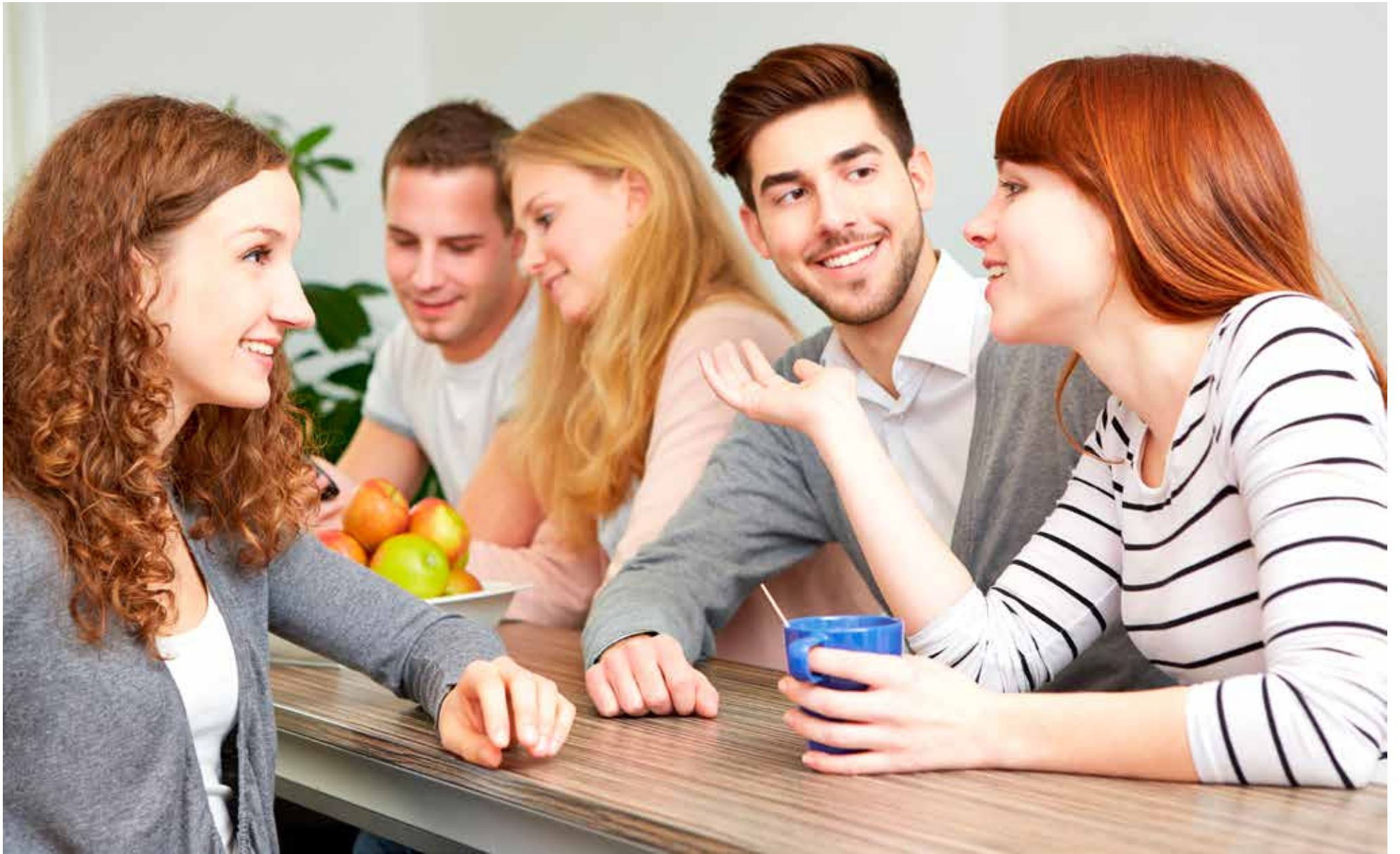
El objetivo es hacer que el lenguaje sea más igualitario y respetuoso para todas las personas, reconociendo su diversidad y dignidad.

Si bien la academia, llámese en nuestro caso, Real Academia de la lengua Española defiende esta posición y la tradición de la norma, considera que debe haber márgenes, aunque también es consciente que el lenguaje evoluciona. Somos los hablantes que dictaminamos los cambios, empero, cada cinco o seis años se renueva la gramática y el Diccionario oficial de la Lengua española.