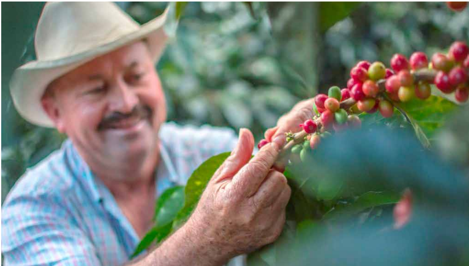
Los productores de café se enfrentan a un cronograma ajustado para adaptarse a las normativas europeas que buscan preservar la sostenibilidad ambiental.

una serie de medidas impuestas por la Unión Europea. Estas medidas se enfocan en el cuidado de la salud, prevención de enfermedades y control de plagas. Esto implica la necesidad de establecer una trazabilidad exhaustiva, desde el inicio del proceso de cultivo, para cualquier producto destinado a la exportación a Europa.