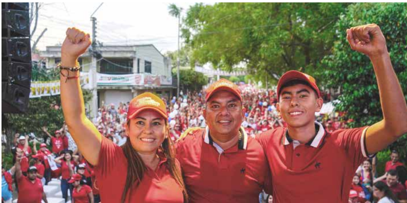
La unidad familiar fue fundamental para el alcalde electo.

Qué Aipe eche pa’ lante, necesitamos construir, necesitamos mejorar en educación, necesitamos el servicio de salud sea de alta calidad, necesidad que la prestación de los servicios públicos domiciliarios se garantice de forma eficiente, necesitamos que el municipio entienda que debemos avanzar en el cambio de nuestra vocación hacia un tema de competitividad, hacia un tema turístico, hacia un tema de productividad, es allí donde queremos trabajar para que a través de la gestión podamos multiplicar los recursos, para que de esta manera se vea la inversión social en el municipio.