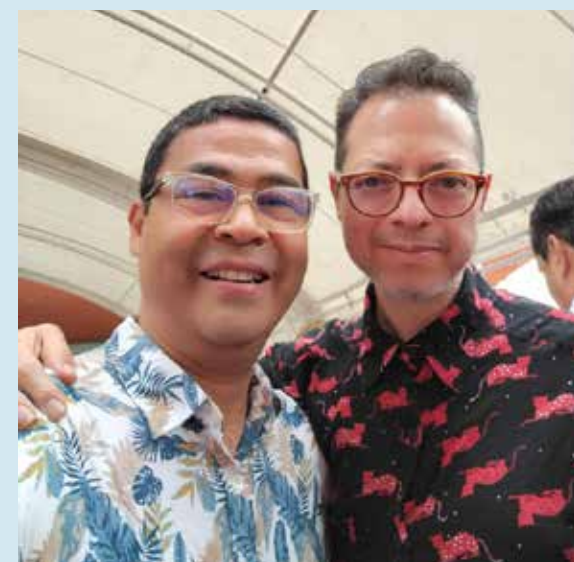
El editor de la Universidad Uniclaletiana junto al Ministro de las culturas, Juan David Correa Ulloa.

“Para la Uniclaletiana, participar en la FilvoráGINE 2023 ha sido una experiencia engrandecedora en todos los sentidos. Fue la oportunidad de disfrutar una propuesta novedosa que supo convocar a protagonistas locales, regionales, nacionales e inter-