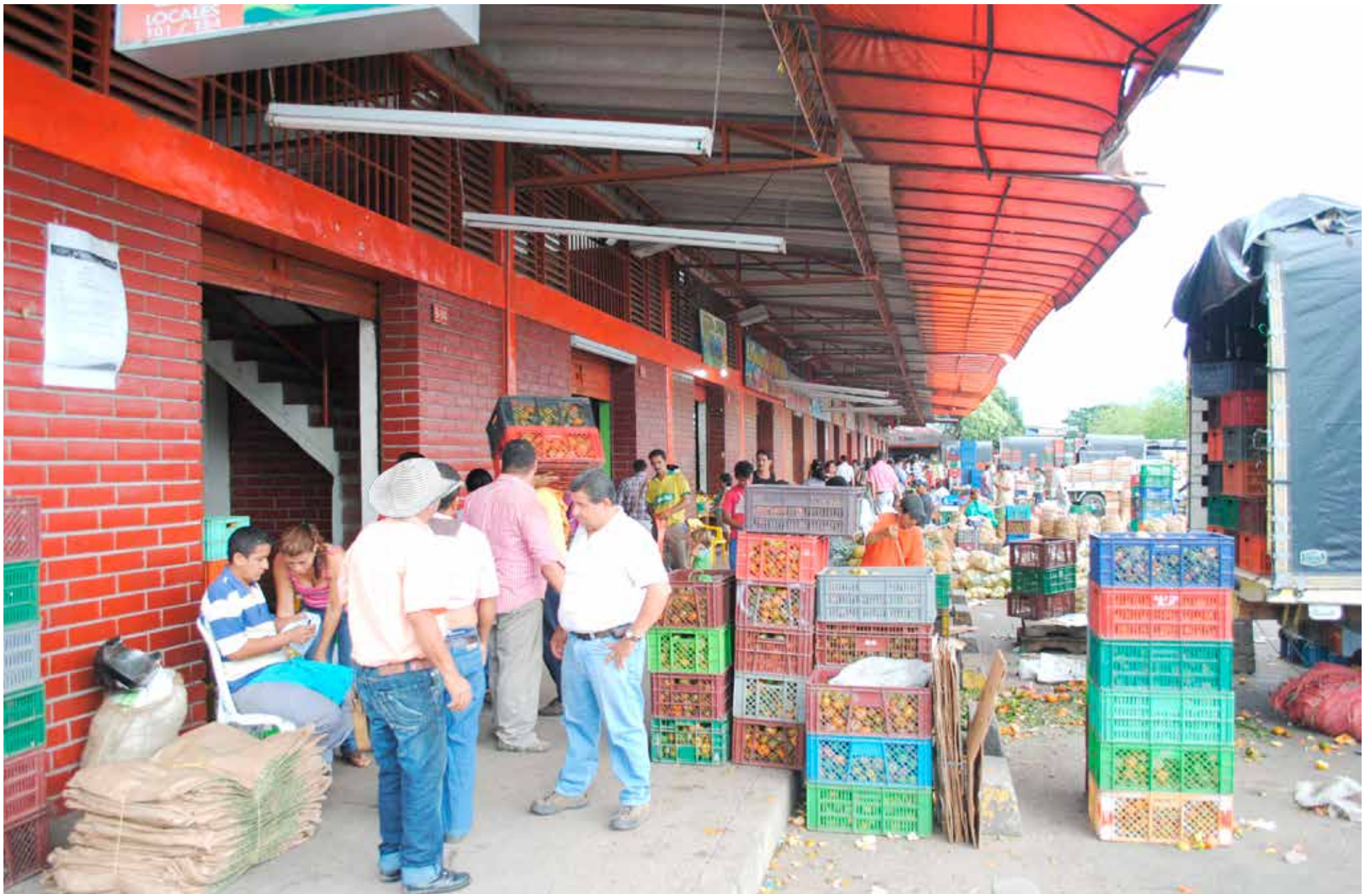
Agricultores afrontan desafíos con cambios climáticos que han afectado la siembra, impactando los precios y la oferta de alimentos en la región del Huila.