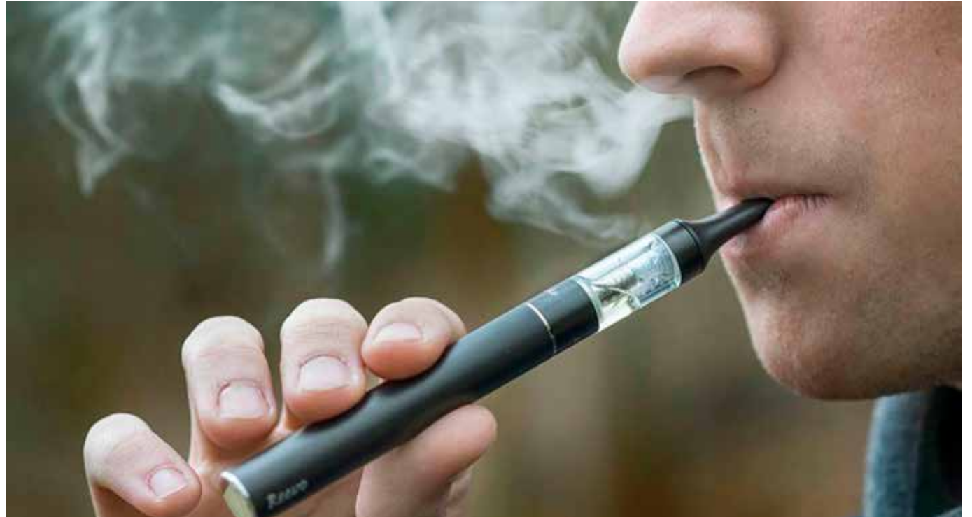
La comercialización de los vapeadores ha sido especialmente alta entre la población menor de 30 años.

El informe destaca que muchos jóvenes están desinformados acerca de los peligros asociados con el vapeo, ya que a menudo se les vende como una alternativa segura al tabaco tradicional.