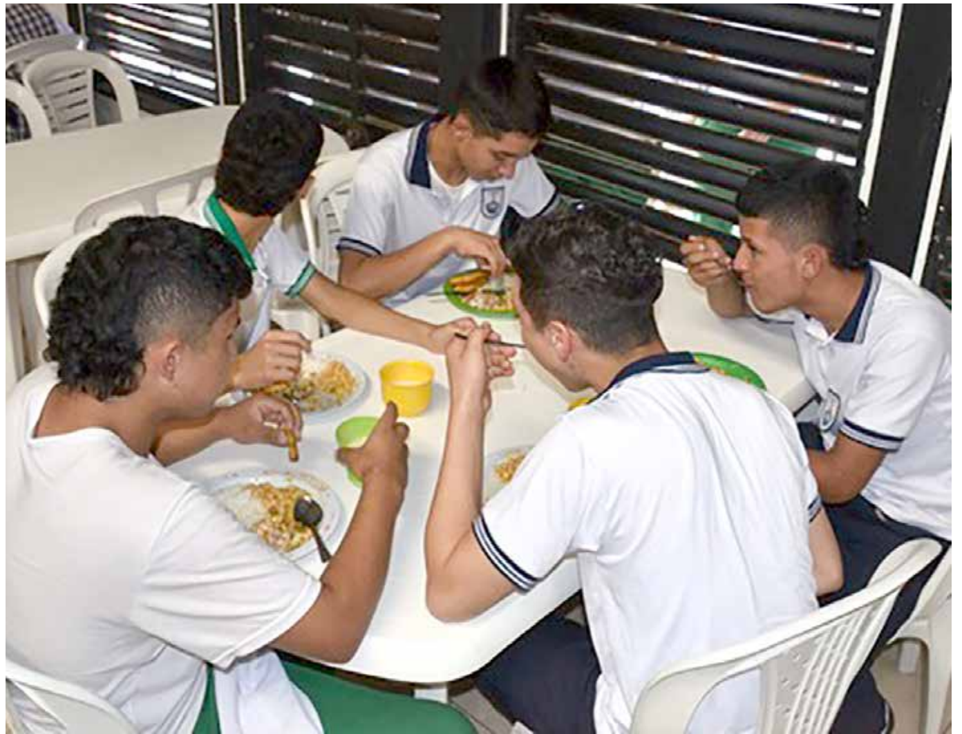
Cabe recordar que el PAE, funciona bajo la figura de corresponsabilidad, entre el Gobierno Nacional y la Gobernación.

El coordinador indicó que con el Programa de Alimentación Escolar, generaron en la primera Mesa Pública, más de 3.000 empleos directos e indirectos. “Con satisfacción, se cumplió el objetivo de las compras públicas locales, que también tuvimos una inversión grande para el departamento”.