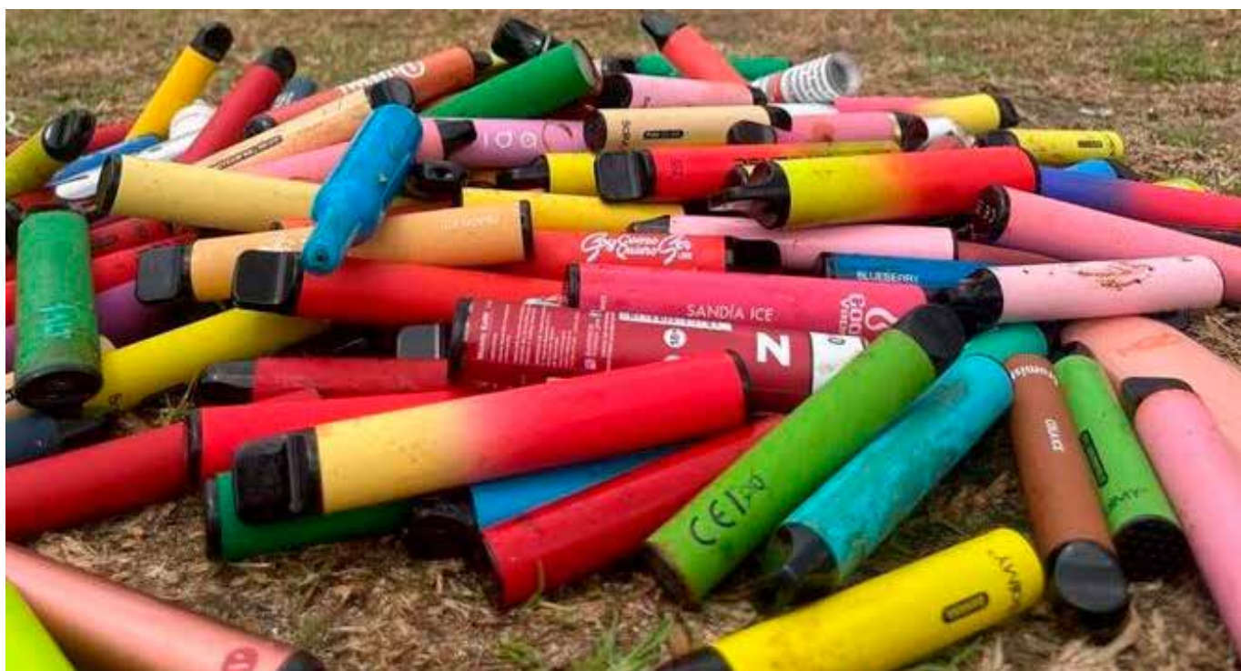
El cáncer de pulmón es la segunda causa de muerte en el mundo.

Además, los departamentos con mayor consumo de tabaco coincidieron con aquellos con mayores tasas de casos de enfermedades relacionadas con el vapeo. Además, se pudo determinar un mayor riesgo de consumo de cigarrillos electrónicos en hombres menores de 45 años que también consumían habitualmente cigarrillos o marihuana. Este hallazgo es consistente con lo reportado en la literatura, que documentó un mayor consumo en la población adulta joven.