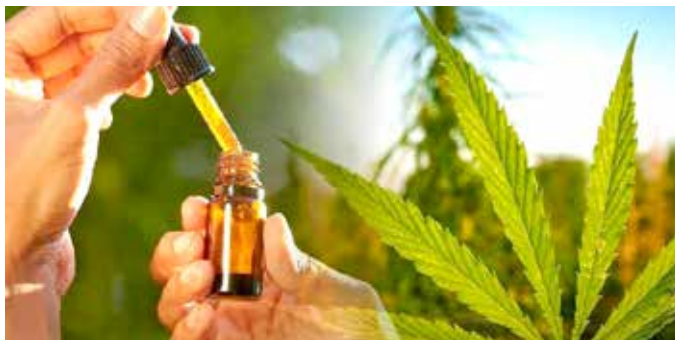
Productores de cannabis medicinal buscan impulso comercial