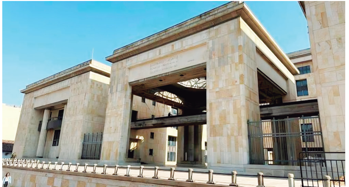
La Corte Constitucional deberá decidir si el artículo afecta la libre competencia.

Si la Corte Constitucional deroga el artículo, se abriría la puerta para que aguardientes producidos en otras regiones del país puedan competir en igualdad de condiciones en todos los departamentos.