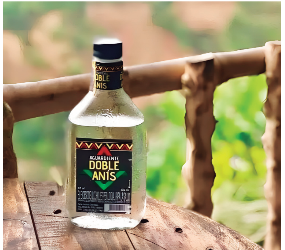
Doble Anís, el aguardiente del Huila, podría verse afectado ante la llegada de licores de otros departamentos.