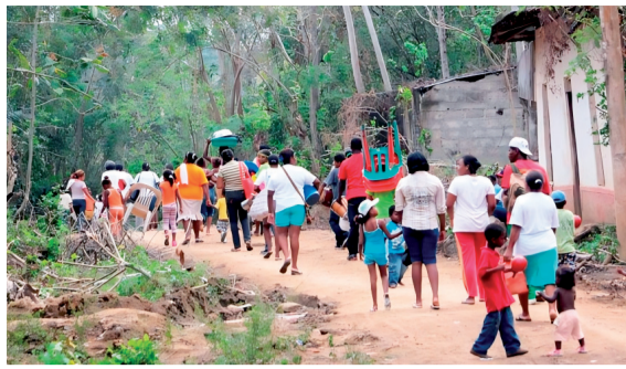
Los actores armados, se ensañan con la población civil