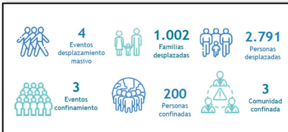
Los 'armados' se ensañan con la población civil.

Otro de los departamentos afectados es el Caquetá, municipio de Valparaiso, donde se viene presentando riesgo de desplazamiento forzado masivo, debido a que el Frente Comandante Raúl Reyes, se encuentran realizando actos de proselitismo mediante la instalación de vallas publicitarias, esto sumado a los homicidios selectivos que se han presentado.