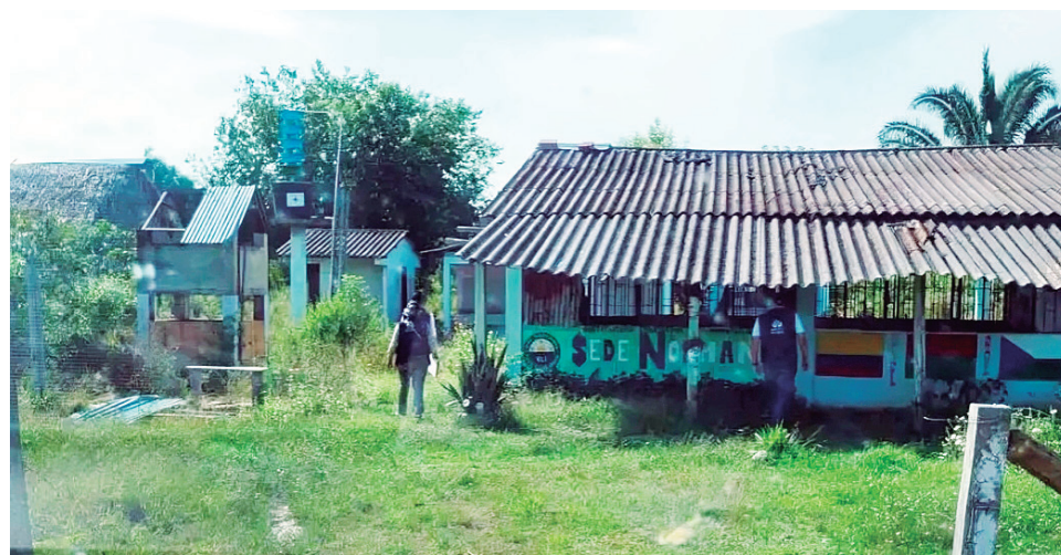
En julio de 2024 se reportaron y registraron tres eventos de confinamiento en los departamentos de Arauca y Valle del Cauca.

han sido incluidas en el Registro Único de Víctimas (RUV) de la Unidad para las Víctimas.