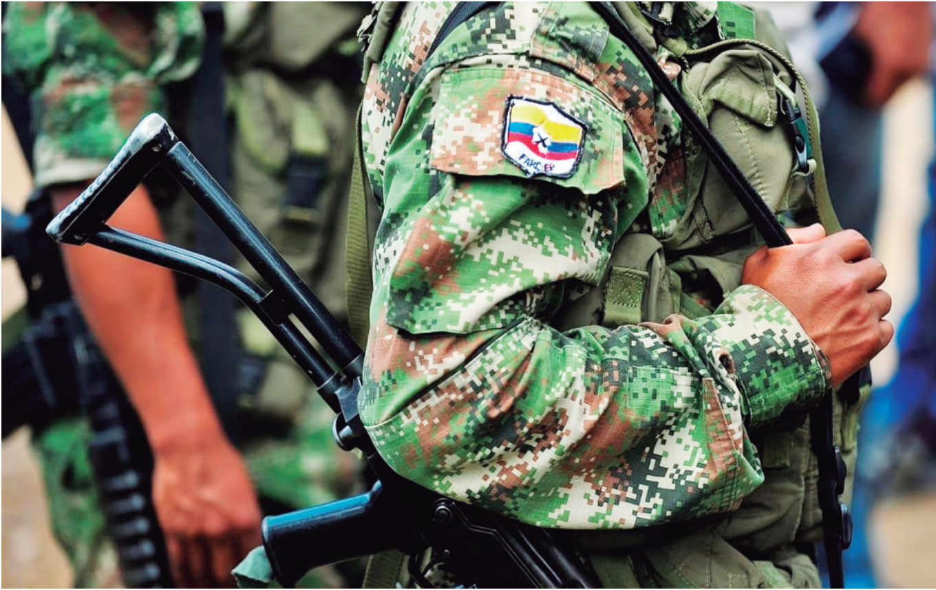
El Frente Comandante Raúl Reyes, se encuentran realizando actos de proselitismo en Valparaíso, Caquetá.

can como se dice popularmente, 'huir de las balas', son los del municipio de Puerto Rondón, donde 70 personas aproximadamente desplazadas de la vereda el Progreso y Normandía, buscaron amparo en la Iglesia Shalom de la vereda Normandía.