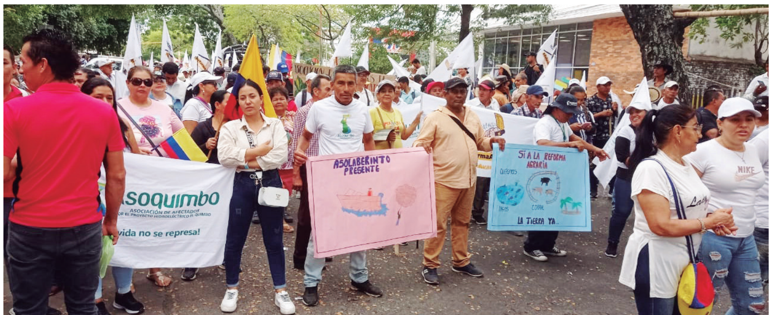
La ANLA será la entidad encargada de definir la ruta a seguir.

pla con su responsabilidad. “Tenemos un reto muy importante en el departamento y es cómo se va a aplicar esta nulidad”, afirma, destacando la necesidad de que la ANLA realice un estudio detallado para evaluar la afectación en términos de producción.