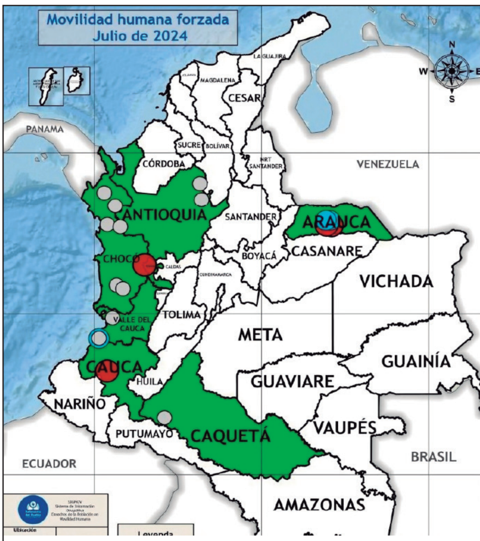
Desplazamiento generado por los actores armados.

La segunda situación, se vio en los municipios de Segovia y Remedios: con ocasión de los homicidios que se viene presentando en este sector, las personas han estado recibiendo amenazas a través del voz a voz, para que abandonen el territorio. El