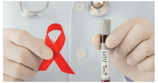
Aumentó el VIH en el Huila