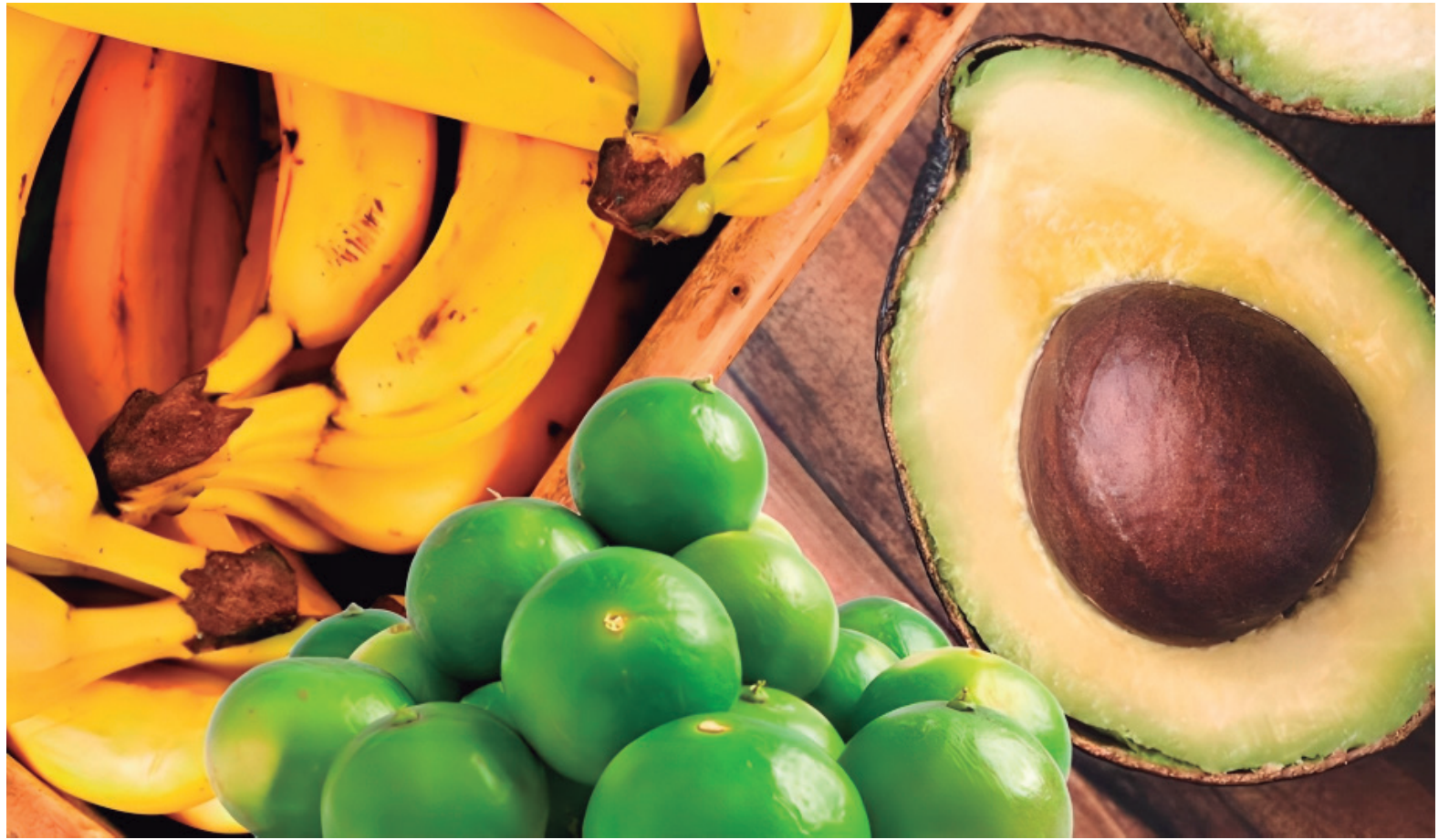
Banano, aguacate hass y limón tahití, conquistan el mercado internacional.