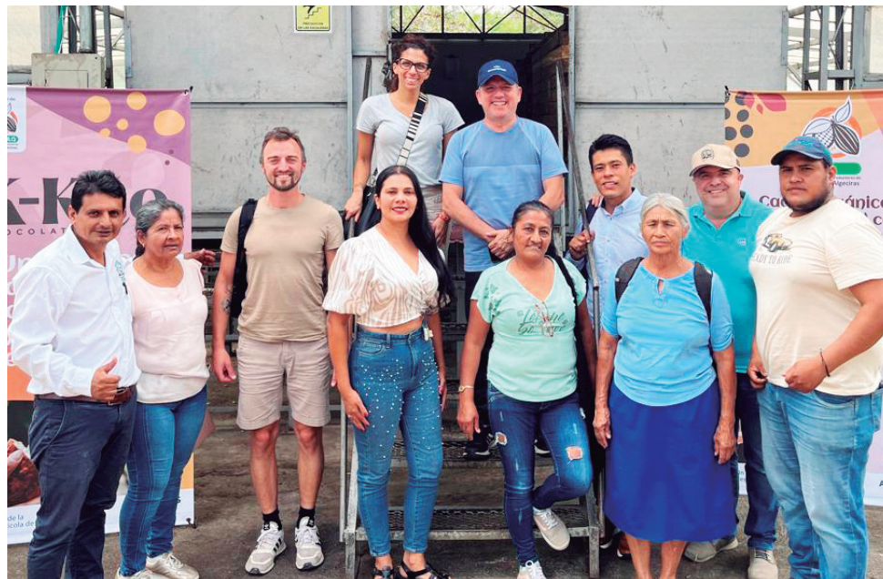
Este compromiso con la calidad y la sostenibilidad ha permitido que APROCALG no solo se destaque en certámenes nacionales.

APROCALG ha logrado exportar almendra de cacao a Suiza y se proyecta como la primera organización en exportar licor de cacao, un paso clave hacia la consolidación de los cacaocultores huilenses en el mercado internacional.