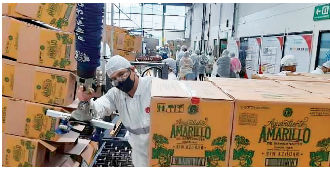
Corte evalúa autonomía en rentas por aguardientes