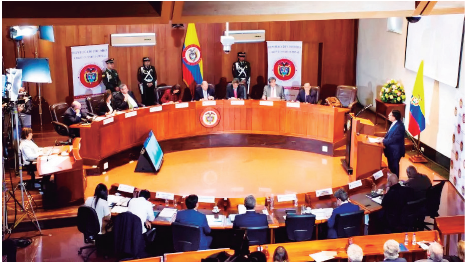
En la audiencia, la corte escuchará a las partes.

El monopolio de los licores destilados, establecido por la Ley 1816 de 2016, otorga a los departamentos la facultad exclusiva de producir, comercializar y fiscalizar estos productos. Esta normativa busca garantizar que los ingresos generados por el consumo de licores se destinen prioritariamente a sectores como la salud