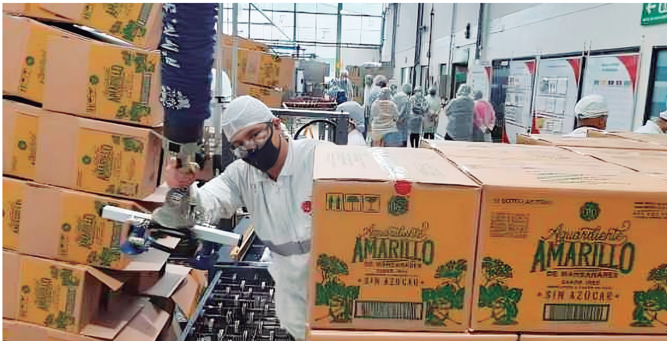
La licorera de Caldas, productora del Aguardiente Amarillo es una de las demandantes.

Los demandantes solicitaron la derogación del artículo 28 de la ley 1816 del 2016, que permite a los departamentos suspender los permisos de entrada de aguardiente producido en otras regiones del país o en el extranjero.