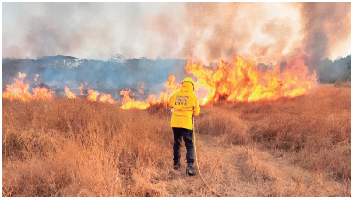
El exhaustivo trabajo que vienen adelantando los bomberos voluntarios no solo en Neiva, sino en municipios vecinos.